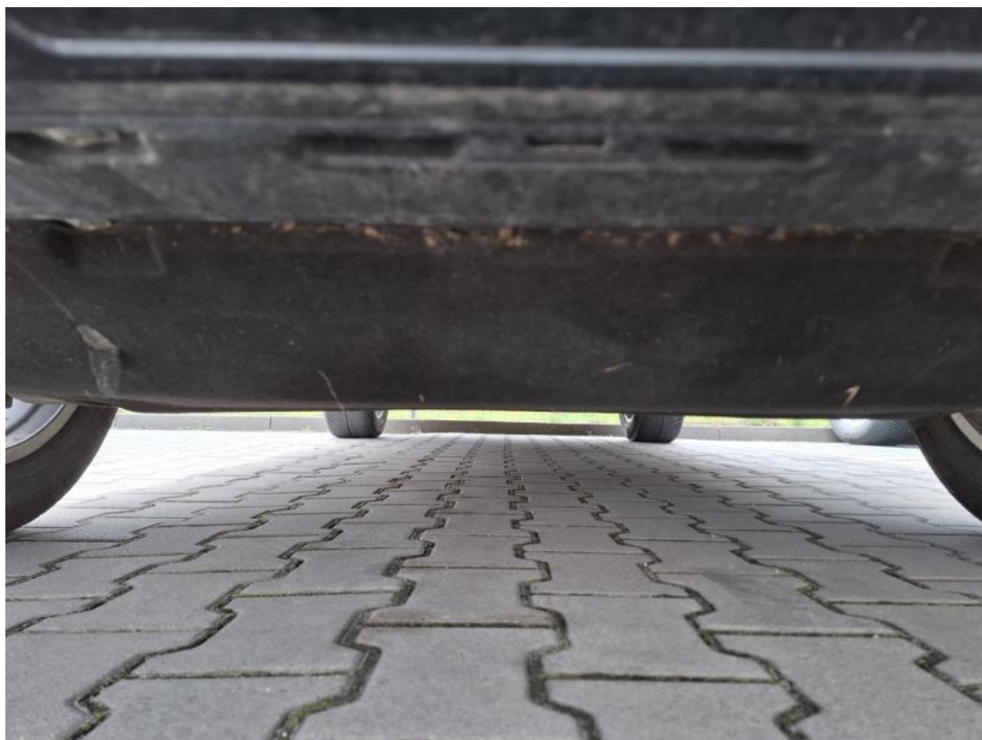
Fot. 25 Spód pojazdu przód