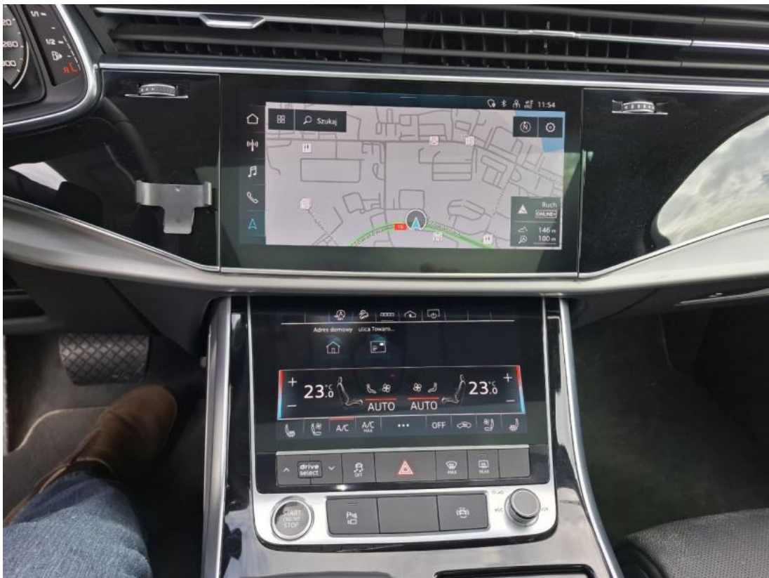
Fot. 19 Konsola środkowa