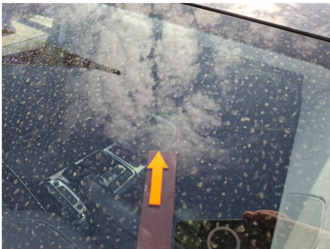
Fot. 37 Szyba czołowa - Pęknięcie/rozerwanie 1