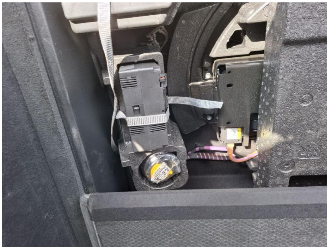
Fot. 33 Zestaw naprawy koła