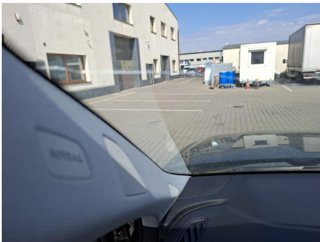
Fot. 38 Szyba czołowa - Pęknięcie/rozerwanie 2