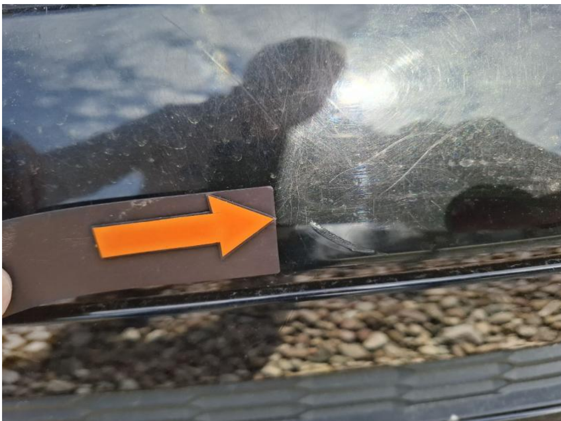
Fot. 40 Zderzak tylny - Wgniecenie/odkształcenie 1