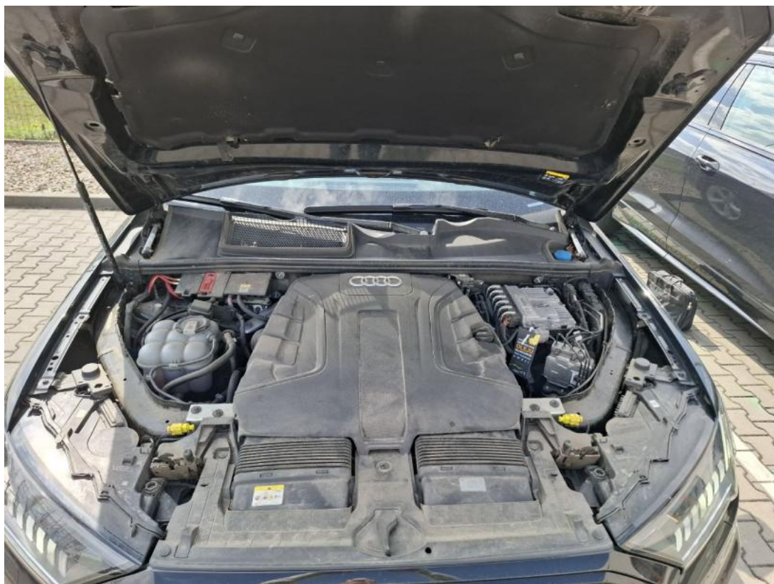
Fot. 23 Komora silnika