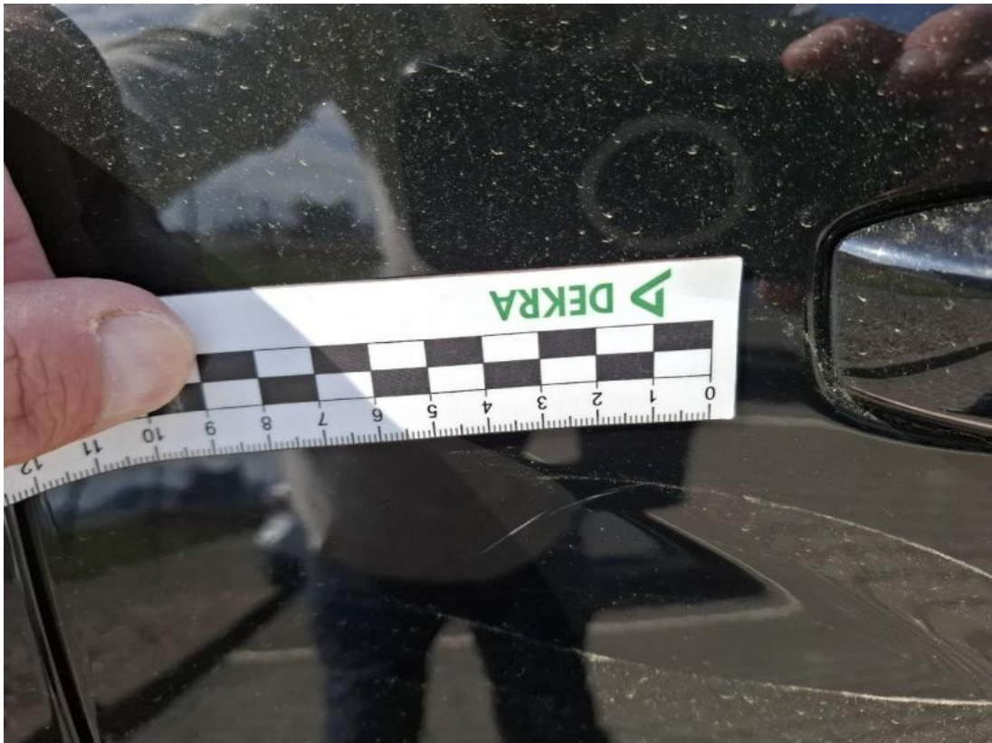
Fot. 39 Drzwi tylne P - Rysa/odprysk 1