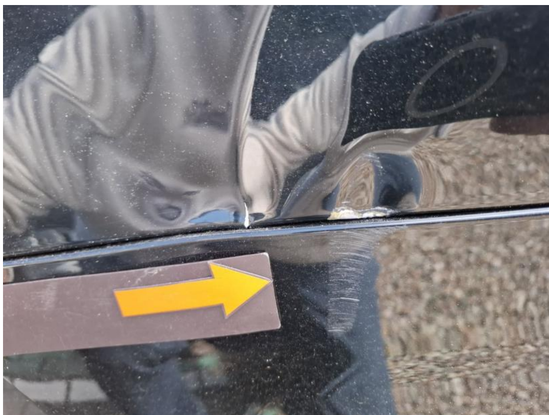
Fot. 42 Zderzak tylny cz L - Rysa/odprysk 1