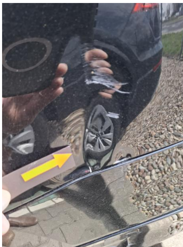
Fot. 44 Błotnik tylny L / Ściana boczna L - zdjęcie pogładowe 1