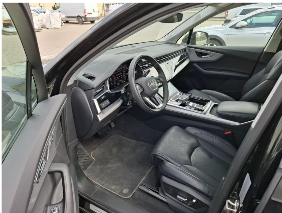
Fot. 16 Widok przez otwarte drzwi przednie lewe