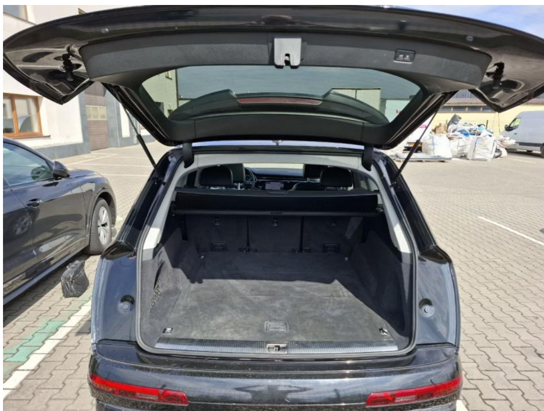
Fot. 24 Bagażnik