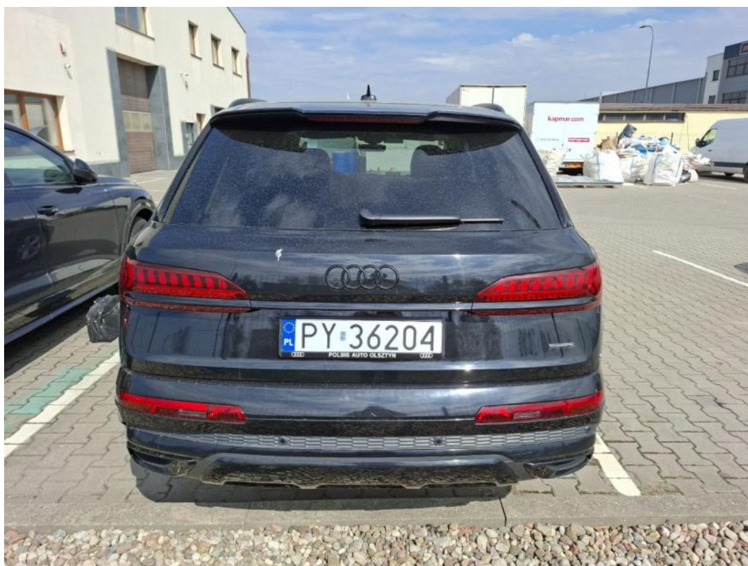
Fot. 8 Tyt