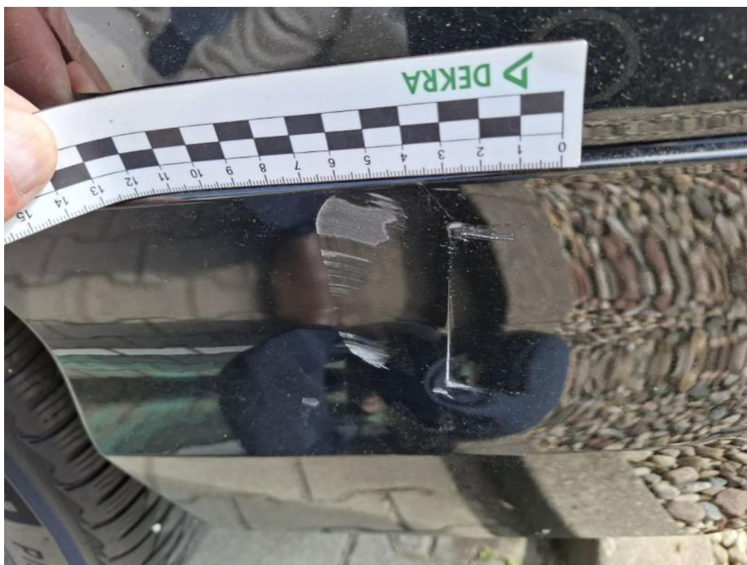
Fot. 41 Zderzak tylny cz L - zdjęcie poglądowe 1