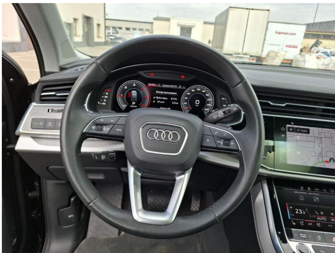
Fot. 21 Kierownica (na wprost)