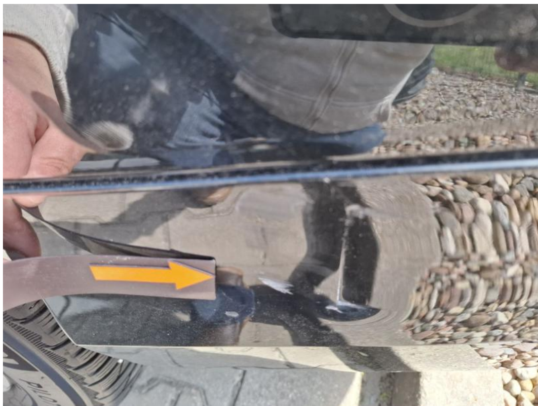
Fot. 43 Zderzak tylny cz L - Pęknięcie/rozerwanie 1