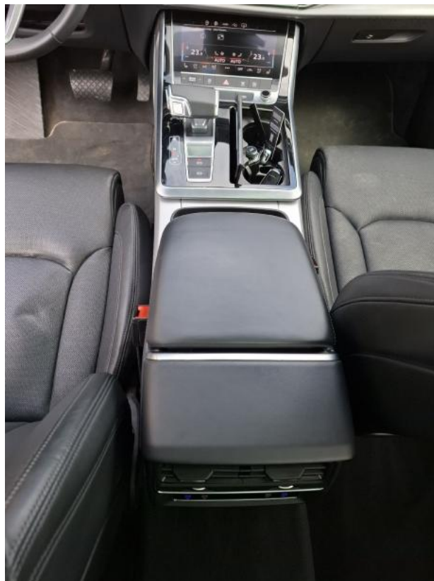
Fot. 20 Tunel środkowy