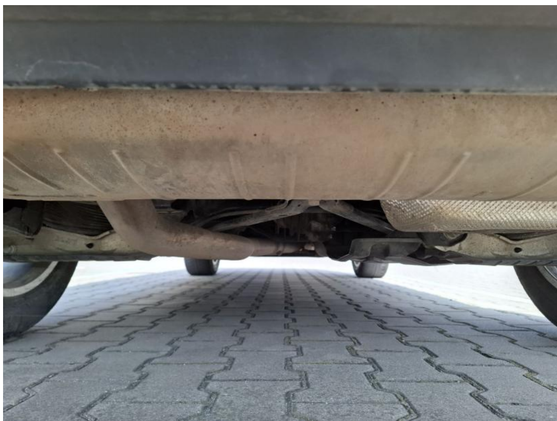
Fot. 26 Spód pojazdu tył