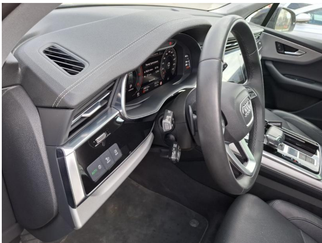
Fot. 22 Kierownica z lewej strony