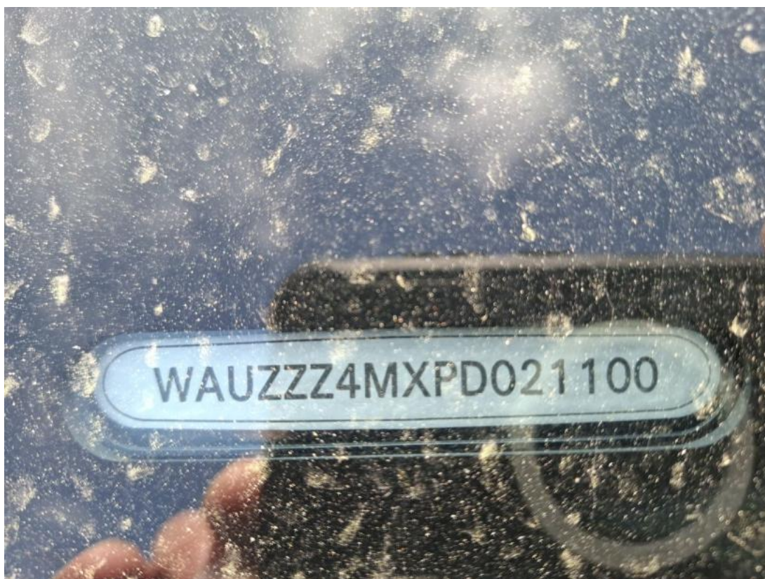
Fot. 34 Zdjęcie do protokołu