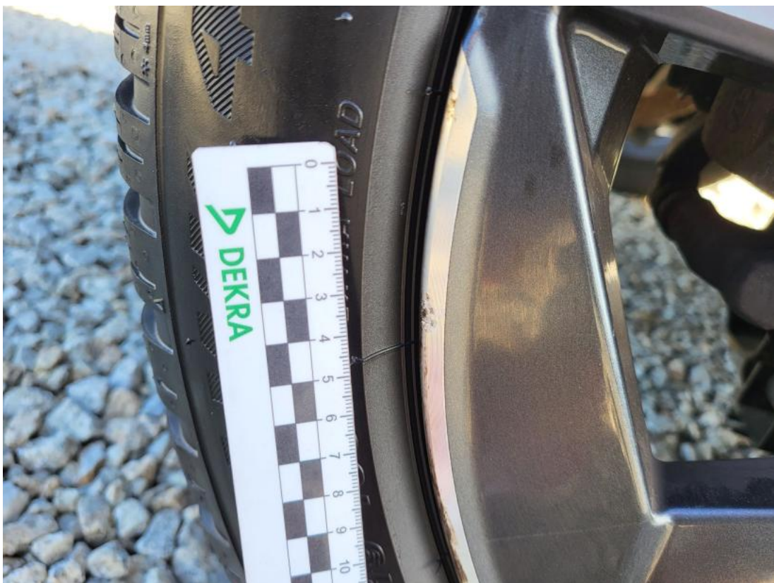
Fot. 40 Felga aluminiowa tylna L - Rysa/odprysk 1