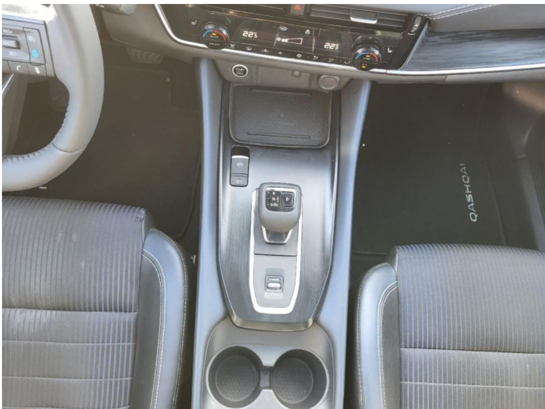
Fot. 20 Tunel środkowy