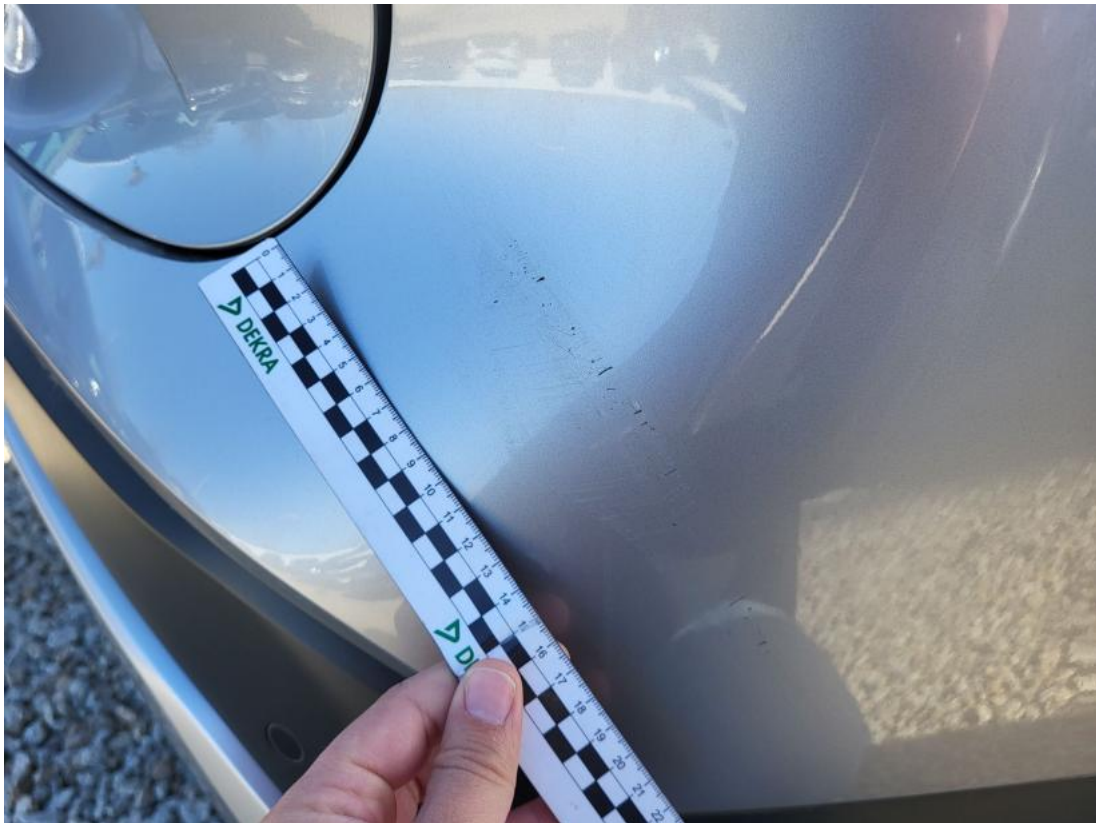
Fot. 39 Zderzak tylny - Rysa/odprysk 1