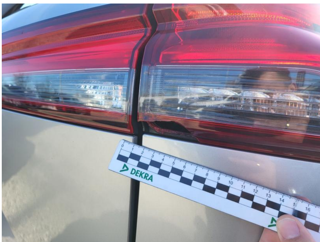
Fot. 38 Lampa tylna zew P - Pęknięcie/rozerwanie 1