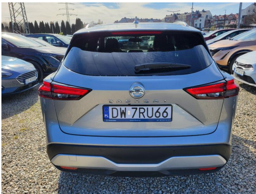
Fot. 8 Tyt