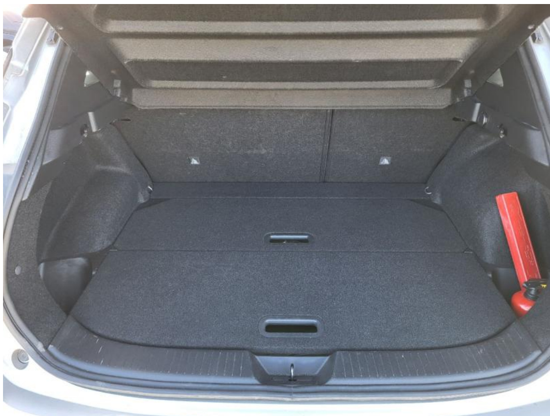
Fot. 24 Bagażnik