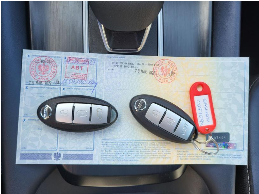
Fot. 33 Dow. Rej. Str.2 i klucze