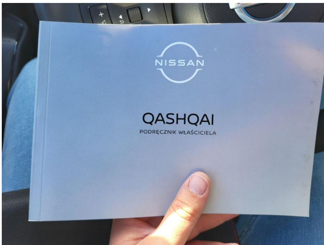
Fot. 36 Instrukcje