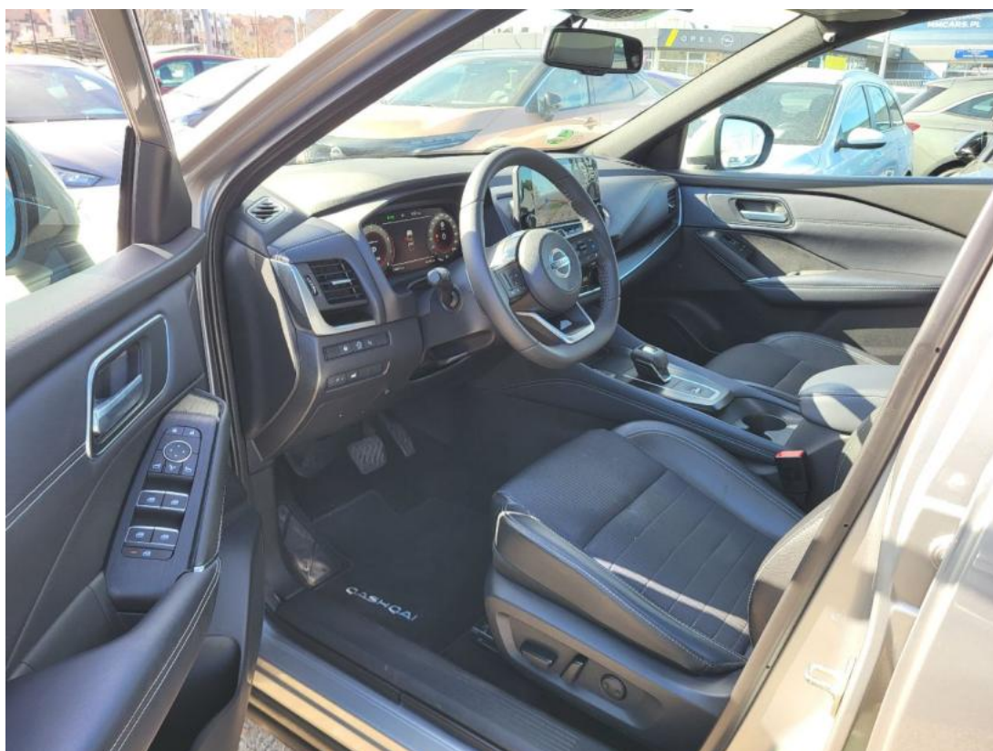
Fot. 16 Widok przez otwarte drzwi przednie lewe