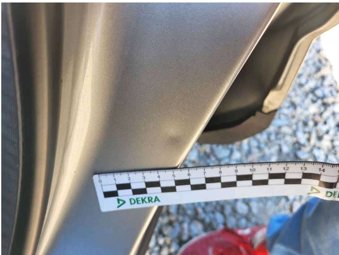
Fot. 42 Słupek środkowy L - Wgniecenie/odkształcenie 1