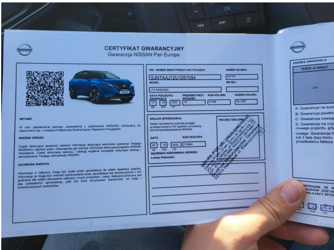
Fot. 34 Książka serwisowa – dane