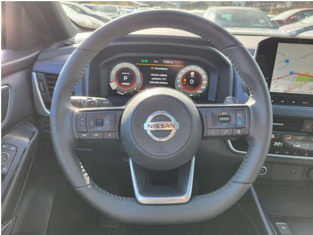
Fot. 21 Kierownica (na wprost)