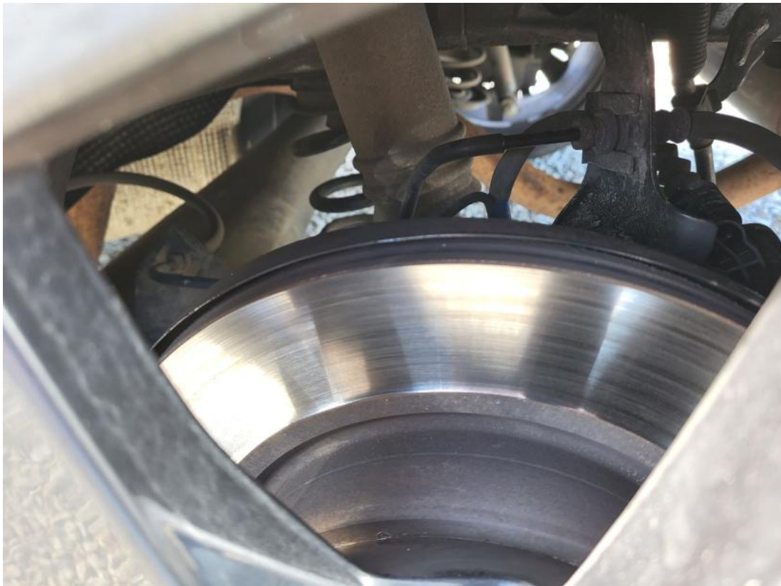
Fot. 31 Tarcza hamulcowa tylna lewa