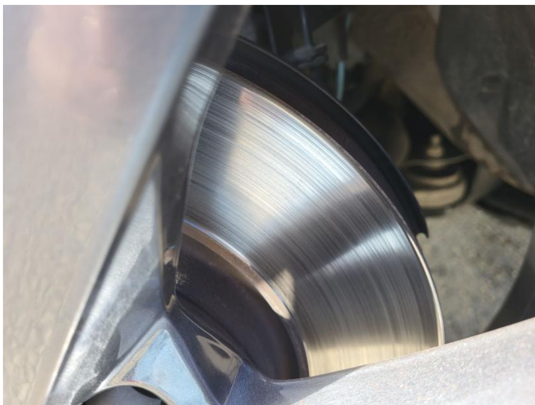
Fot. 28 Tarcza hamulcowa przednia lewa