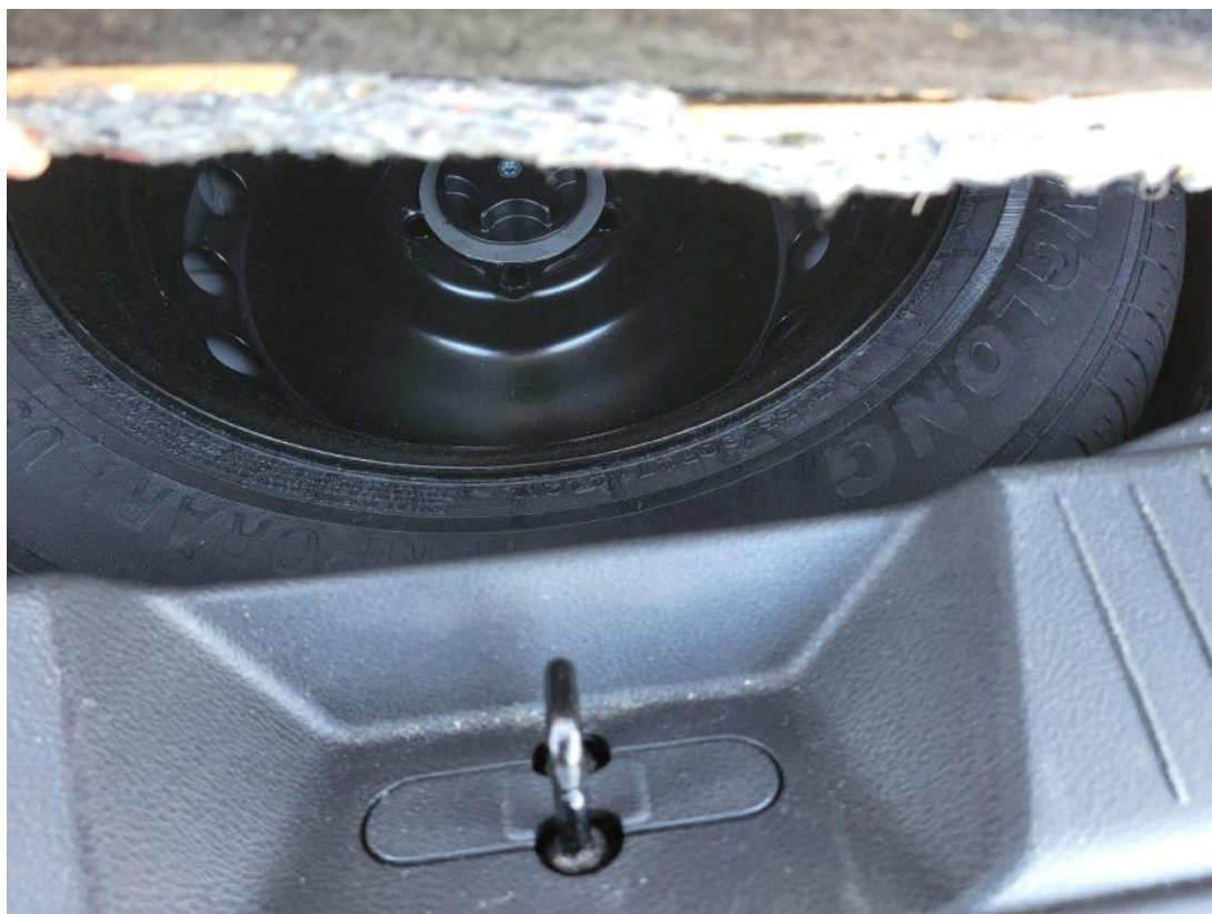
Fot. 25 Koło zapasowe