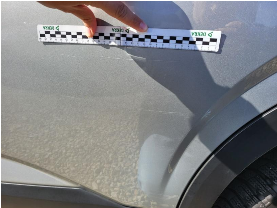
Fot. 41 Drzwi tylne L - Rysa/odprysk 1