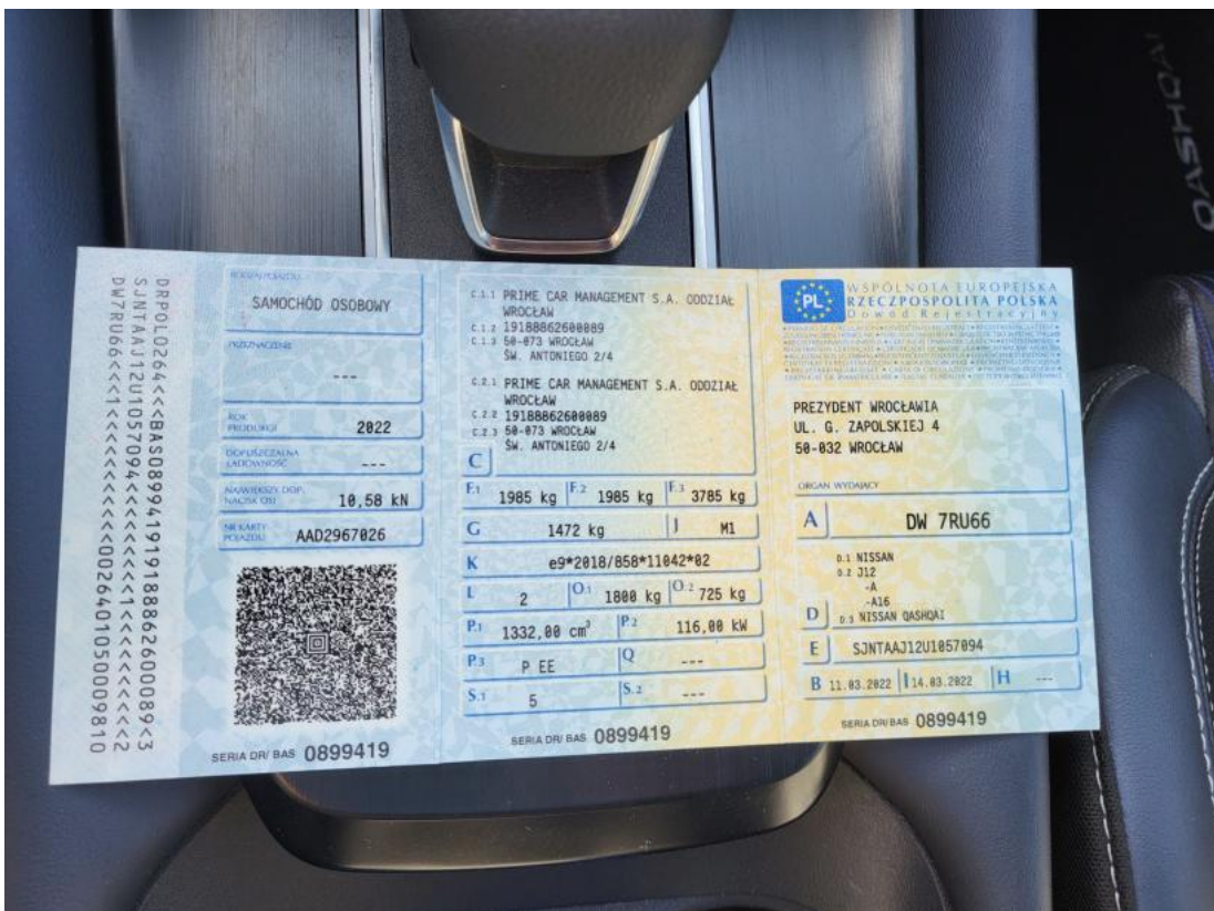
Fot. 32 Dowód rej. Str. 1