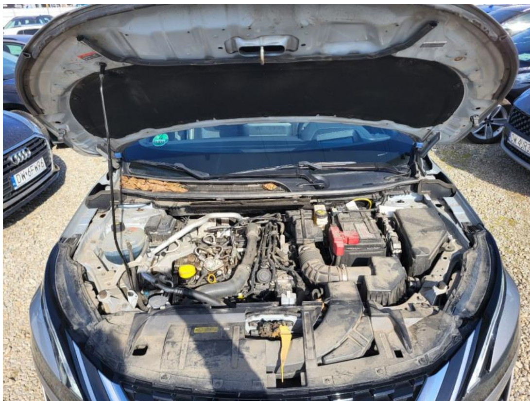
Fot. 23 Komora silnika