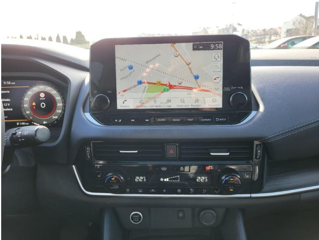
Fot. 19 Konsola środkowa