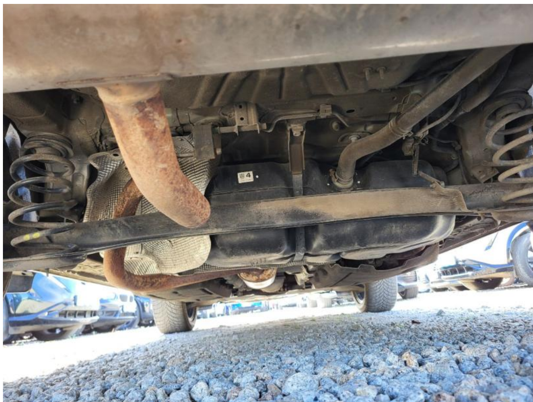
Fot. 27 Spód pojazdu tył