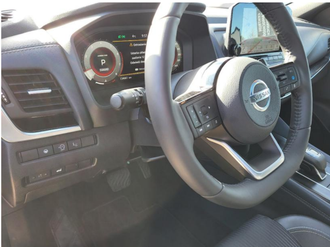
Fot. 22 Kierownica z lewej strony