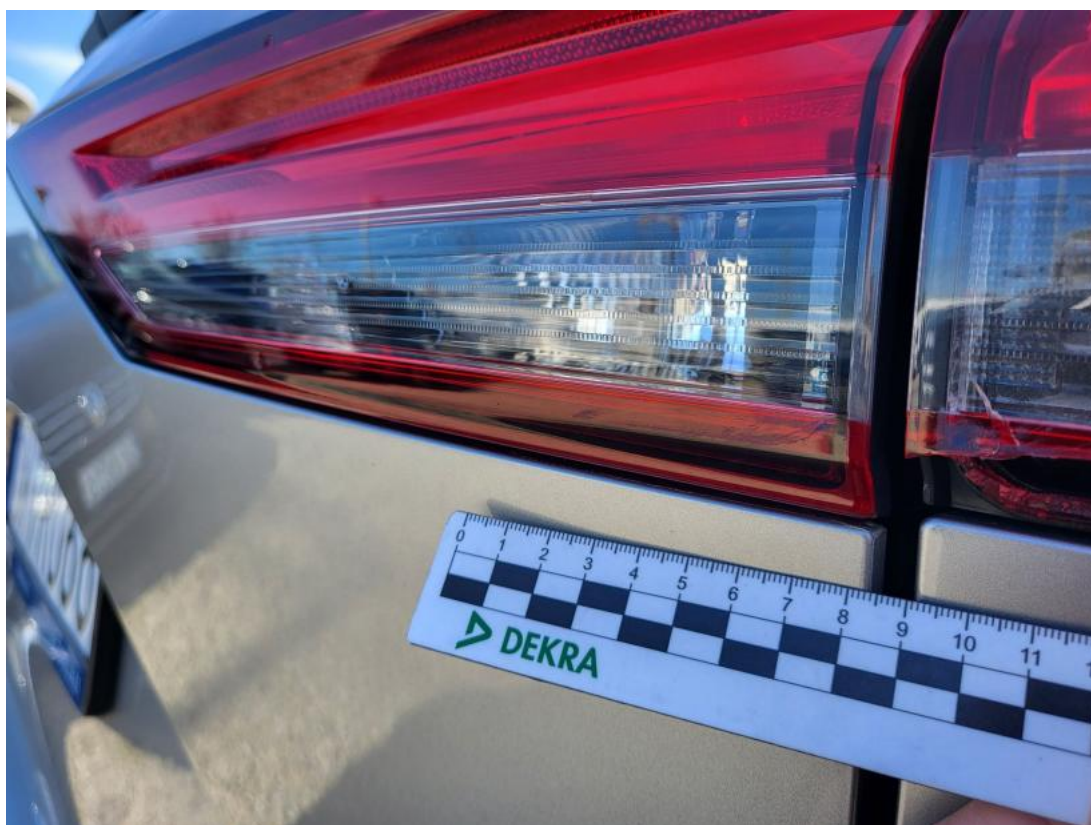
Fot. 37 Lampa tylna wew P - Rysa/odprysk 1