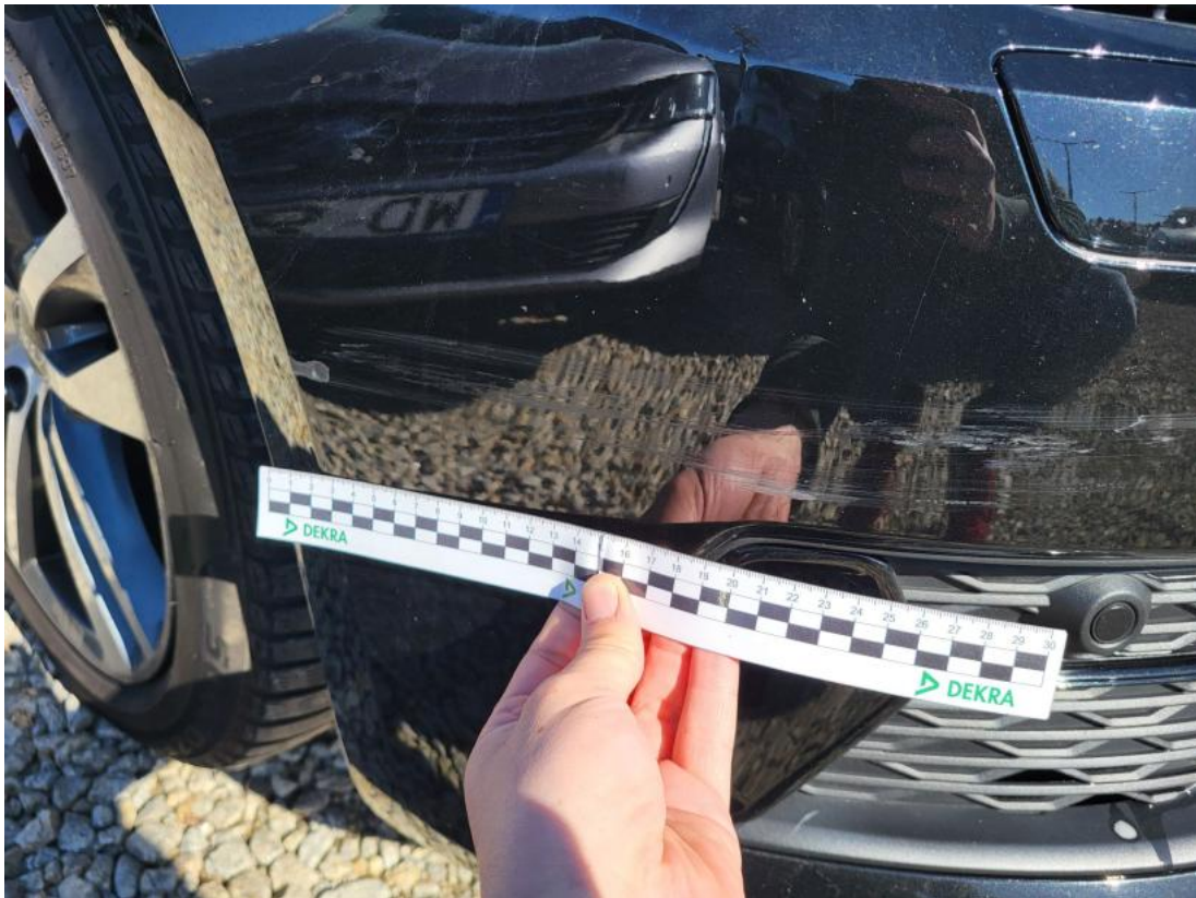
Fot. 39 Zderzak - Rysa/odprysk 1