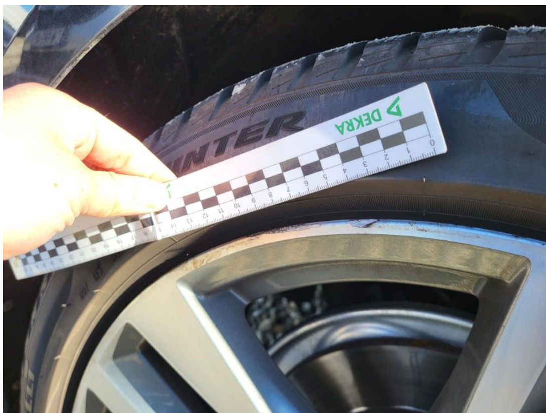
Fot. 45 Felga aluminiowa tylna P - Rysa/odprysk 1