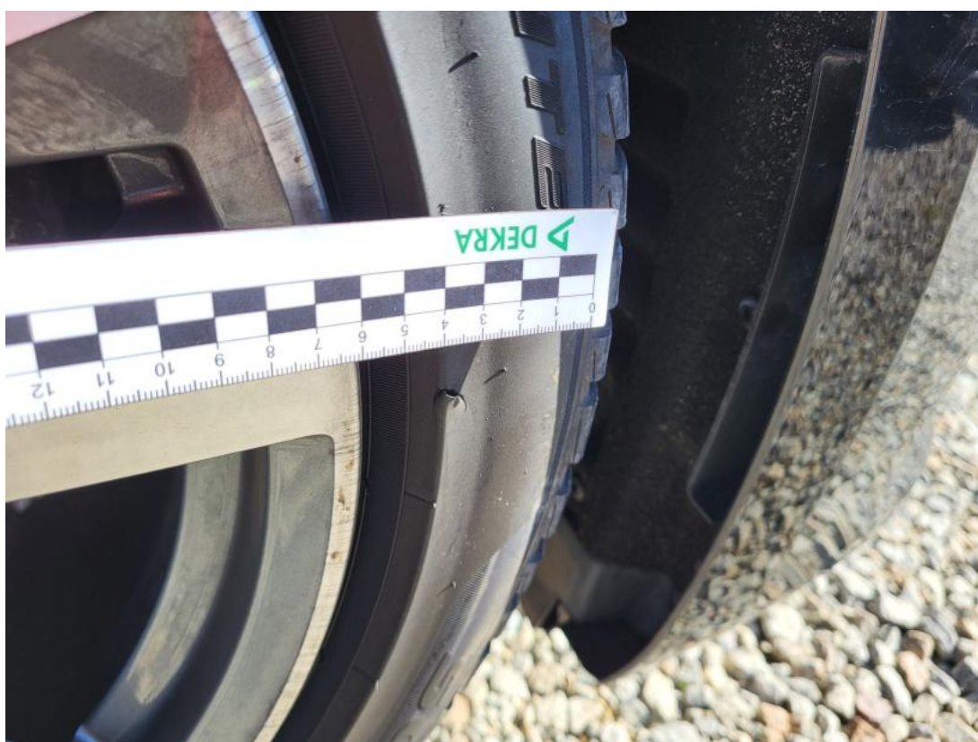
Fot. 42 Opona przednia P - Pęknięcie/rozerwanie 1