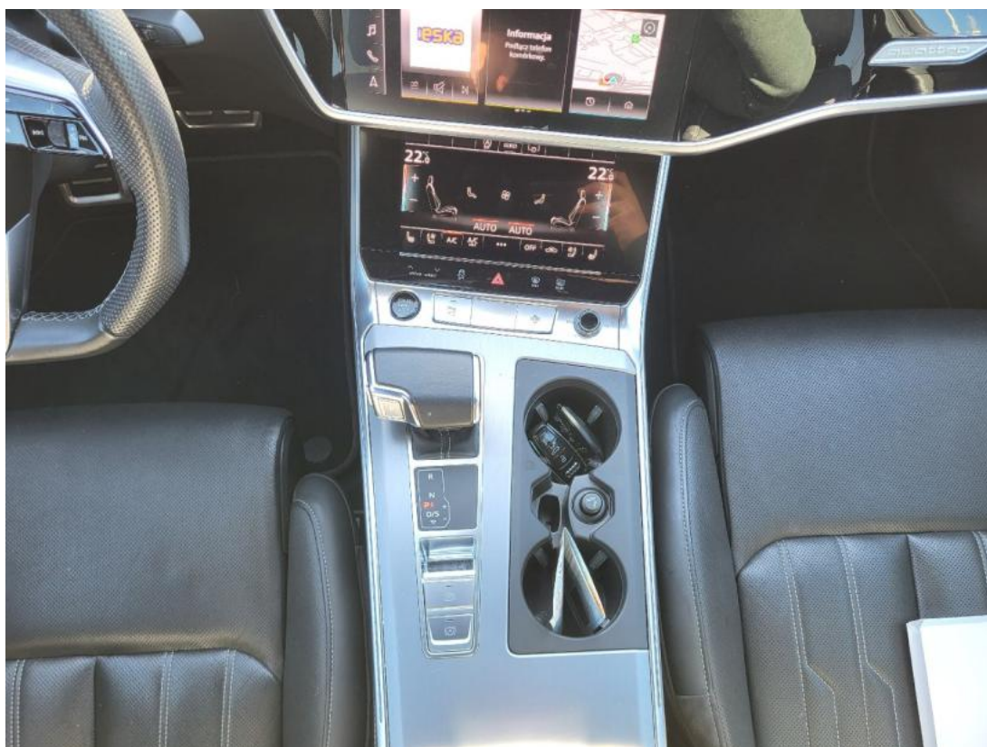
Fot. 20 Tunel środkowy