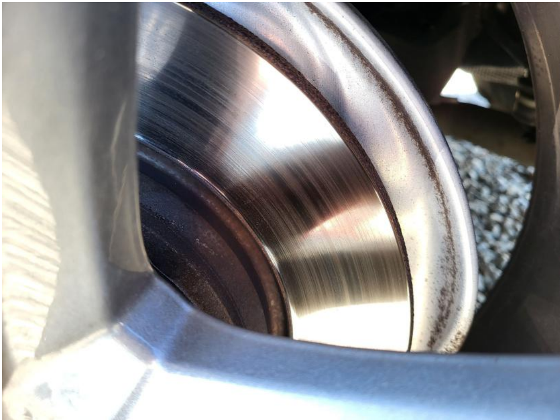
Fot. 31 Tarcza hamulcowa tylna lewa