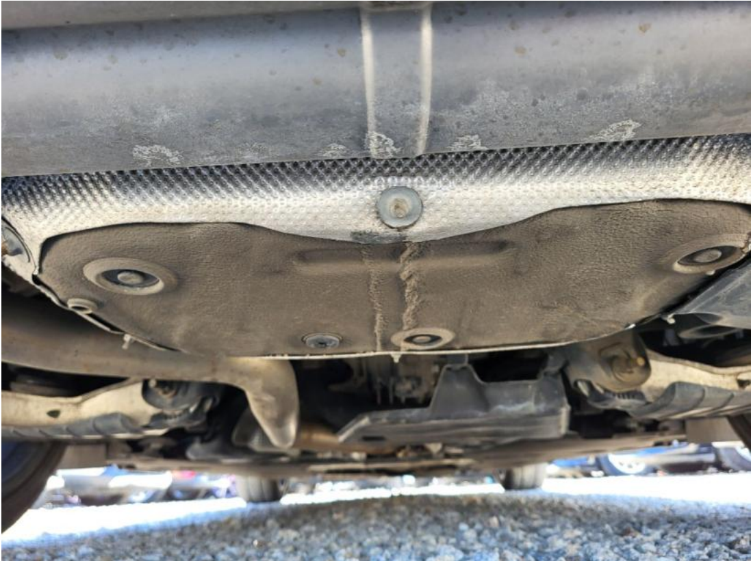
Fot. 27 Spód pojazdu tył