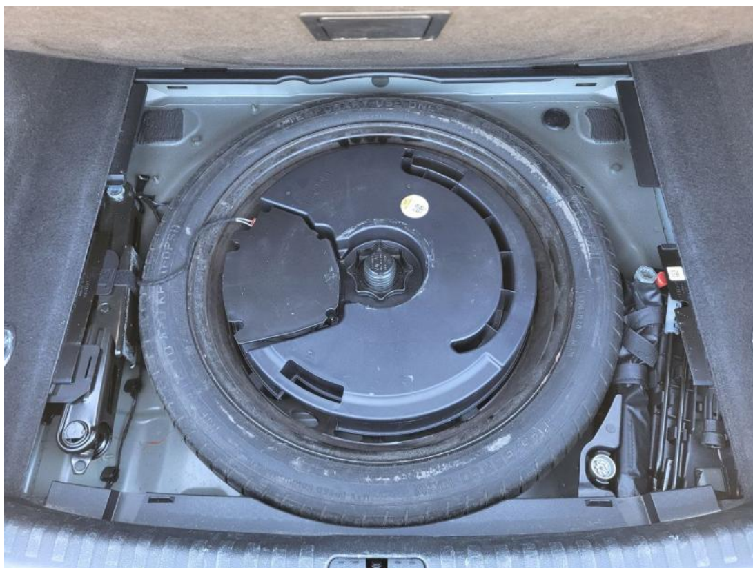
Fot. 25 Koło zapasowe