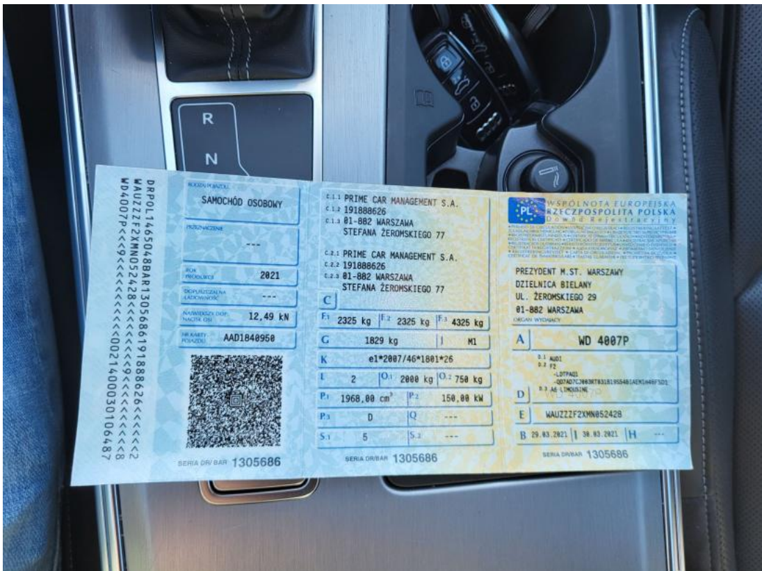
Fot. 32 Dowód rej. Str. 1