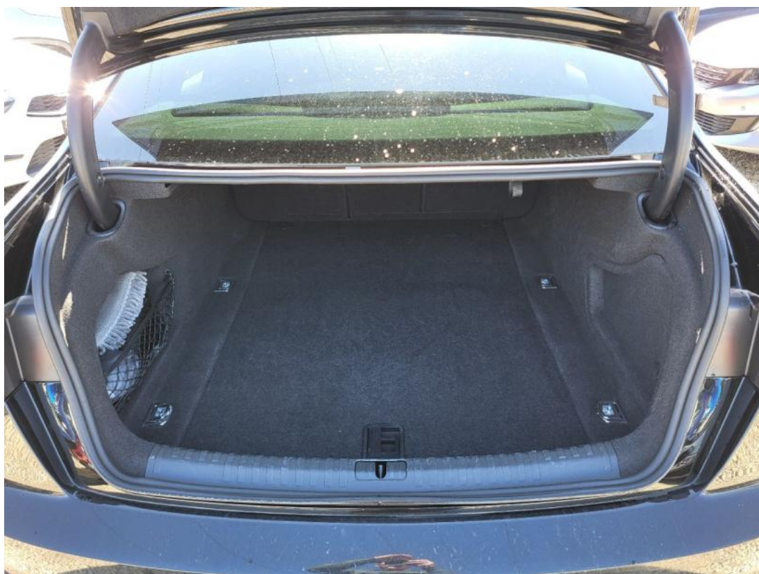
Fot. 24 Bagażnik