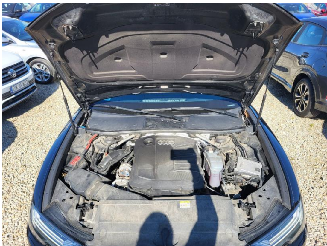
Fot. 23 Komora silnika