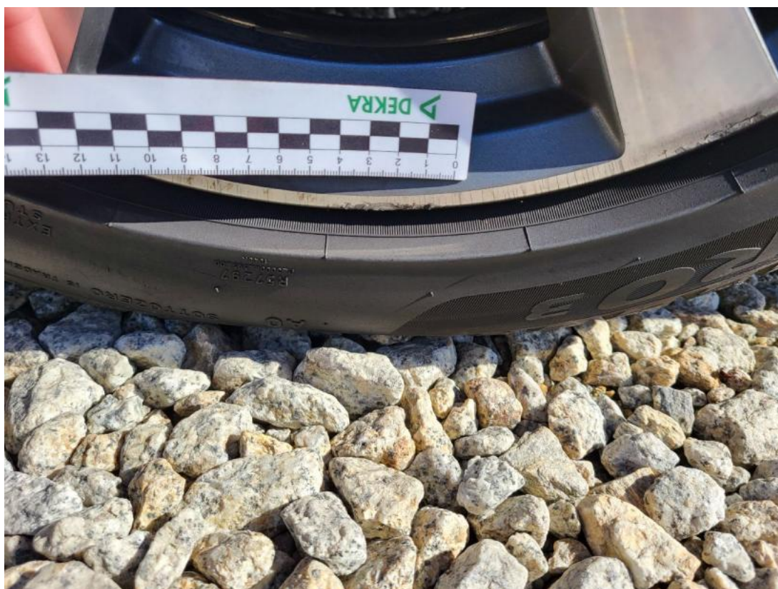
Fot. 41 Felga aluminiowa przednia P - Rysa/odprysk 2