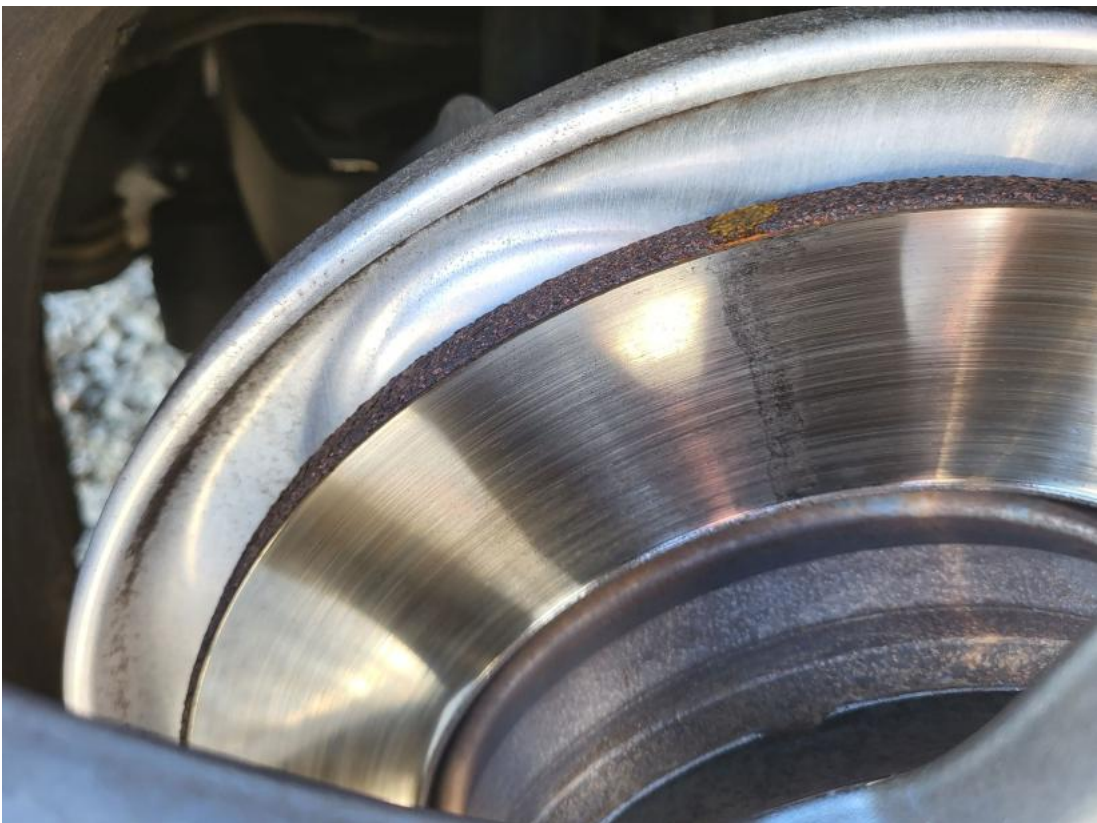
Fot. 30 Tarcza hamulcowa tylna prawa