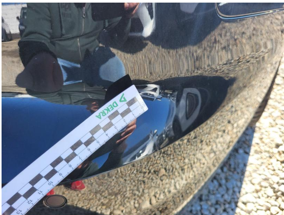
Fot. 46 Zderzak tylny - Wgniecenie/odkształcenie 1