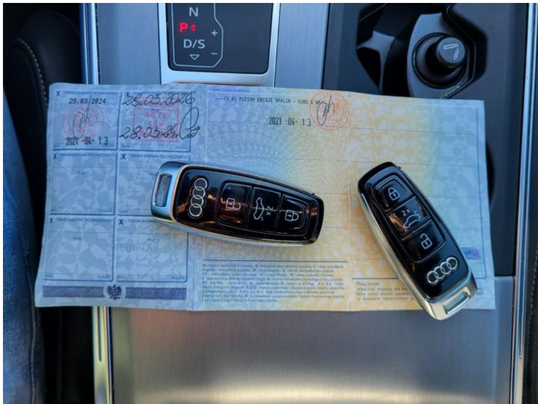
Fot. 33 Dow. Rej. Str.2 i klucze