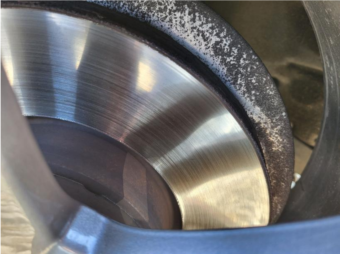
Fot. 29 Tarcza hamulcowa przednia prawa