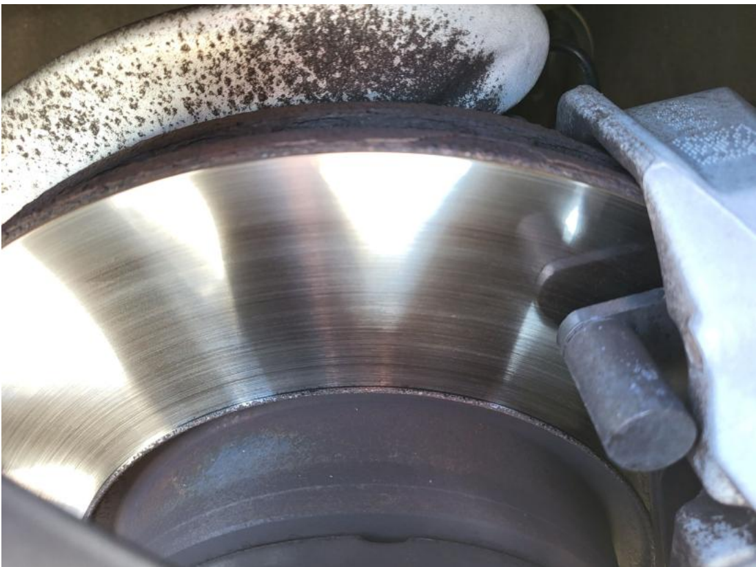
Fot. 28 Tarcza hamulcowa przednia lewa