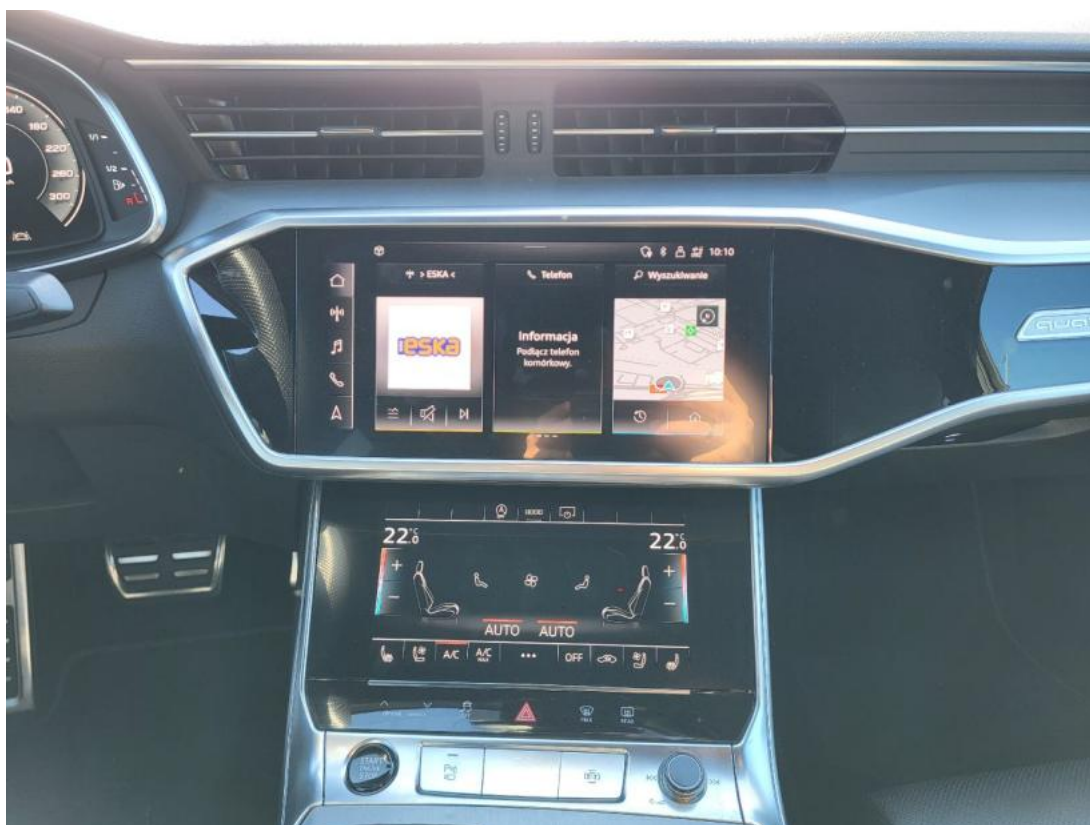
Fot. 19 Konsola środkowa