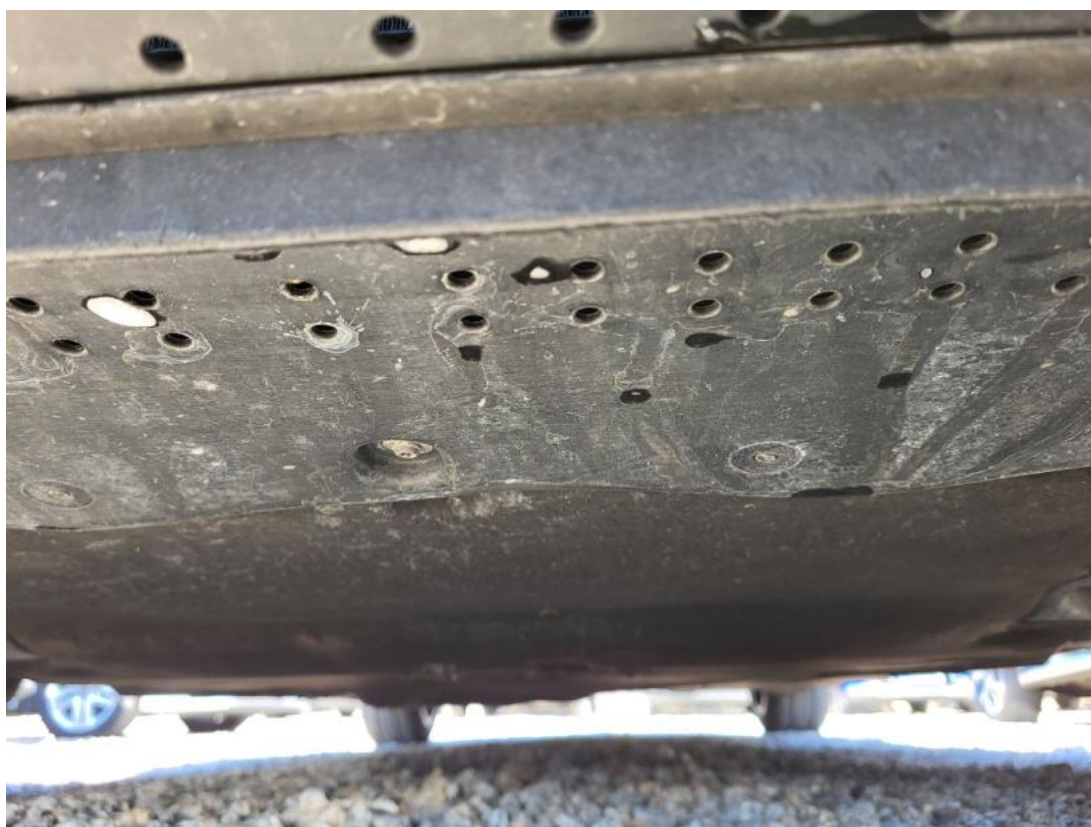
Fot. 26 Spód pojazdu przód