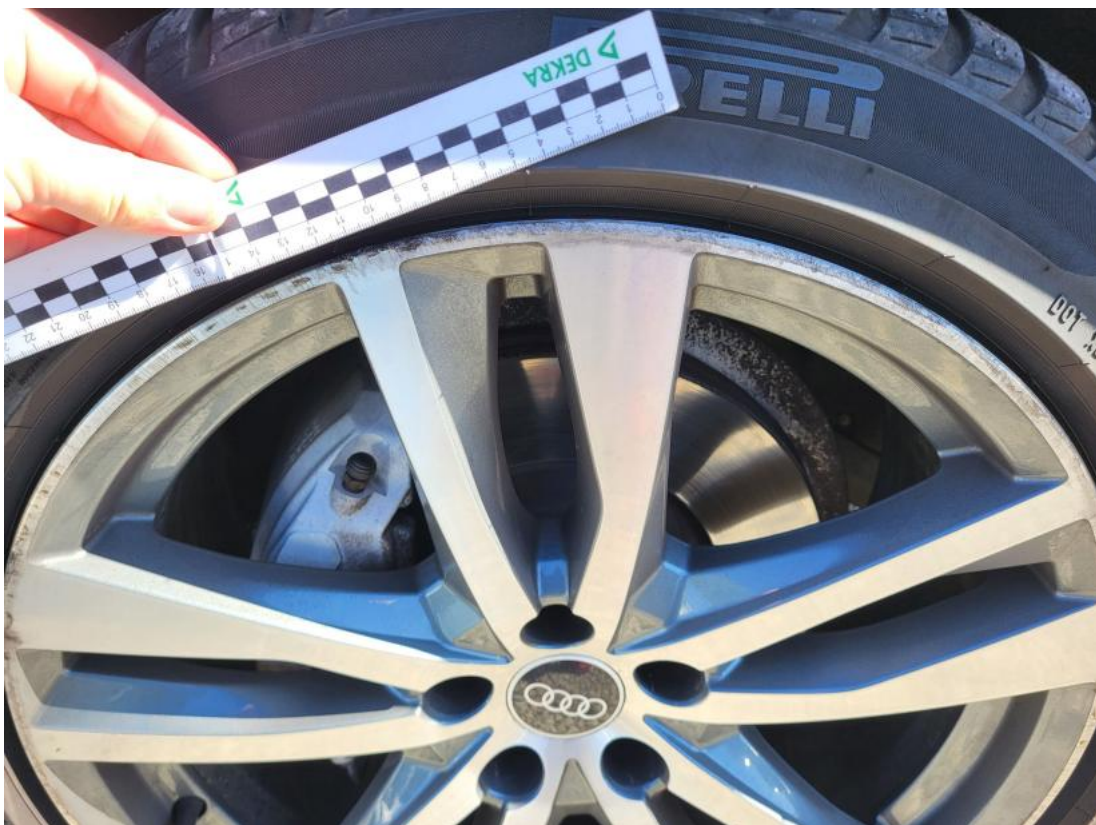
Fot. 40 Felga aluminiowa przednia P - Rysa/odprysk 1