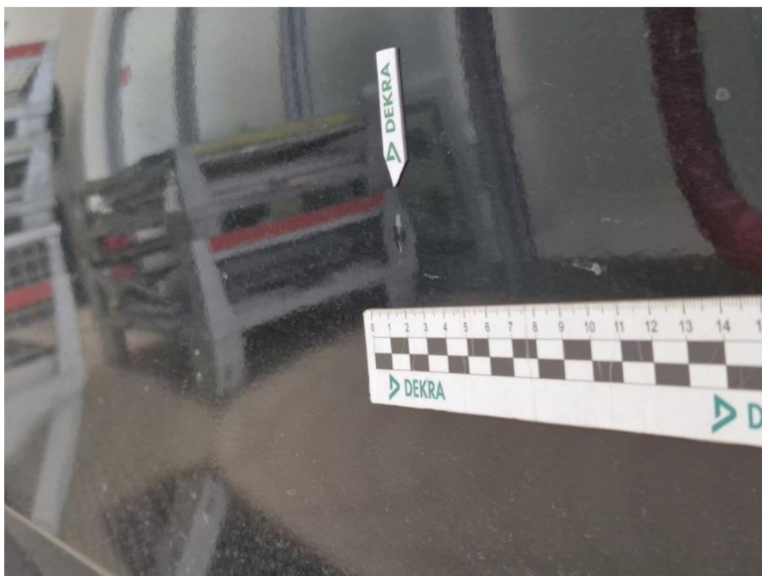
Fot. 43 Drzwi przed L - Wgniecenie/odkształcenie 1