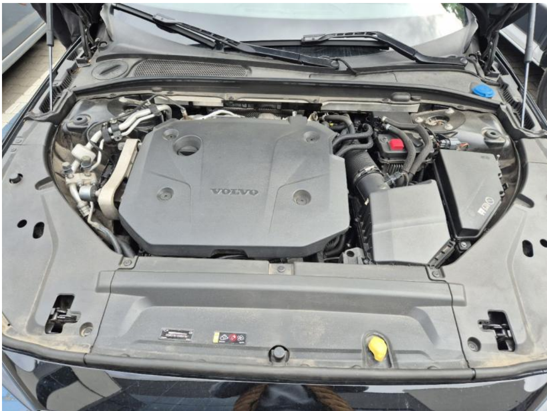
Fot. 24 Komora silnika