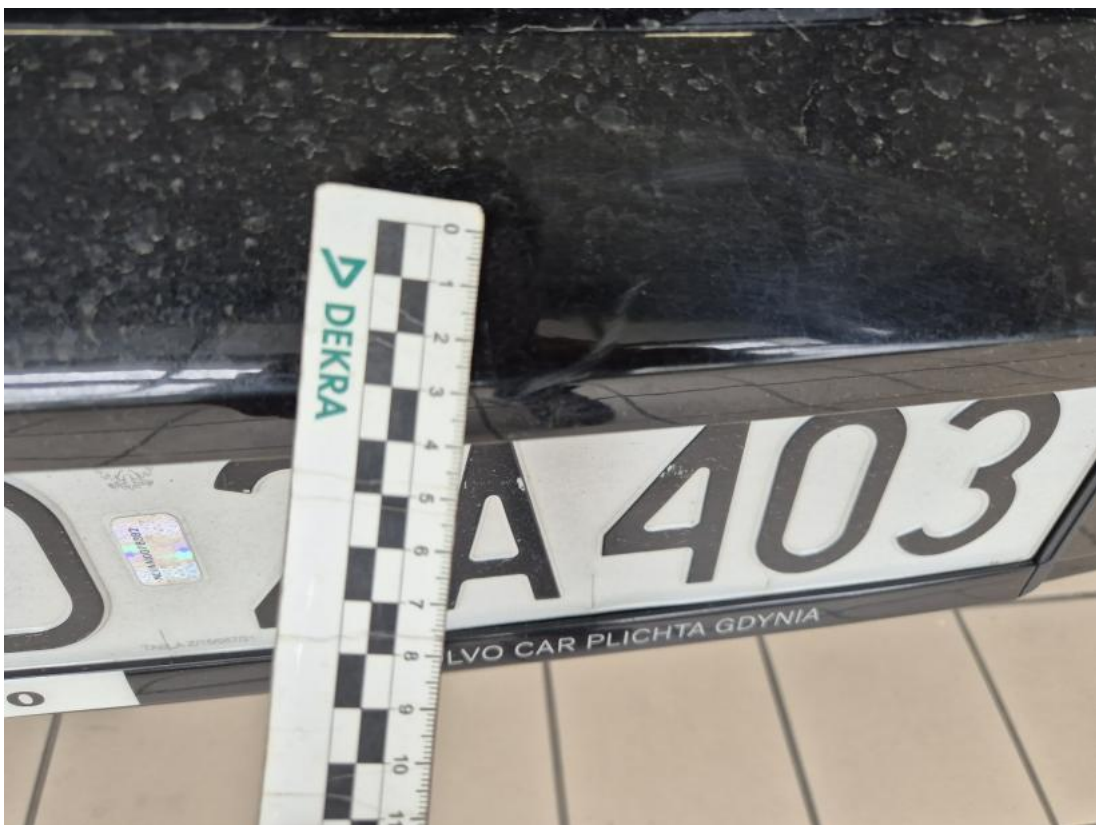
Fot. 40 Zderzak tylny - Rysa/odprysk 1