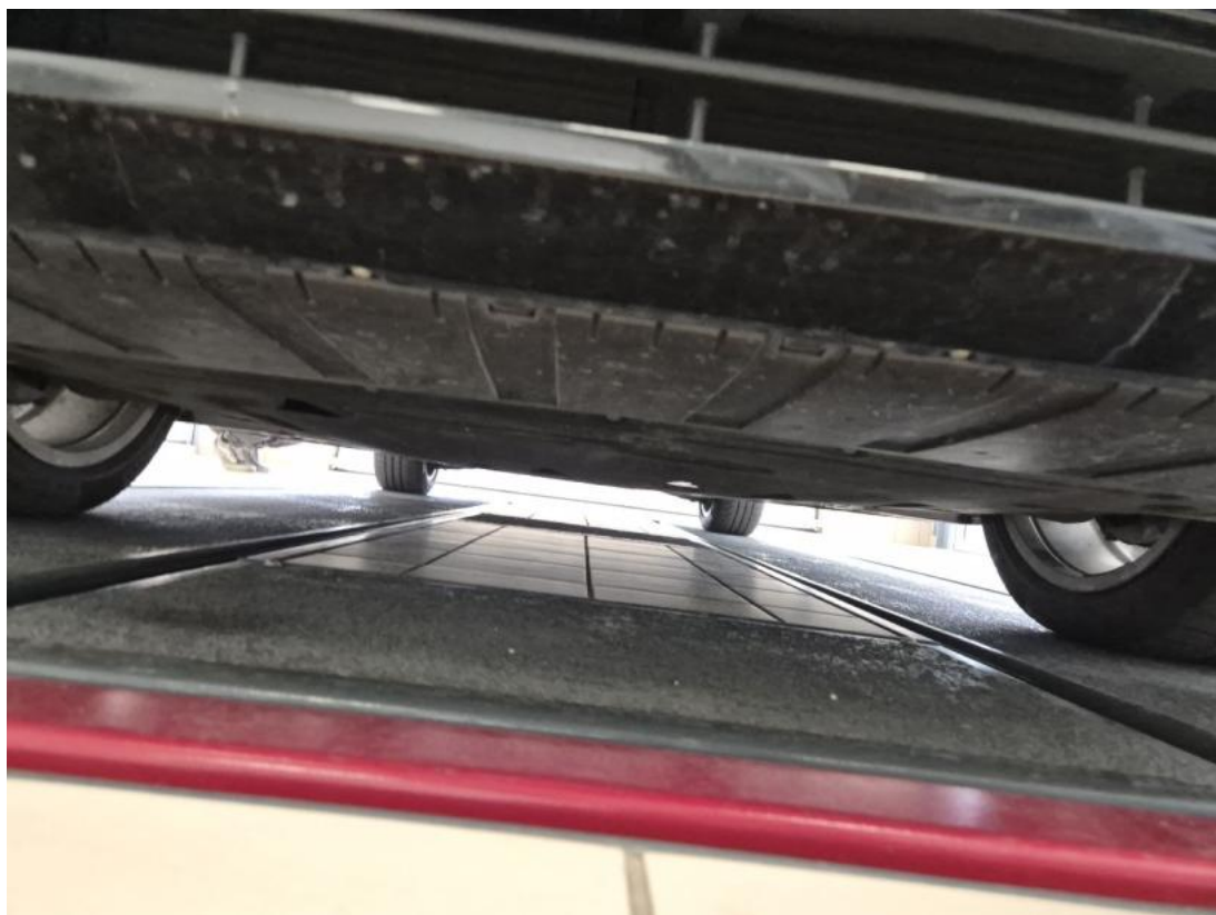
Fot. 27 Spód pojazdu przód