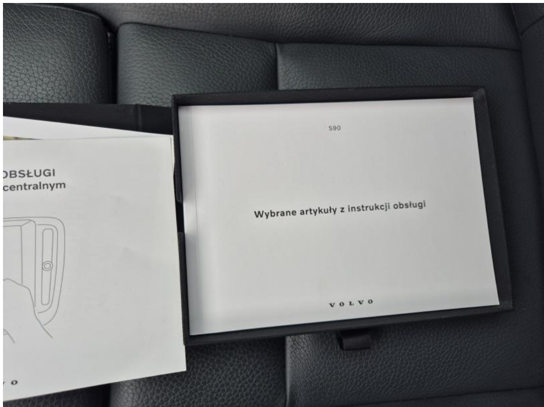
Fot. 33 Instrukcje