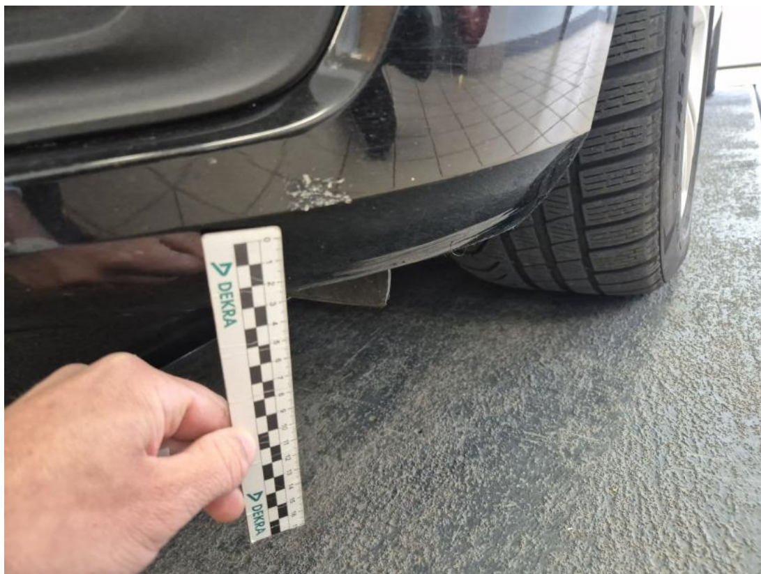
Fot. 35 Zderzak - Rysa/odprysk 1