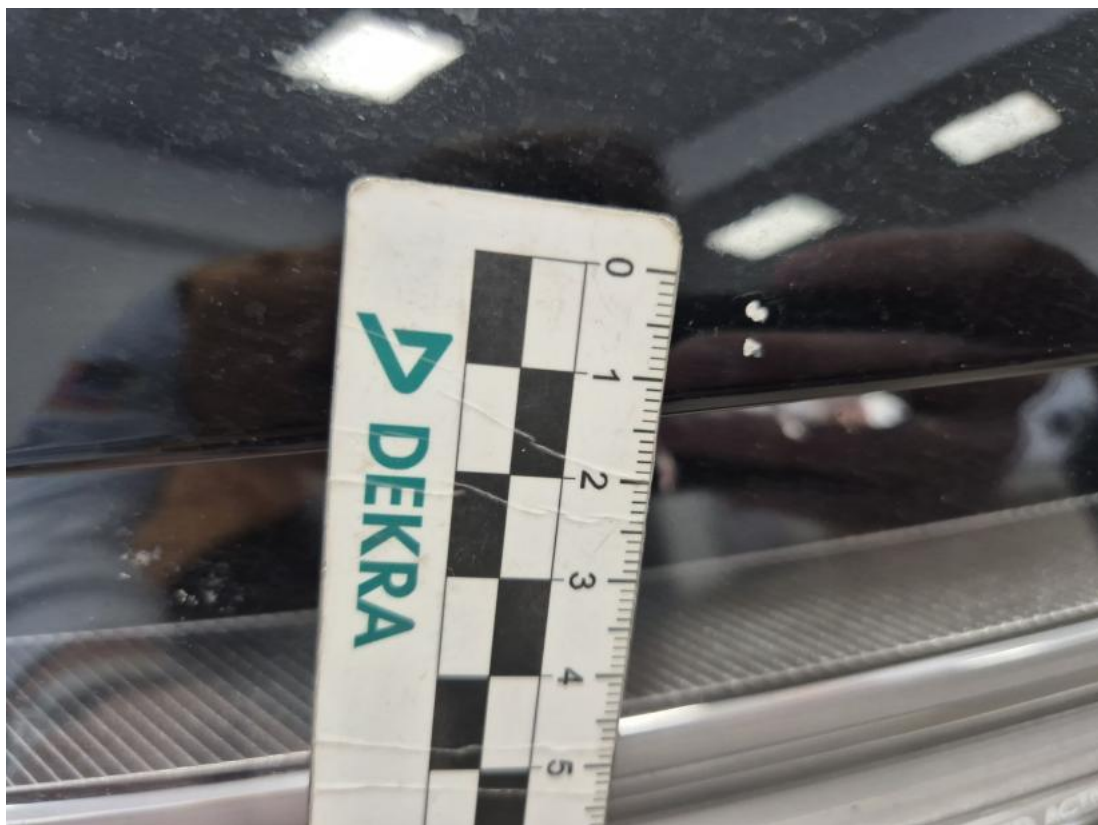
Fot. 34 Pokrywa komory silnika - Rysa/odprysk 1