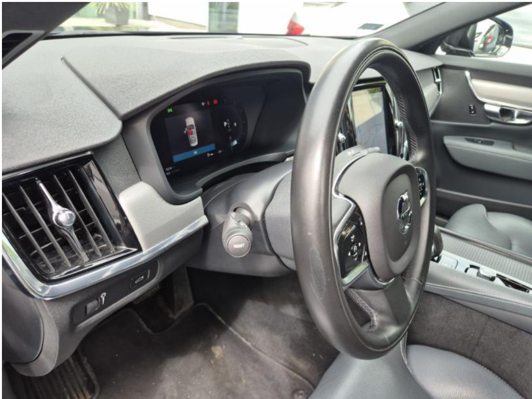
Fot. 23 Kierownica z lewej strony