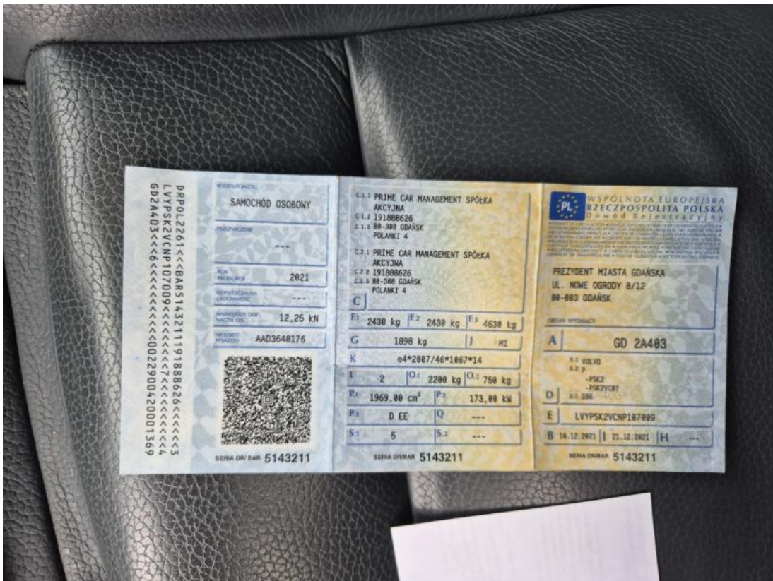
Fot. 29 Dowód rej. Str. 1