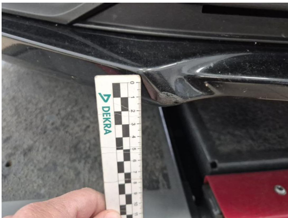
Fot. 36 Zderzak - Rysa/odprysk 2