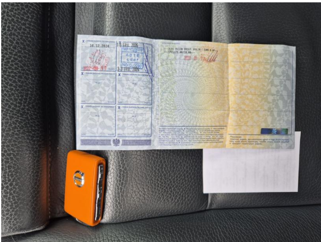
Fot. 30 Dow. Rej. Str.2 i klucze