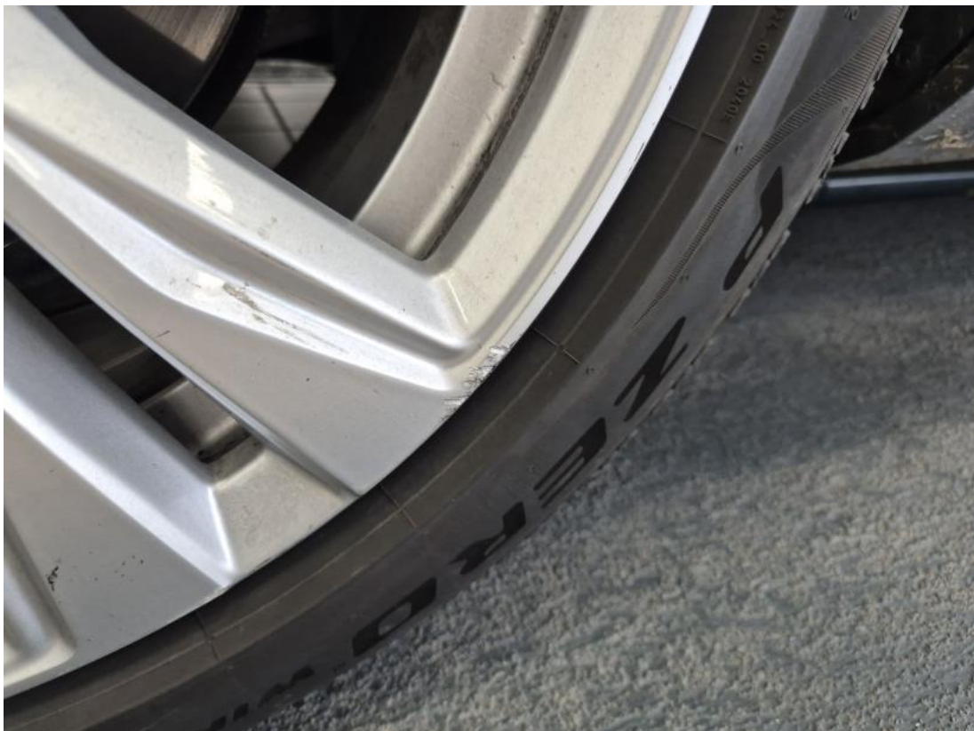
Fot. 46 Felga Aluminiowa przednia L - Rysa/odprysk 1