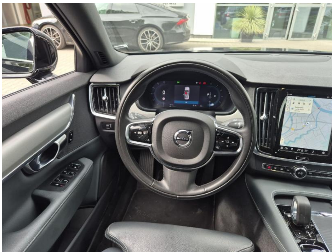
Fot. 22 Kierownica (na wprost)