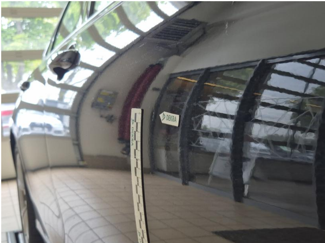
Fot. 37 Drzwi przednie P - Wgniecenie/odkształcenie 1