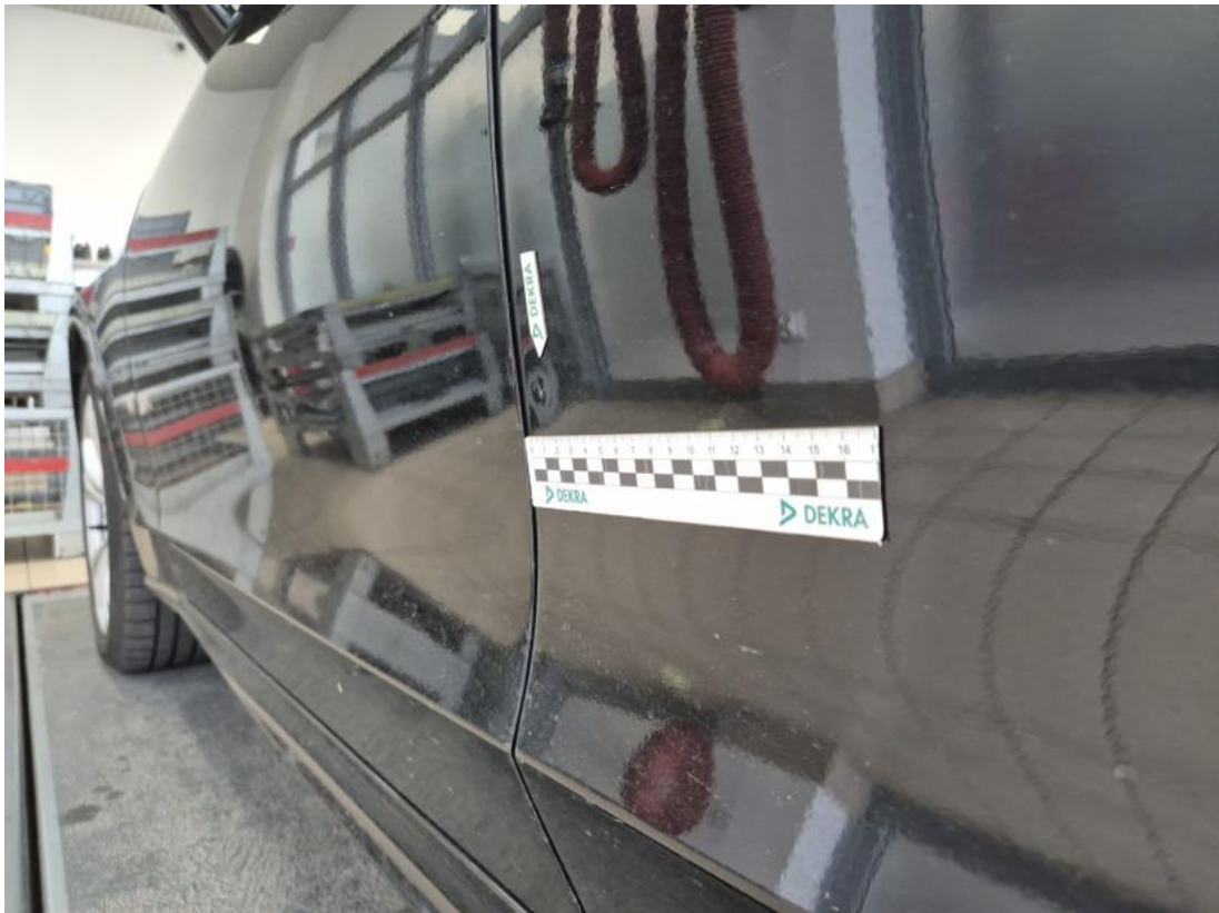
Fot. 45 Drzwi tylne L - Wgniecenie/odkształcenie 1