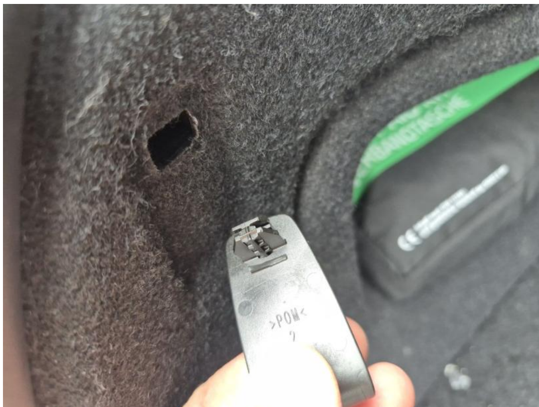
Fot. 49 Wykładzina przestrzeni bagażowej - Pęknięcie/rozerwanie 1