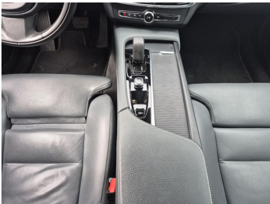
Fot. 21 Tunel środkowy