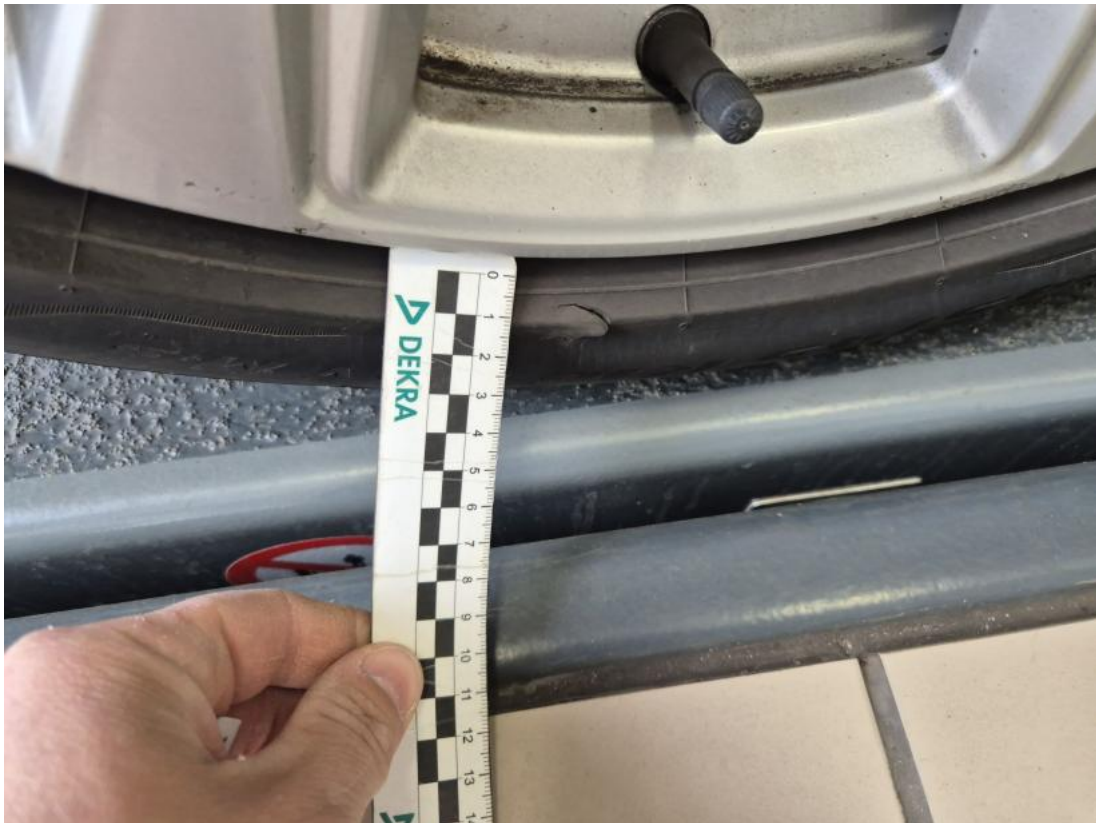
Fot. 39 Opona tylna P - Inne 1