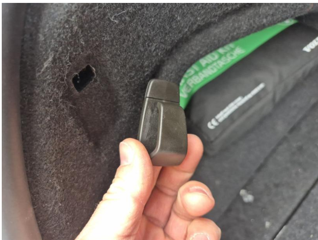
Fot. 50 Wykładzina przestrzeni bagażowej - Pęknięcie/rozerwanie 2