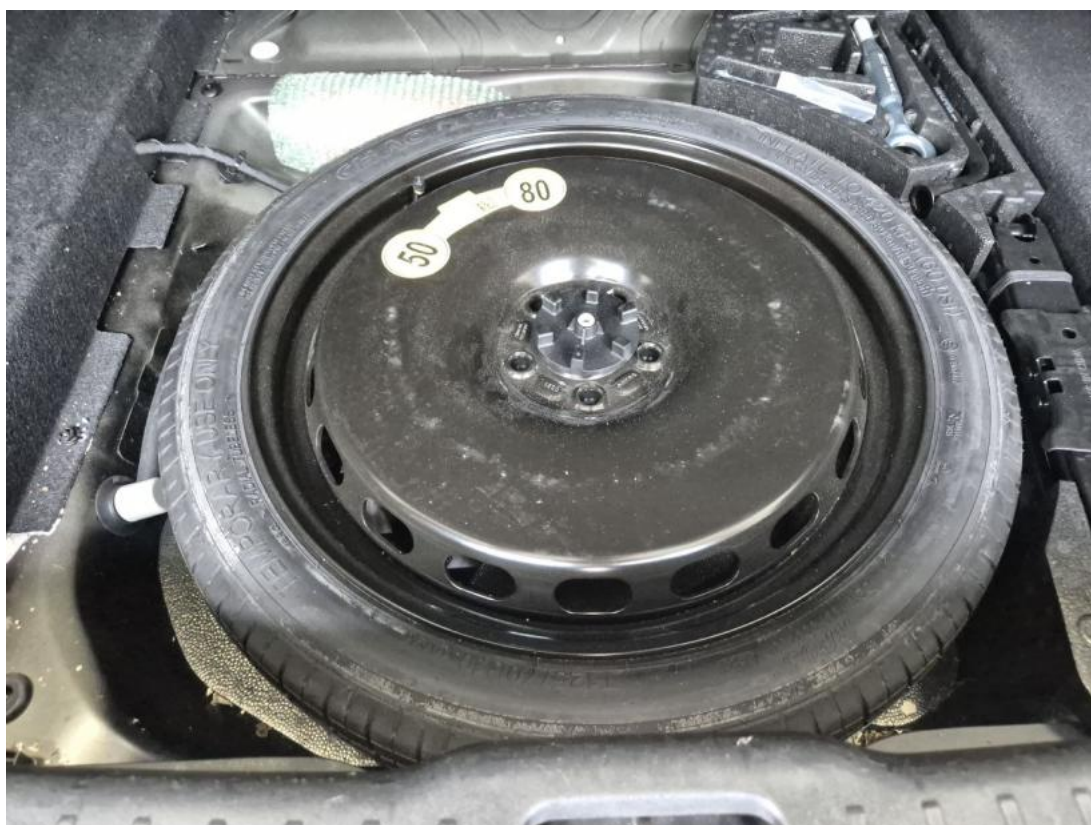
Fot. 26 Koło zapasowe