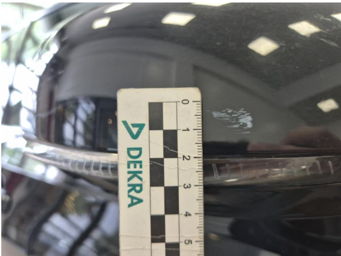
Fot. 38 Lusterko zew P - Rysa/odprysk 1