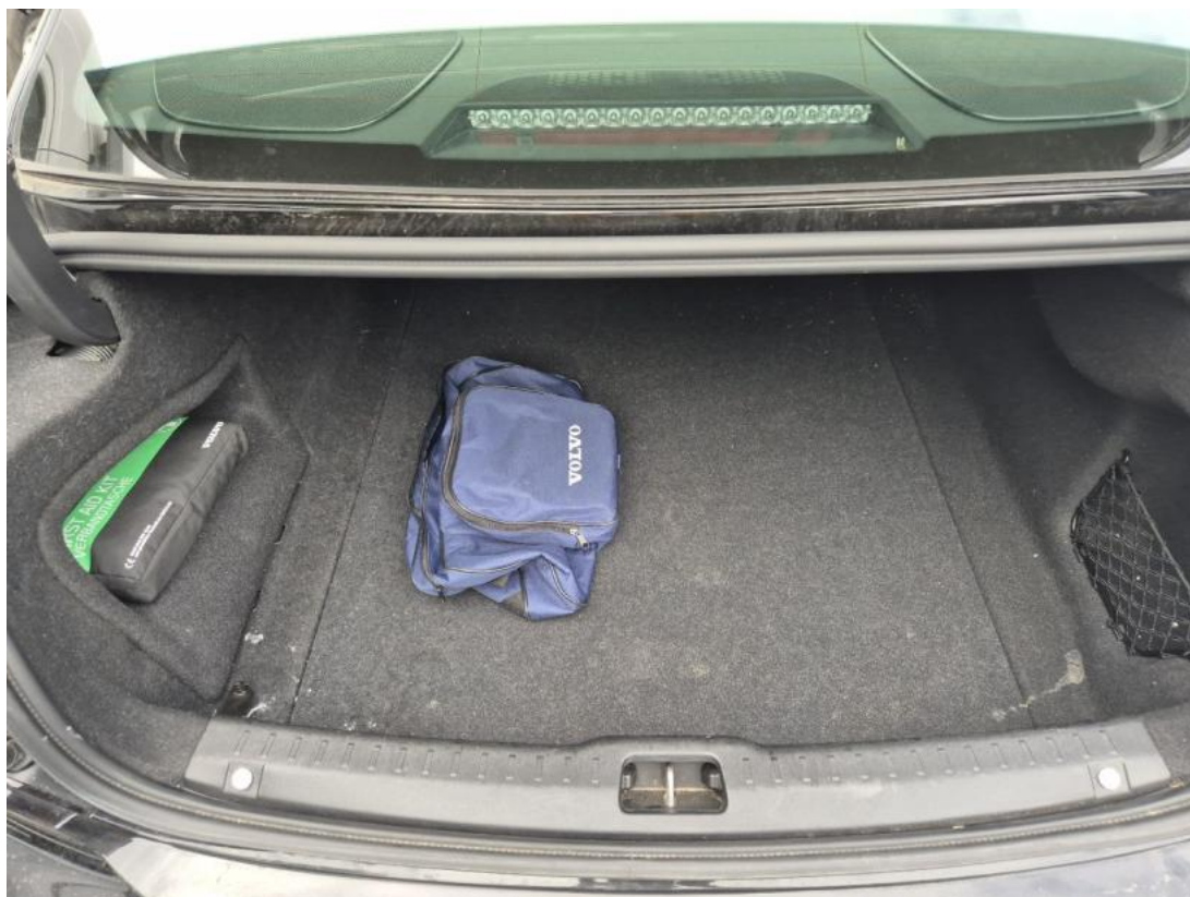
Fot. 25 Bagażnik