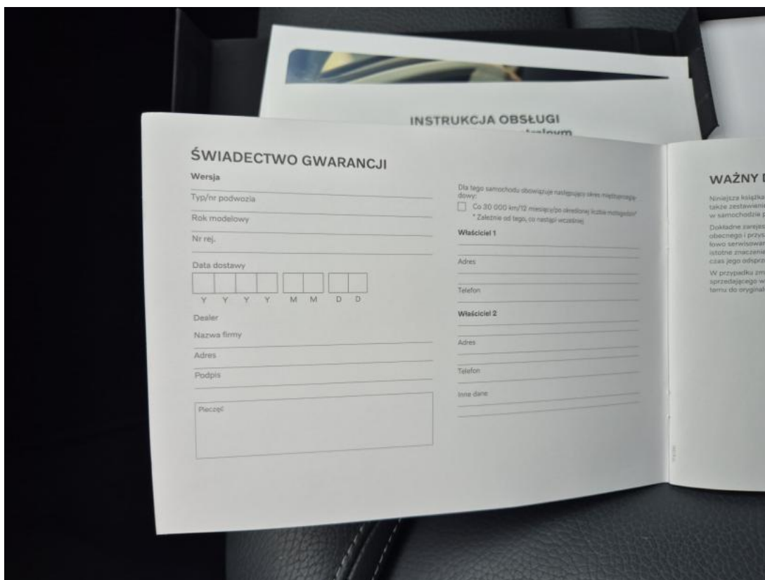
Fot. 31 Książka serwisowa – dane