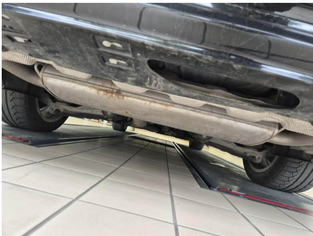
Fot. 28 Spód pojazdu tył