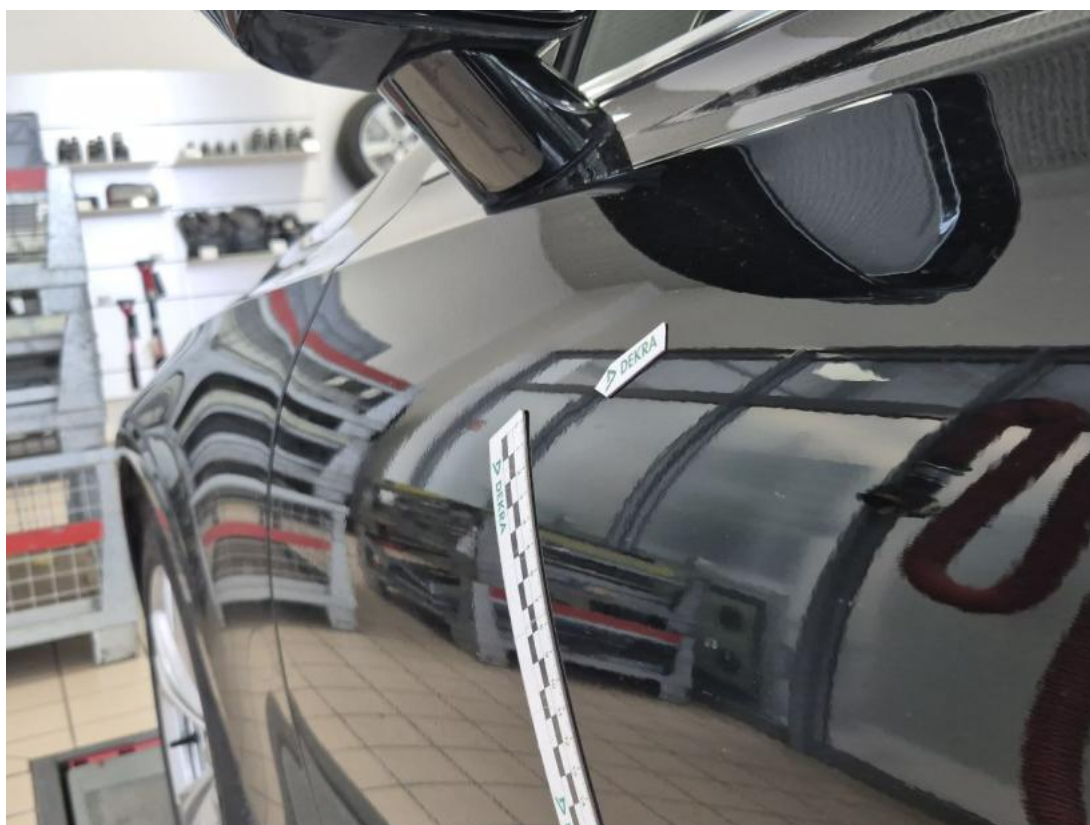
Fot. 44 Drzwi przed L - Wgniecenie/odkształcenie 2