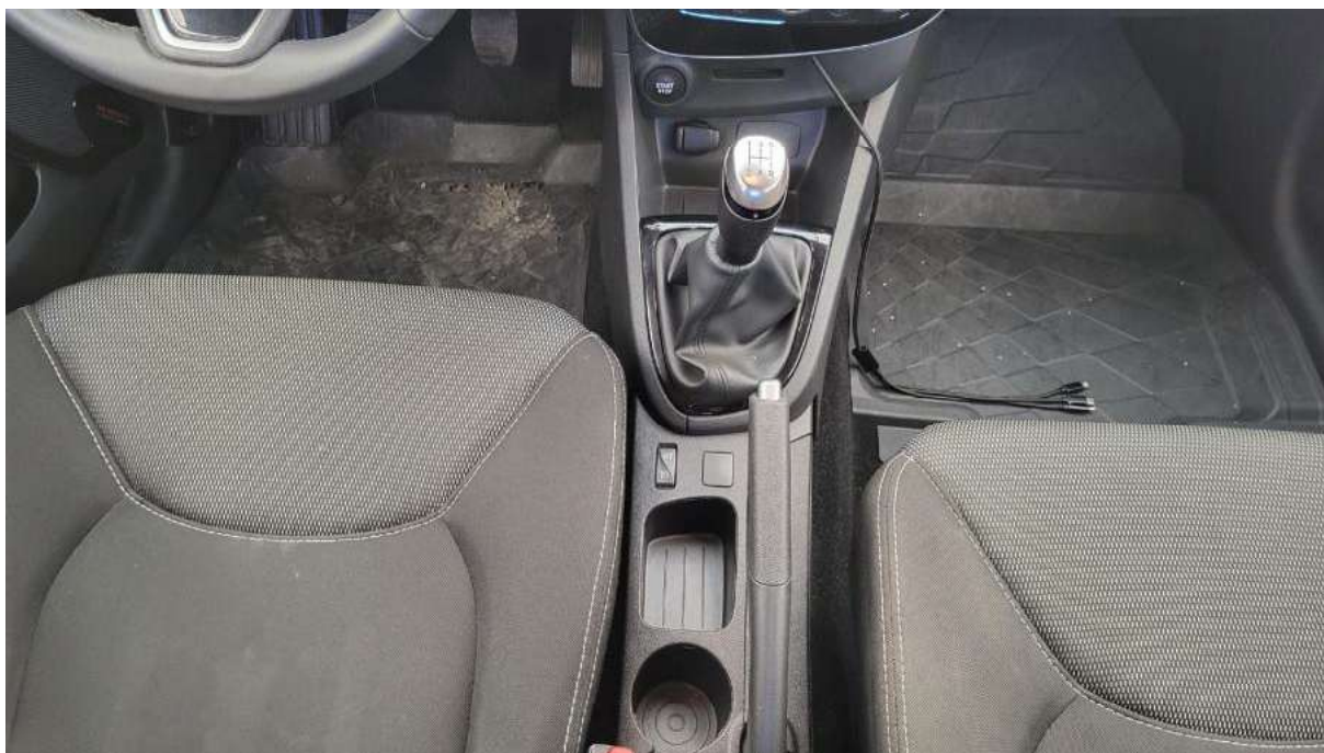
Fot. 20 Tuneł środkowy