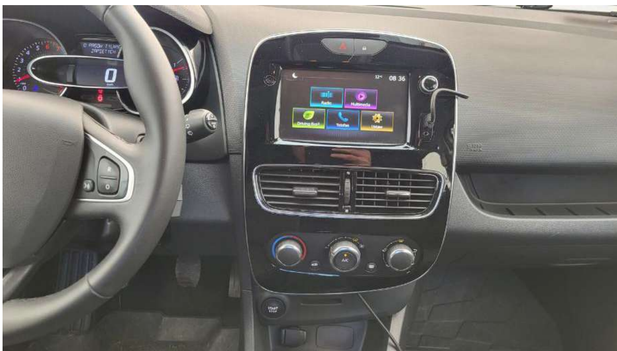
Fot. 19 Konsola środkowa