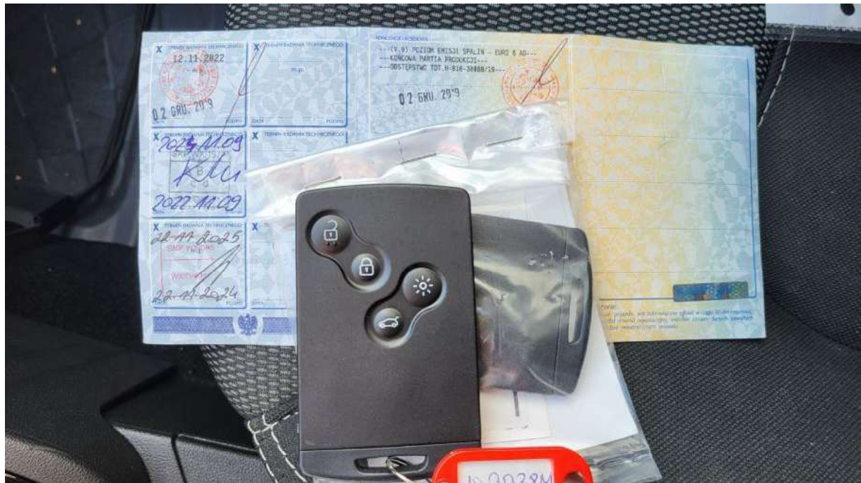
Fot. 28 Dow. Rej. Str.2 i klucze