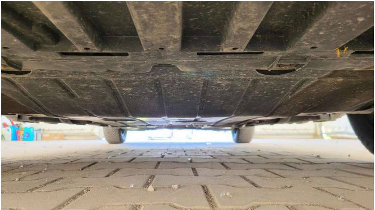
Fot. 25 Spód pojazdu przód