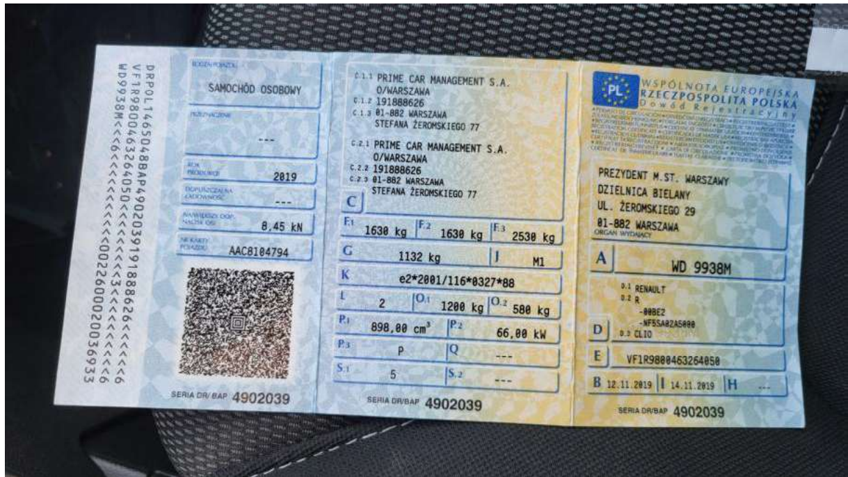
Fot. 27 Dowód rej. Str. 1