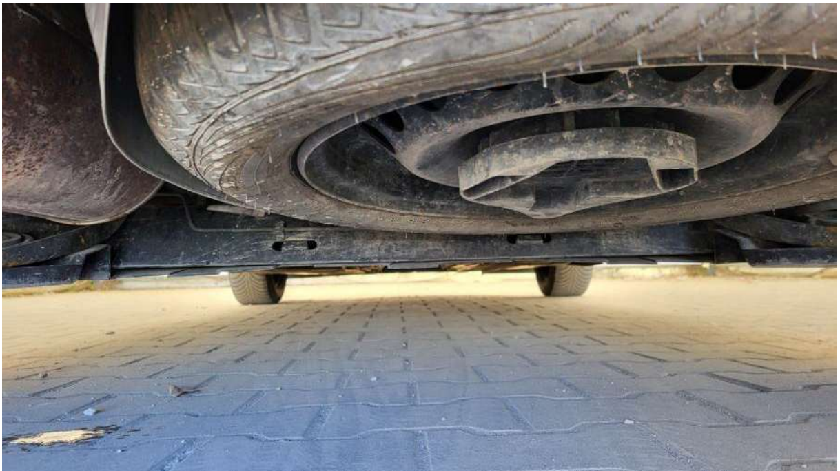
Fot. 26 Spód pojazdu tył