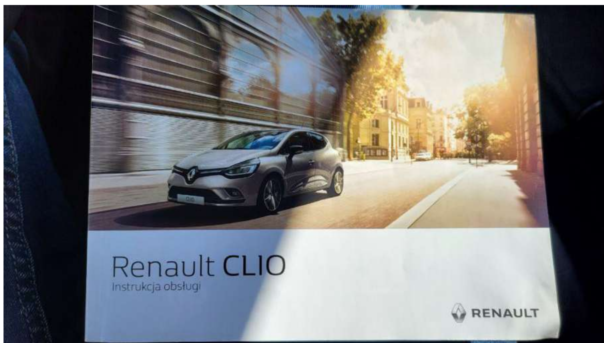
Fot. 31 Instrukcje