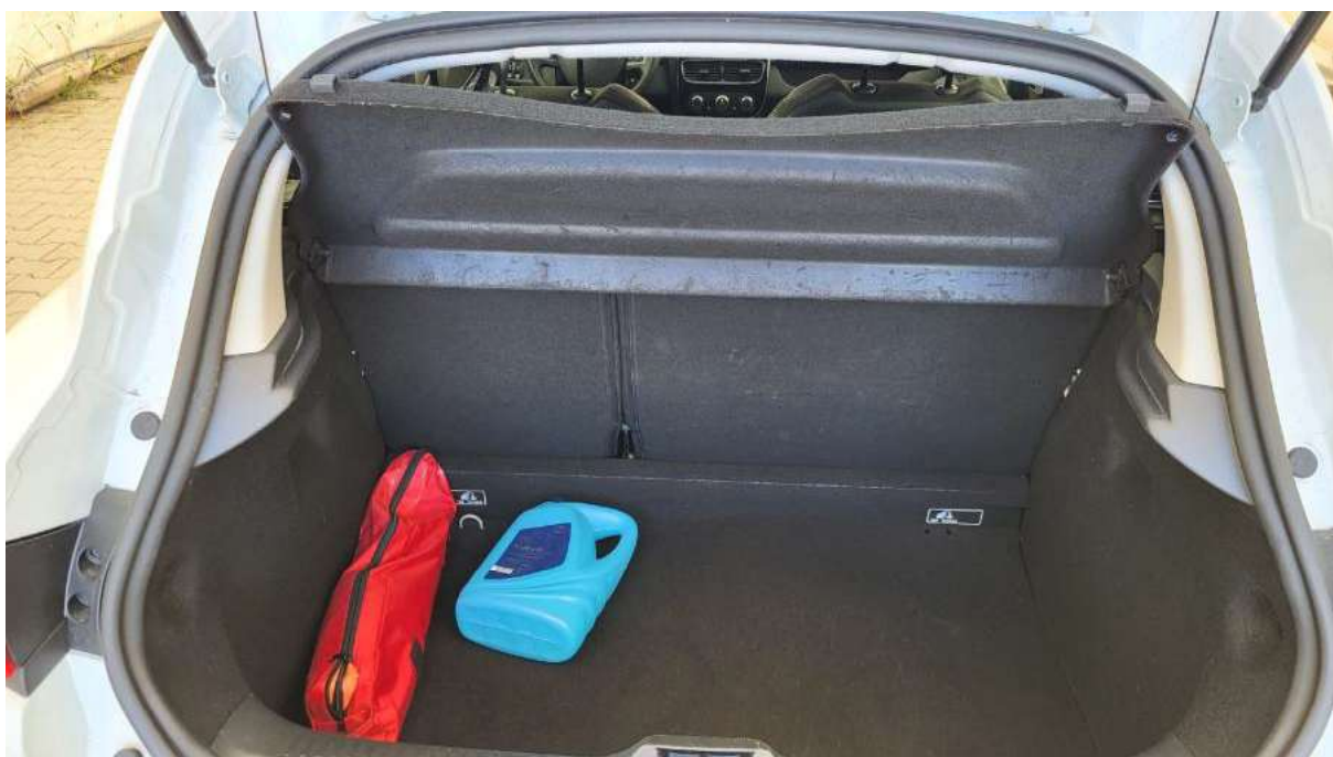
Fot. 24 Bagażnik