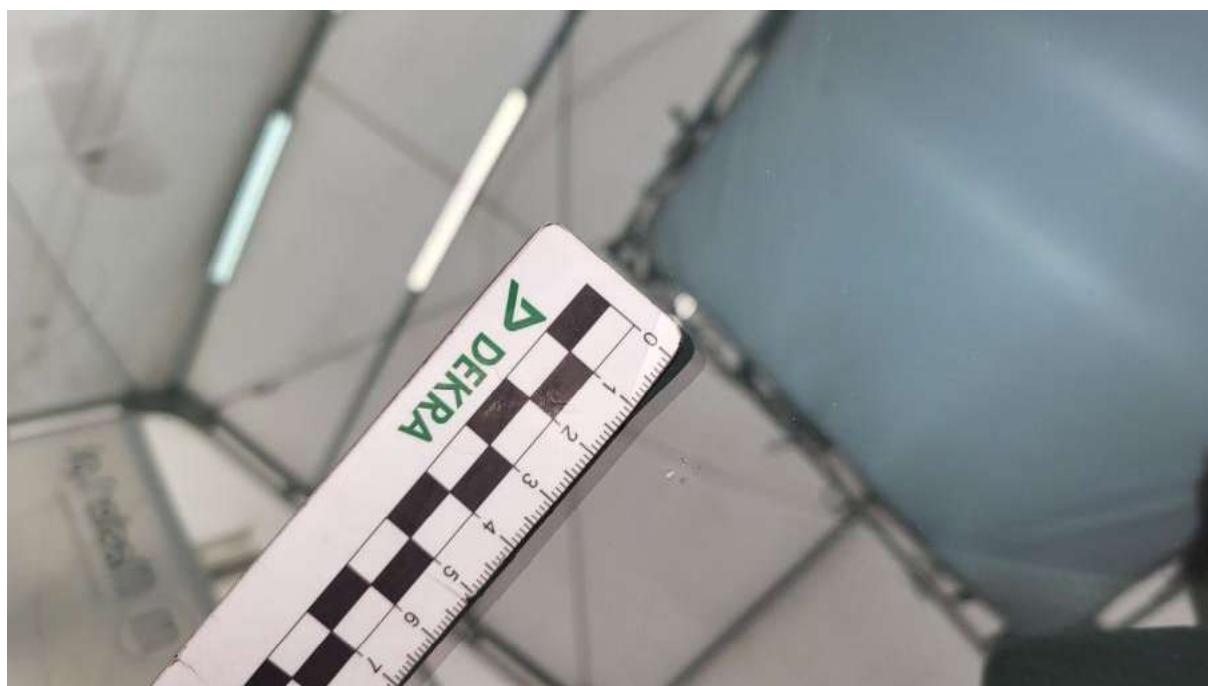
Fot. 32 Szyba czołowa - Rysa/odprysk 1