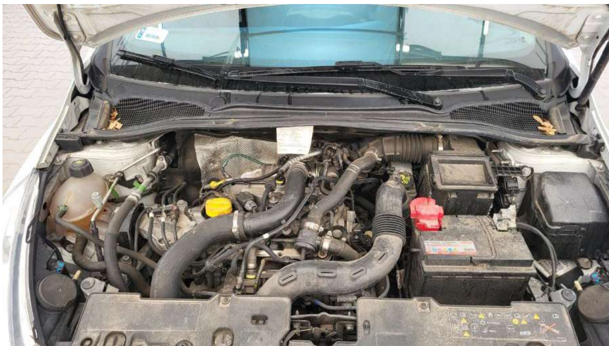
Fot. 23 Komora silnika