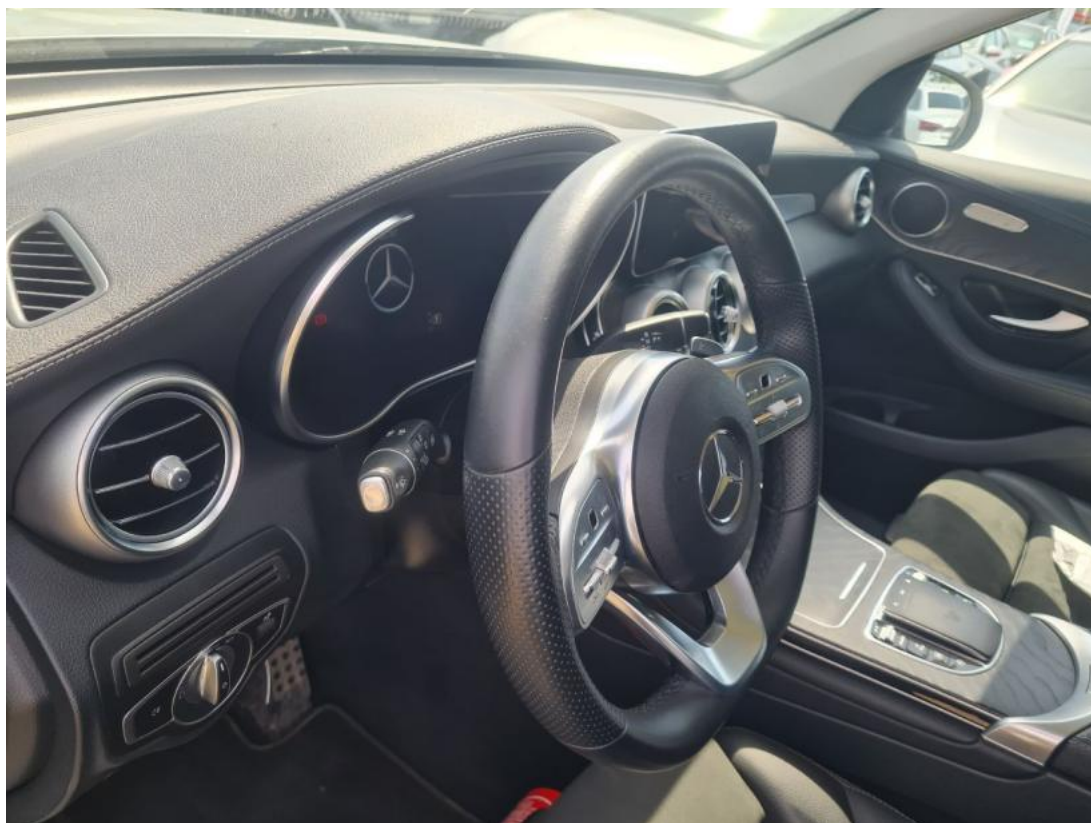
Fot. 23 Kierownica z lewej strony