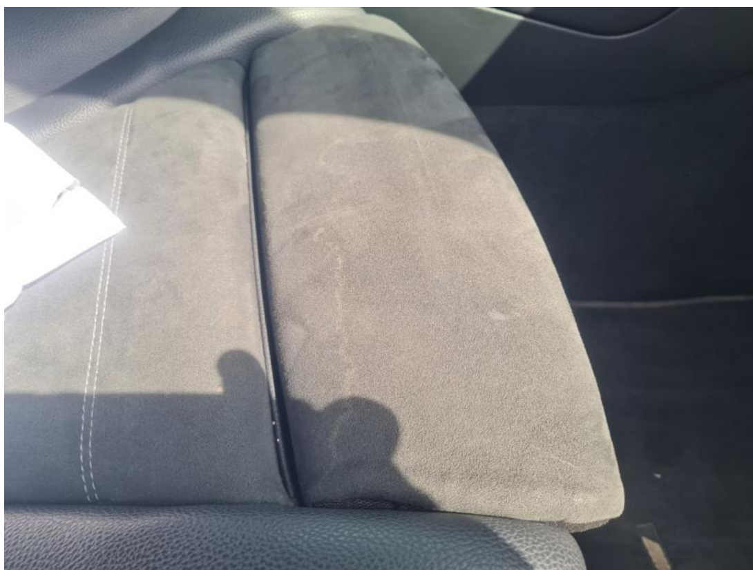
Fot. 42 Zdjęcie do protokołu