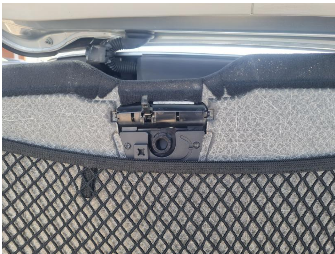
Fot. 64 Wykładzina podłogi bagażnika - Inne 1