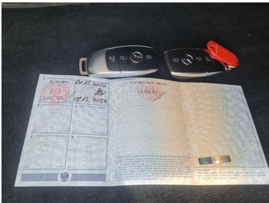
Fot. 33 Dow. Rej. Str.2 i klucze