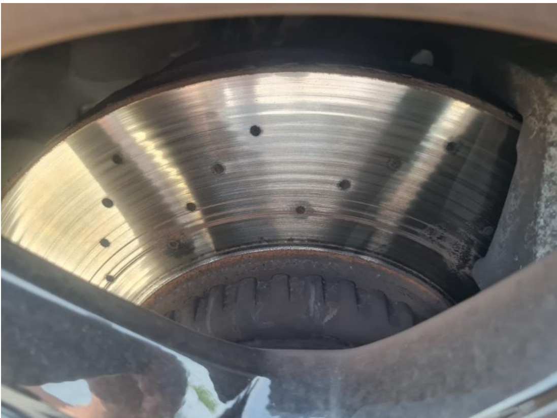
Fot. 28 Tarcza hamulcowa przednia lewa