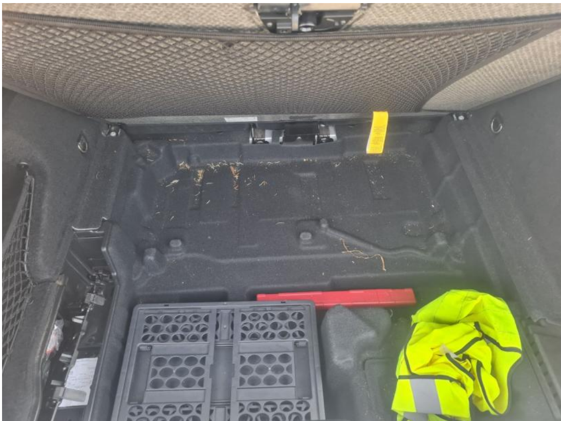
Fot. 36 Zdjęcie do protokołu