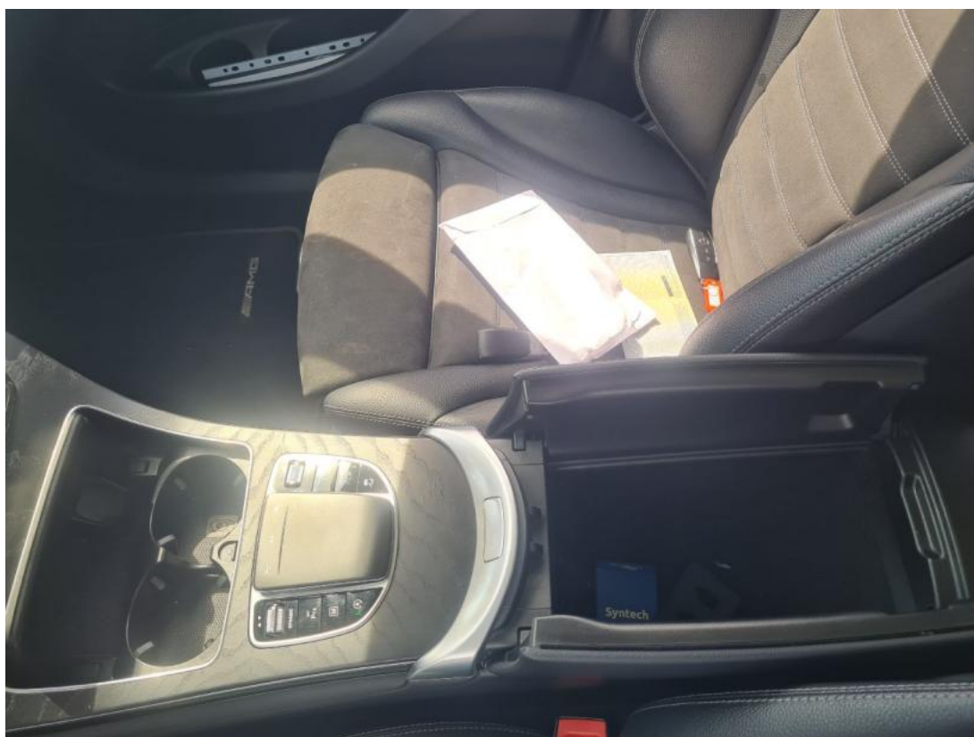
Fot. 21 Tunel środkowy