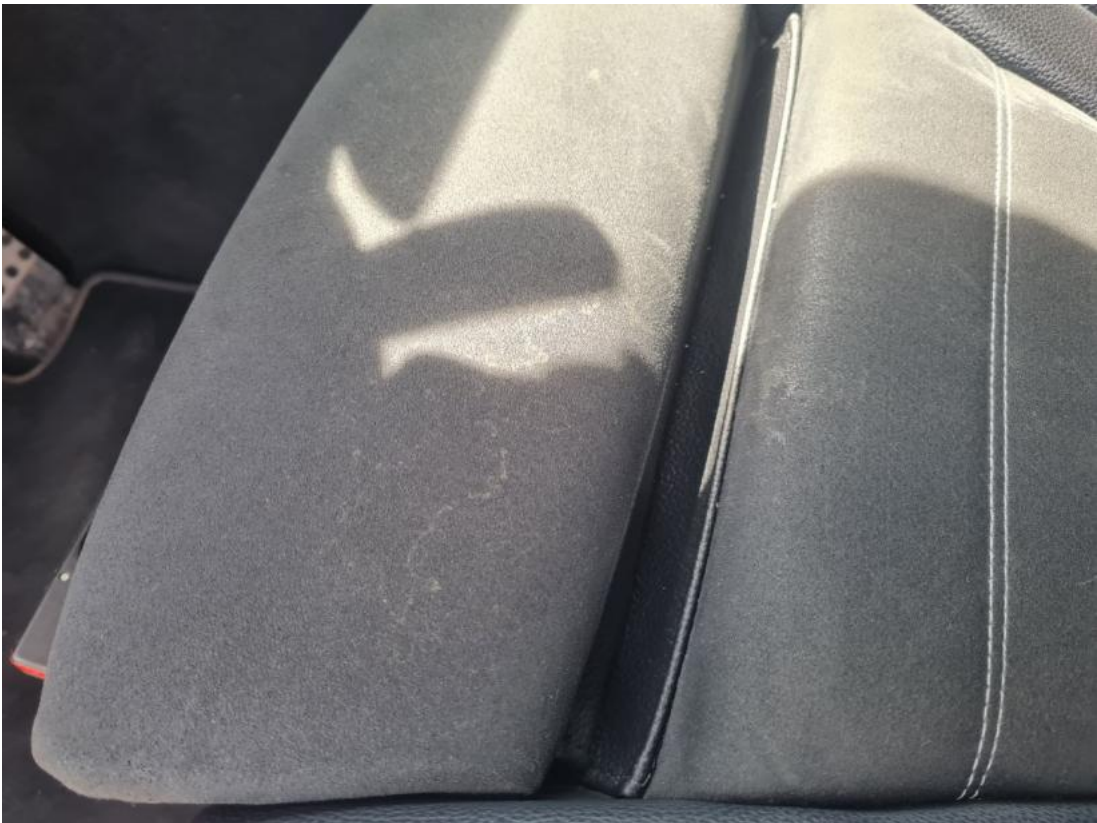
Fot. 39 Zdjęcie do protokołu