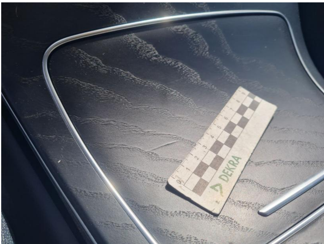
Fot. 56 Konsola tunelu śr. - Pęknięcie/rozerwanie 1