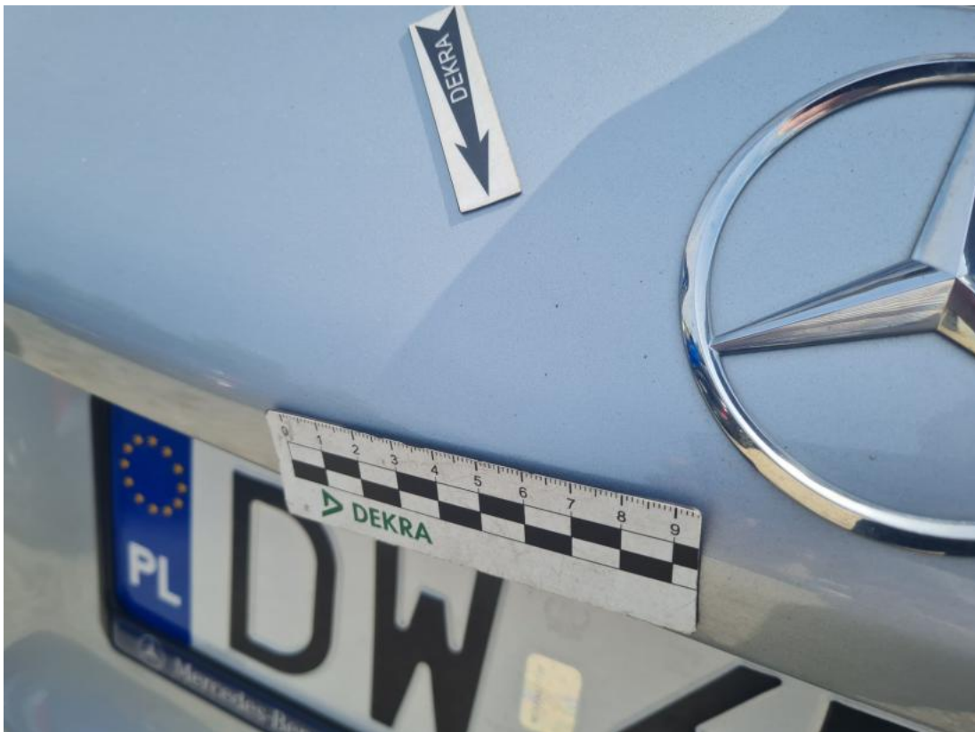
Fot. 49 Pokrywy bagażnika() - Wgniecenie/odkształcenie 3