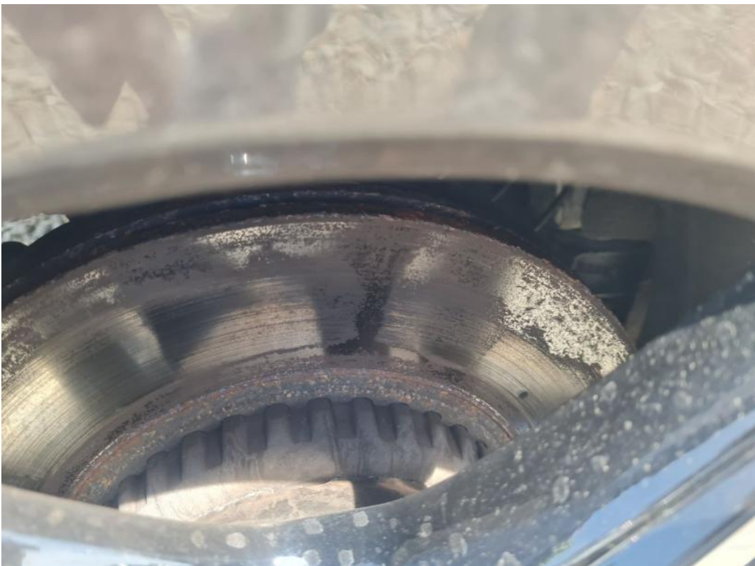
Fot. 30 Tarcza hamulcowa tylna prawa