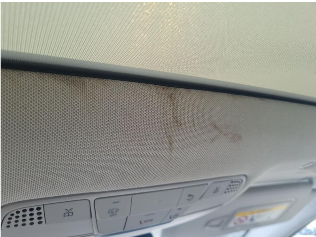
Fot. 40 Zdjęcie do protokołu