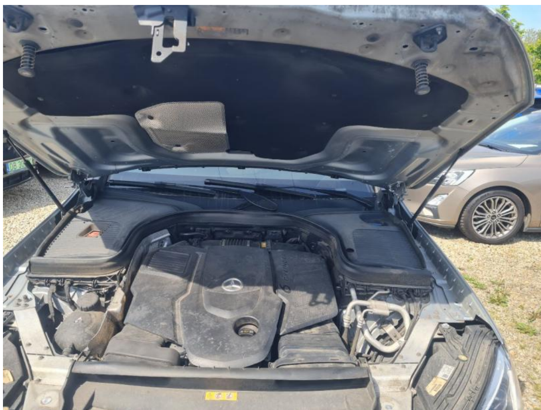
Fot. 24 Komora silnika