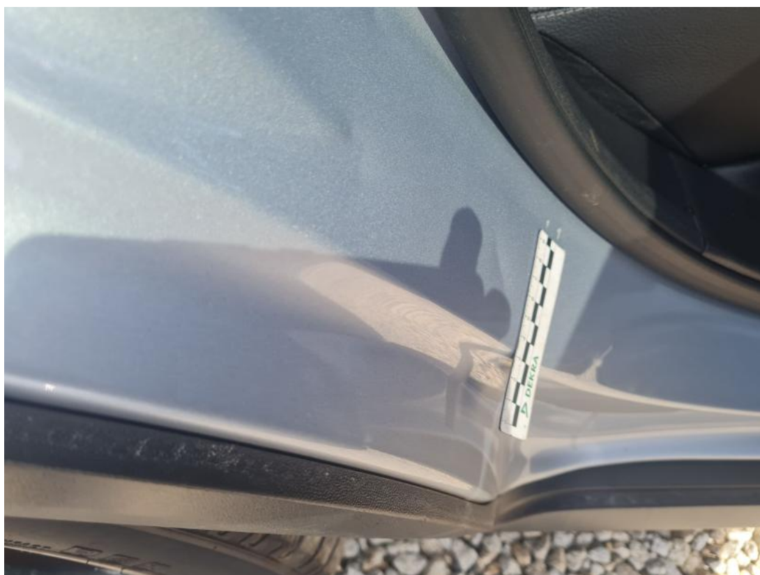
Fot. 46 Błotnik tylny P / Ściana boczna P - Wgniecenie/odkształcenie 1