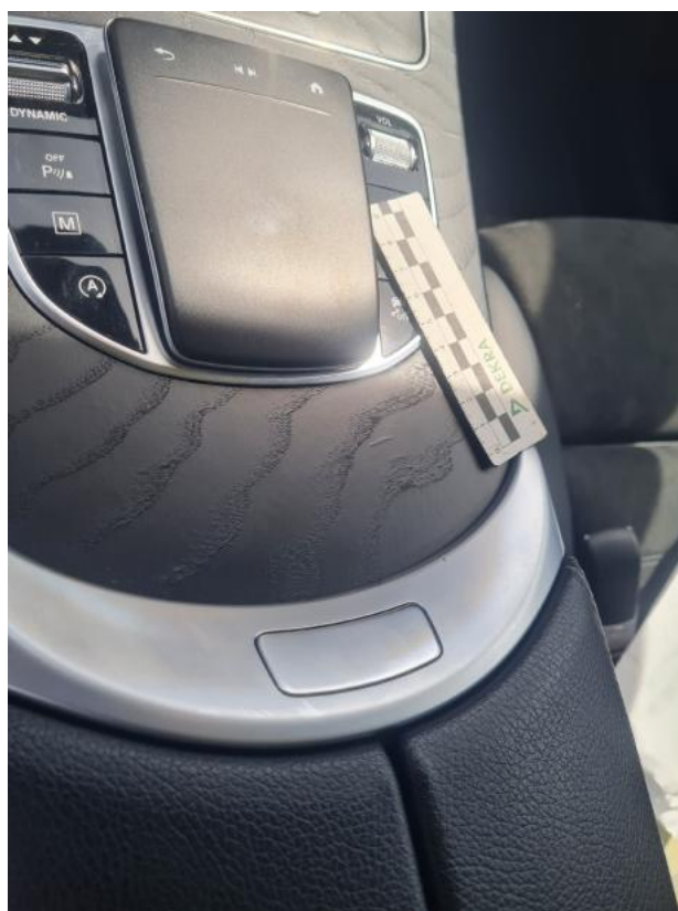
Fot. 57 Konsola tunelu śr.() - Pęknięcie/rozerwanie 3