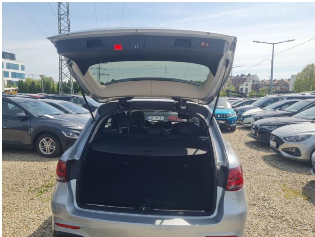
Fot. 25 Bagażnik