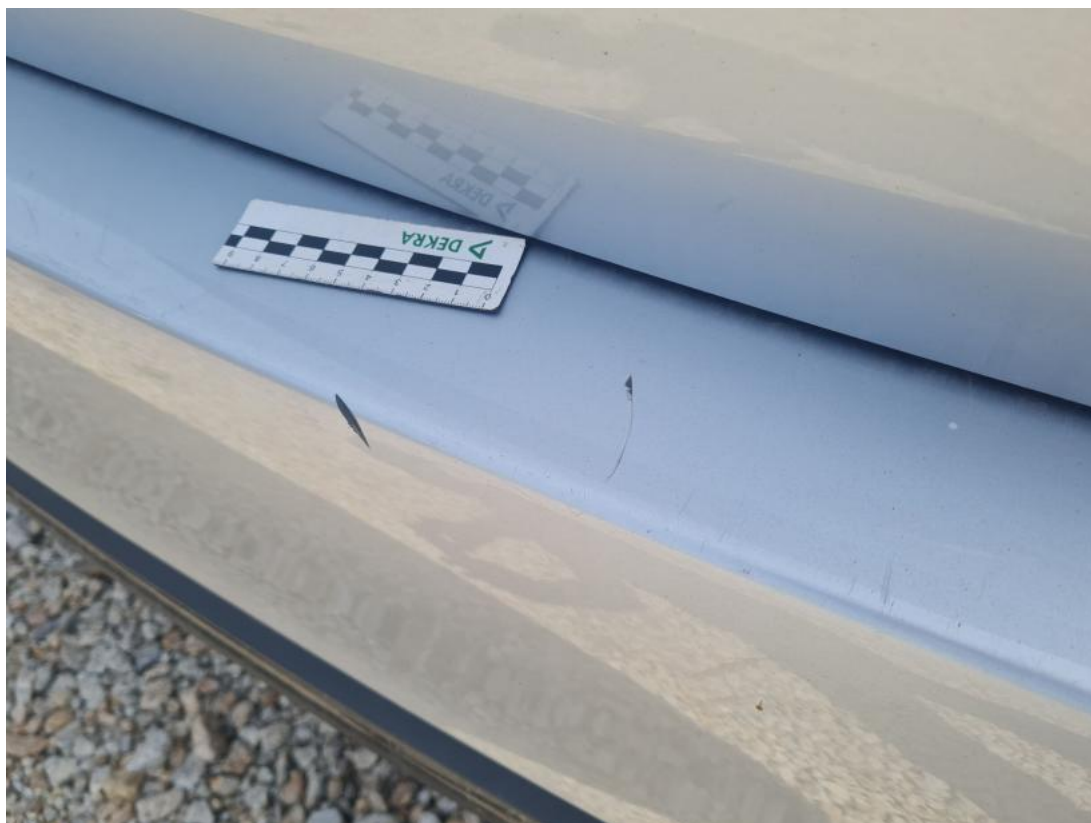
Fot. 51 Zderzak tylny - Rysa/odprysk 1