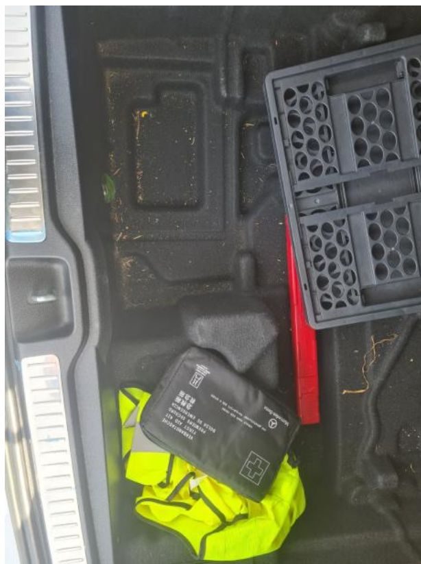
Fot. 37 Zdjęcie do protokołu