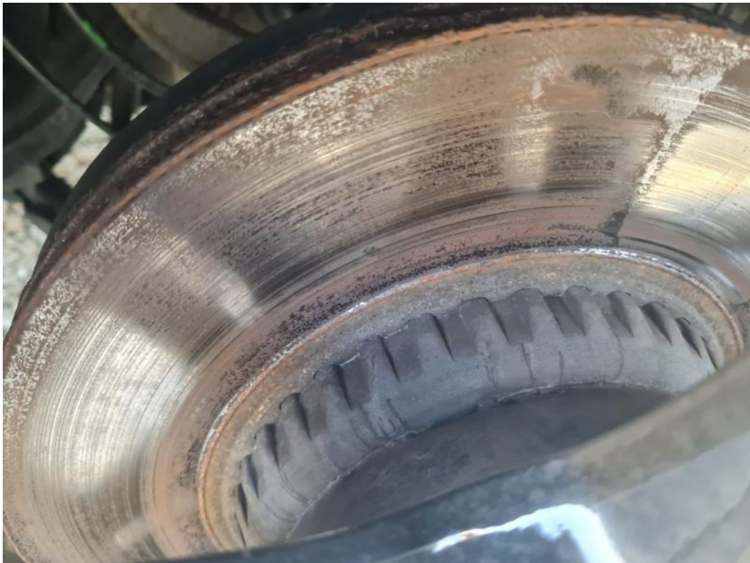
Fot. 31 Tarcza hamulcowa tylna lewa