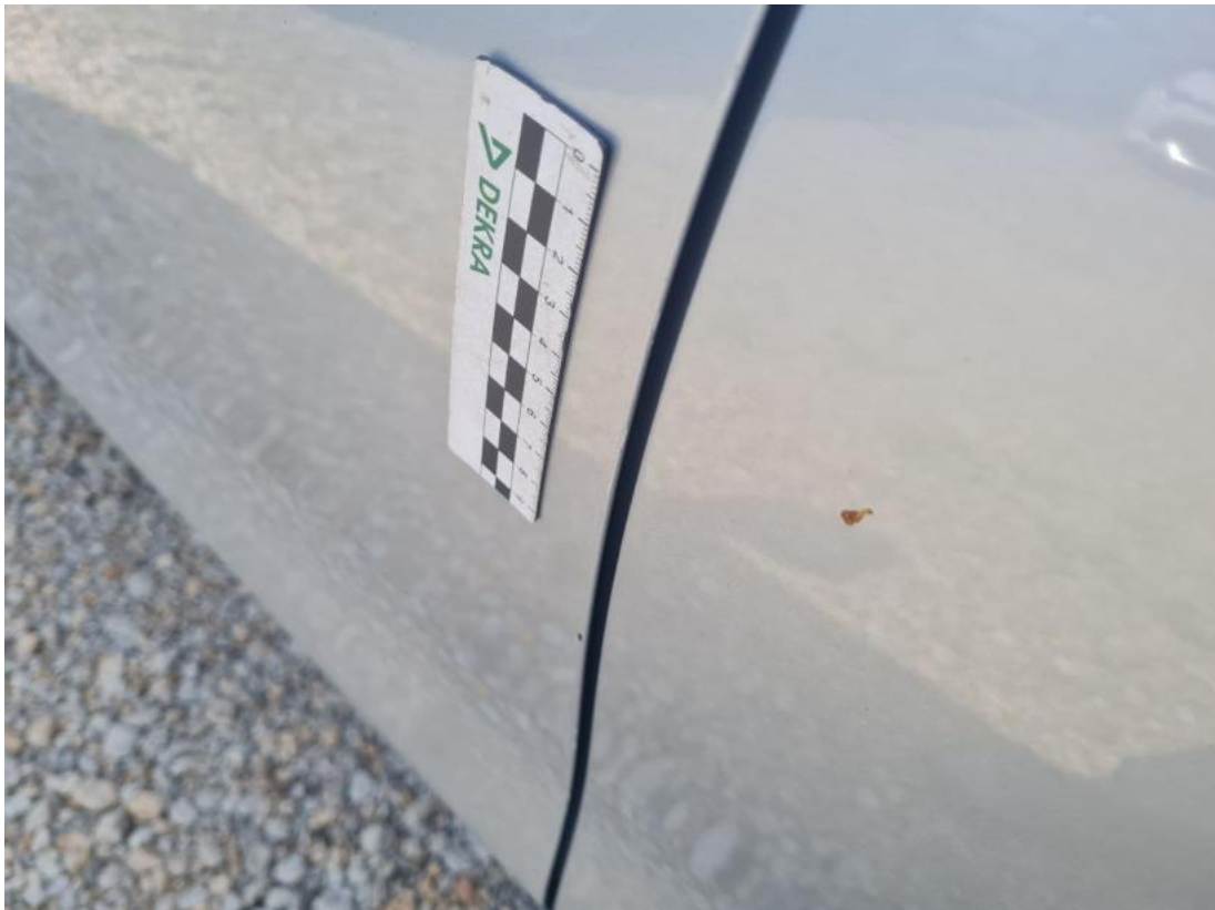
Fot. 55 Drzwi przed L - Rysa/odprysk 1