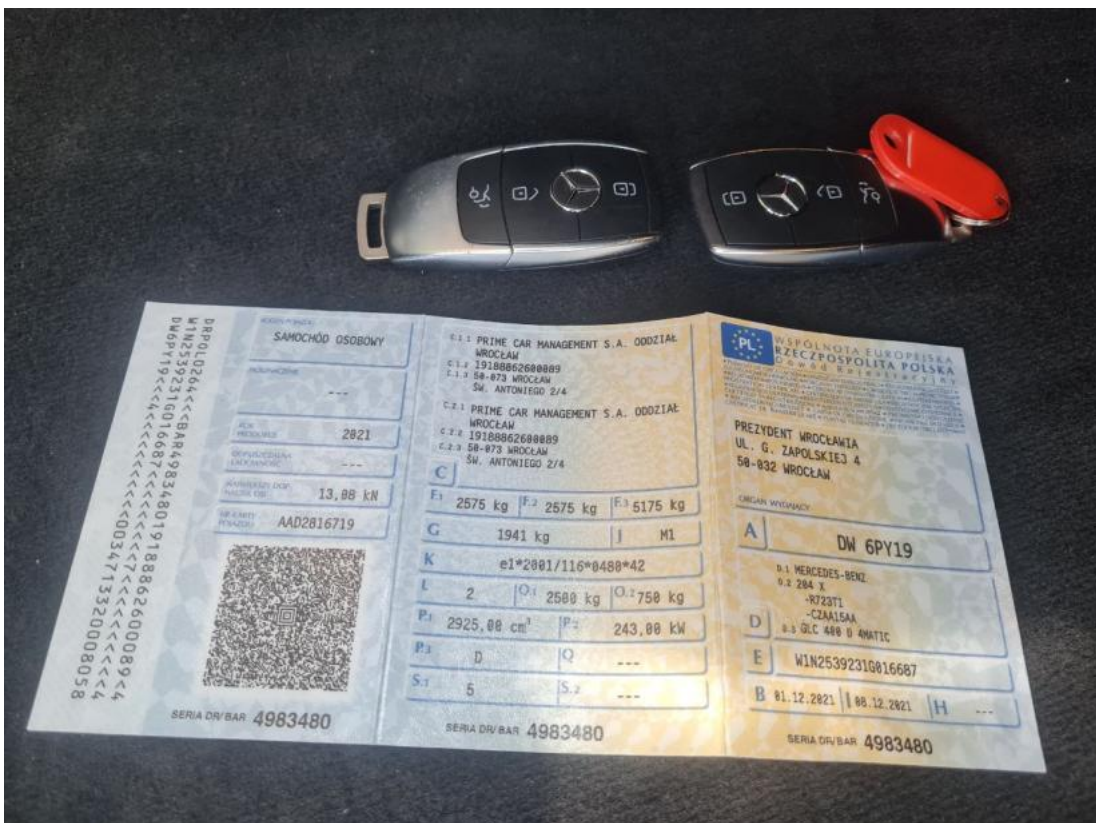
Fot. 32 Dowód rej. Str. 1