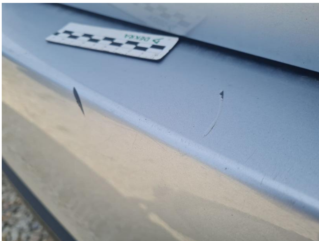
Fot. 52 Zderzak tylny - Rysa/odprysk 2