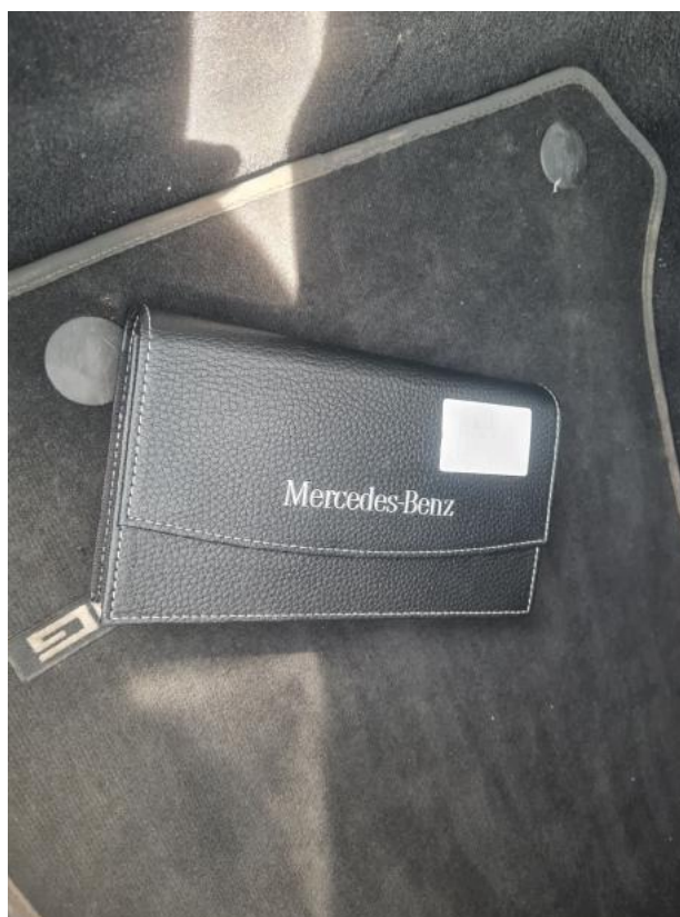
Fot. 34 Instrukcje