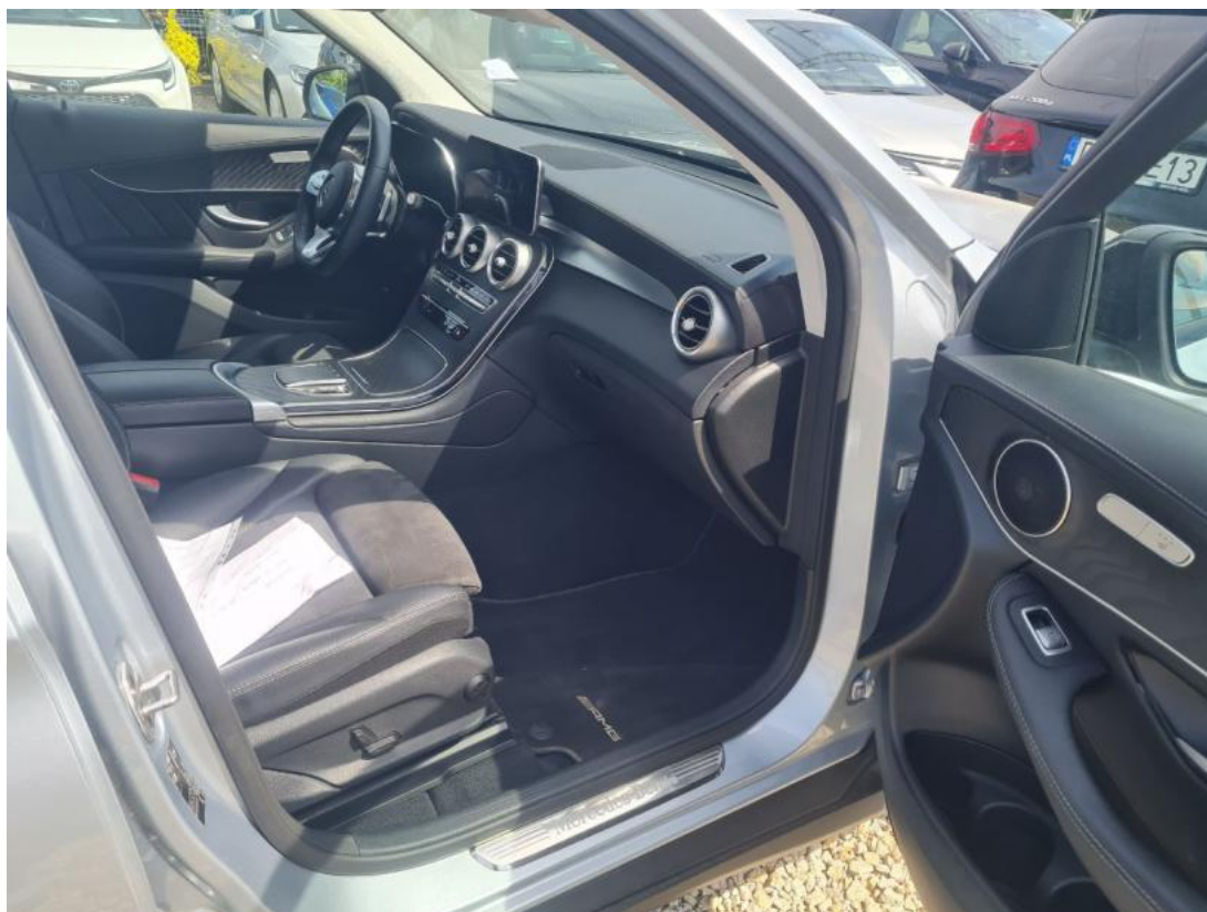
Fot. 41 Zdjęcie do protokołu