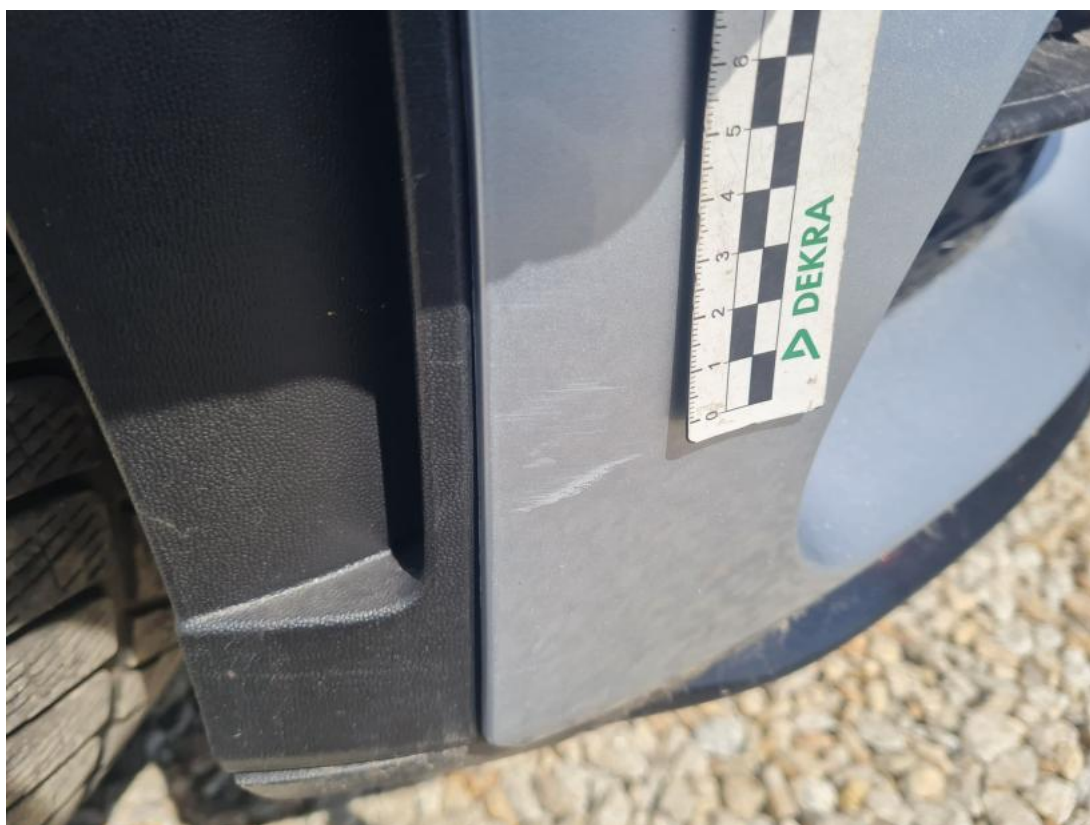
Fot. 45 Zderzak - Rysa/odprysk 1