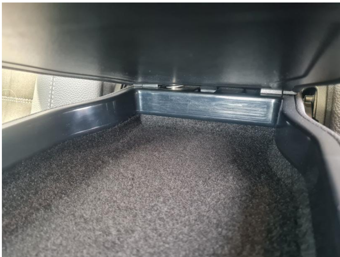
Fot. 63 Kanapa tyl. - Inne 1