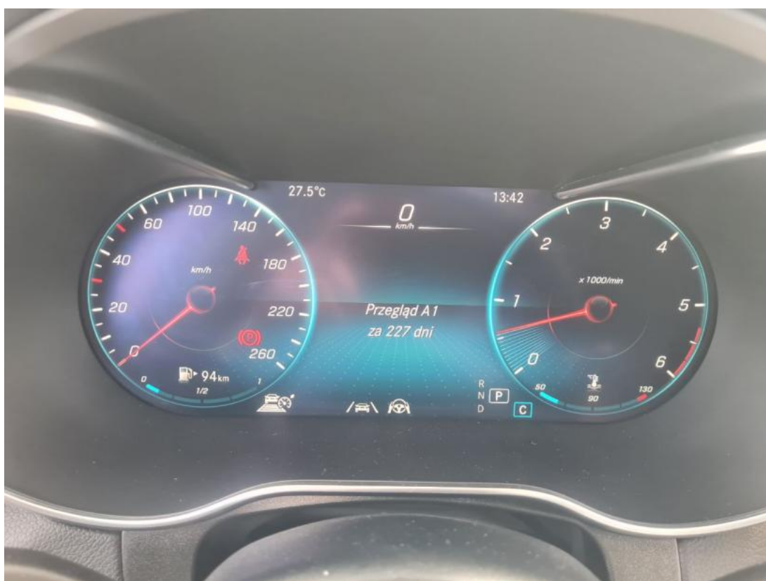
Fot. 16 Zestaw wskaźników - serwis