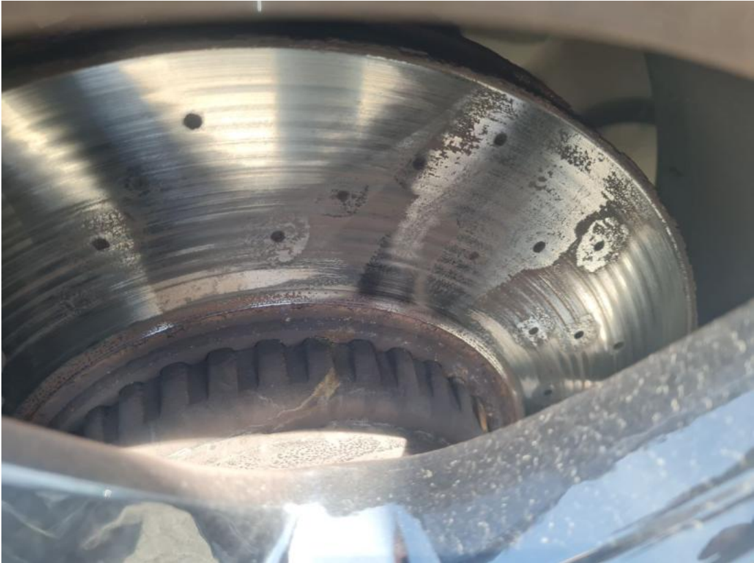
Fot. 29 Tarcza hamulcowa przednia prawa