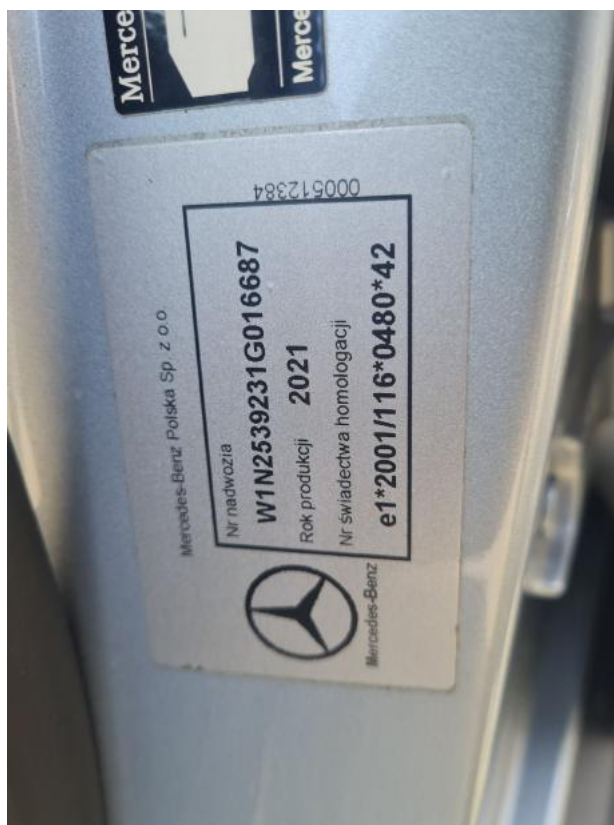
Fot. 38 Zdjęcie do protokołu