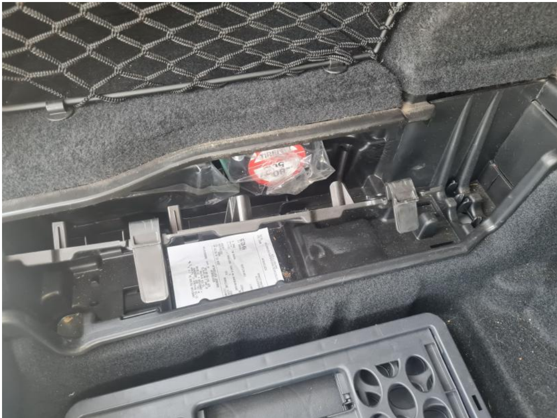
Fot. 35 Zestaw naprawczy koła