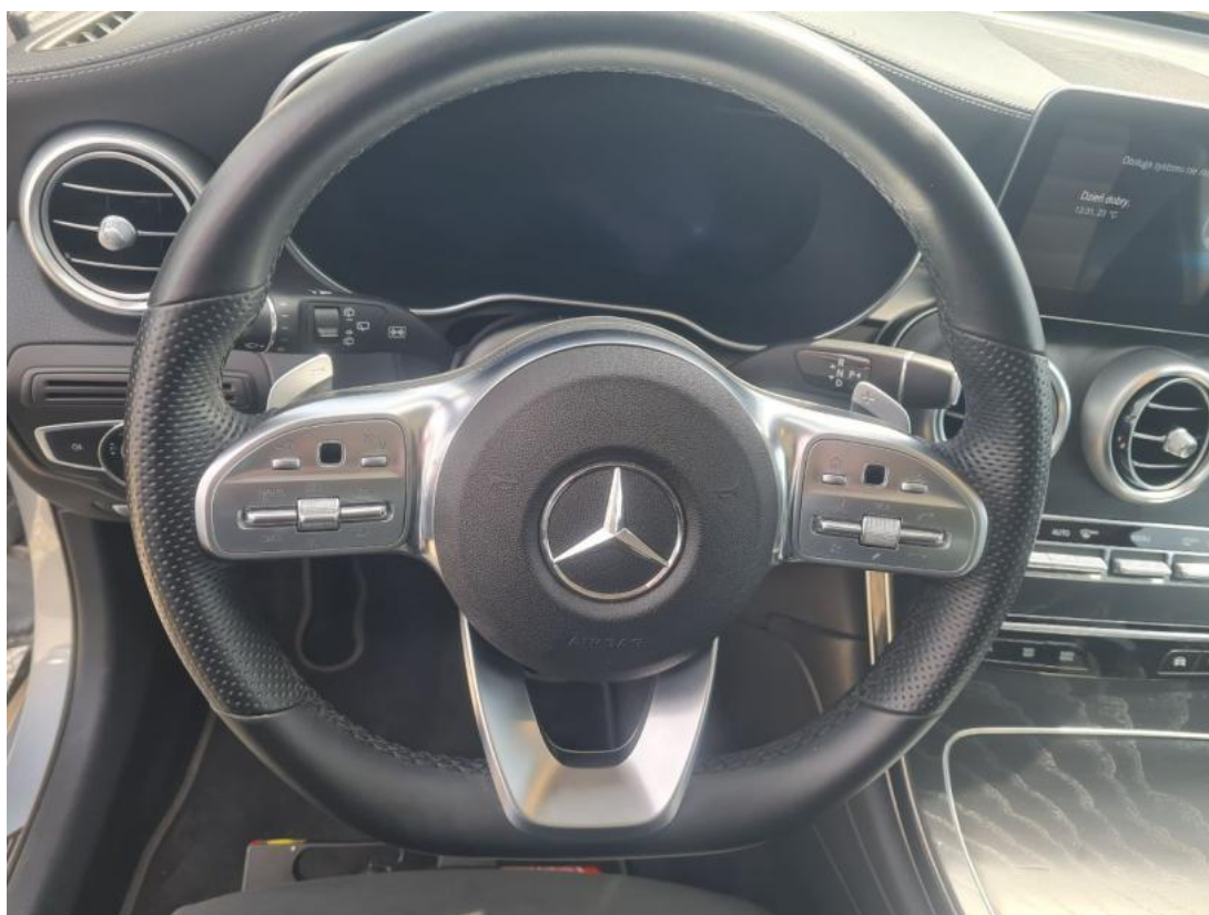
Fot. 22 Kierownica (na wprost)