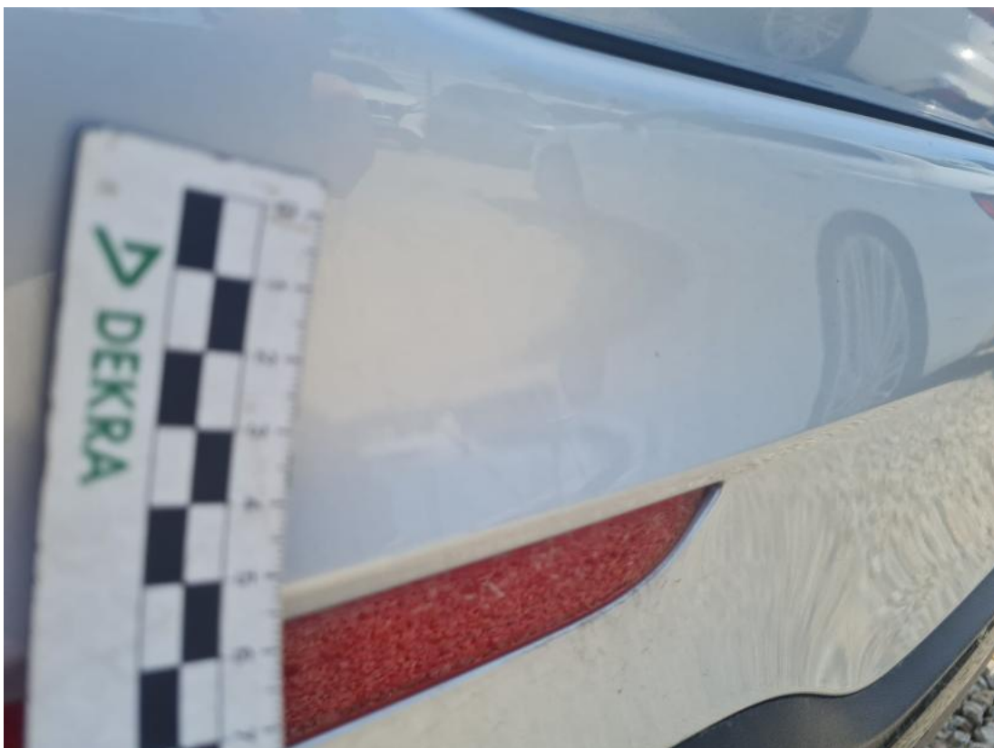
Fot. 50 Zderzak tylny - zdjęcie poglądowe 2