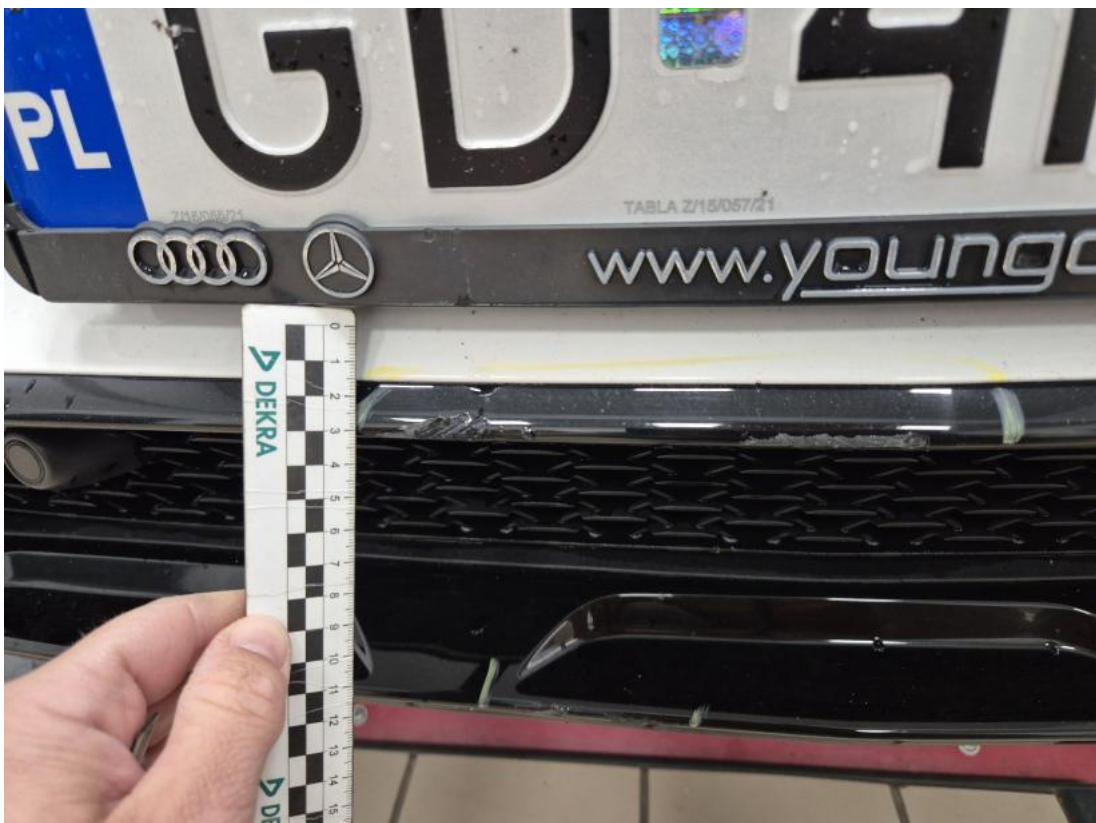
Fot. 38 Zderzak przedni cz dolna - Rysa/odprysk 1