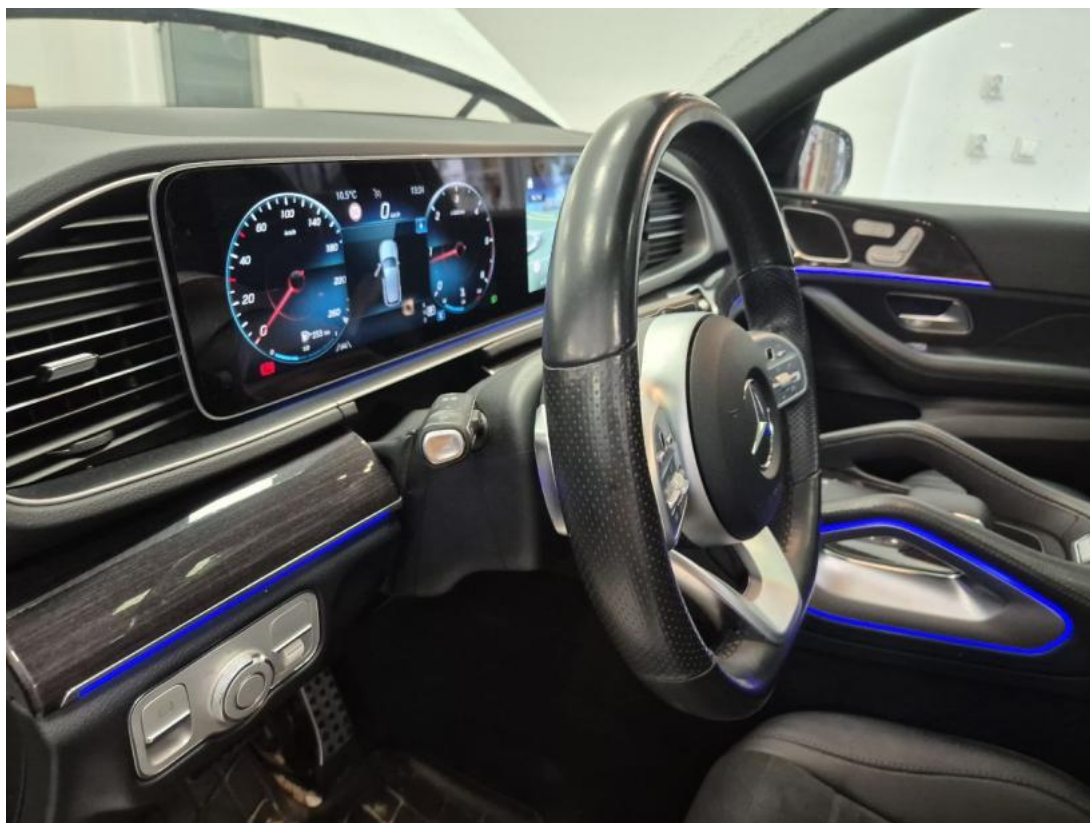
Fot. 23 Kierownica z lewej strony