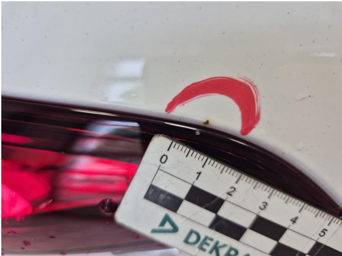
Fot. 41 Pokrywy bagażnika - Inne 1