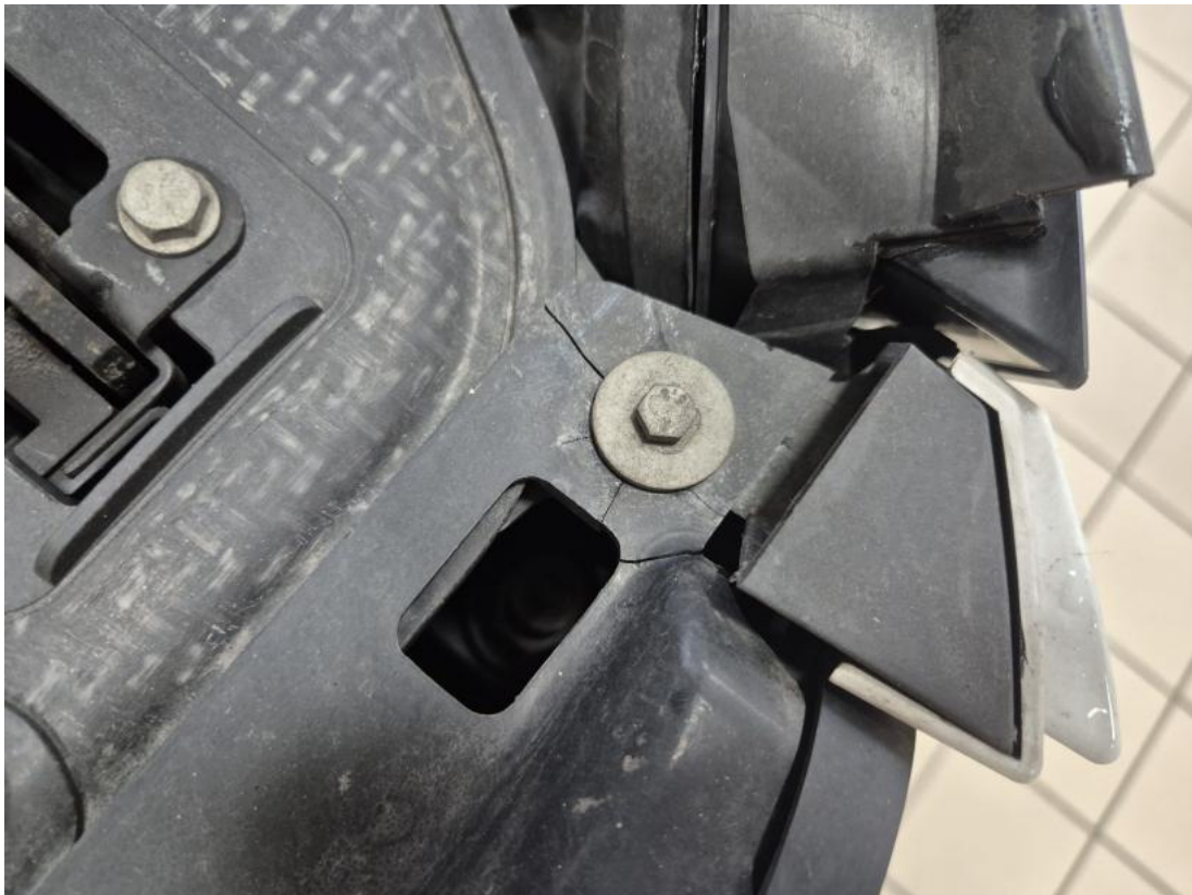
Fot. 33 Wzmocnienie czołowe - Pęknięcie/rozerwanie 1