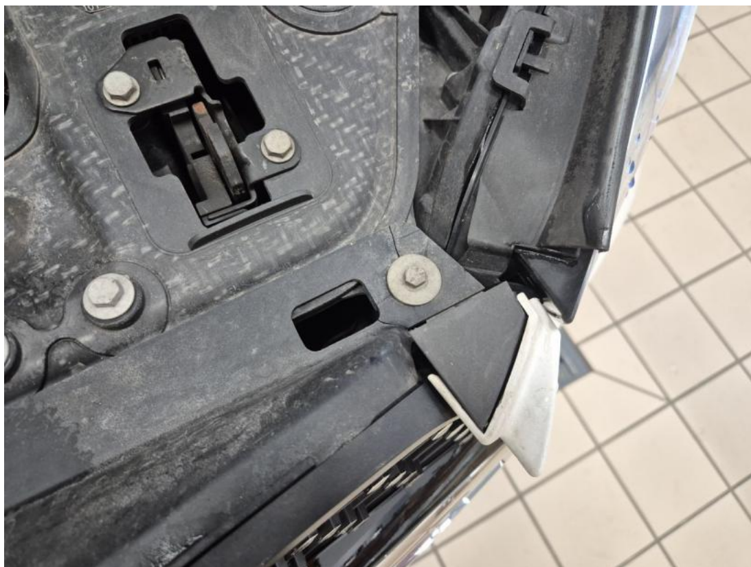
Fot. 32 Wzmocnienie czołowe - zdjęcie pogładowe 1