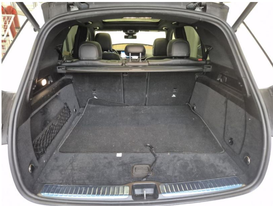
Fot. 25 Bagażnik