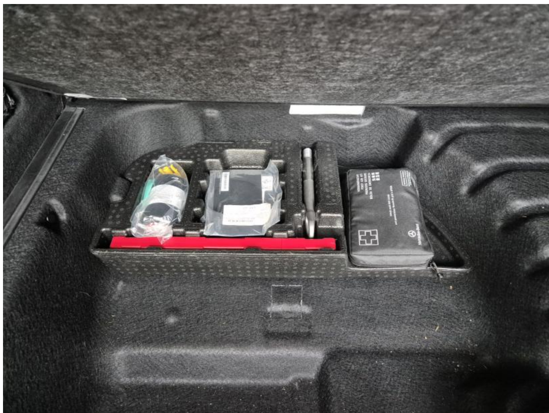
Fot. 31 Zestaw naprawy koła