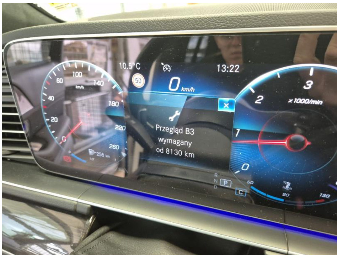
Fot. 16 Zestaw wskaźników - serwis