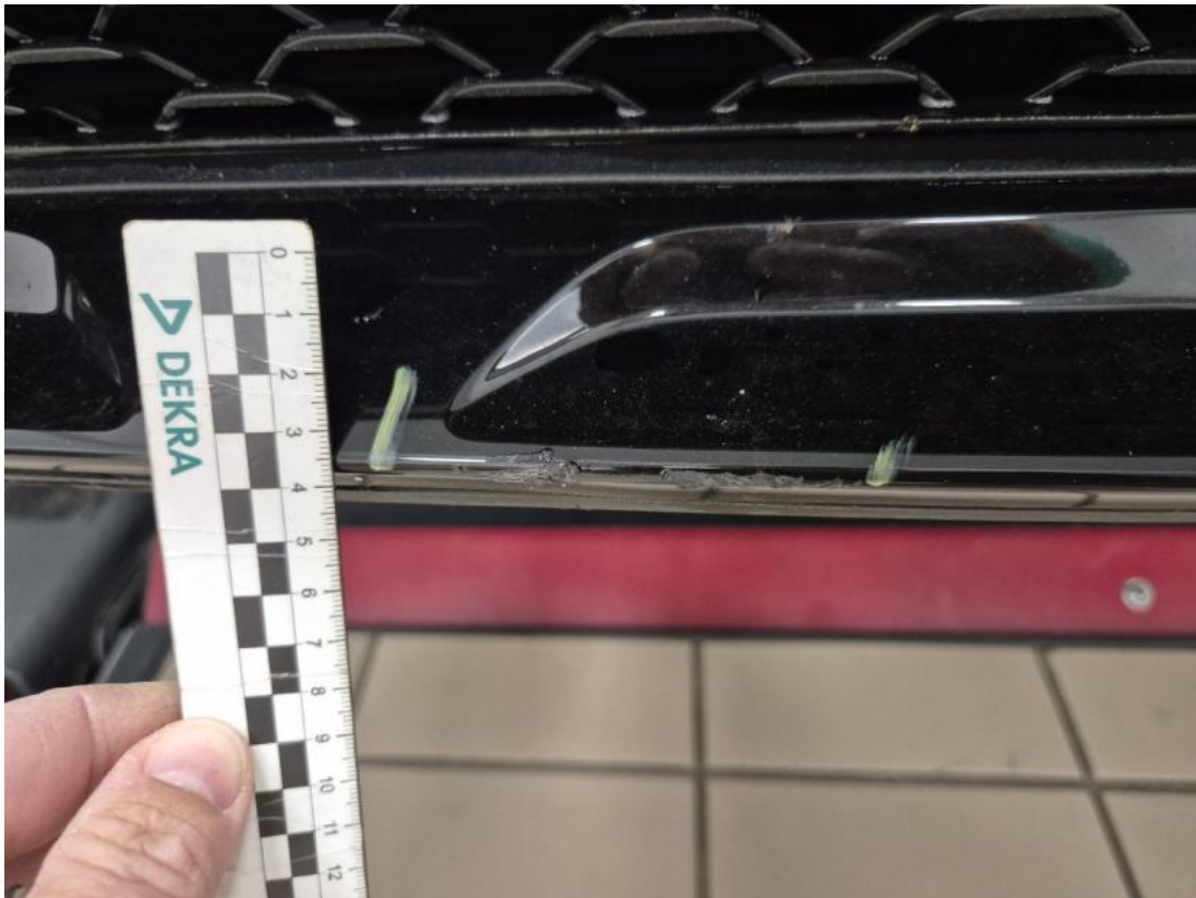
Fot. 39 Zderzak przedni cz dolna - Rysa/odprysk 2