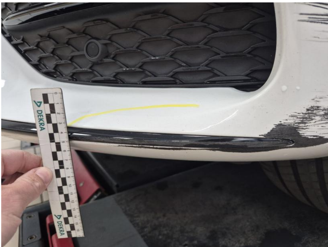
Fot. 34 Zderzak - zdjęcie poglądowe 2