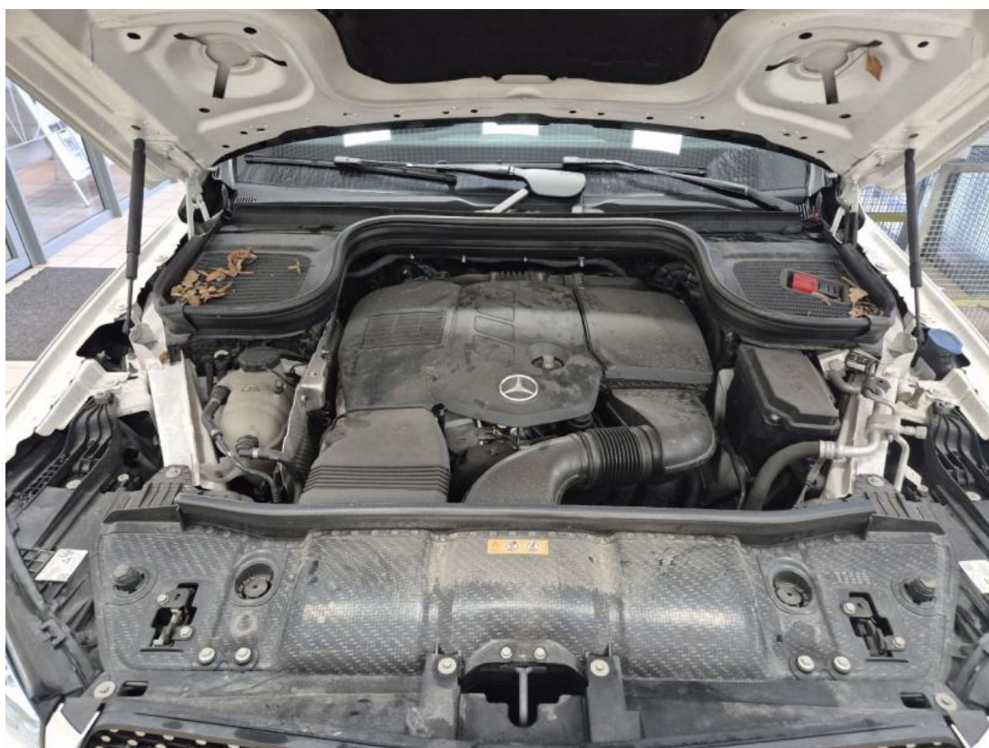
Fot. 24 Komora silnika