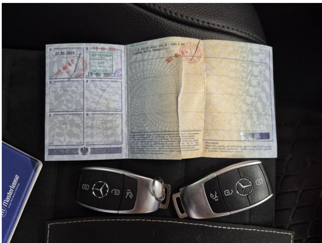
Fot. 29 Dow. Rej. Str.2 i klucze