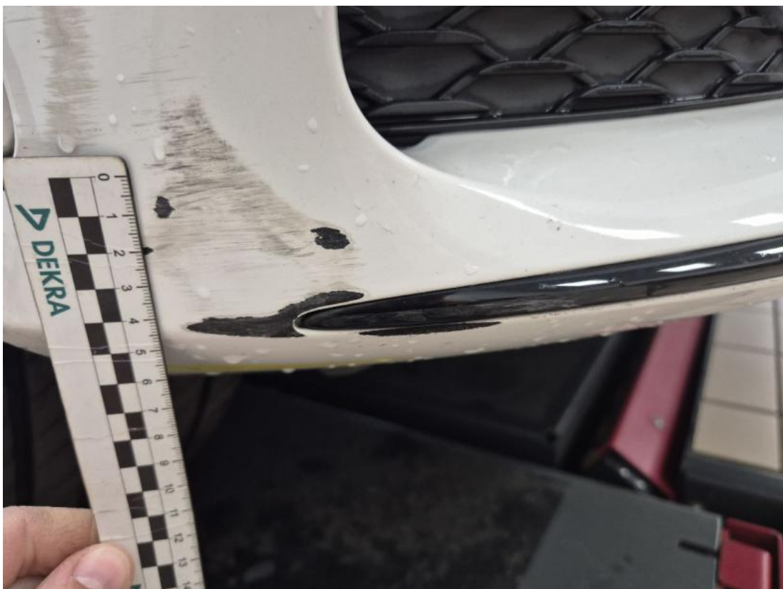
Fot. 36 Zderzak - Rysa/odprysk 2