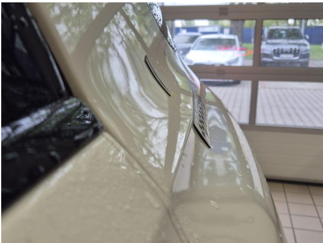
Fot. 42 Błotnik tylny L / Ściana boczna L - Wgniecenie/odkształcenie 1