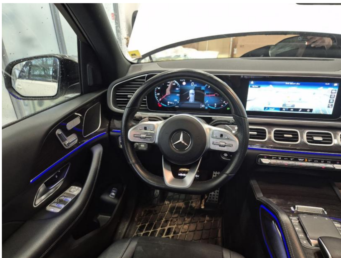
Fot. 22 Kierownica (na wprost)