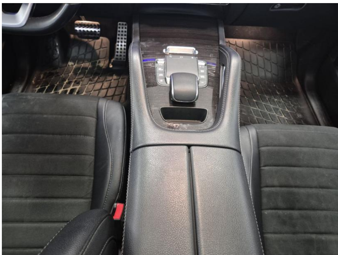
Fot. 21 Tunel środkowy