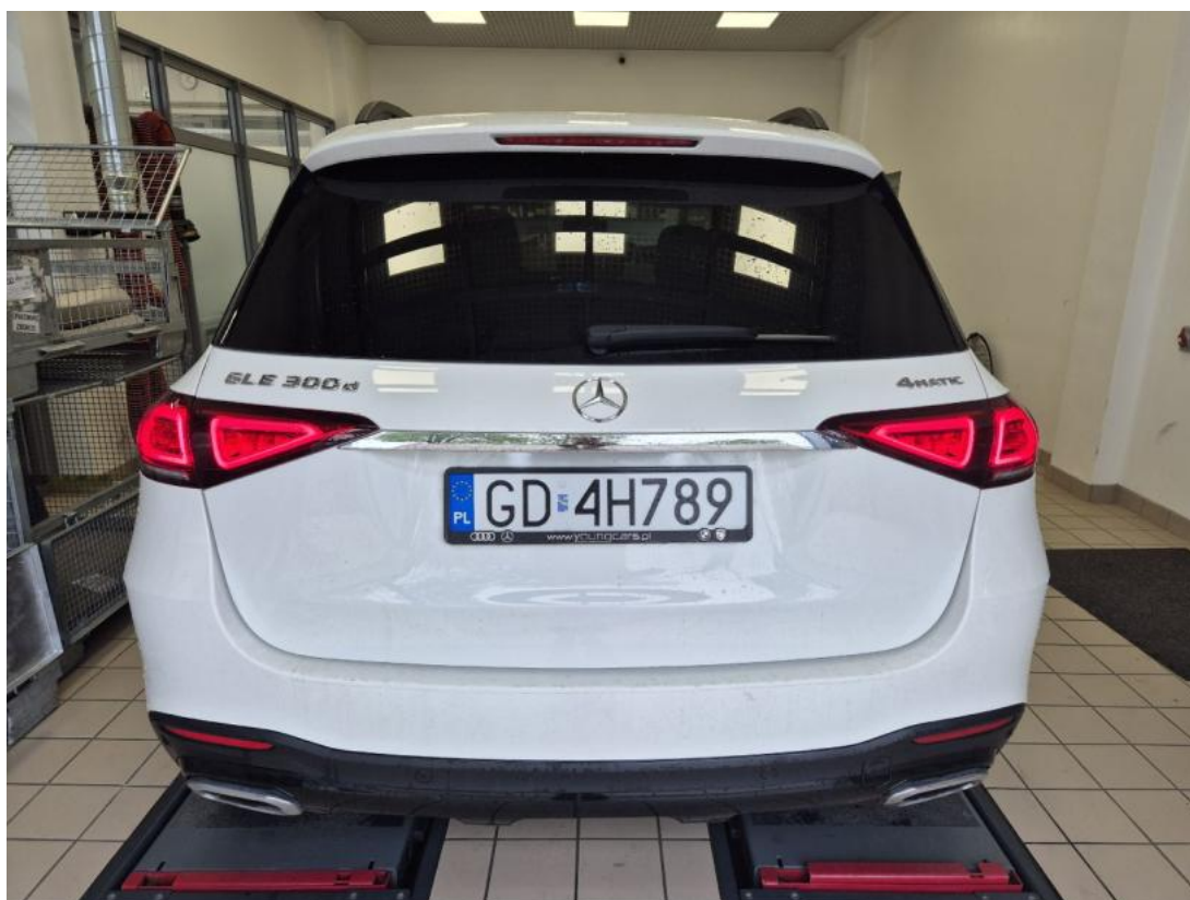
Fot. 8 Tyt