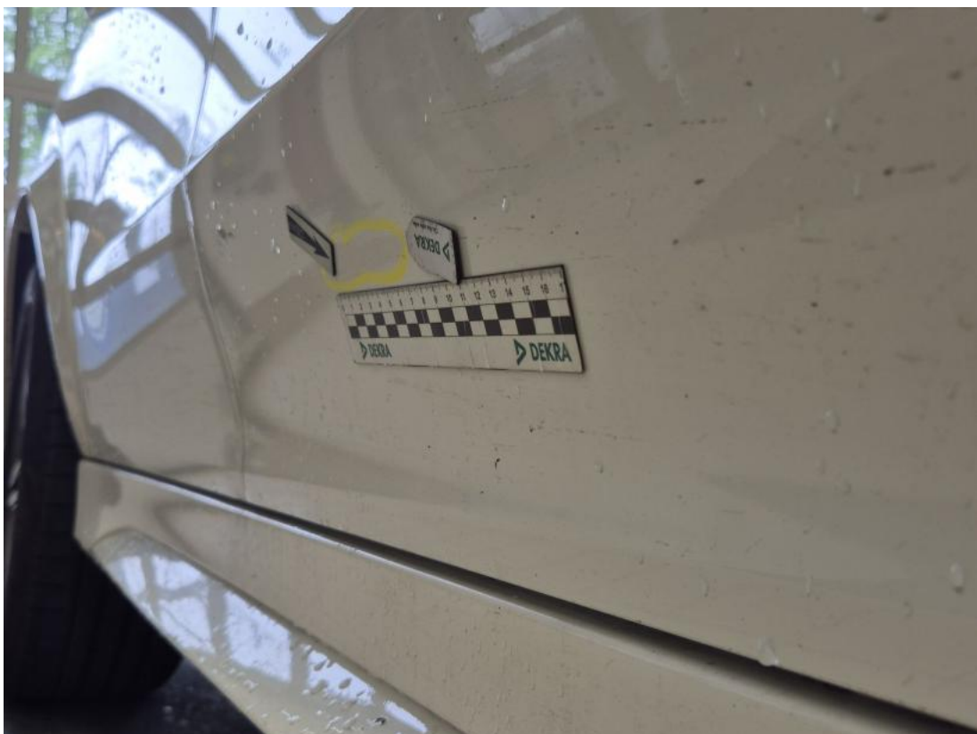
Fot. 40 Drzwi przednie P - Wgniecenie/odkształcenie 1