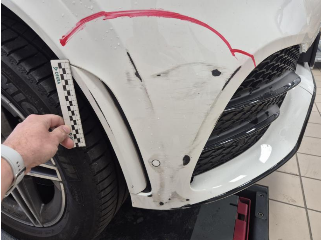
Fot. 35 Zderzak - Rysa/odprysk 1