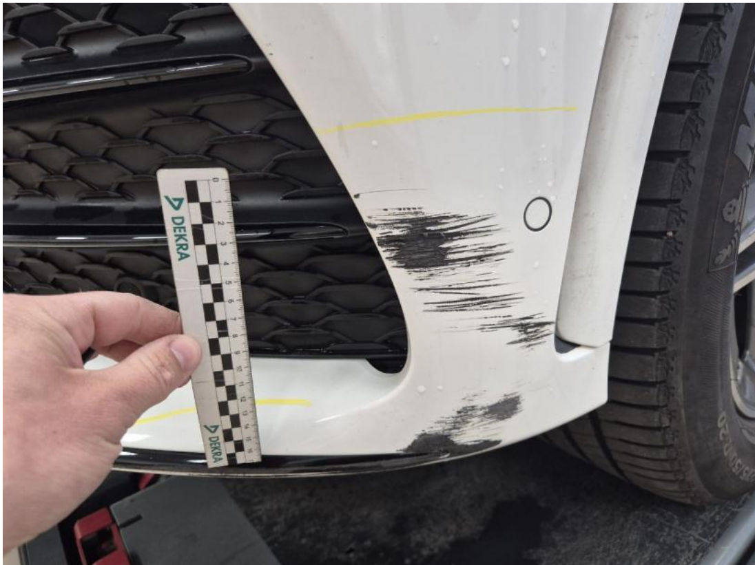
Fot. 37 Zderzak() - Rysa/odprysk 3