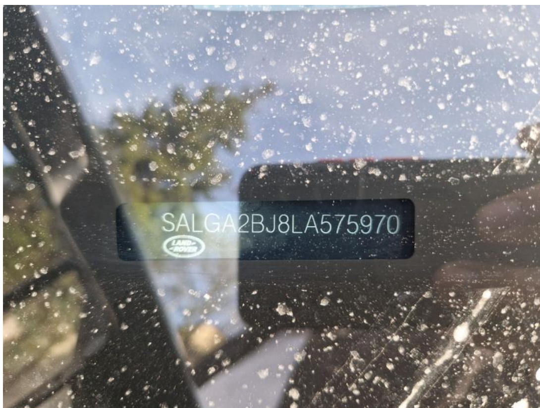
Fot. 34 Zdjęcie do protokołu