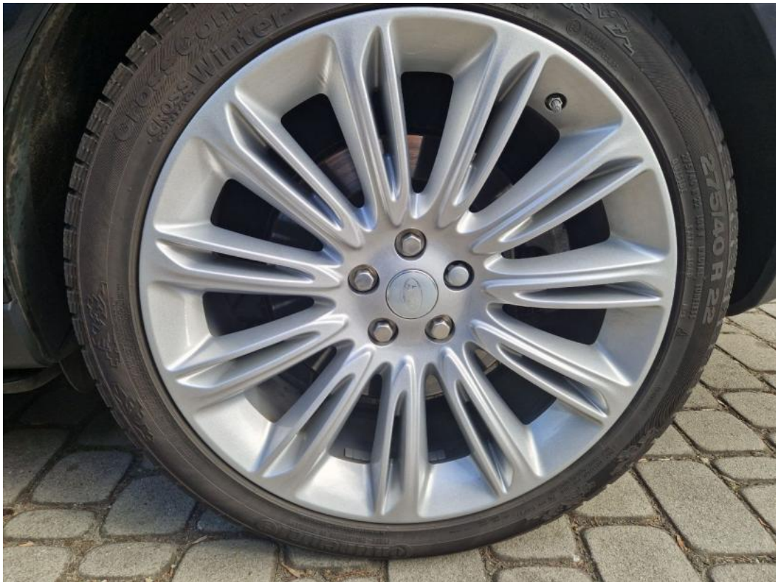
Fot. 31 Tarcza hamulcowa tylna lewa