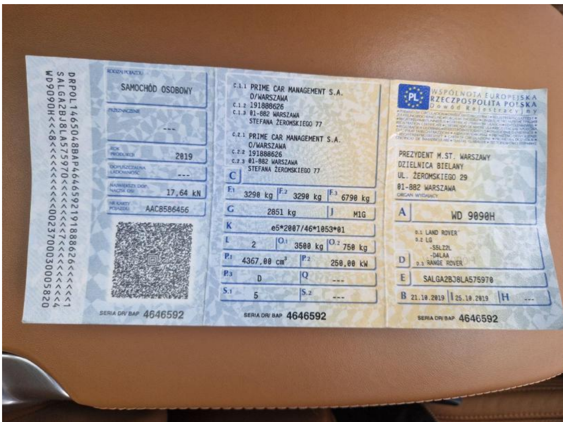
Fot. 32 Dowód rej. Str. 1