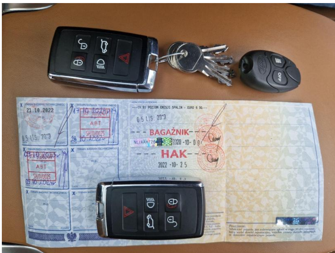
Fot. 33 Dow. Rej. Str.2 i klucze