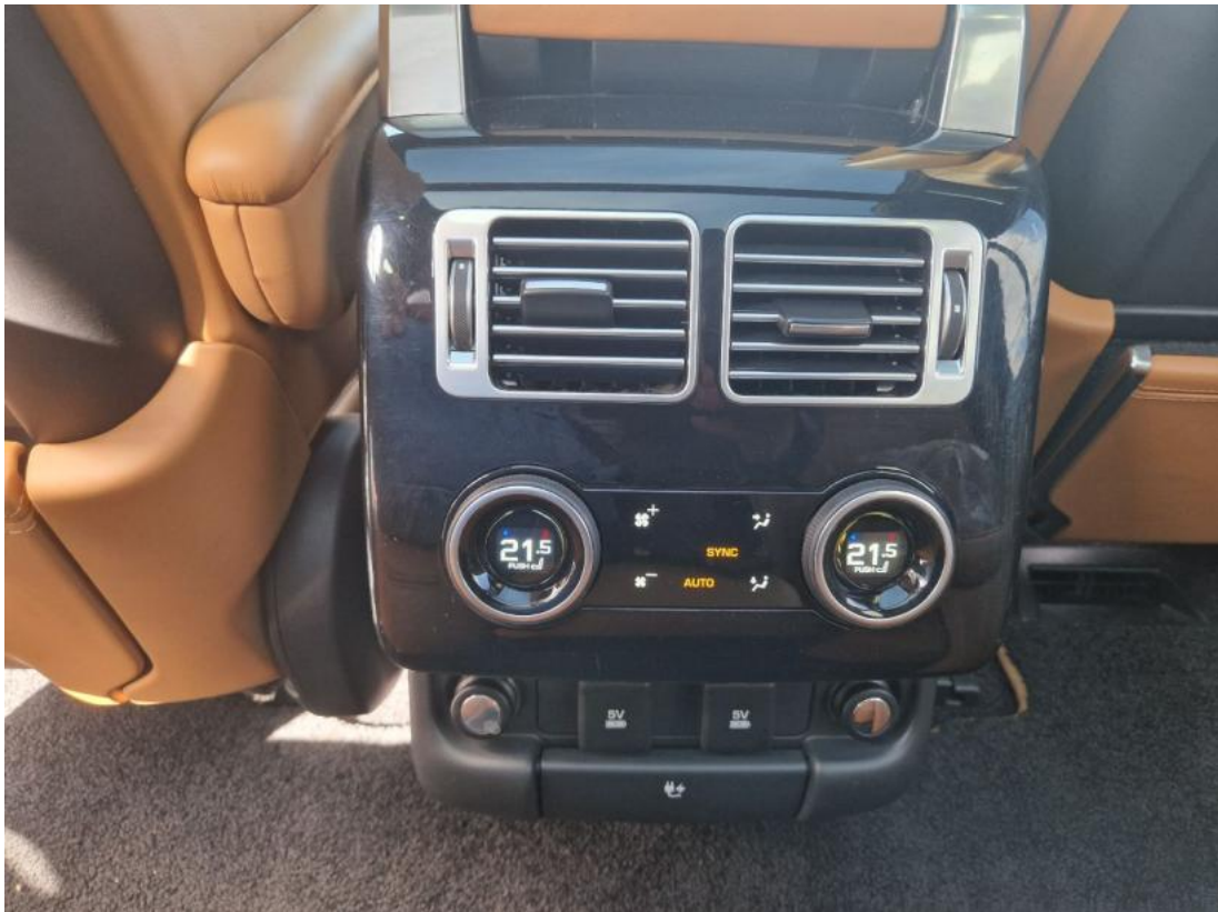
Fot. 37 Zdjęcie do protokołu