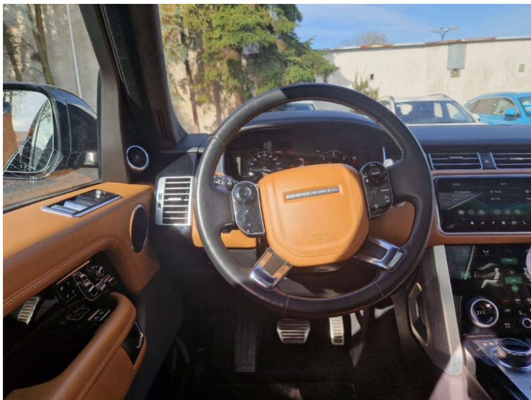
Fot. 21 Kierownica (na wprost)