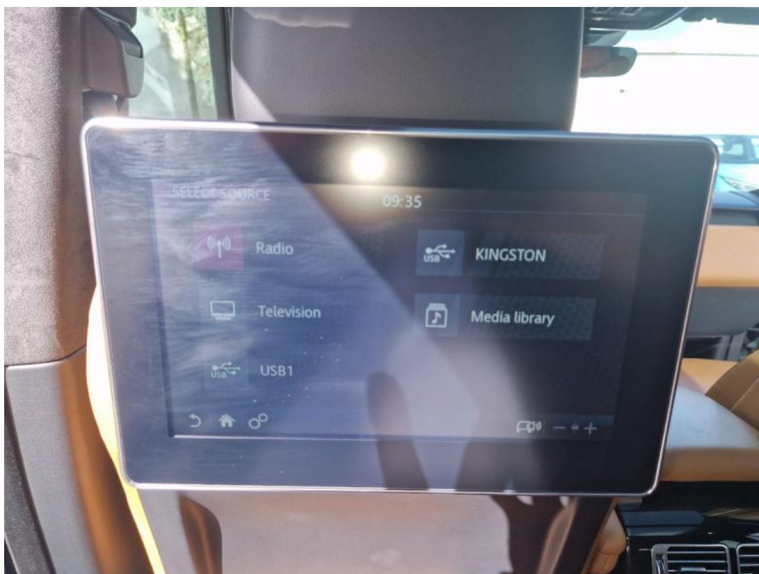
Fot. 35 Zdjęcie do protokołu