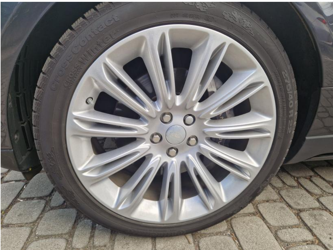
Fot. 28 Tarcza hamulcowa przednia lewa