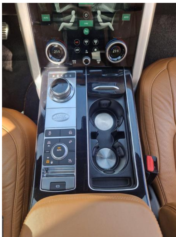
Fot. 20 Tuneł środkowy