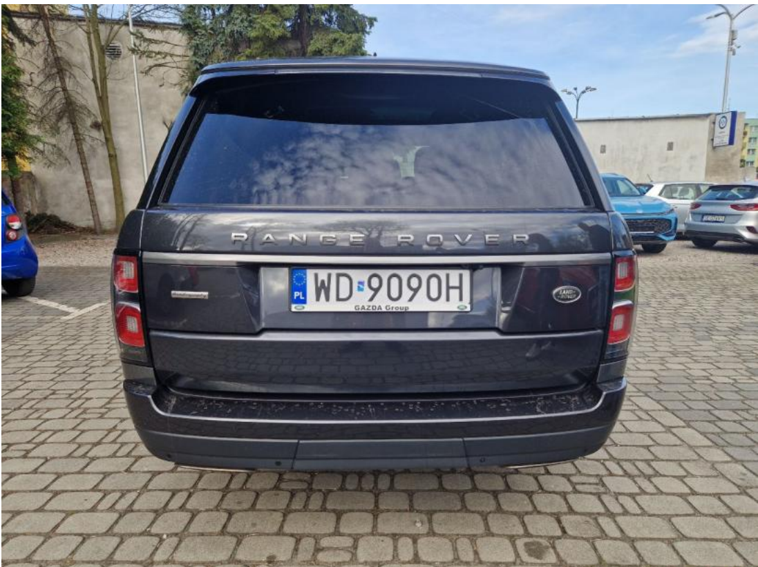
Fot. 8 Tyt