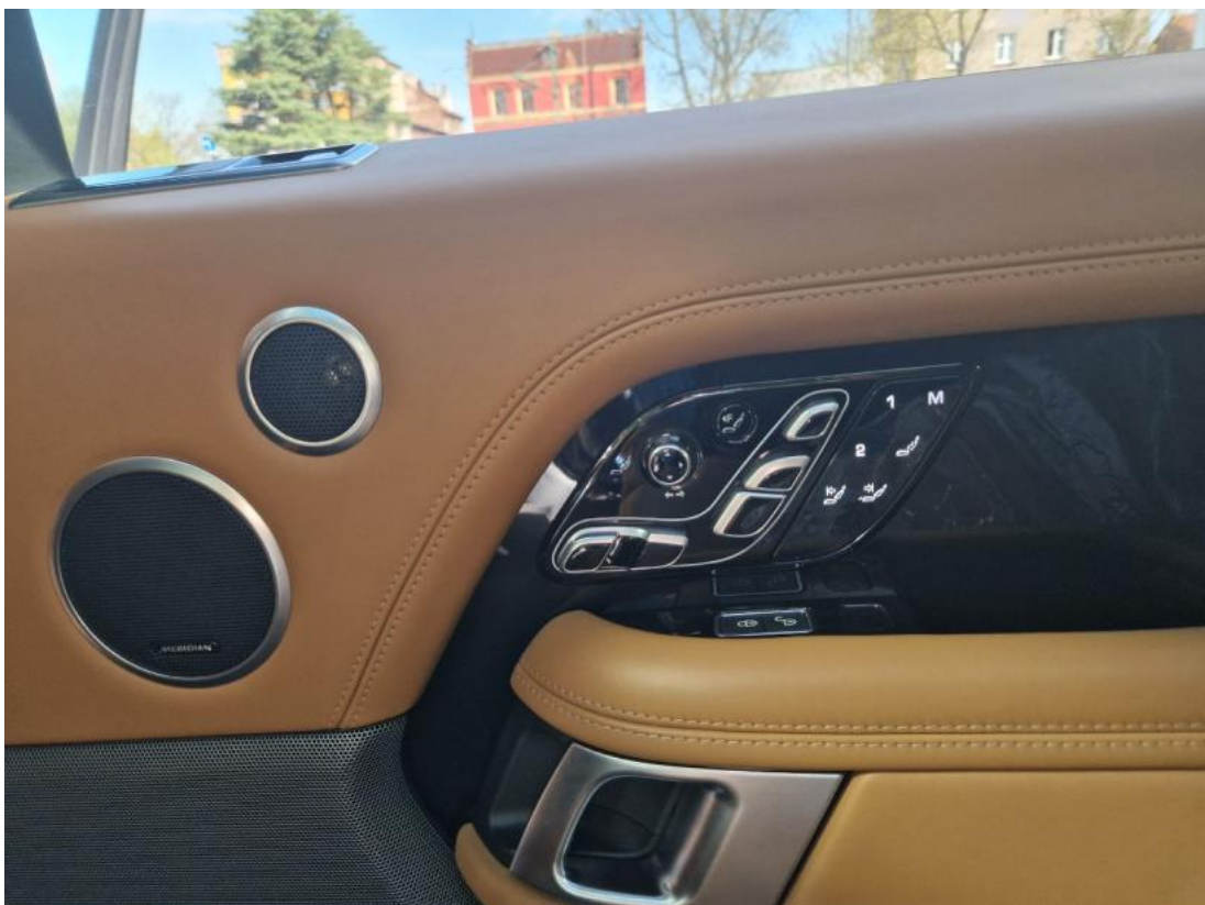
Fot. 38 Zdjęcie do protokołu