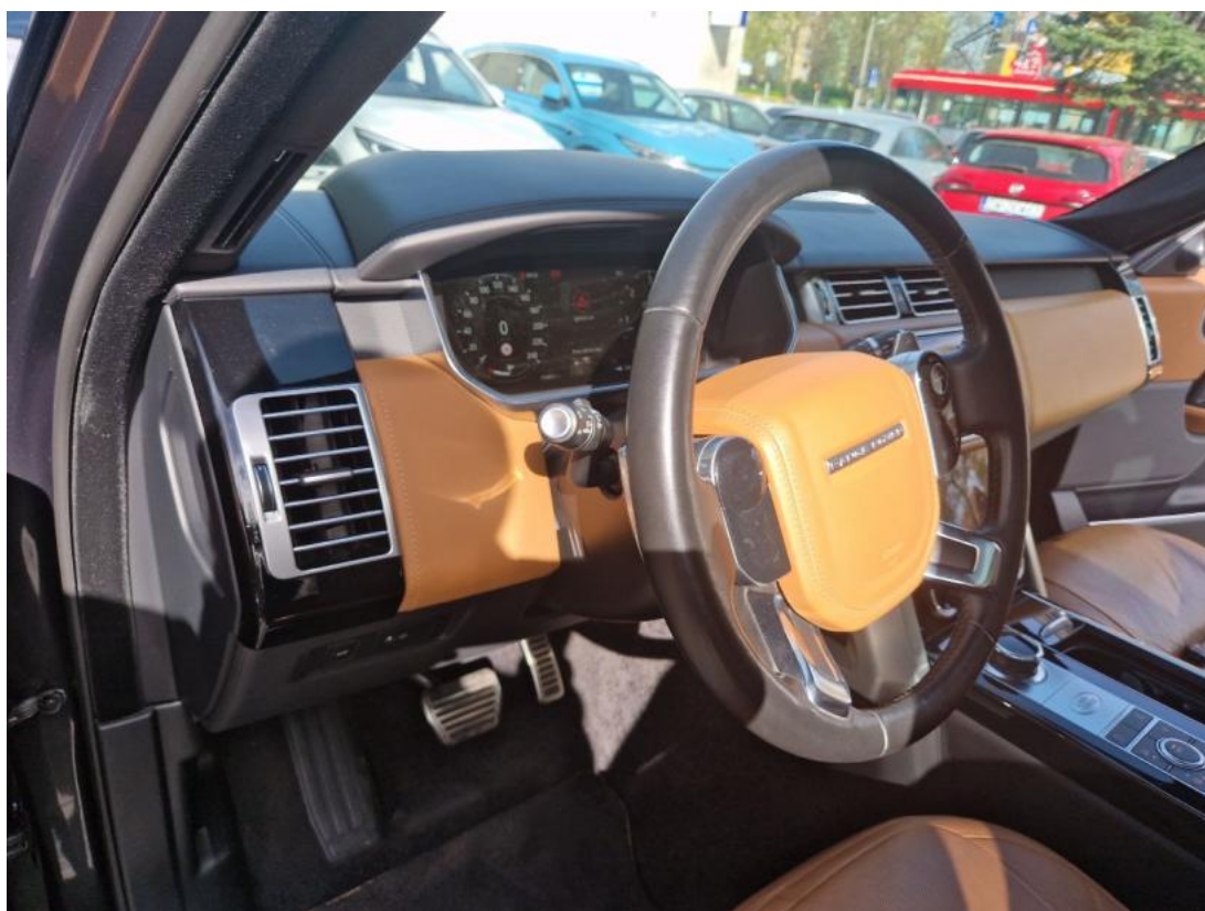
Fot. 22 Kierownica z lewej strony