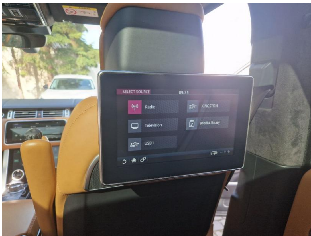
Fot. 36 Zdjęcie do protokołu