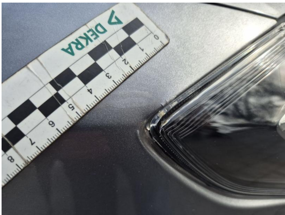
Fot. 39 Błotnik przedni P - Wgniecenie/odkształcenie 2