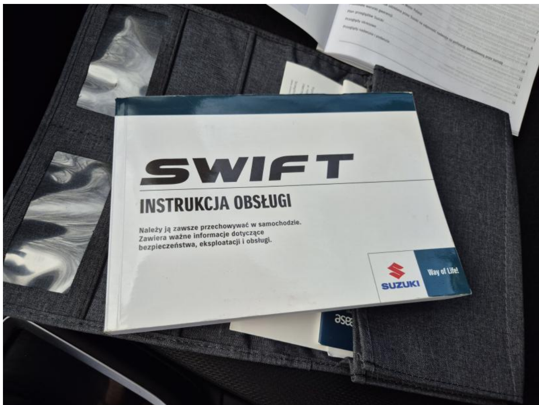
Fot. 32 Instrukcje