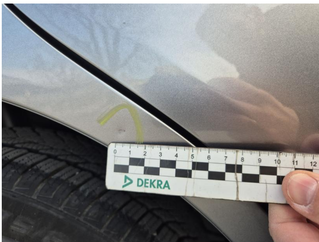
Fot. 42 Błotnik tylny P / Ściana boczna P - Rysa/odprysk 1