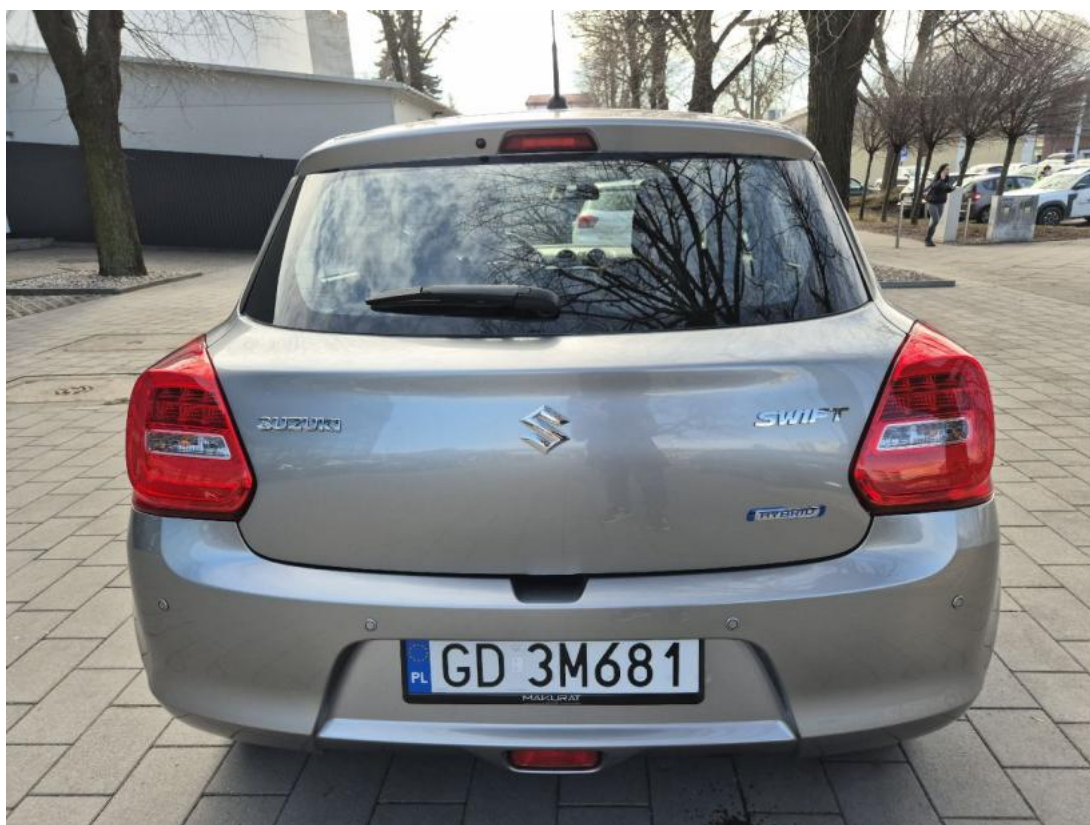
Fot. 8 Tyt