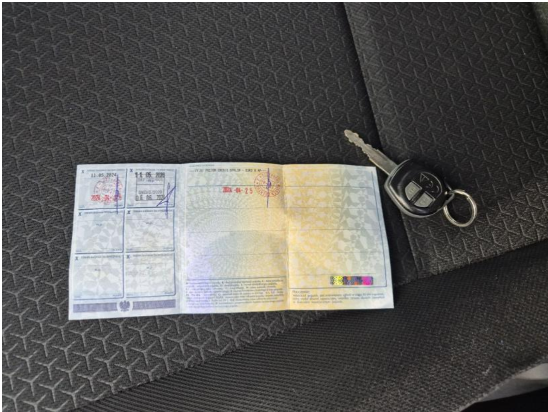
Fot. 29 Dow. Rej. Str.2 i klucze