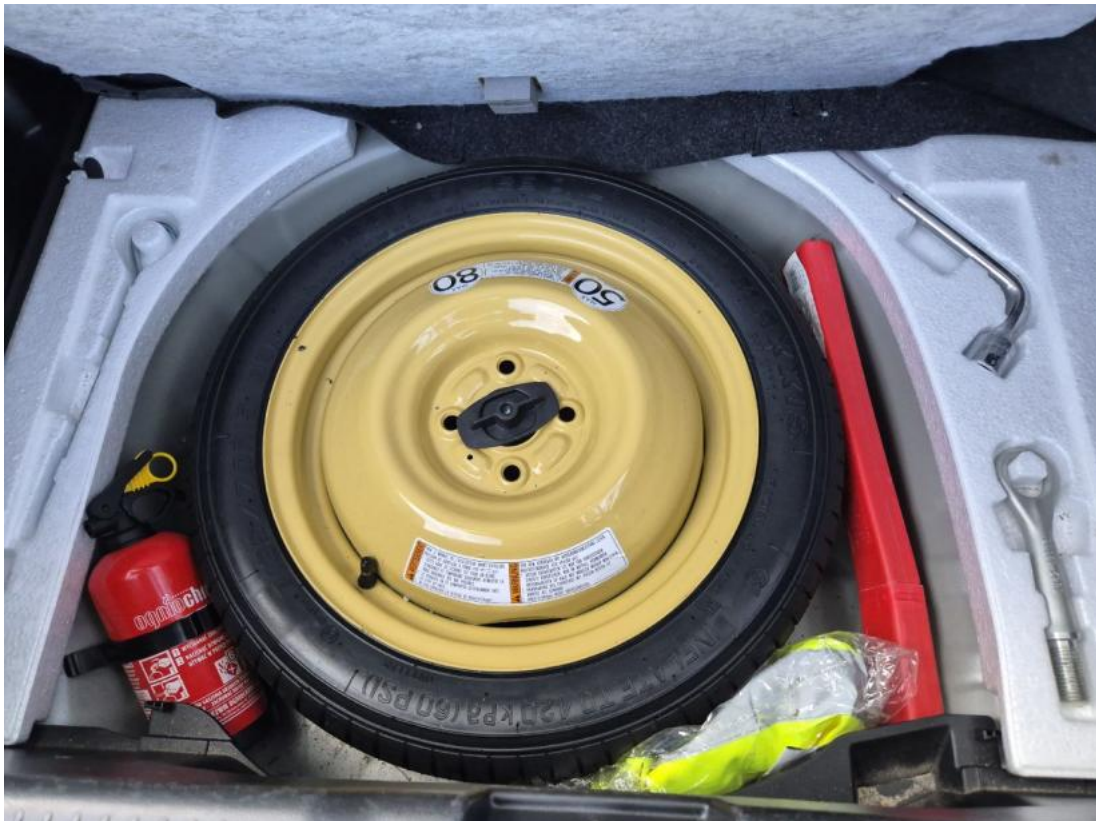
Fot. 25 Koło zapasowe