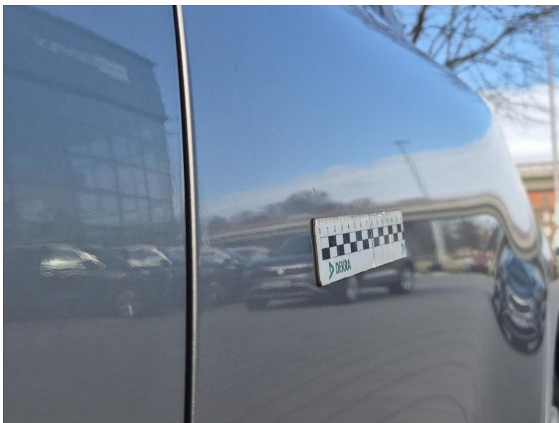
Fot. 50 Drzwi tylne L - Wgniecenie/odkształcenie 1