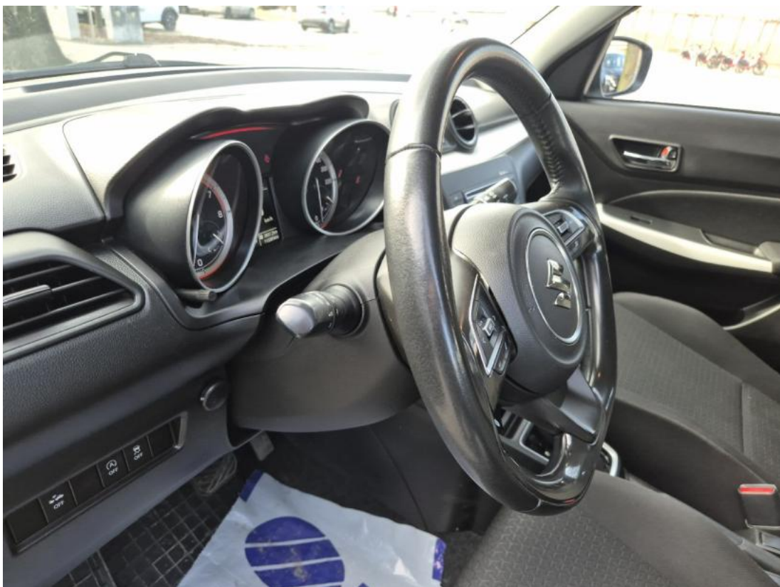
Fot. 22 Kierownica z lewej strony