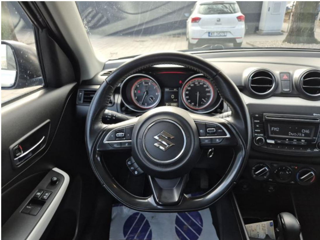
Fot. 21 Kierownica (na wprost)