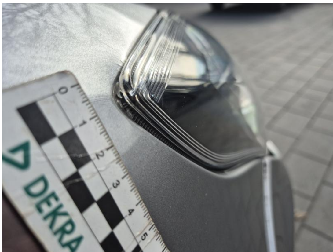
Fot. 40 Reflektor P - Rysa/odprysk 1