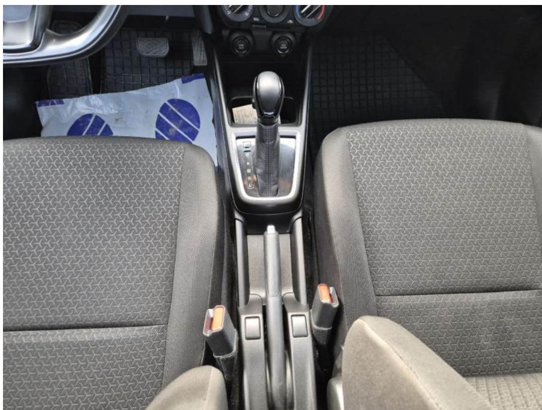
Fot. 20 Tunel środkowy