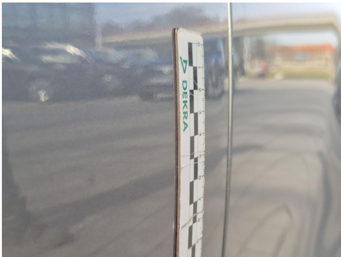
Fot. 49 Drzwi przed L - Wgniecenie/odkształcenie 1