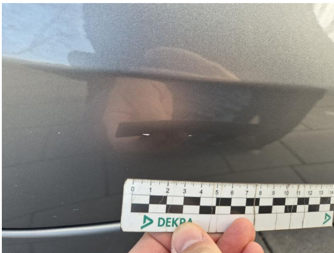
Fot. 41 Drzwi tylne P - Rysa/odprysk 1