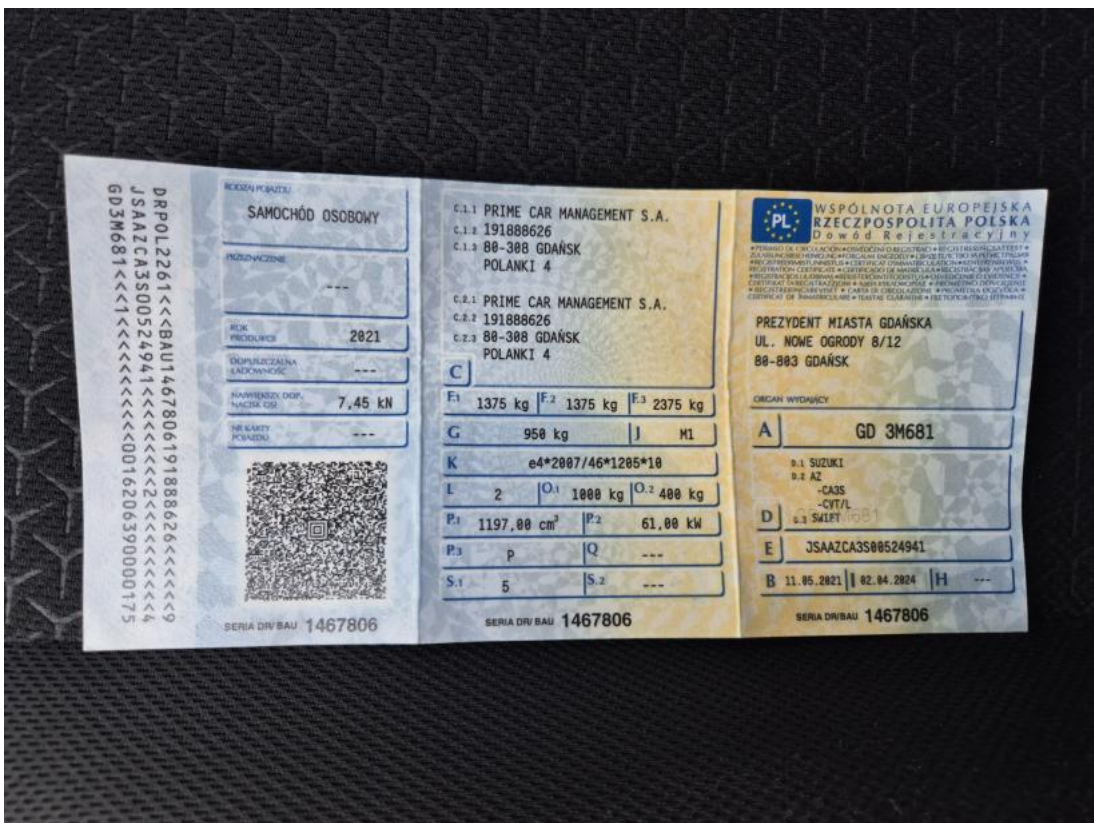
Fot. 28 Dowód rej. Str. 1