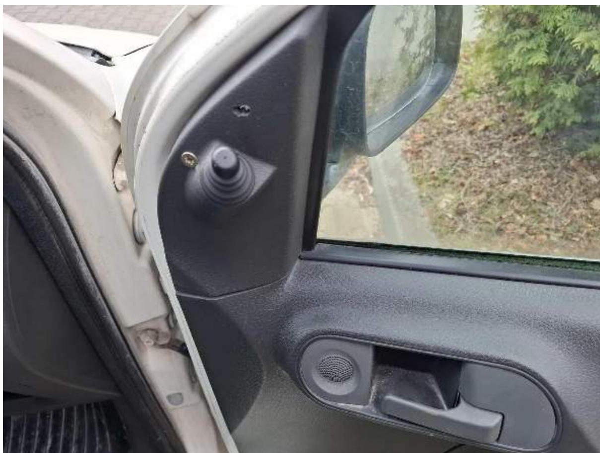
Fot. nr 78