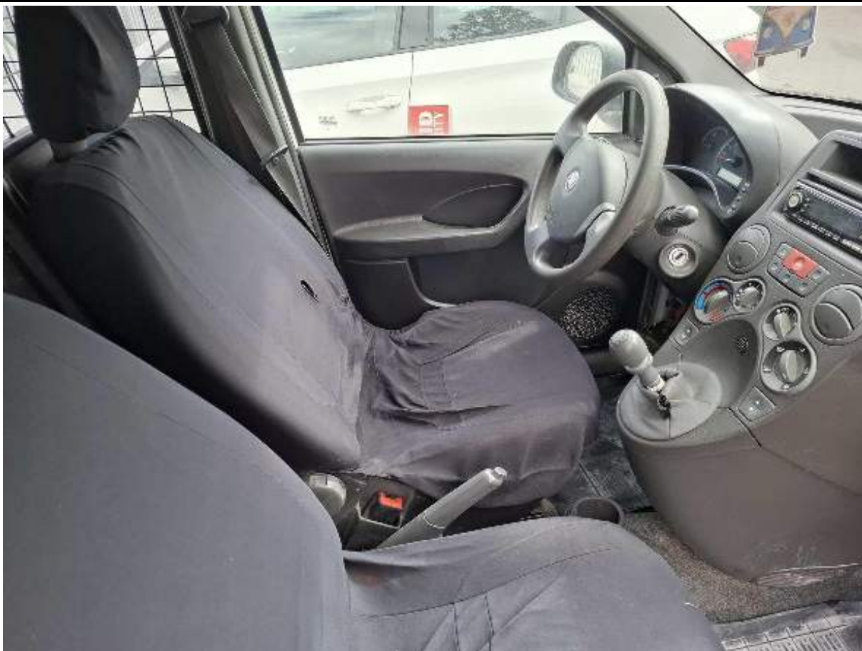
Fot. nr 83