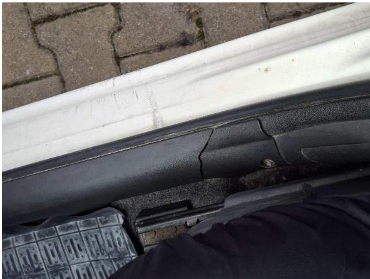
Fot. nr 88