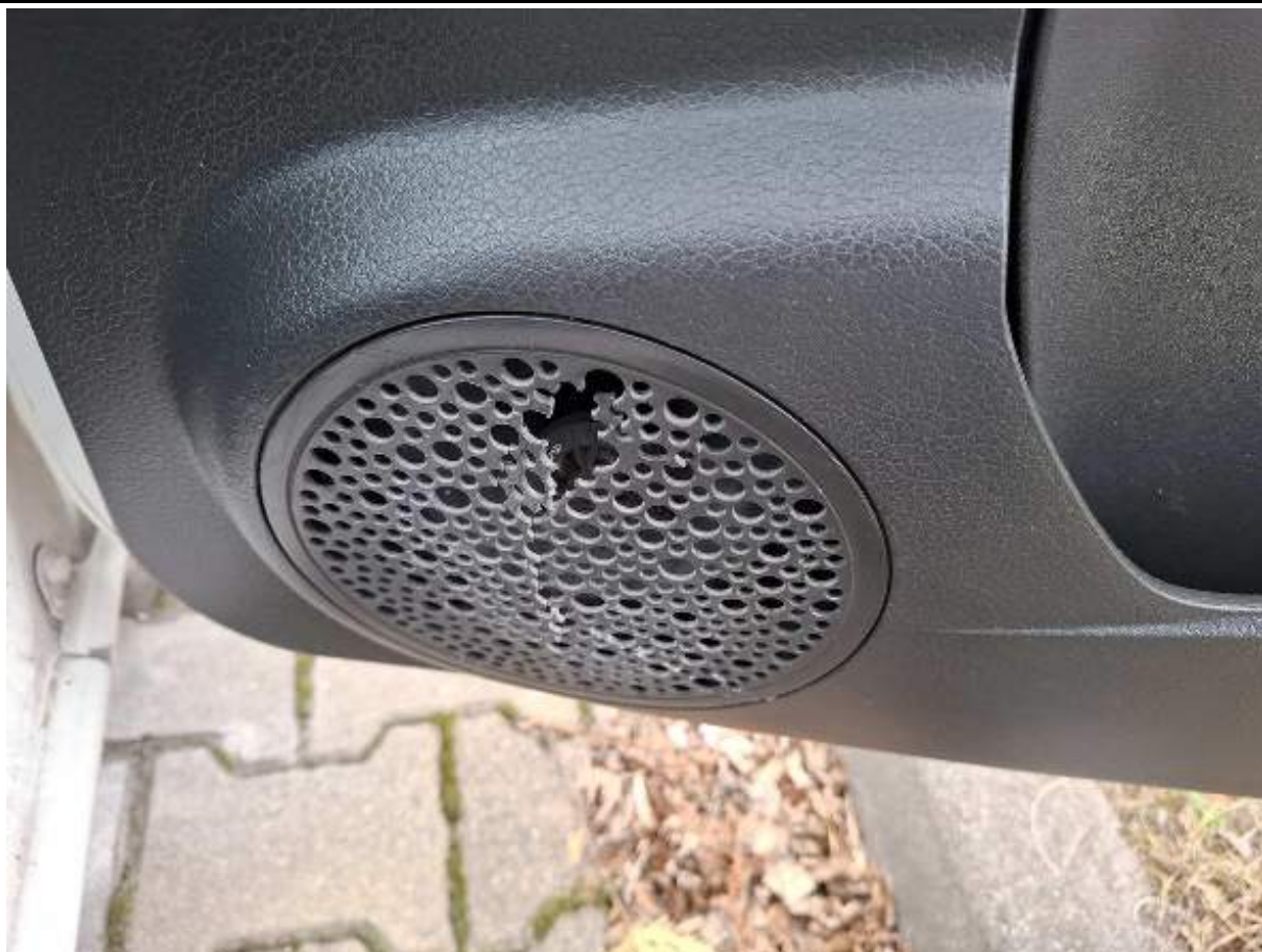
Fot. nr 79