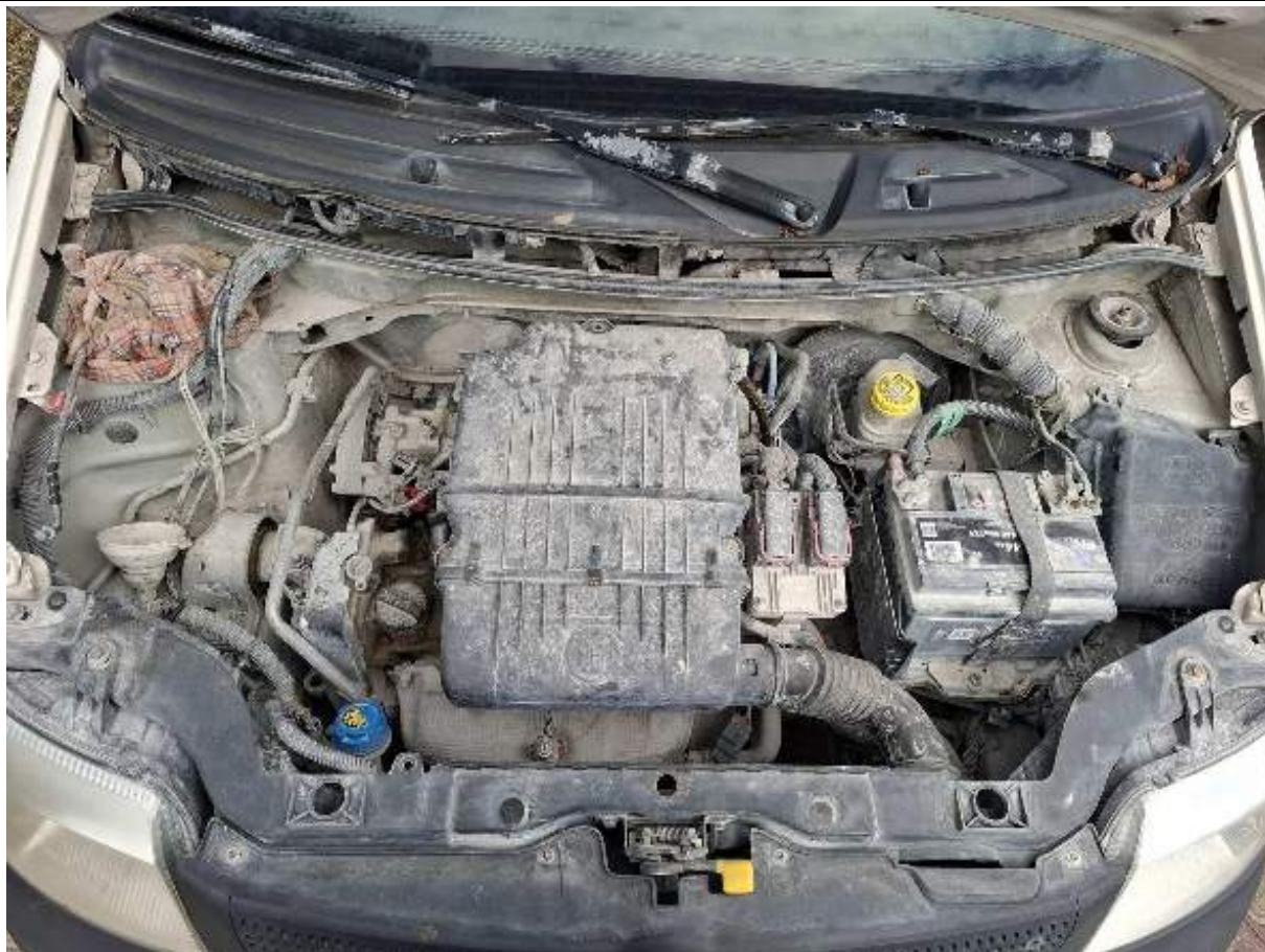
Fot. nr 89