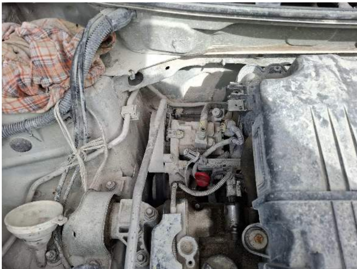
Fot. nr 90