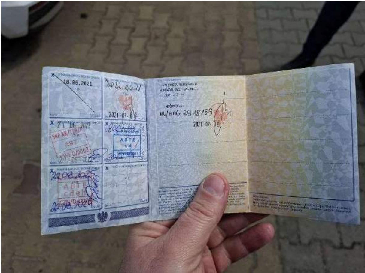
Fot. nr 95

Dokument wystawiony elektronicznie, wa ny bez podpisu