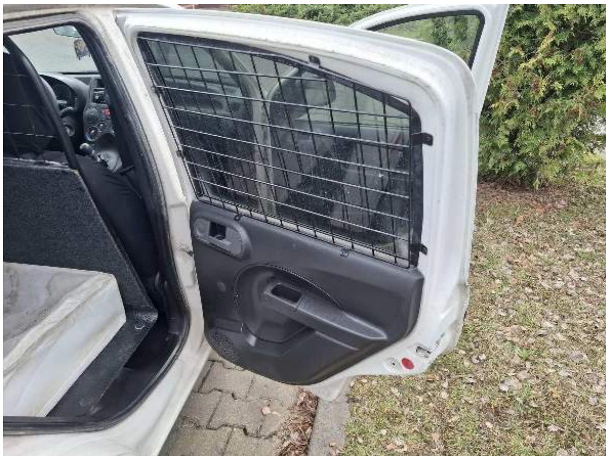
Fot. nr 86