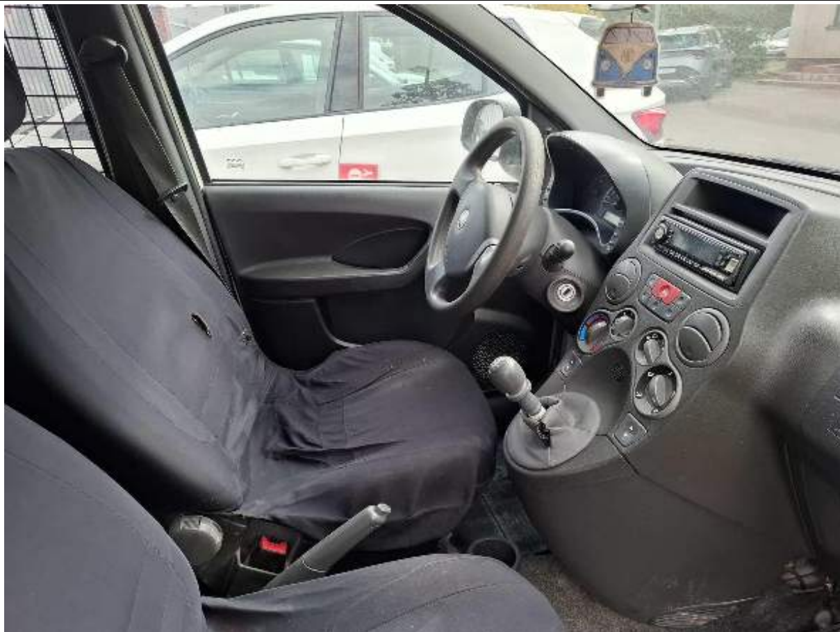
Fot. nr 81