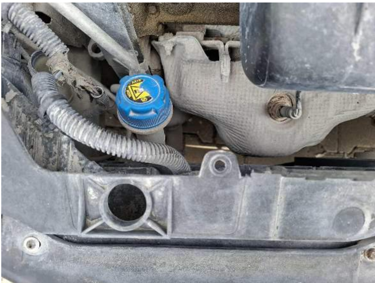
Fot. nr 92