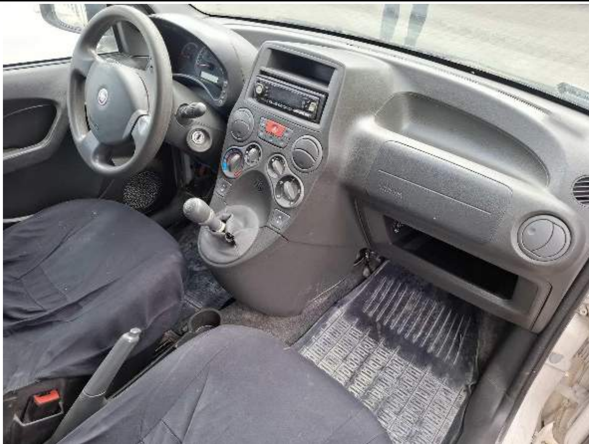
Fot. nr 85