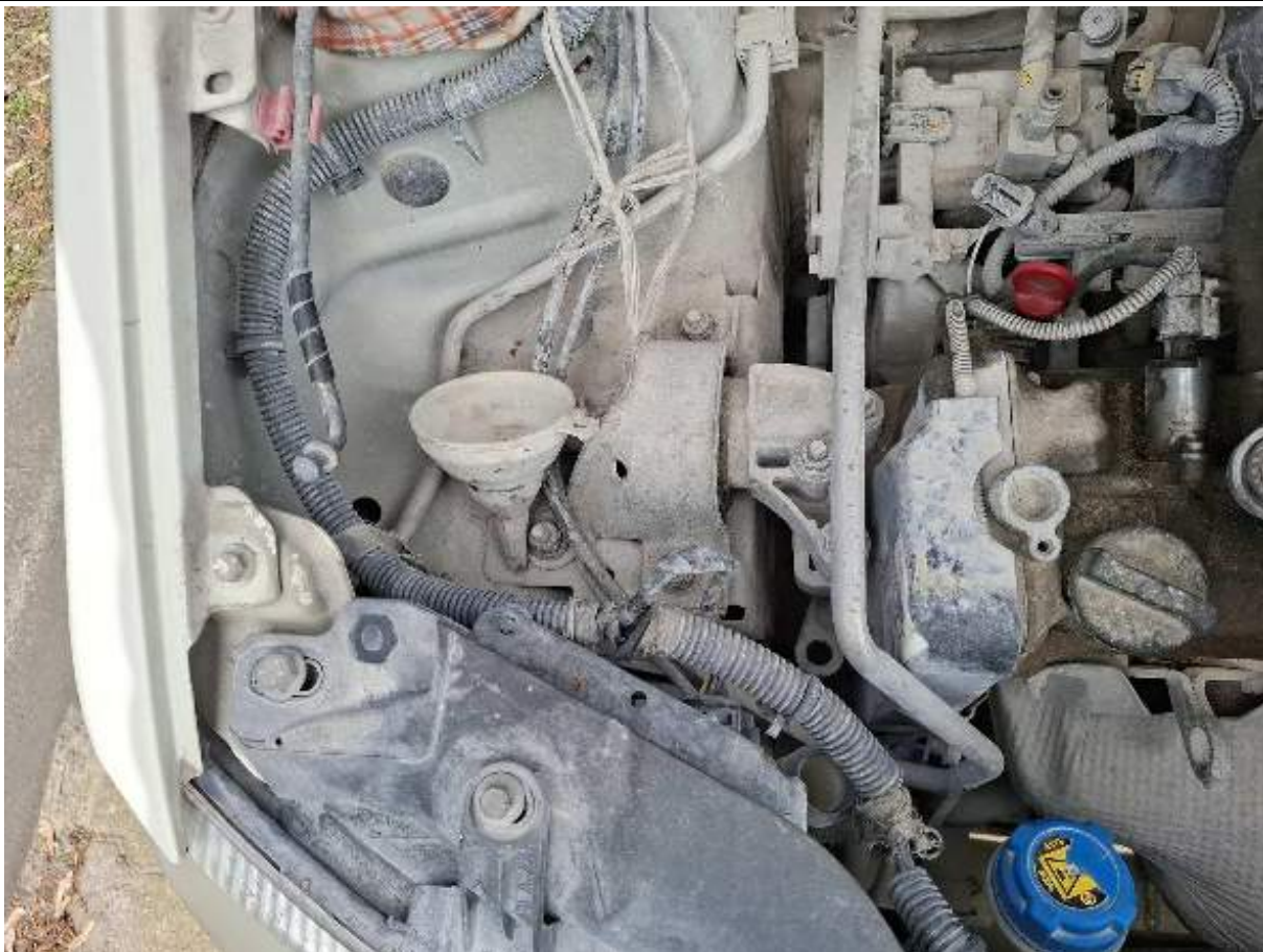
Fot. nr 91