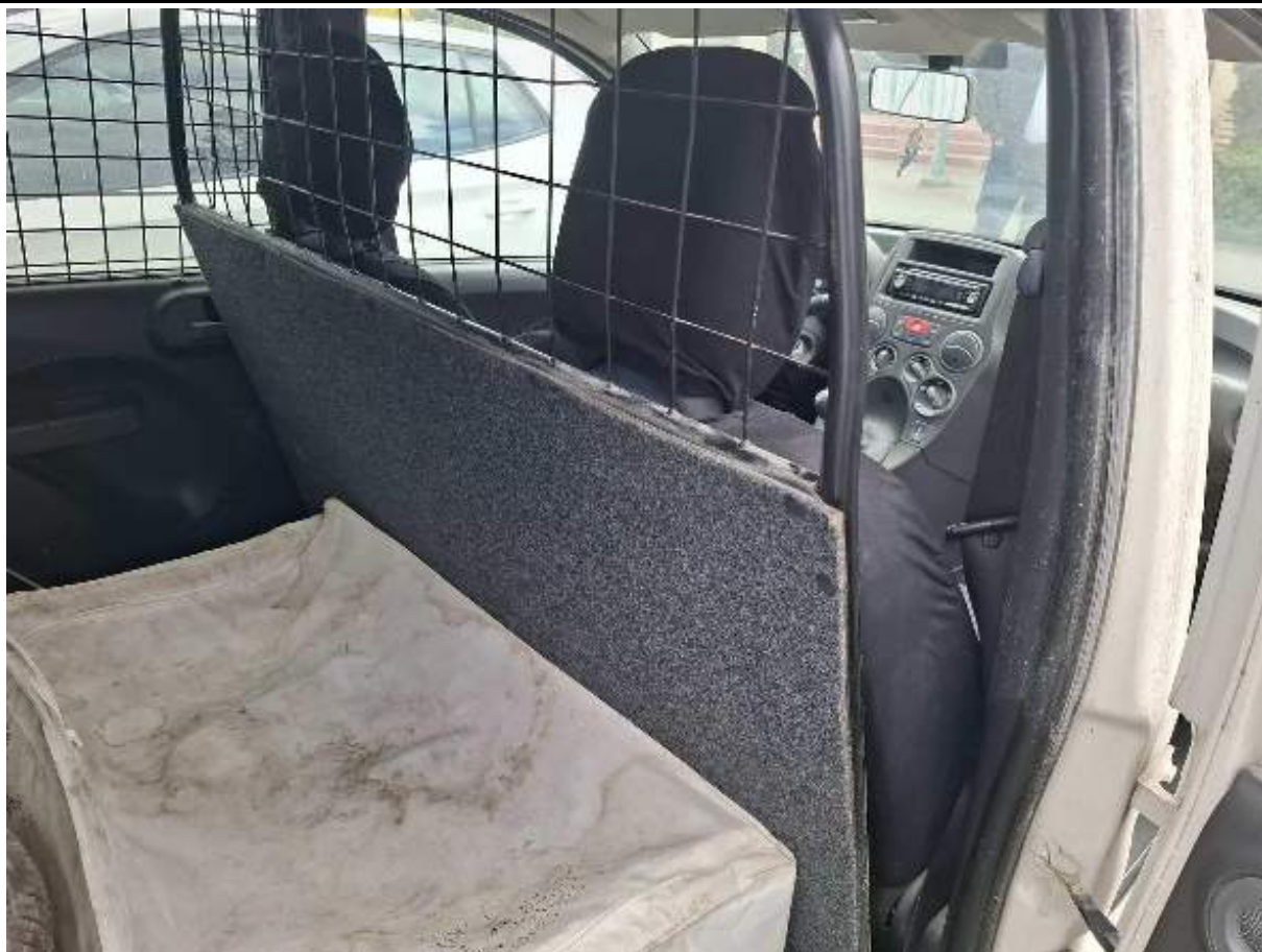
Fot. nr 87