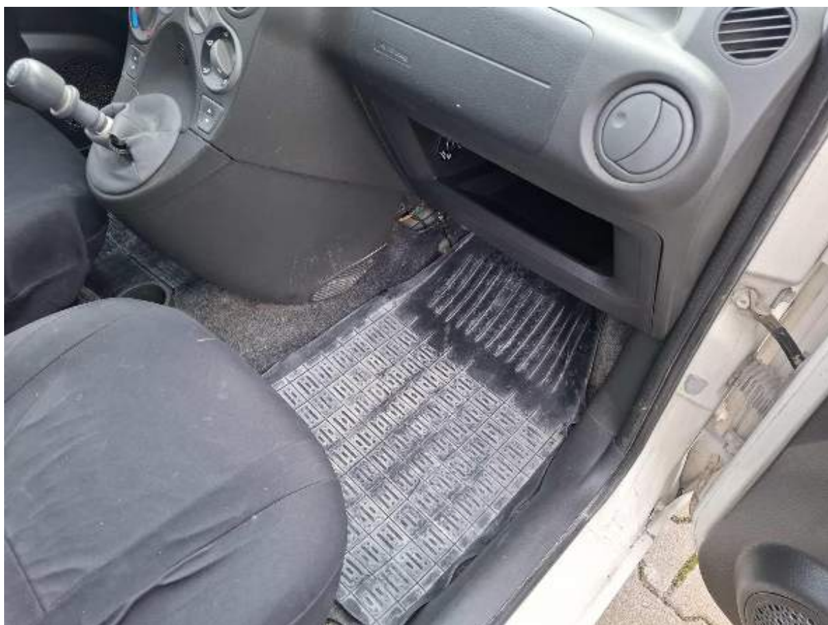
Fot. nr 80