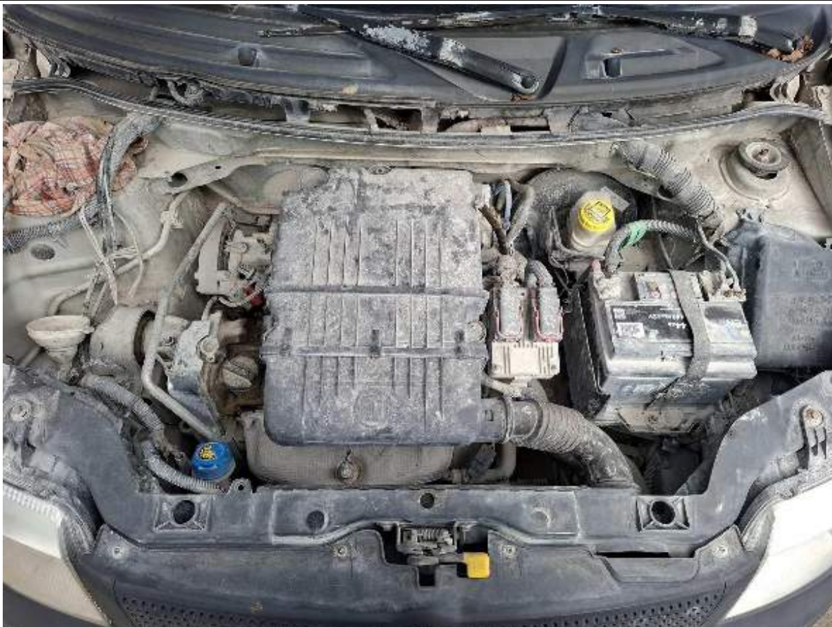
Fot. nr 93