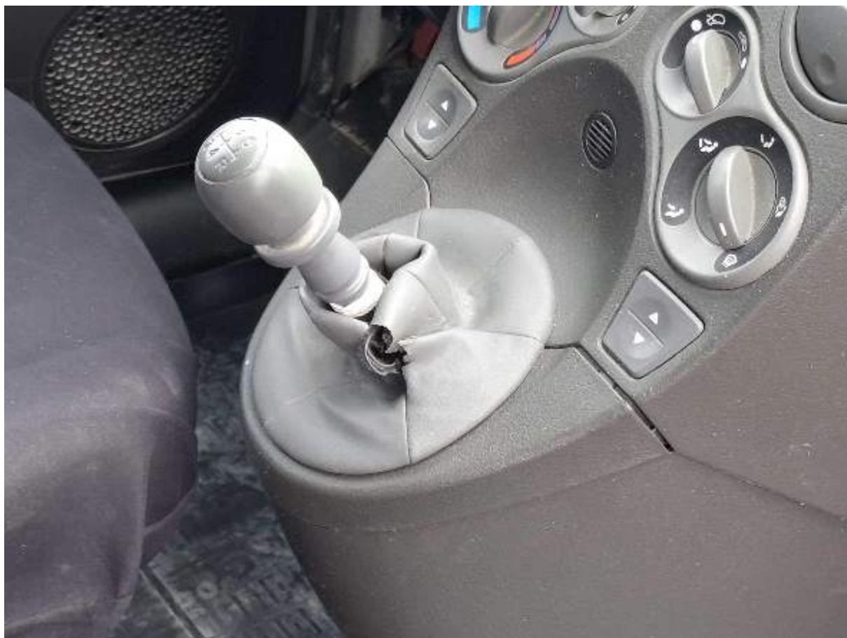
Fot. nr 82