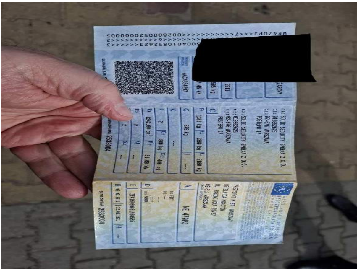
Fot. nr 94