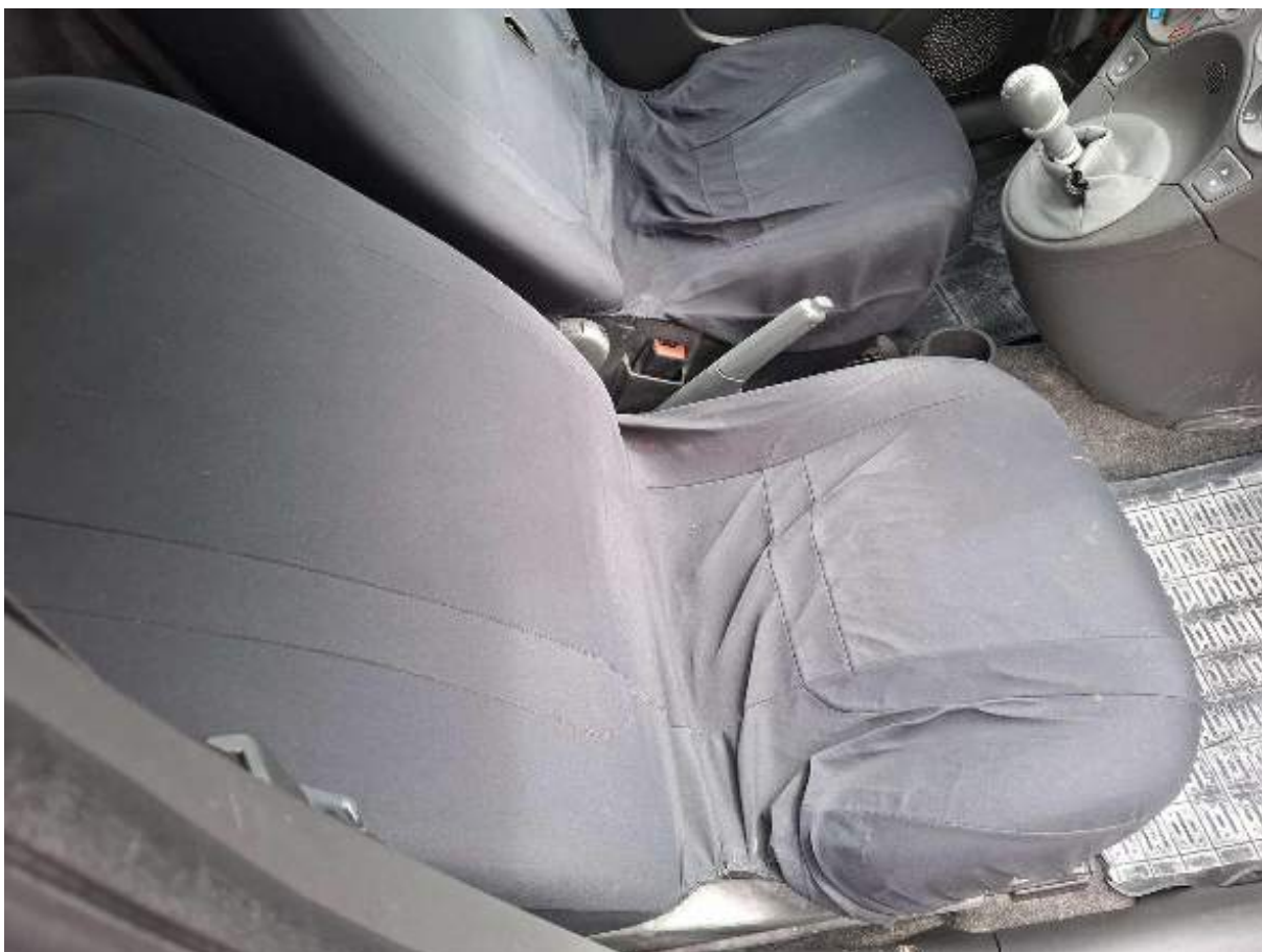
Fot. nr 84