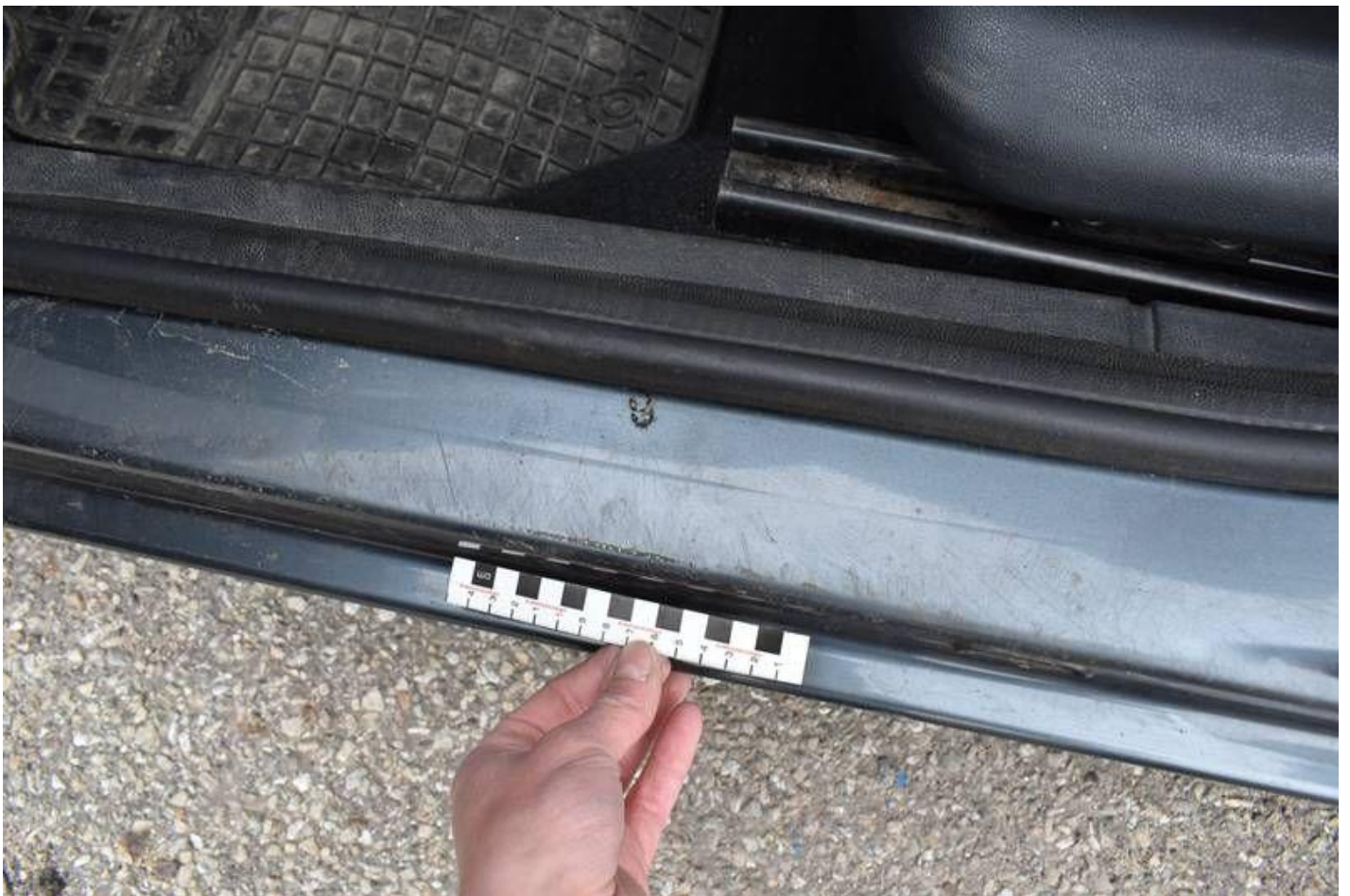
Fot. nr 100