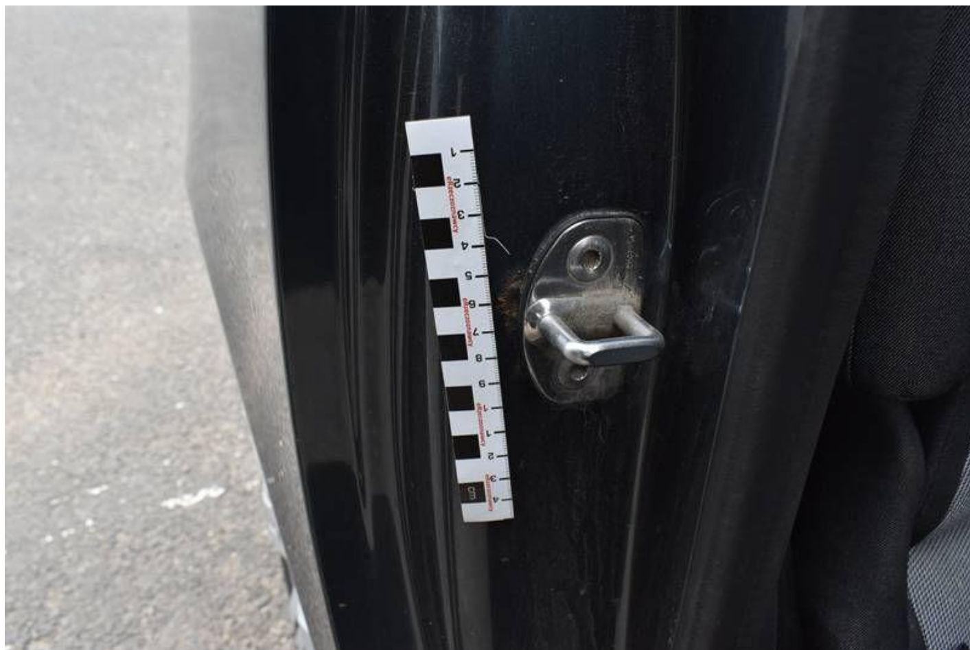
Fot. nr 112