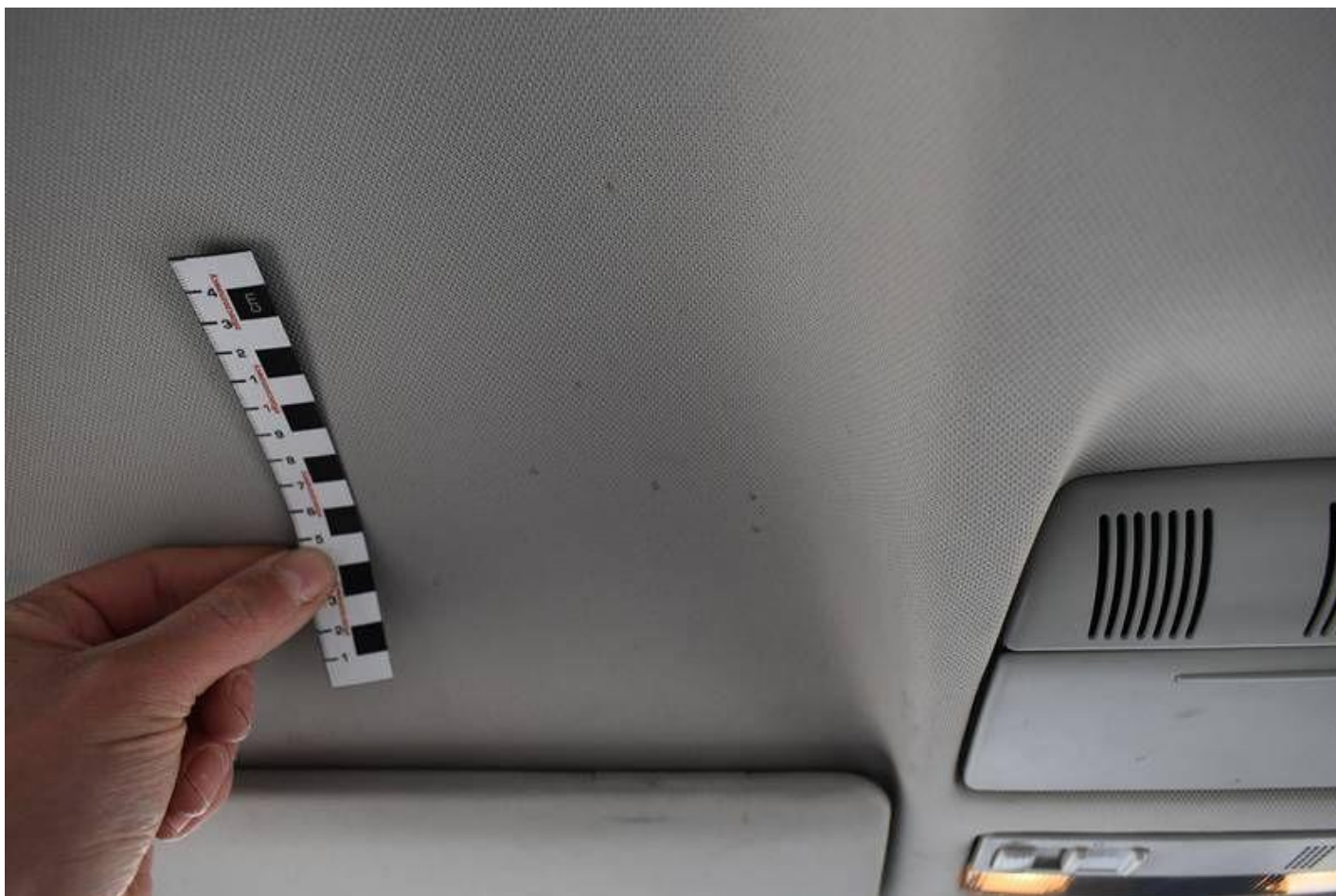
Fot. nr 106