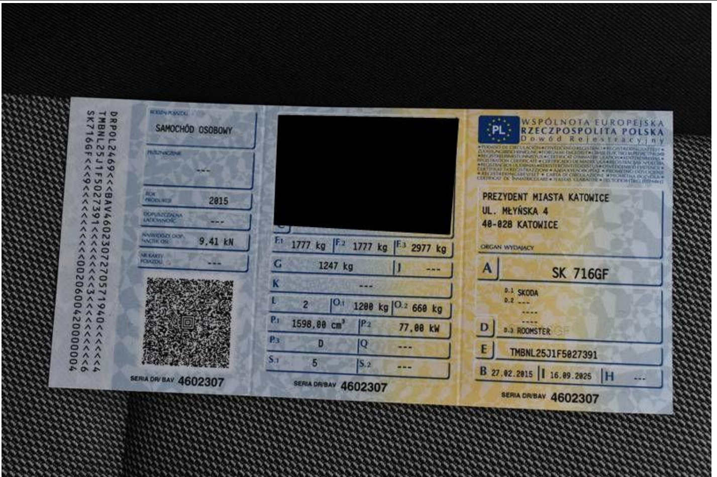
Fot. nr 115