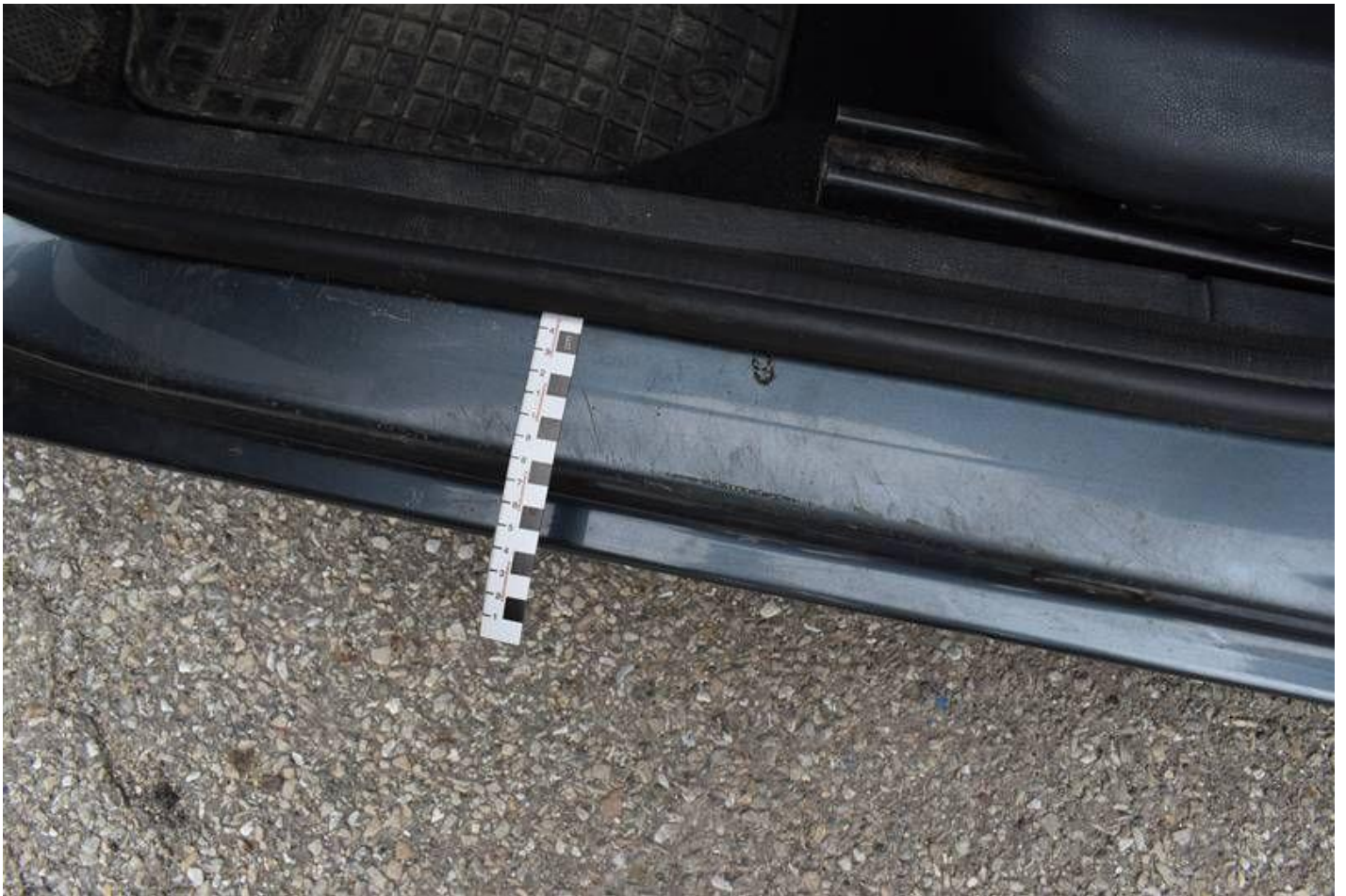
Fot. nr 99