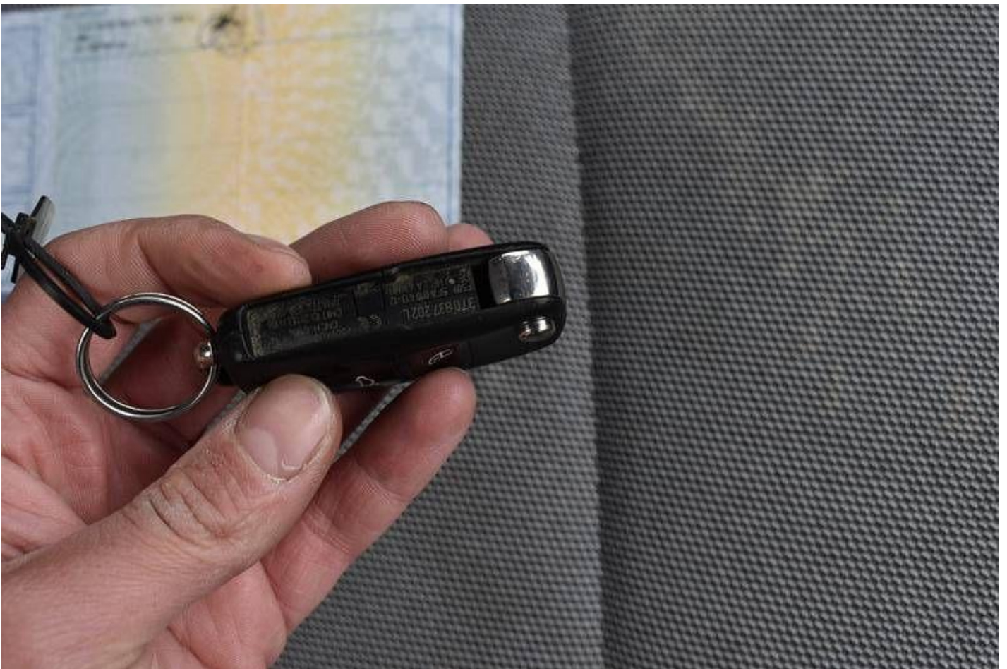
Fot. nr 114