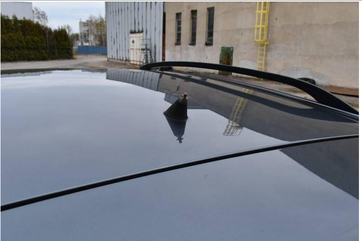
Fot. nr 113