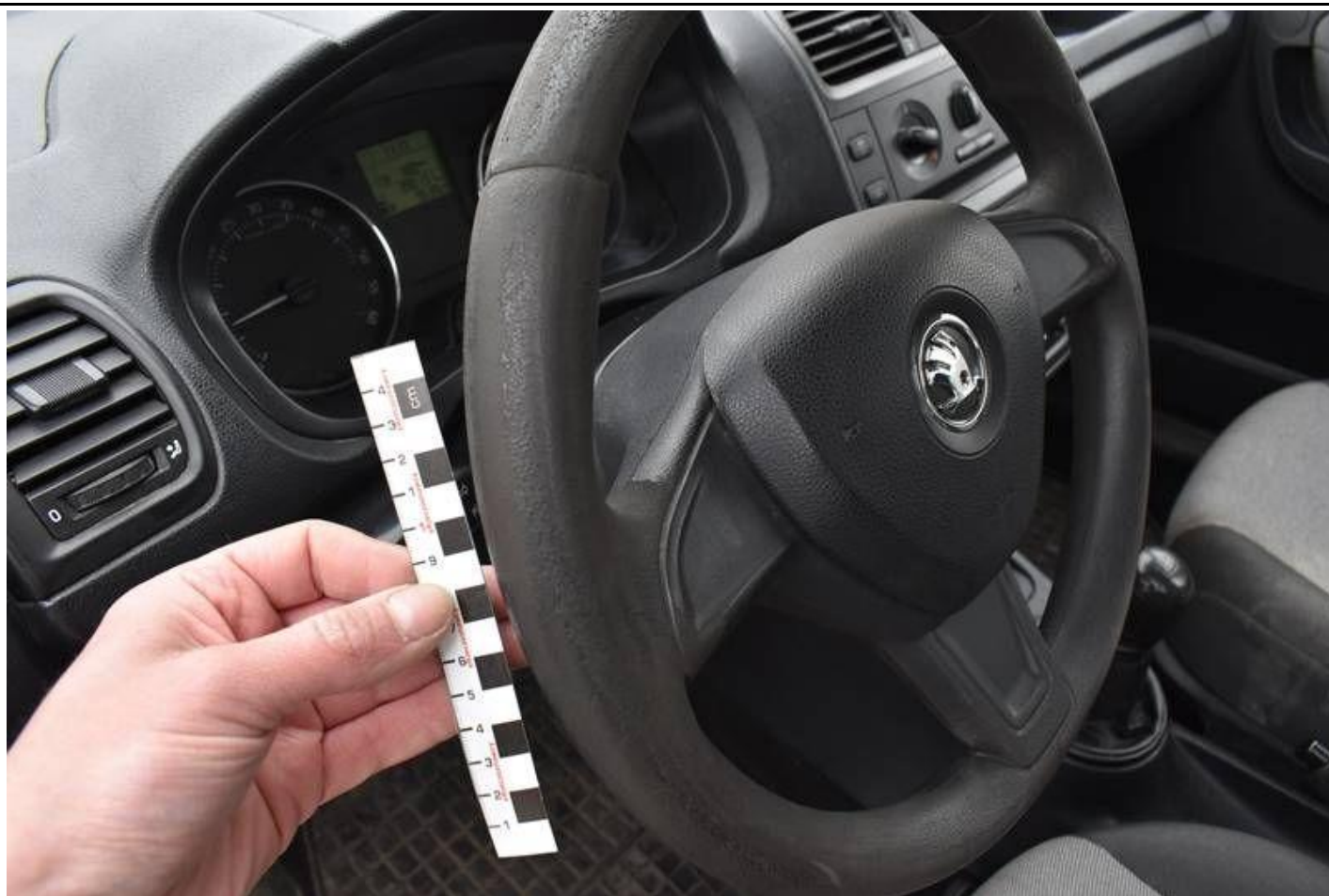
Fot. nr 101