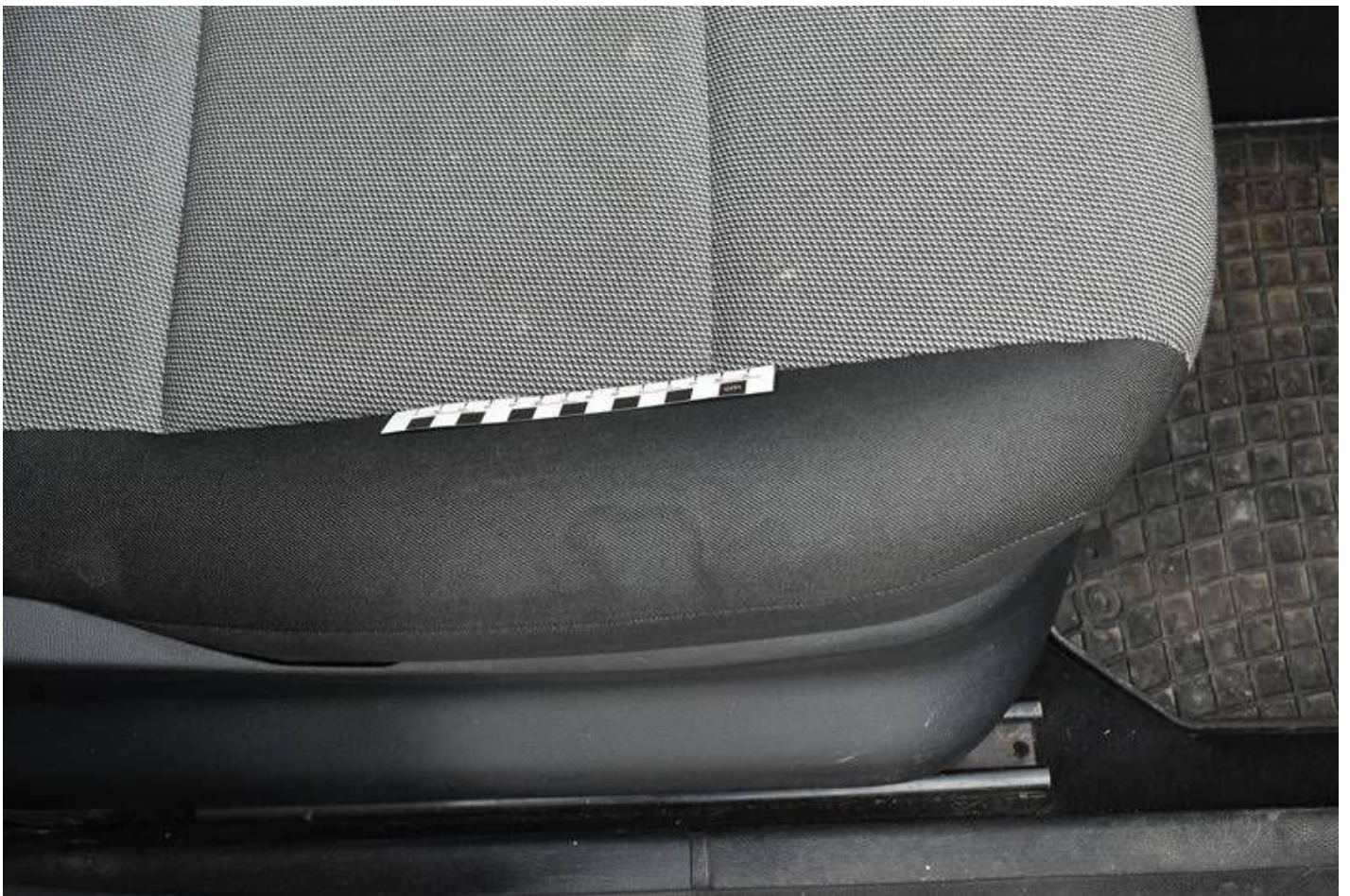
Fot. nr 86