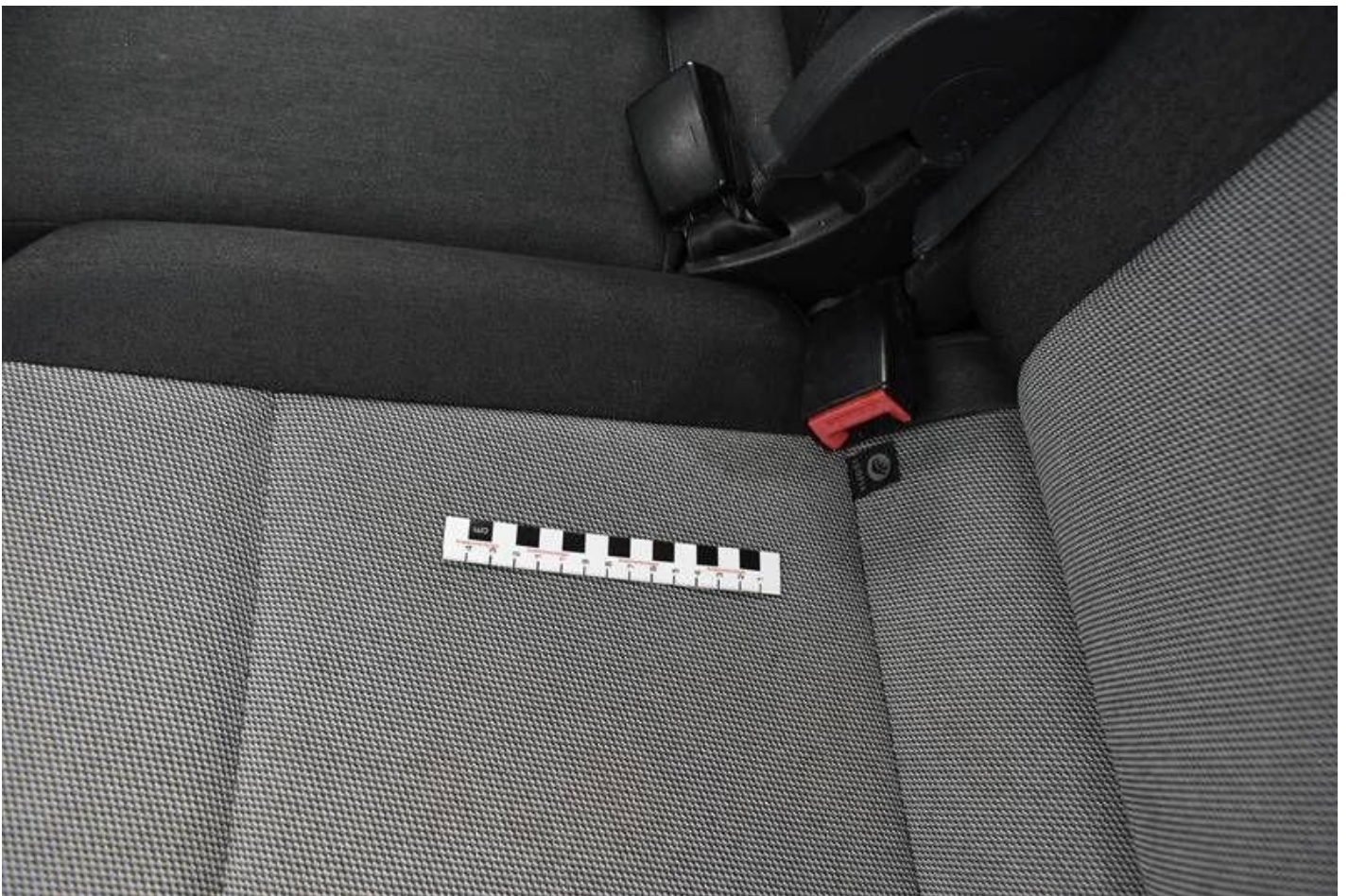
Fot. nr 92