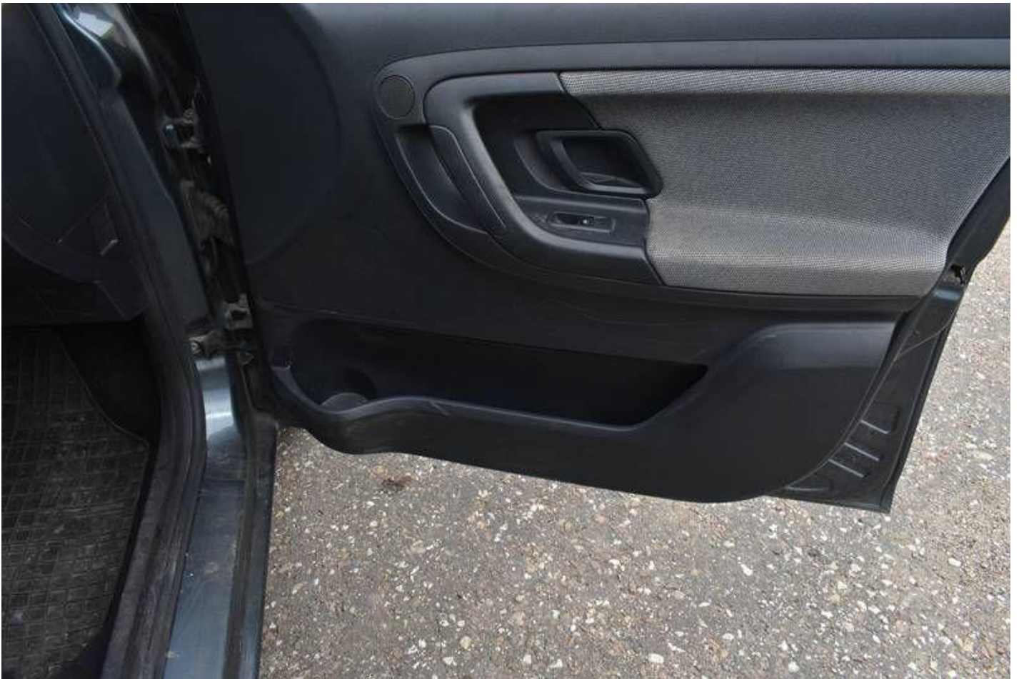
Fot. nr 87