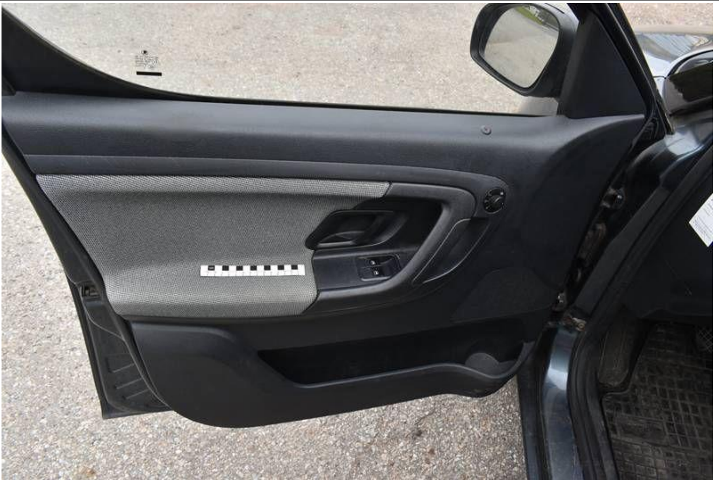
Fot. nr 95