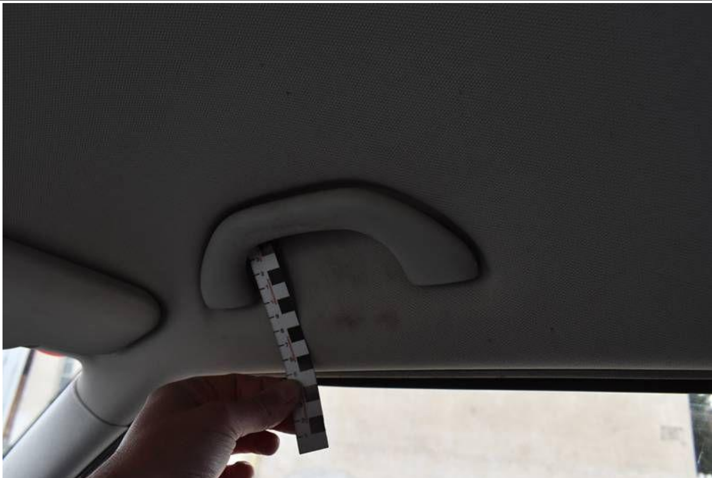
Fot. nr 107