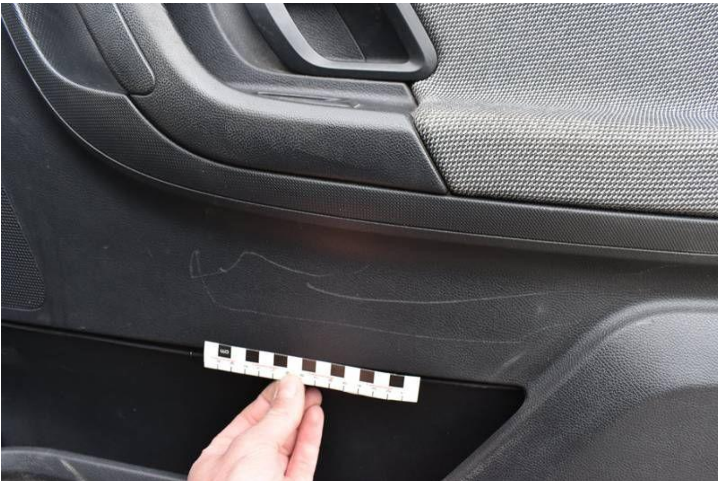
Fot. nr 88