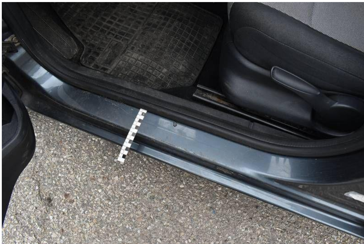
Fot. nr 98