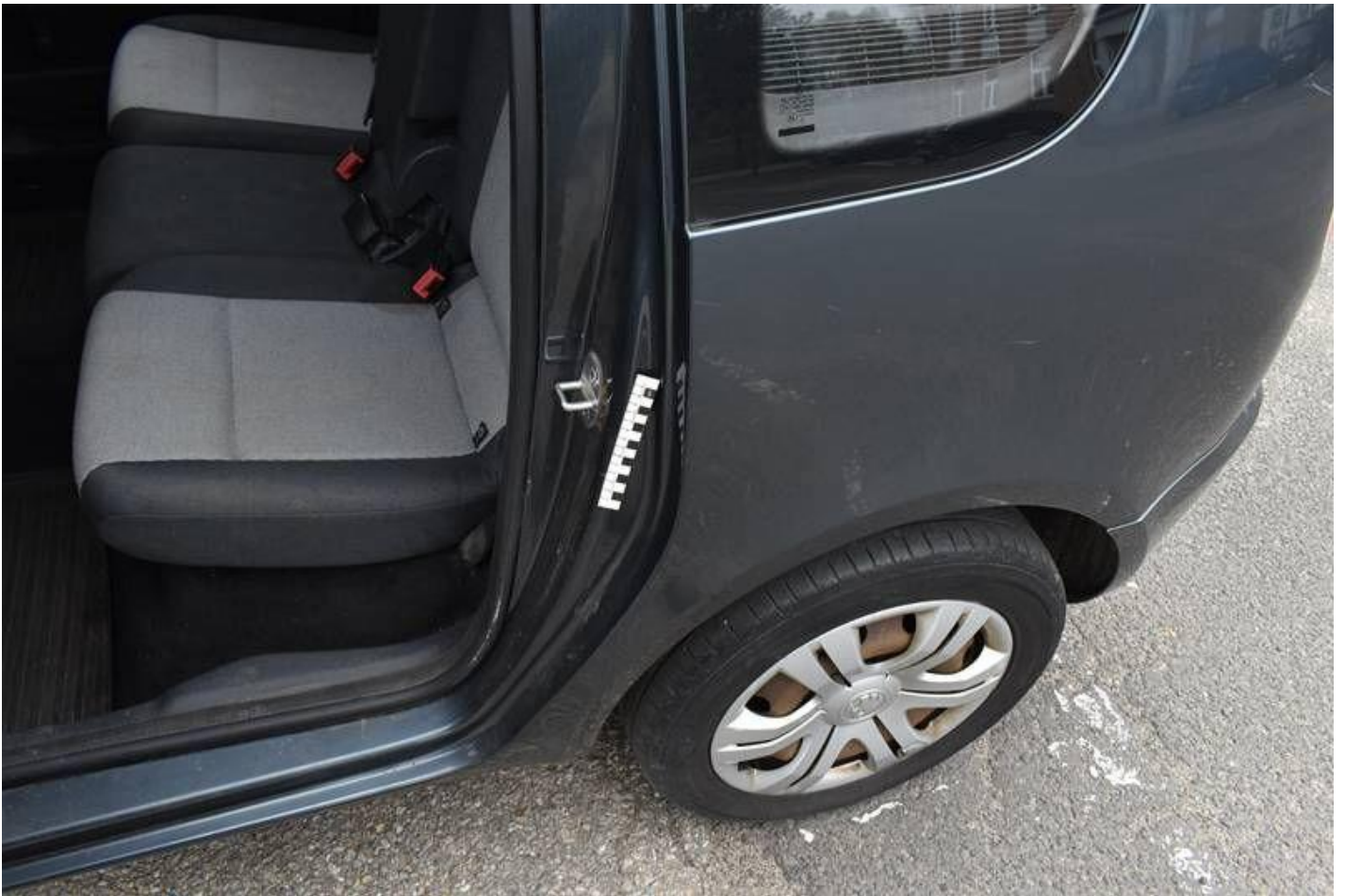
Fot. nr 109