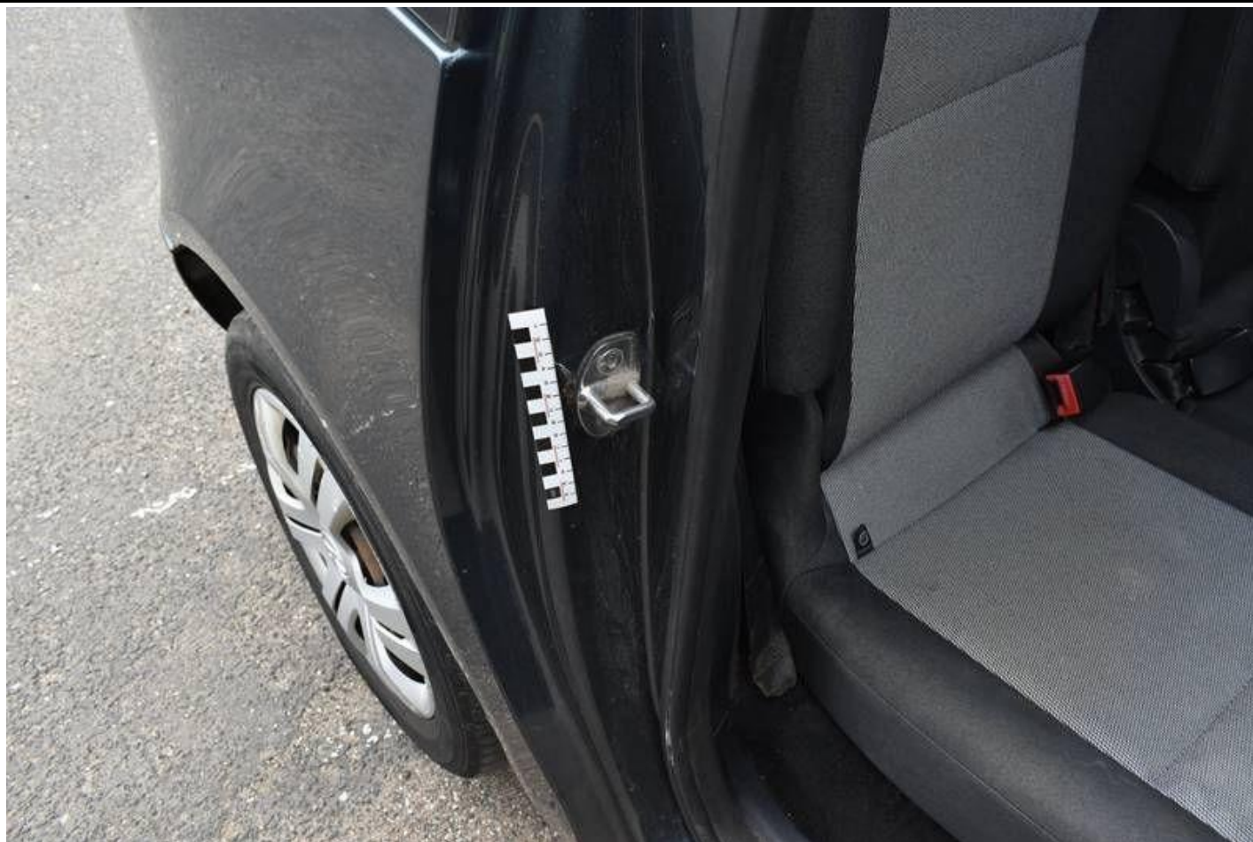
Fot. nr 111