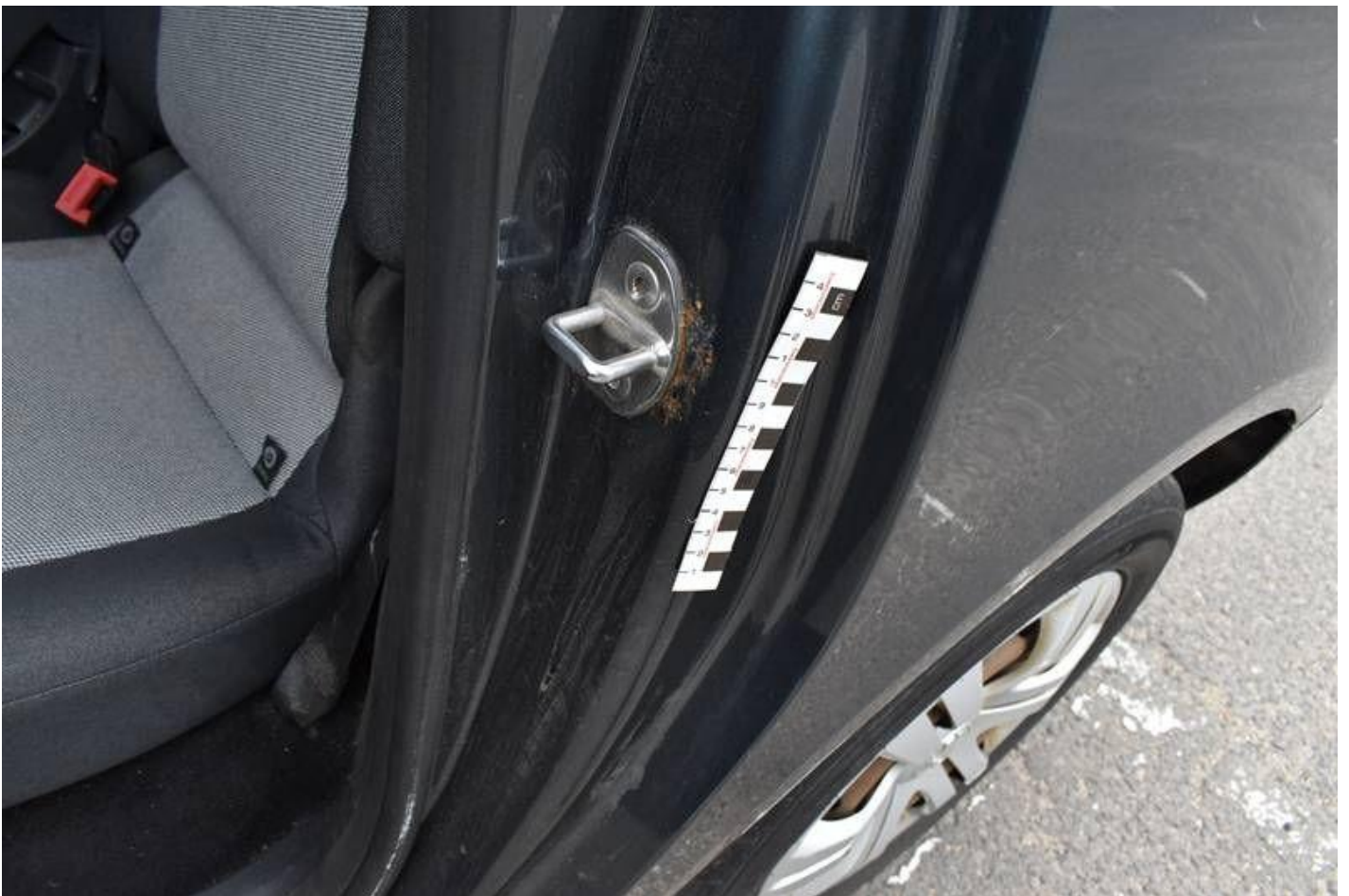
Fot. nr 110