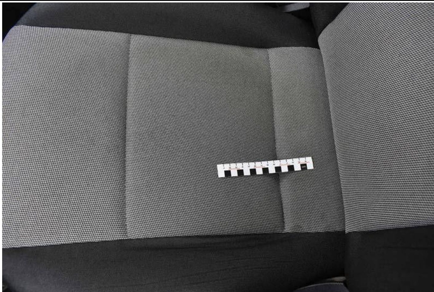
Fot. nr 97