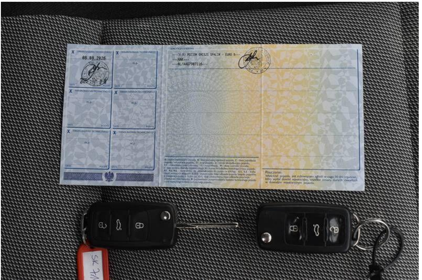
Fot. nr 116

Dokument wystawiony elektronicznie, wa ny bez podpisu