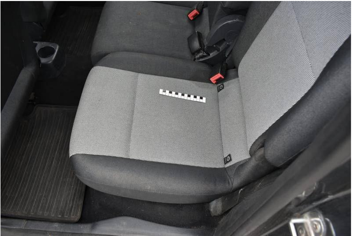
Fot. nr 91