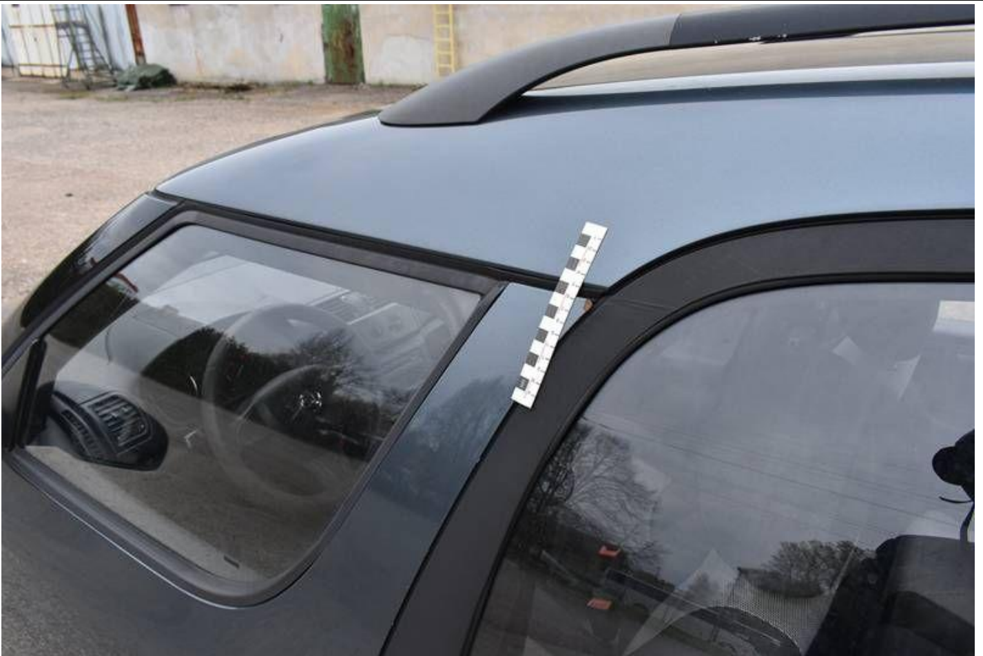
Fot. nr 93