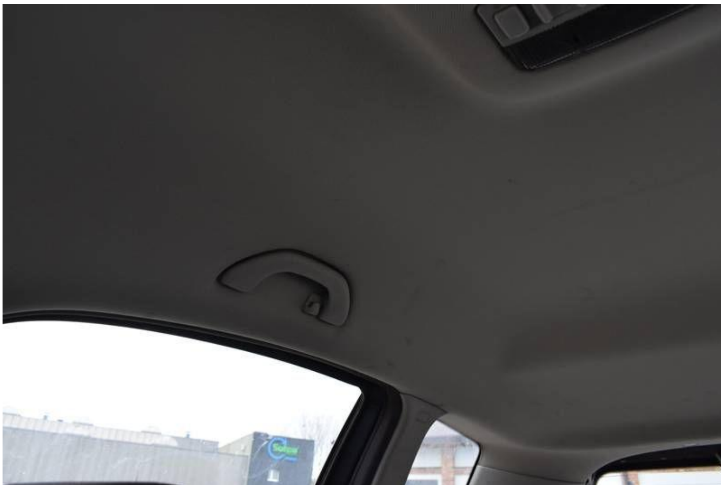
Fot. nr 108