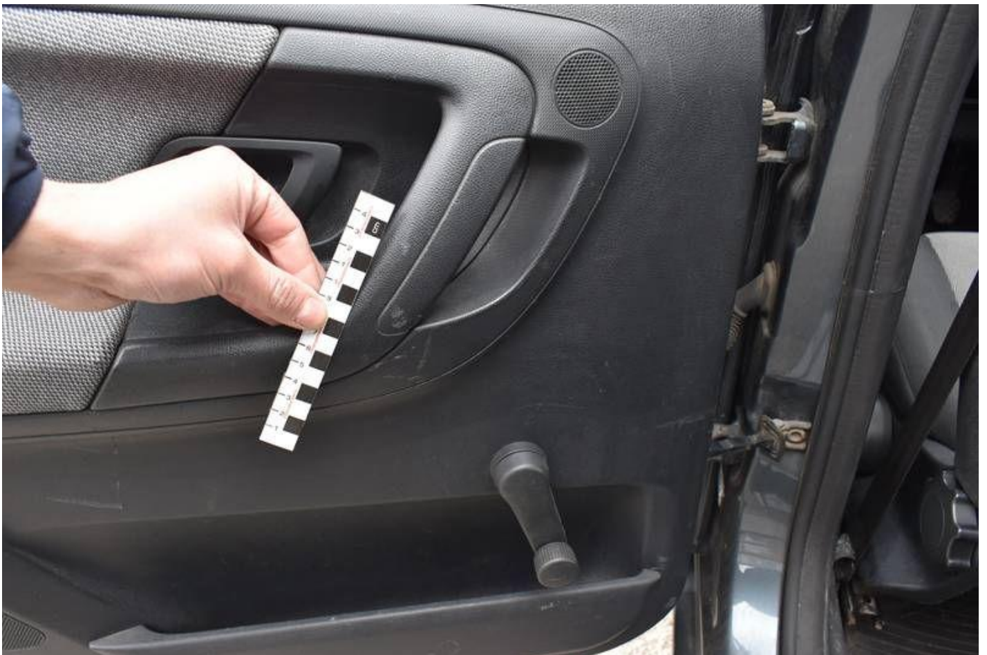
Fot. nr 90