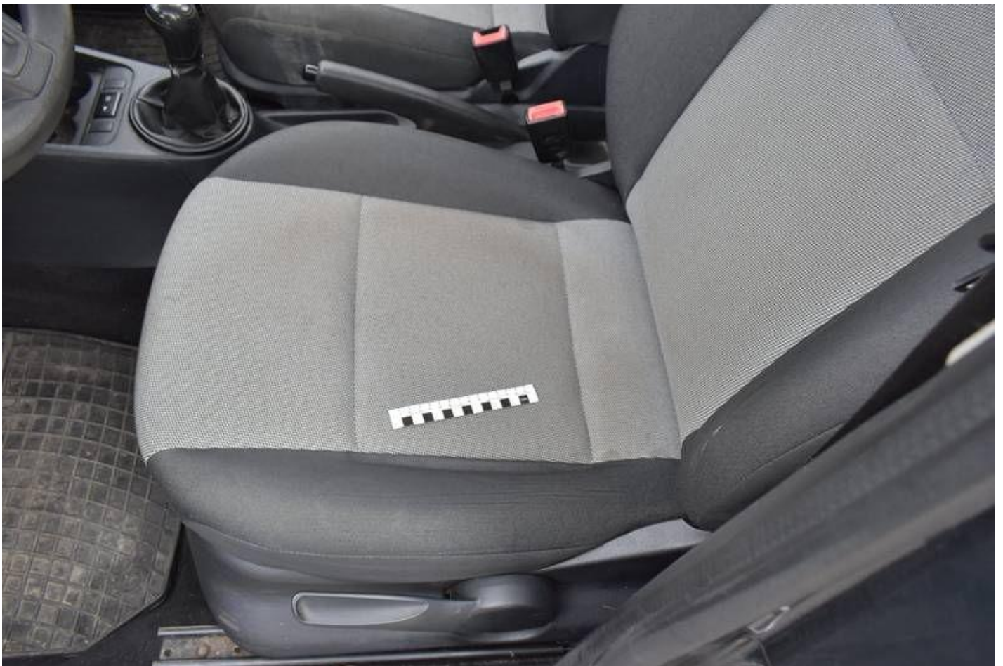
Fot. nr 96