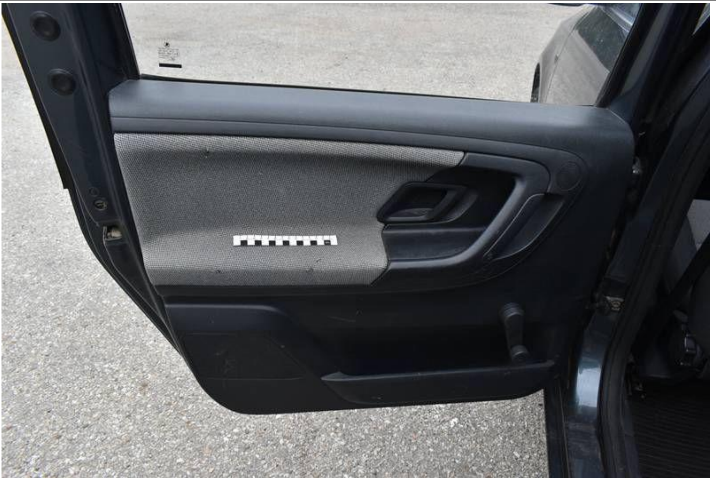
Fot. nr 89