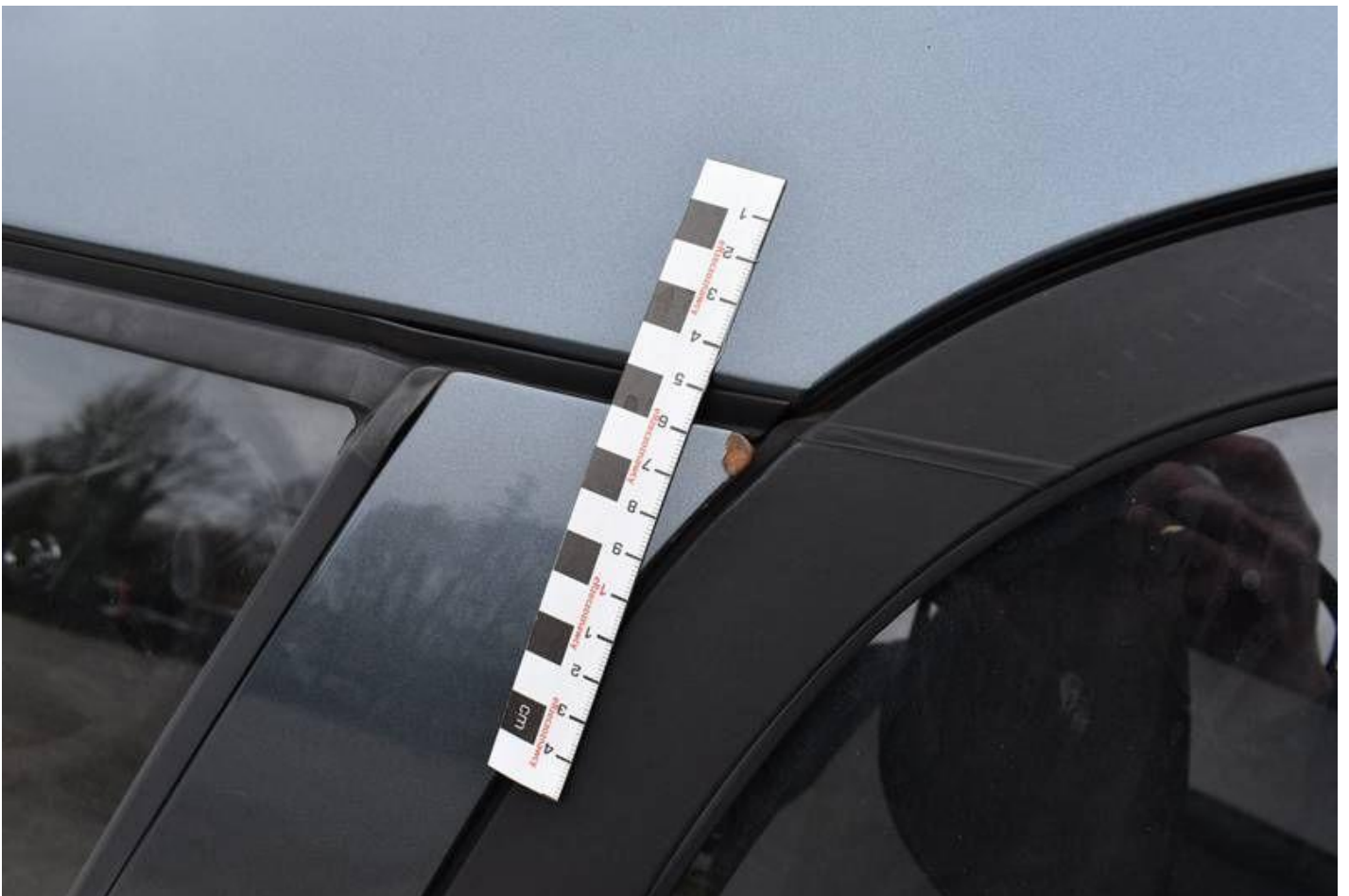
Fot. nr 94