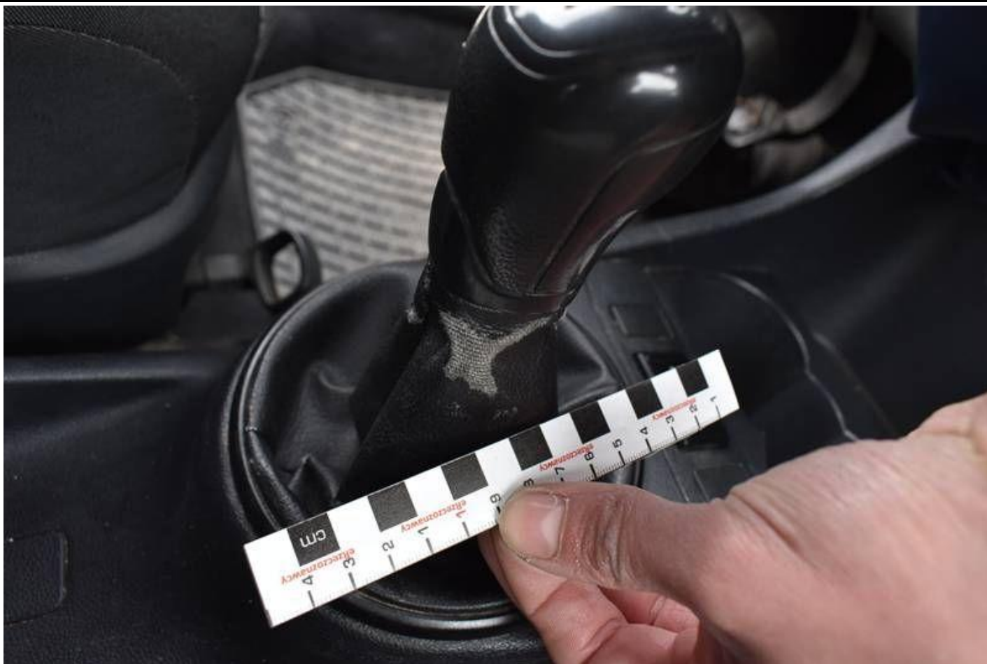
Fot. nr 105