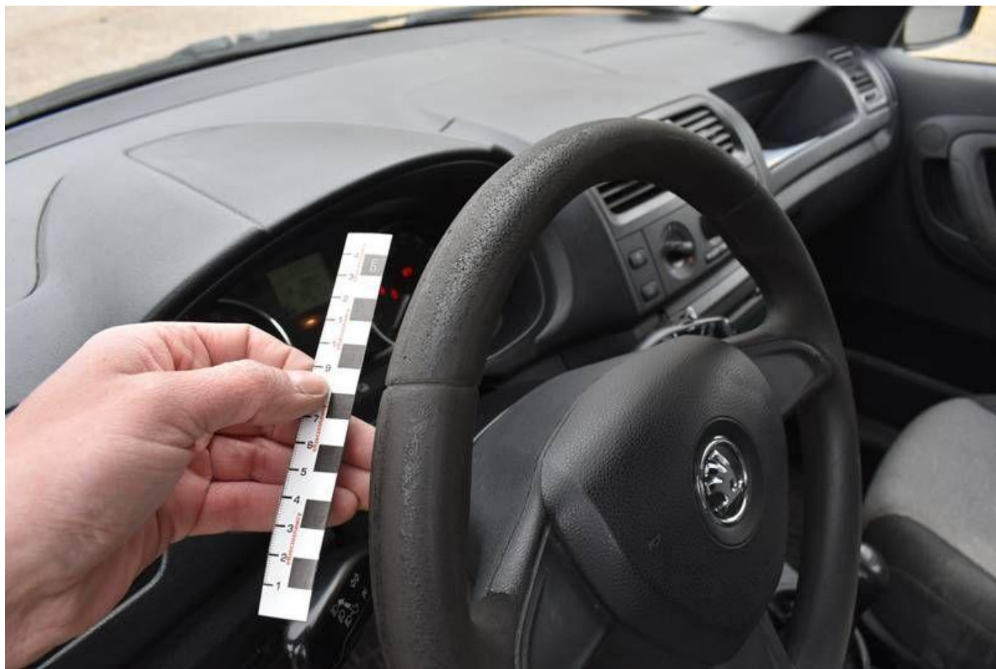
Fot. nr 102