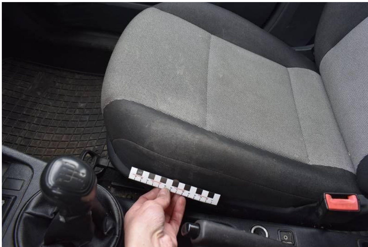
Fot. nr 104