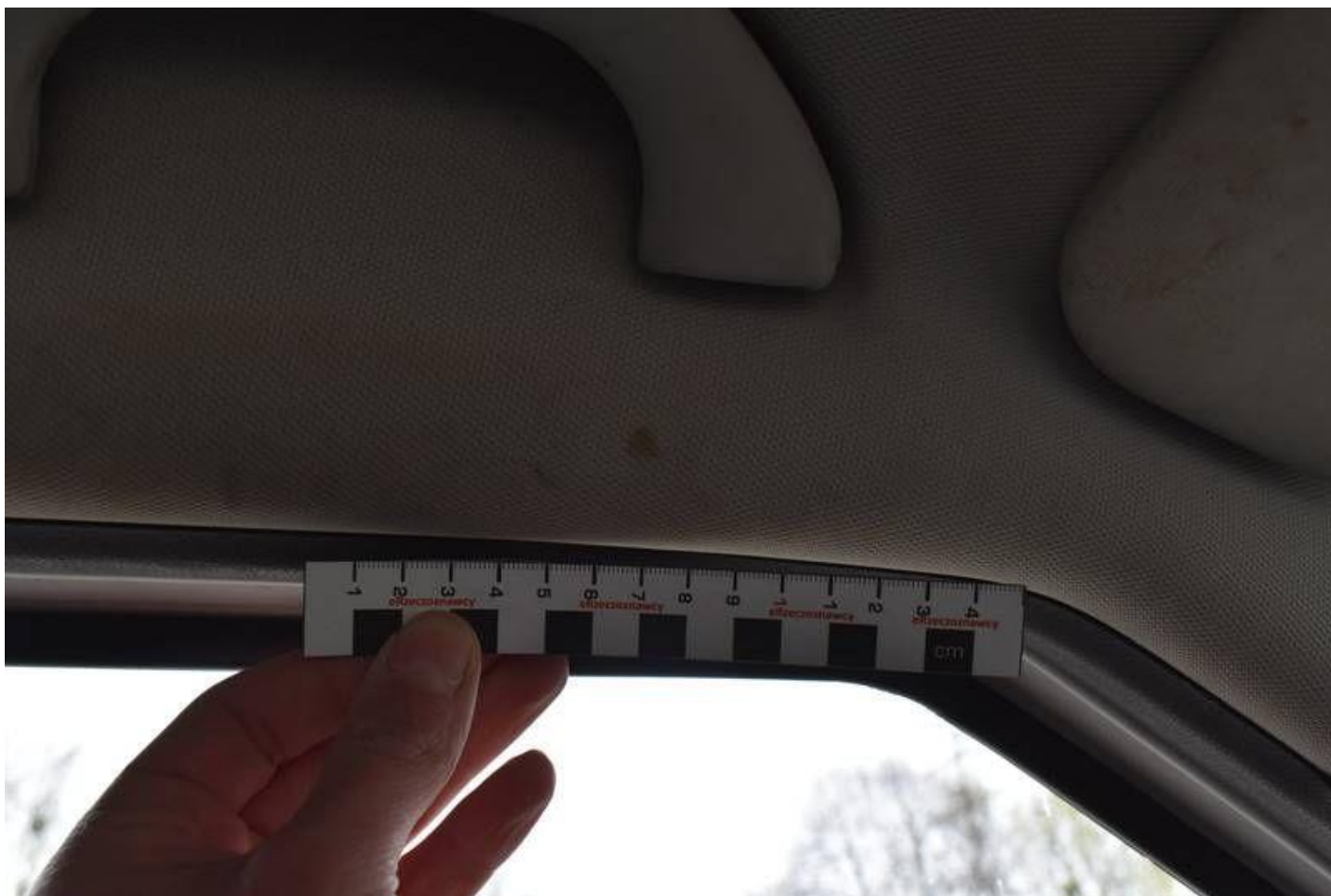
Fot. nr 96