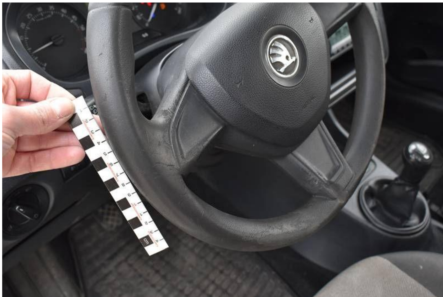
Fot. nr 92