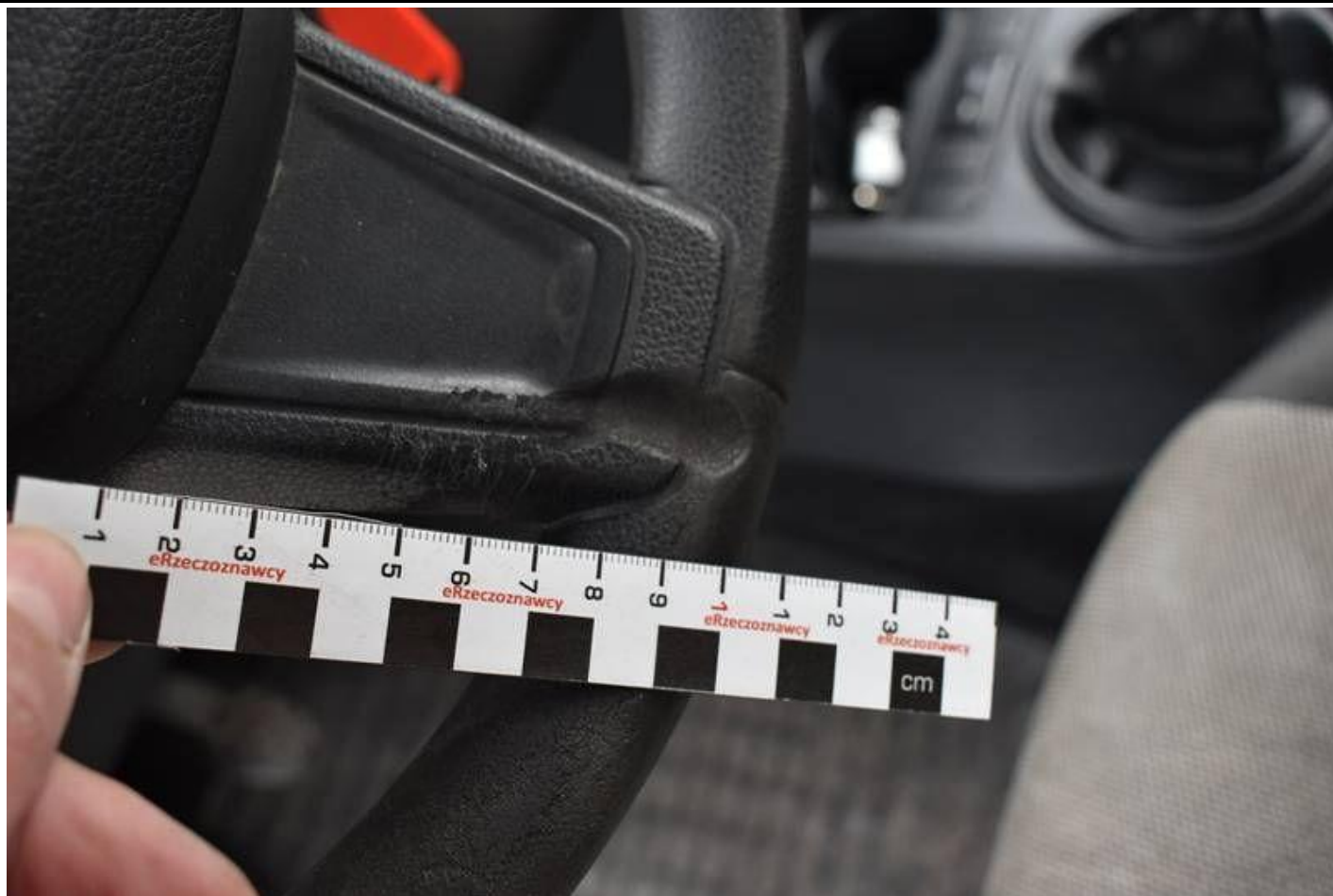
Fot. nr 91