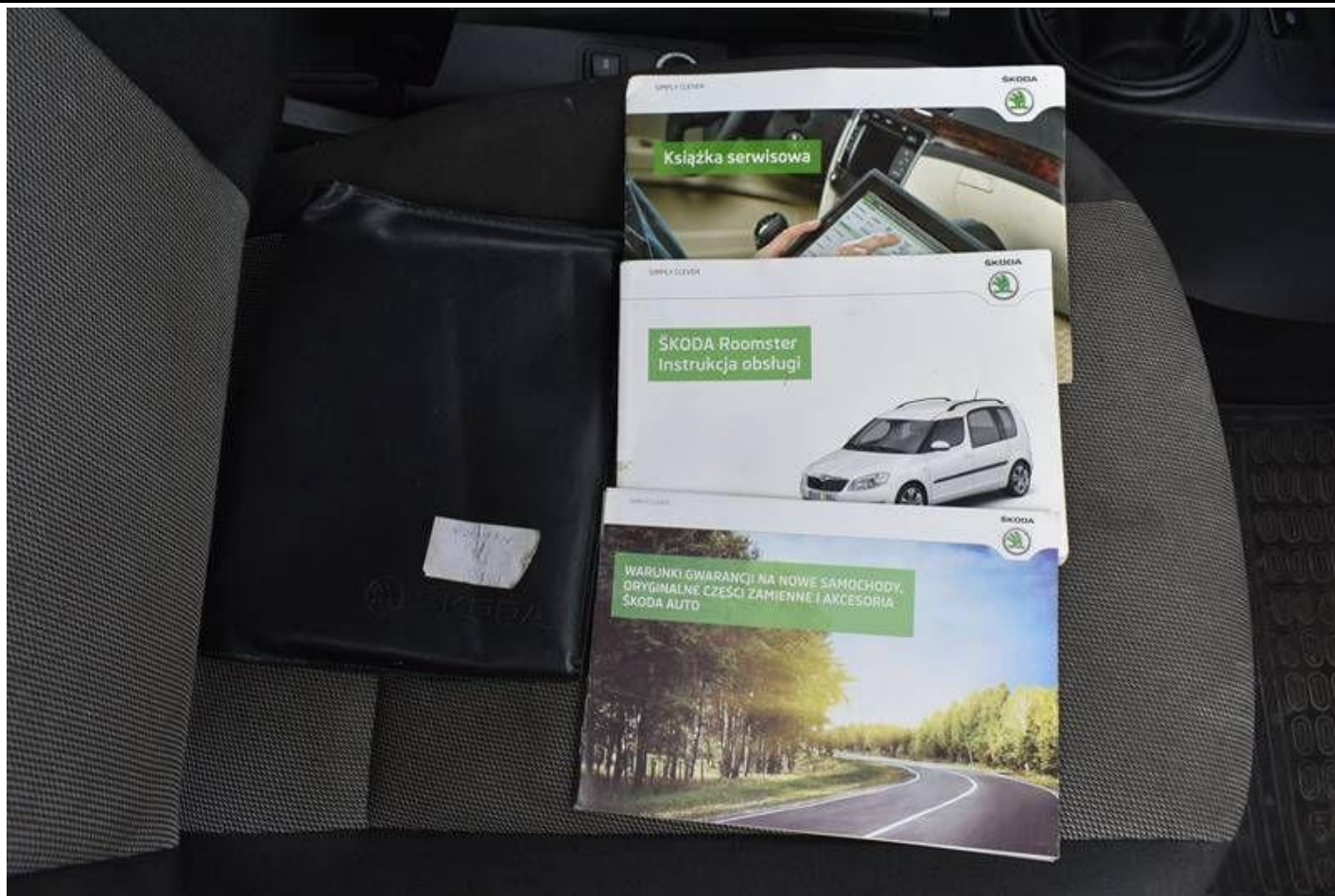
Fot. nr 101