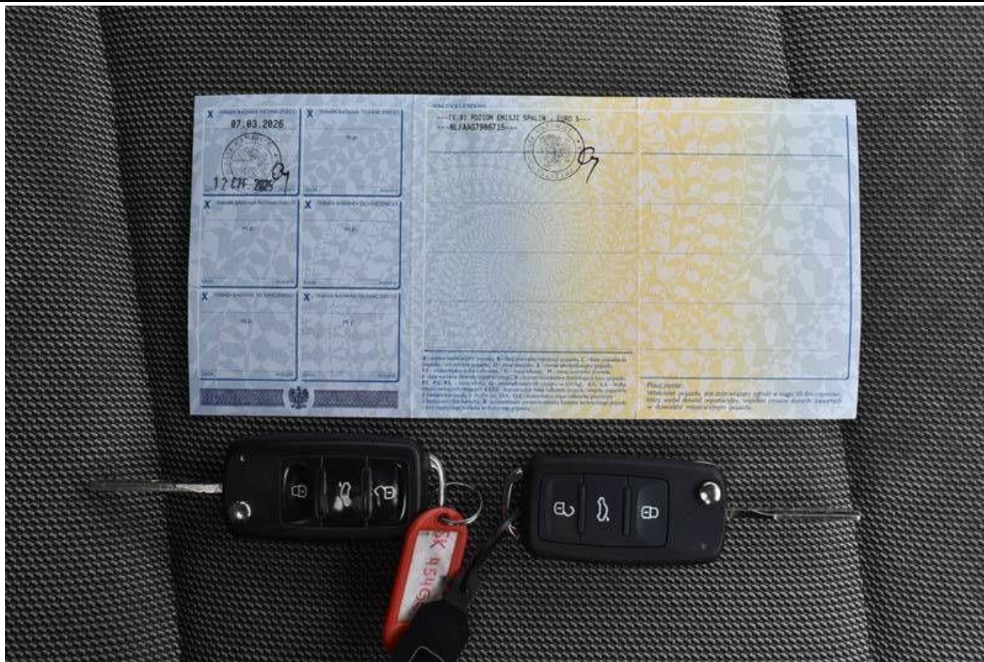
Fot. nr 103

Dokument wystawiony elektronicznie, wa ny bez podpisu