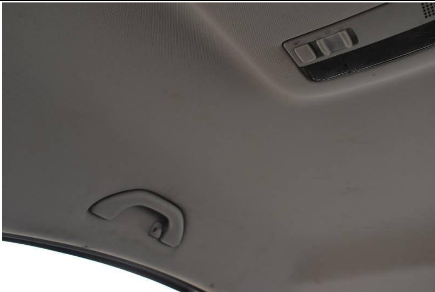
Fot. nr 97