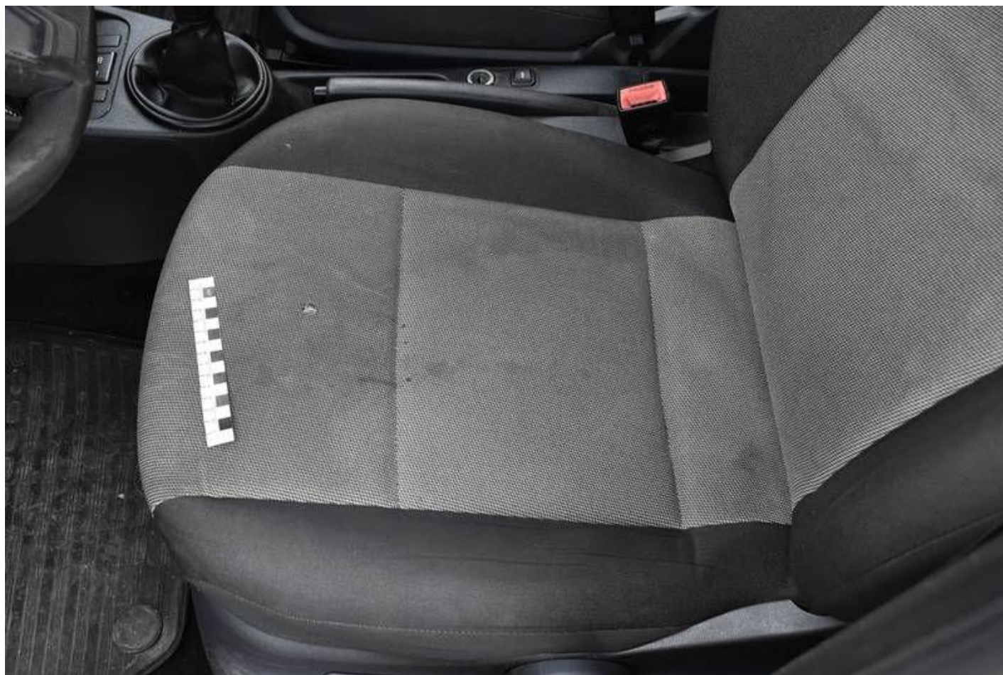
Fot. nr 88