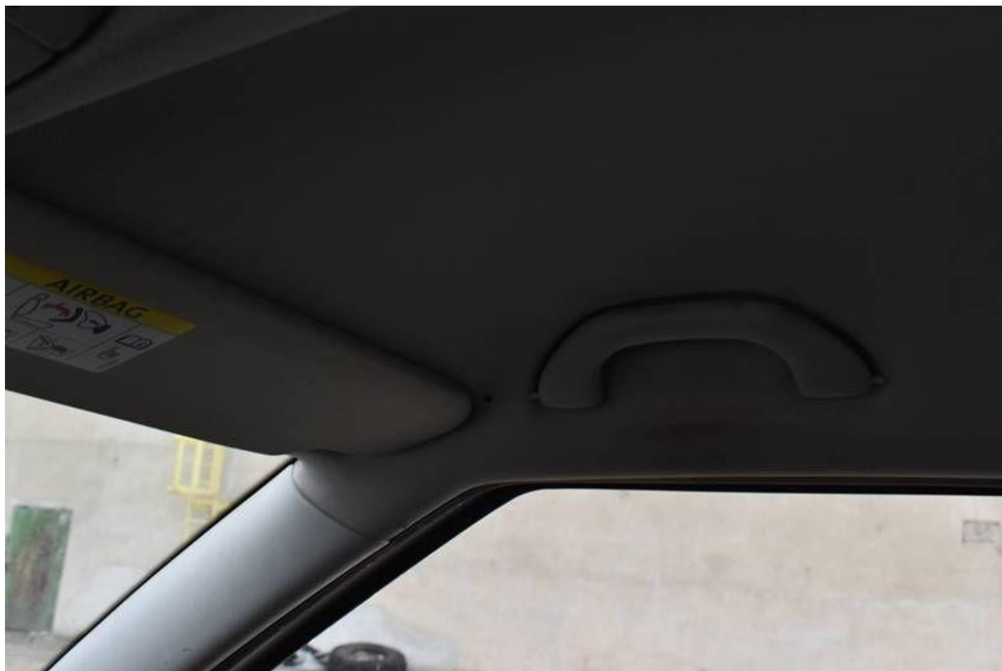
Fot. nr 98