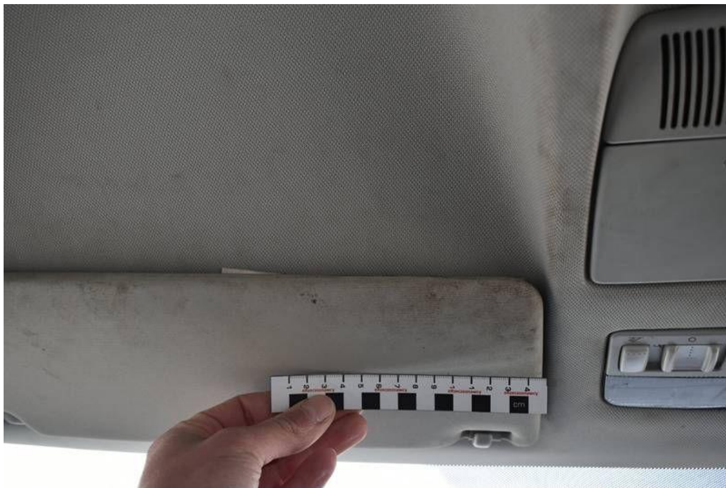
Fot. nr 94