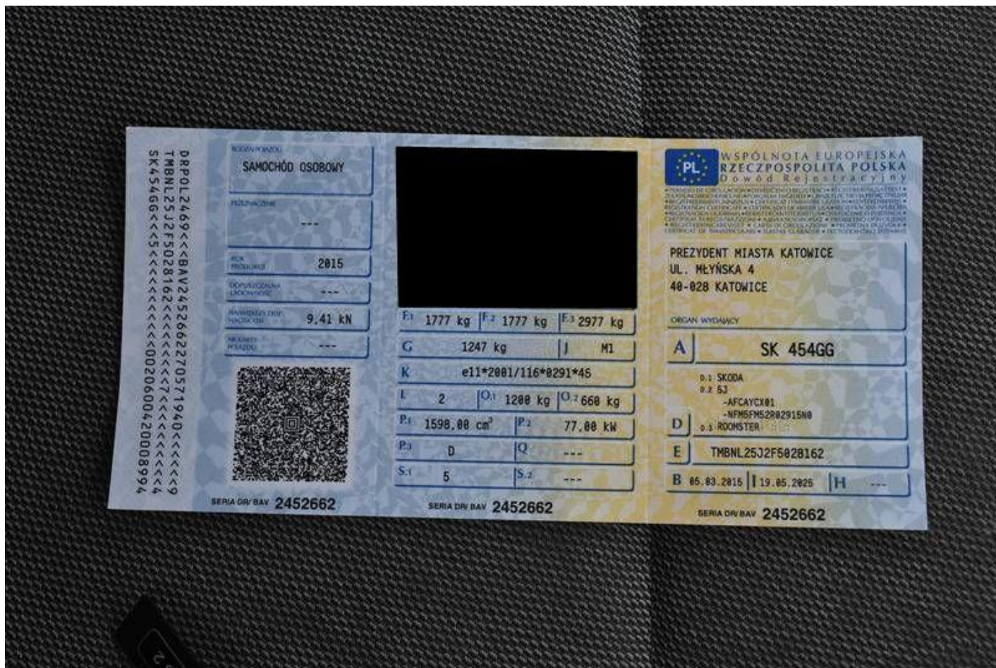
Fot. nr 102