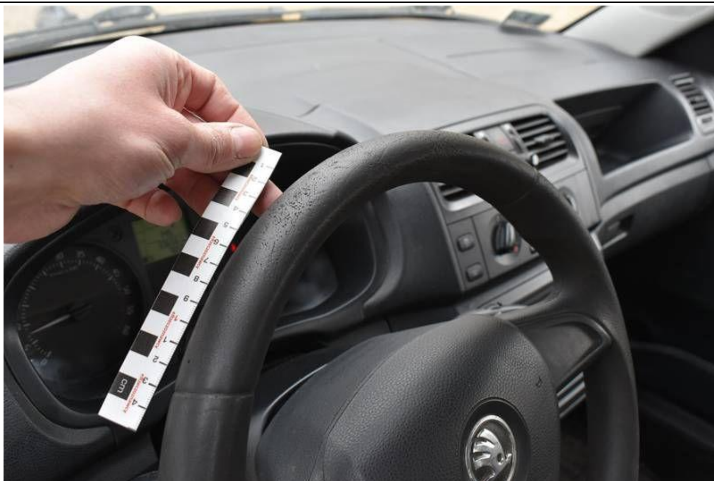
Fot. nr 93