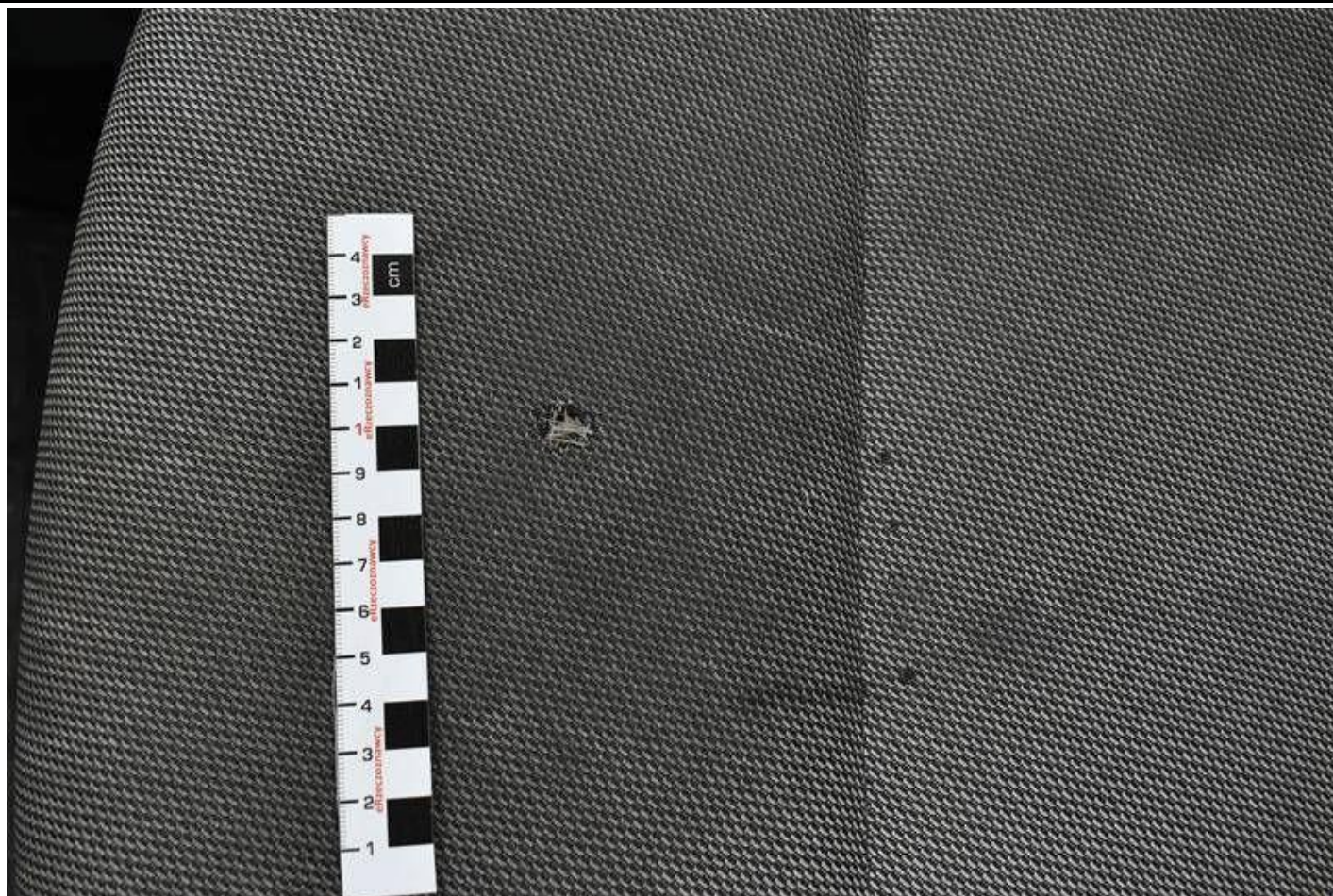
Fot. nr 89