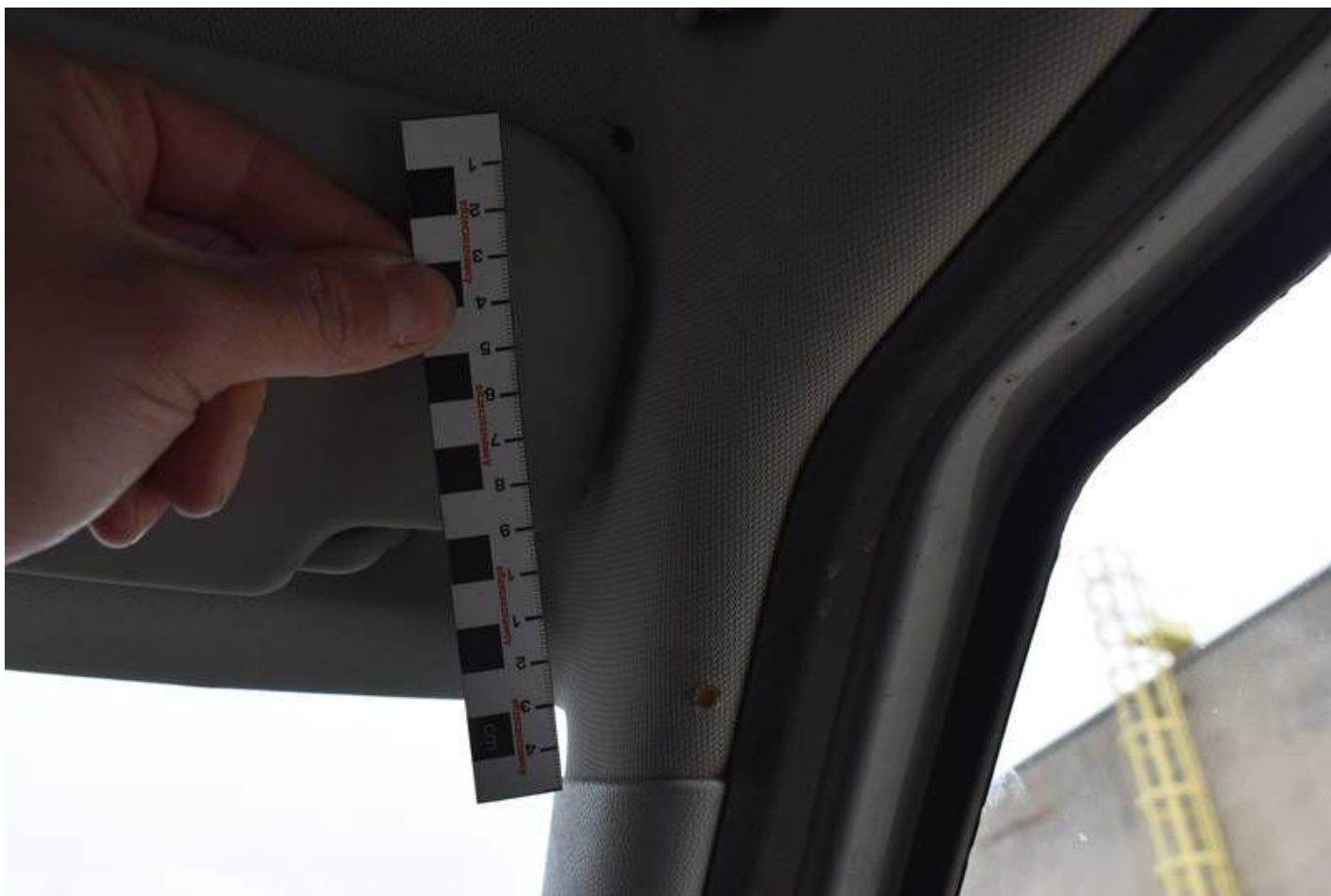
Fot. nr 100