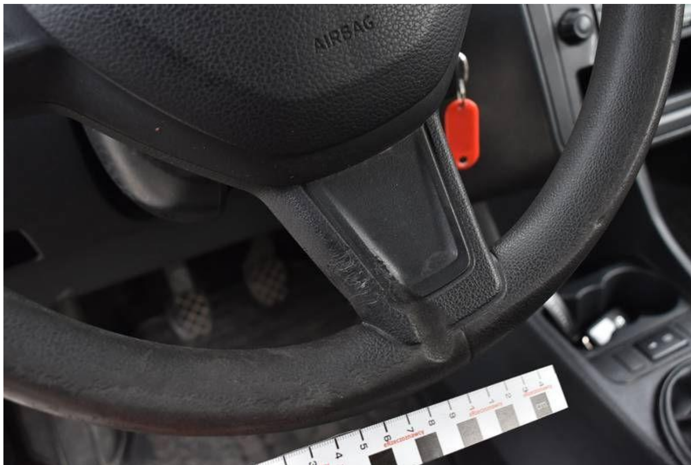
Fot. nr 90