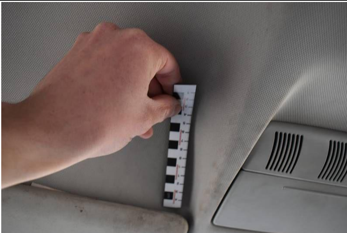
Fot. nr 95