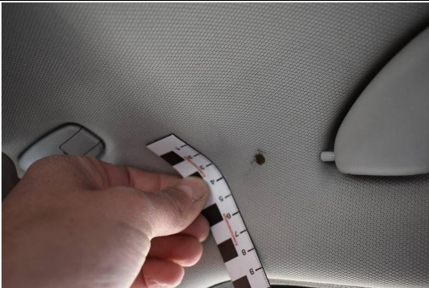
Fot. nr 99