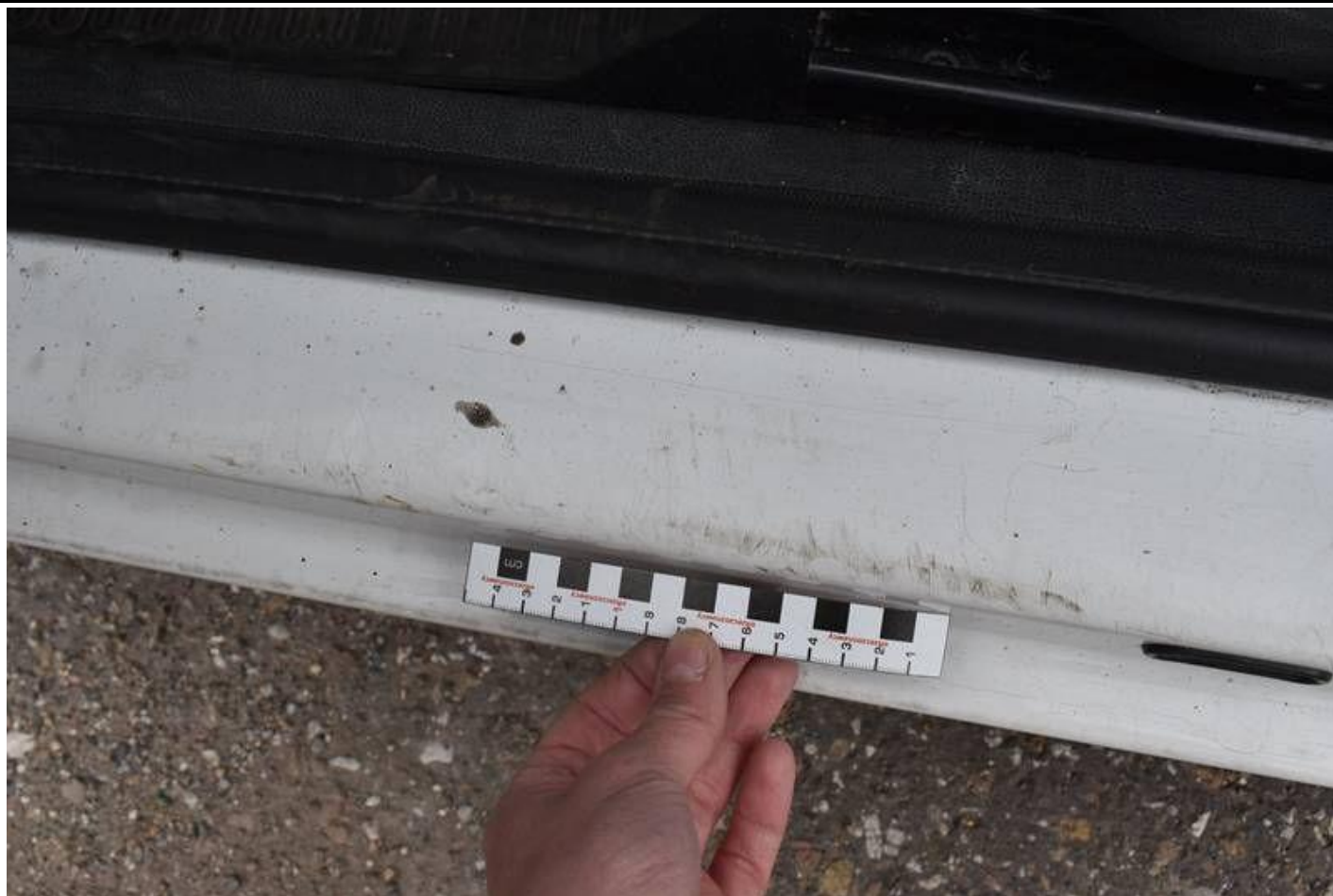
Fot. nr 87