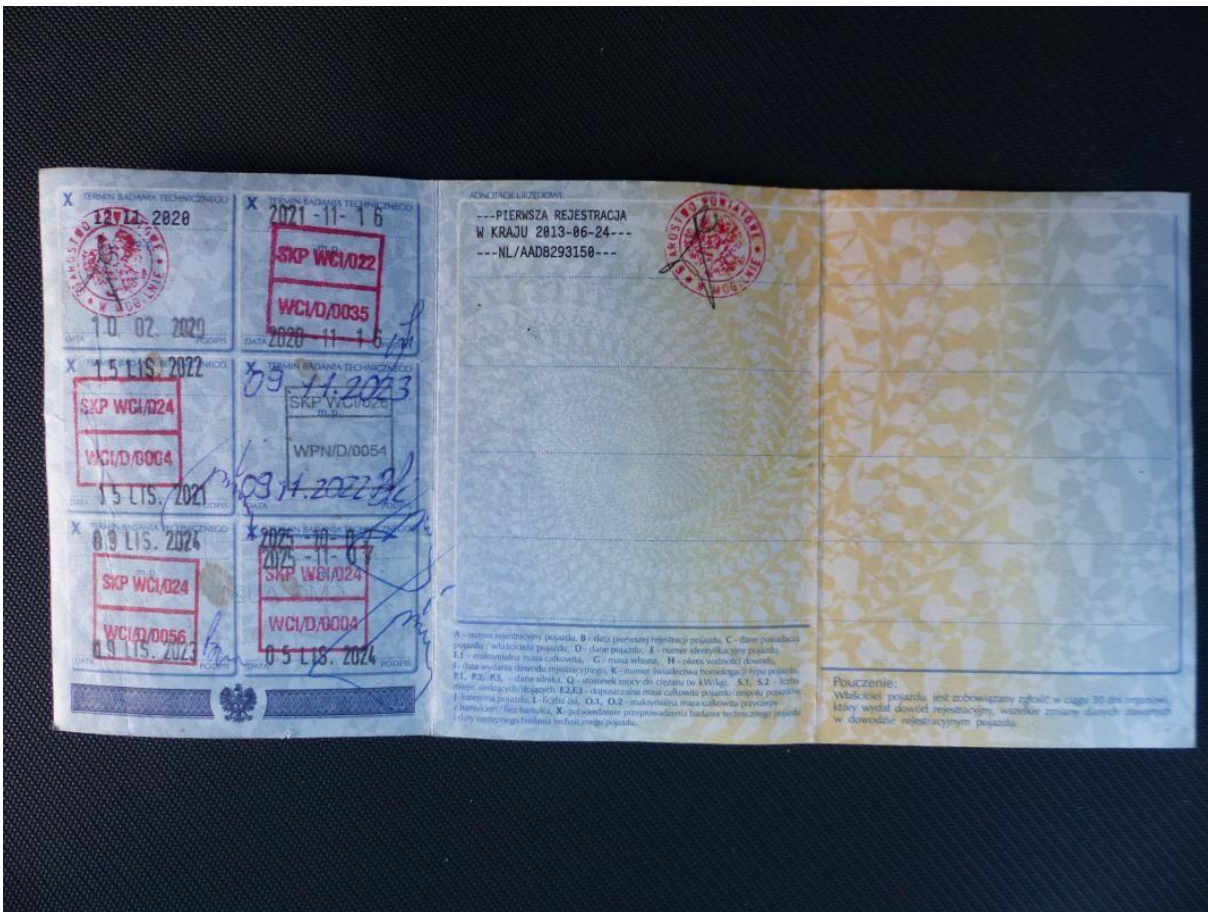
Fot. nr 78

Dokument wystawiony elektronicznie, wa ny bez podpisu