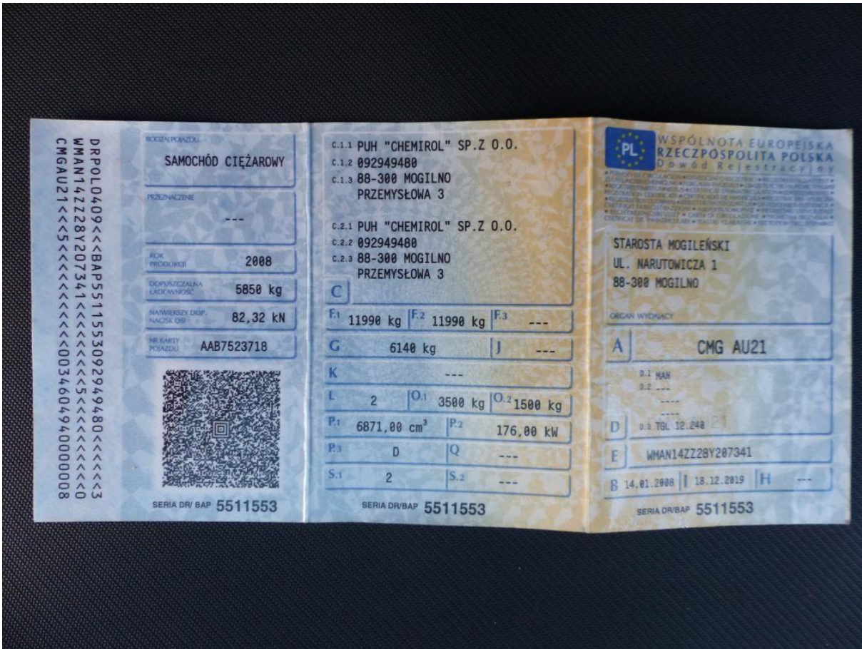
Fot. nr 77