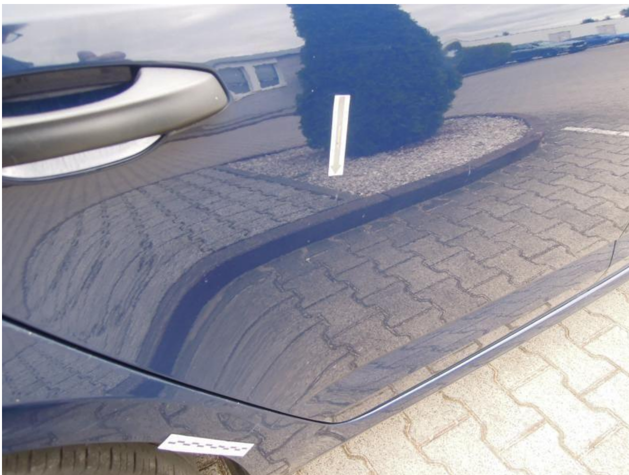
Fot. nr 92