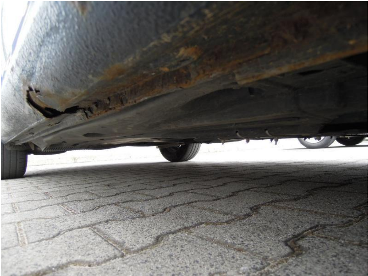
Fot. nr 109