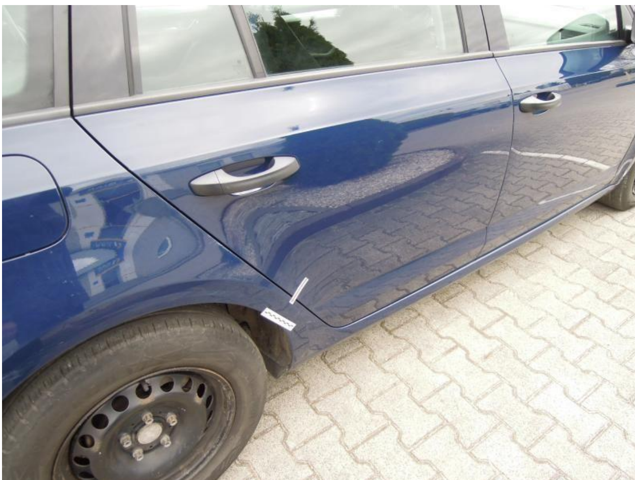
Fot. nr 90