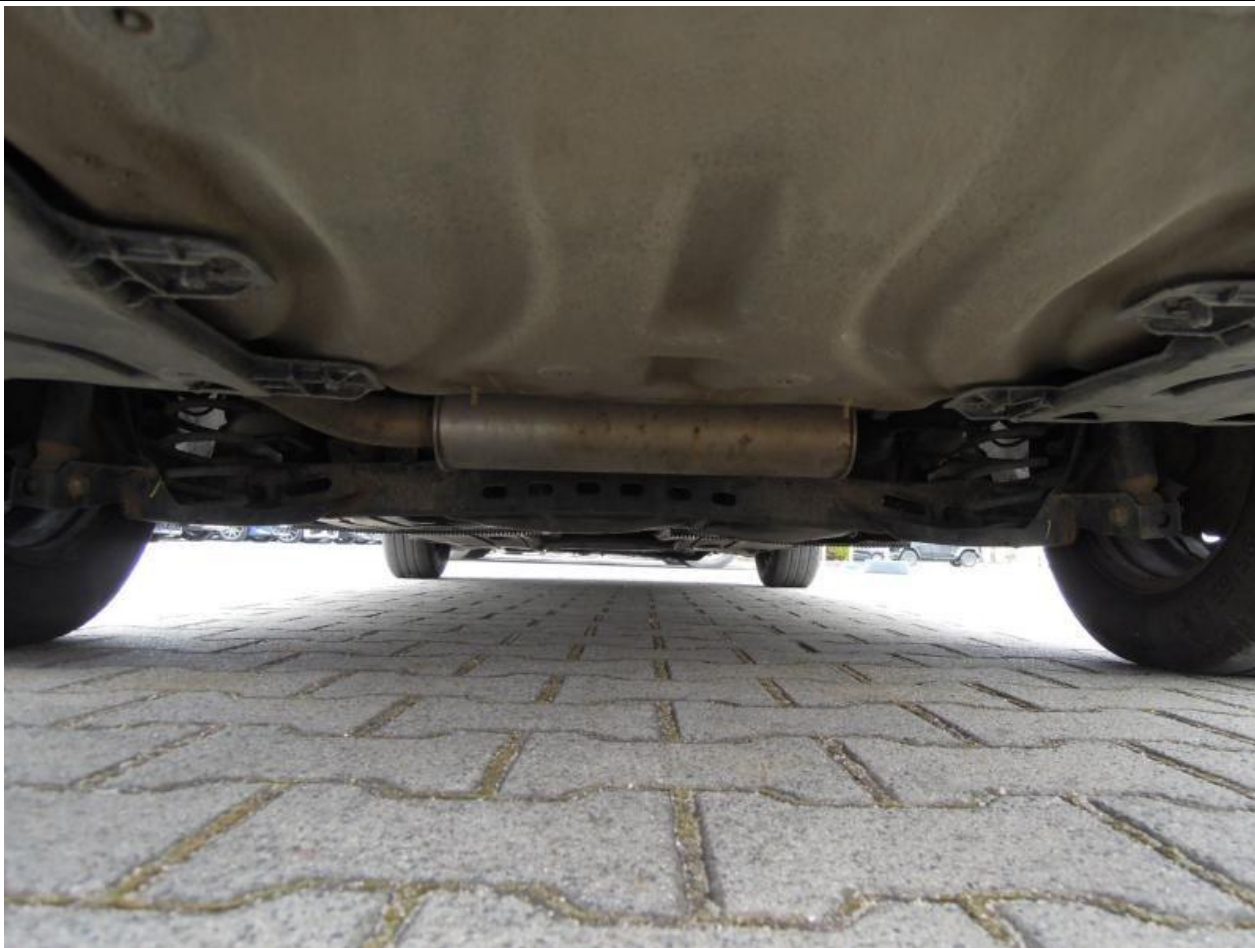
Fot. nr 111