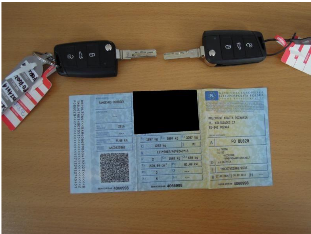
Fot. nr 114