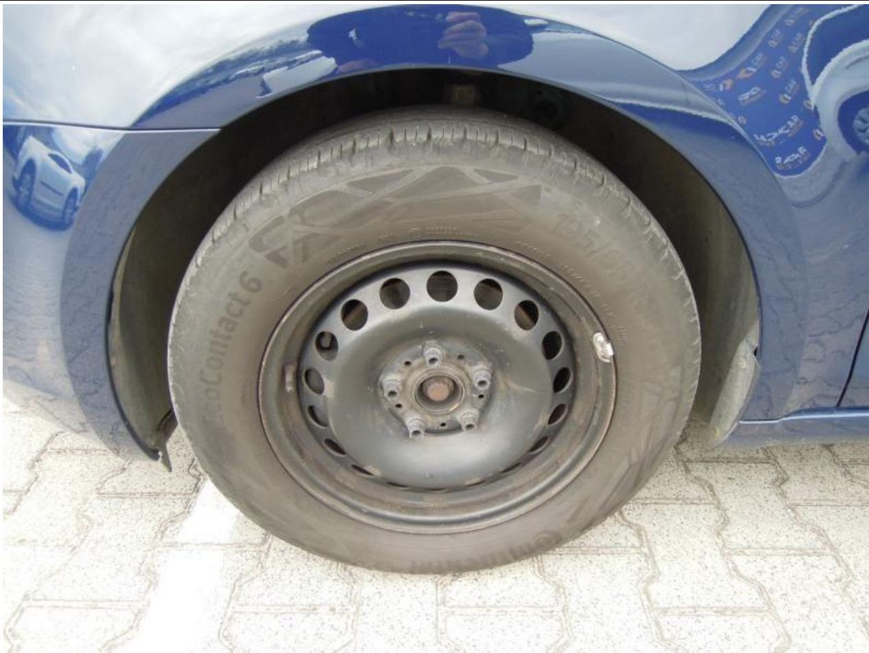
Fot. nr 101