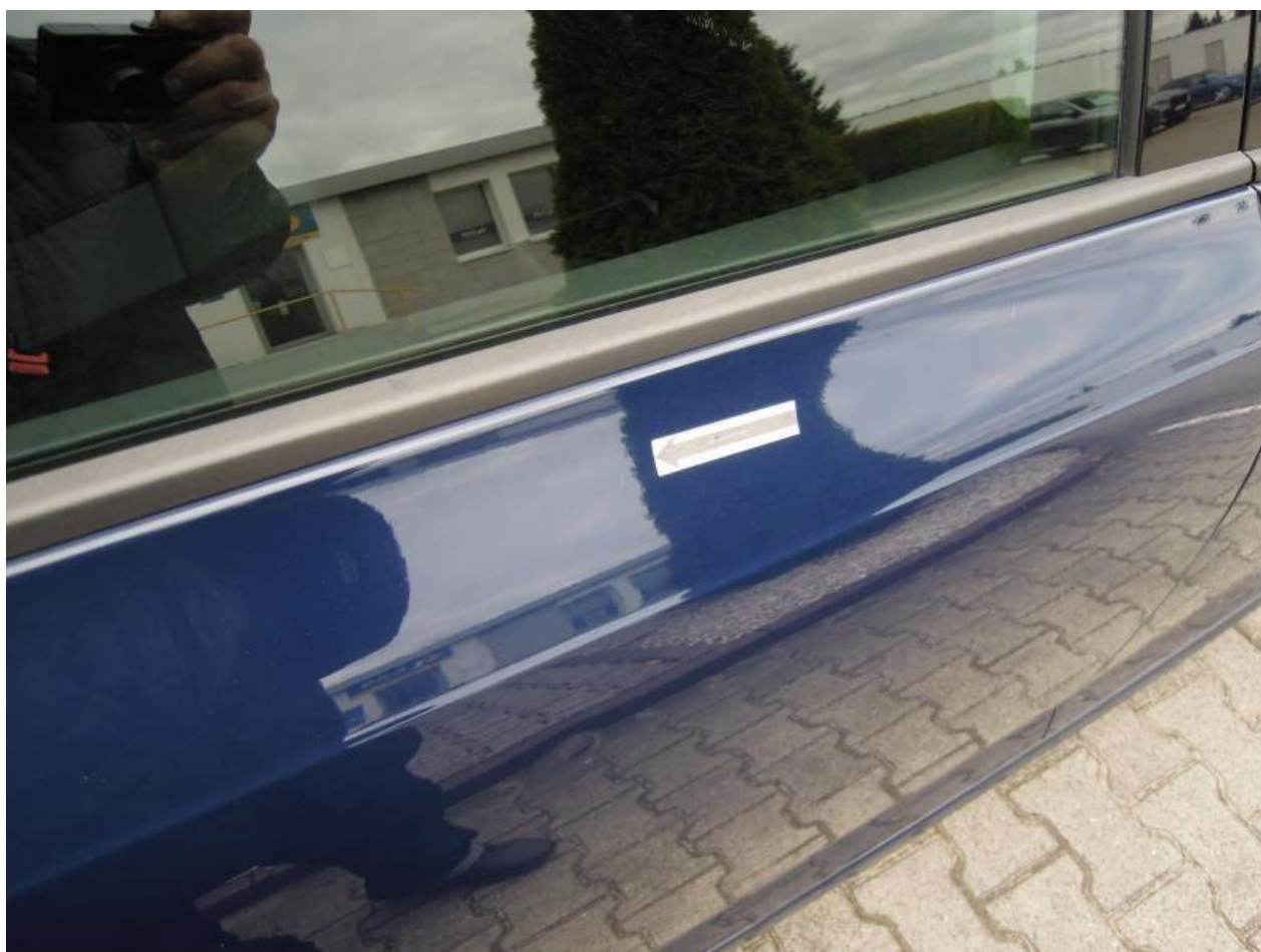
Fot. nr 88