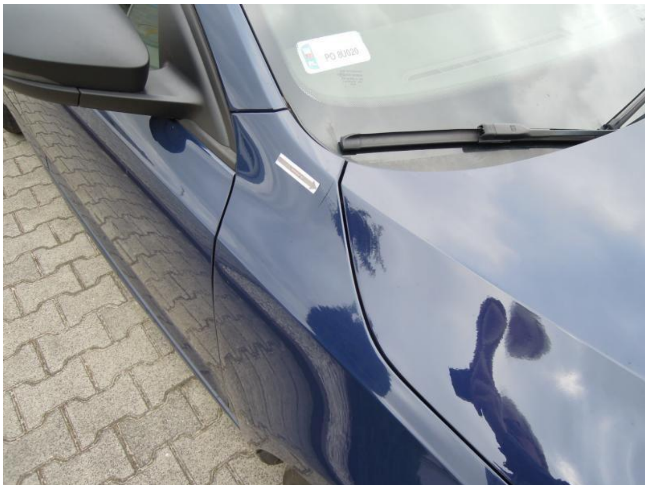
Fot. nr 82