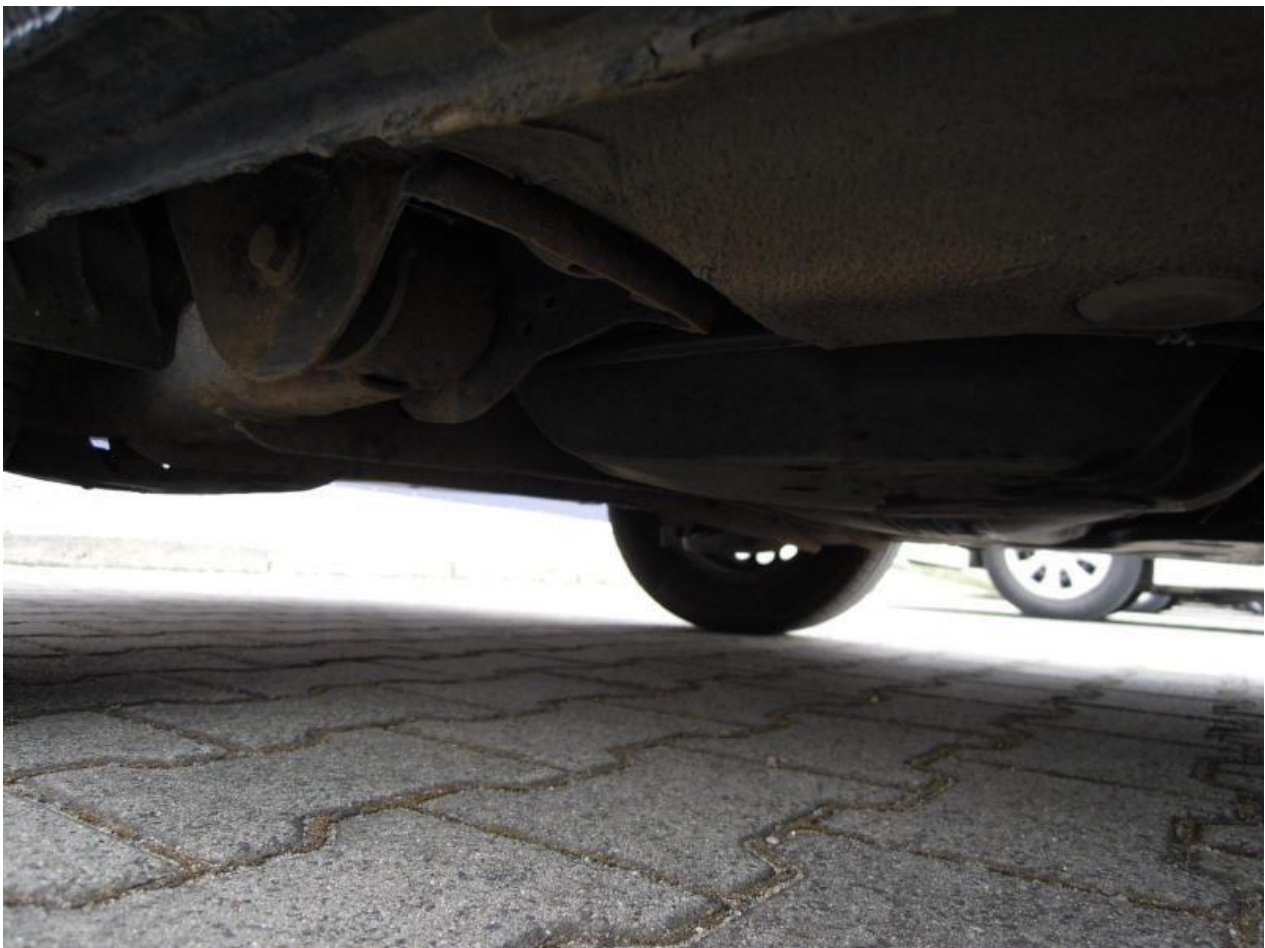
Fot. nr 110