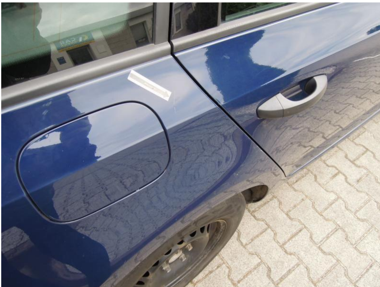
Fot. nr 100