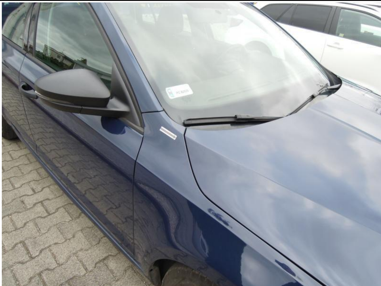
Fot. nr 81