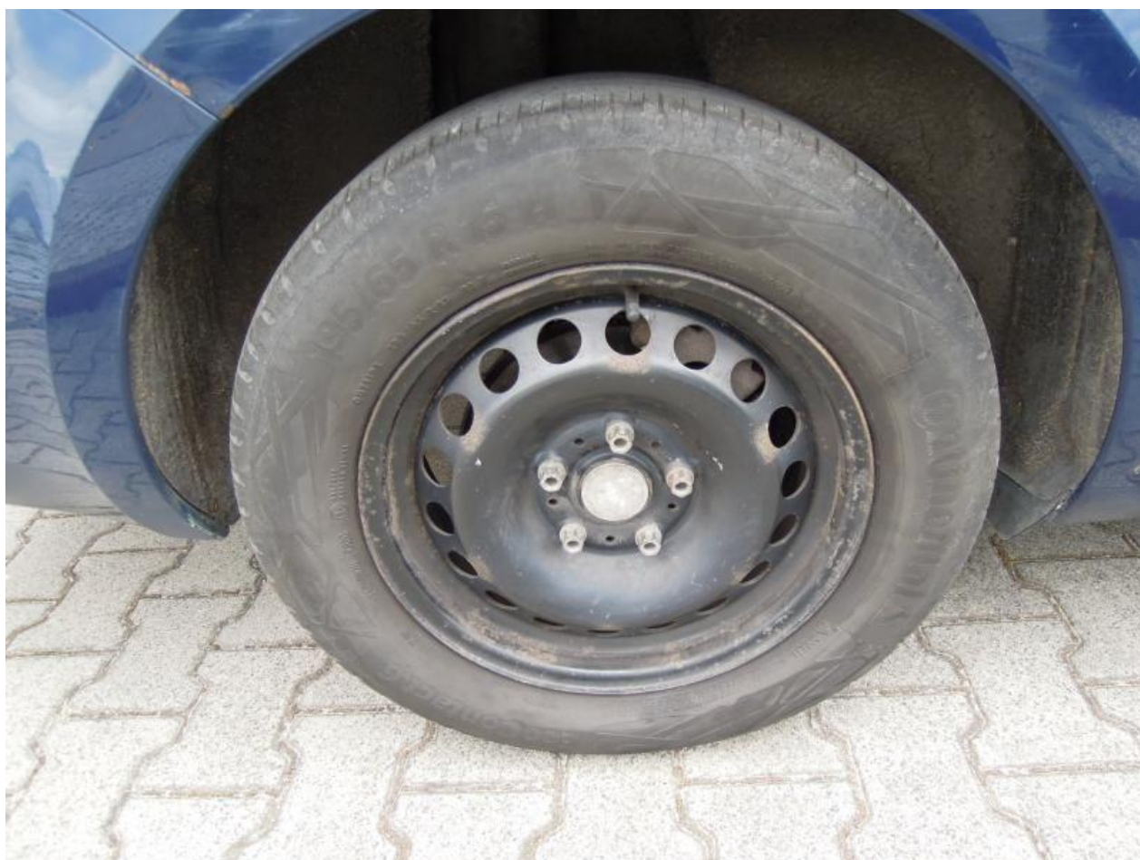
Fot. nr 104