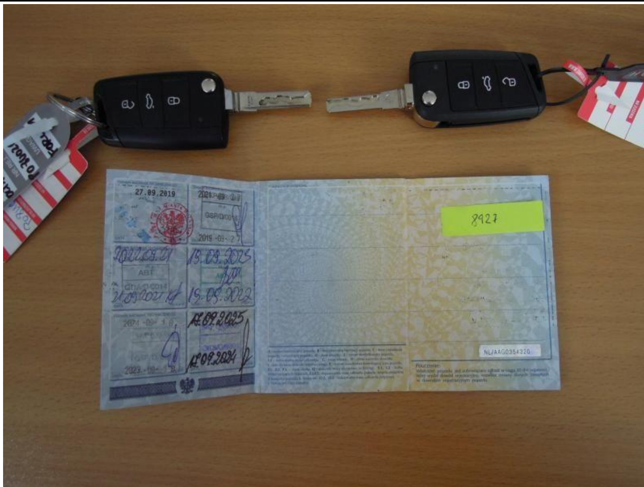
Fot. nr 115

Dokument wystawiony elektronicznie, wa ny bez podpisu