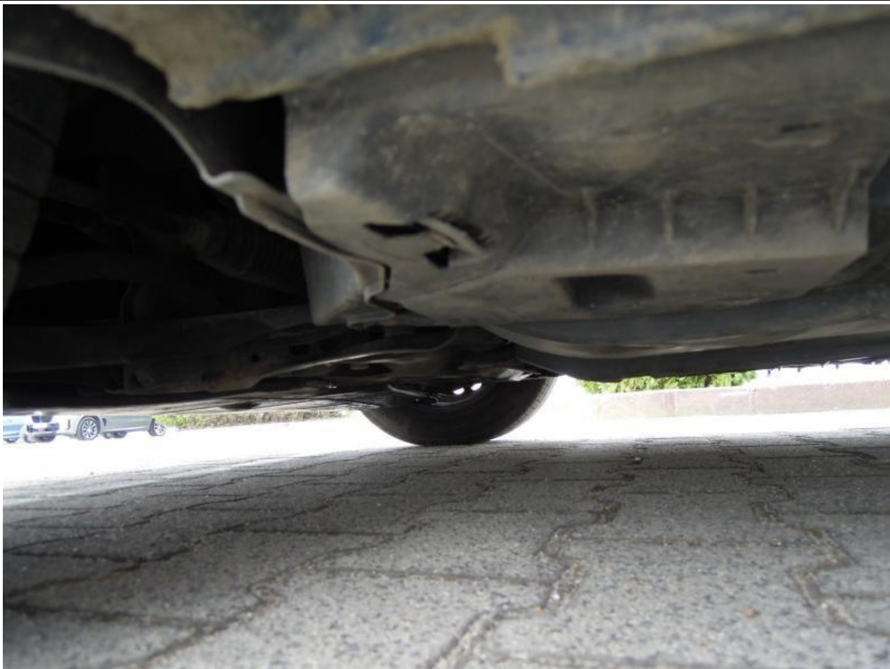
Fot. nr 105