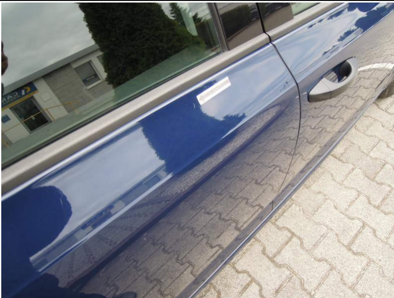
Fot. nr 89