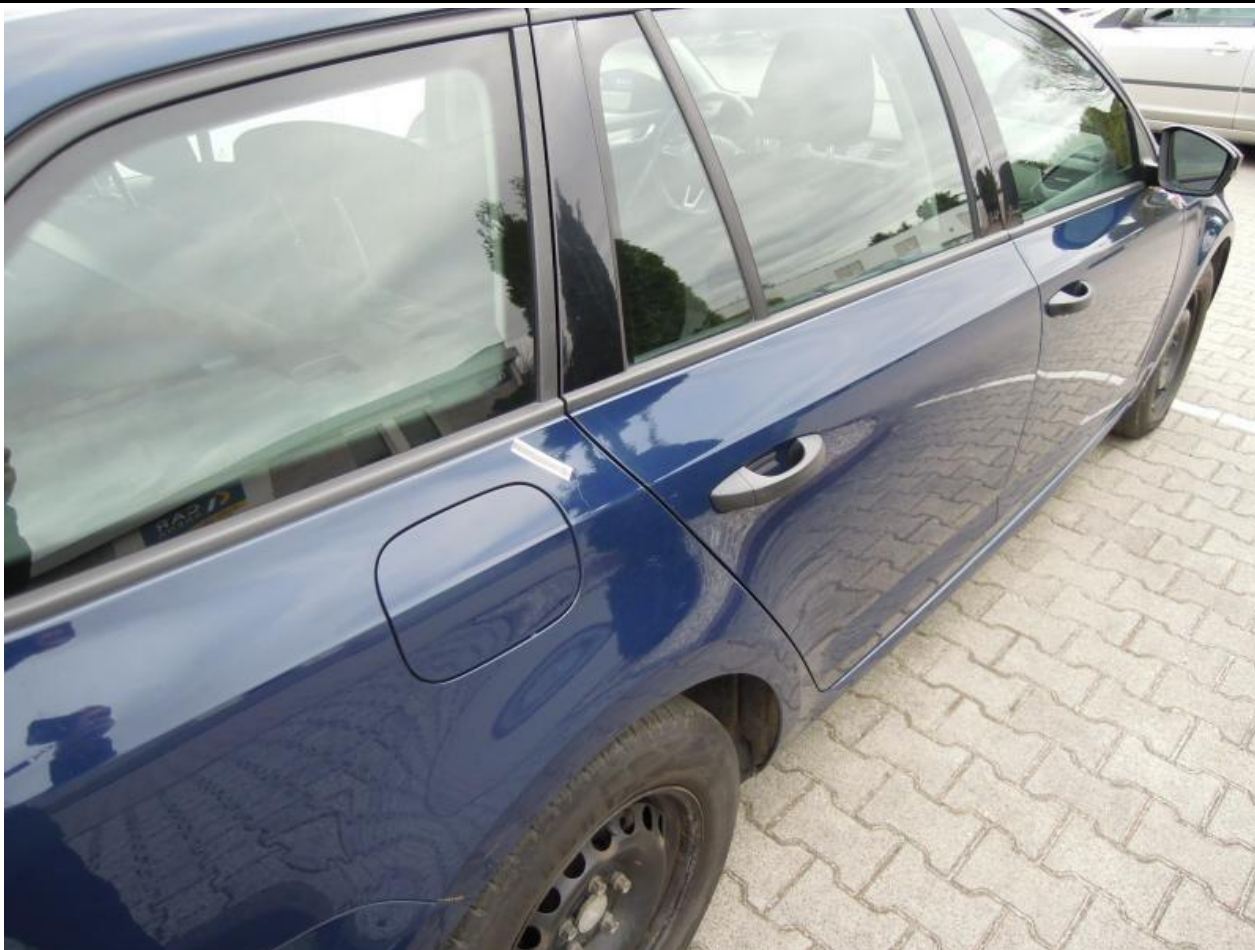
Fot. nr 99