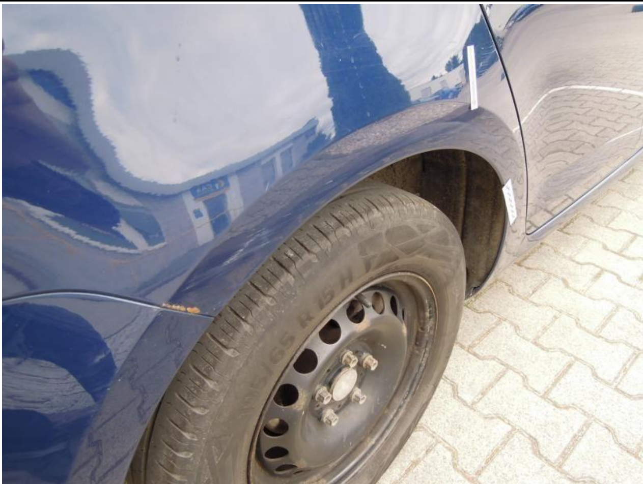
Fot. nr 95