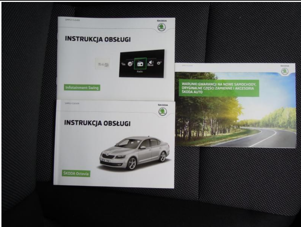
Fot. nr 113