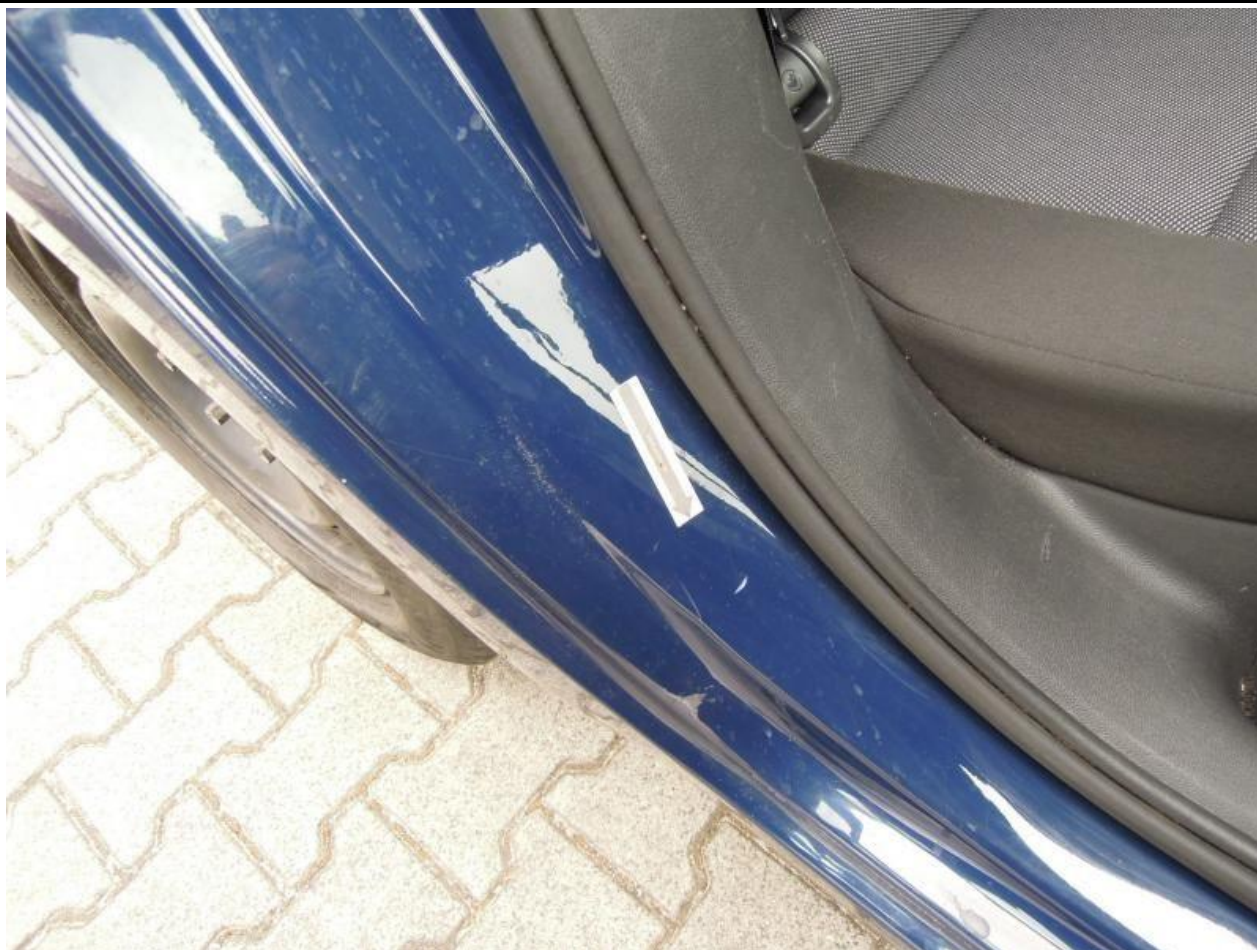
Fot. nr 97