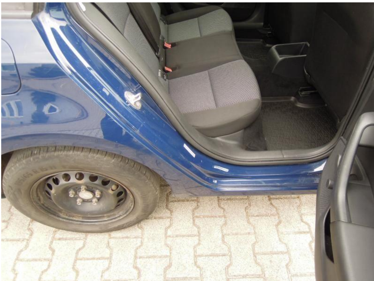
Fot. nr 96