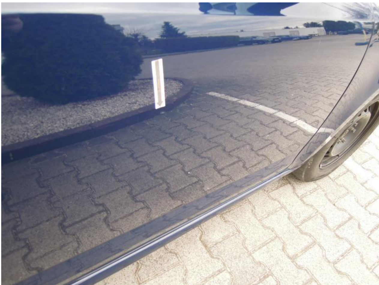
Fot. nr 84