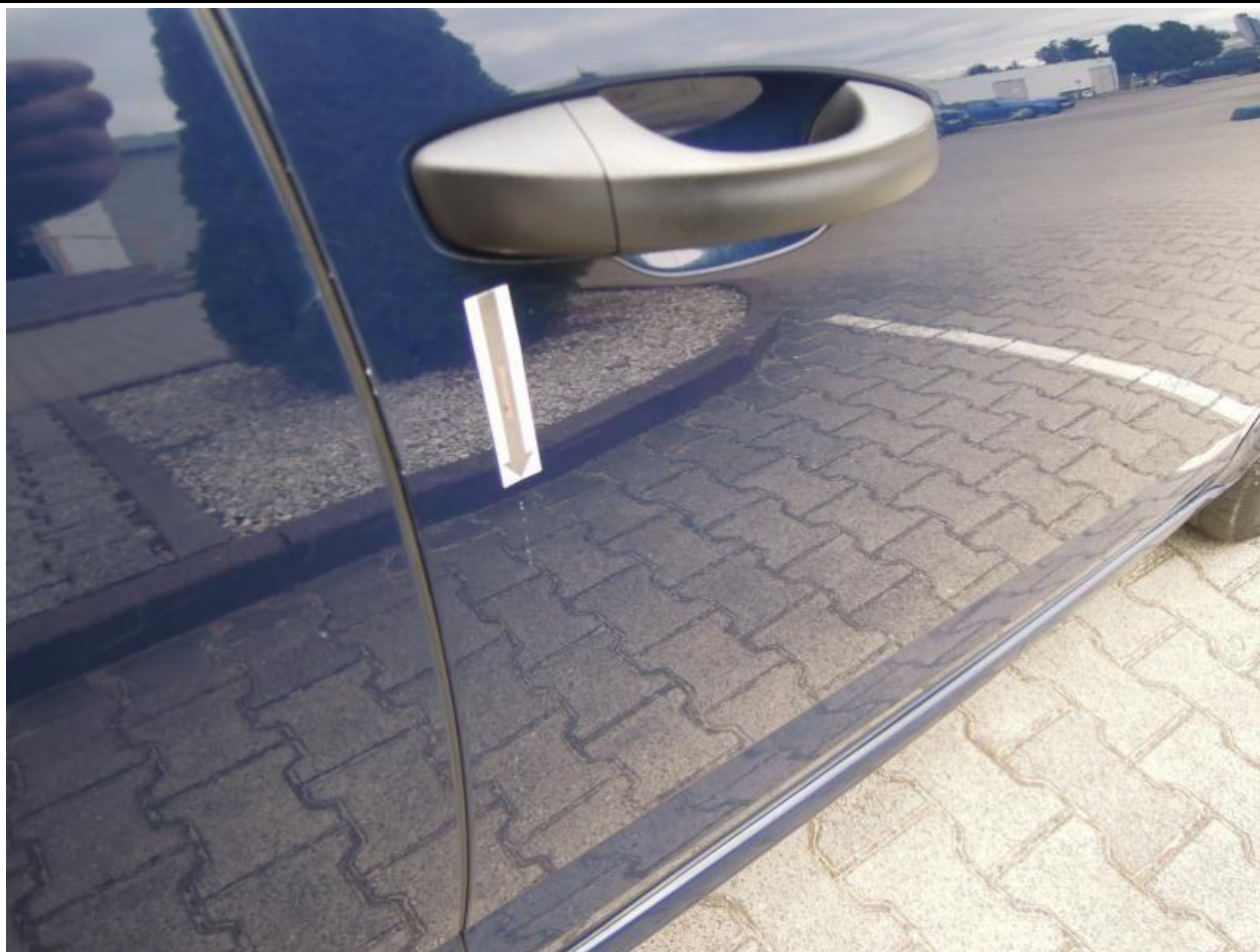
Fot. nr 85