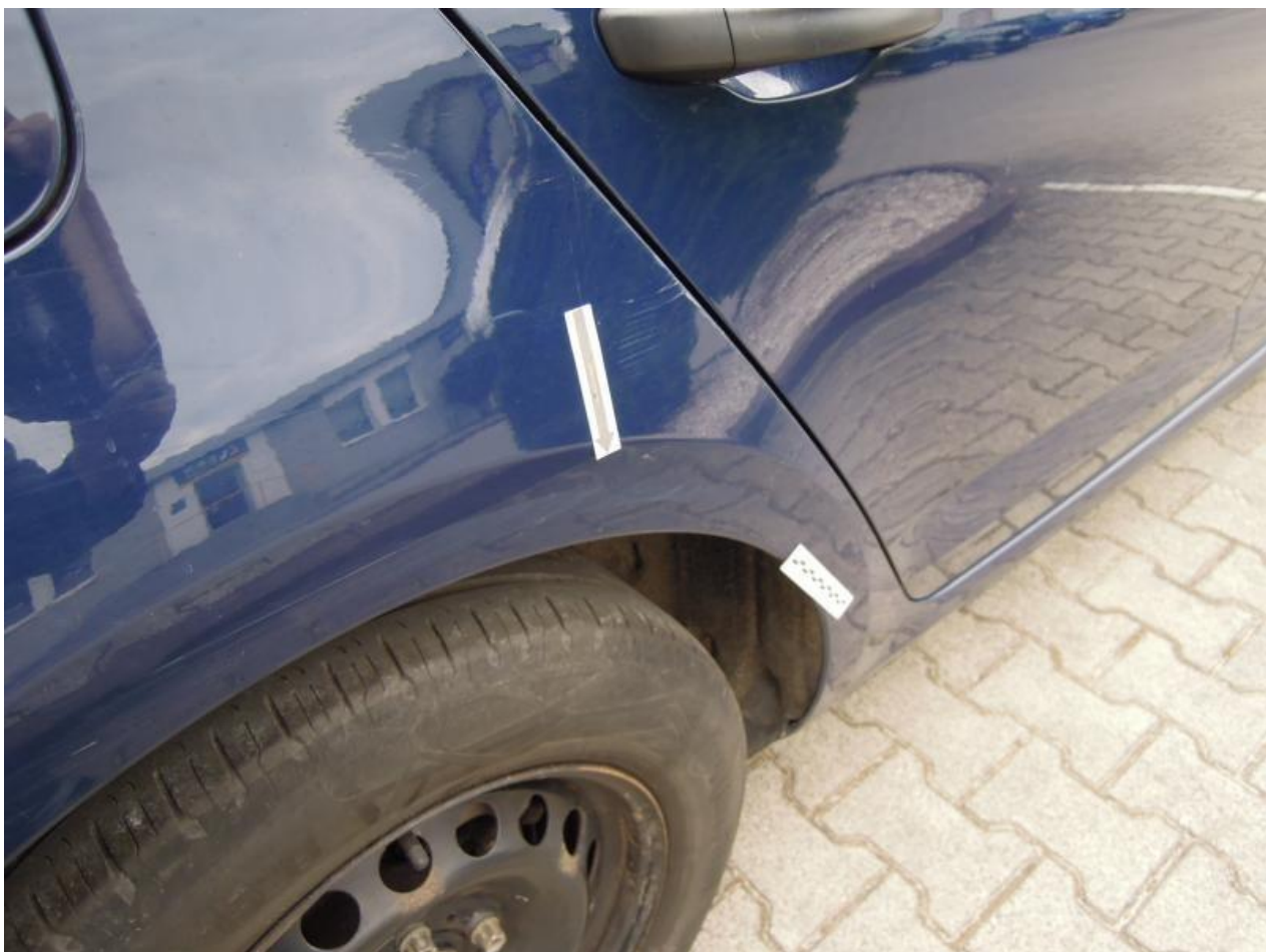
Fot. nr 94