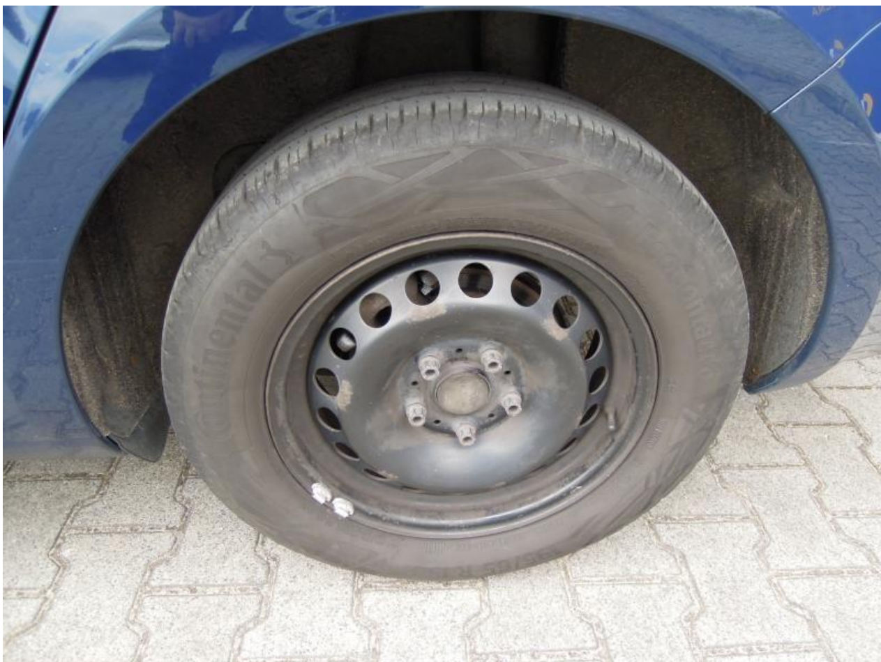
Fot. nr 102