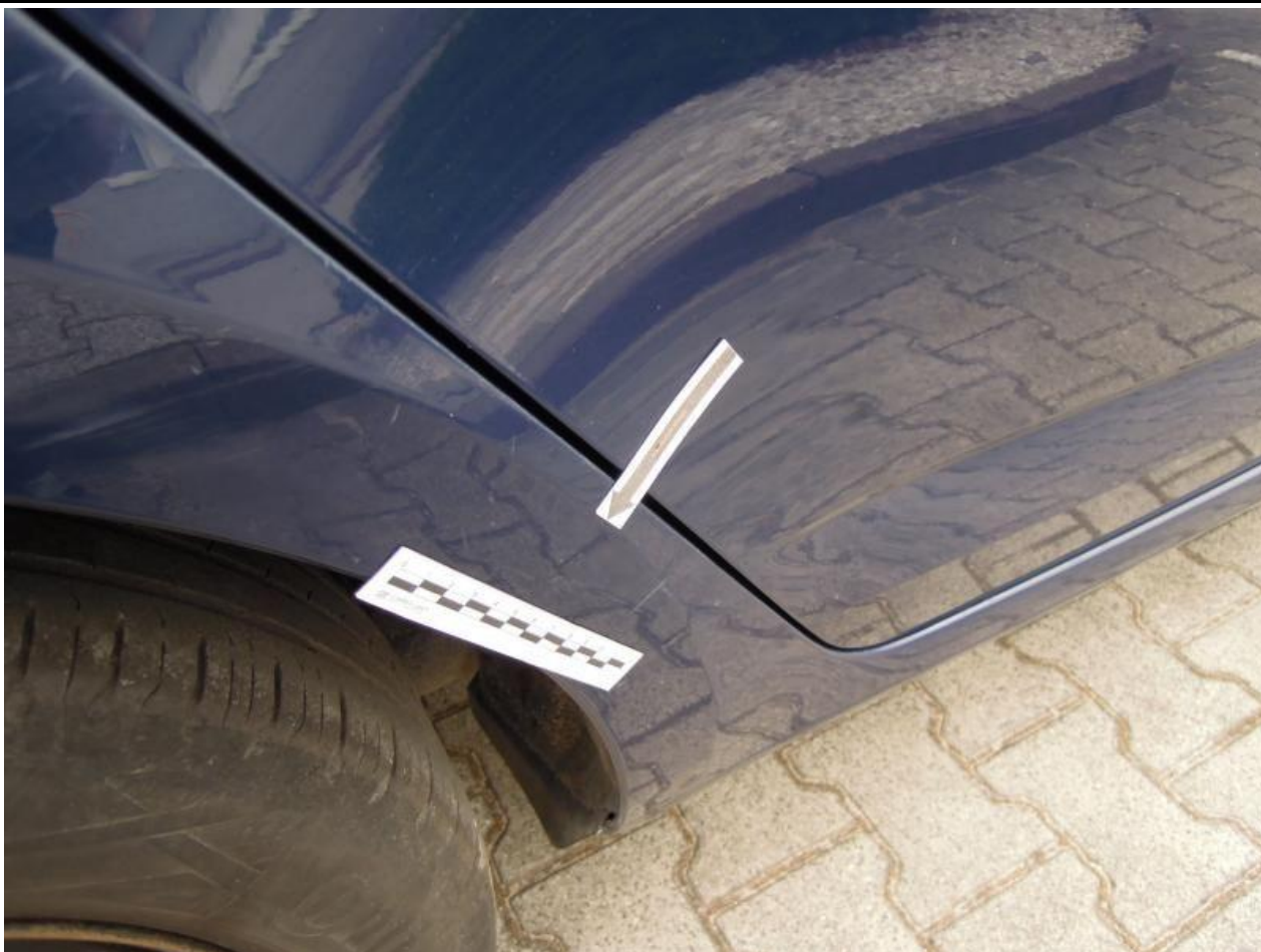
Fot. nr 91