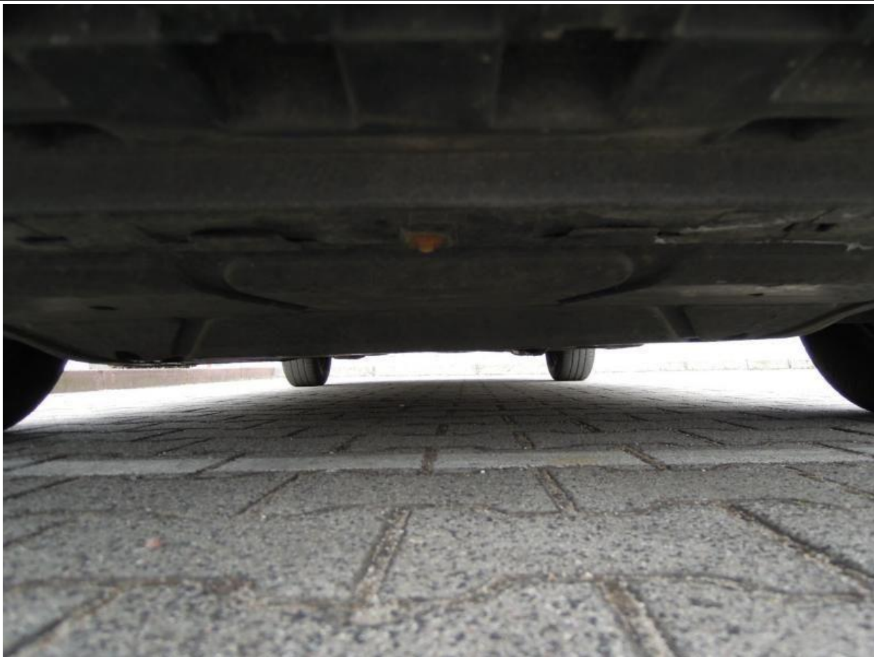
Fot. nr 107