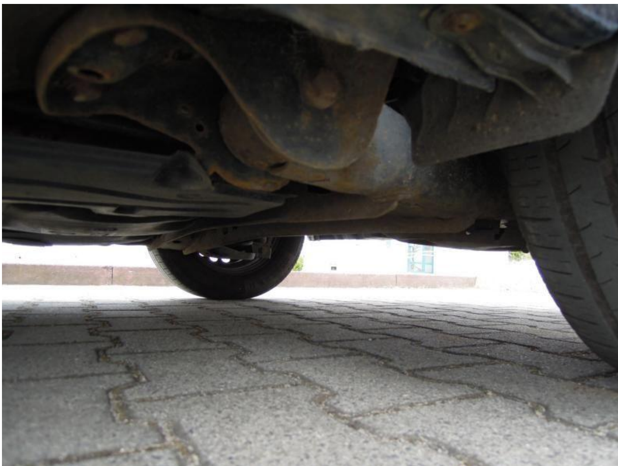
Fot. nr 112