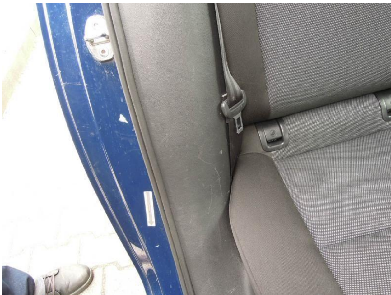
Fot. nr 98