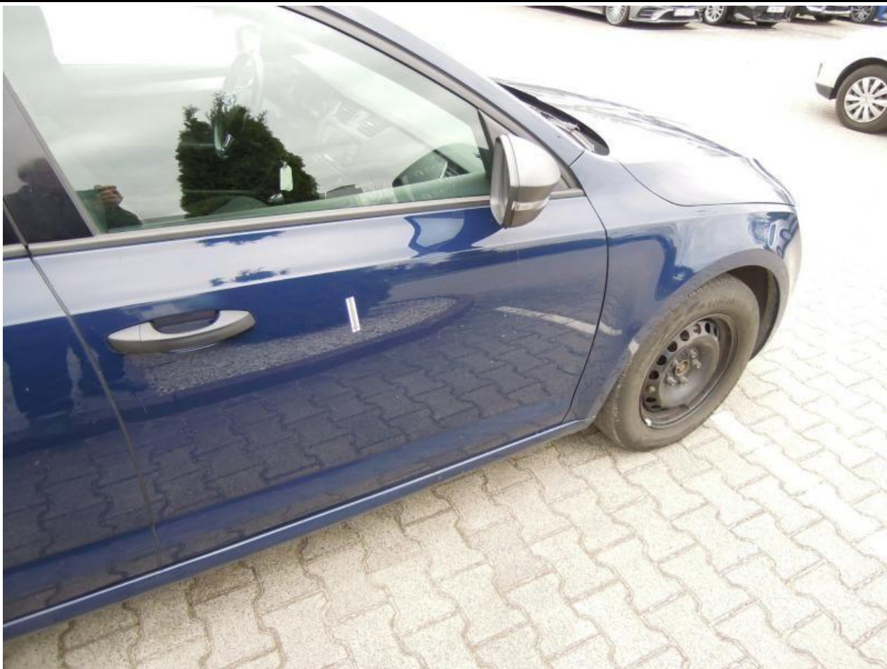
Fot. nr 83