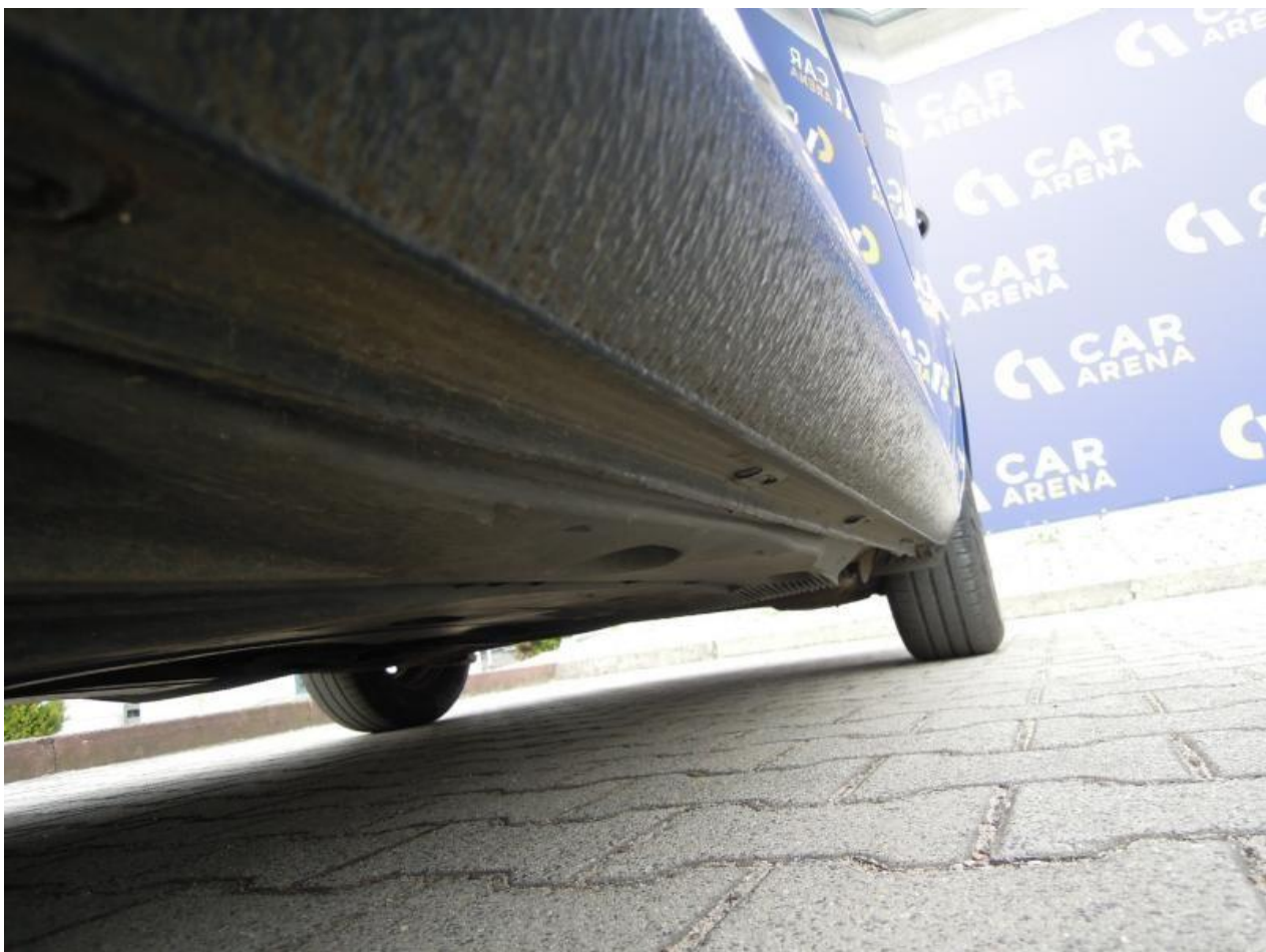
Fot. nr 106