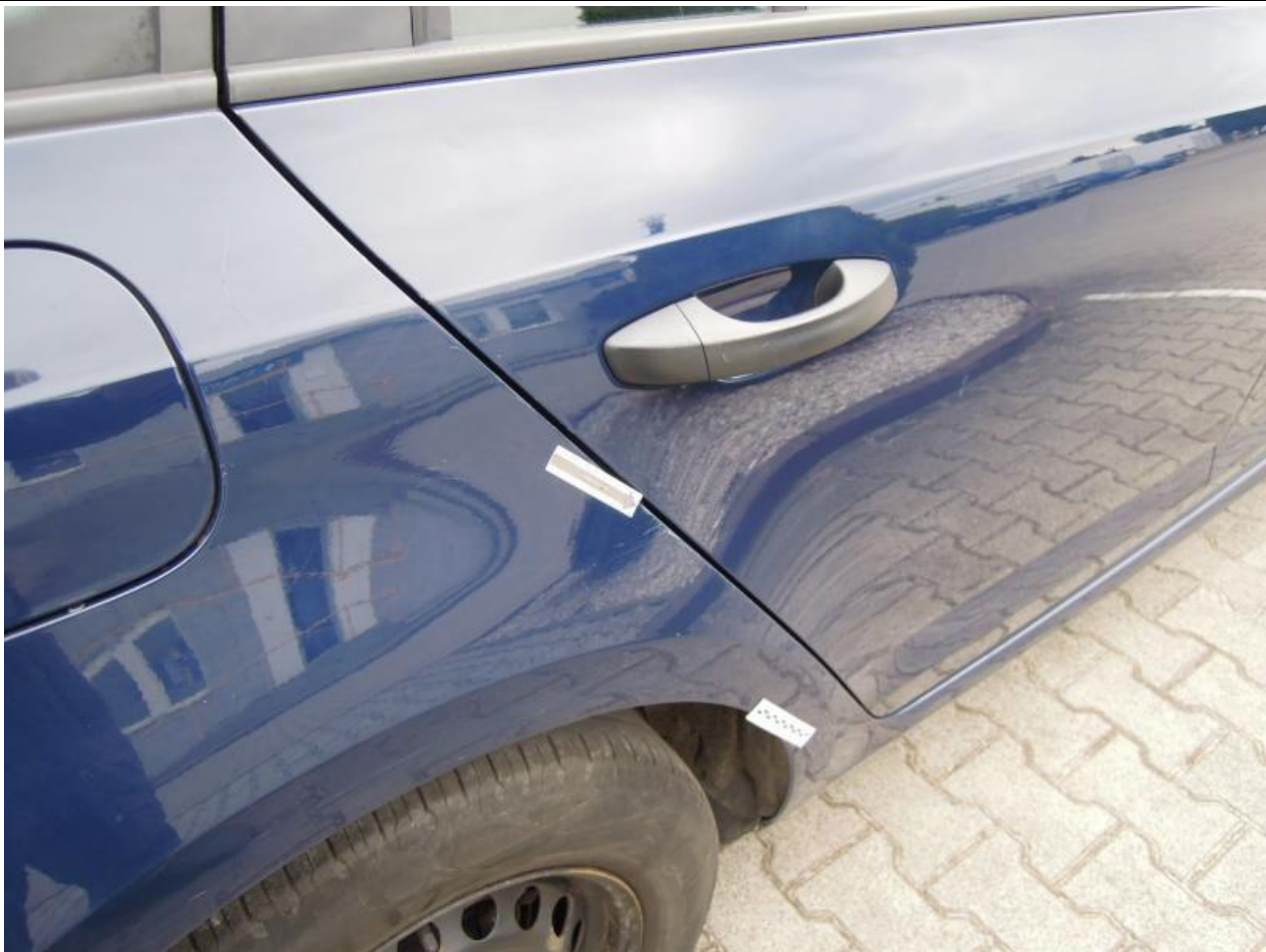
Fot. nr 93