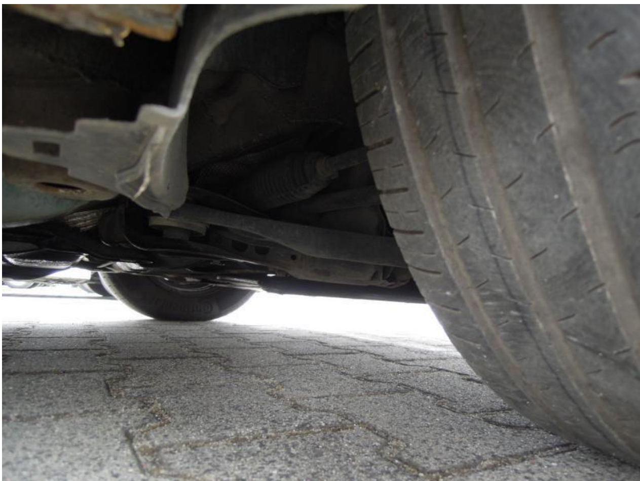
Fot. nr 108