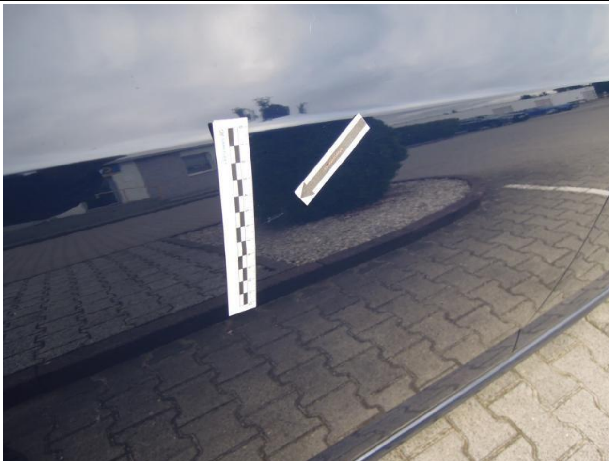
Fot. nr 87