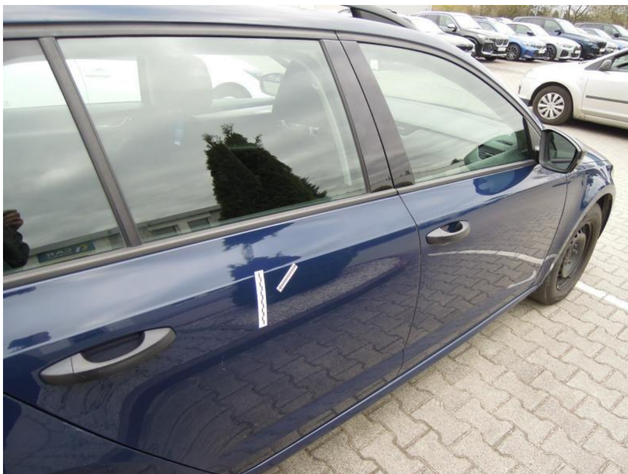
Fot. nr 86