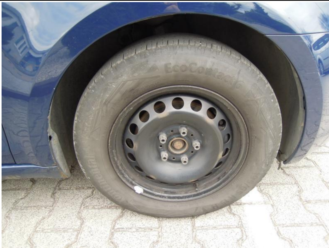
Fot. nr 103