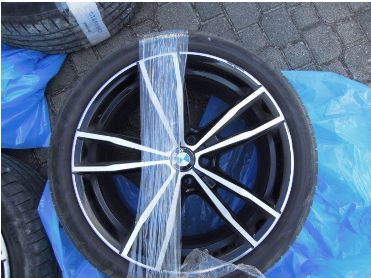
Fot. nr 86