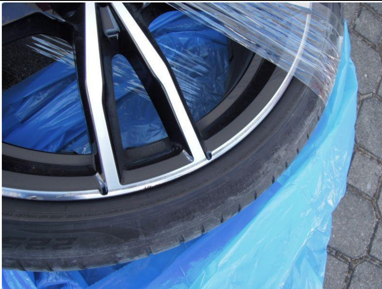
Fot. nr 91