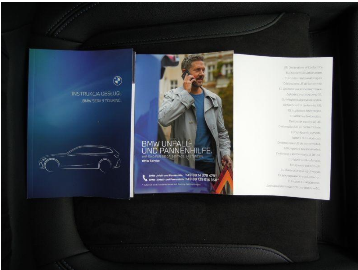
Fot. nr 78