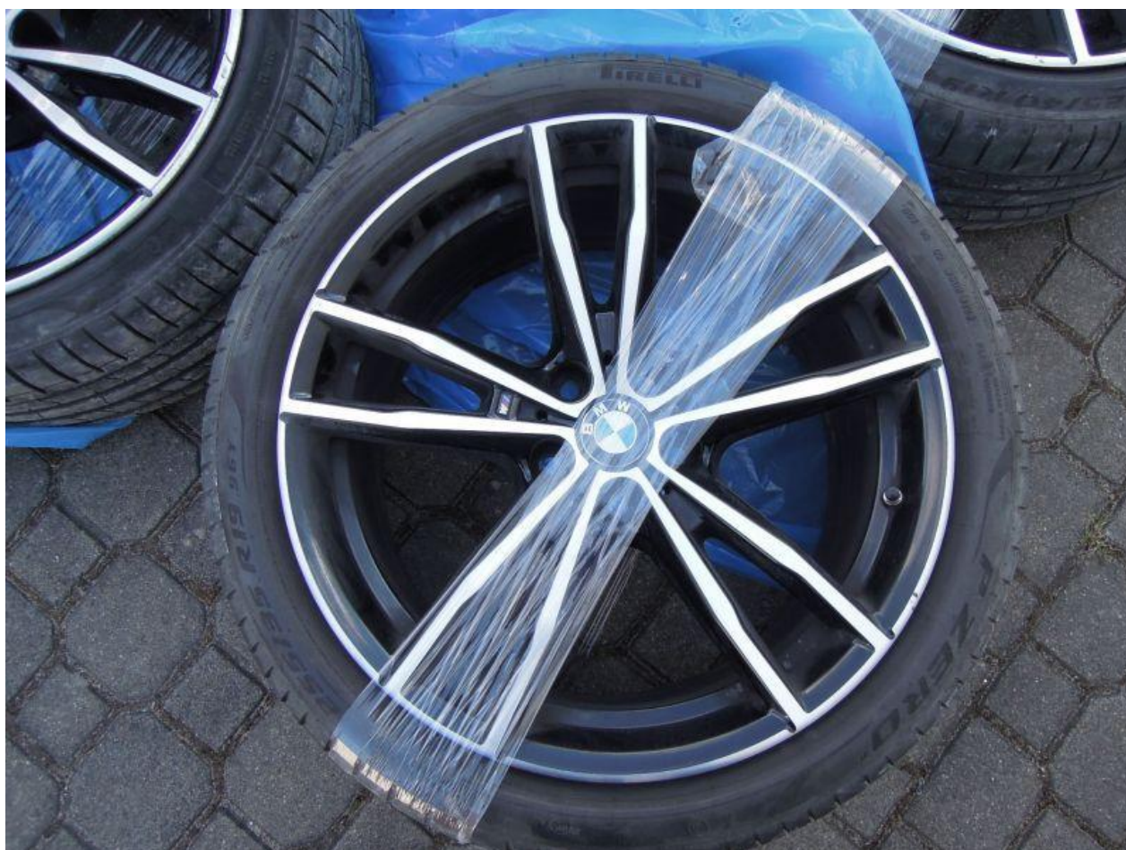
Fot. nr 82