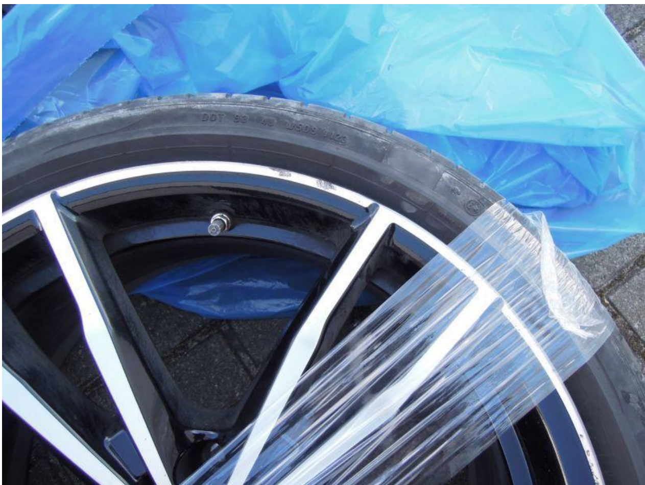
Fot. nr 84