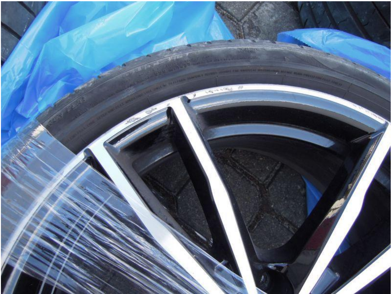
Fot. nr 85