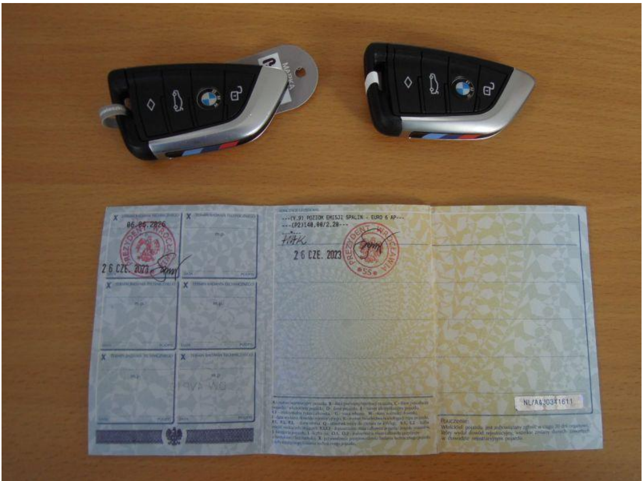
Fot. nr 80