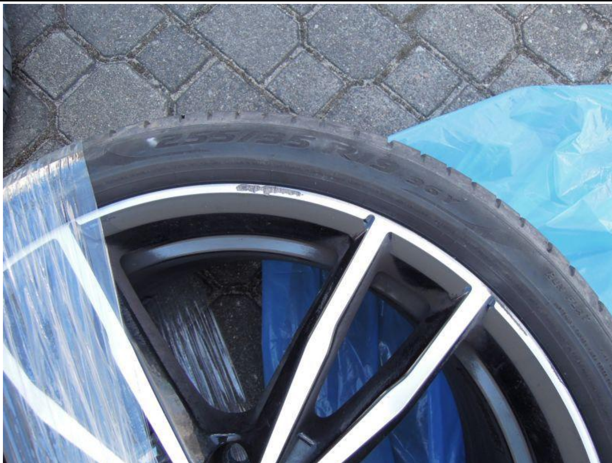
Fot. nr 87