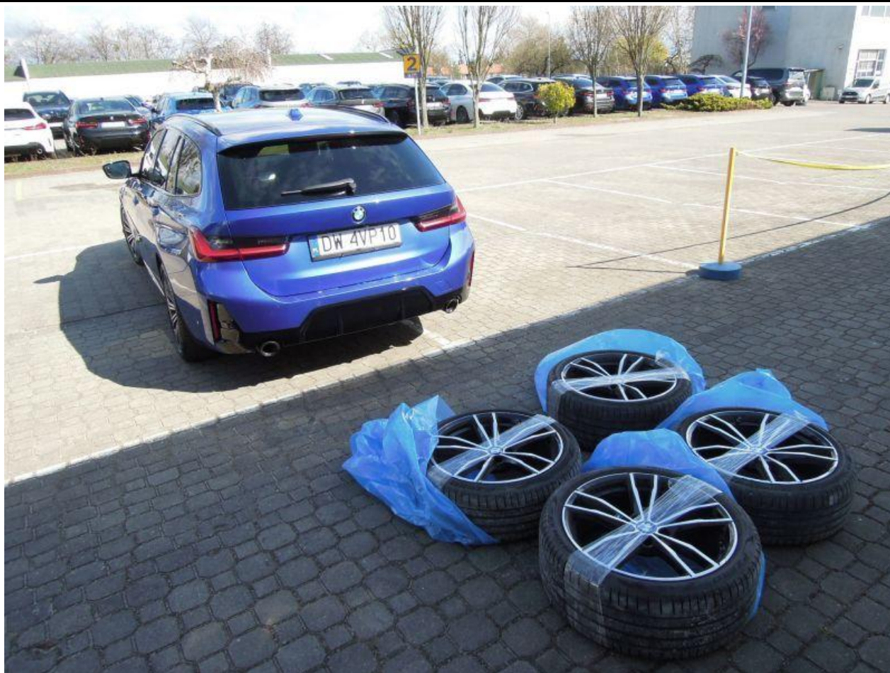
Fot. nr 81