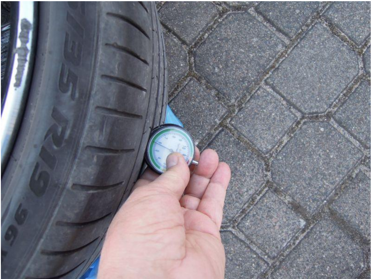
Fot. nr 93

Dokument wystawiony elektronicznie, w a ny bez podpisu