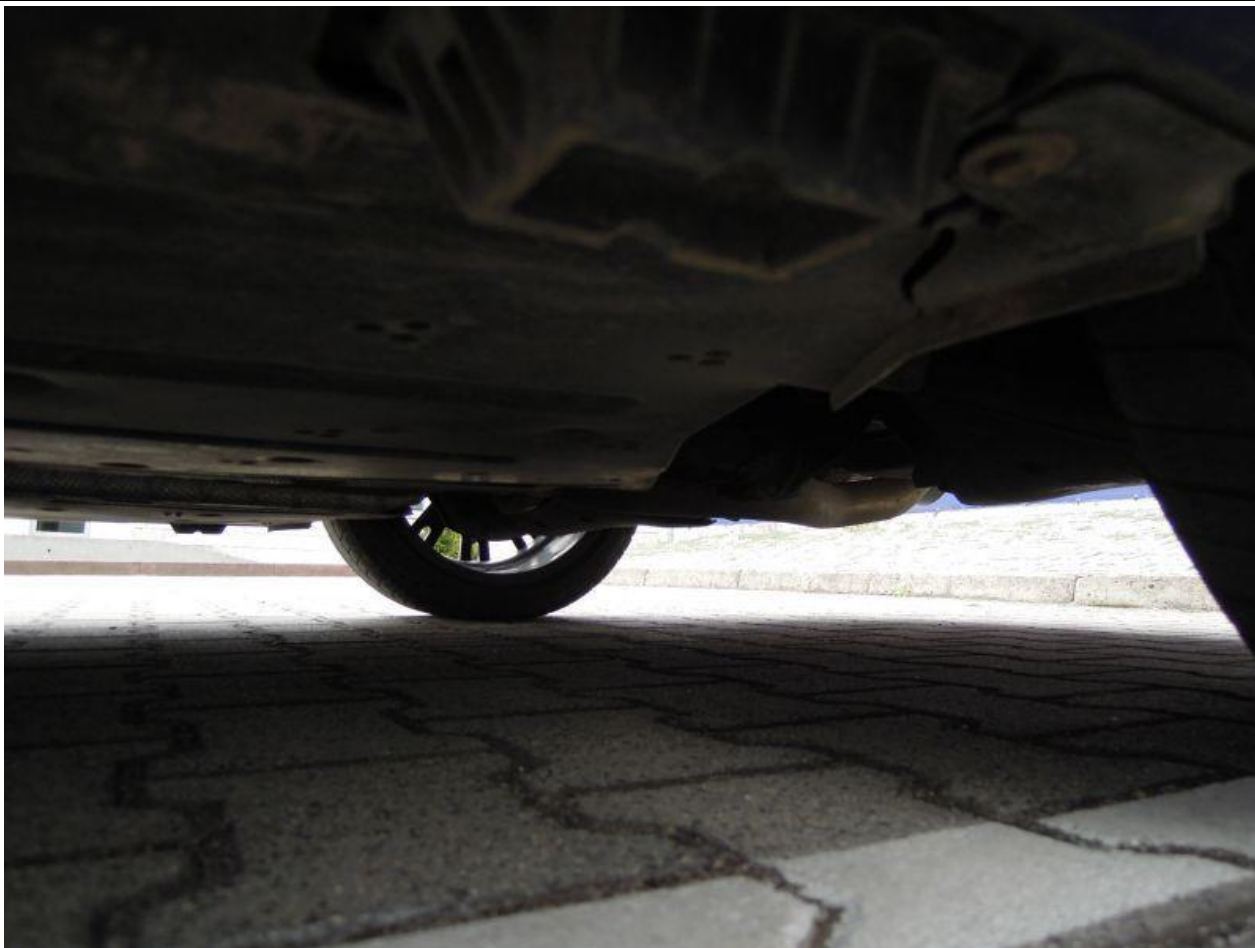
Fot. nr 77