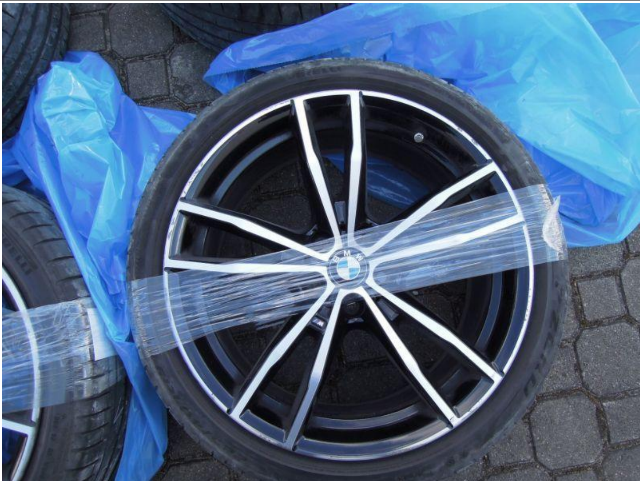
Fot. nr 83