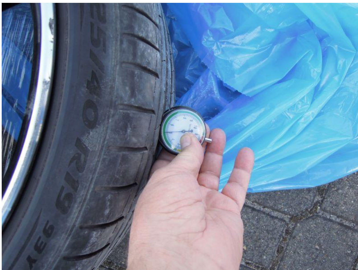
Fot. nr 92