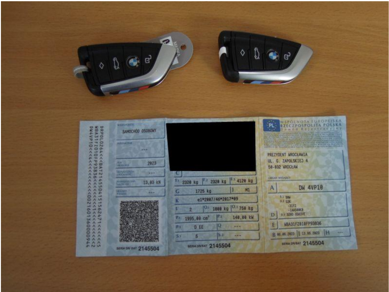
Fot. nr 79