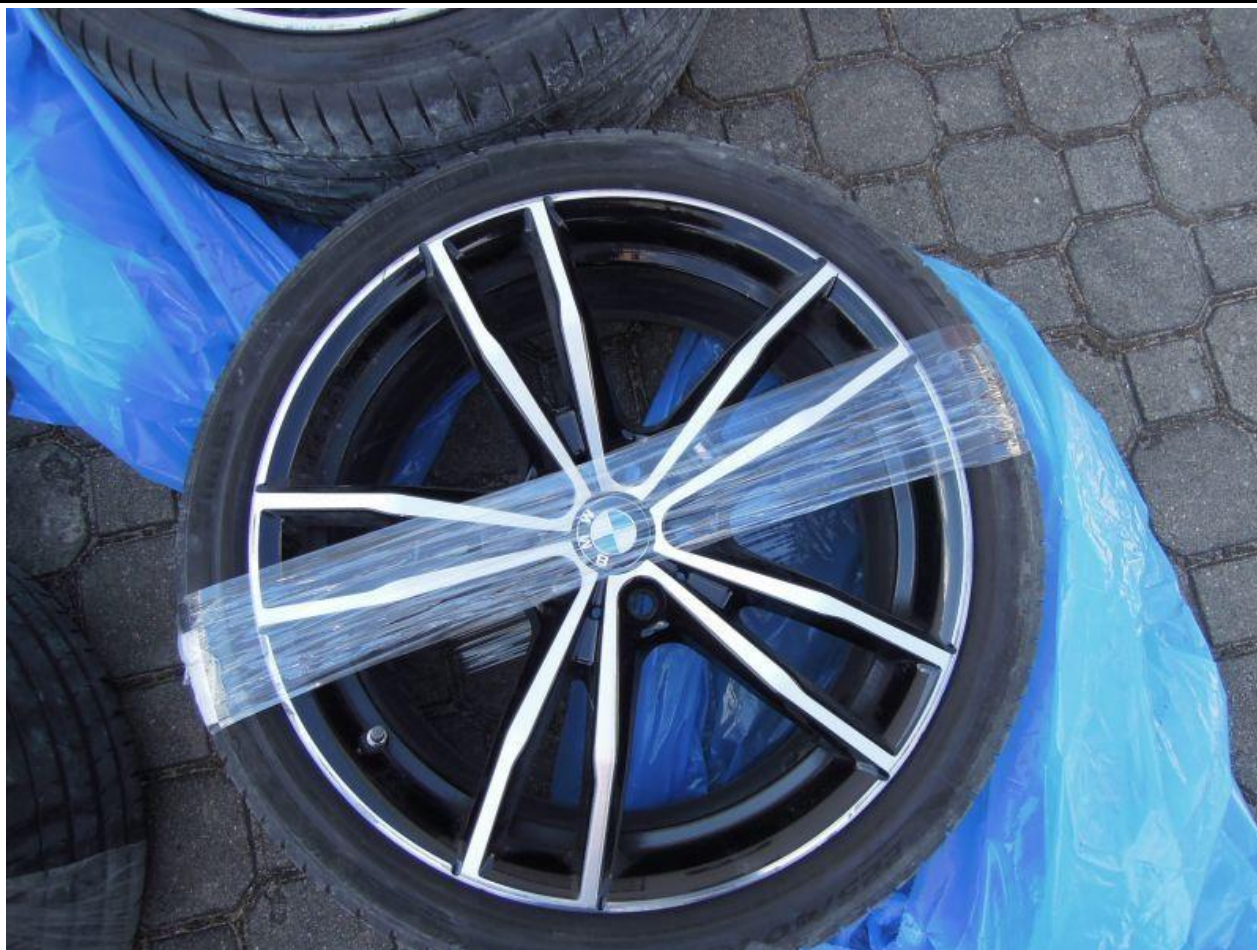
Fot. nr 89