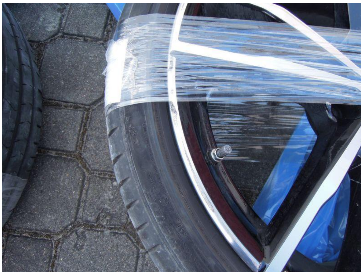
Fot. nr 90