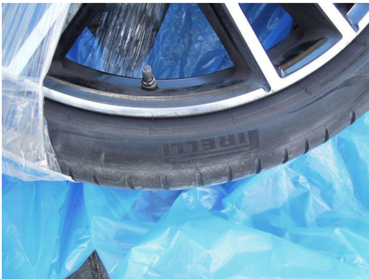
Fot. nr 88