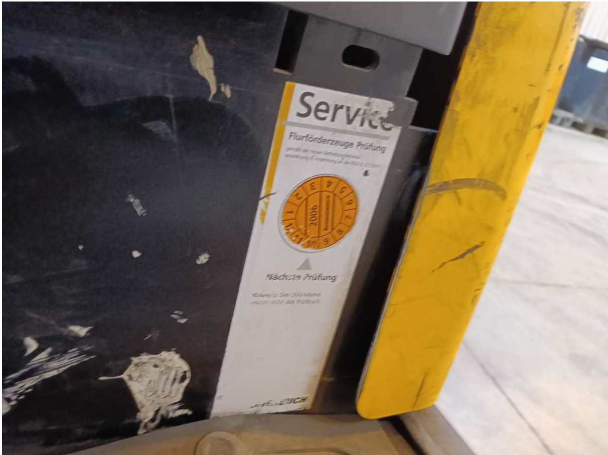
DETA 48V 6EPZS 690