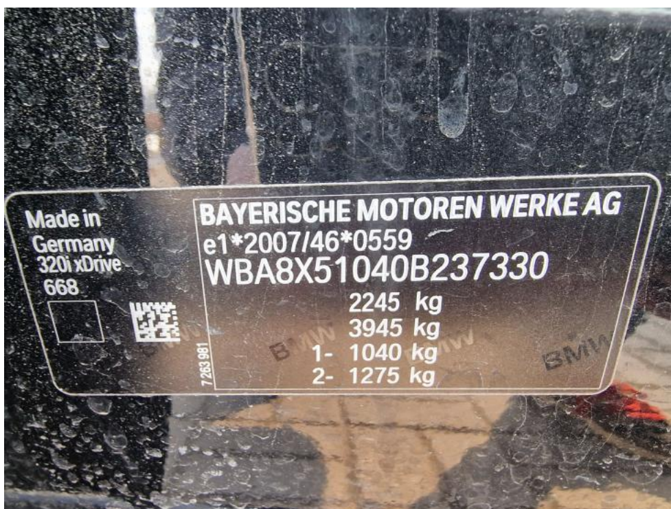
Fot. 8. Tabliczka znamionowa