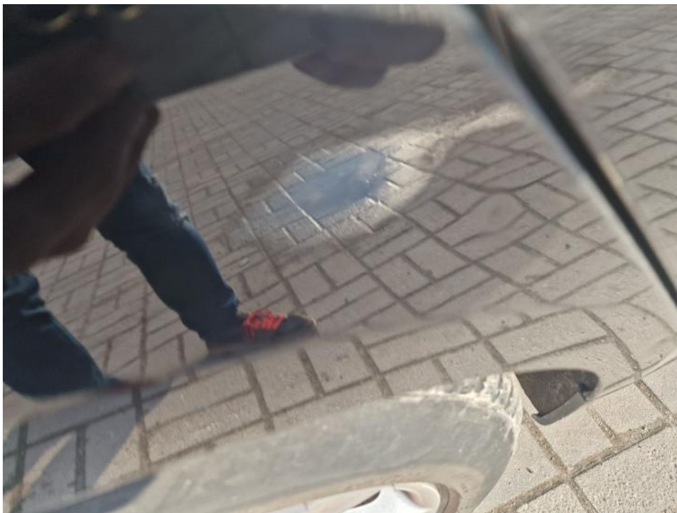
Fot. 27. Błotnik metal TP - wgniecenia punkt. w ilości do 3 1