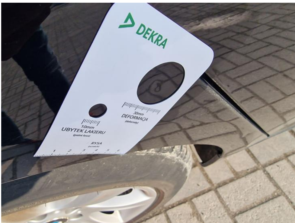
Fot. 28. Błotnik metal TP - wgniecenia punkt. w ilości do 3 2