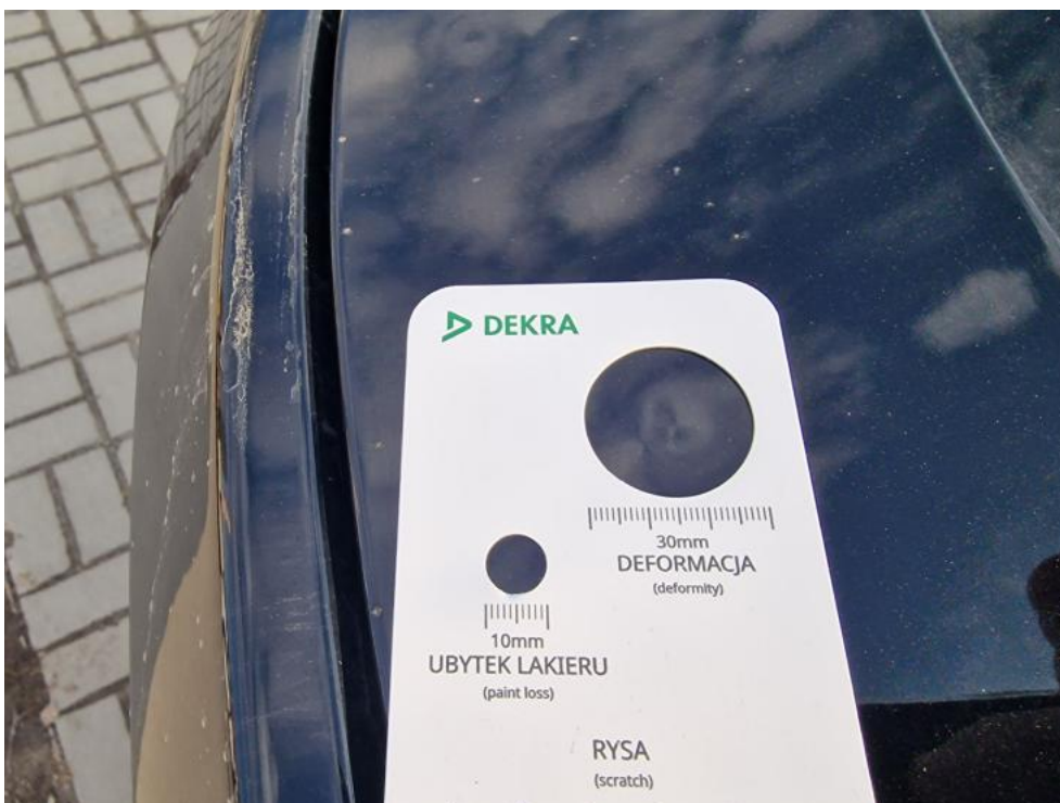
Fot. 34. Pokrywa() - wgniecenia w ilości pow. 3 3