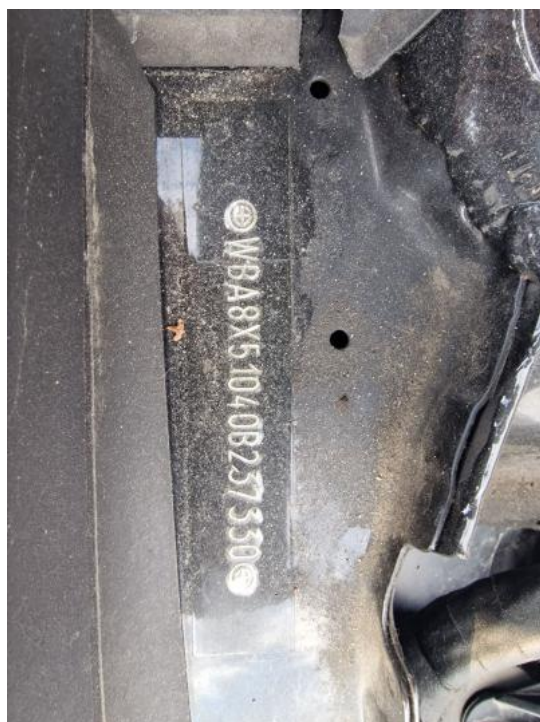
Fot. 7. Numer identyfikacyjny