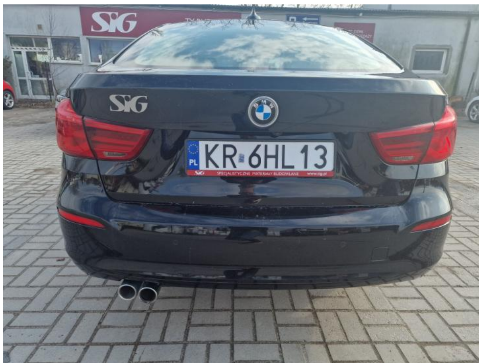
Fot. 5. Tył