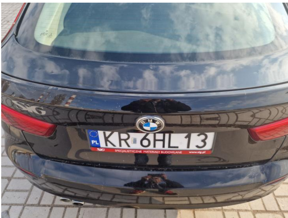
Fot. 31. Pokrywa - zdjęcie poglądowe 1