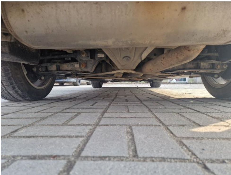
Fot. 11. Spód tył