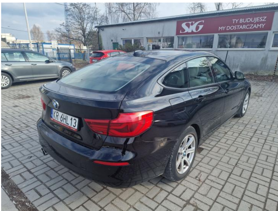
Fot. 4. Przekątna tylna prawa