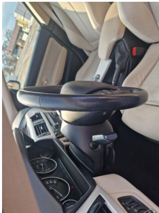
Fot. 25. Kierownica z lewej strony