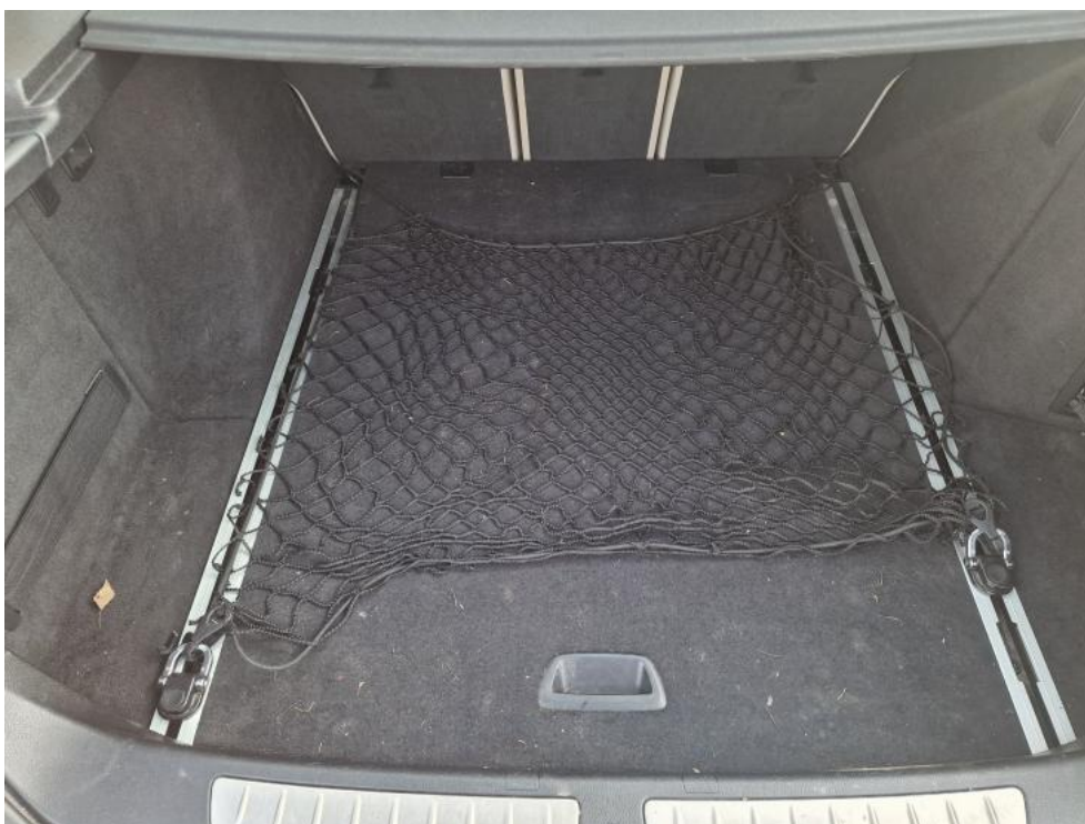
Fot. 12. Bagażnik