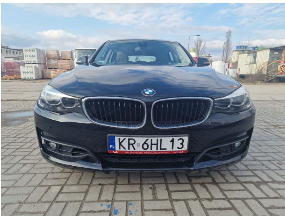
Fot. 2. Przód