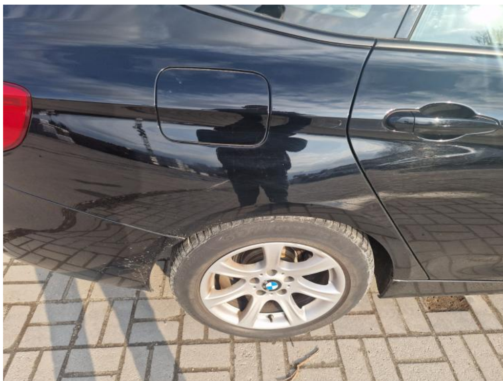
Fot. 26. Błotnik metal TP - zdjęcie poglądowe 1