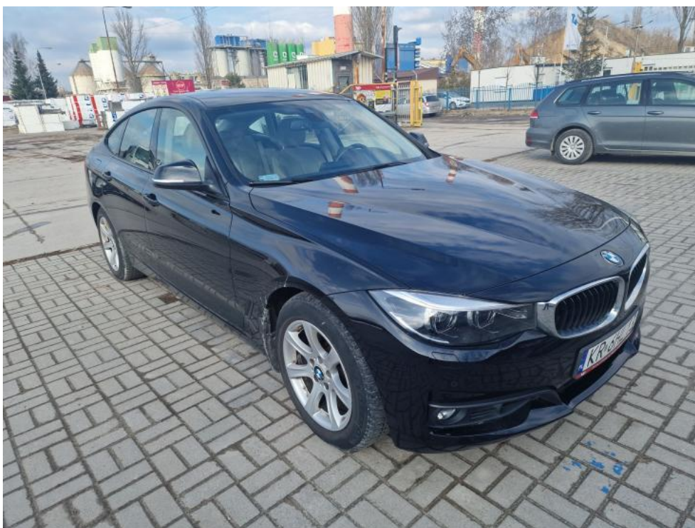
Fot. 3. Przekątna przednia prawa