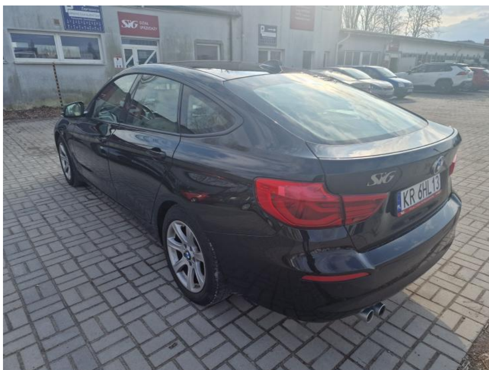
Fot. 6. Przekątna tylna lewa