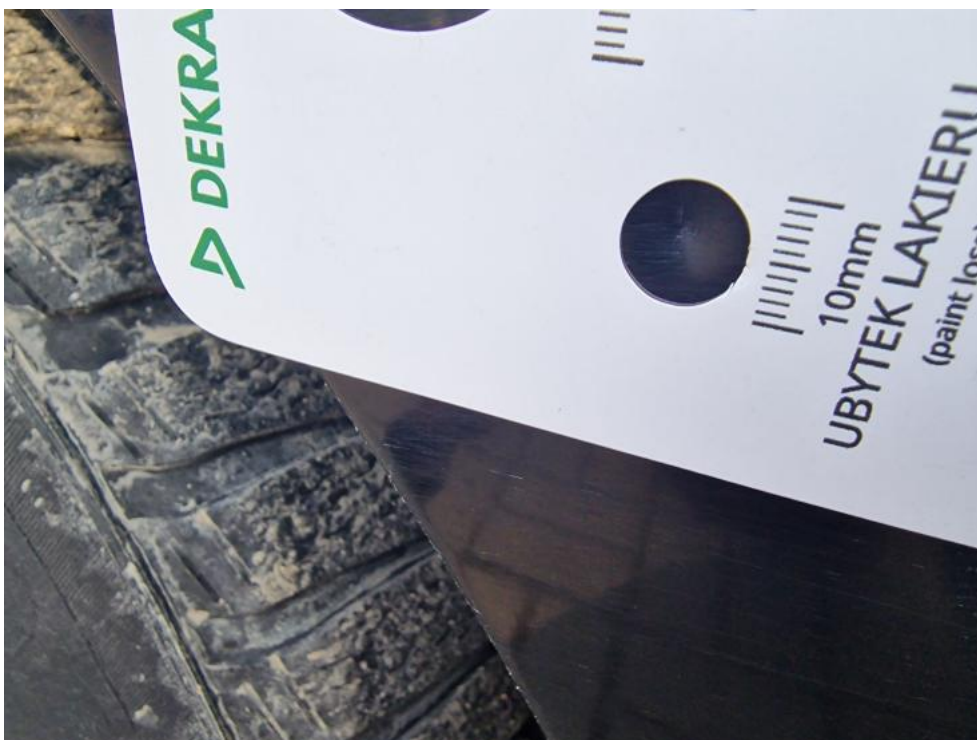
Fot. 30. Błotnik metal TP - wgniecenie 2