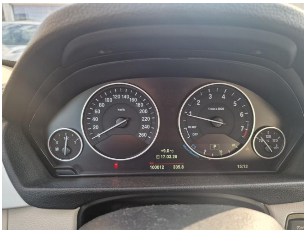
Fot. 18. Zestaw wskaźników