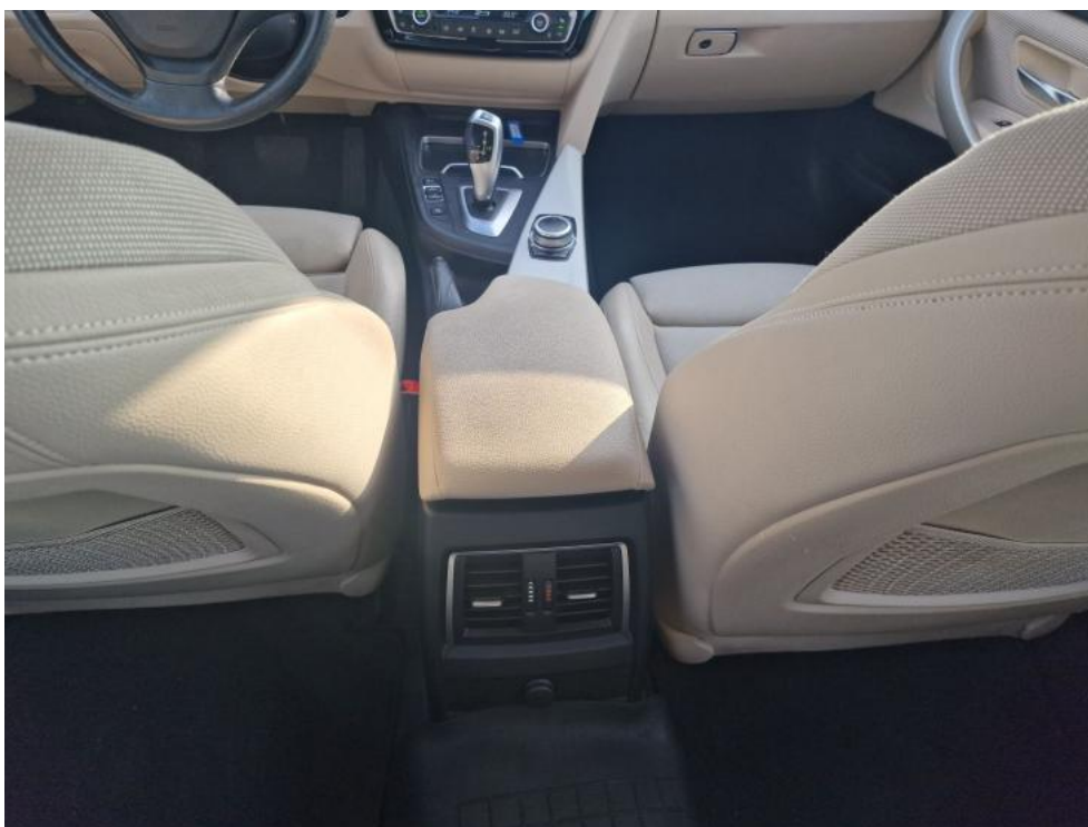
Fot. 23. Tunel środkowy