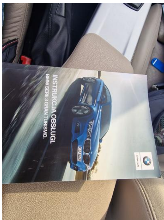
Fot. 17. Instrukcje