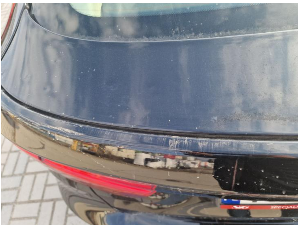
Fot. 32. Pokrywa - wgniecenia w ilości pow. 3 1