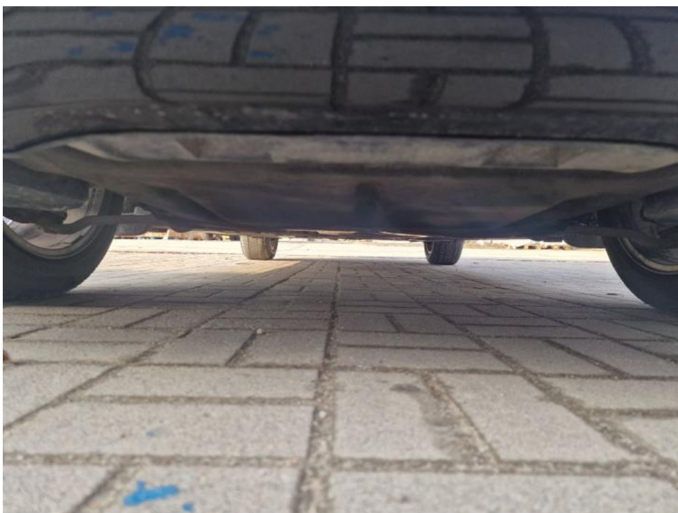
Fot. 10. Spód pojazdu przód