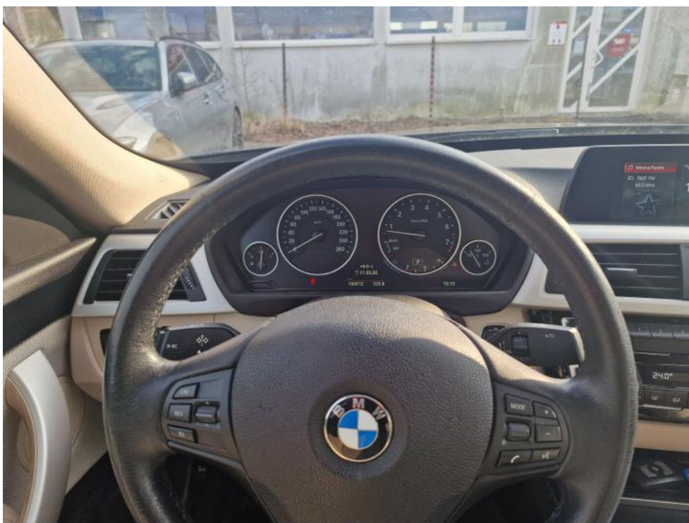
Fot. 24. Kierownica (na wprost)