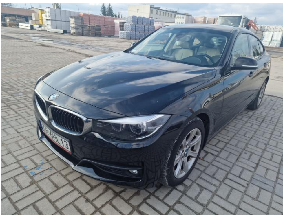
Fot. 1. Przekątna przednia lewa