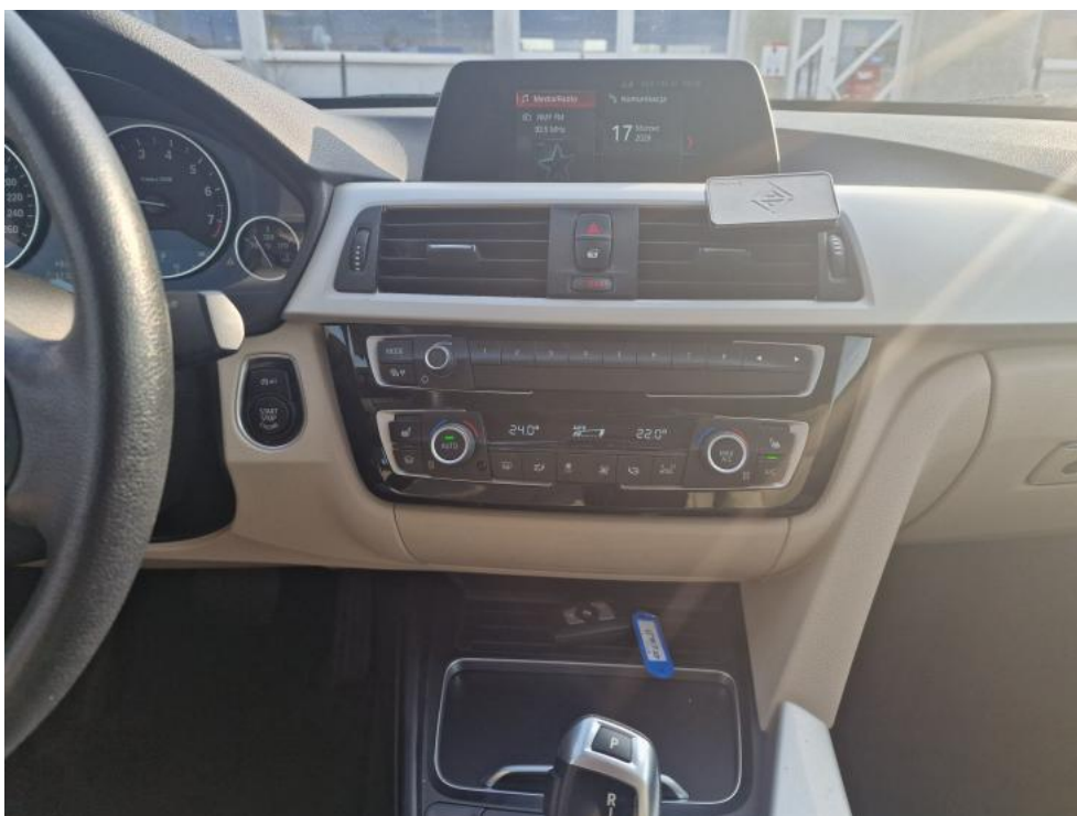
Fot. 22. Konsola środkowa