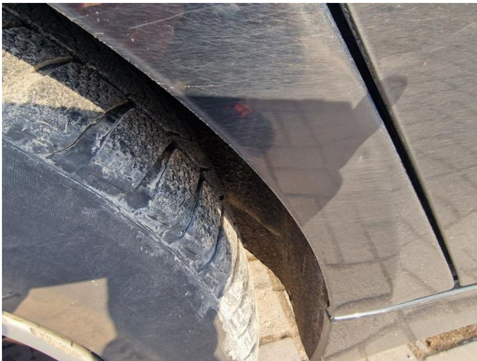
Fot. 29. Błotnik metal TP - wgniecenie 1