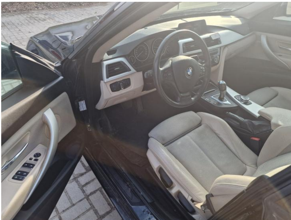
Fot. 19. Widok przez otwarte drzwi przednie lewe