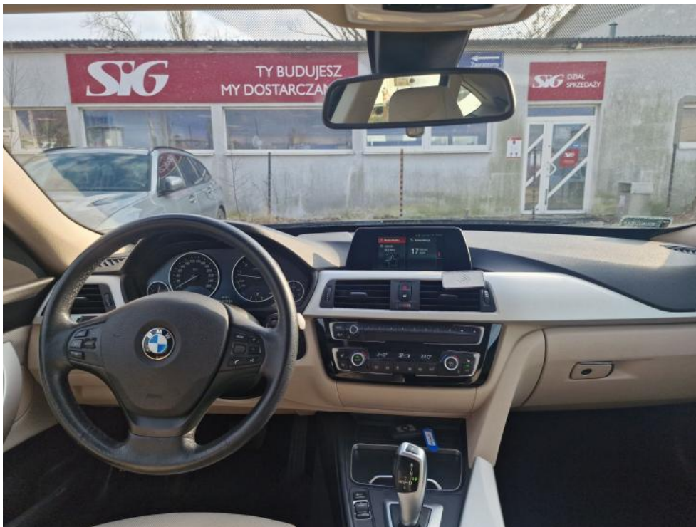
Fot. 21. Widok z tylnej kanapy na deskę rozd.