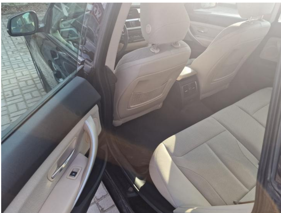
Fot. 20. Widok przez otwarte drzwi tylne lewe