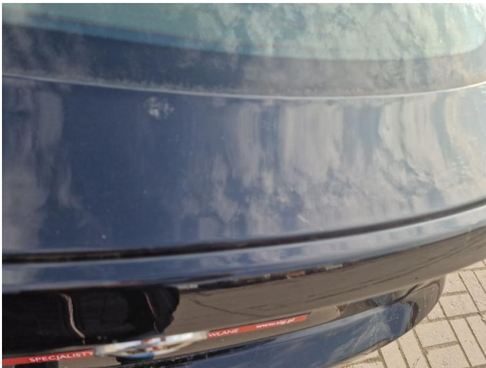
Fot. 33. Pokrywa - wgniecenia w ilości pow. 3 2