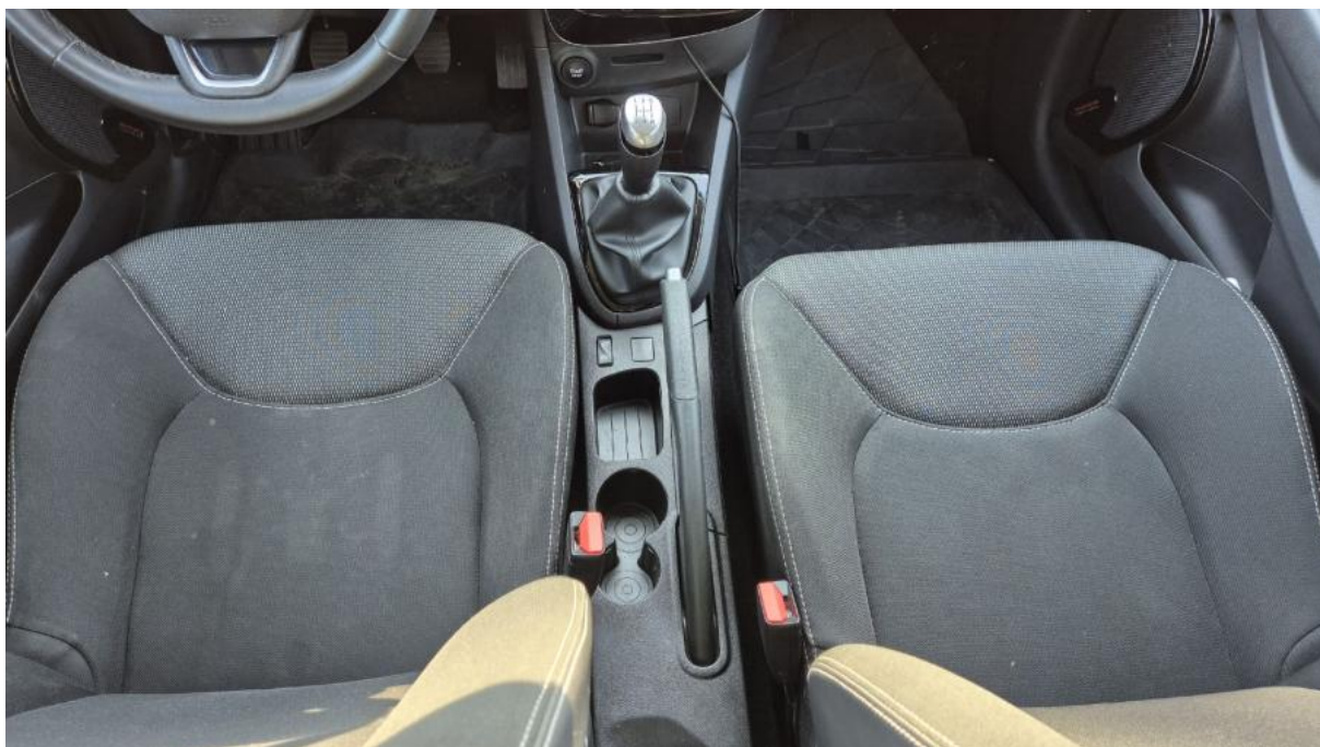
Fot. 20 Tuneł środkowy