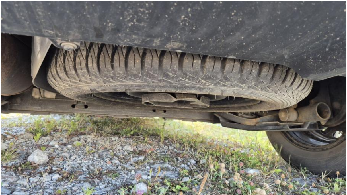
Fot. 25 Koło zapasowe