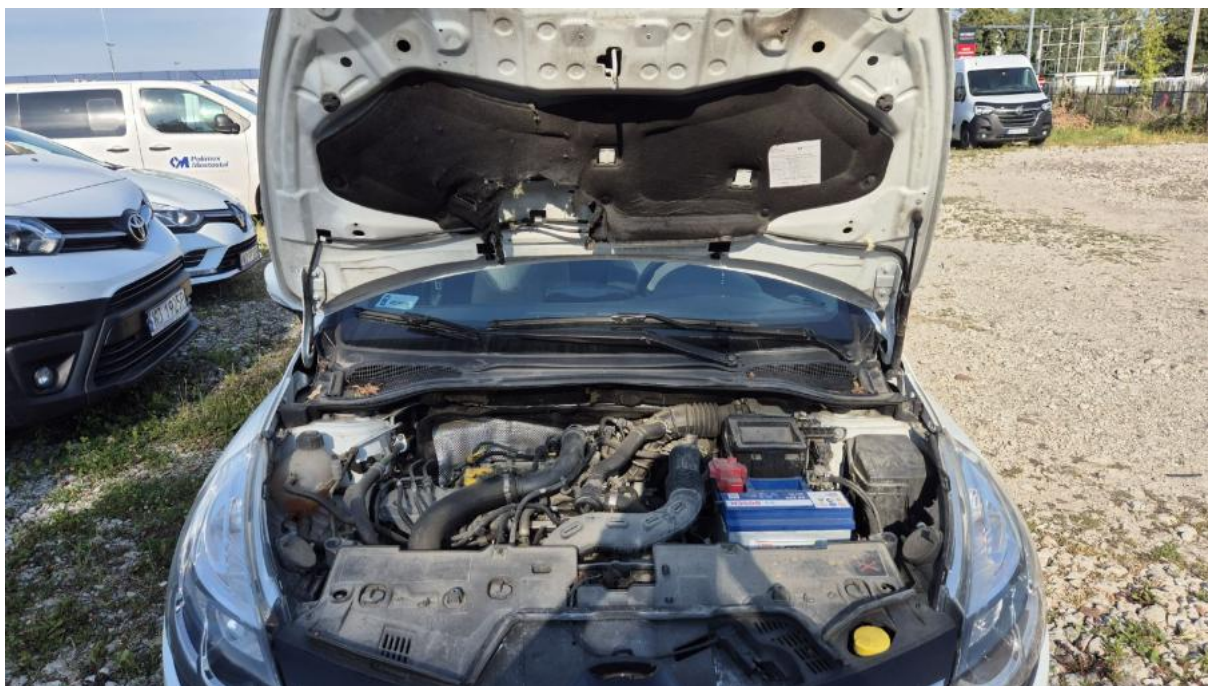
Fot. 23 Komora silnika