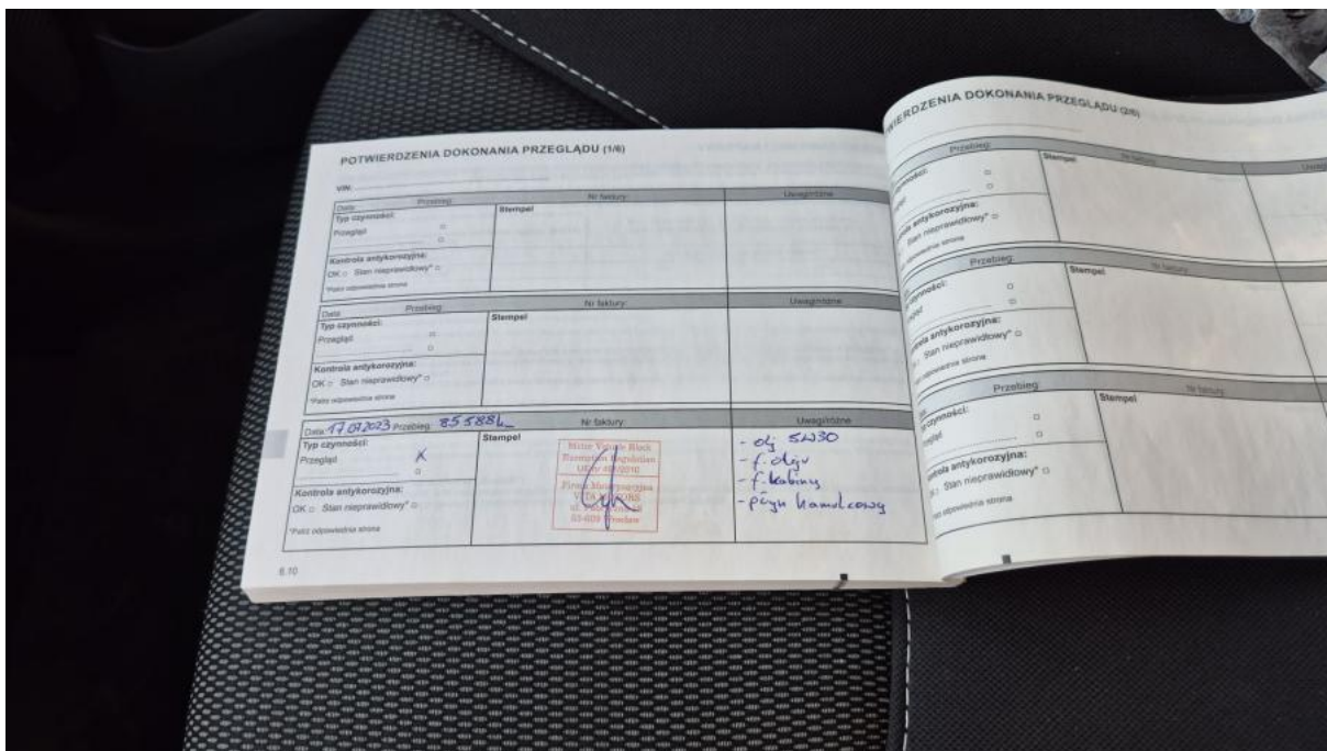
Fot. 30 Książka serwisowa – dane