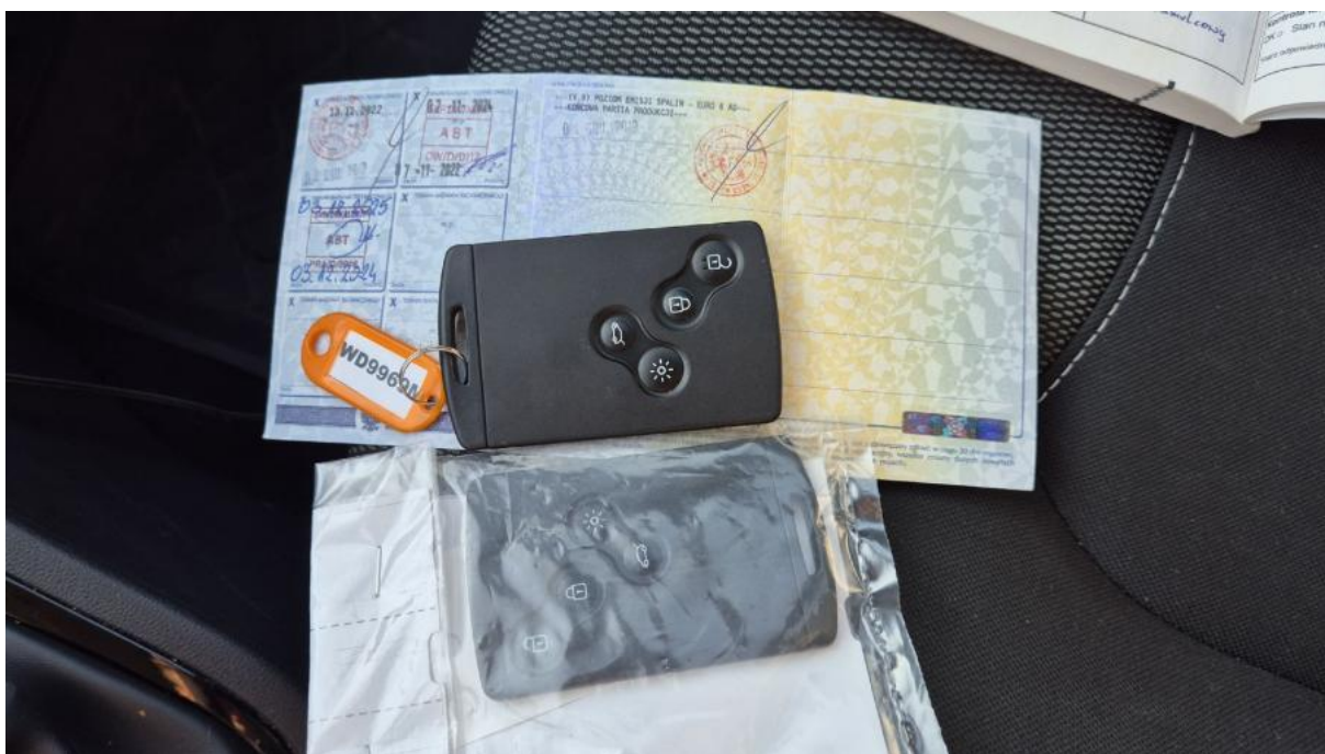
Fot. 29 Dow. Rej. Str.2 i klucze