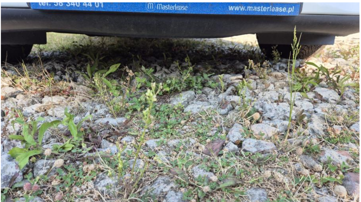
Fot. 26 Spód pojazdu przód