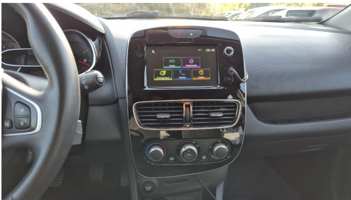
Fot. 19 Konsola środkowa