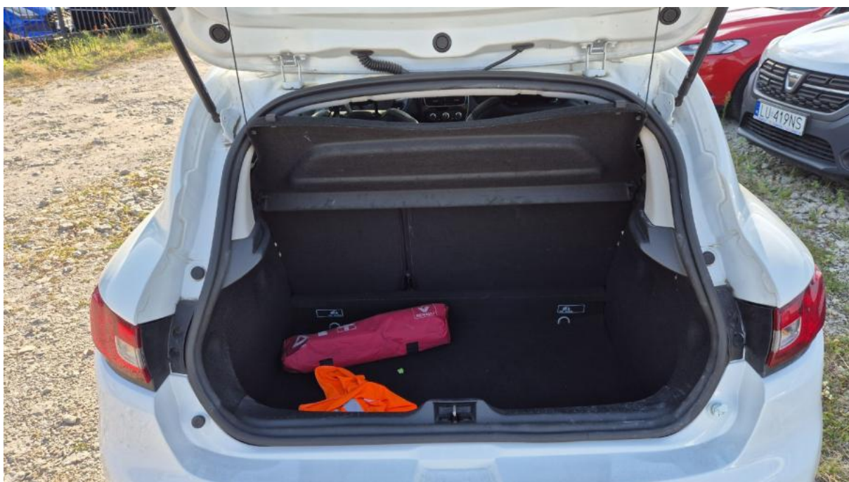
Fot. 24 Bagażnik