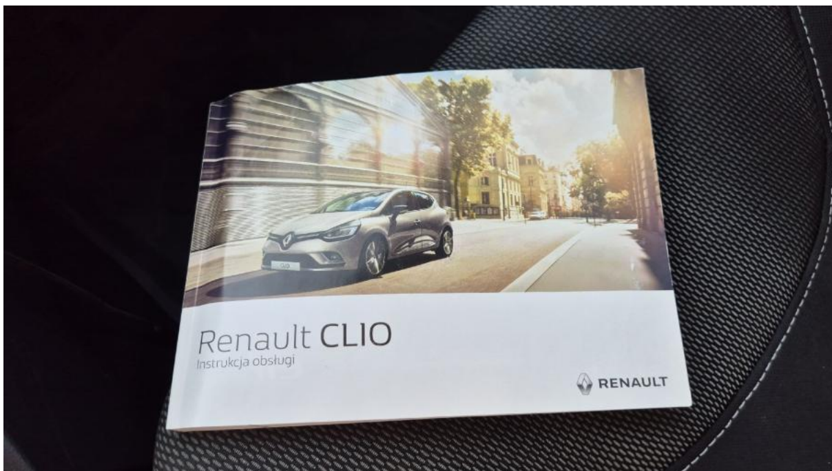
Fot. 32 Instrukcje