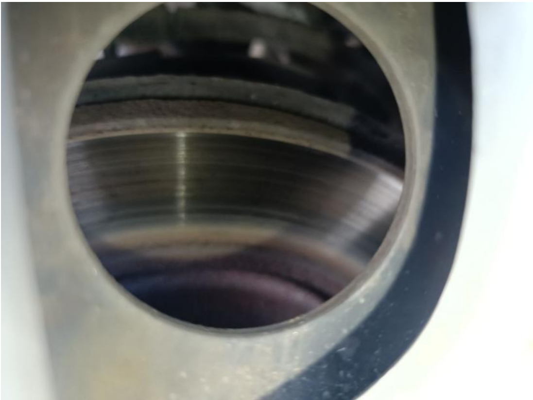
Fot. 29 Tarcza hamulcowa tylna prawa