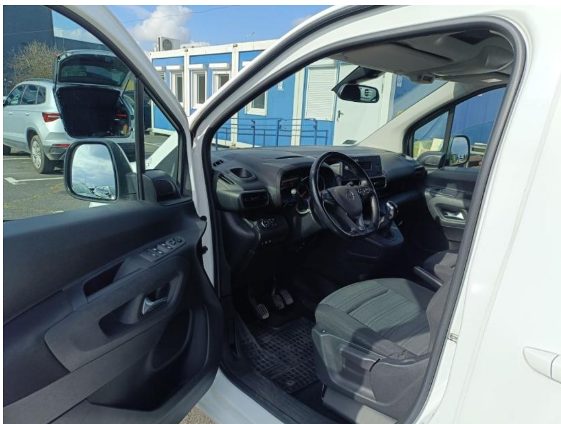
Fot. 16 Widok przez otwarte drzwi przednie lewe