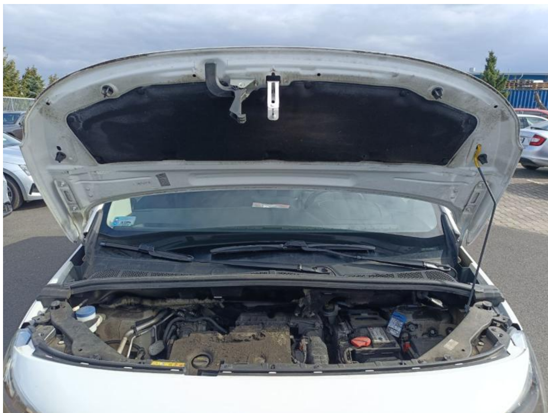
Fot. 23 Komora silnika