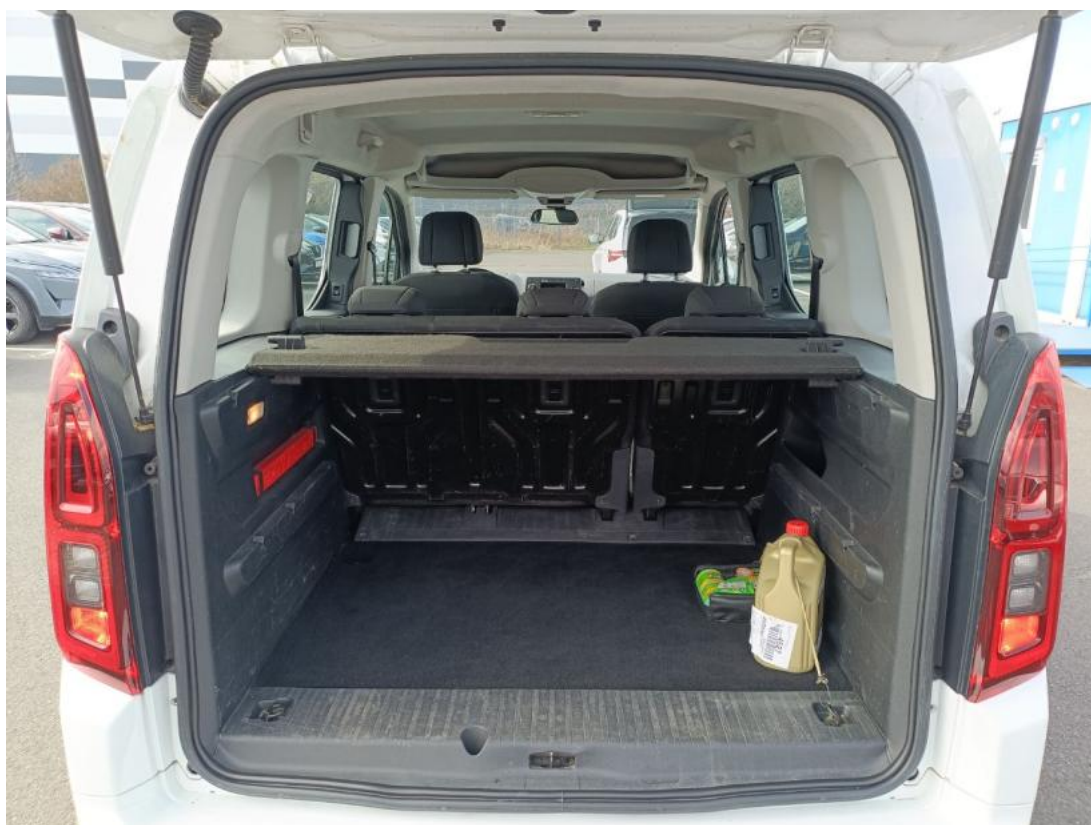
Fot. 24 Bagażnik