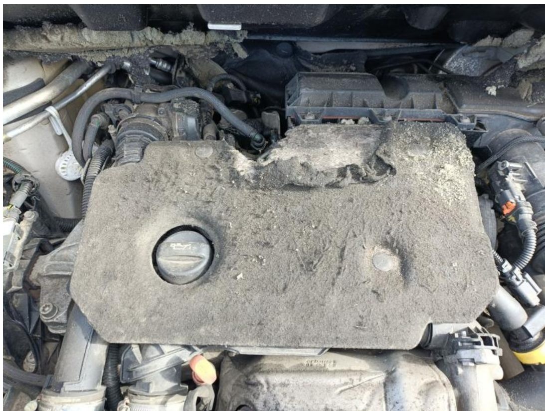
Fot. 39 uszkodzona wykładzina/pokrywa silnika