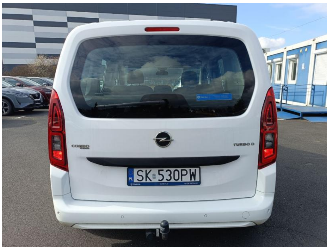
Fot. 8 Tyt