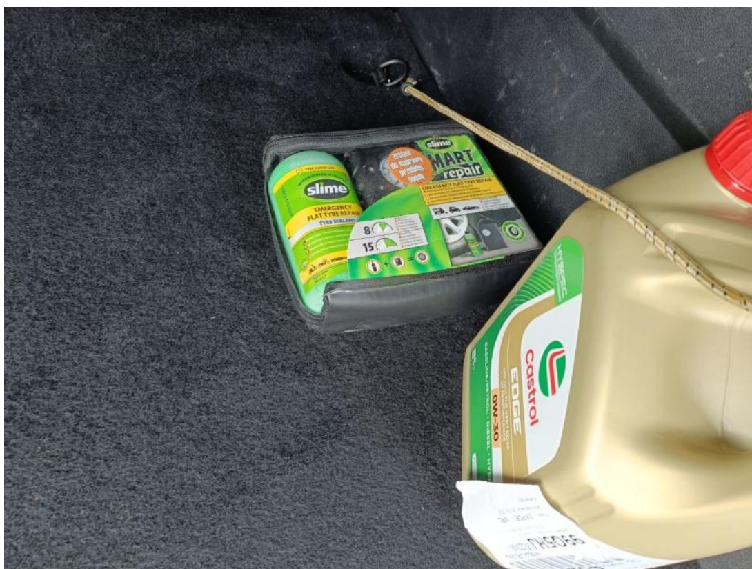
Fot. 33 Zestaw naprawczy koła