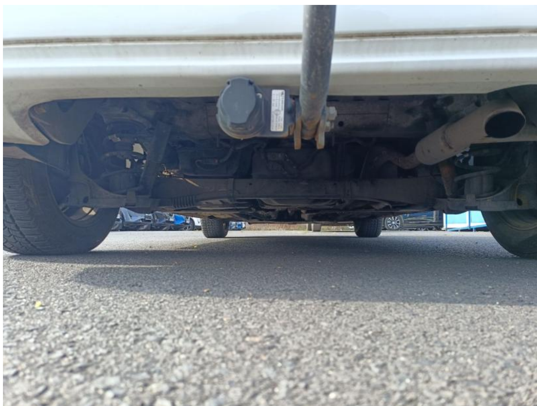
Fot. 26 Spód pojazdu tył