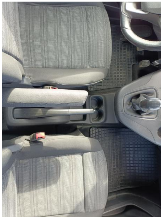
Fot. 20 Tuneł środkowy