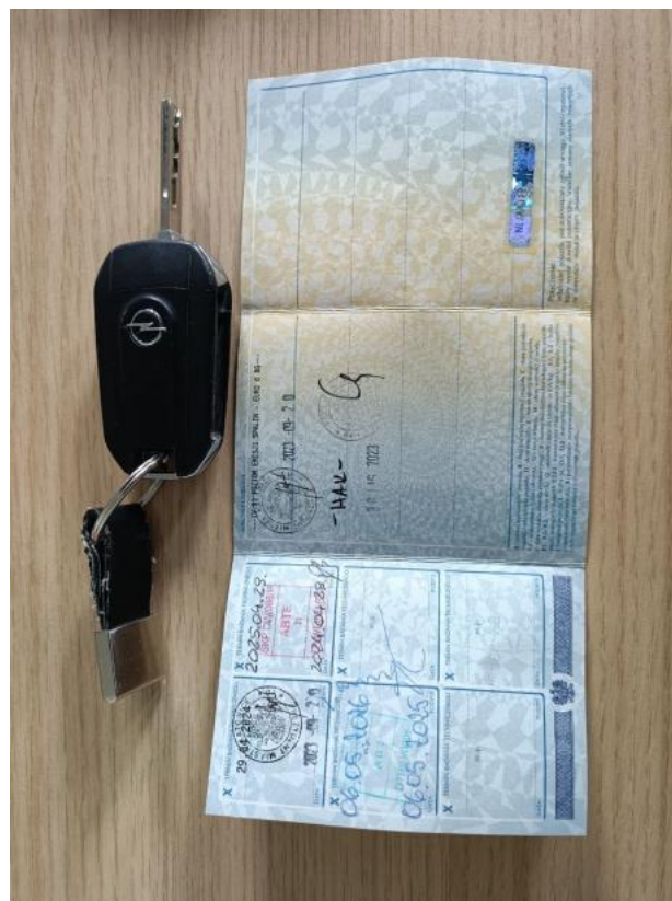
Fot. 32 Dow. Rej. Str.2 i klucze