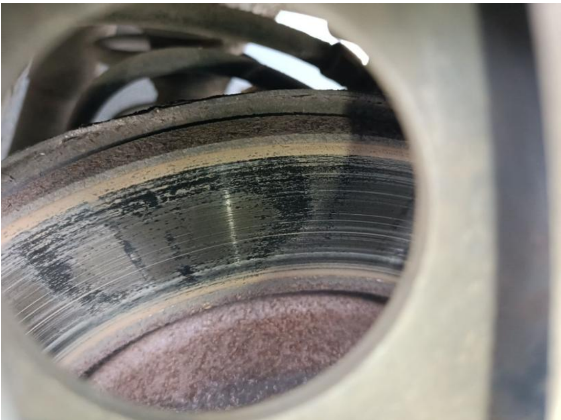
Fot. 30 Tarcza hamulcowa tylna lewa