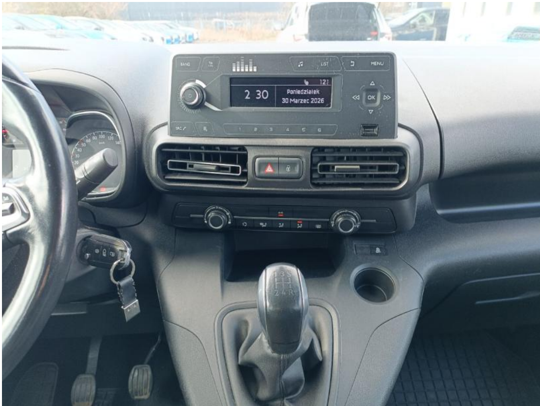
Fot. 19 Konsola środkowa