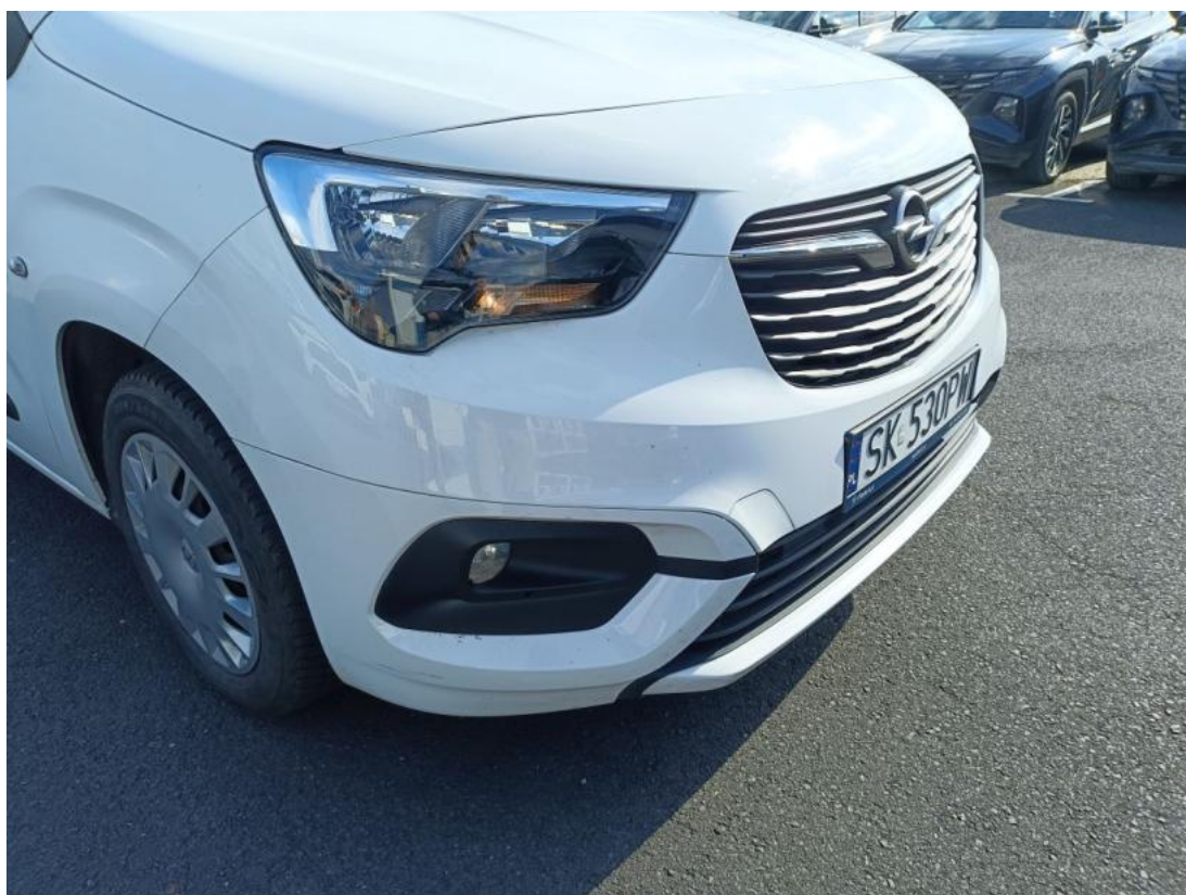
Fot. 40 Zderzak przedni cz P - zdjęcie poglądowe 1