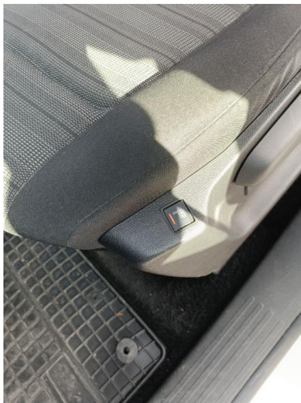
Fot. 35 Zdjęcie do protokołu