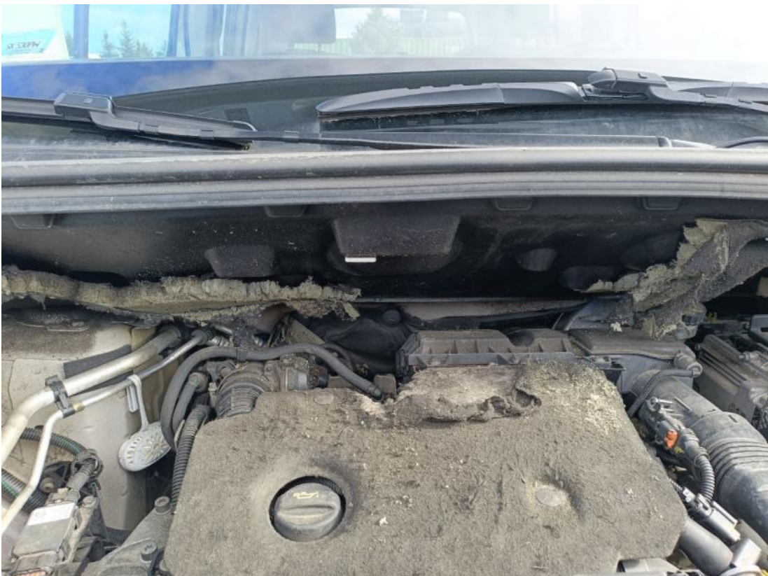
Fot. 38 uszkodzona wykładzina dźwiękochłonna ściany grodziowej komory mocowania silnika