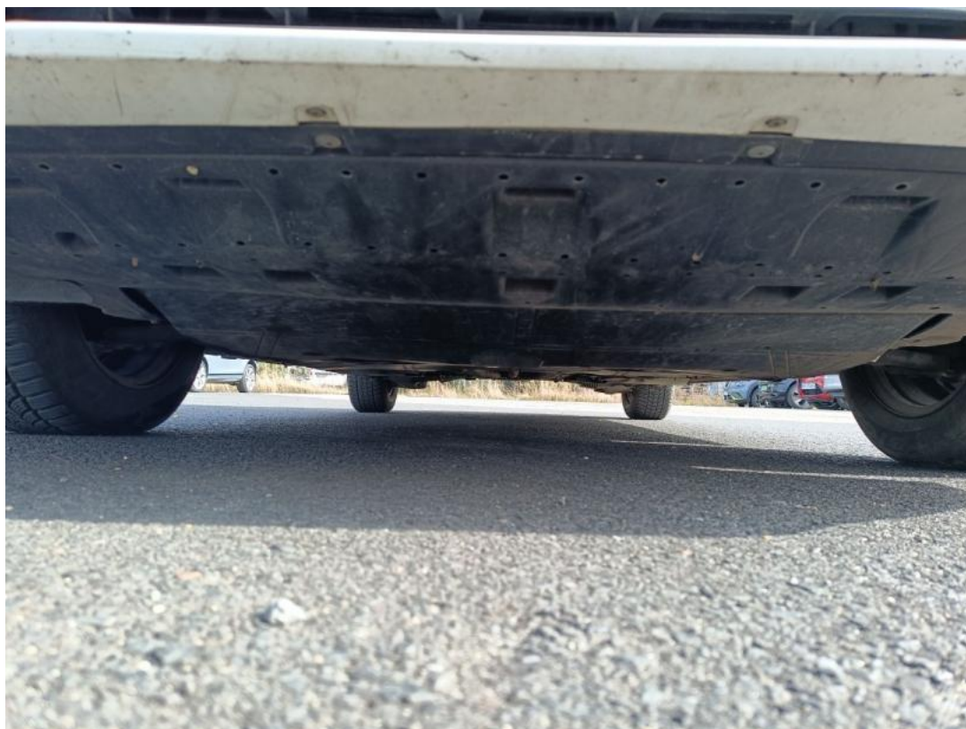
Fot. 25 Spód pojazdu przód