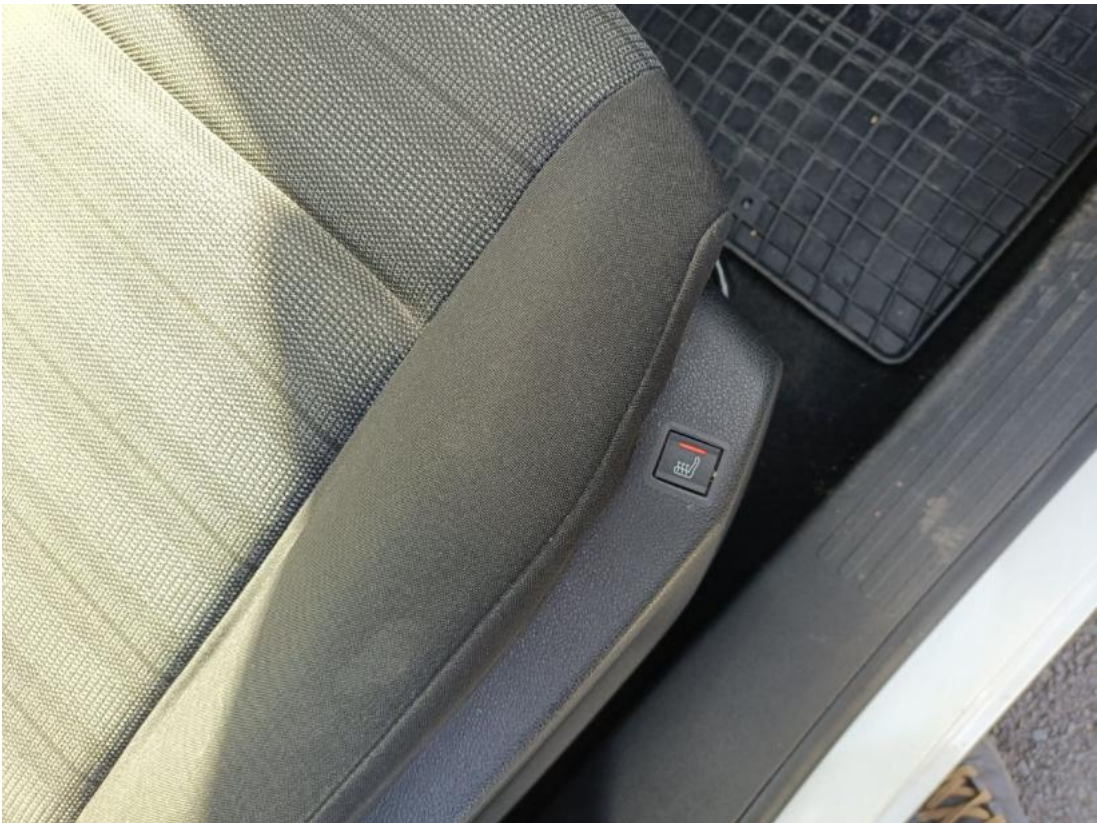
Fot. 37 Zdjęcie do protokołu