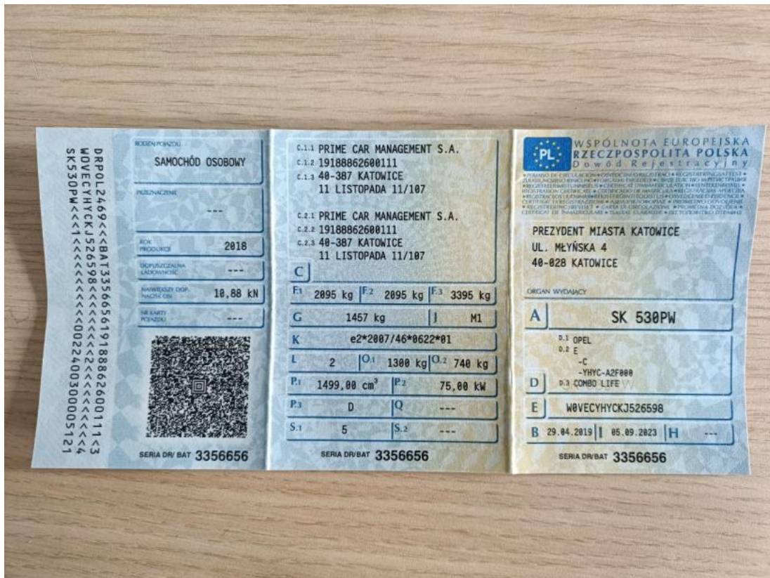
Fot. 31 Dowód rej. Str. 1