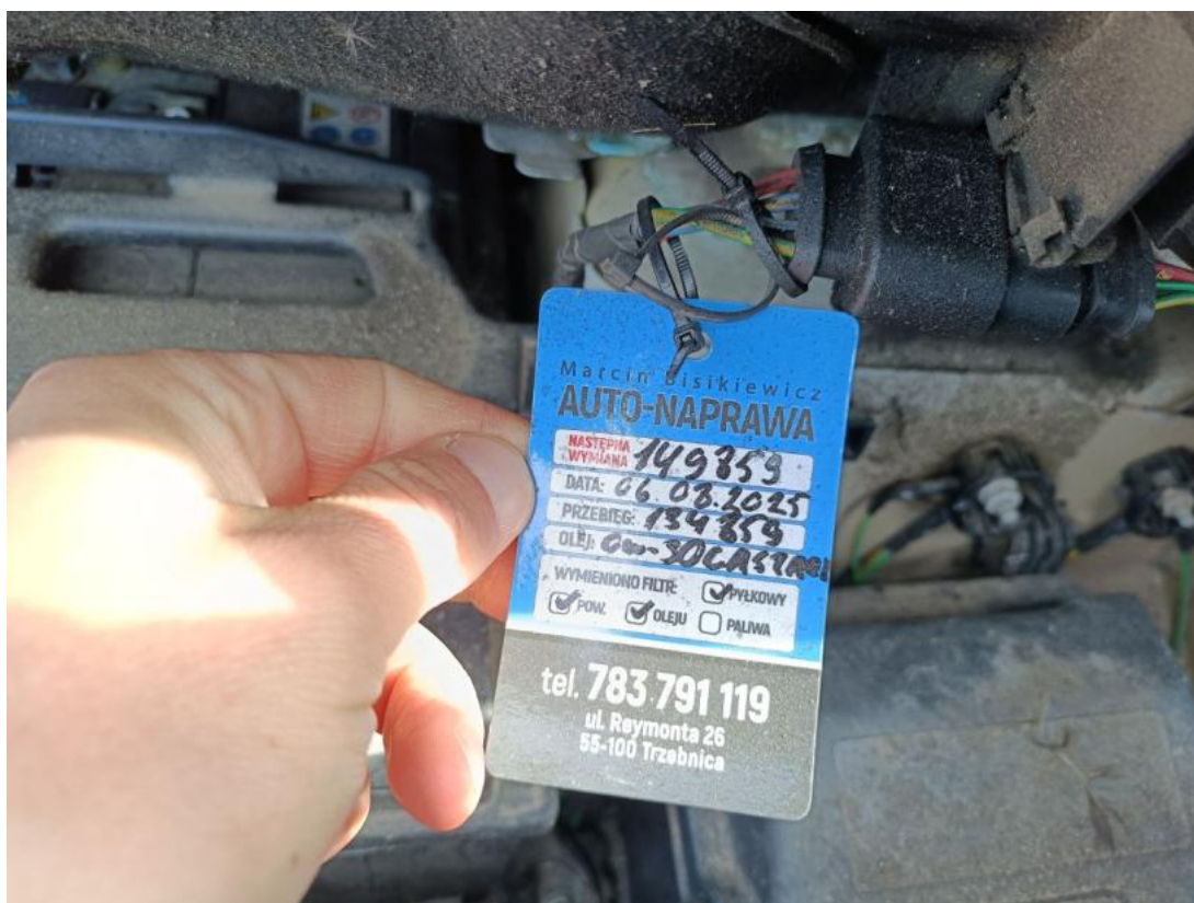
Fot. 34 Zdjęcie do protokołu