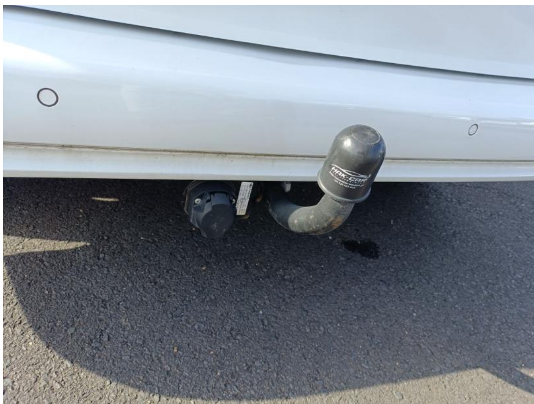
Fot. 36 Zdjęcie do protokołu