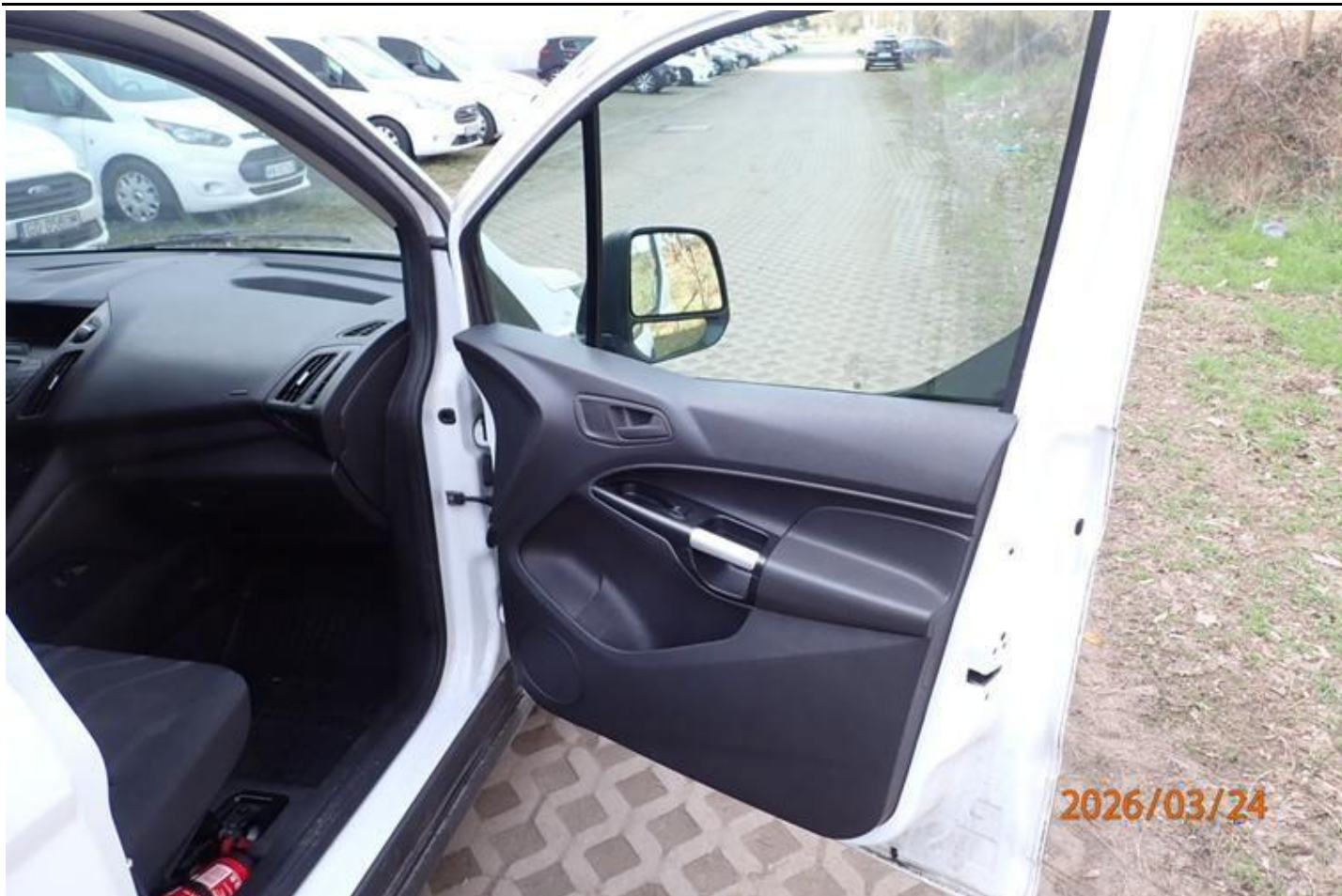
Fot. nr 121