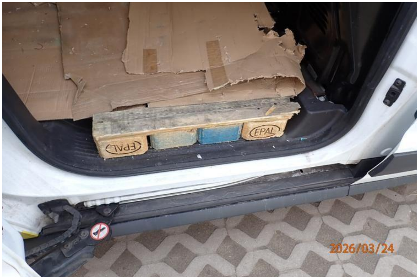
Fot. nr 94