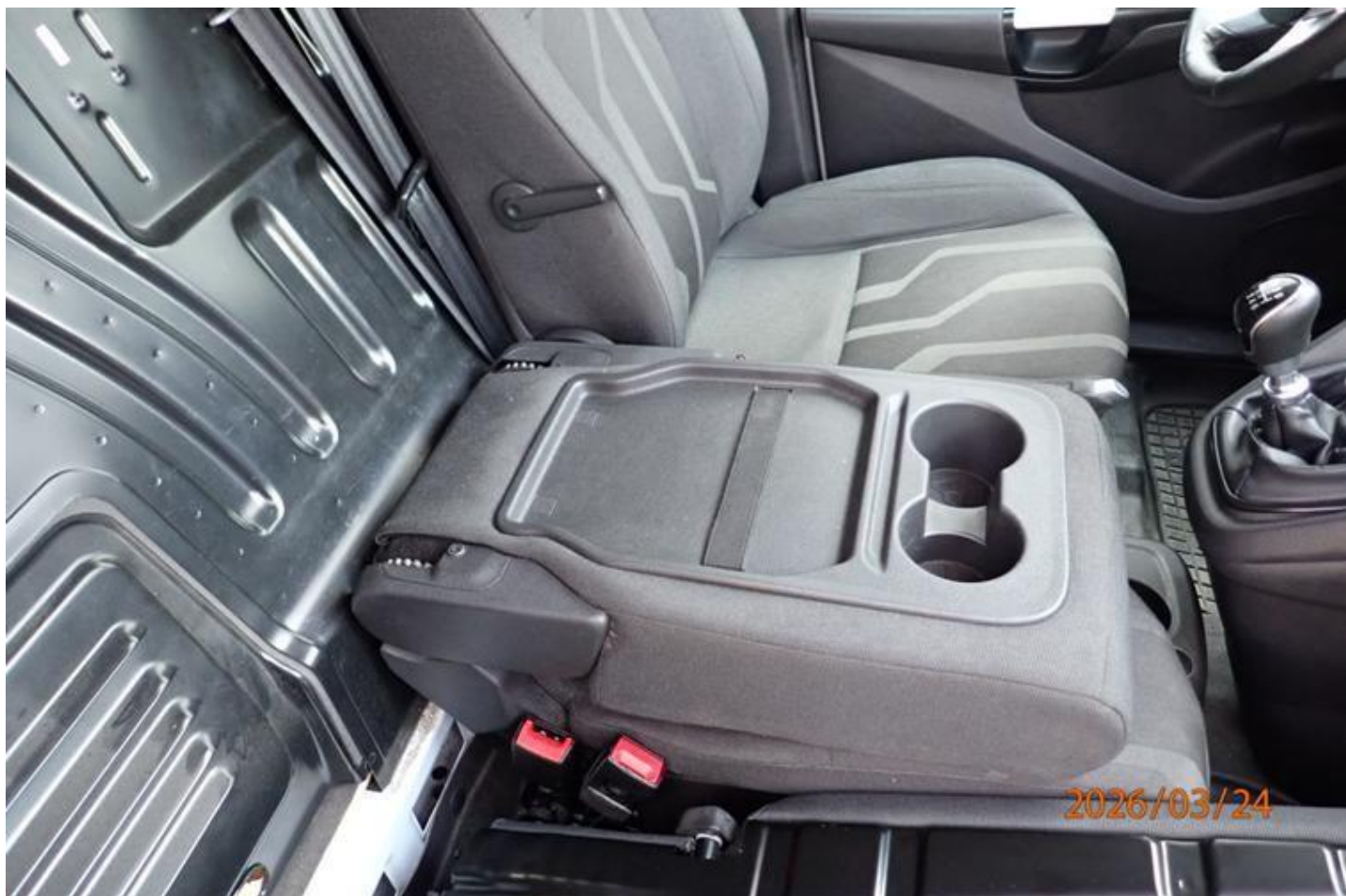
Fot. nr 130