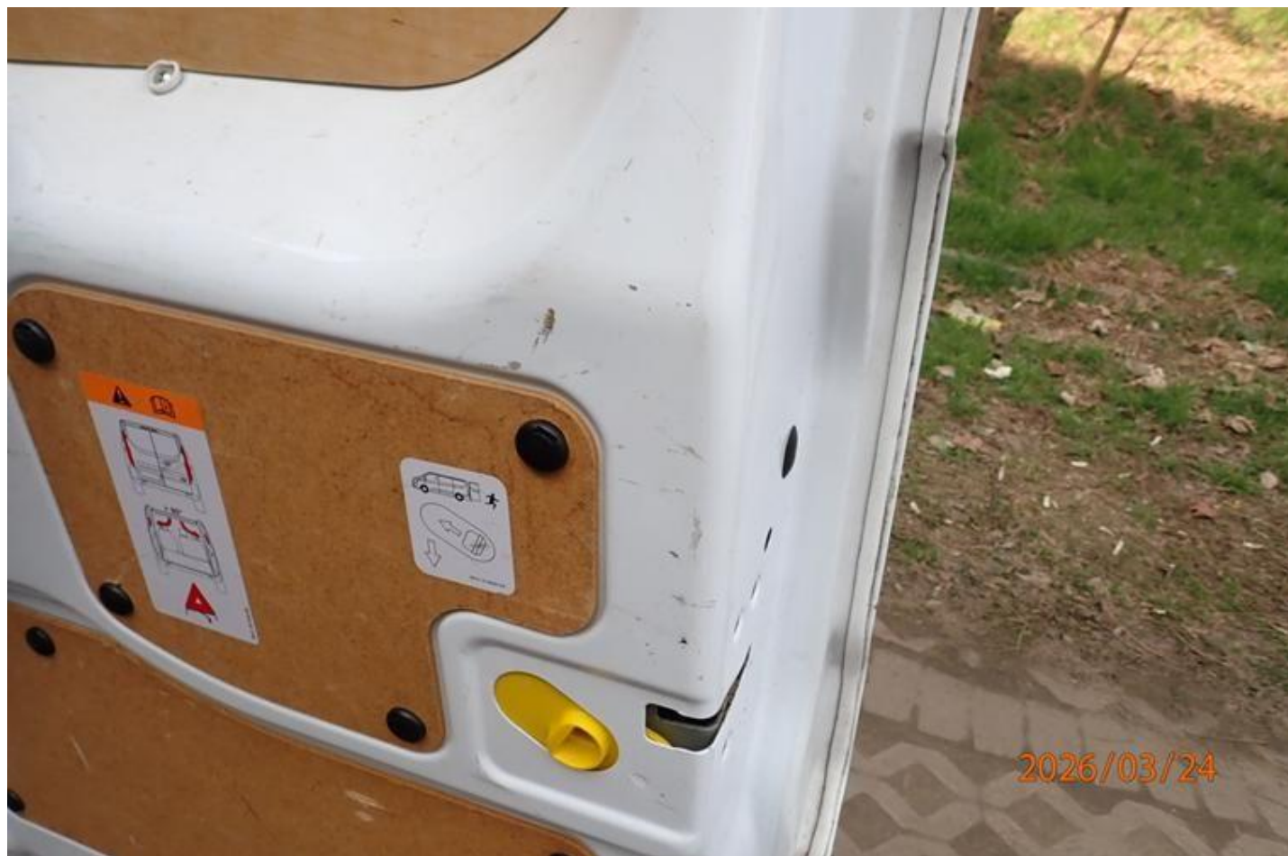
Fot. nr 100