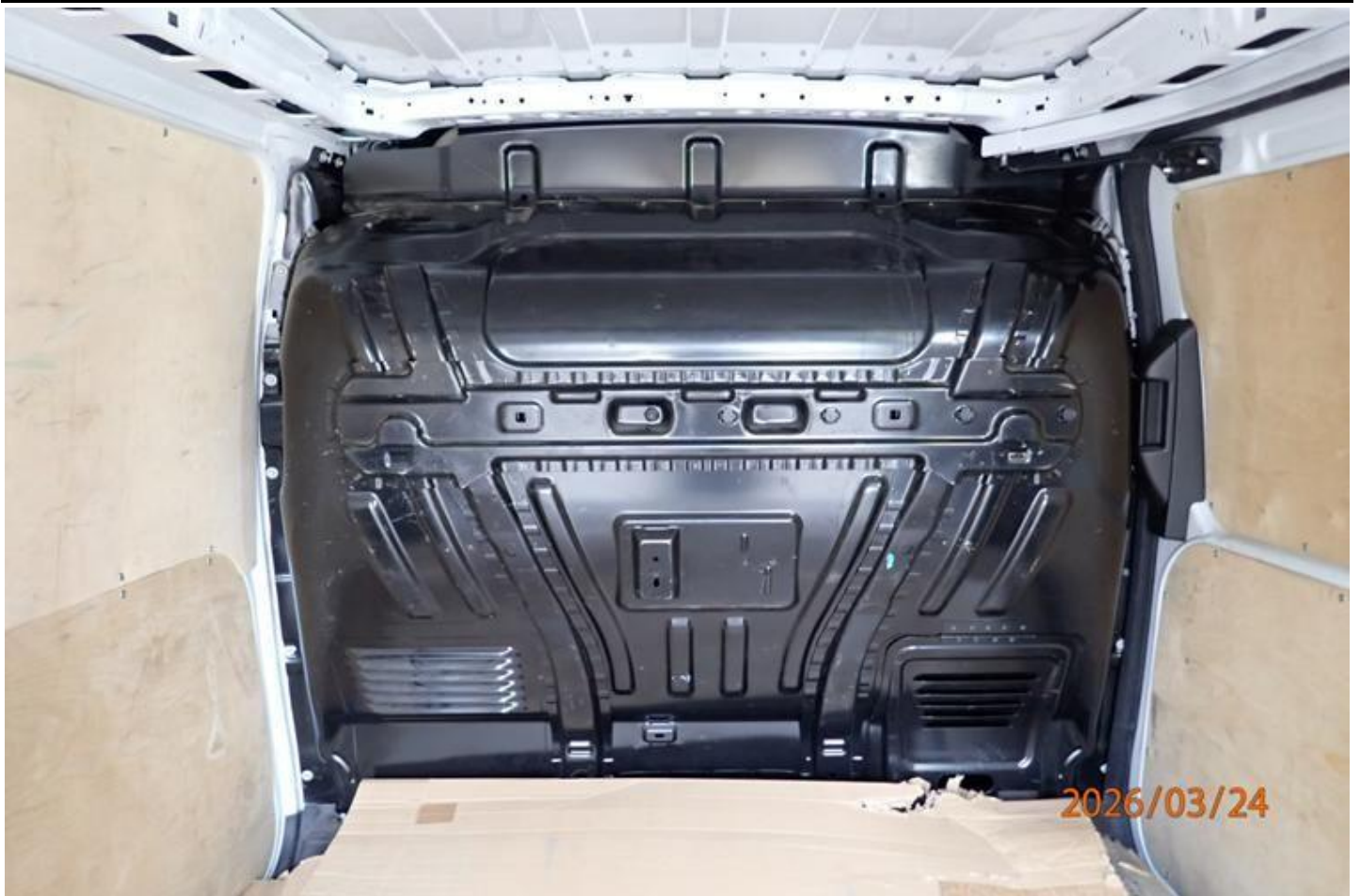
Fot. nr 113