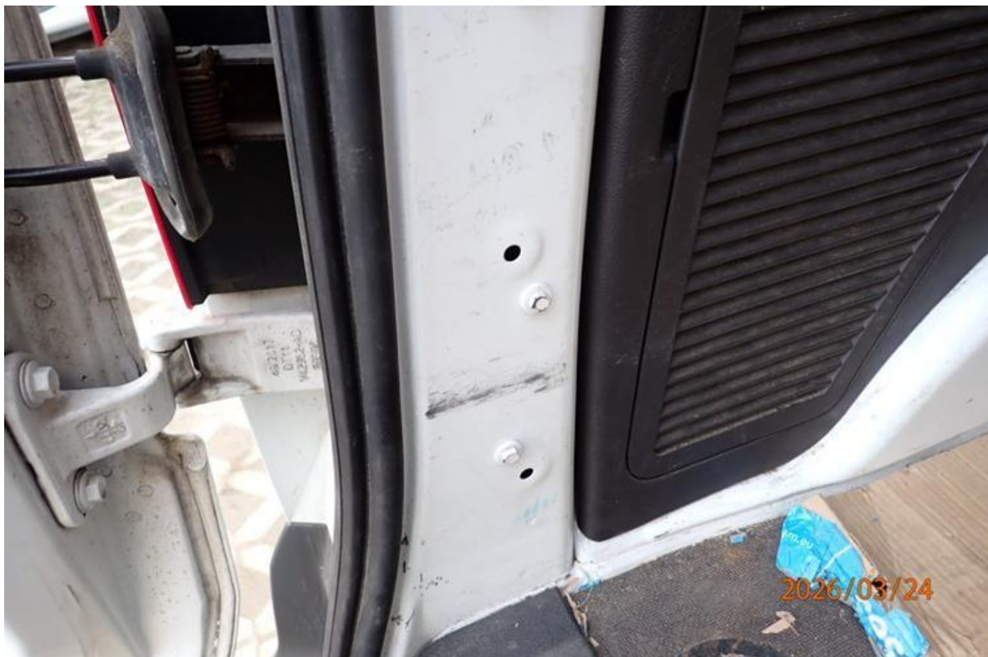
Fot. nr 106