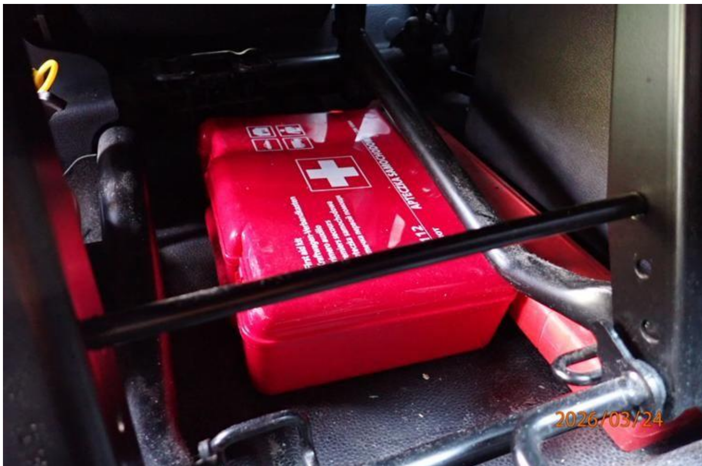
Fot. nr 126