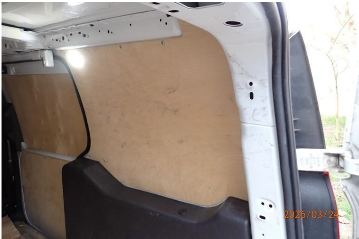
Fot. nr 116