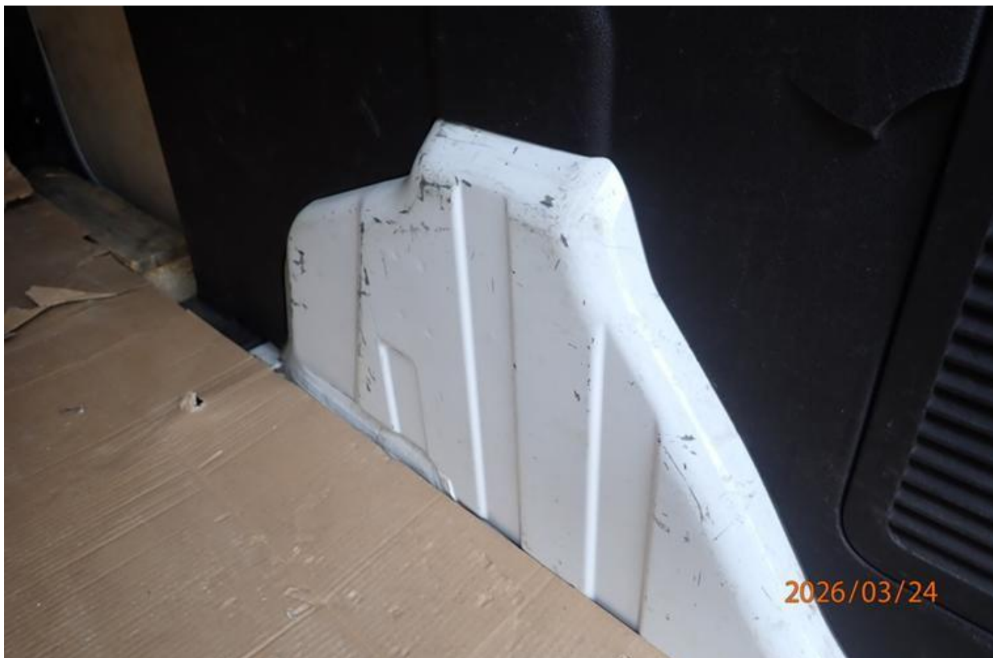
Fot. nr 118