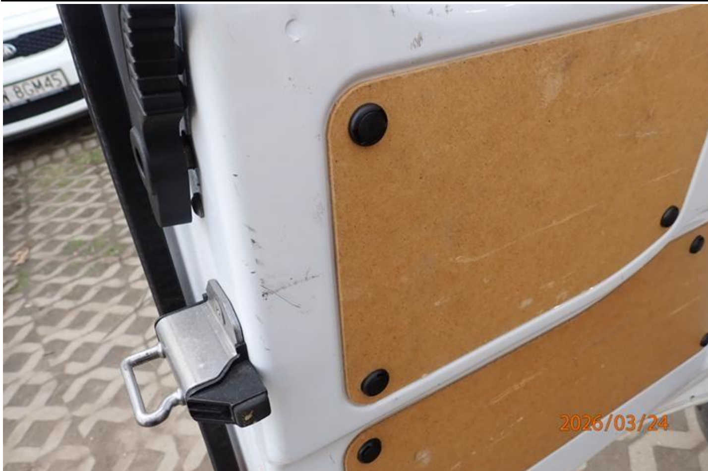
Fot. nr 97