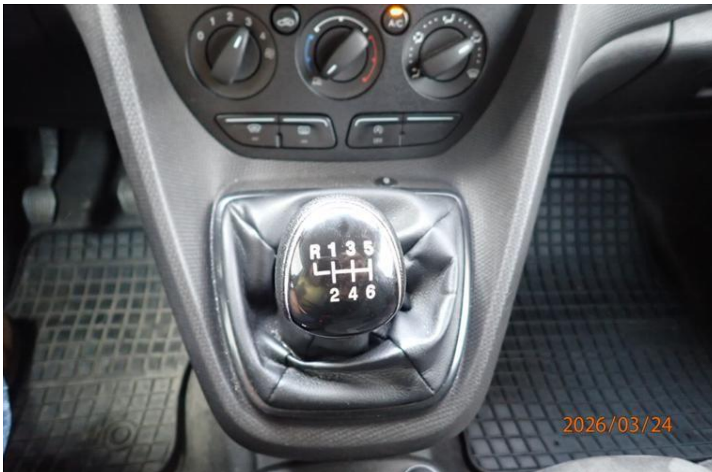
Fot. nr 158