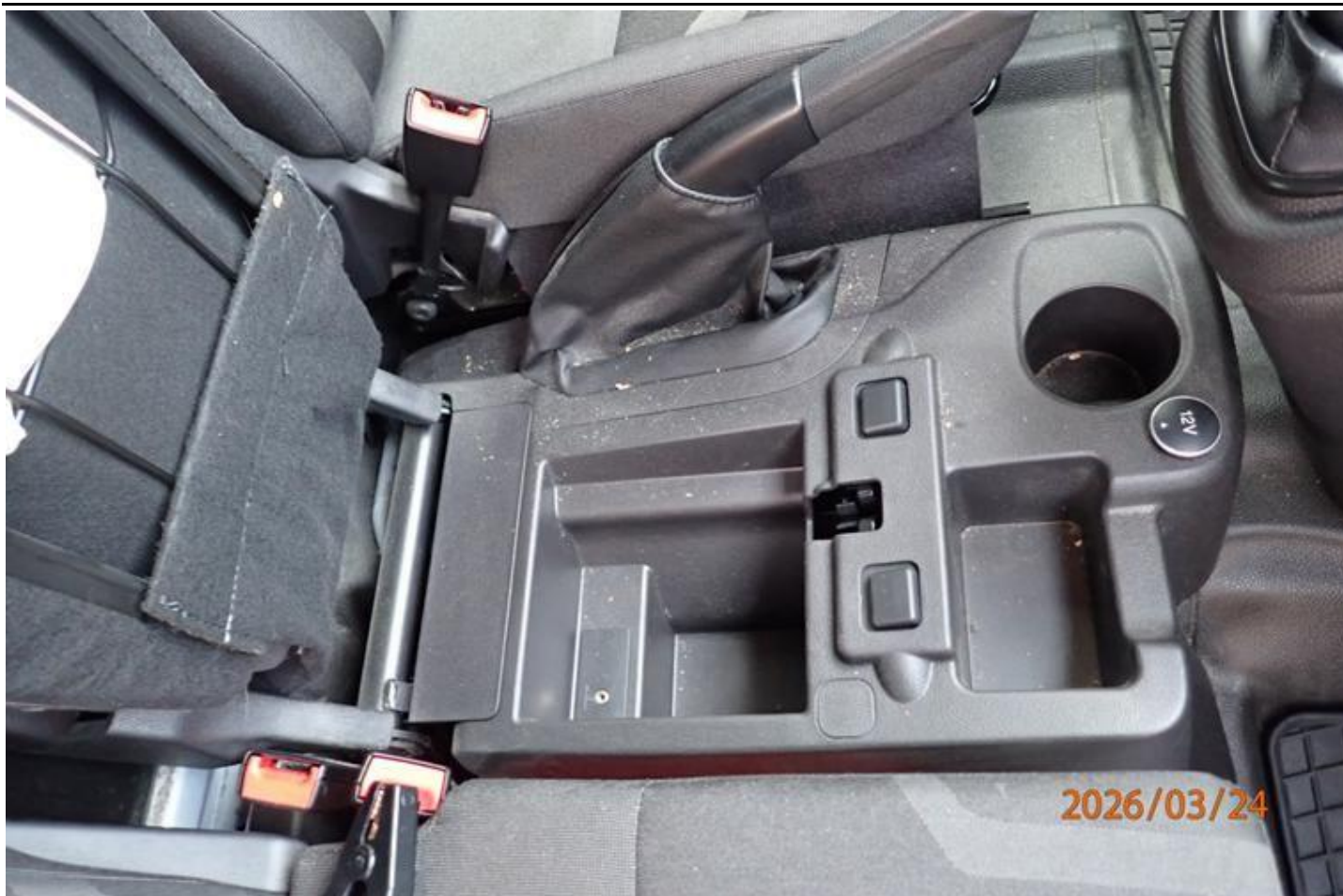
Fot. nr 125