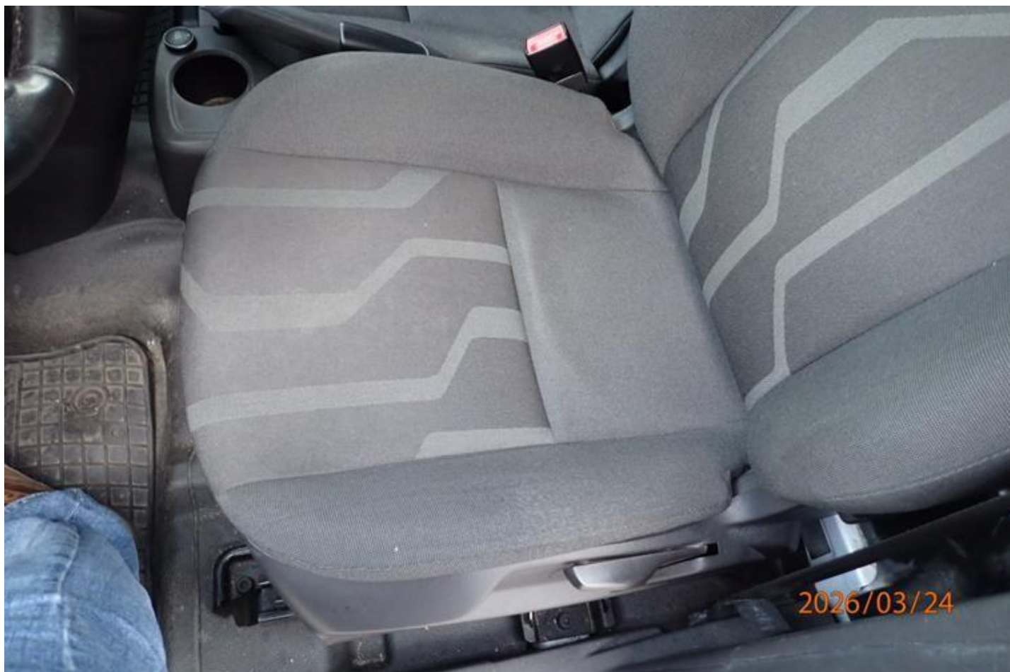
Fot. nr 144