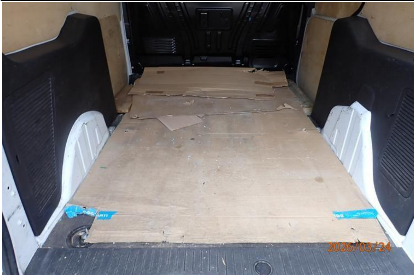
Fot. nr 103