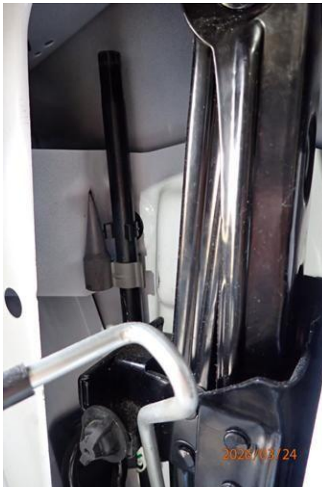
Fot. nr 110