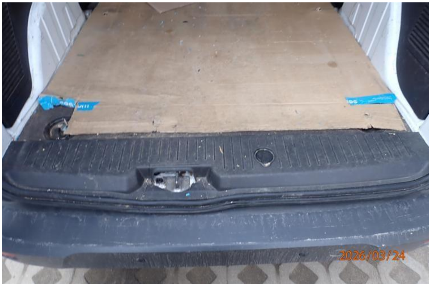
Fot. nr 102