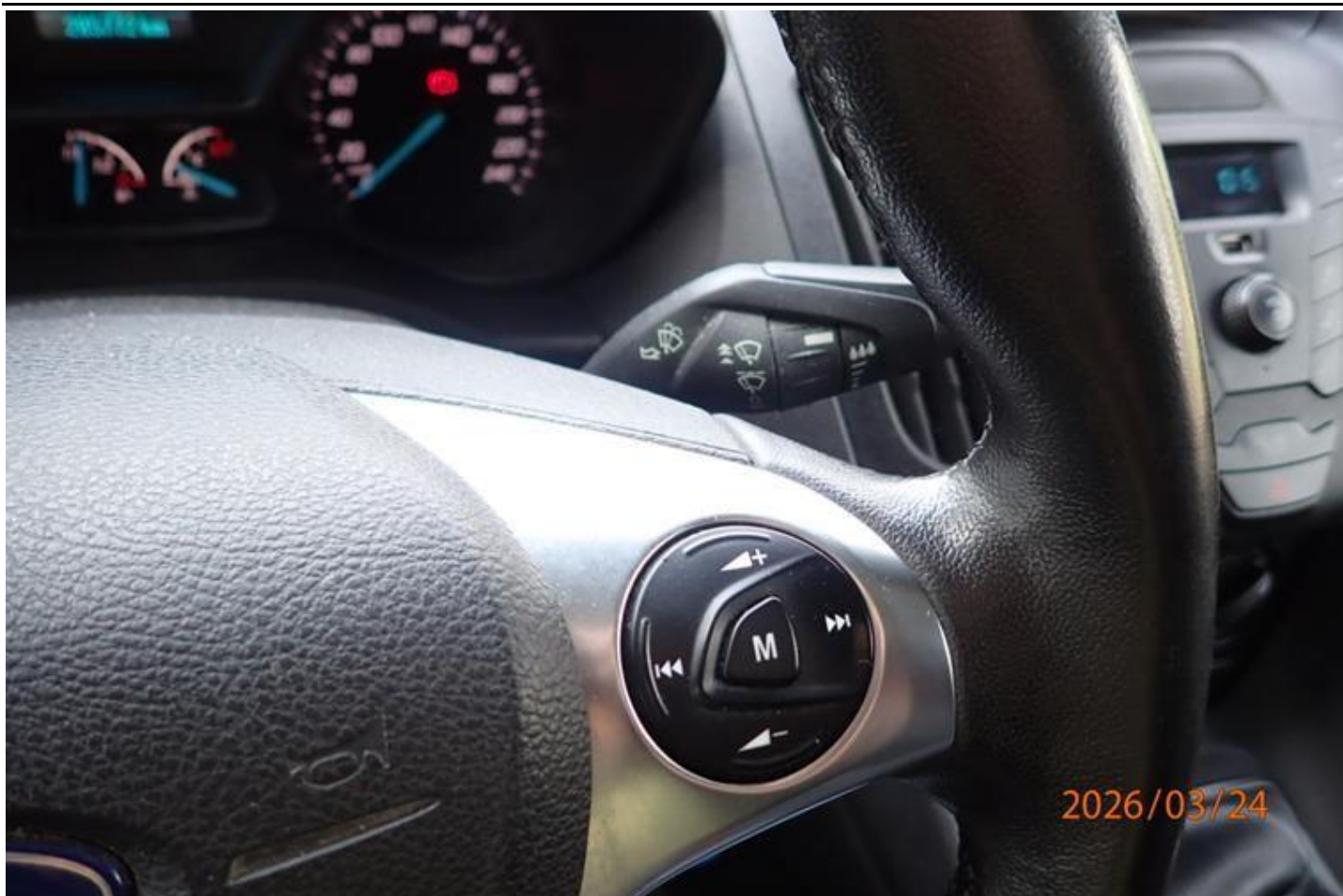
Fot. nr 151