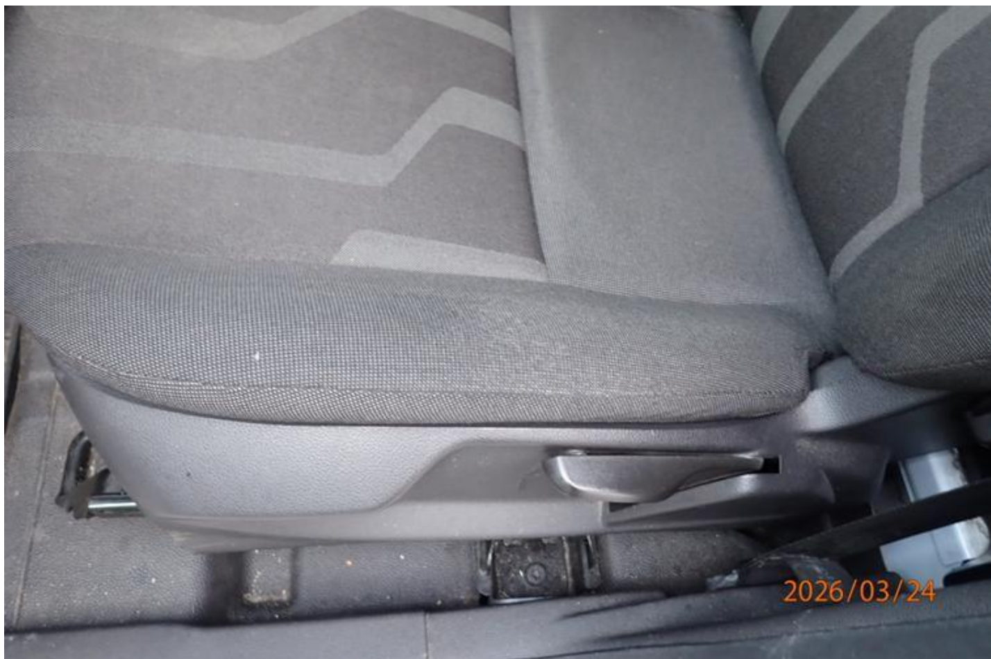
Fot. nr 140