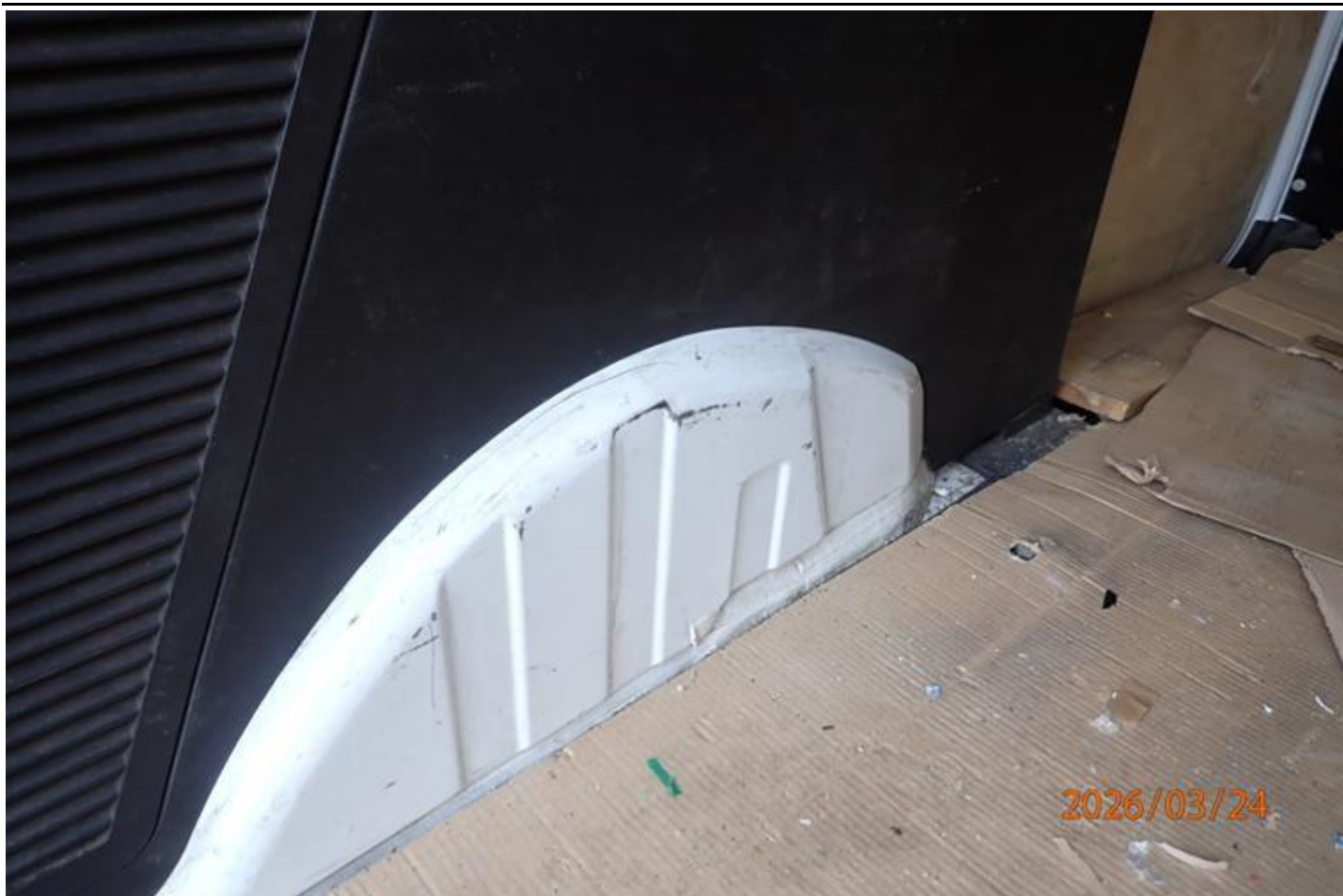
Fot. nr 107