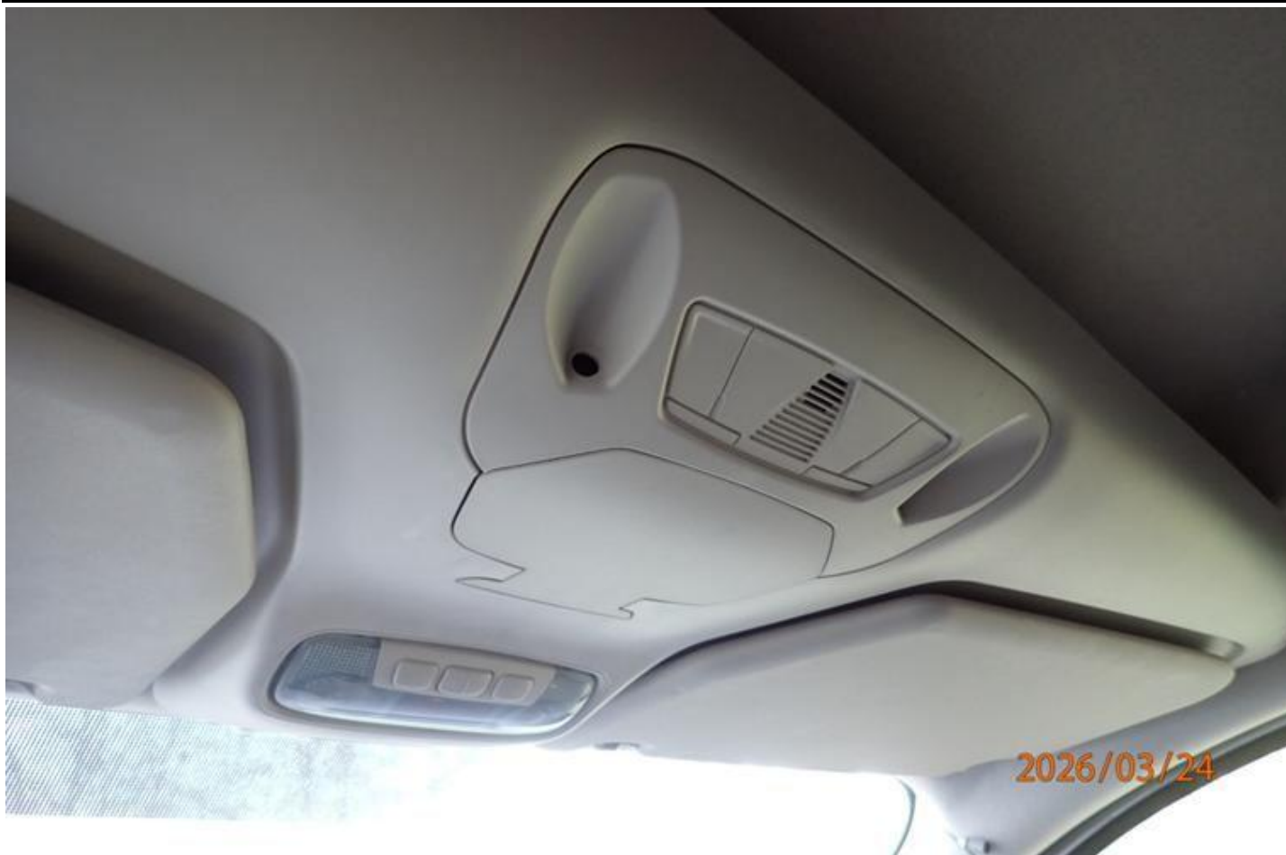
Fot. nr 145