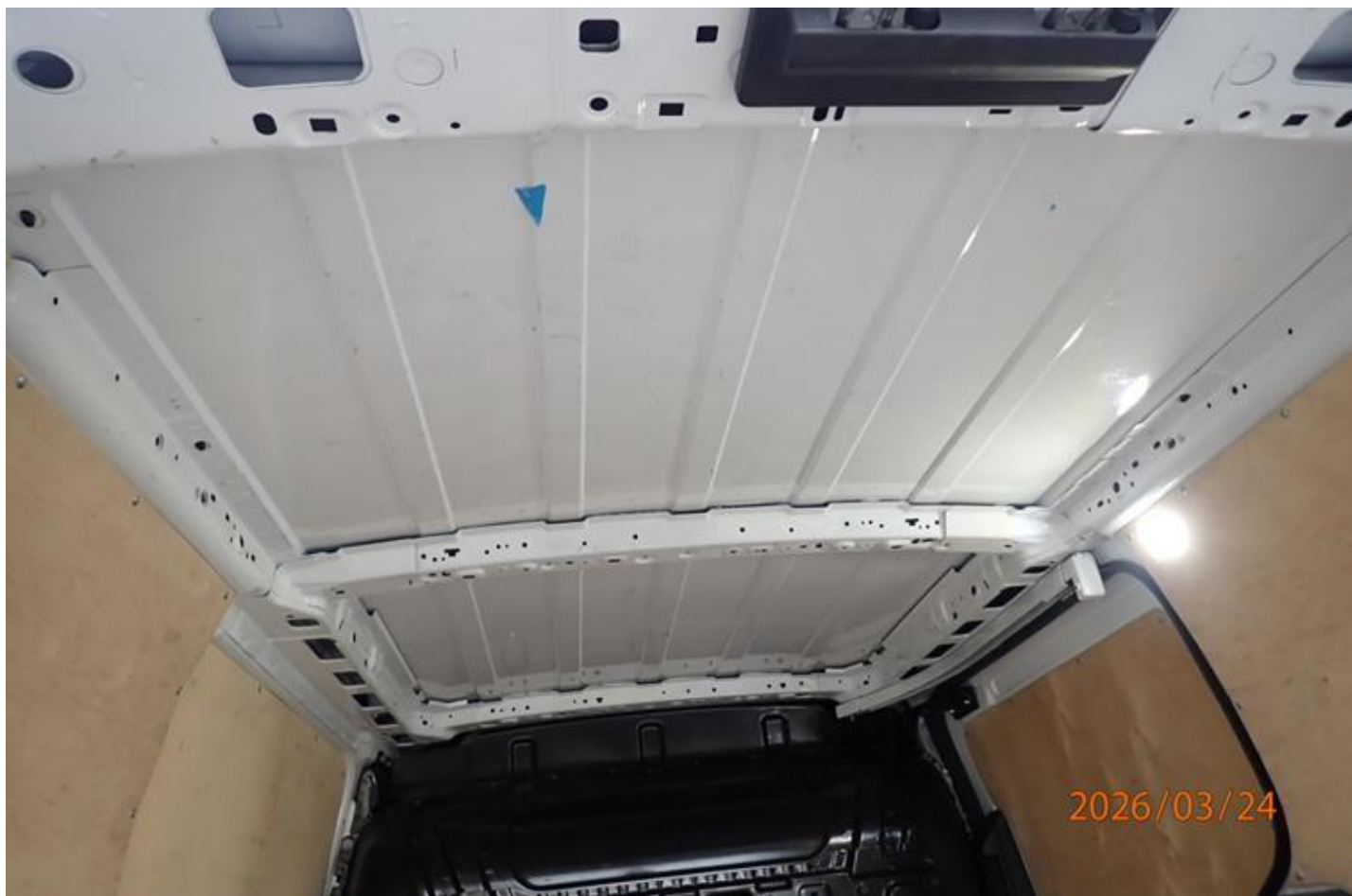
Fot. nr 112