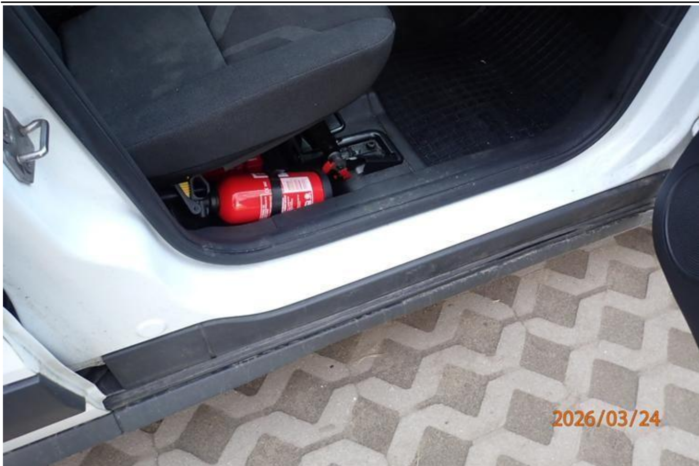
Fot. nr 123