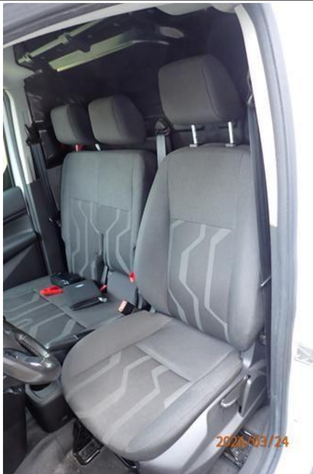
Fot. nr 139