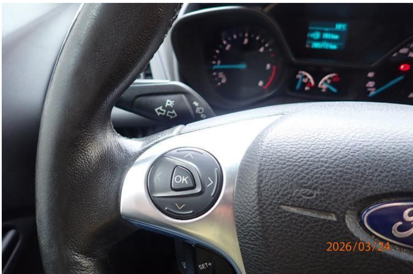
Fot. nr 149