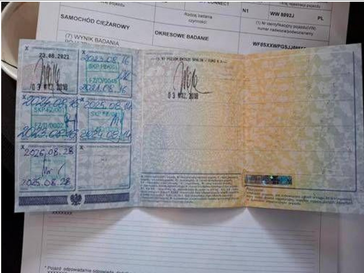
Fot. nr 163