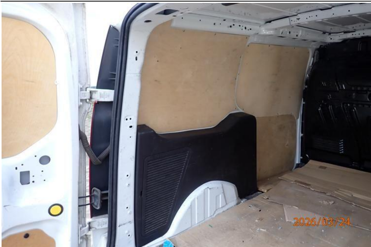
Fot. nr 105