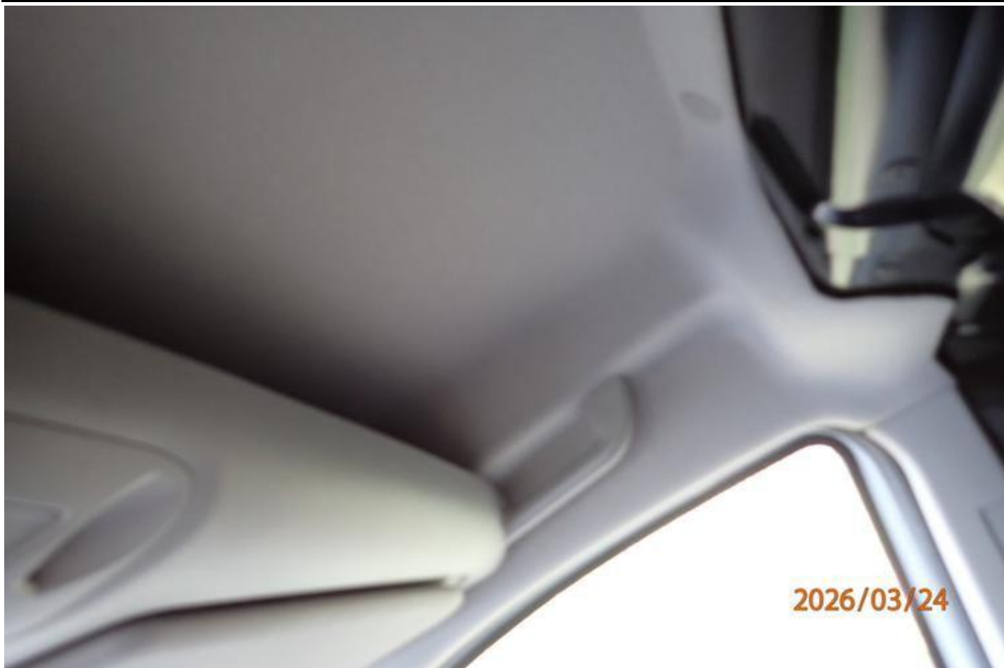
Fot. nr 147