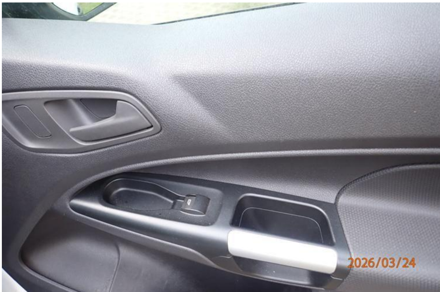
Fot. nr 122