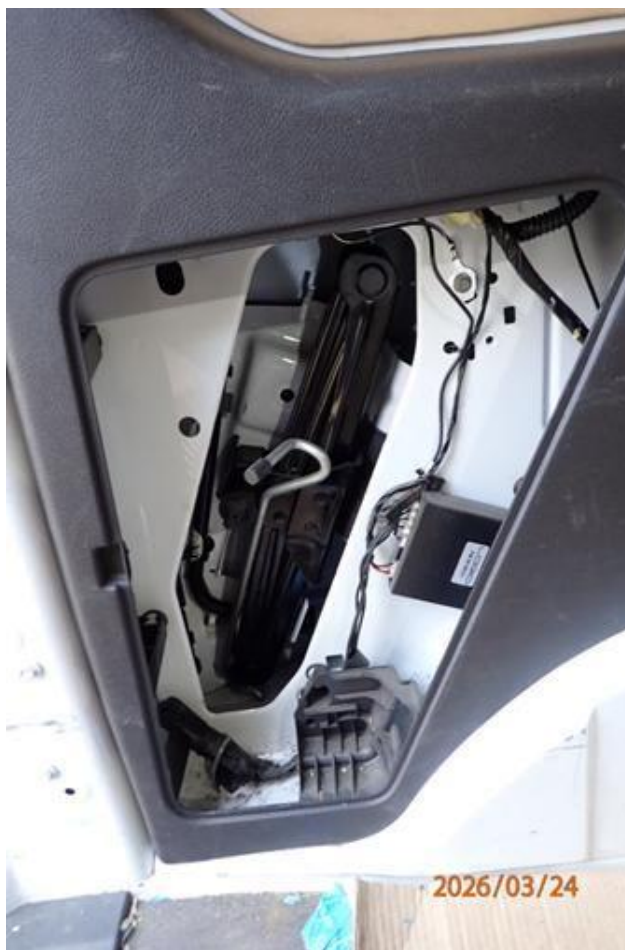
Fot. nr 108