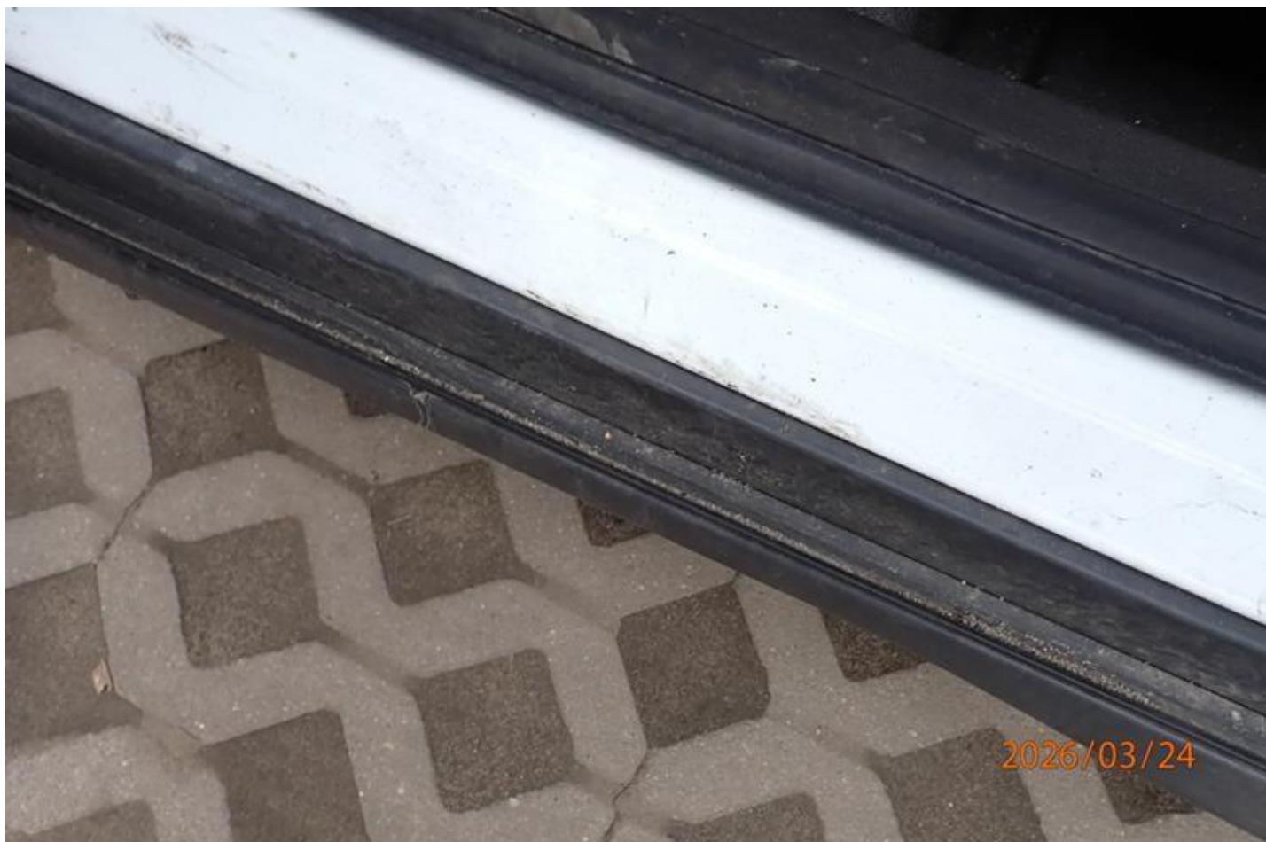
Fot. nr 138