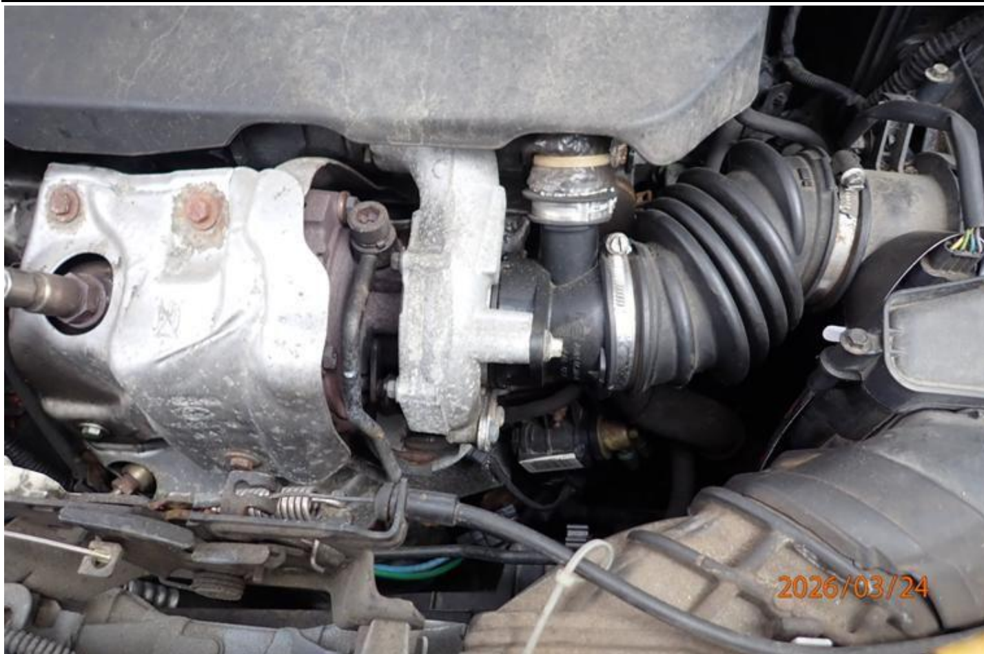
Fot. nr 93