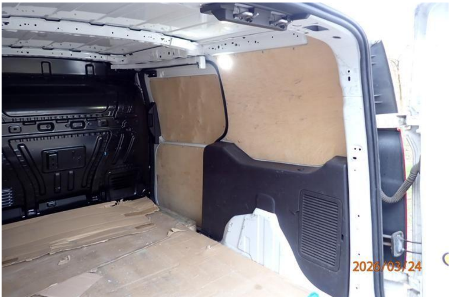
Fot. nr 114