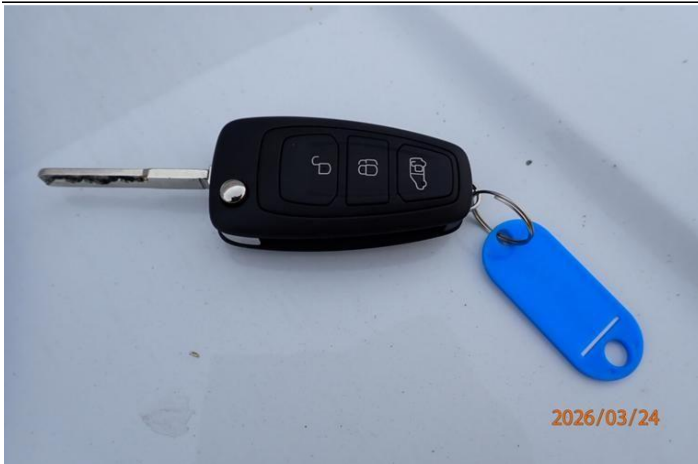
Fot. nr 161