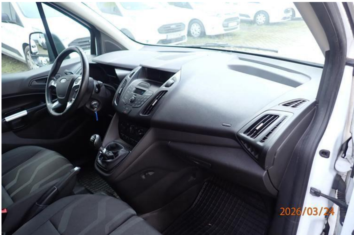
Fot. nr 132