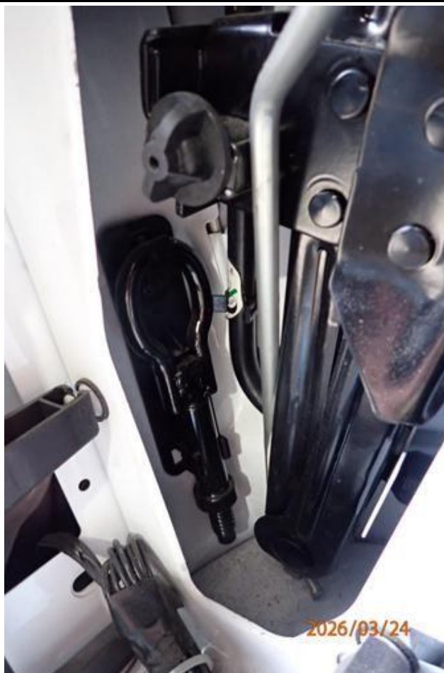
Fot. nr 111