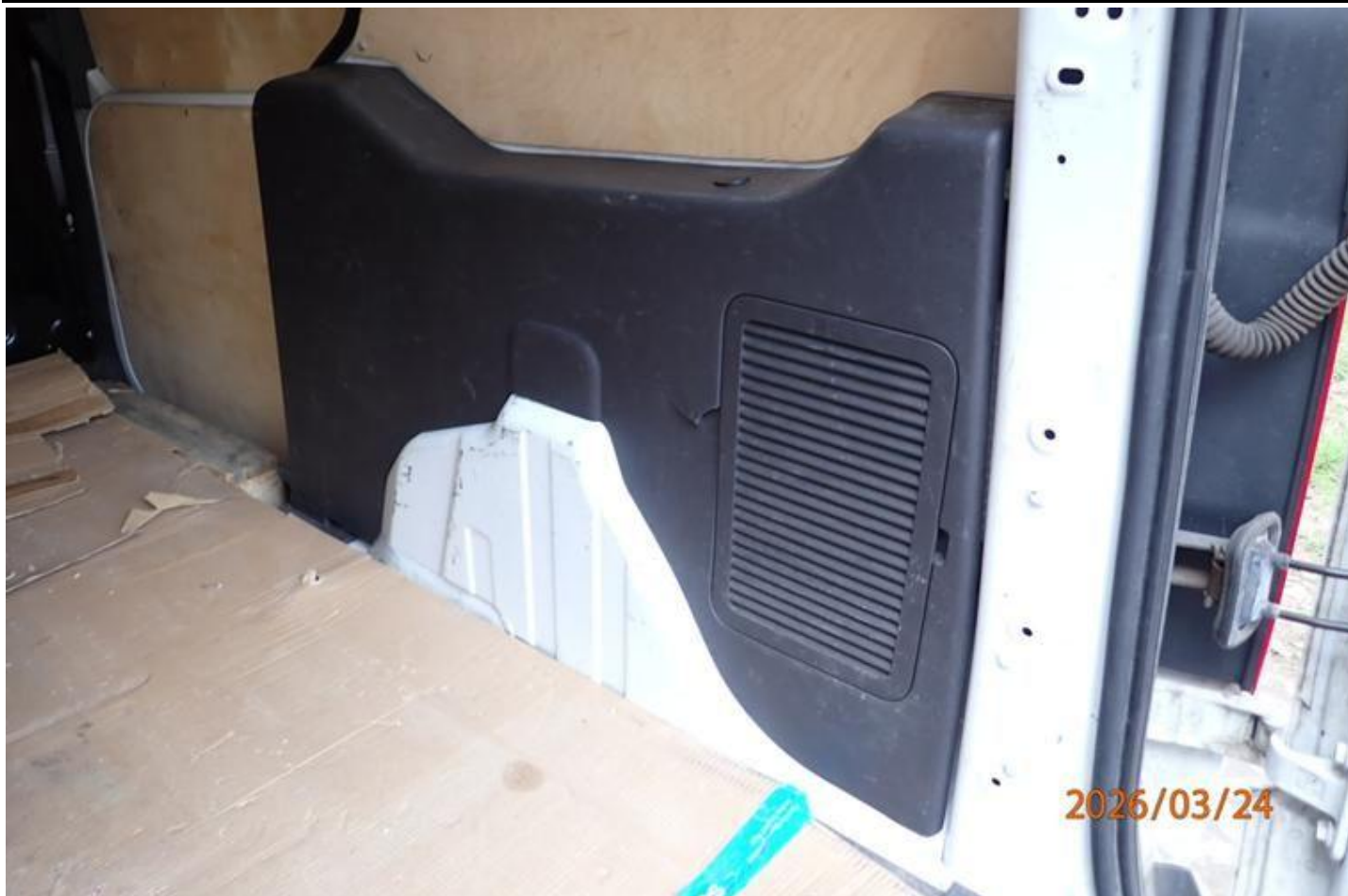
Fot. nr 117