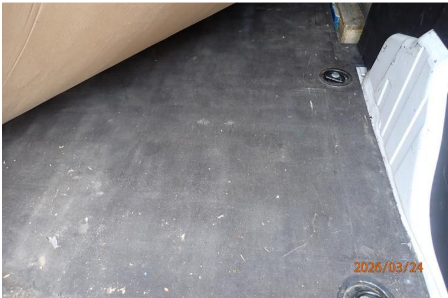
Fot. nr 104