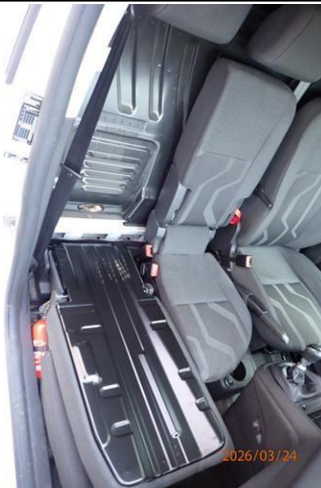
Fot. nr 129