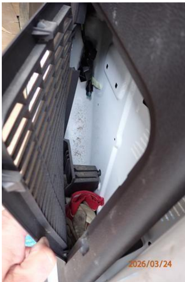
Fot. nr 120