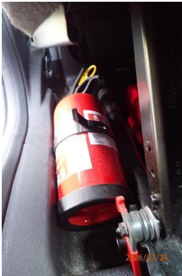
Fot. nr 128