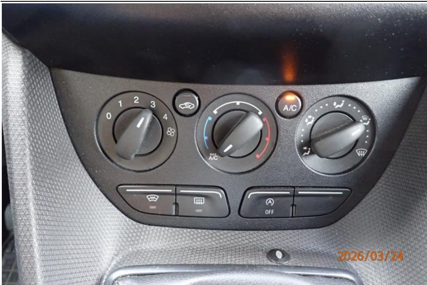
Fot. nr 157