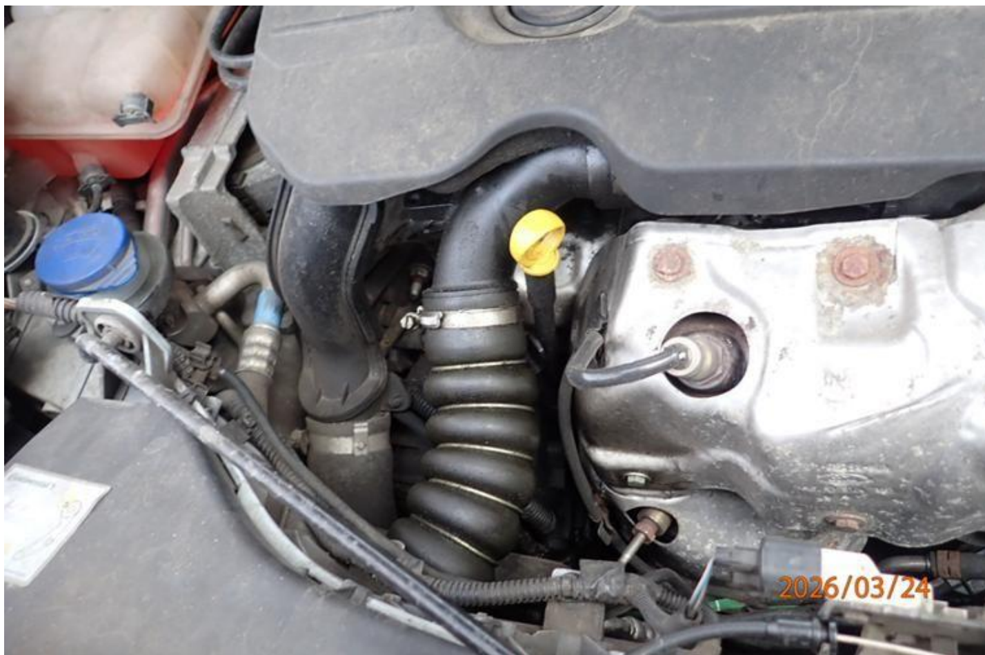
Fot. nr 92