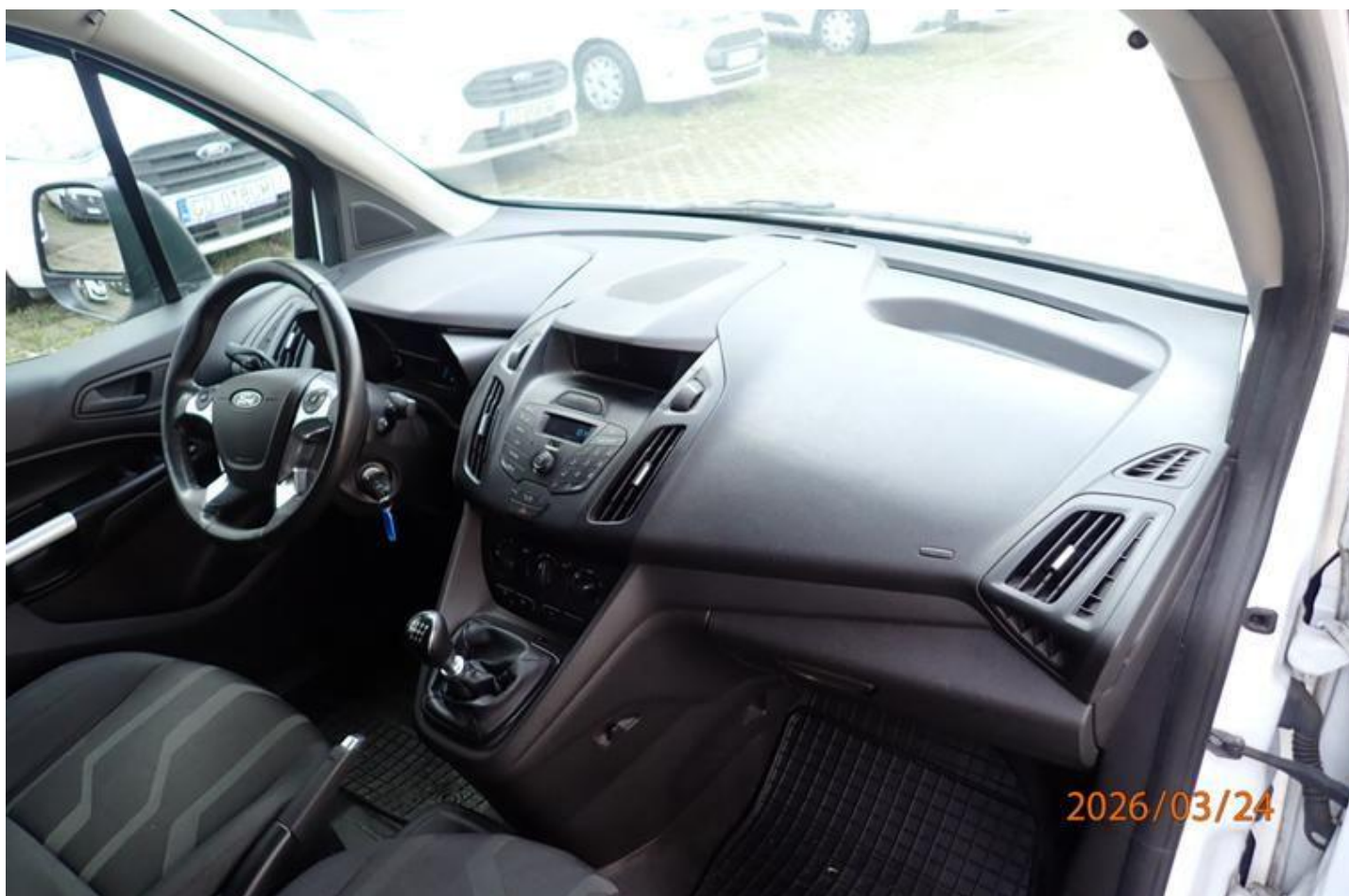
Fot. nr 134