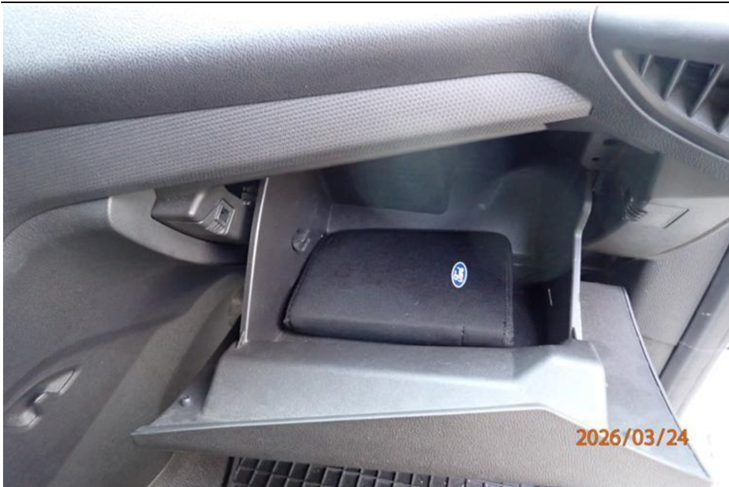
Fot. nr 131