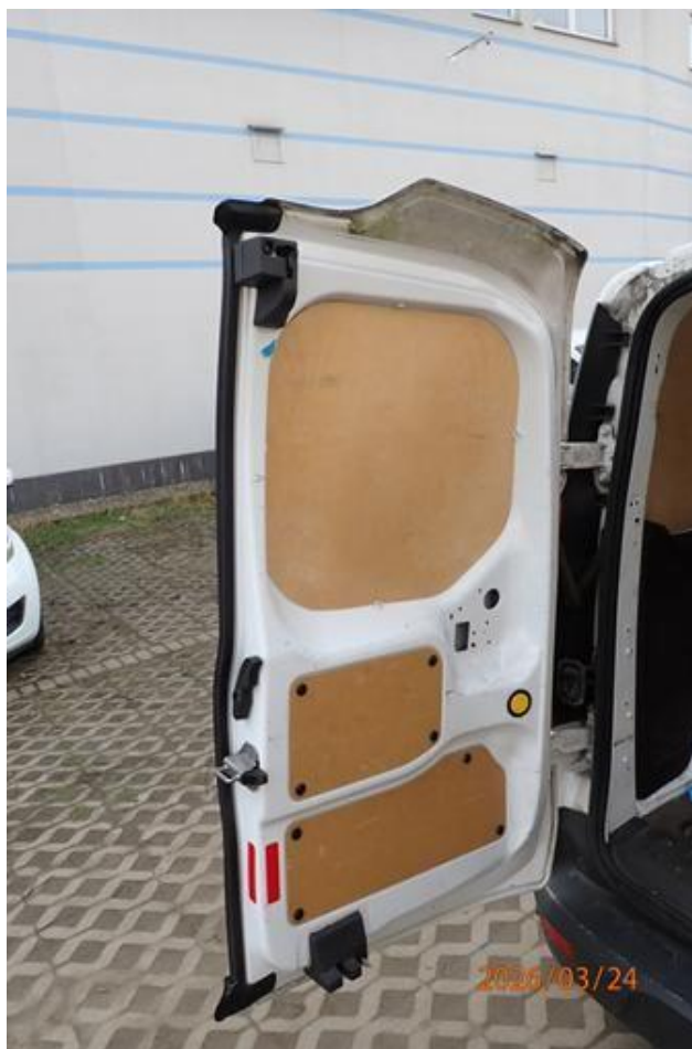
Fot. nr 96