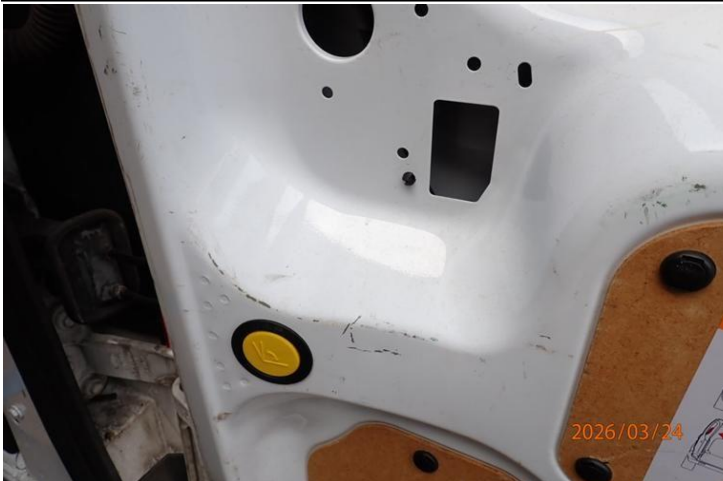
Fot. nr 101