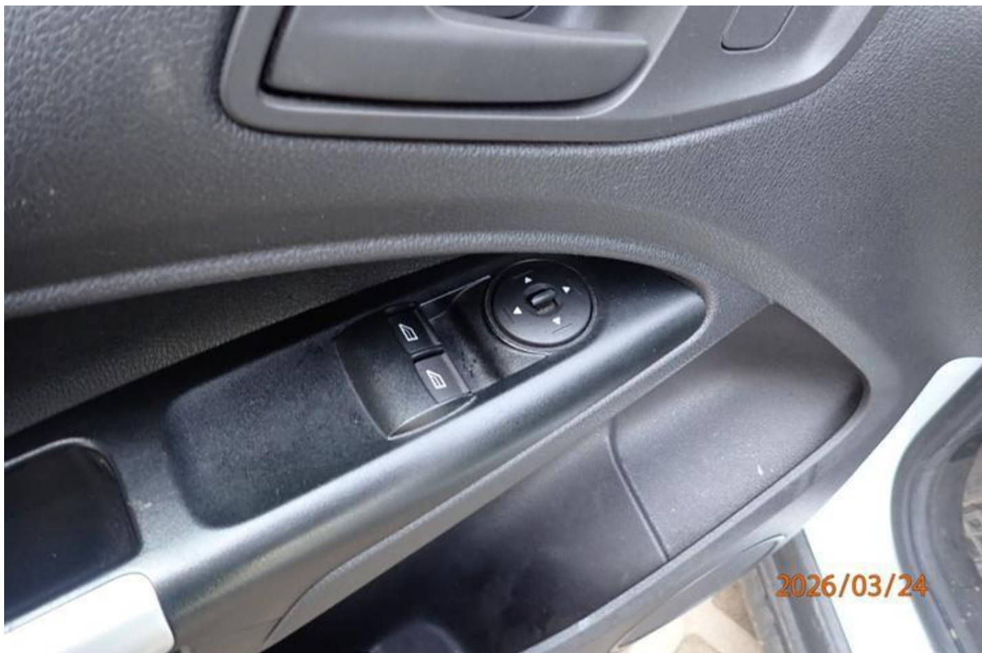
Fot. nr 136