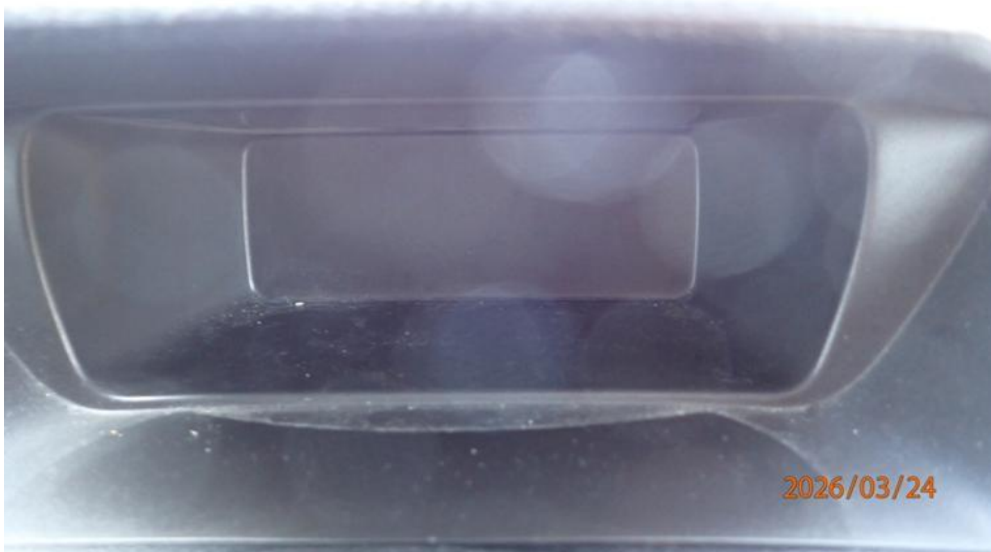
Fot. nr 154