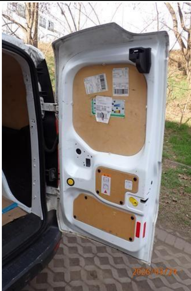
Fot. nr 99