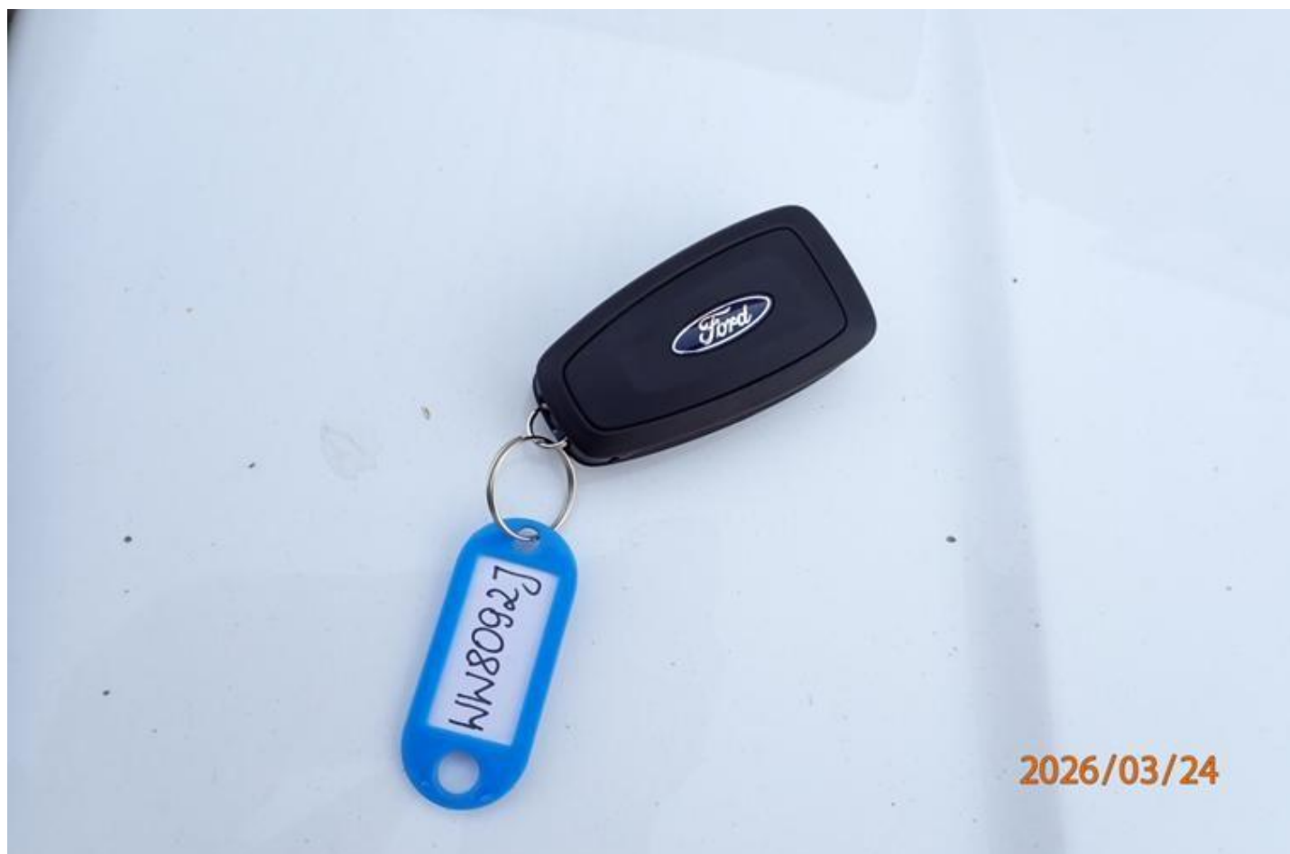
Fot. nr 162