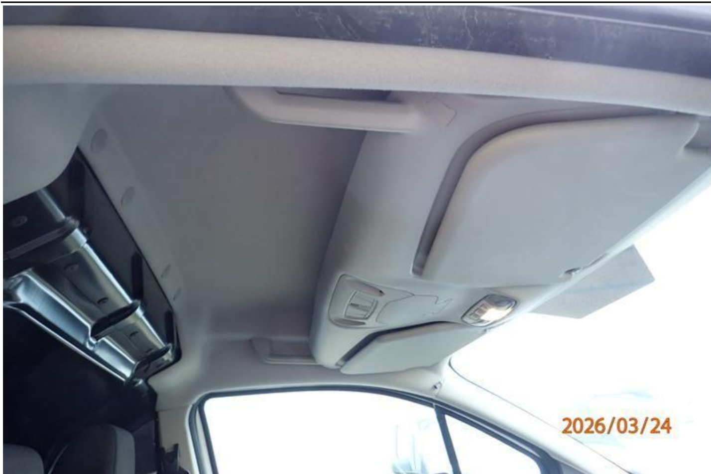
Fot. nr 133