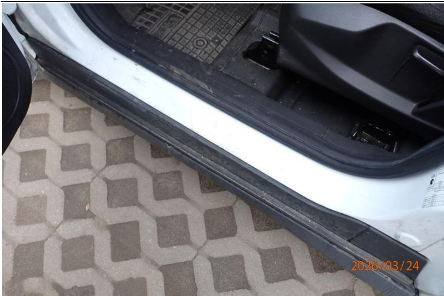
Fot. nr 137