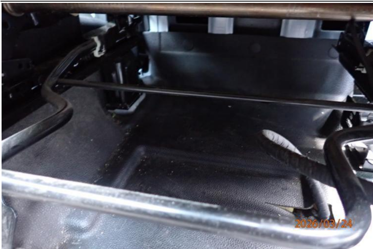
Fot. nr 141