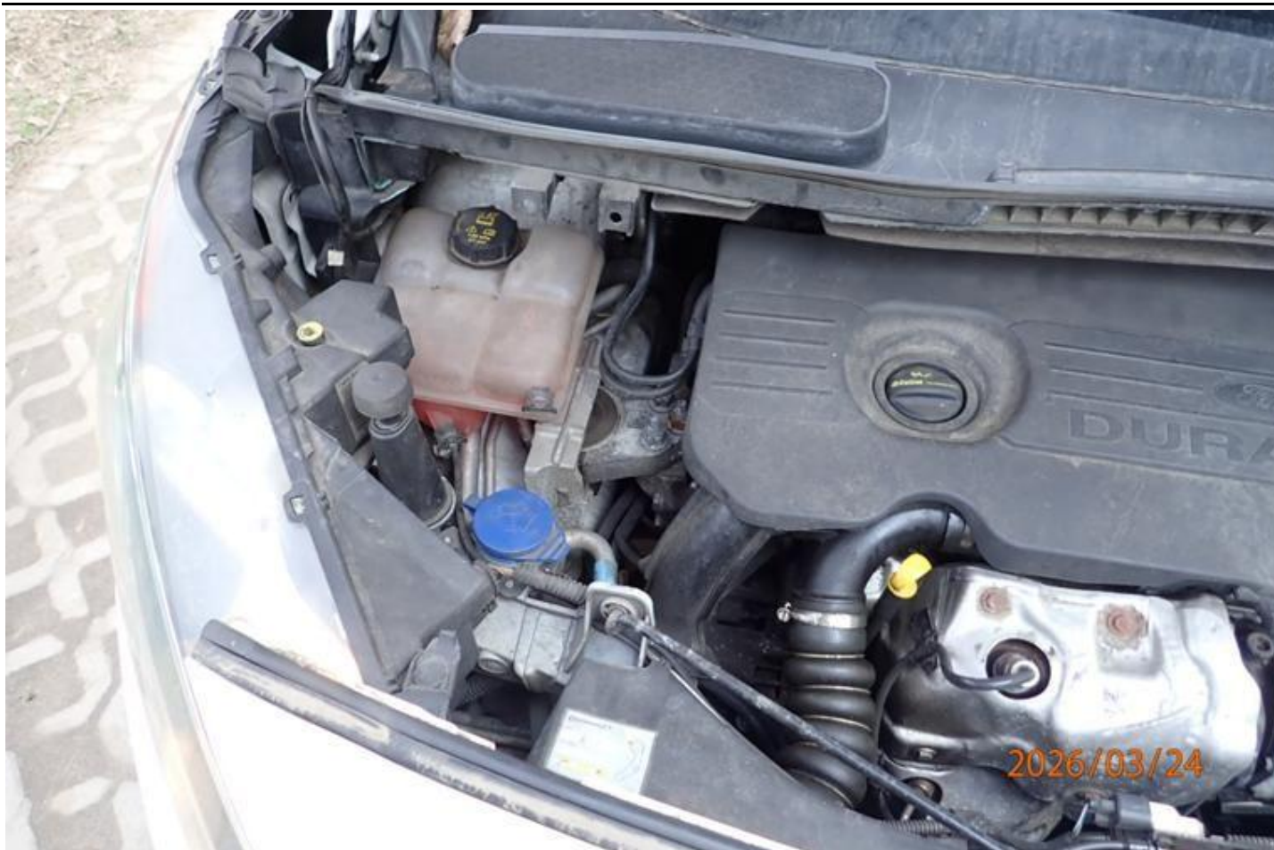
Fot. nr 91