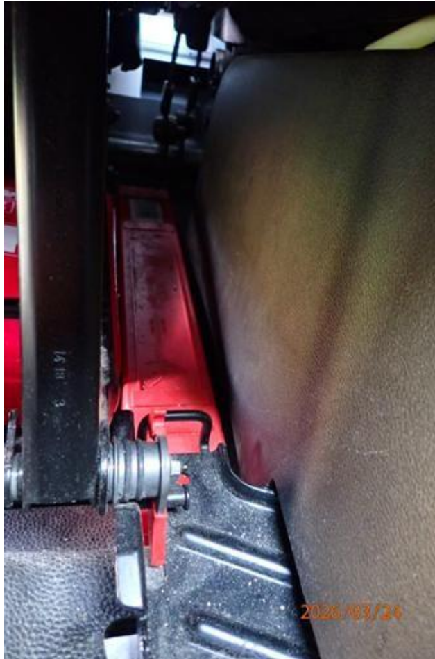
Fot. nr 127