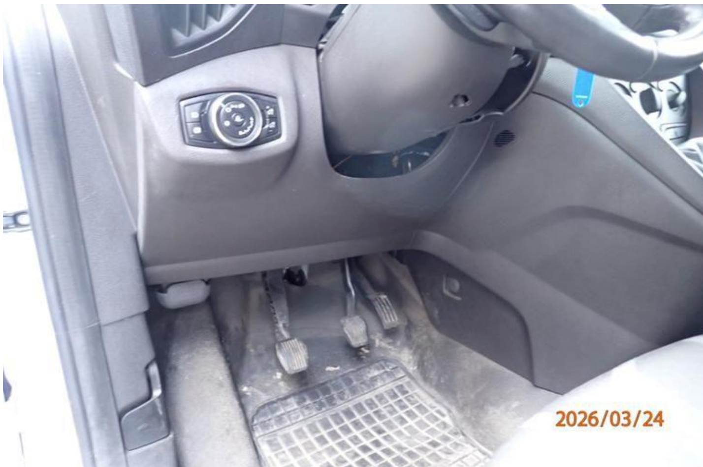
Fot. nr 142