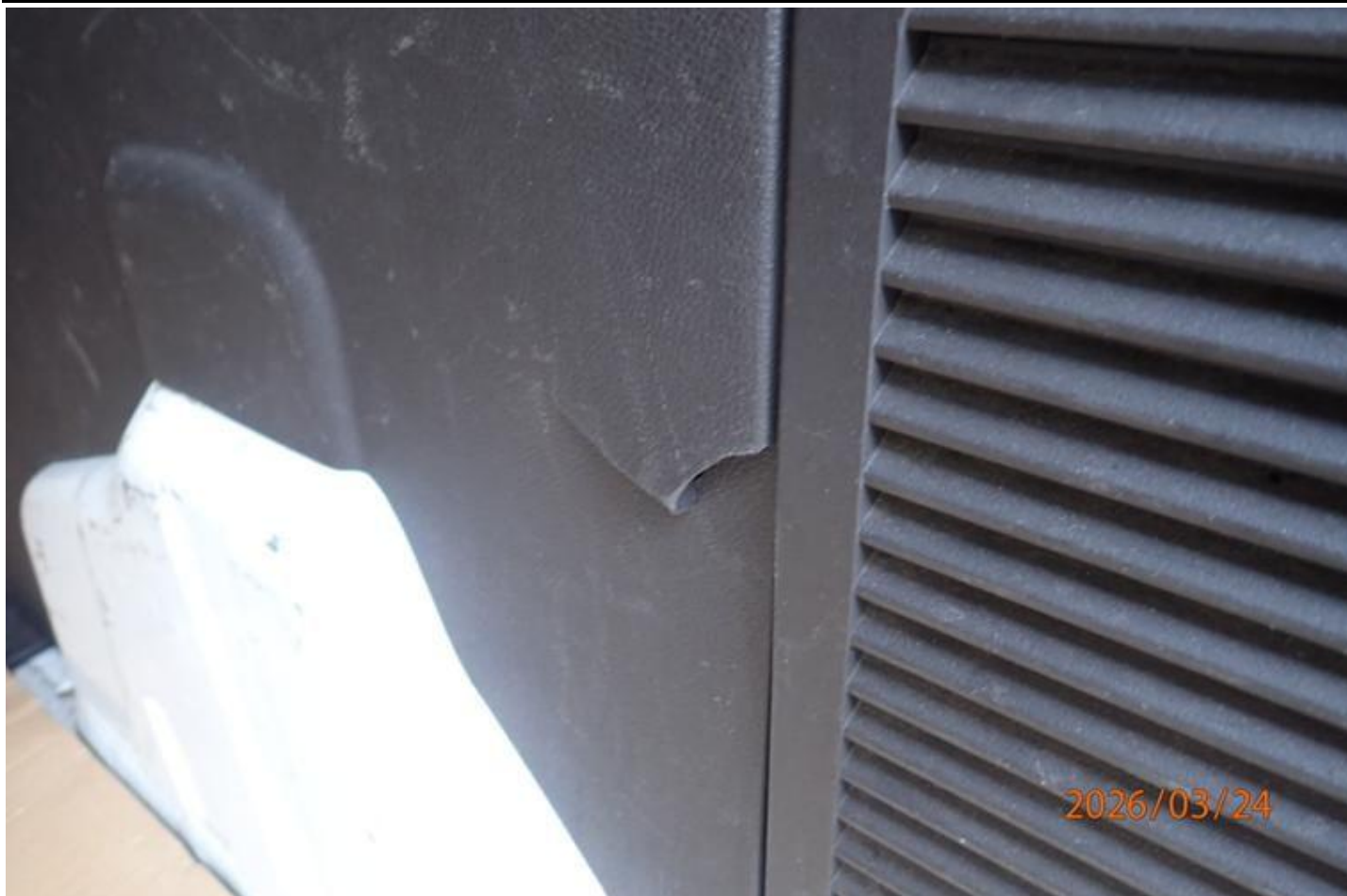
Fot. nr 119