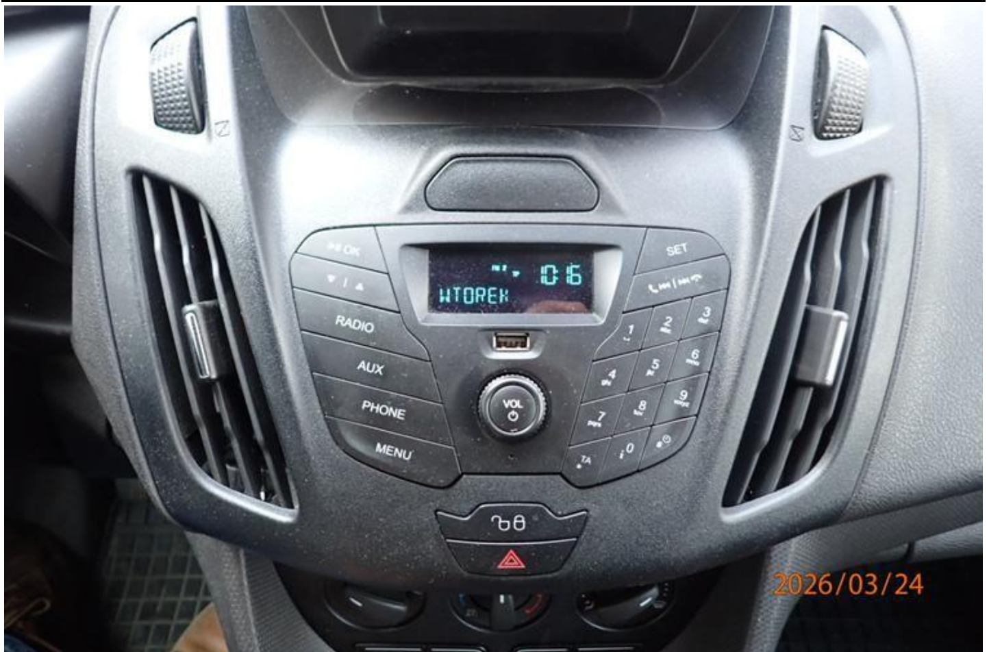
Fot. nr 155