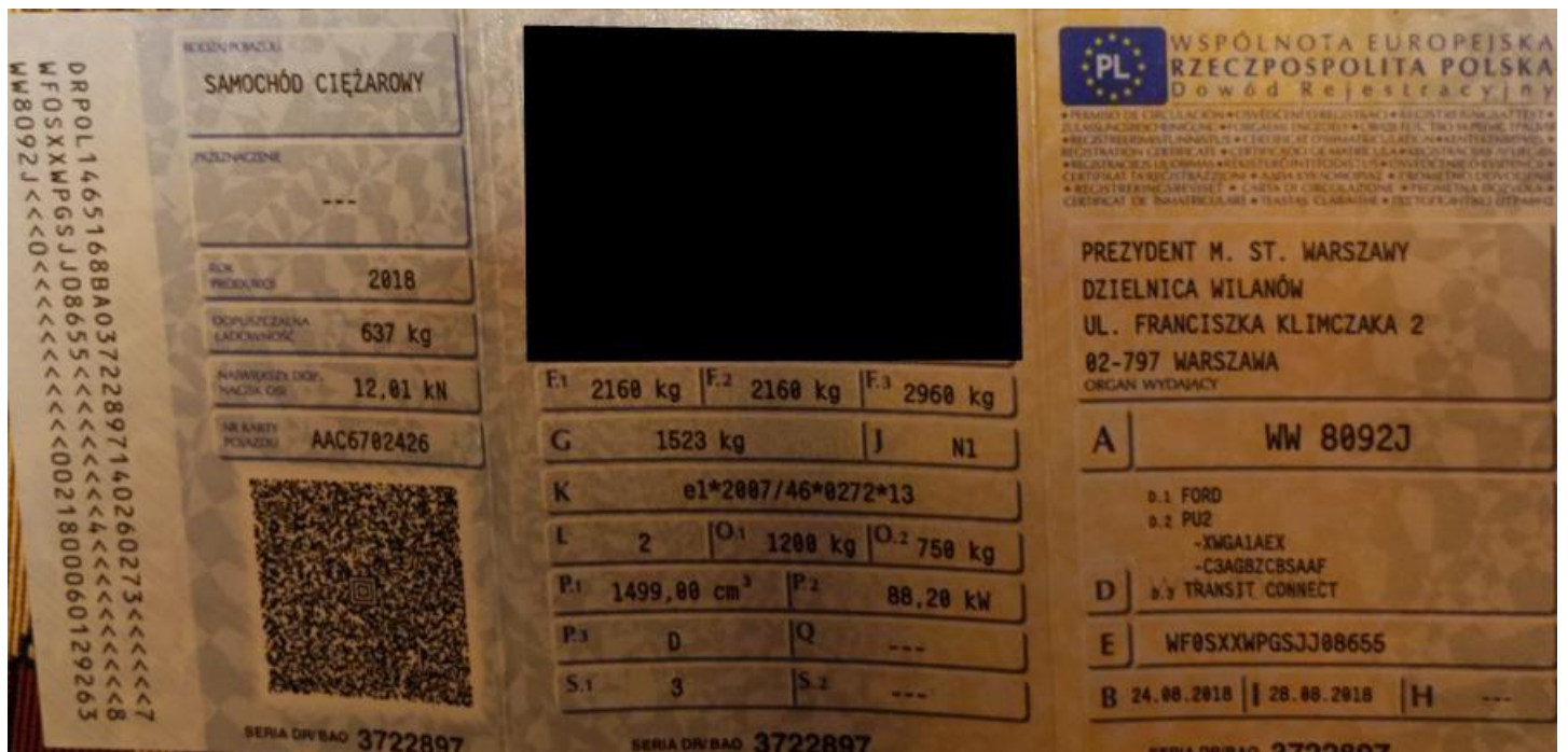
Fot. nr 164

Dokument wystawiony elektronicznie, wa ny bez podpisu