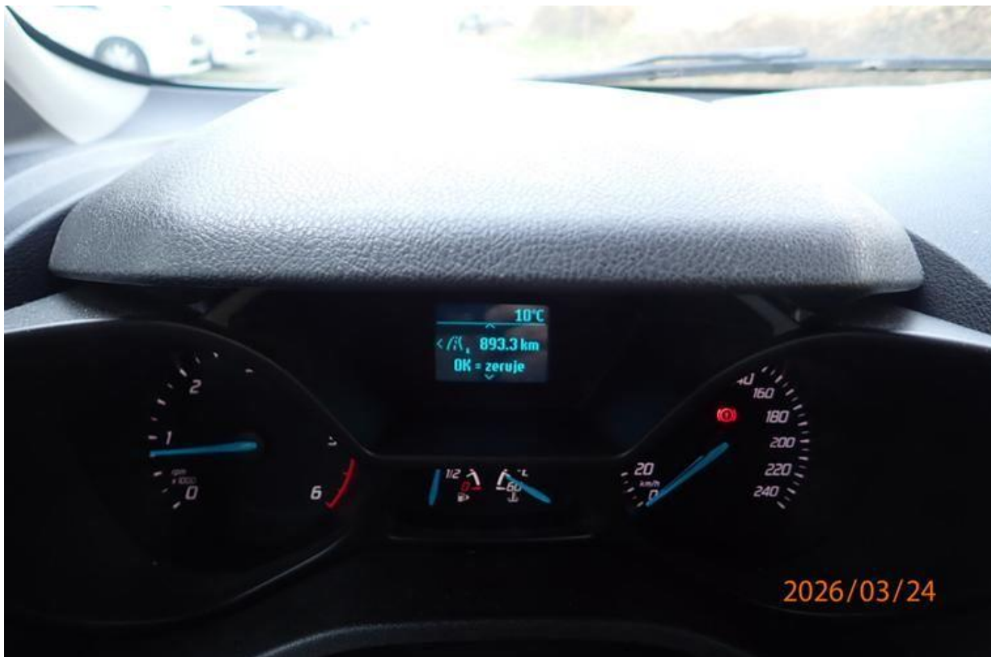
Fot. nr 160