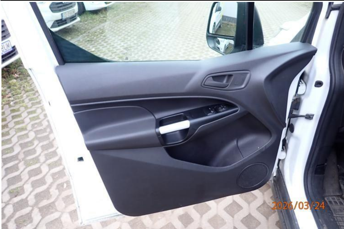
Fot. nr 135