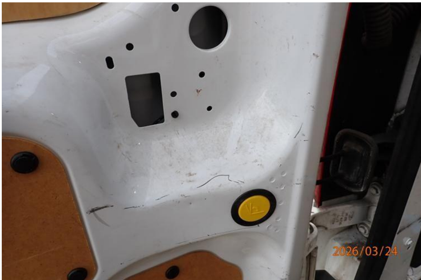
Fot. nr 98