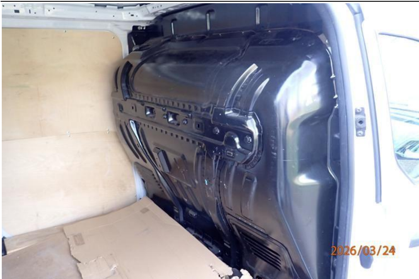
Fot. nr 95