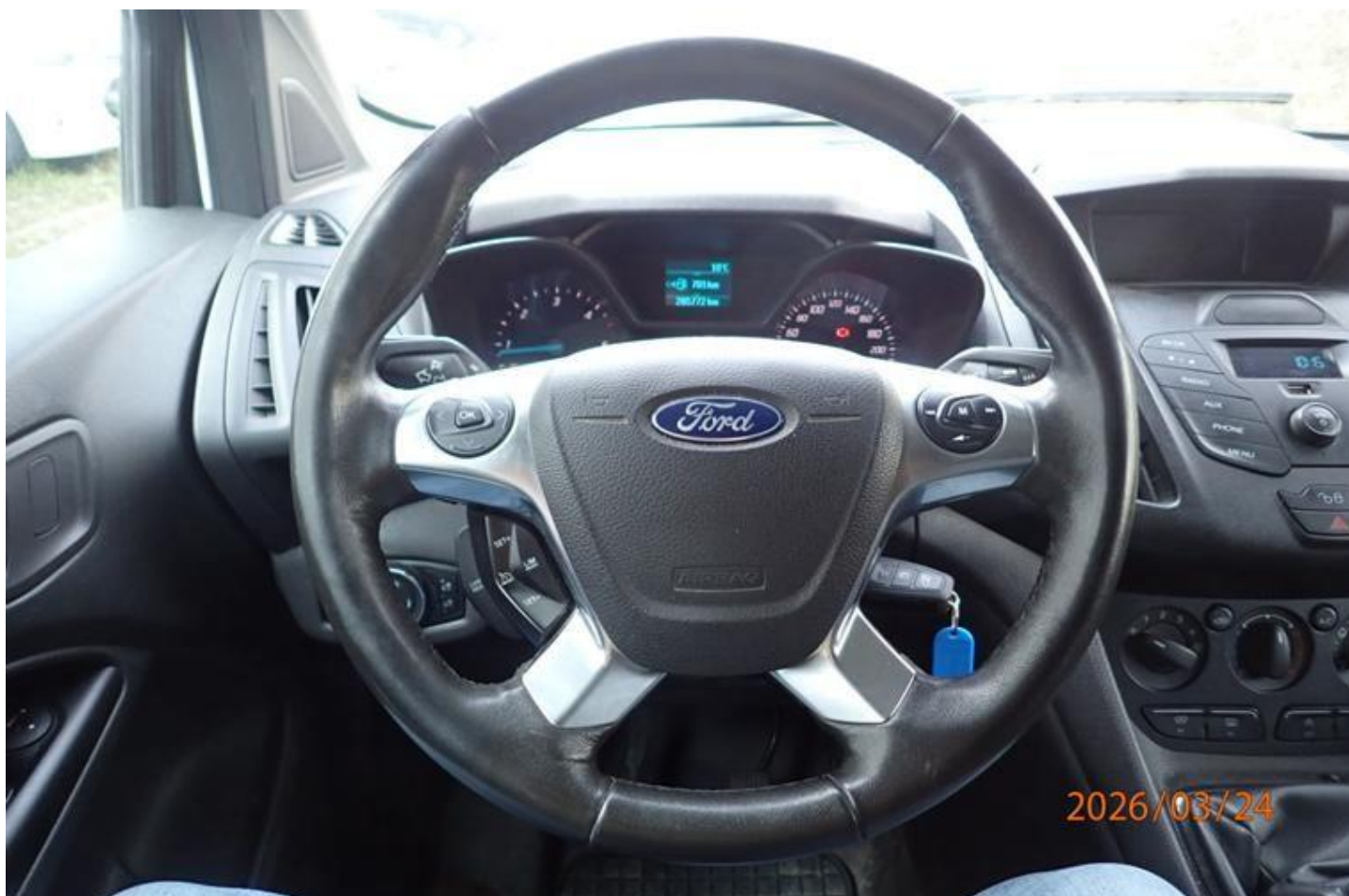
Fot. nr 148