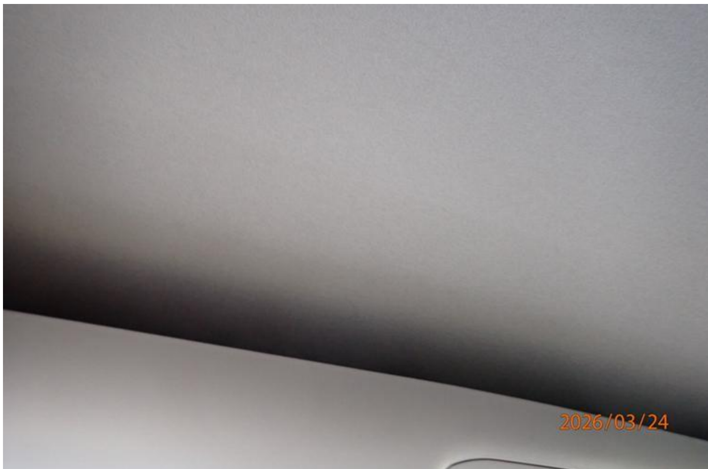
Fot. nr 146