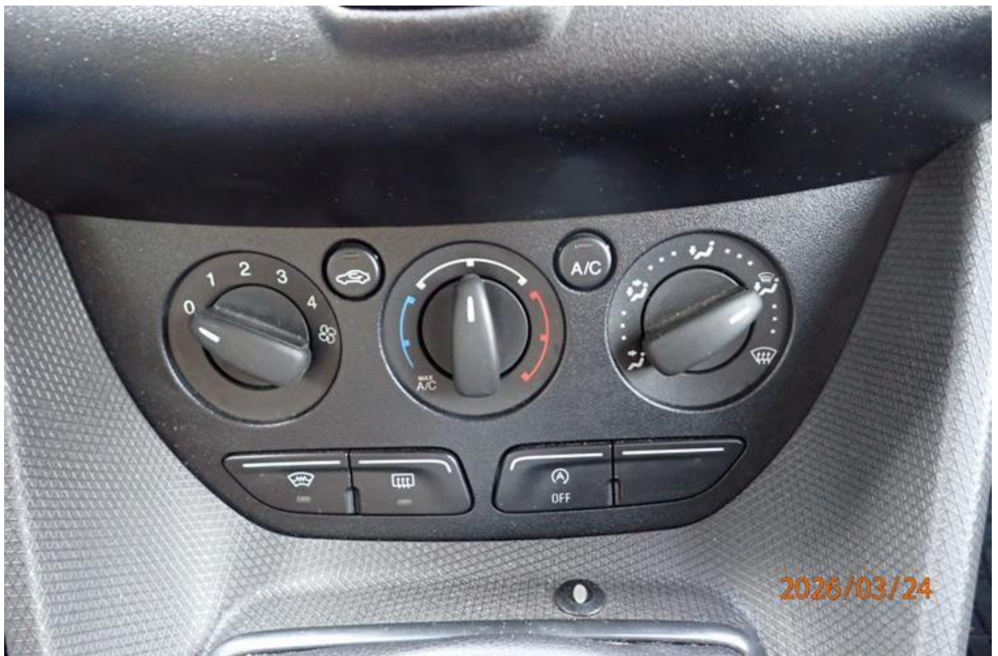
Fot. nr 156