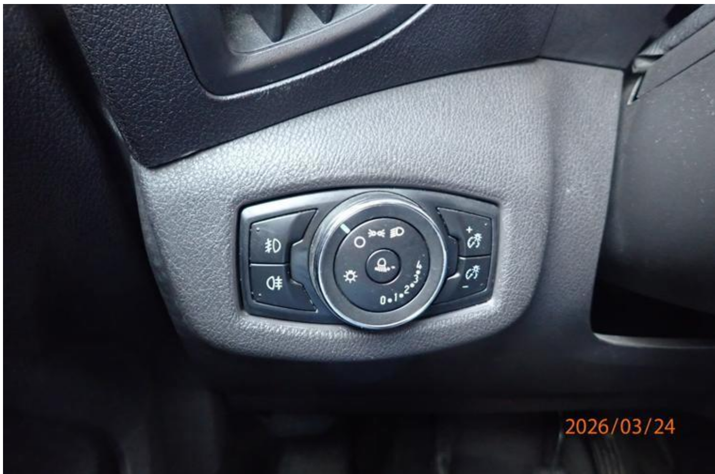
Fot. nr 152