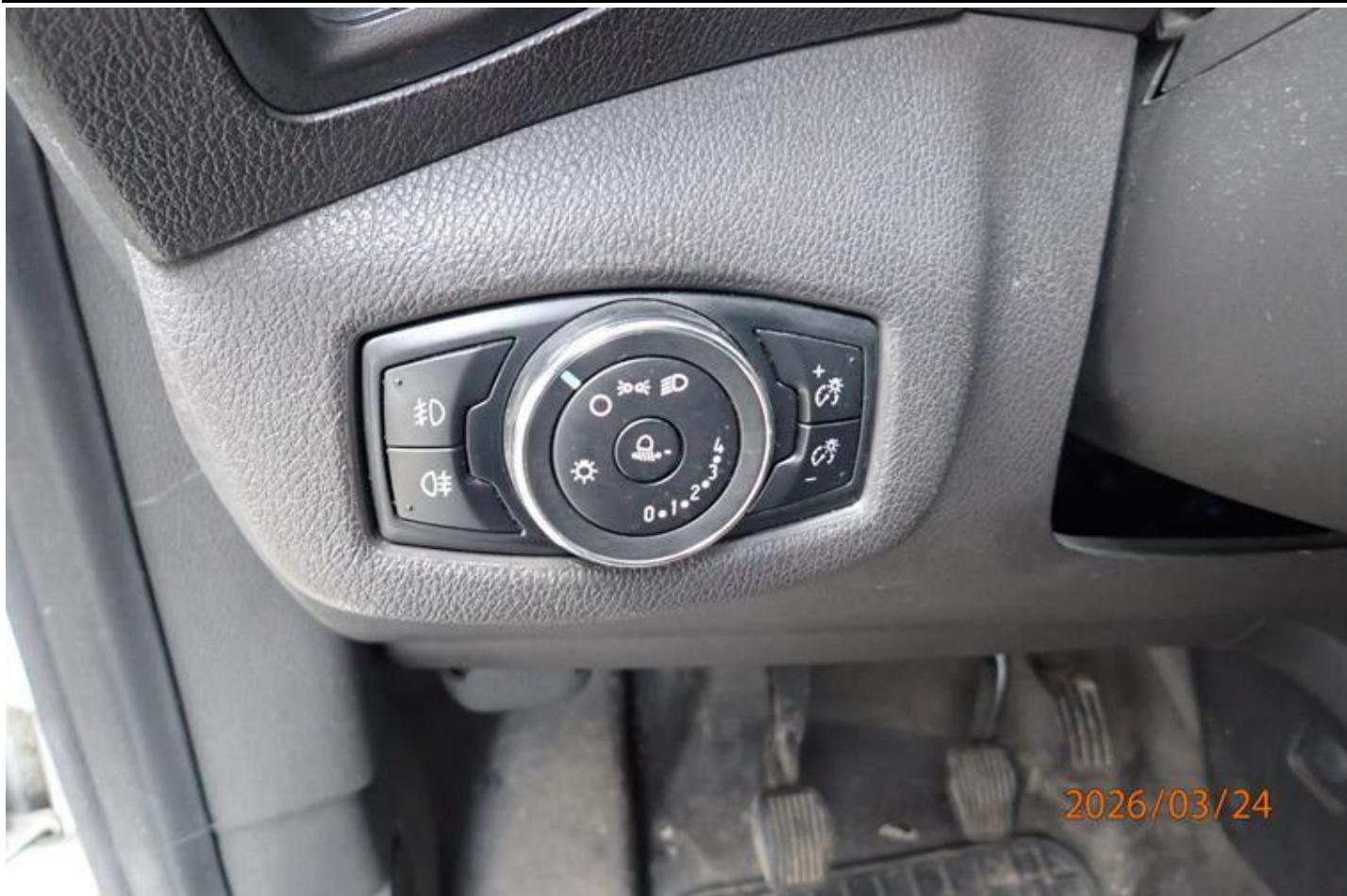
Fot. nr 143