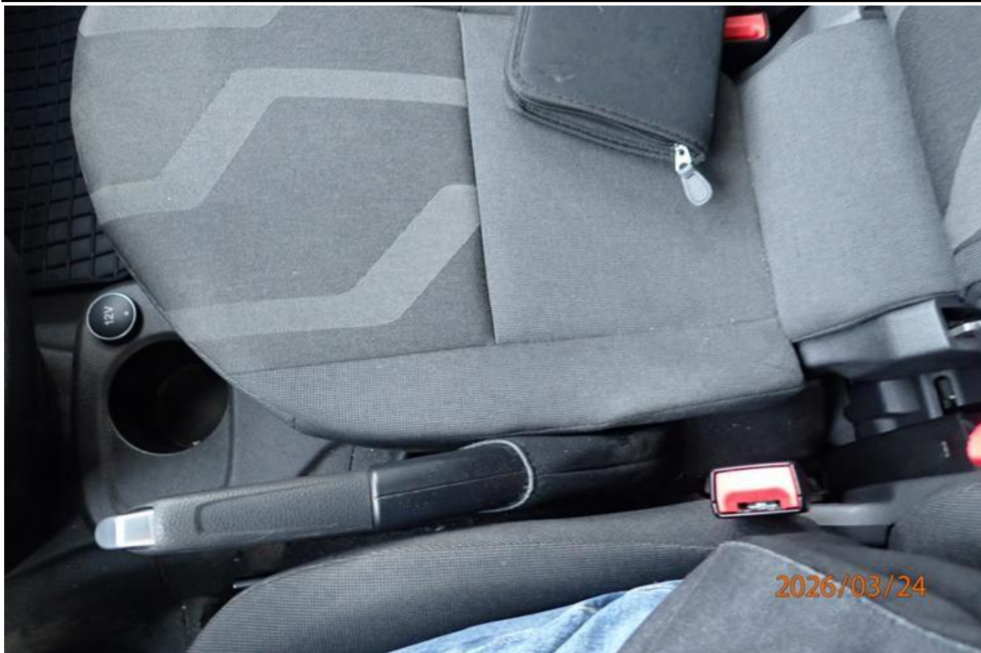
Fot. nr 159