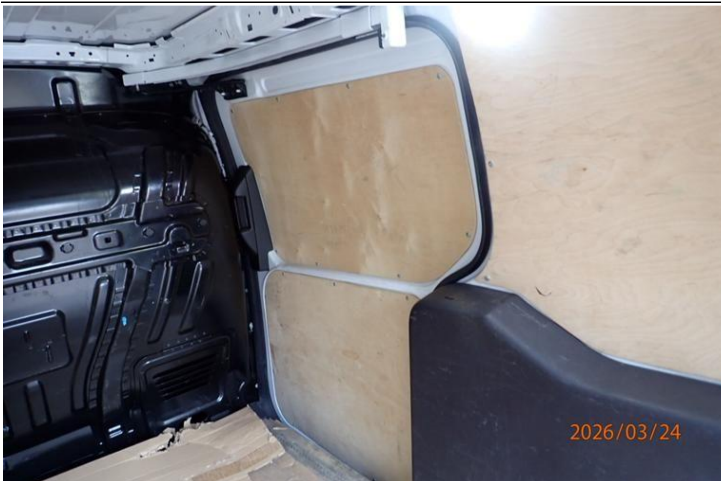
Fot. nr 115