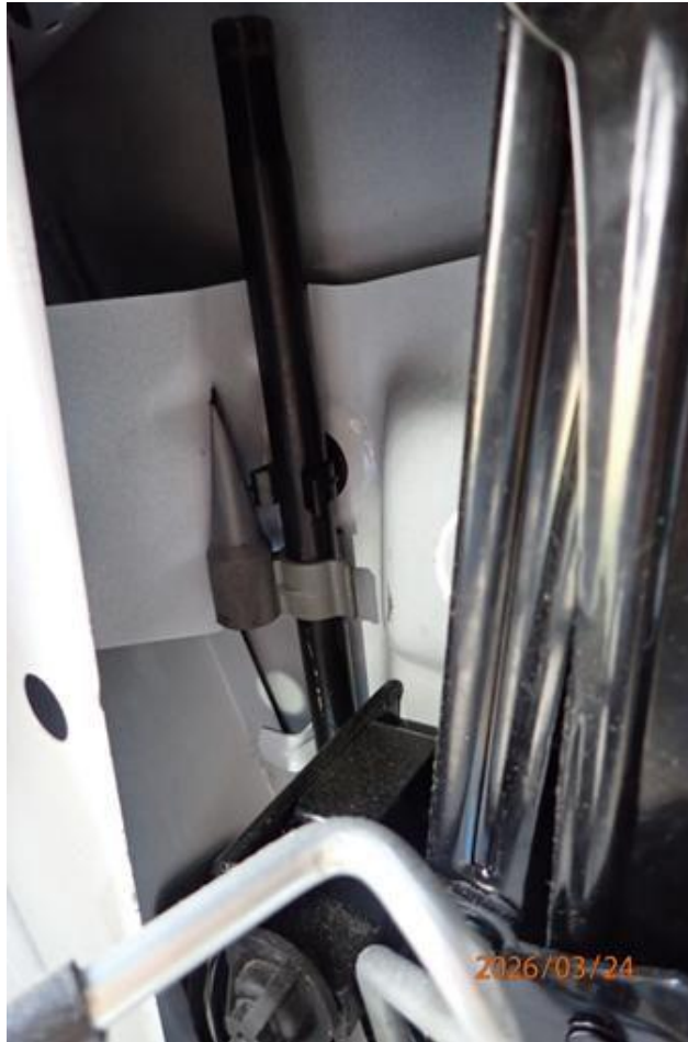
Fot. nr 109