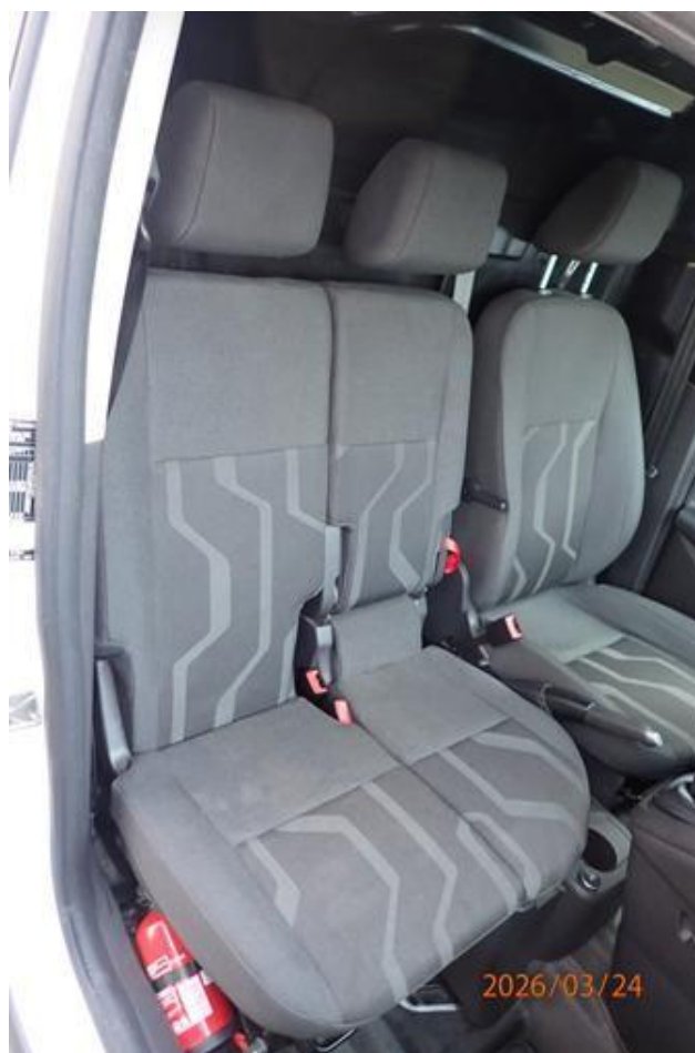
Fot. nr 124