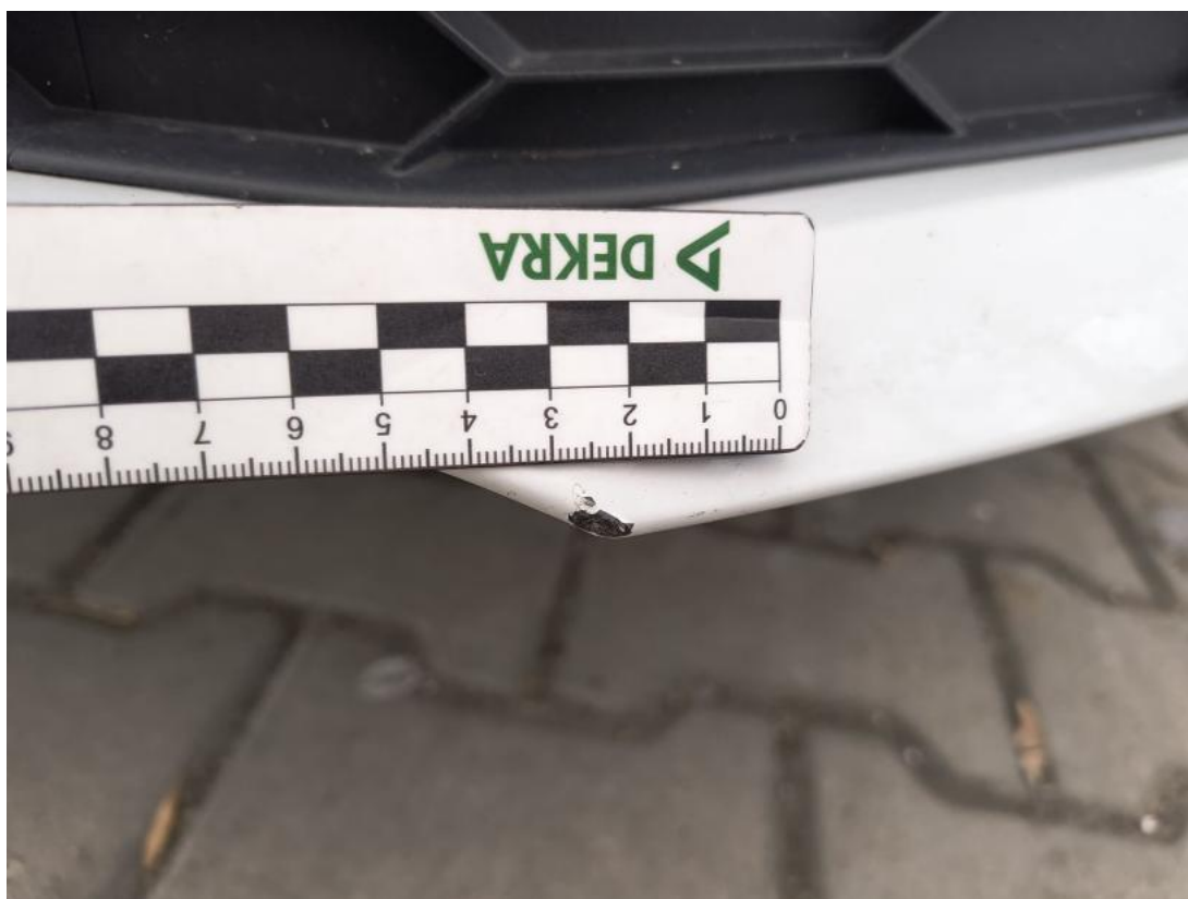
Fot. 41 Zderzak - Rysa/odprysk 1