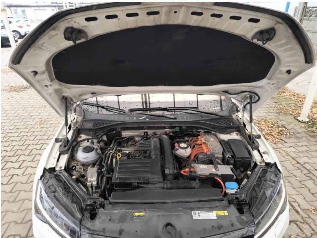
Fot. 24 Komora silnika