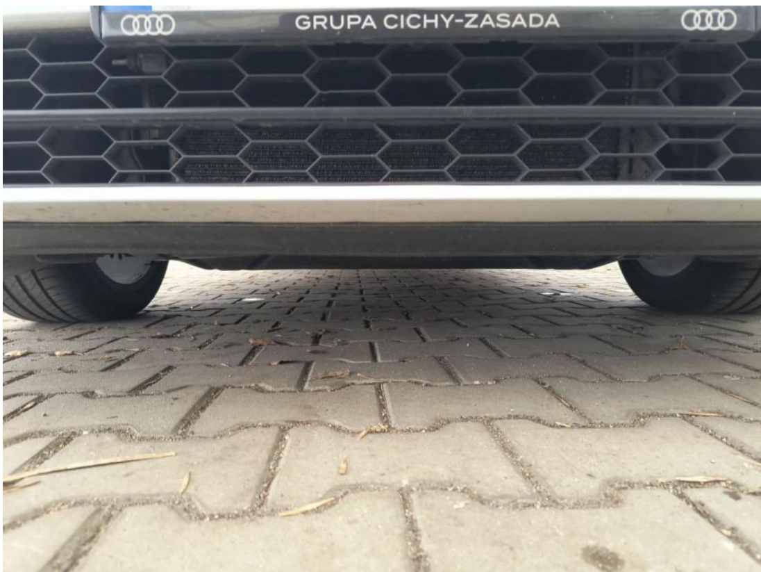
Fot. 26 Spód pojazdu przód