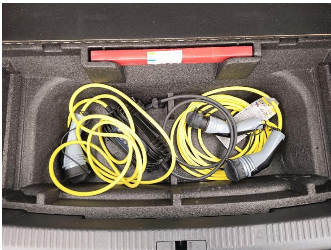
Fot. 28 Przewód ładowania baterii trakcyjnej