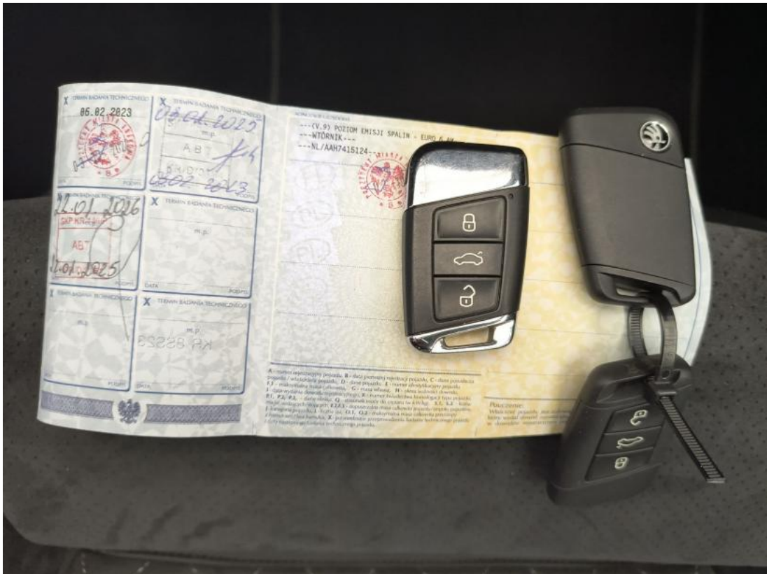
Fot. 35 Dow. Rej. Str.2 i klucze