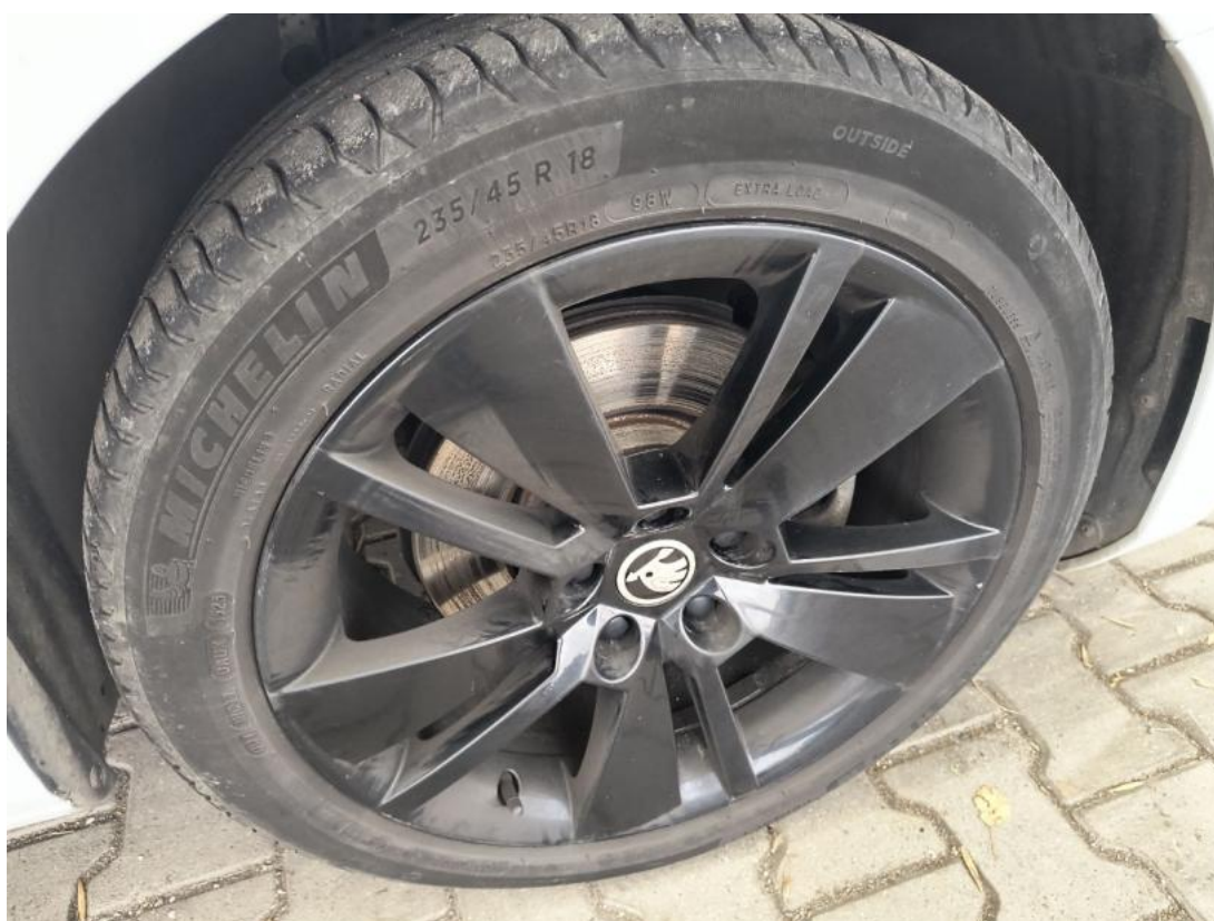
Fot. 42 Felga aluminiowa przednia P - zdjęcie pogładowe 1