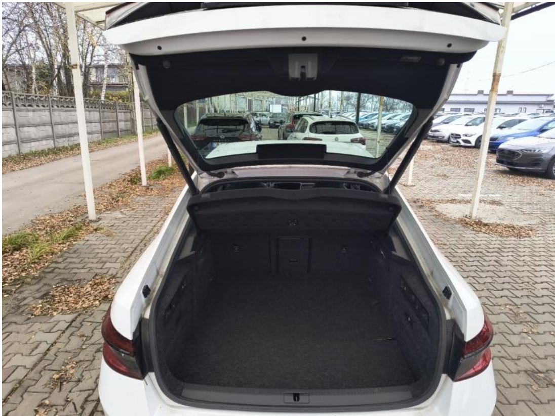
Fot. 25 Bagażnik