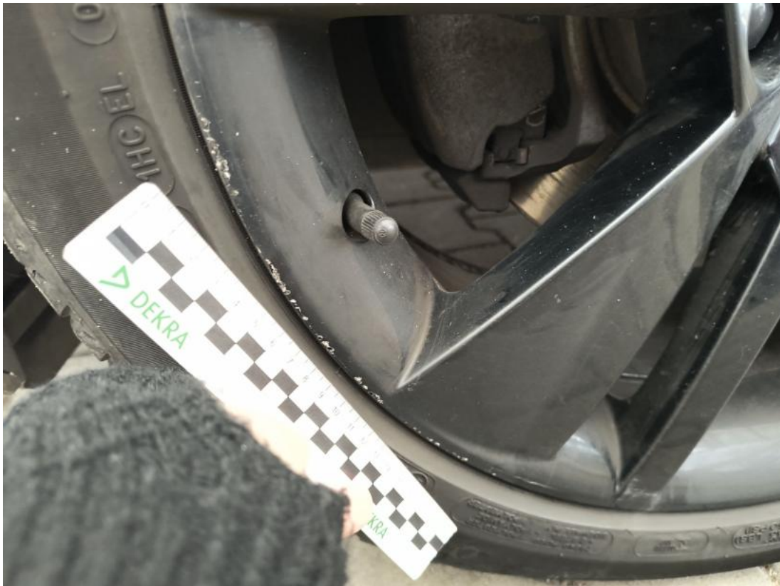
Fot. 49 Felga Aluminiowa przednia L - Rysa/odprysk 1