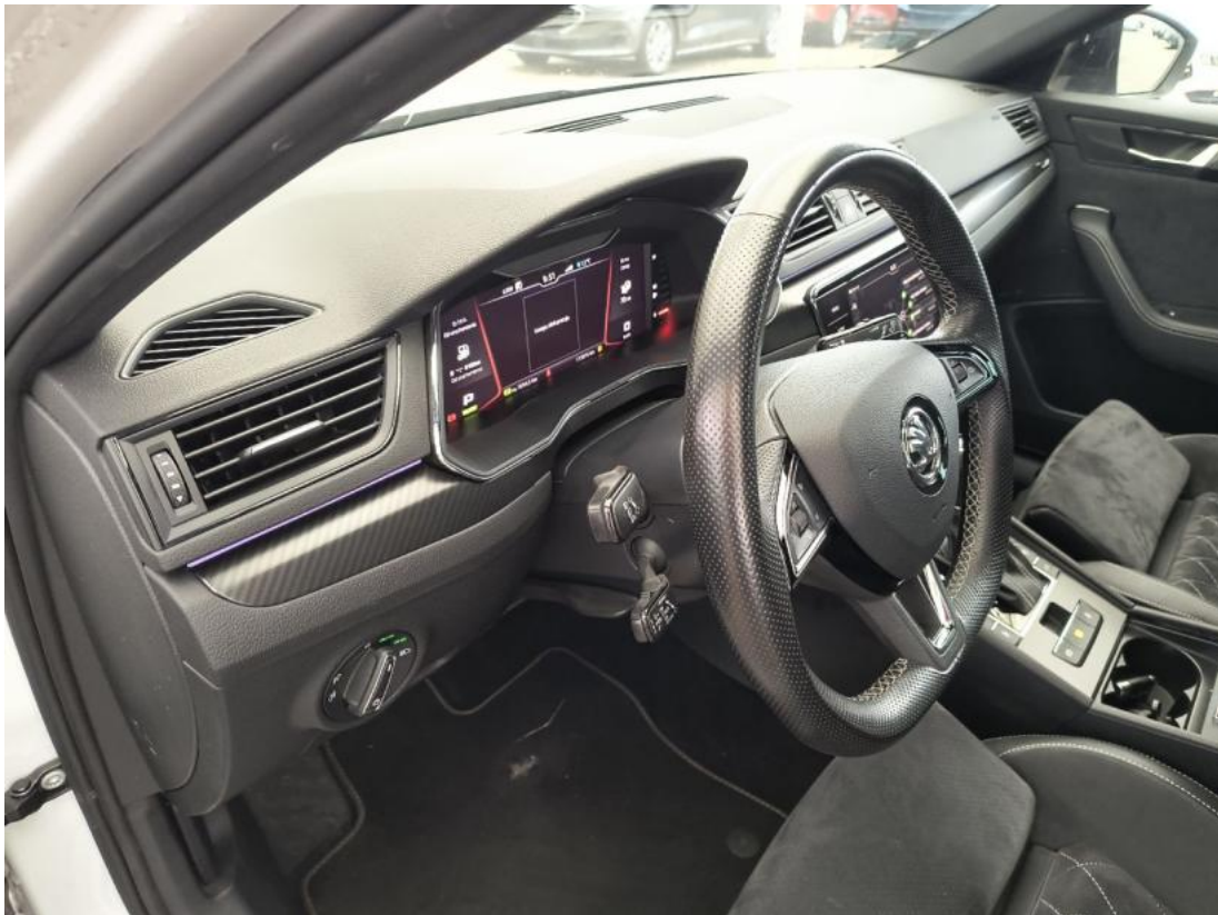
Fot. 23 Kierownica z lewej strony