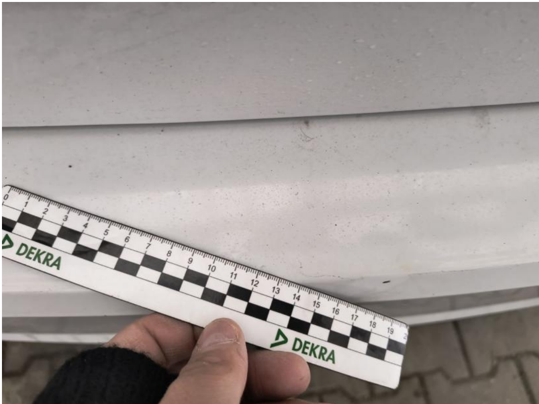
Fot. 47 Zderzak tylny() - Rysa/odprysk 3