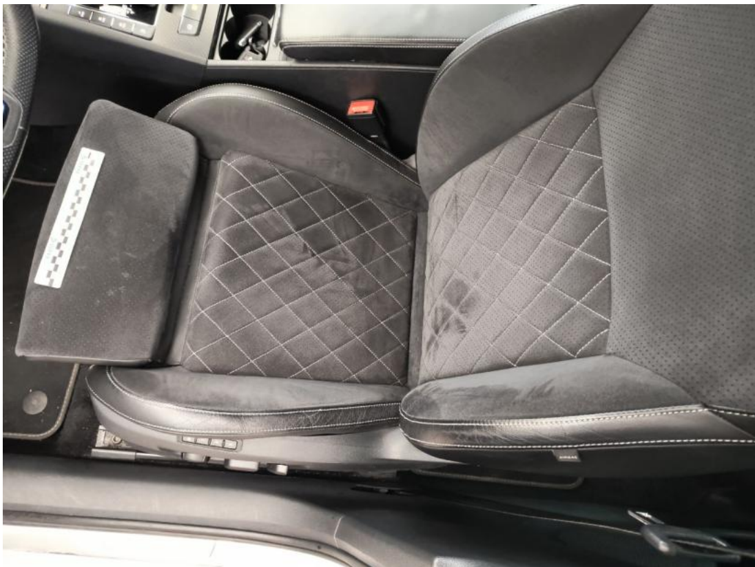
Fot. 50 Fotel prz. lew. - zdjęcie poglądowe 1