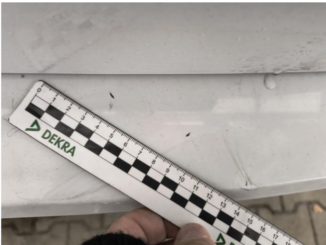
Fot. 46 Zderzak tylny - Rysa/odprysk 2