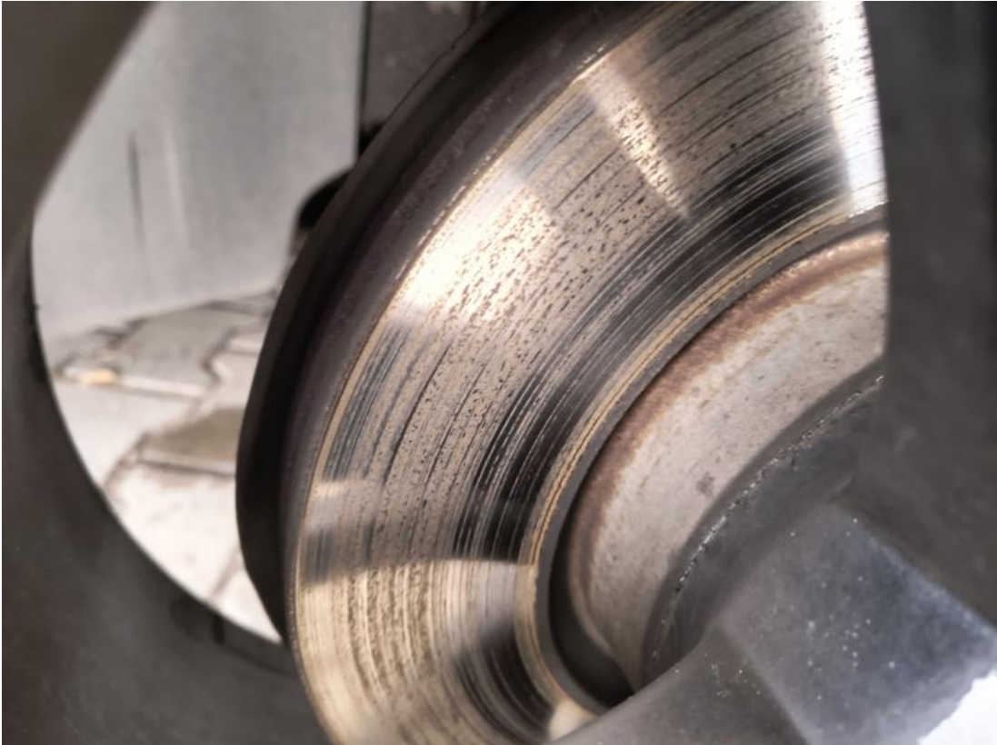
Fot. 31 Tarcza hamulcowa przednia prawa