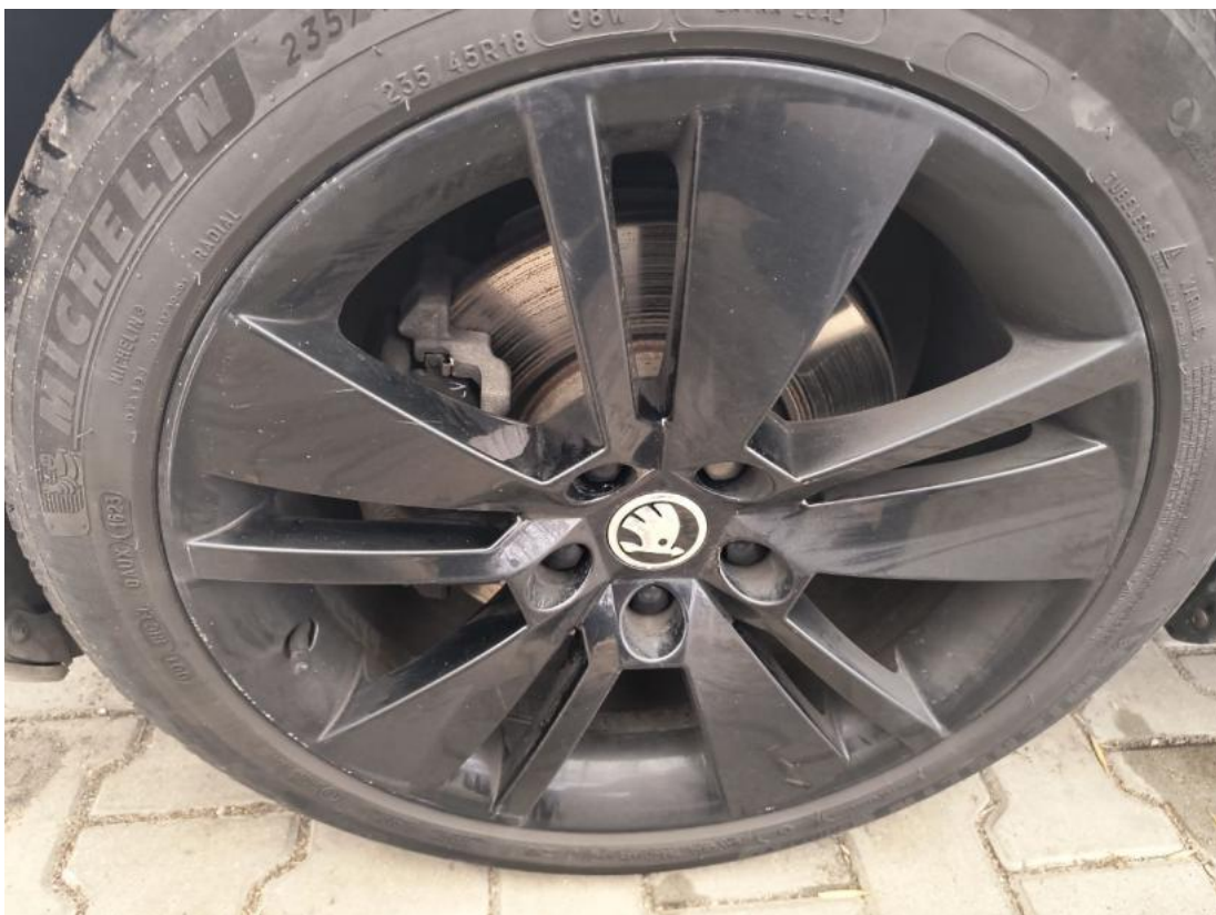
Fot. 48 Felga Aluminiowa przednia L - zdjęcie poglądowe 1