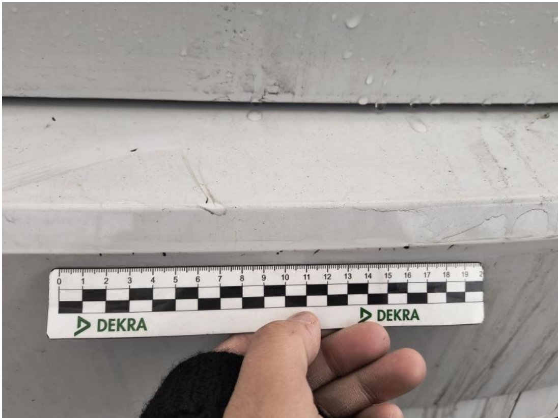
Fot. 45 Zderzak tylny - Rysa/odprysk 1