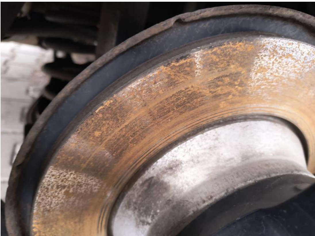
Fot. 32 Tarcza hamulcowa tylna prawa