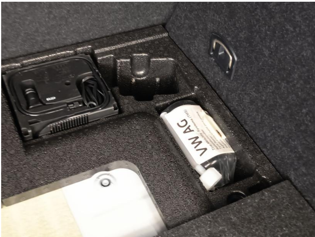
Fot. 36 Zestaw naprawy koła