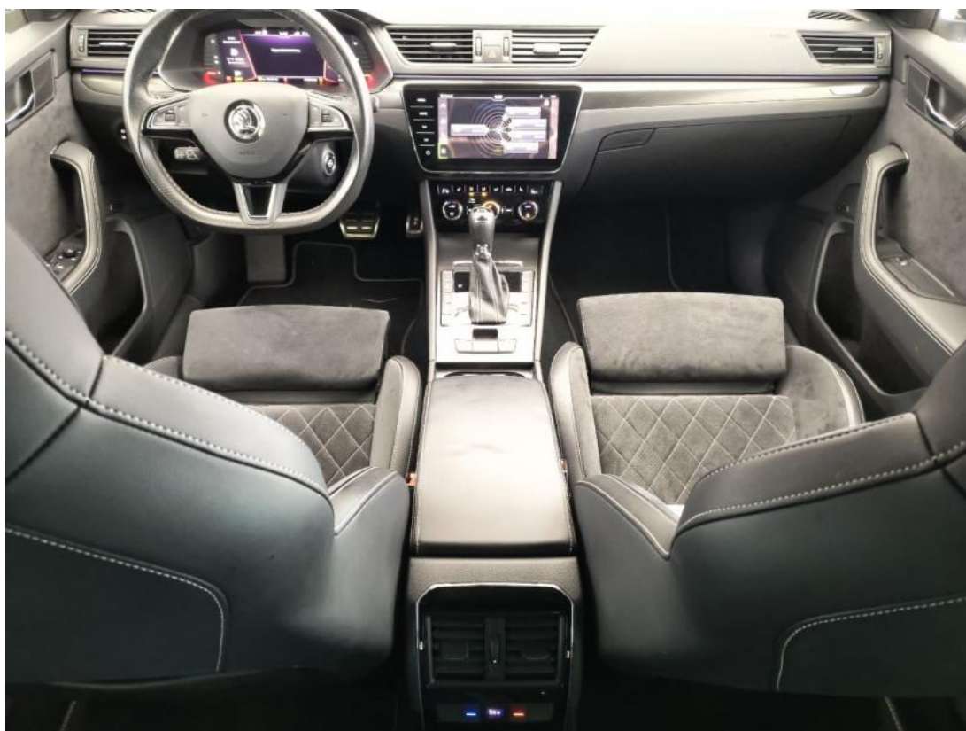
Fot. 21 Tunel środkowy