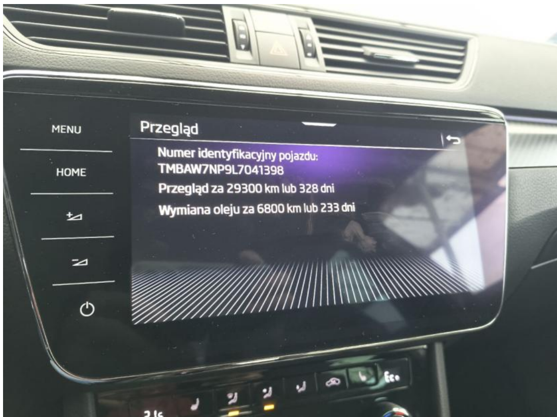
Fot. 16 Zestaw wskaźników - serwis