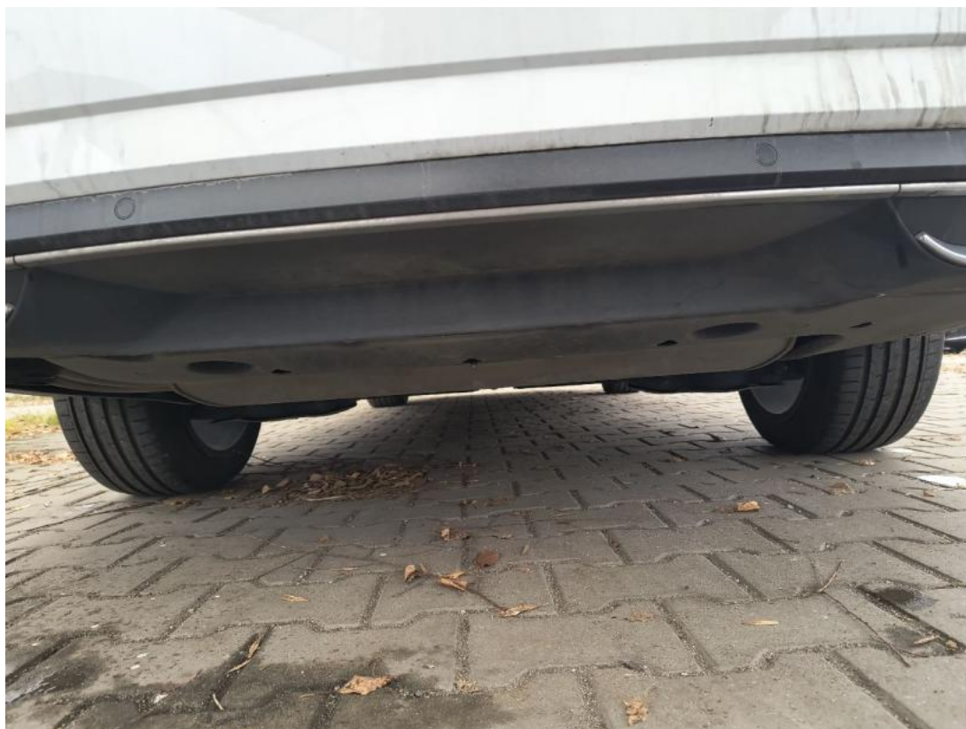
Fot. 27 Spód pojazdu tył