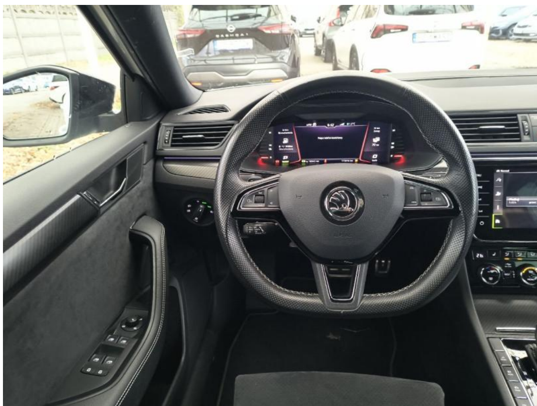
Fot. 22 Kierownica (na wprost)