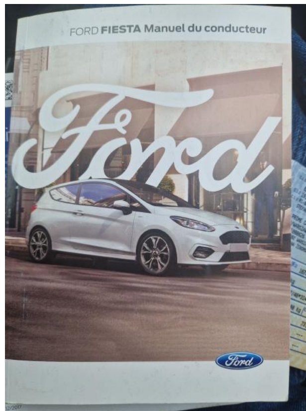
Fot. 37 Instrukcje