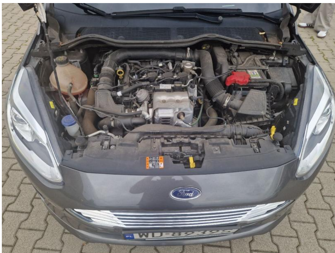
Fot. 24 Komora silnika