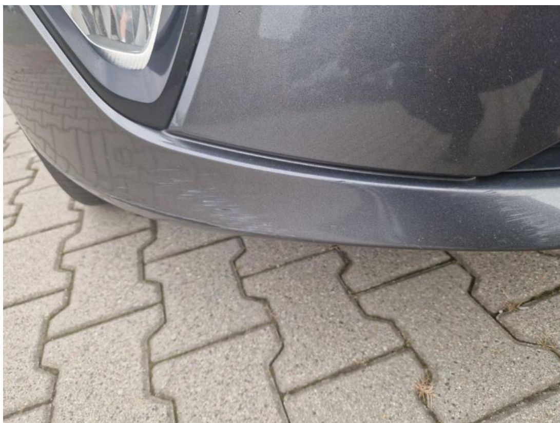
Fot. 39 Zderzak - Rysa/odprysk 1