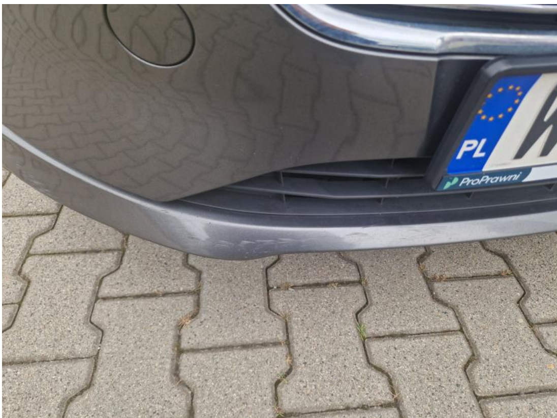
Fot. 38 Zderzak - zdjęcie poglądowe 1