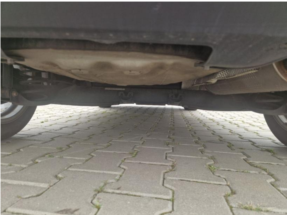
Fot. 28 Spód pojazdu tył