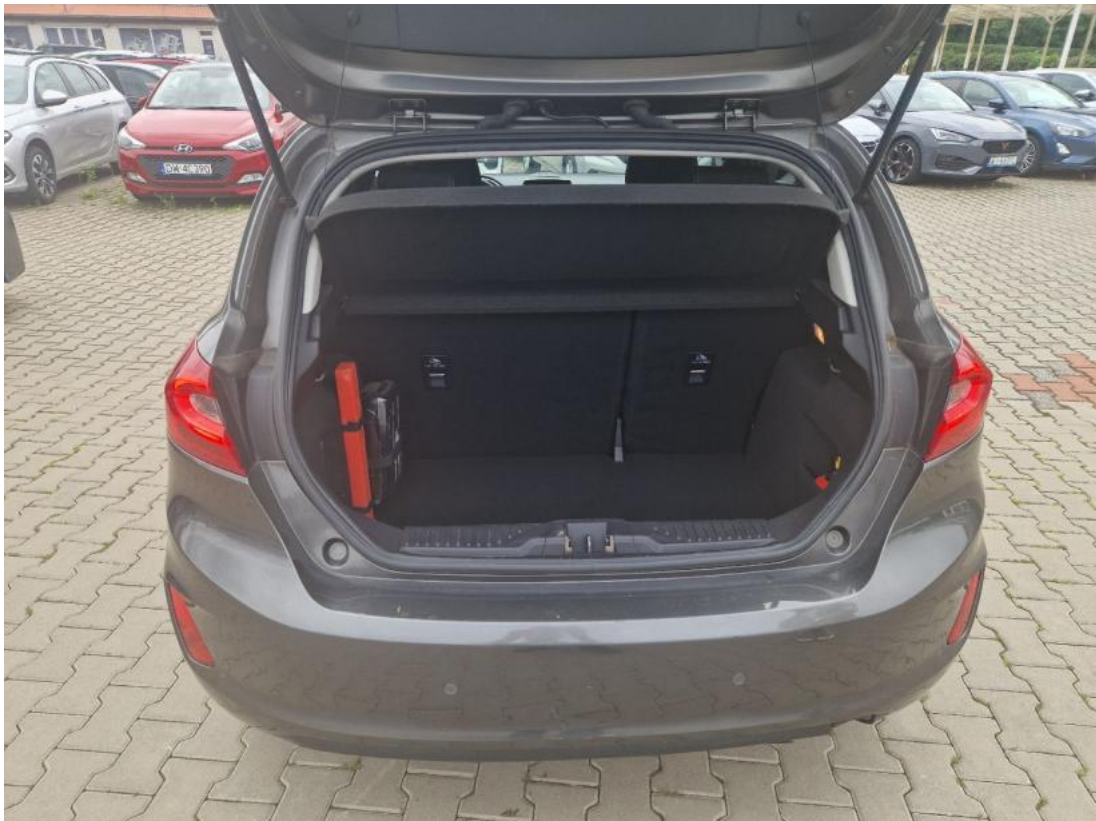
Fot. 25 Bagażnik