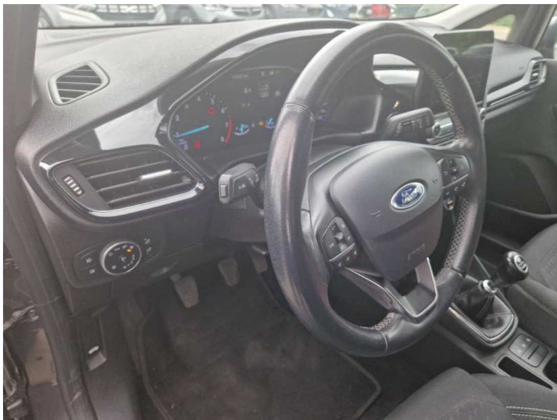
Fot. 23 Kierownica z lewej strony