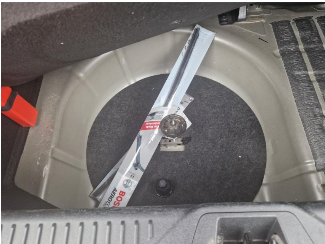
Fot. 26 Koło zapasowe