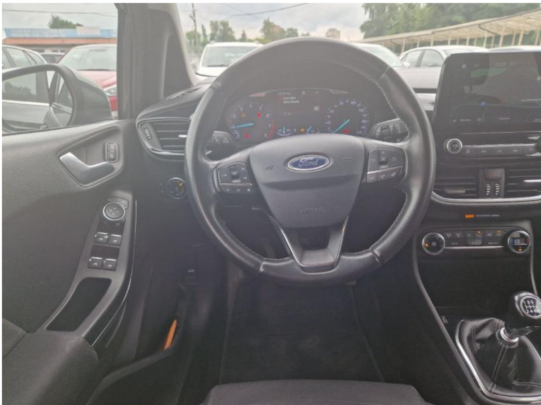
Fot. 22 Kierownica (na wprost)