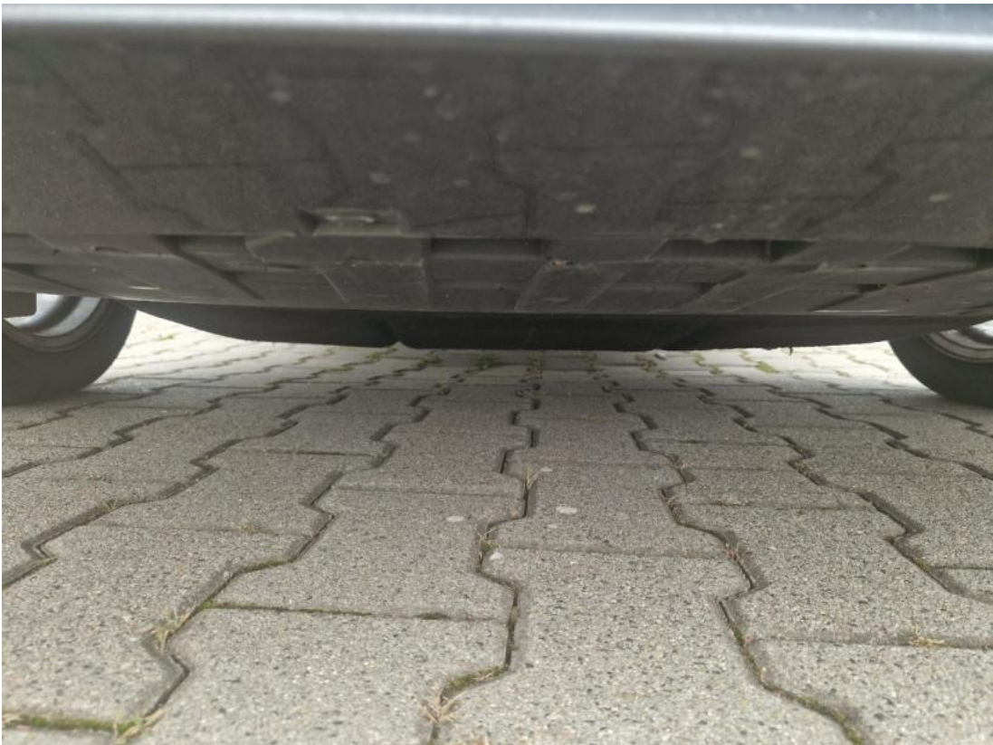
Fot. 27 Spód pojazdu przód