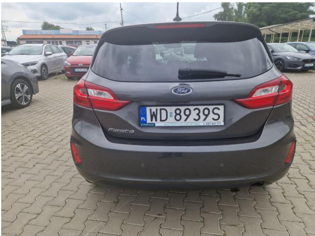
Fot. 8 Tyt