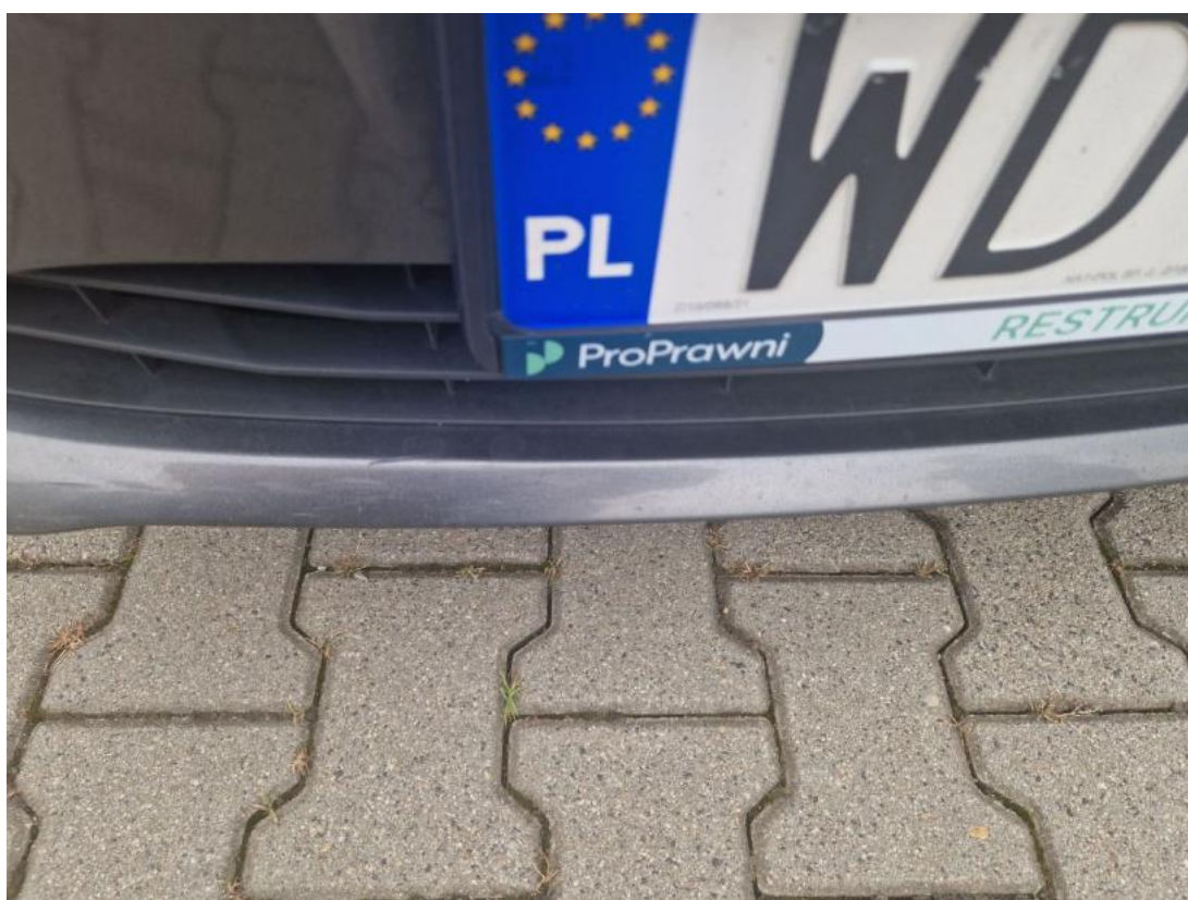
Fot. 40 Zderzak - Wgniecenie/odkształcenie 1