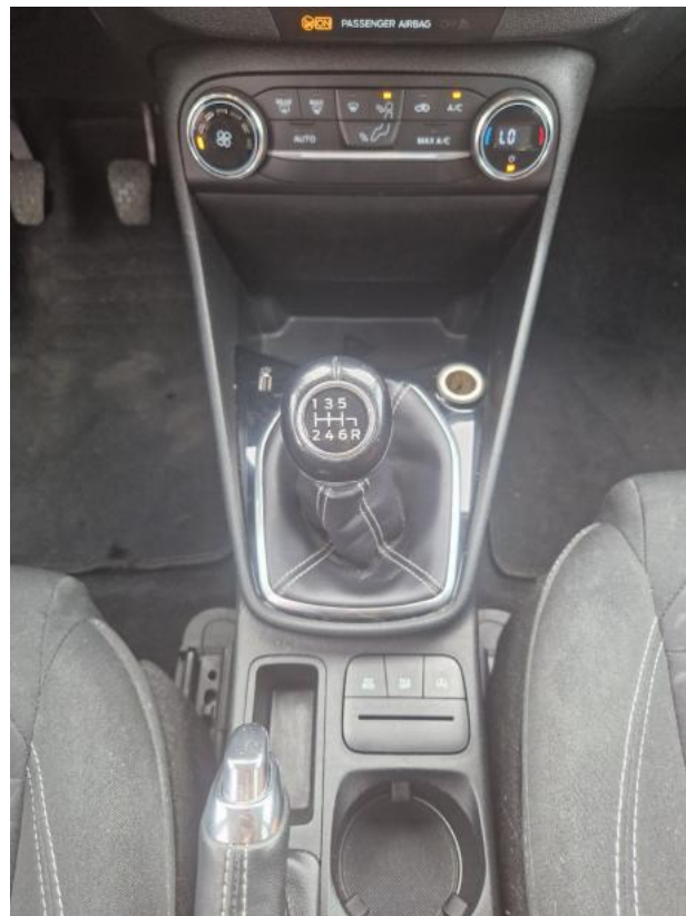
Fot. 21 Tunel środkowy