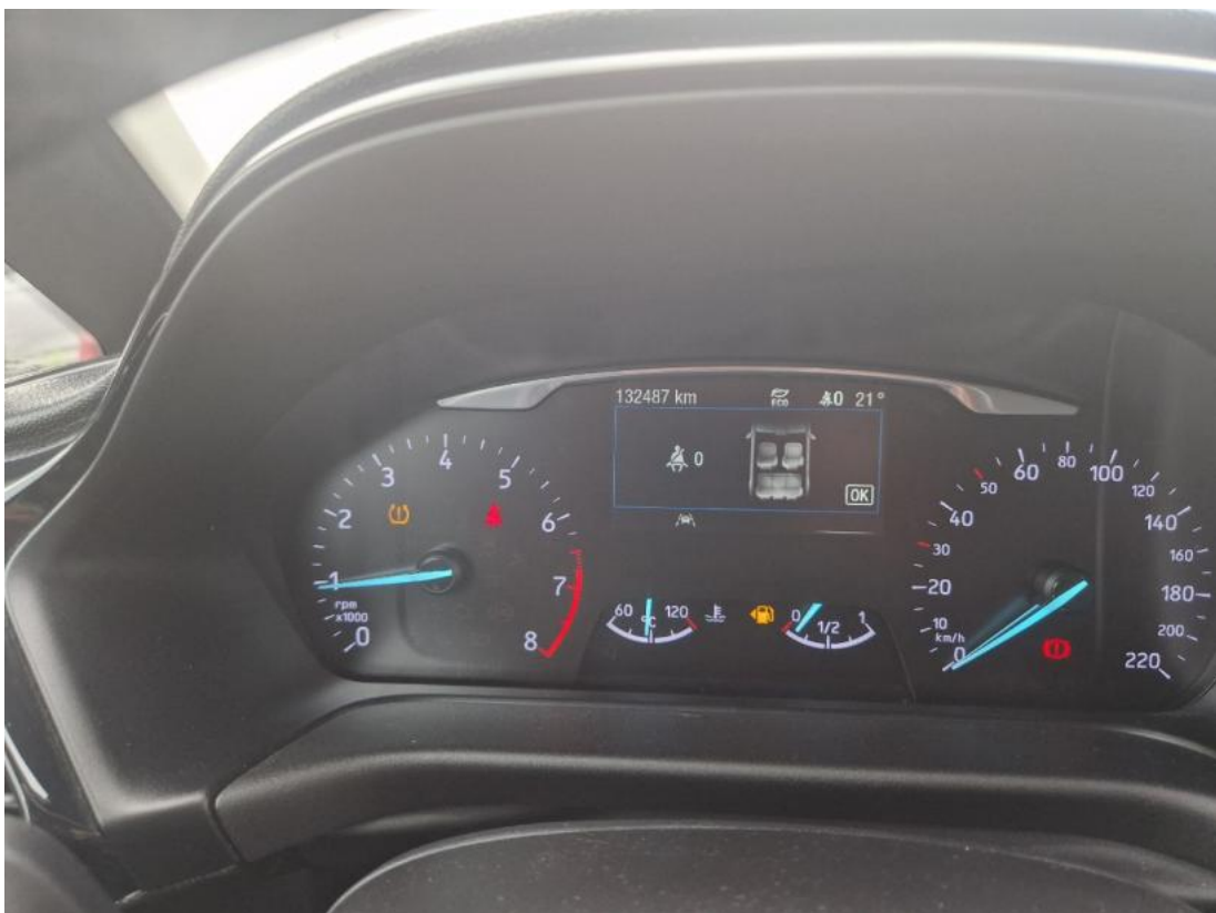
Fot. 16 Zestaw wskaźników - serwis