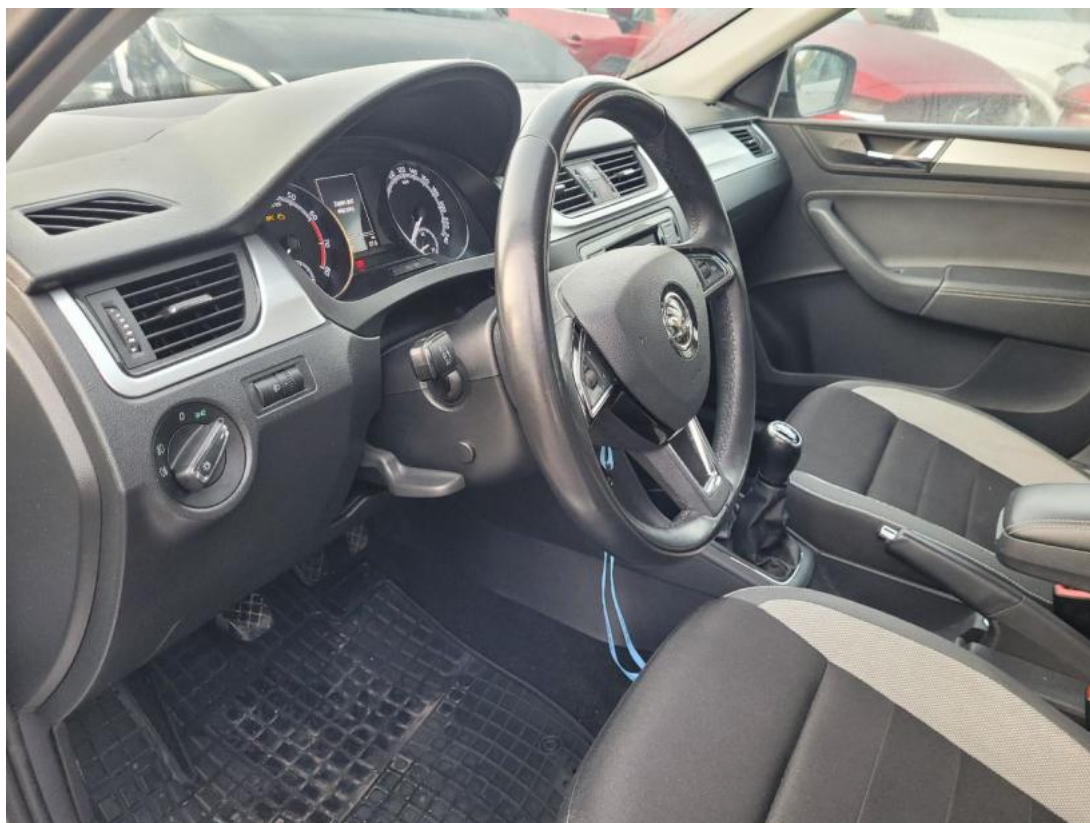
Fot. 23 Kierownica z lewej strony