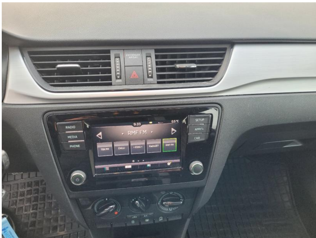
Fot. 31 Zdjęcie do protokołu