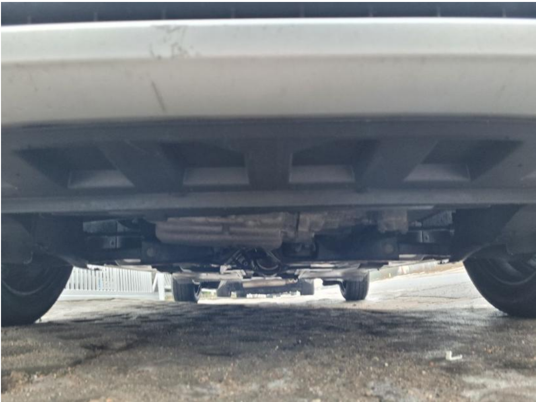
Fot. 27 Spód pojazdu przód