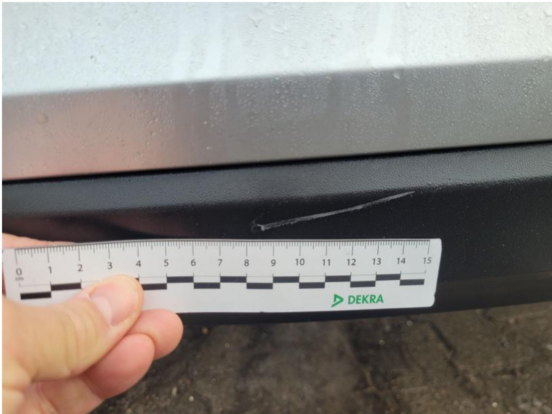
Fot. 37 Zderzak tylny - Rysa/odprysk 1