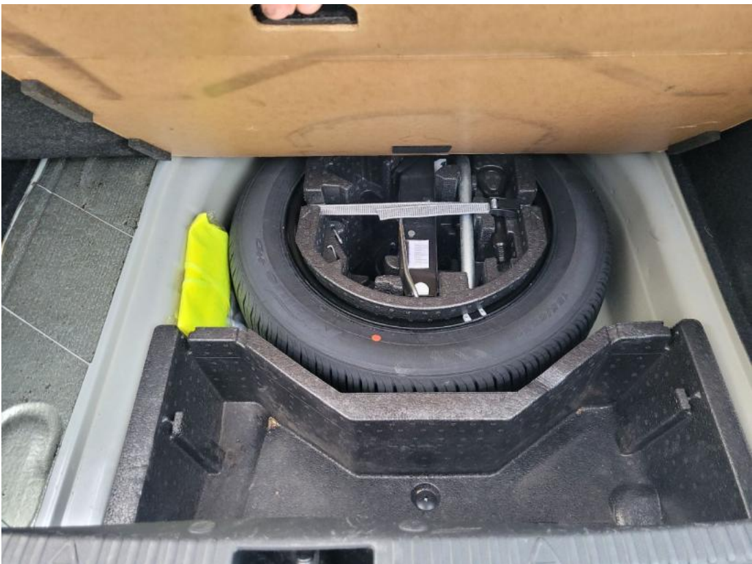
Fot. 26 Koło zapasowe