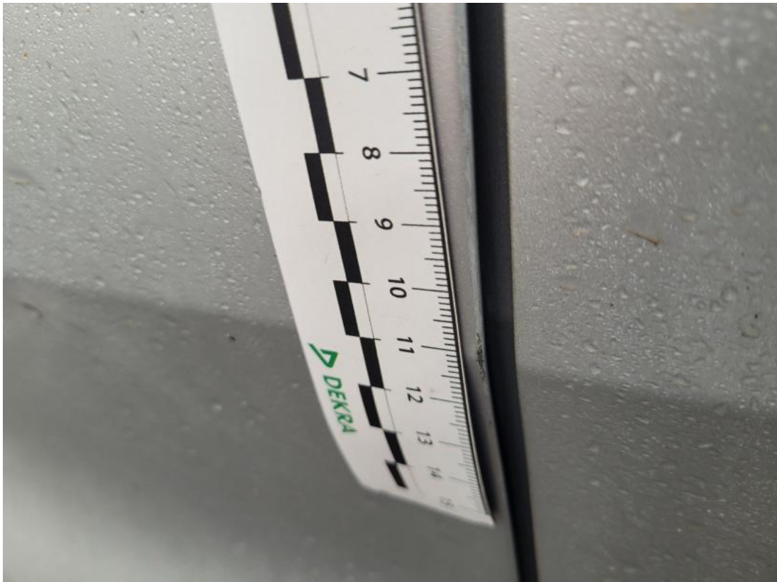
Fot. 39 Drzwi przed L - Rysa/odprysk 1