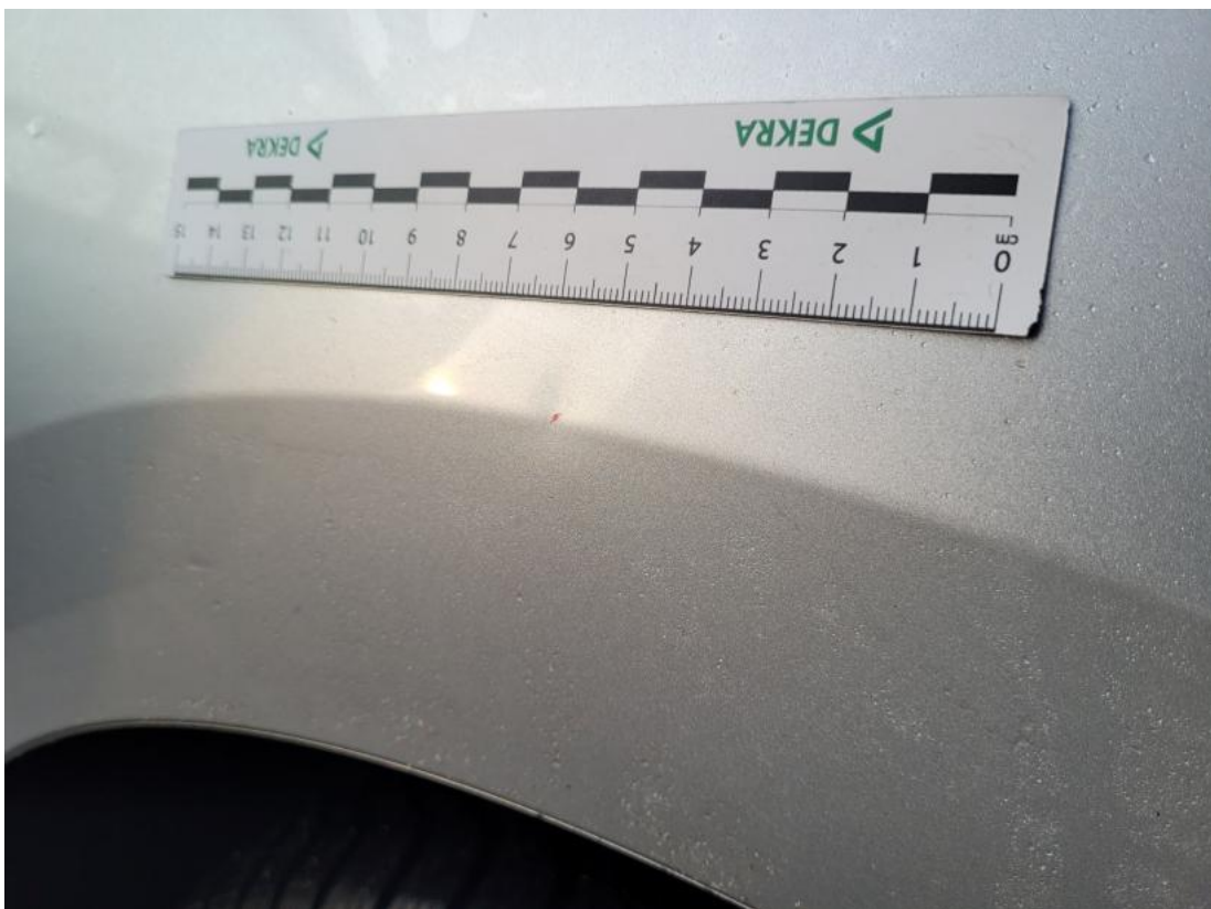
Fot. 38 Błotnik tylny L / Ściana boczna L - Wgniecenie/odkształcenie 1