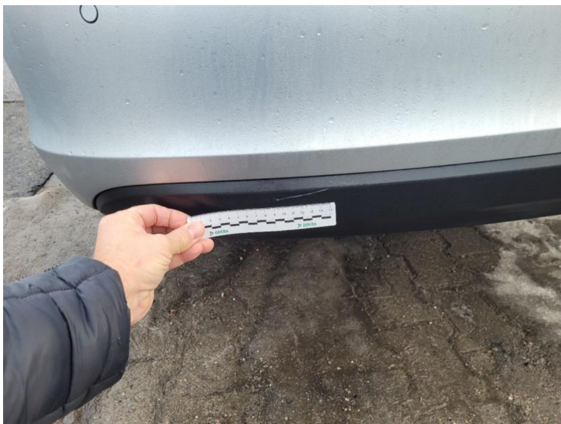
Fot. 36 Zderzak tylny - zdjęcie poglądowe 2