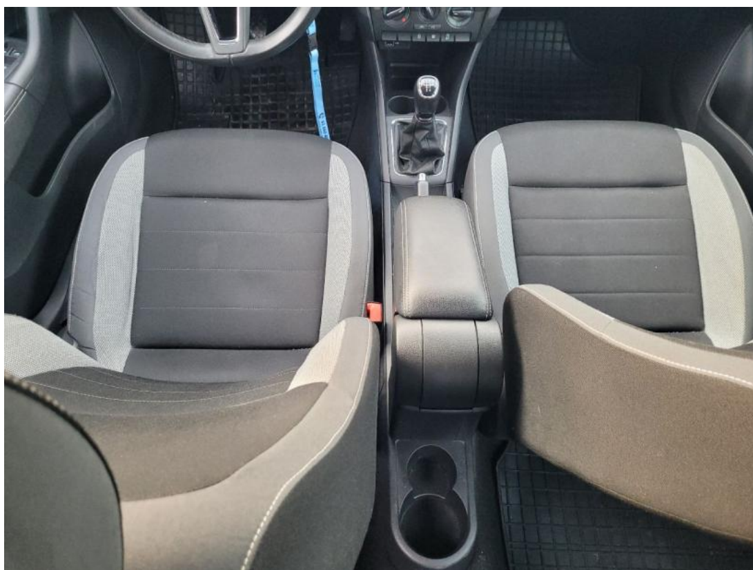
Fot. 21 Tunel środkowy