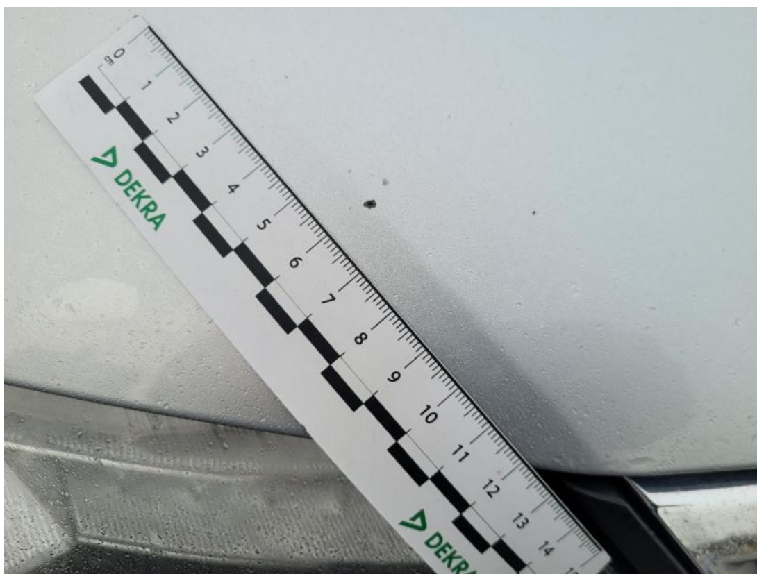
Fot. 32 Pokrywa komory silnika - zdjęcie poglądowe 1