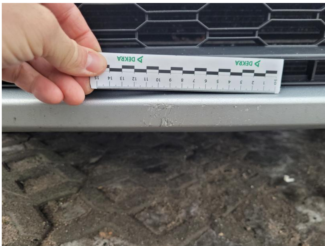
Fot. 35 Zderzak - Rysa/odprysk 1