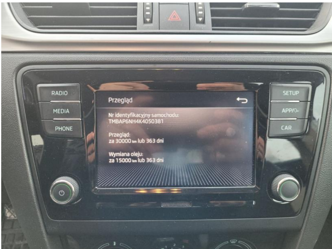
Fot. 16 Zestaw wskaźników - serwis