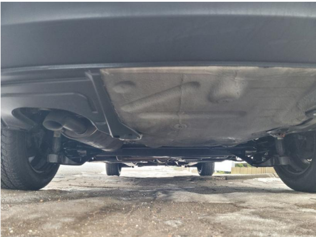
Fot. 28 Spód pojazdu tył