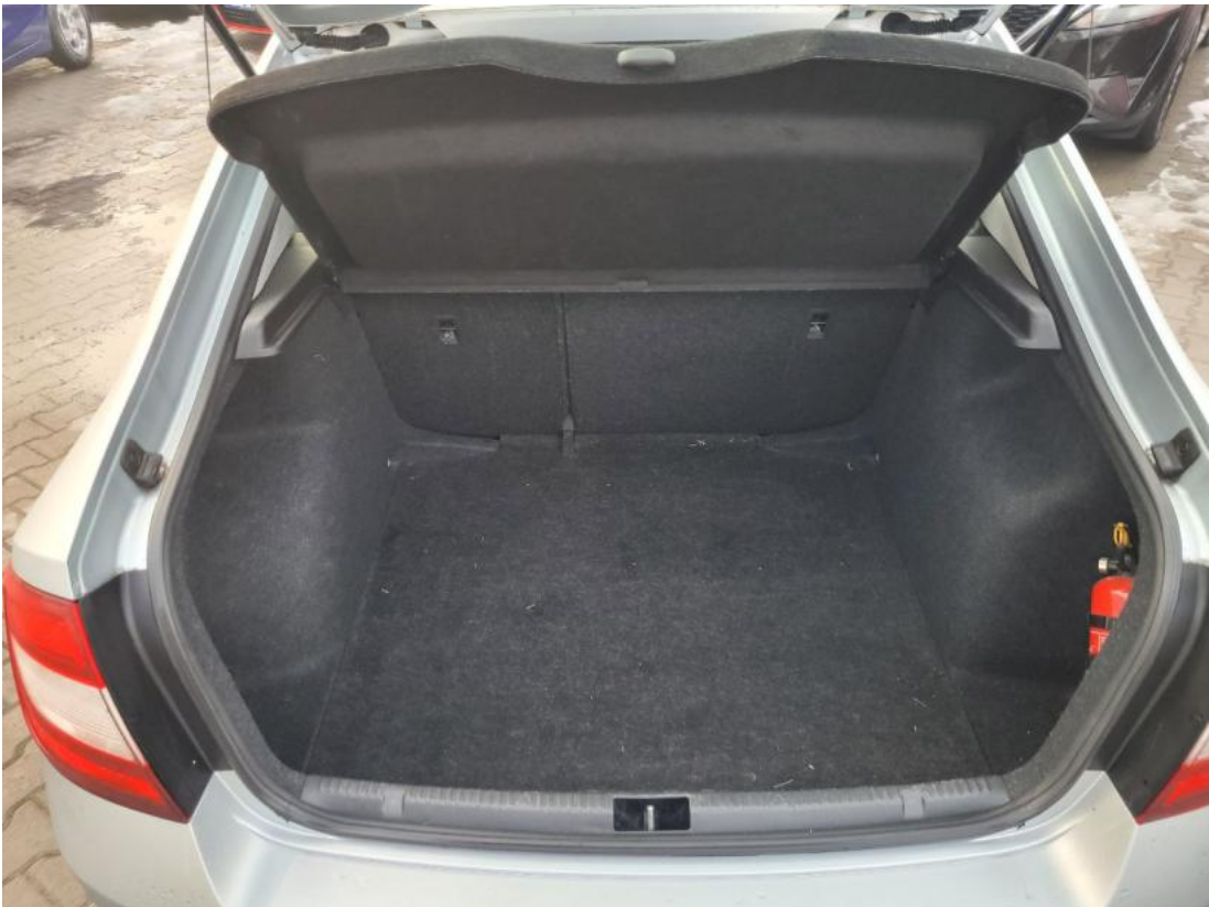
Fot. 25 Bagażnik