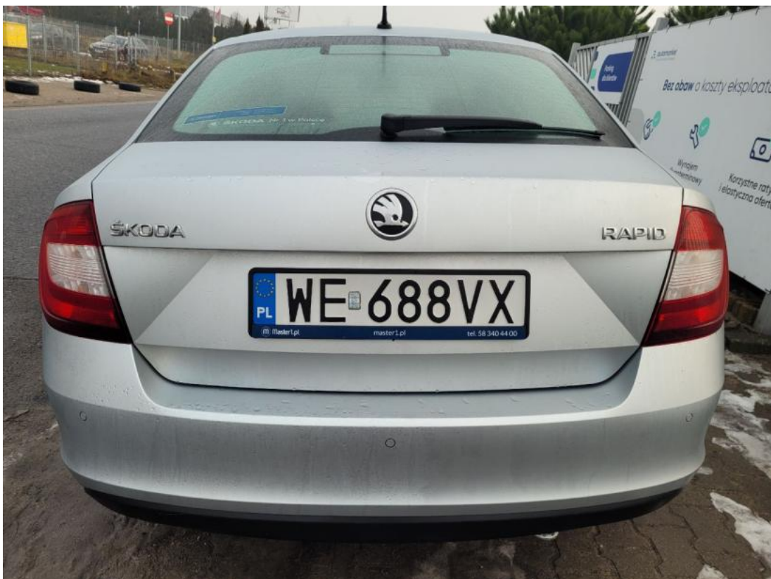
Fot. 8 Tyt