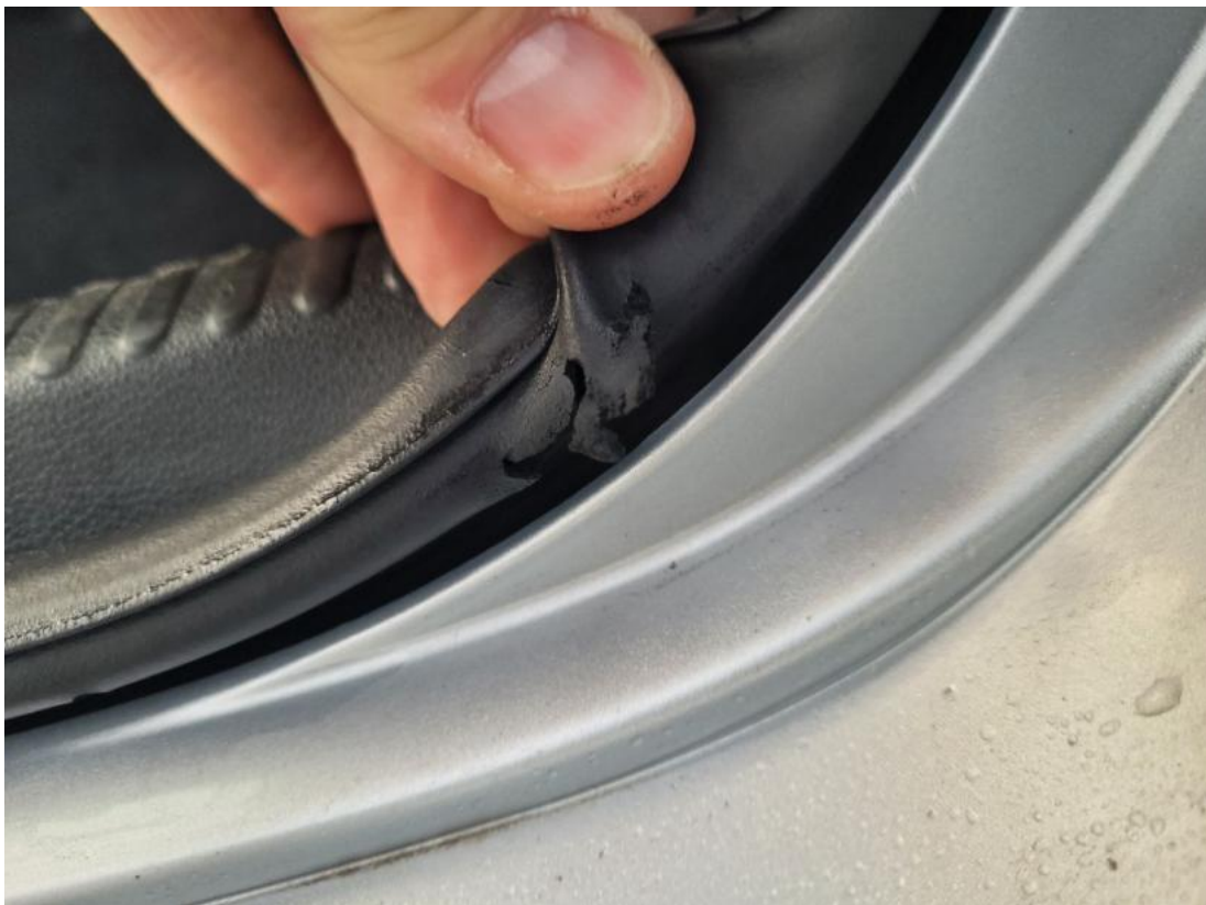
Fot. 40 Uszczelka pokrywy tylnej - zdjęcie poglądowe 2