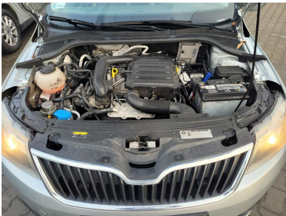
Fot. 24 Komora silnika