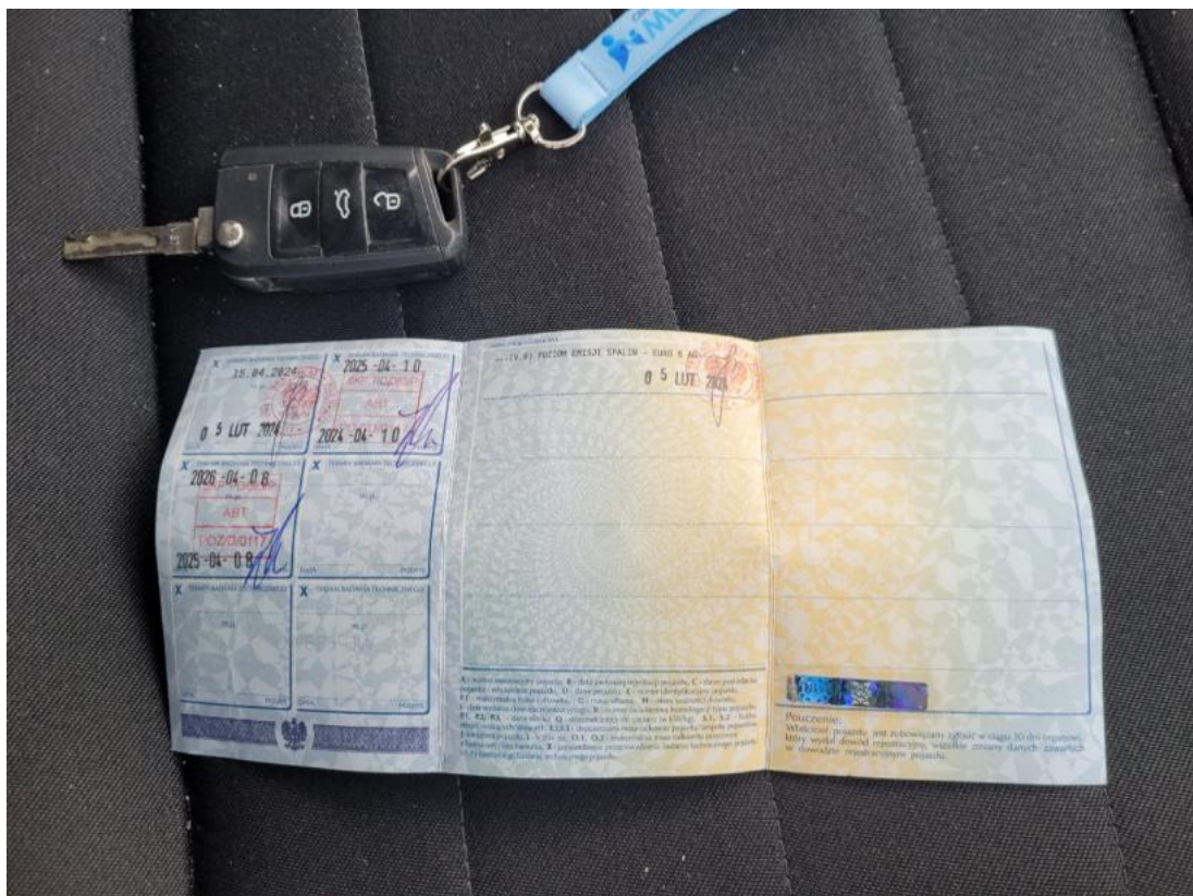
Fot. 30 Dow. Rej. Str.2 i klucze