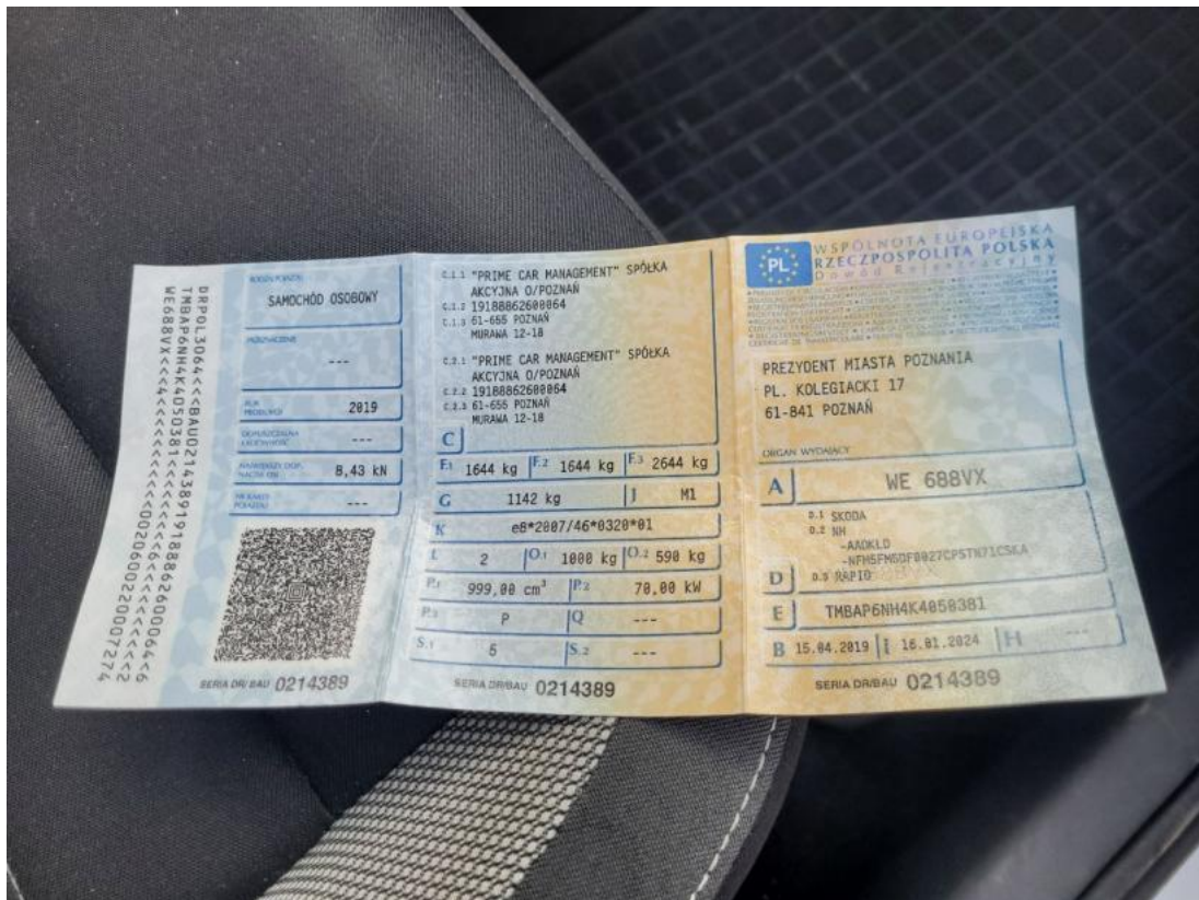
Fot. 29 Dowód rej. Str. 1