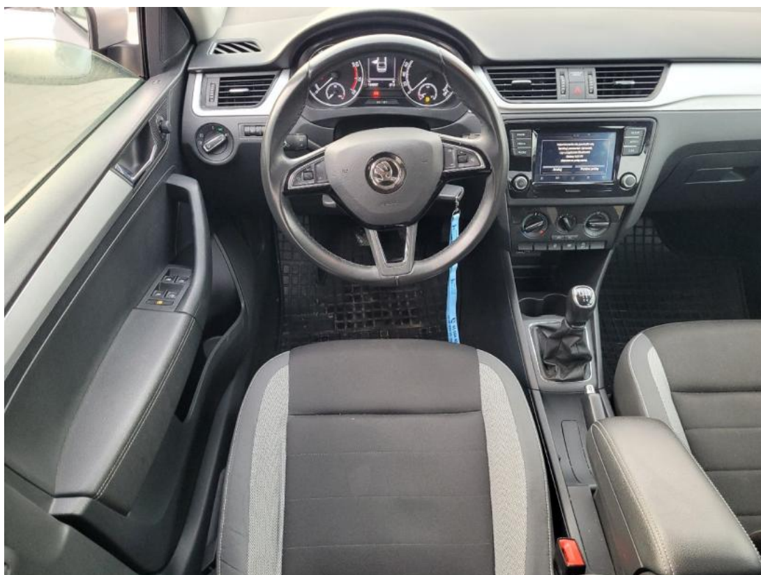
Fot. 22 Kierownica (na wprost)