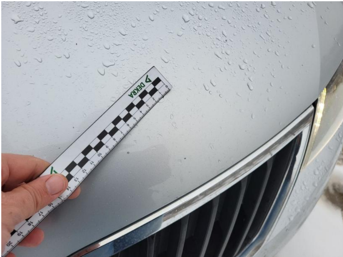
Fot. 39 Pokrywa komory silnika() - Rysa/odprysk 3