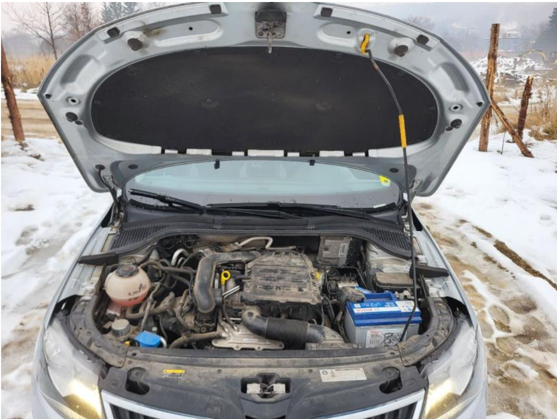
Fot. 23 Komora silnika