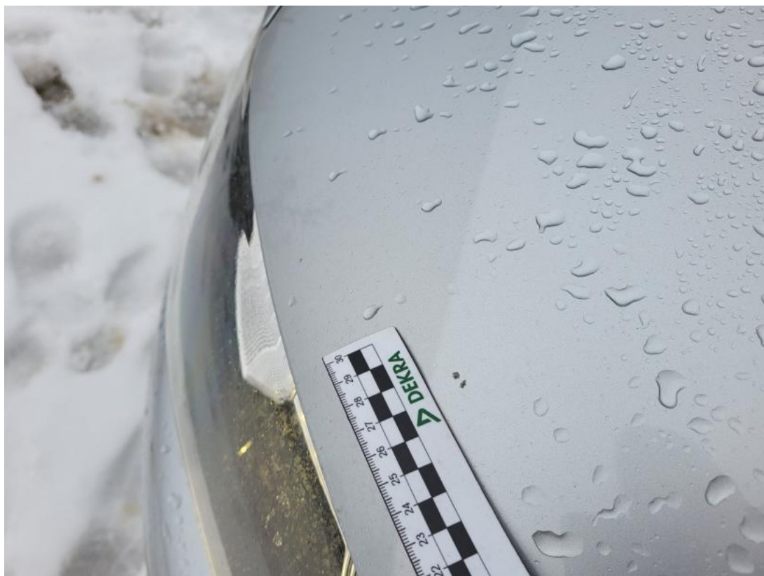
Fot. 37 Pokrywa komory silnika - Rysa/odprysk 1