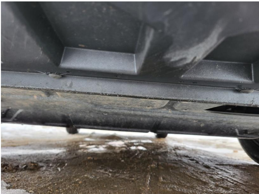
Fot. 26 Spód pojazdu przód