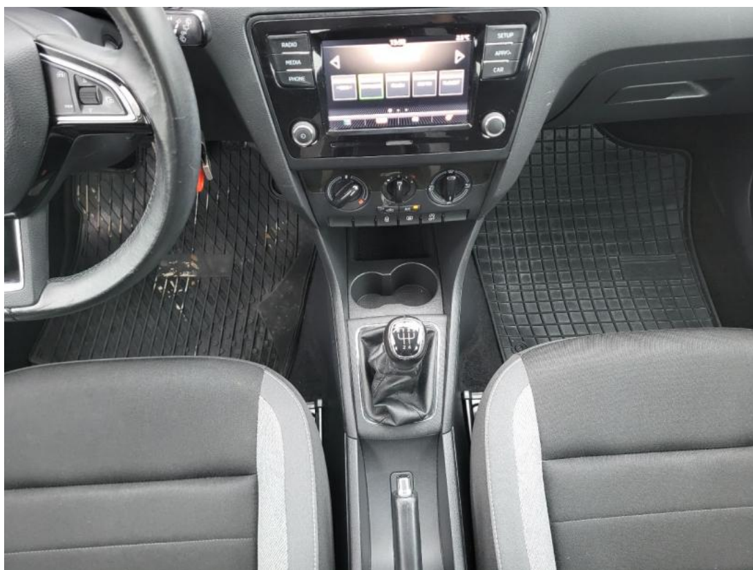
Fot. 20 Tuneł środkowy