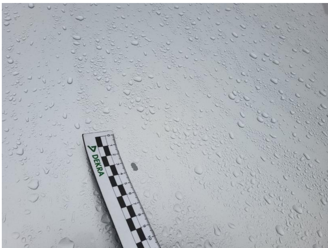
Fot. 38 Pokrywa komory silnika - Rysa/odprysk 2