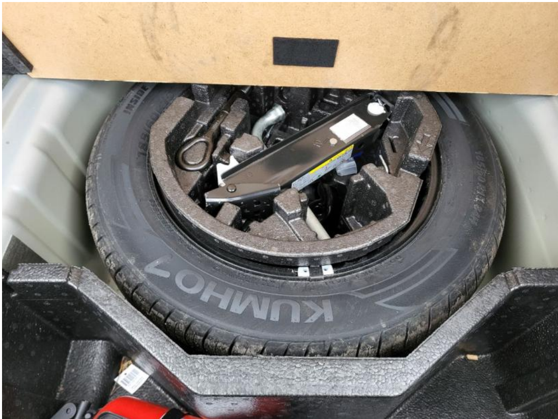
Fot. 25 Koło zapasowe