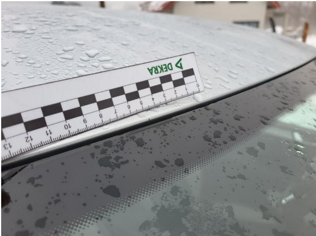
Fot. 43 Dach - Rysa/odprysk 2