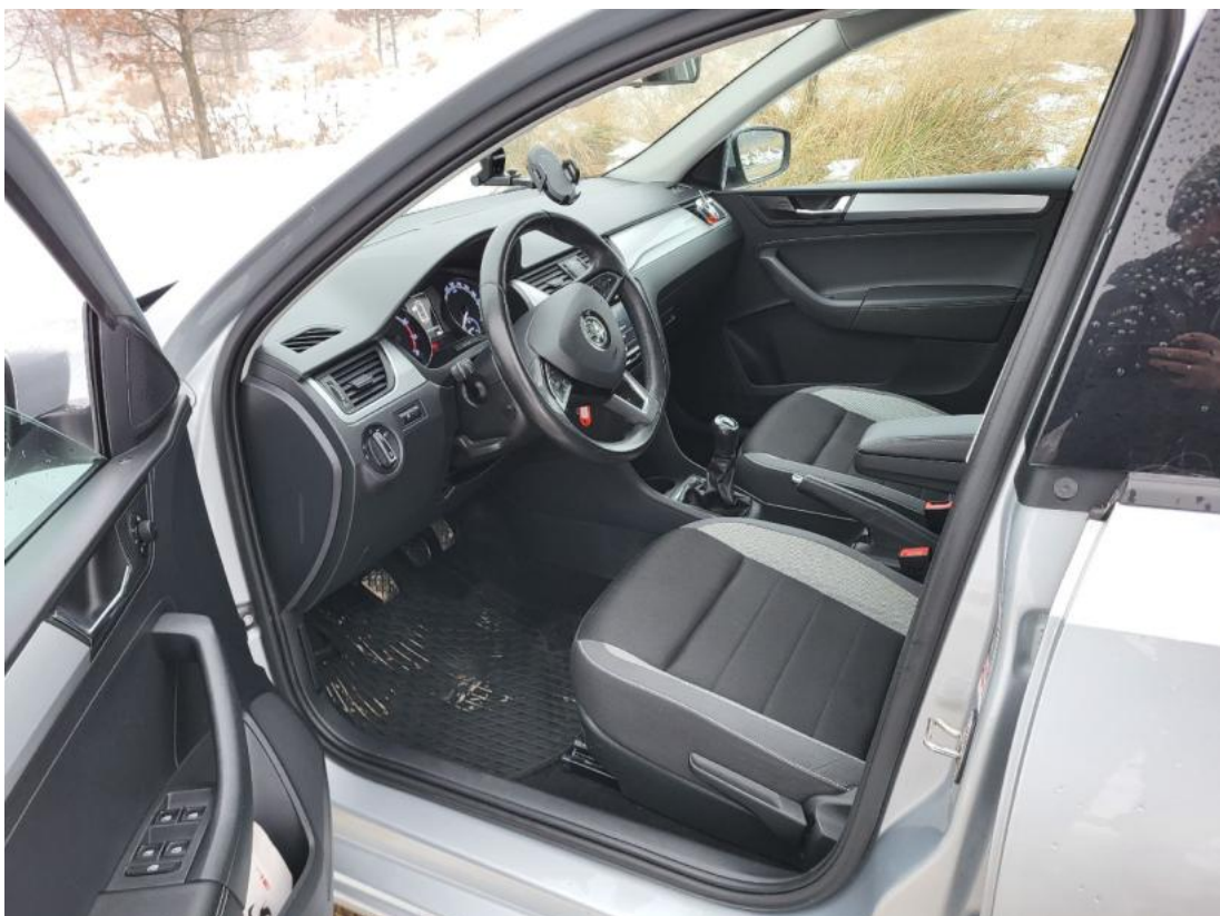
Fot. 16 Widok przez otwarte drzwi przednie lewe