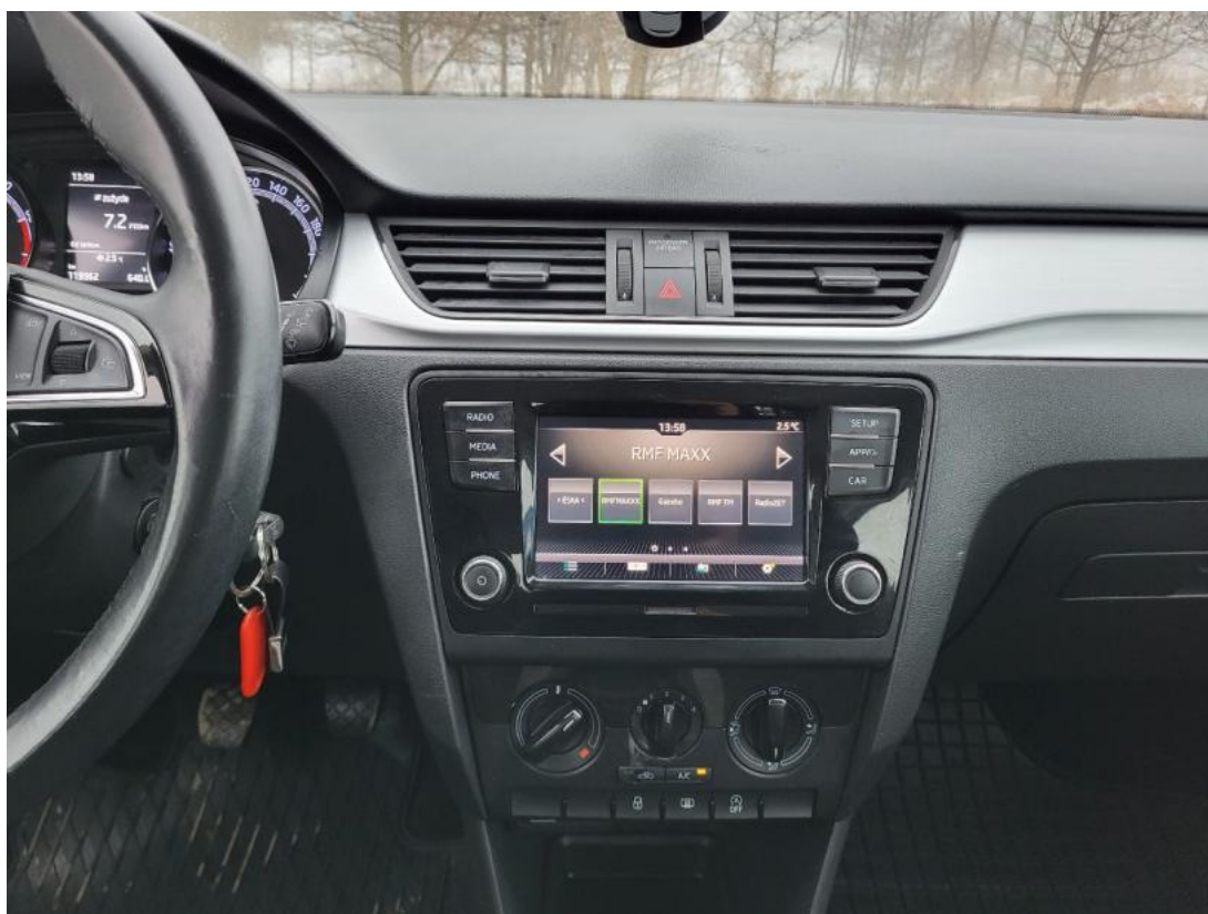
Fot. 19 Konsola środkowa