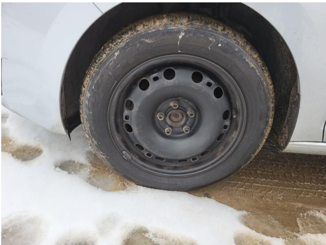
Fot. 44 Kołpak przedni L - Inne 1