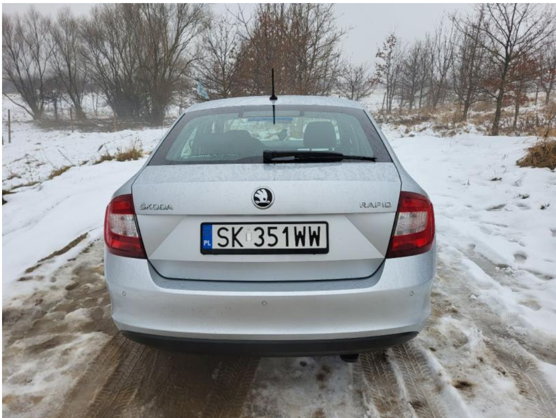
Fot. 8 Tyt