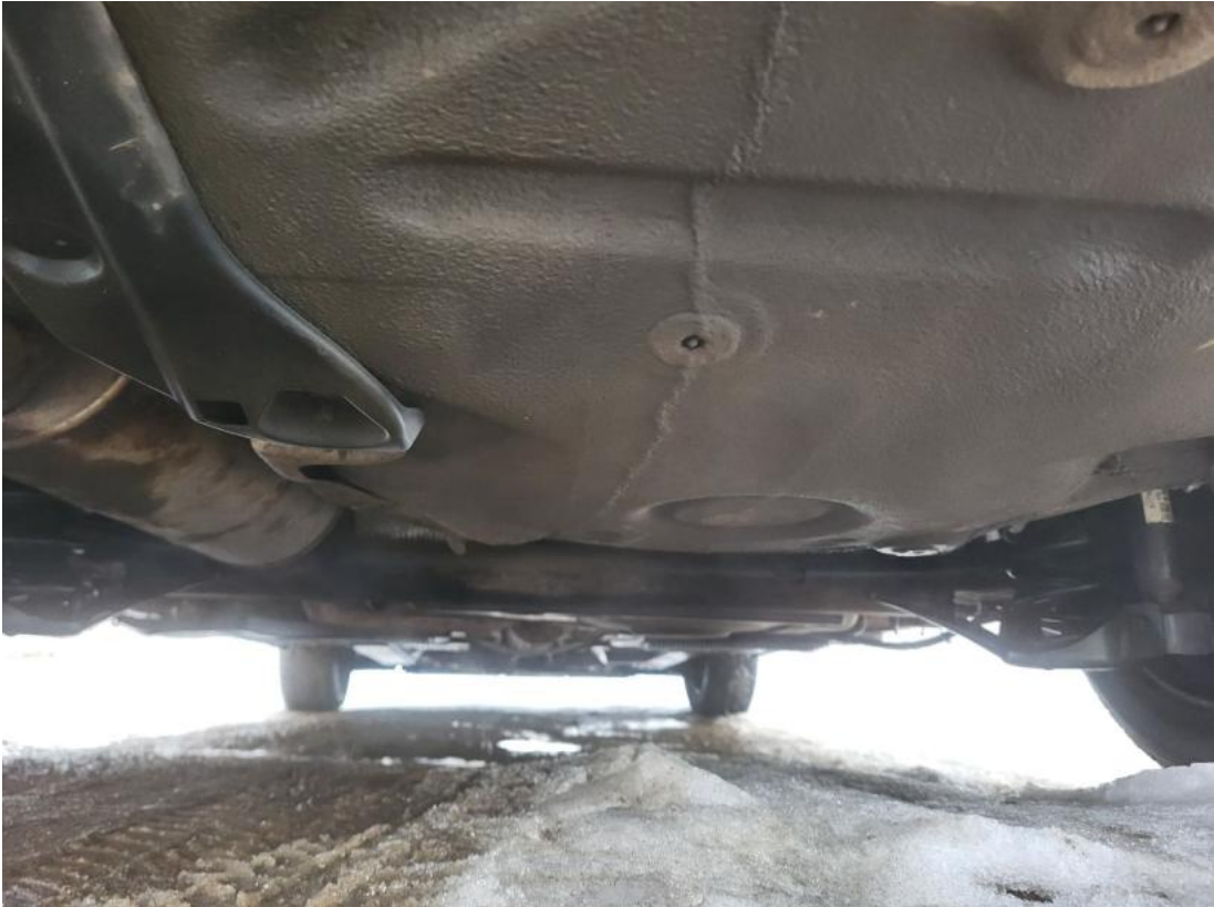
Fot. 27 Spód pojazdu tył