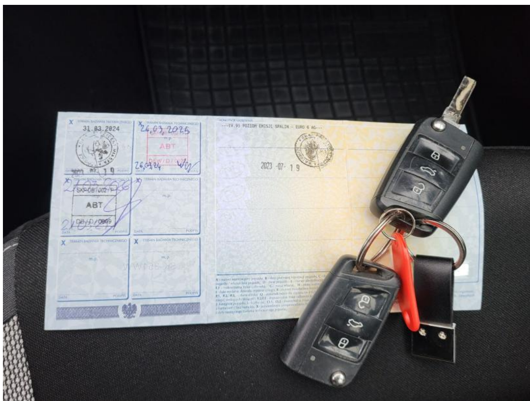
Fot. 33 Dow. Rej. Str.2 i klucze