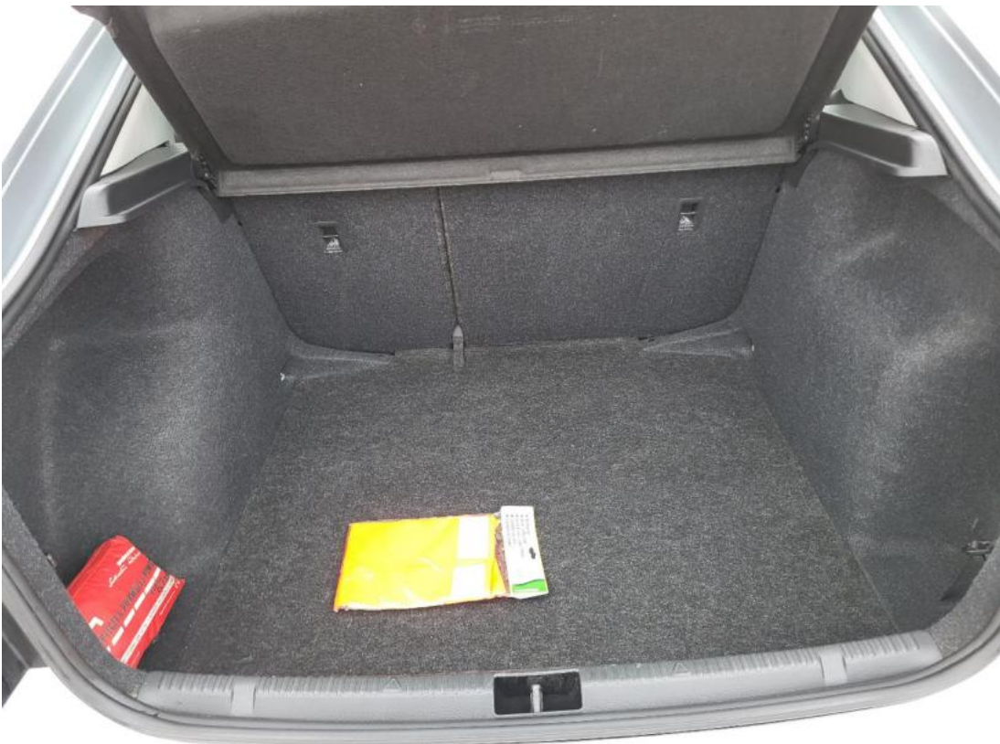
Fot. 24 Bagażnik