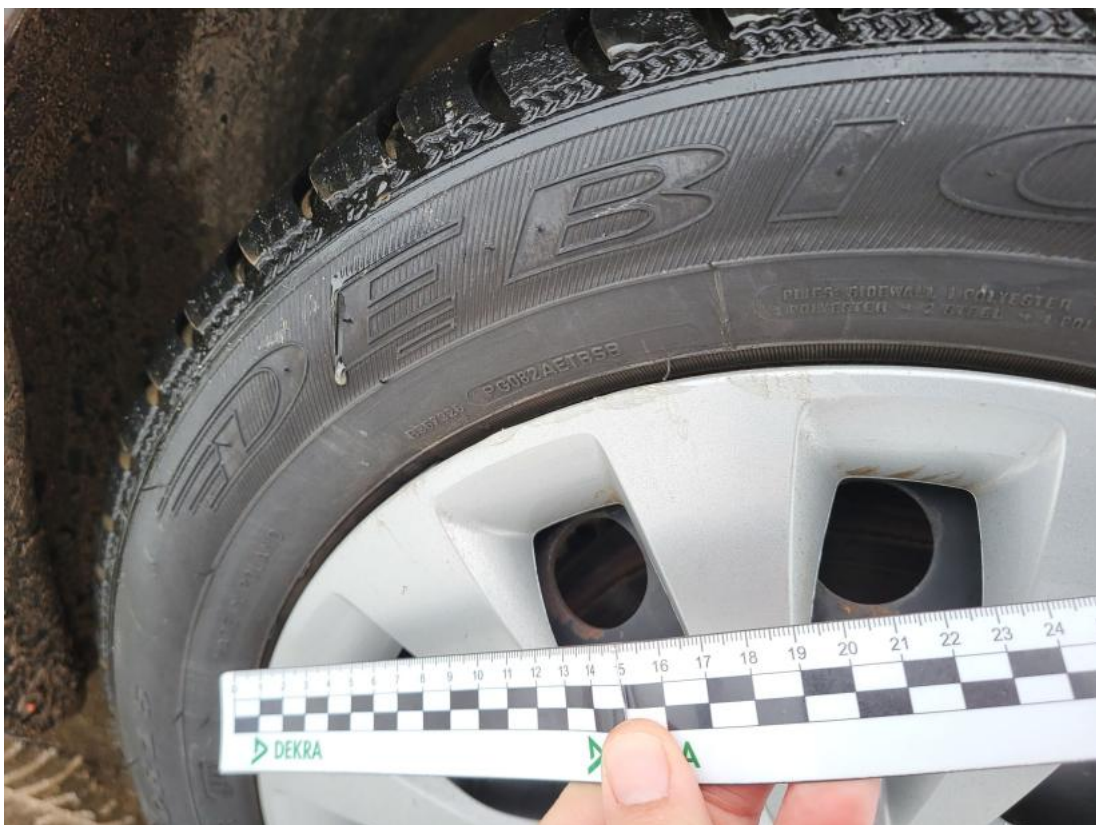
Fot. 40 Kołpak przedni P - Rysa/odprysk 1