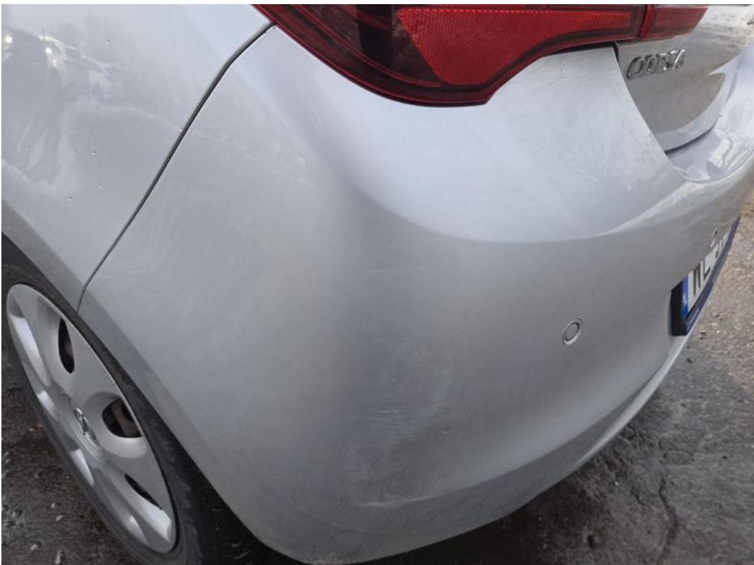
Fot. 54 Zderzak tylny - zdjęcie poglądowe 2