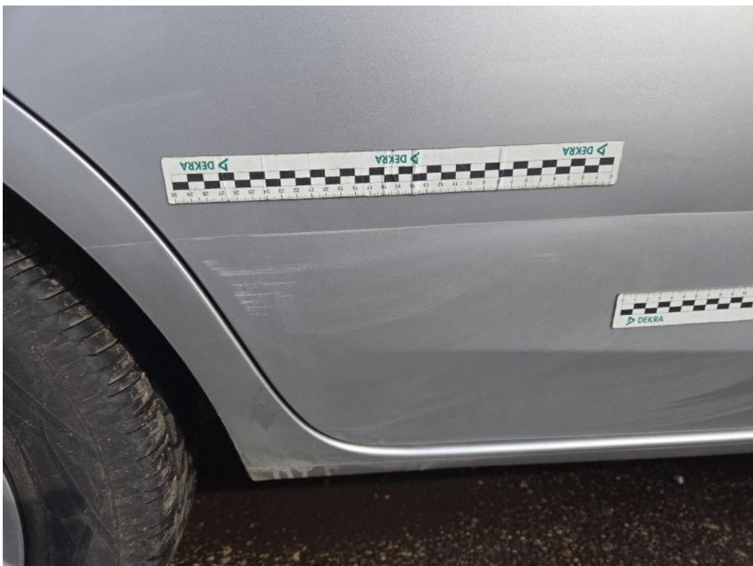
Fot. 46 Drzwi tylne P - zdjęcie pogłądowe 2