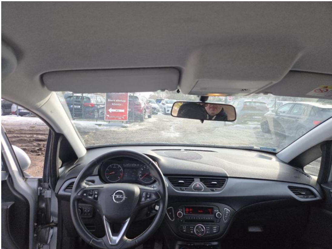
Fot. 19 Konsola środkowa