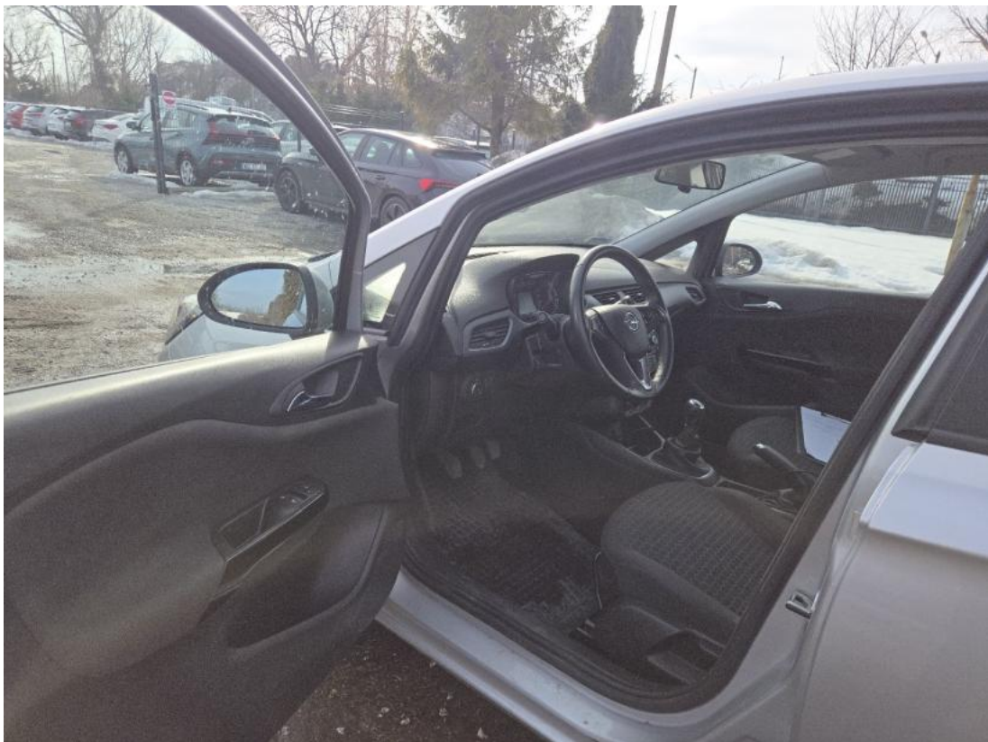
Fot. 16 Widok przez otwarte drzwi przednie lewe