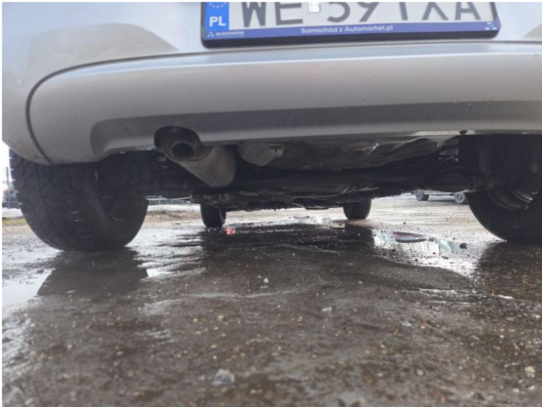
Fot. 27 Spód pojazdu tył