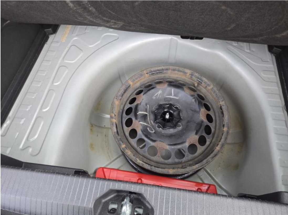
Fot. 25 Koło zapasowe