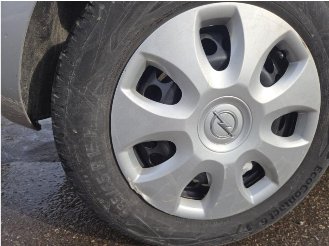
Fot. 53 Kołpak tylny P - Wgniecenie/odkształcenie 1