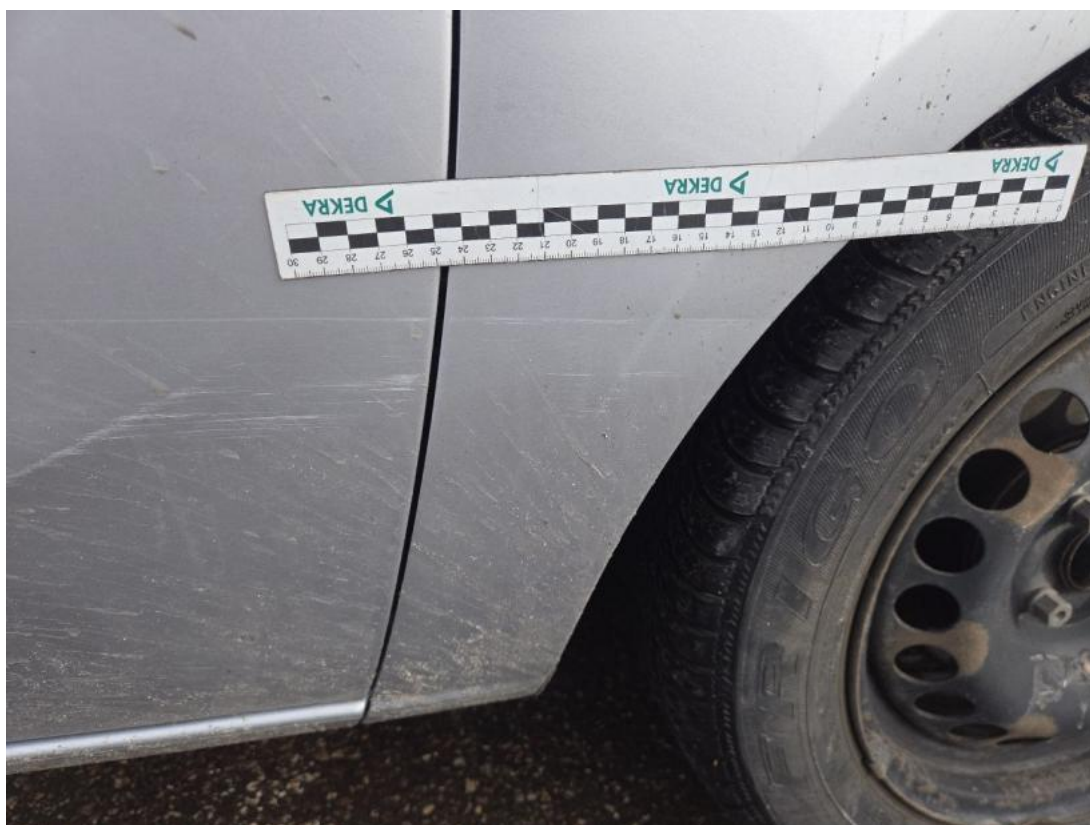
Fot. 40 Błotnik przedni P - zdjęcie pogładowe 2