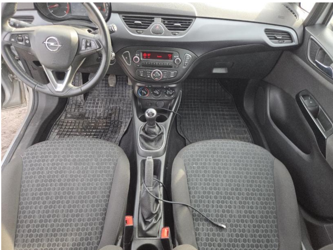
Fot. 20 Tuneł środkowy