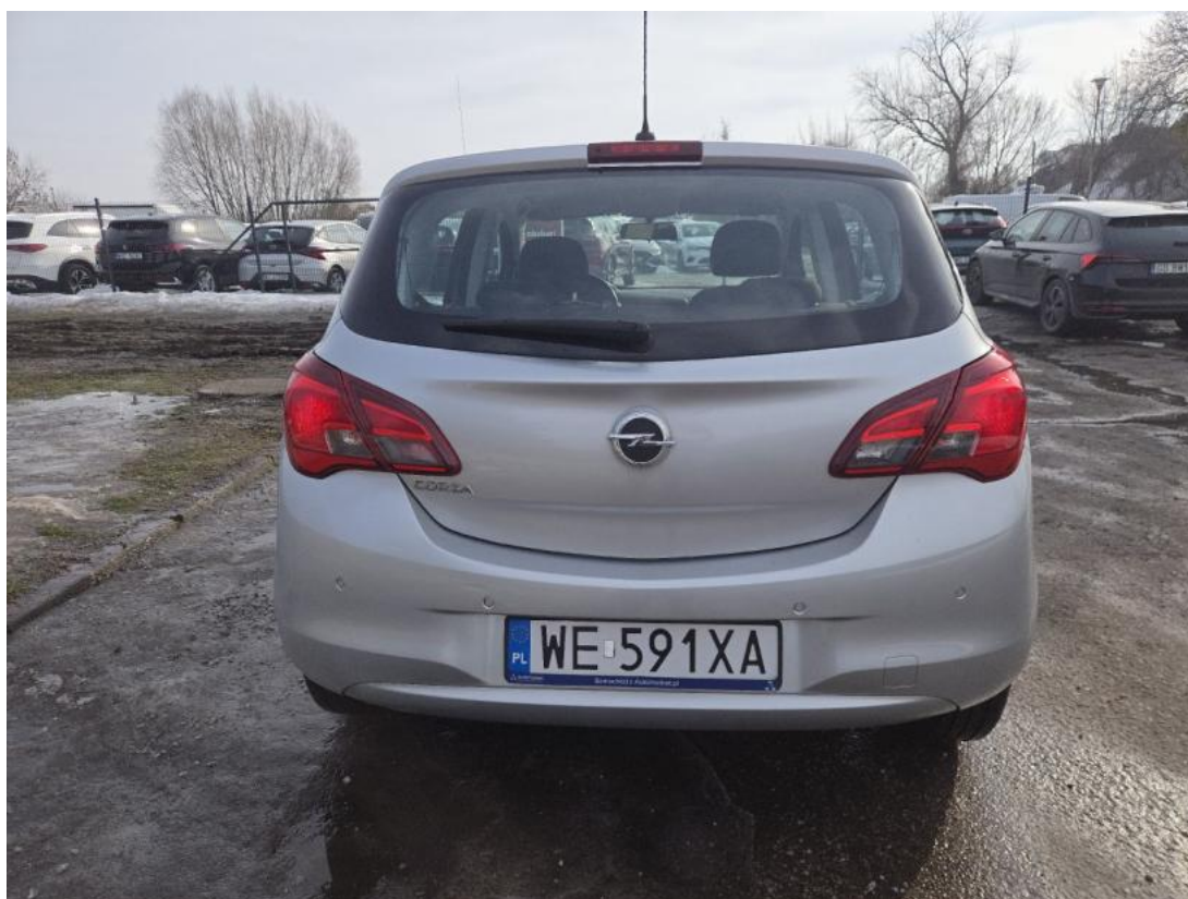
Fot. 8 Tyt