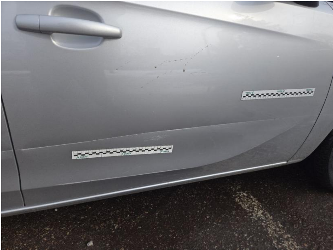
Fot. 45 Drzwi przednie P - Wgniecenie/odkształcenie 1