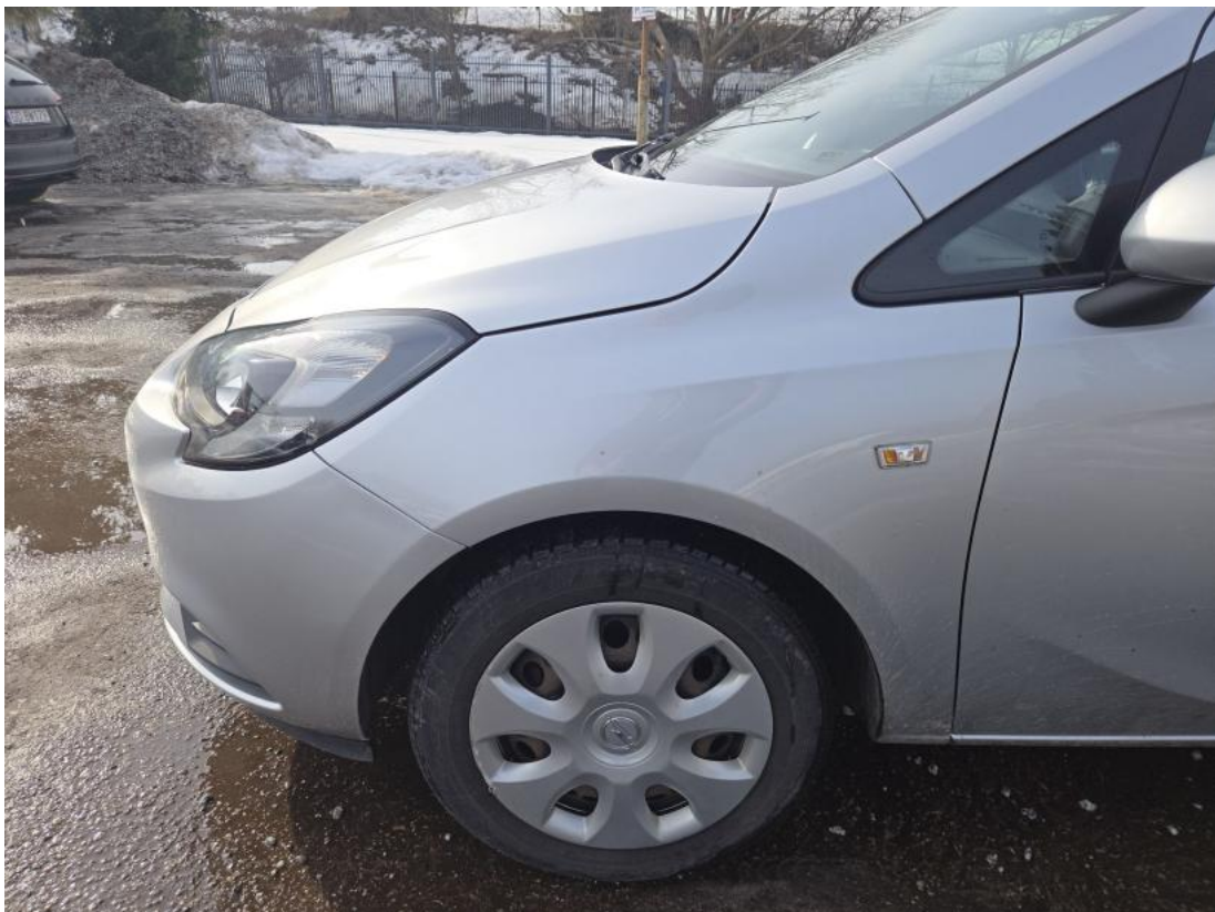
Fot. 28 Tarcza hamulcowa przednia lewa