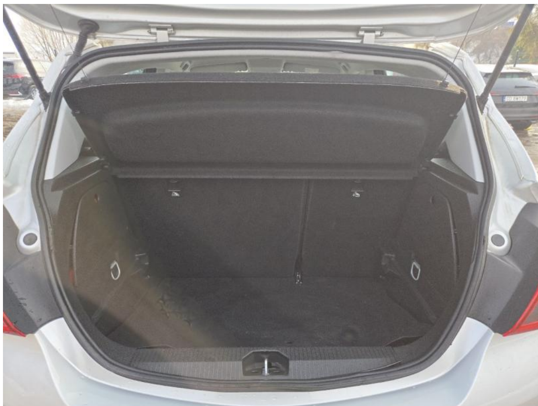
Fot. 24 Bagażnik