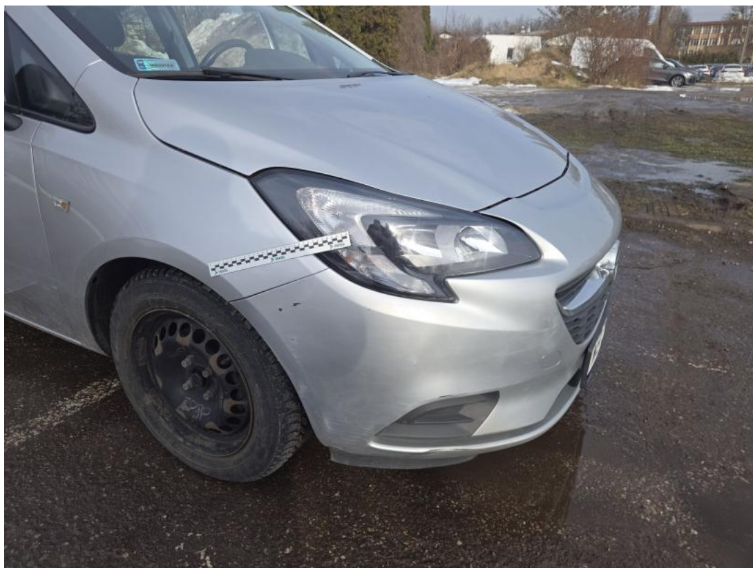
Fot. 39 Zderzak - Rysa/odprysk 1