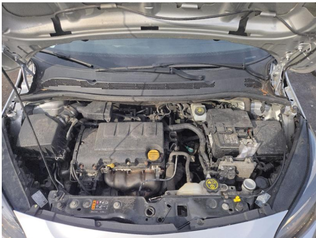
Fot. 23 Komora silnika