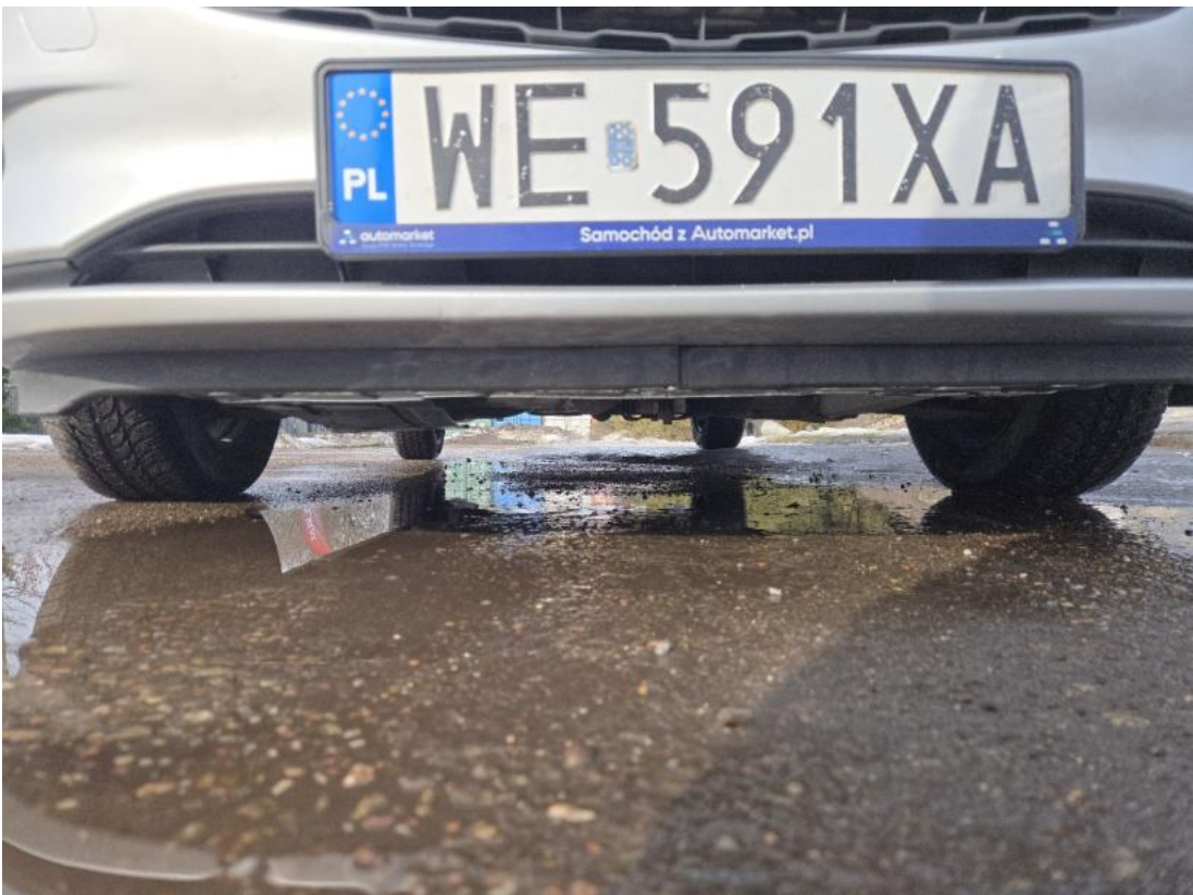
Fot. 26 Spód pojazdu przód