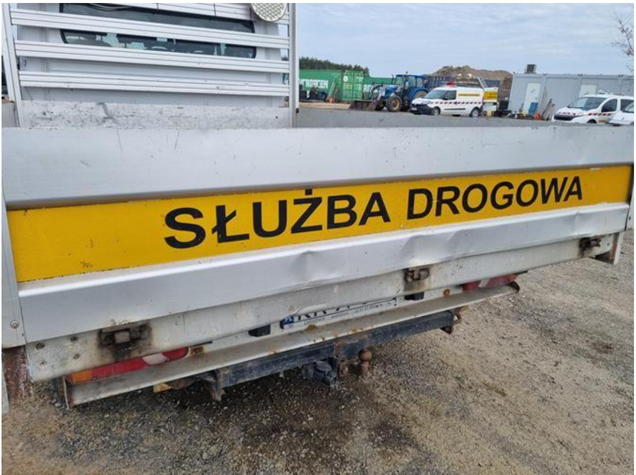
Fot. nr 80