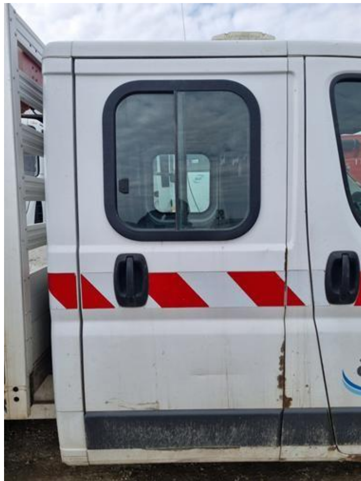
Fot. nr 84