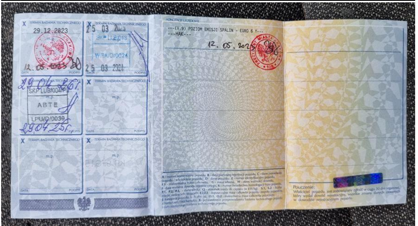
Fot. nr 105