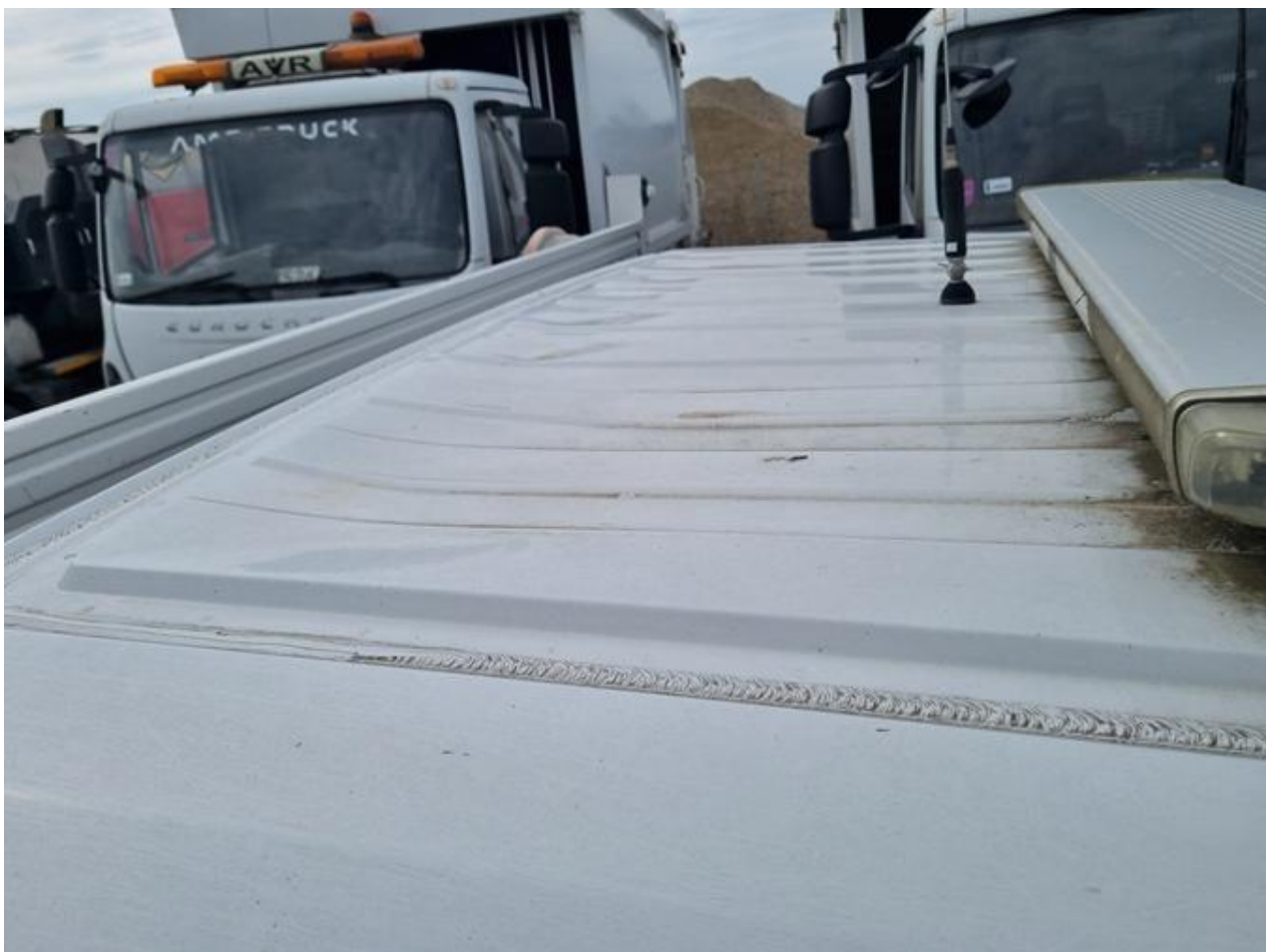
Fot. nr 100