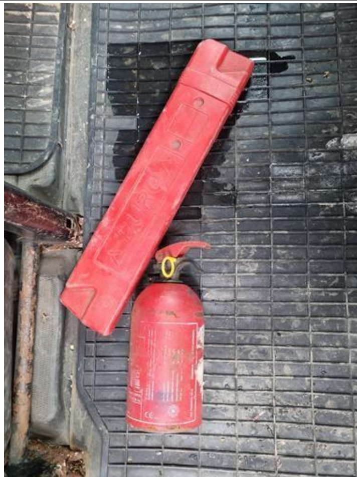
Fot. nr 103