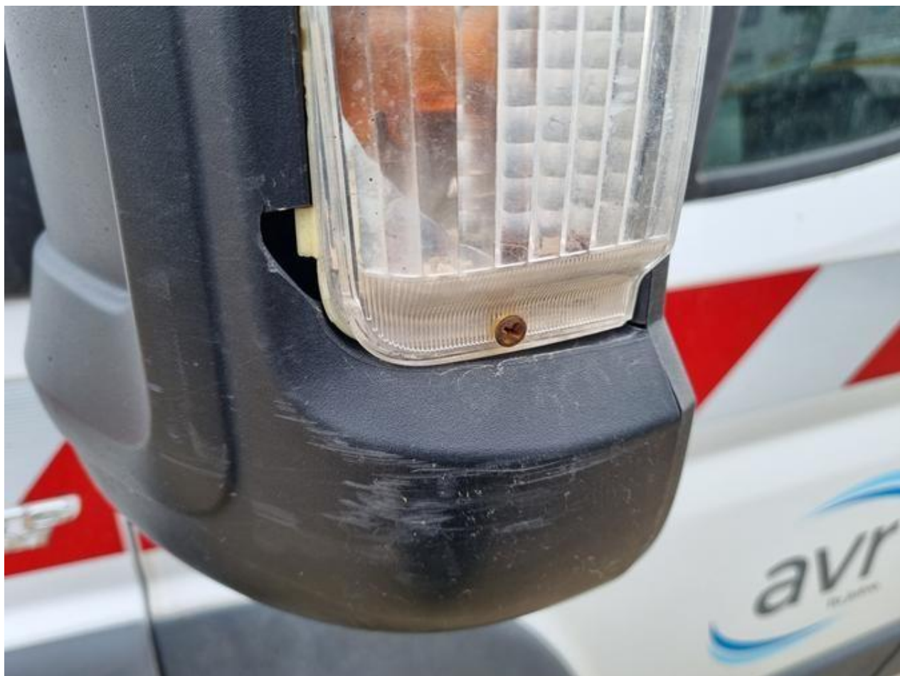
Fot. nr 96