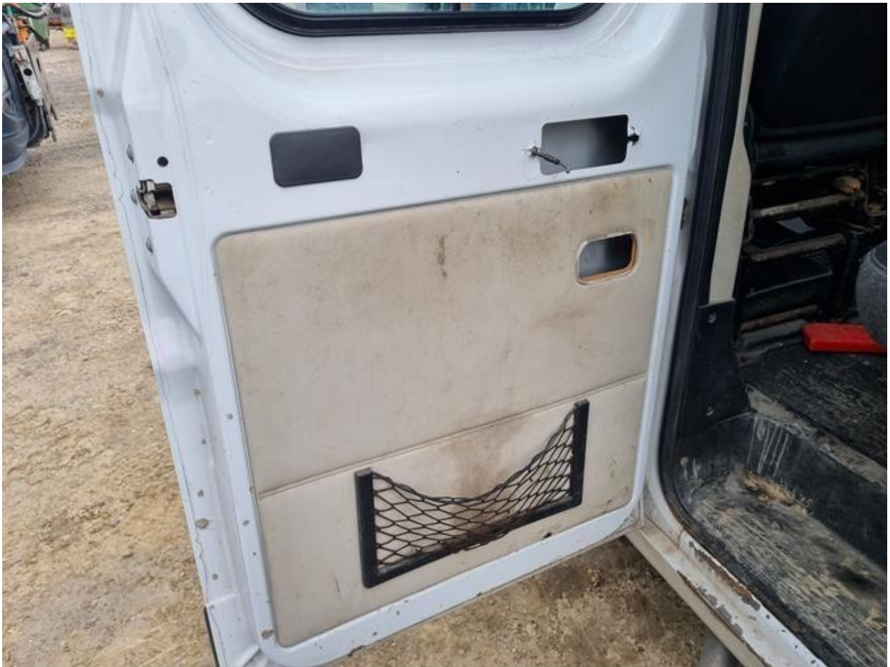
Fot. nr 97