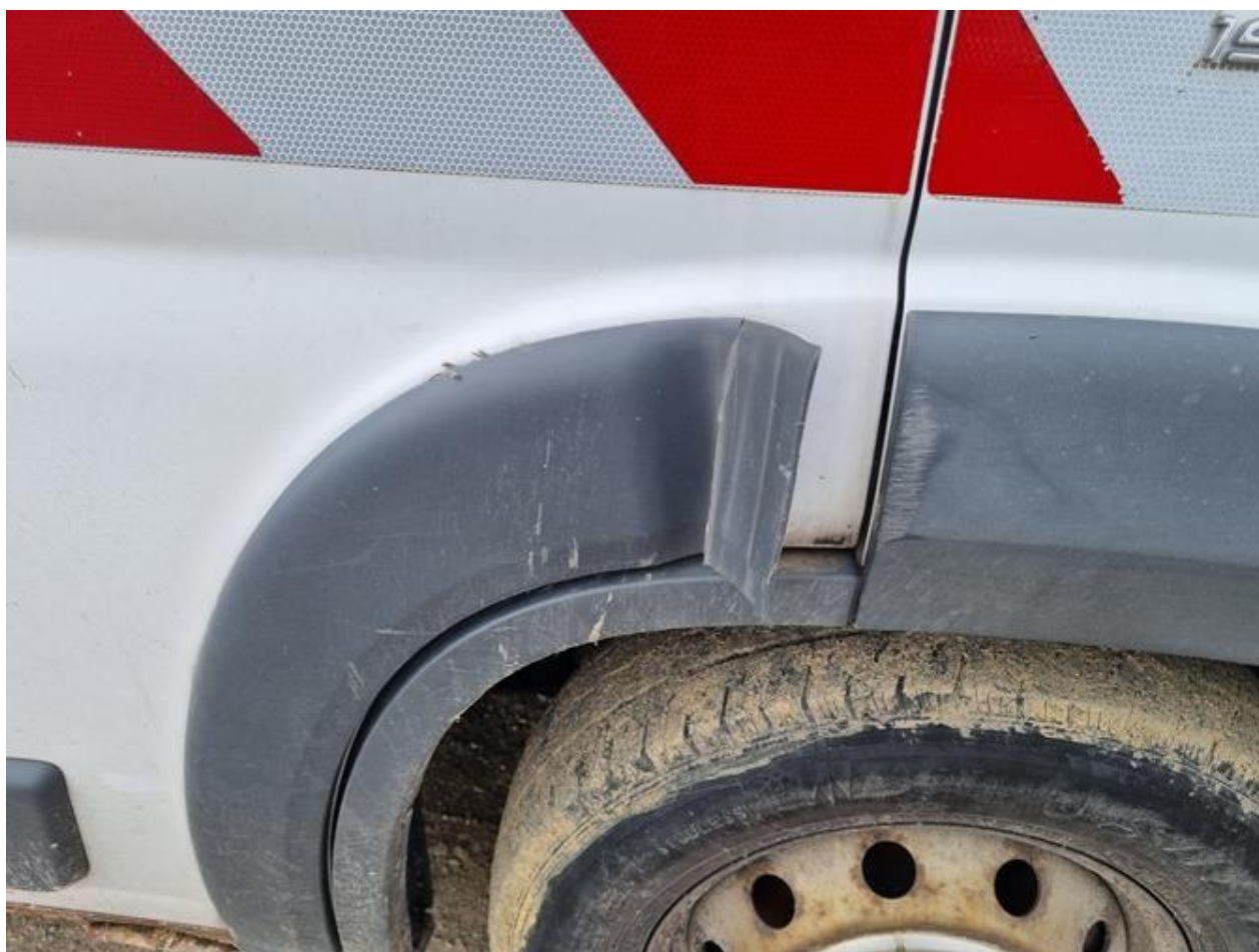
Fot. nr 94