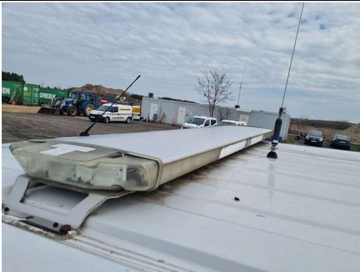
Fot. nr 77