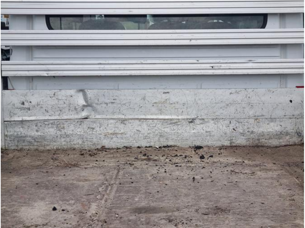
Fot. nr 79