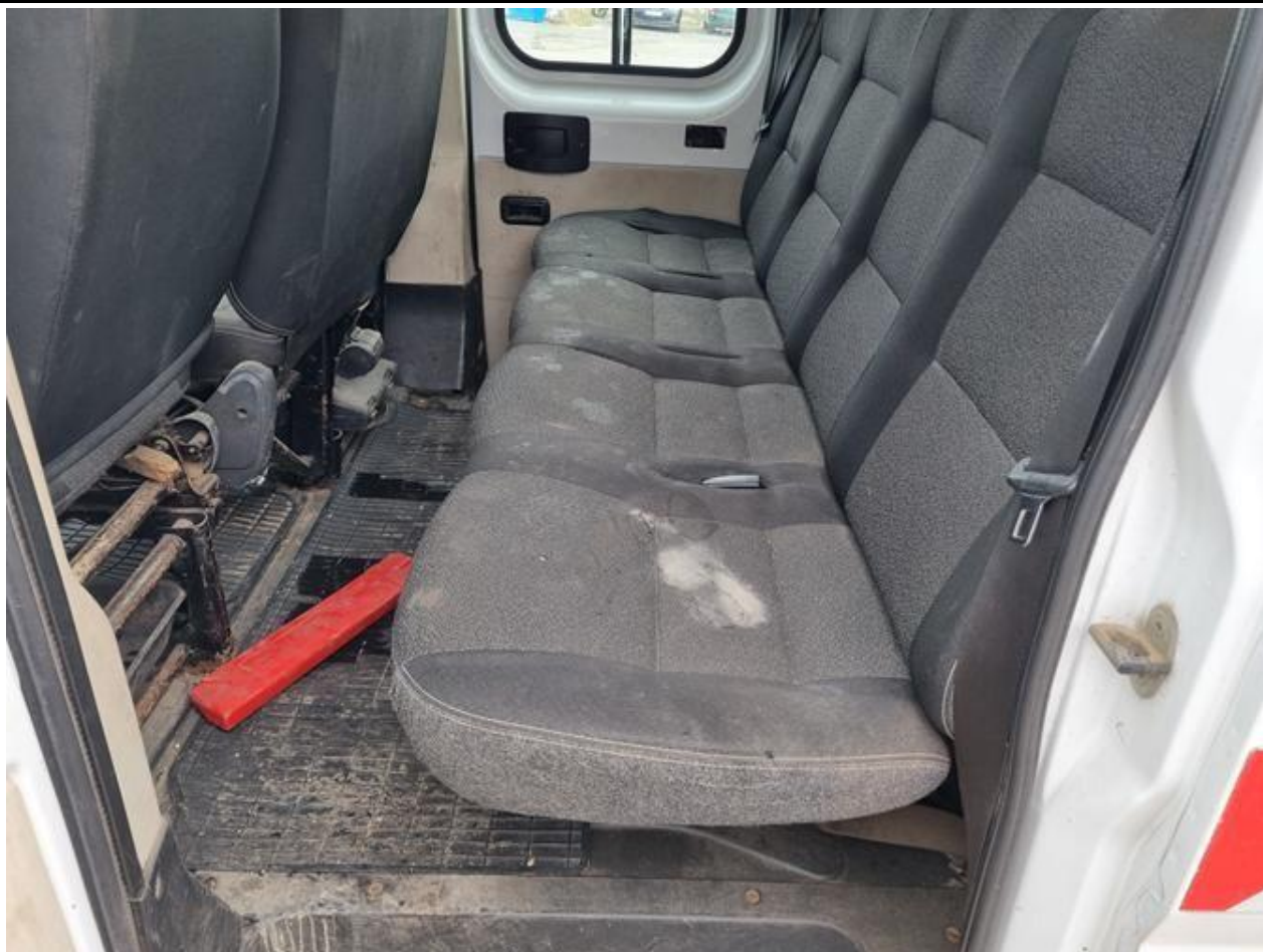
Fot. nr 75