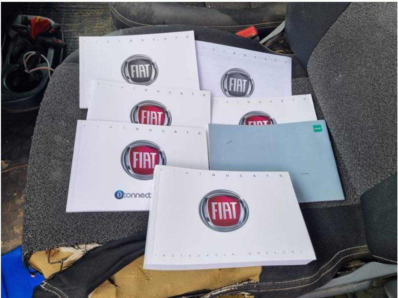
Fot. nr 106

Dokument wystawiony elektronicznie, wa ny bez podpisu