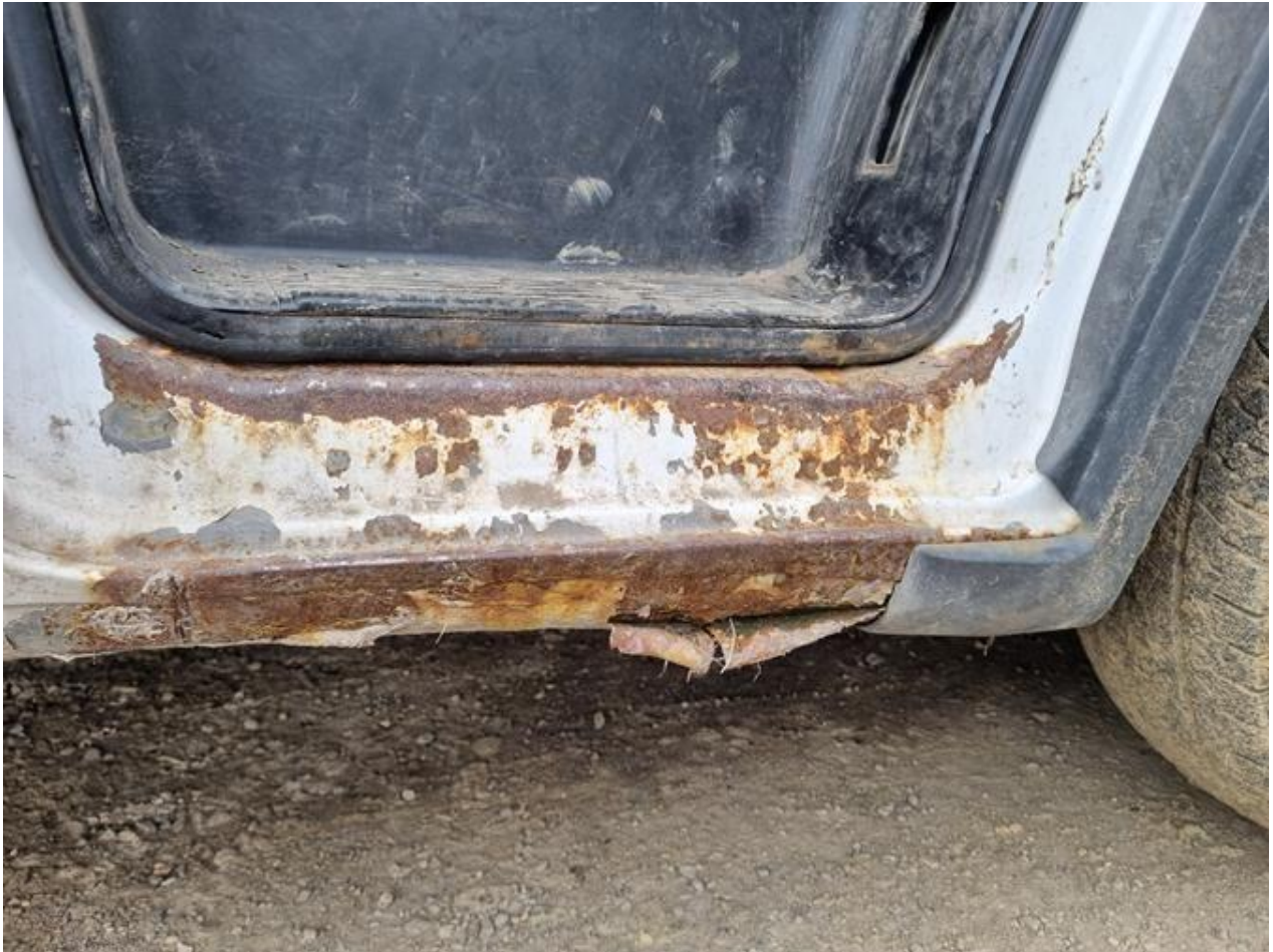
Fot. nr 89