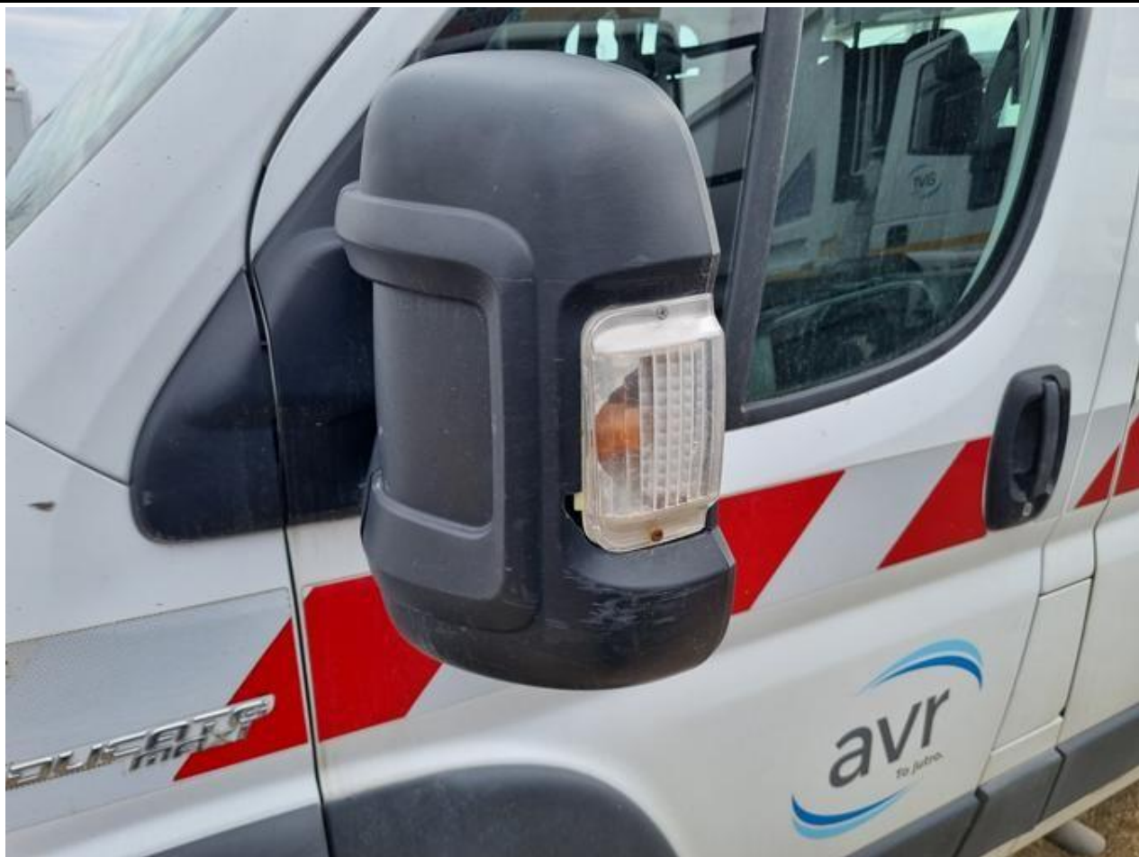
Fot. nr 95