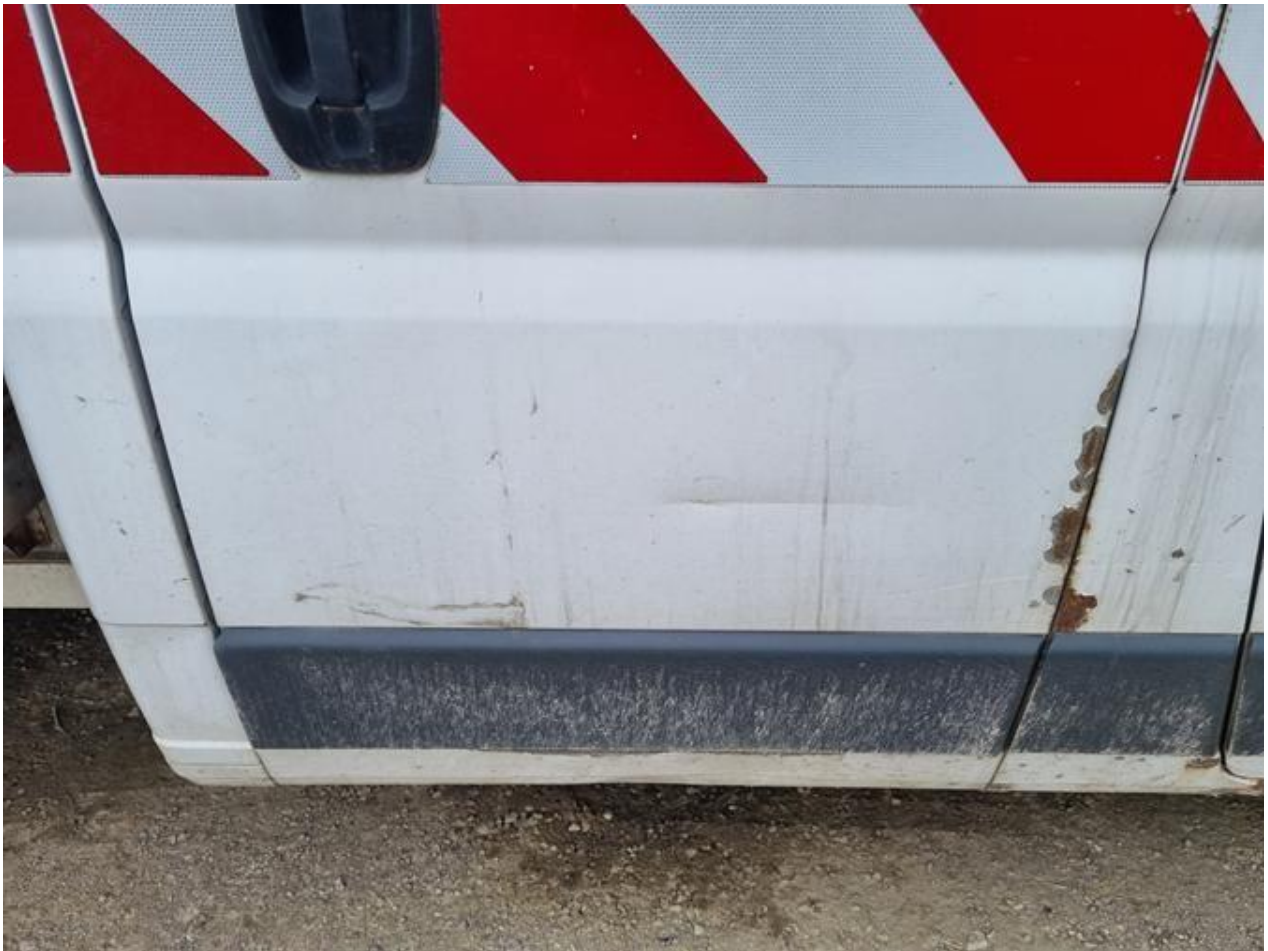
Fot. nr 85