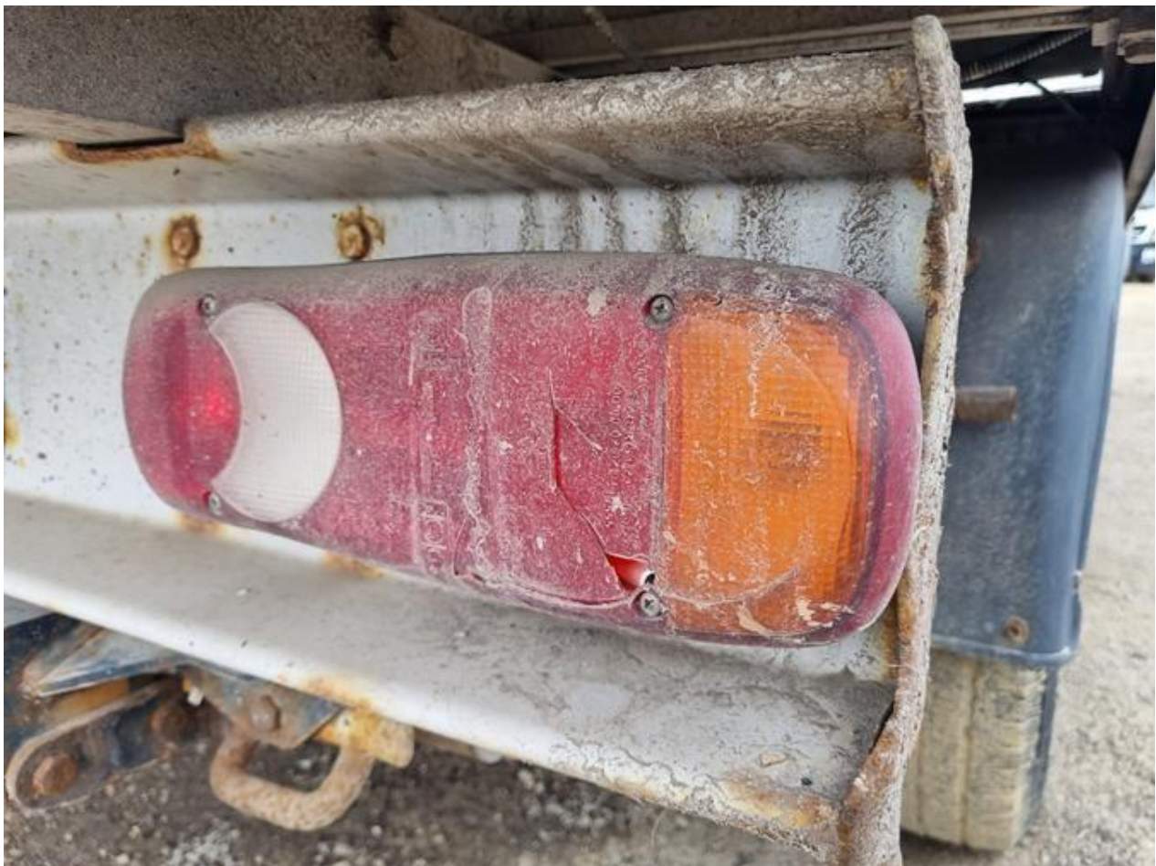
Fot. nr 82