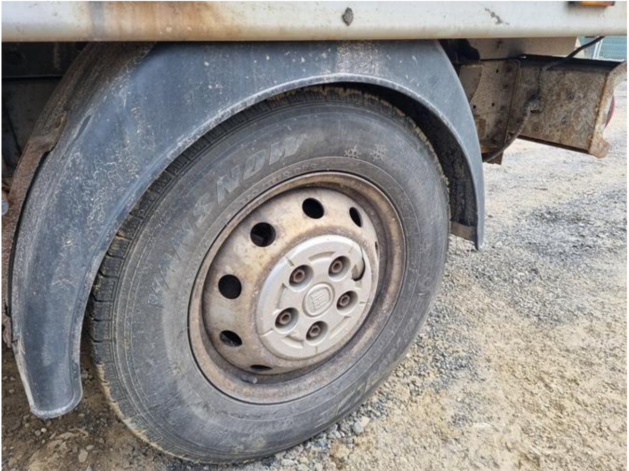
Fot. nr 101