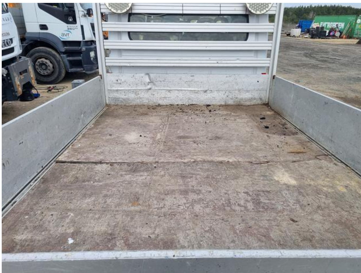
Fot. nr 78