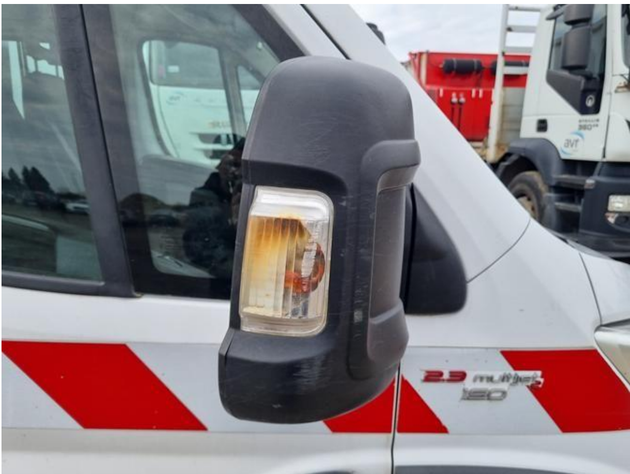
Fot. nr 92