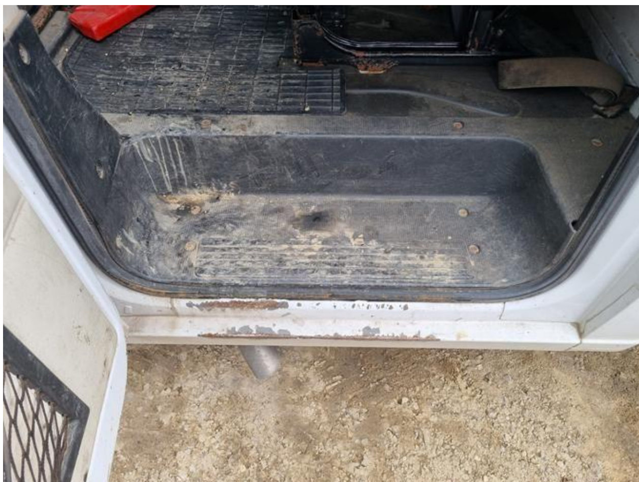
Fot. nr 76