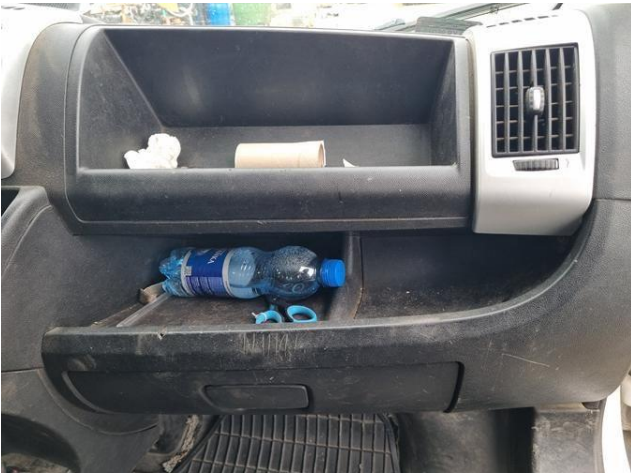
Fot. nr 90