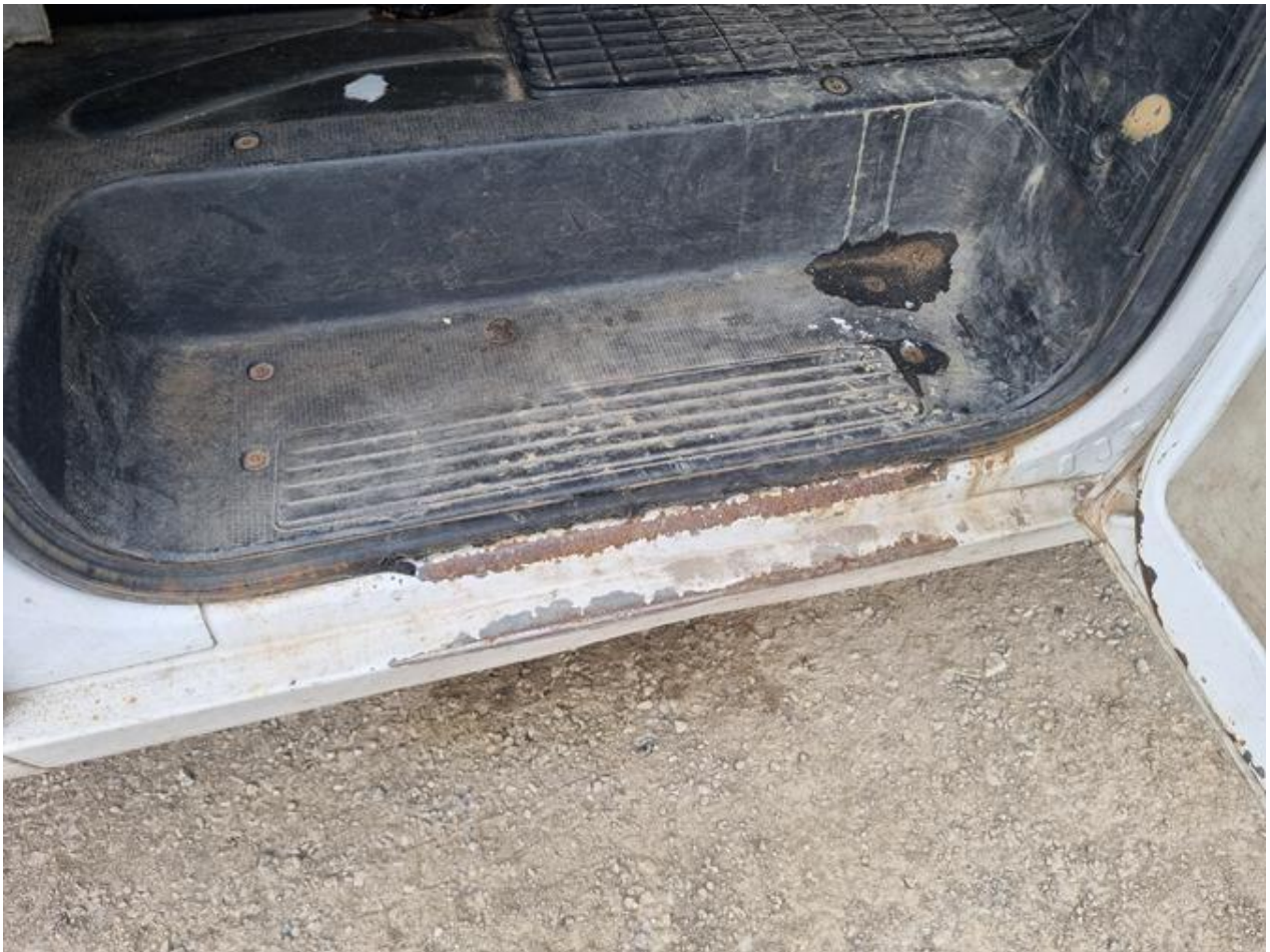
Fot. nr 87