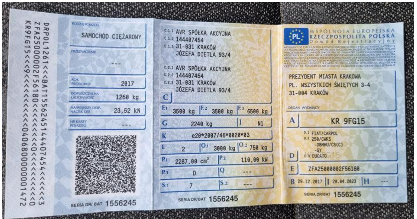
Fot. nr 104