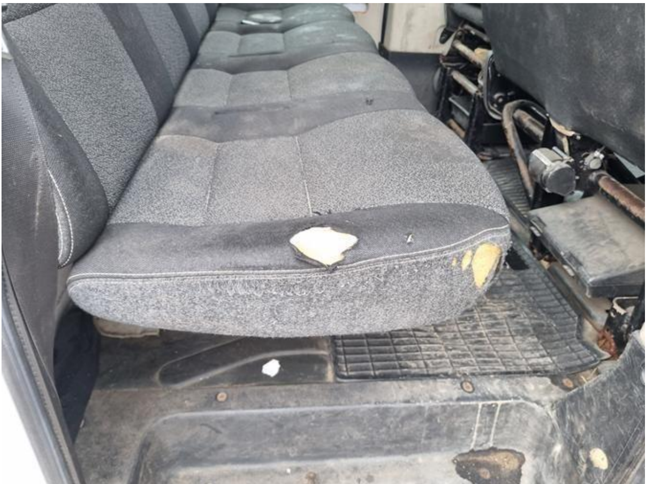
Fot. nr 86