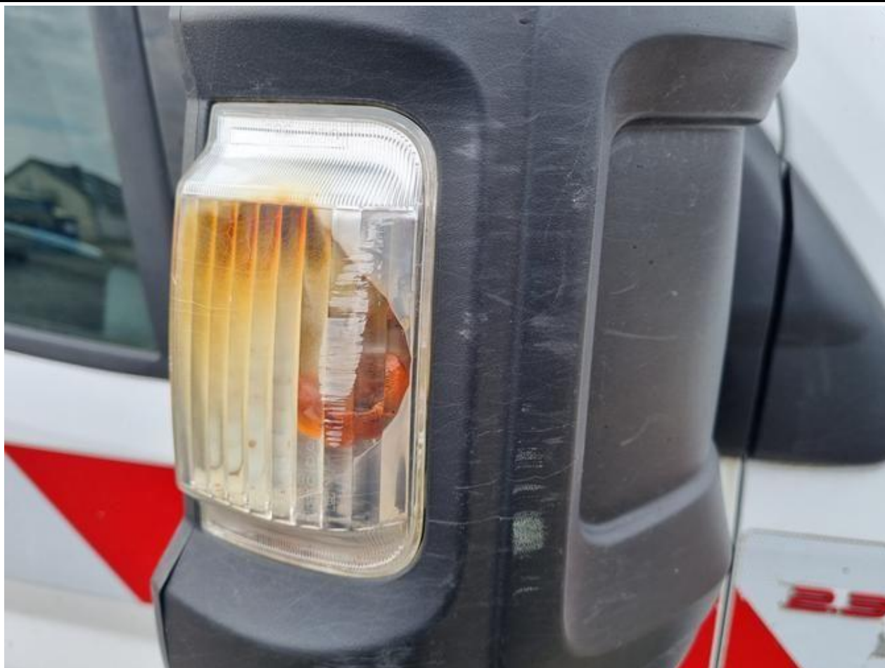
Fot. nr 93