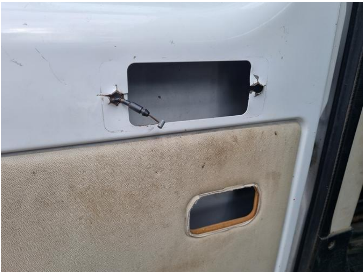
Fot. nr 98