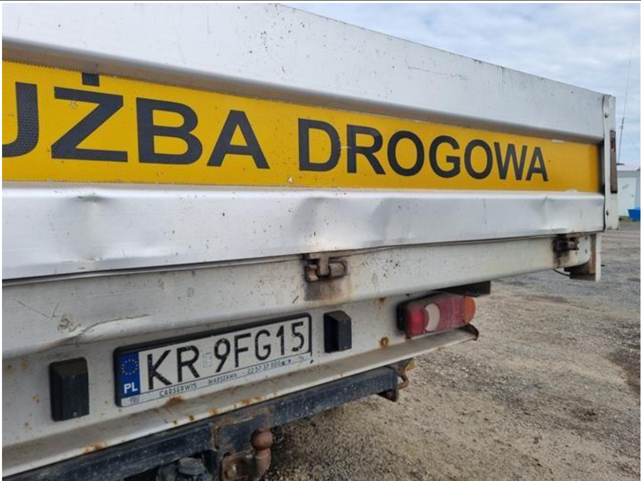
Fot. nr 81