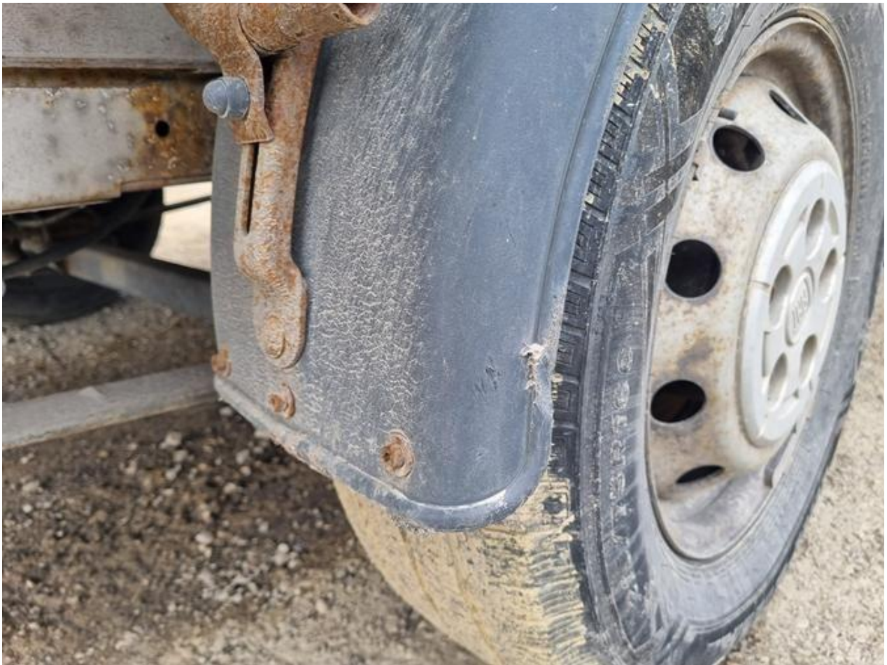
Fot. nr 83