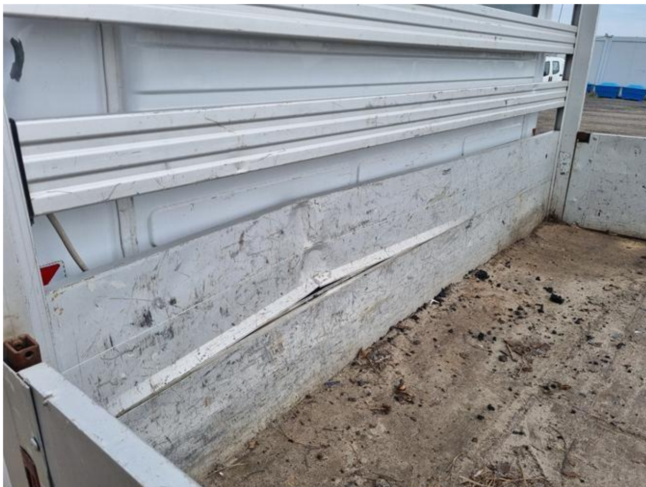
Fot. nr 74