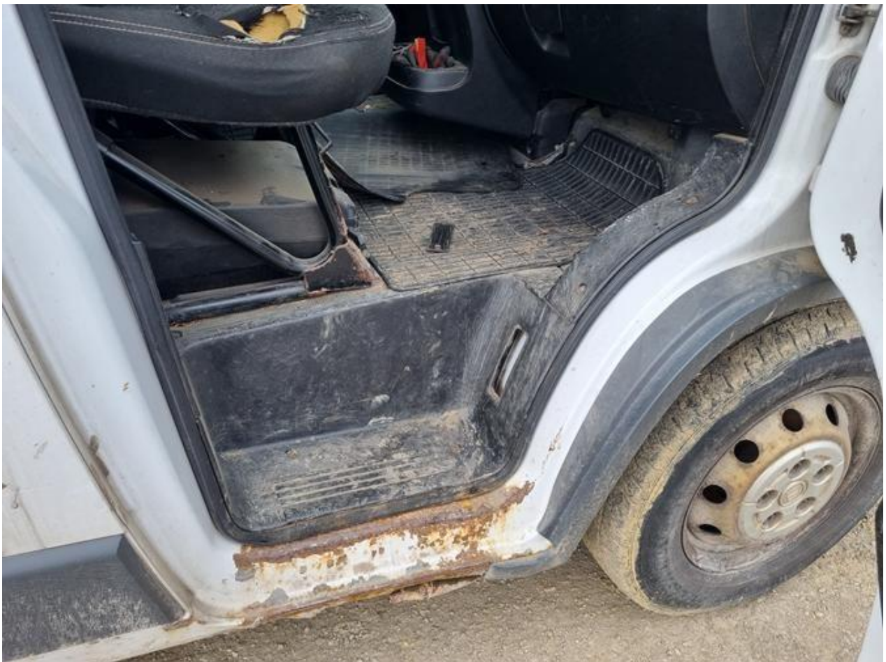
Fot. nr 88