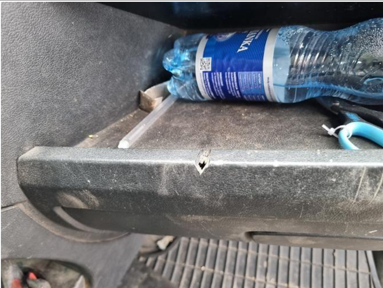
Fot. nr 91