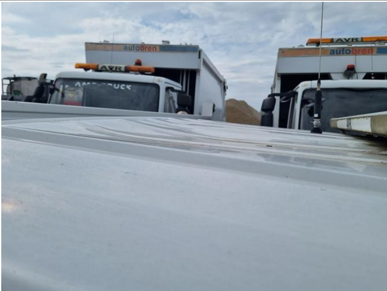
Fot. nr 99