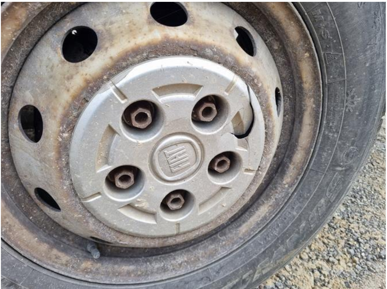
Fot. nr 102