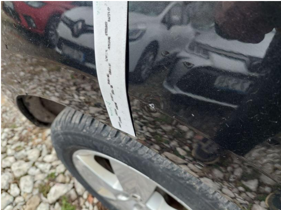
Fot. 39 Błotnik tylny P / Ściana boczna P - Wgniecenie/odkształcenie 1