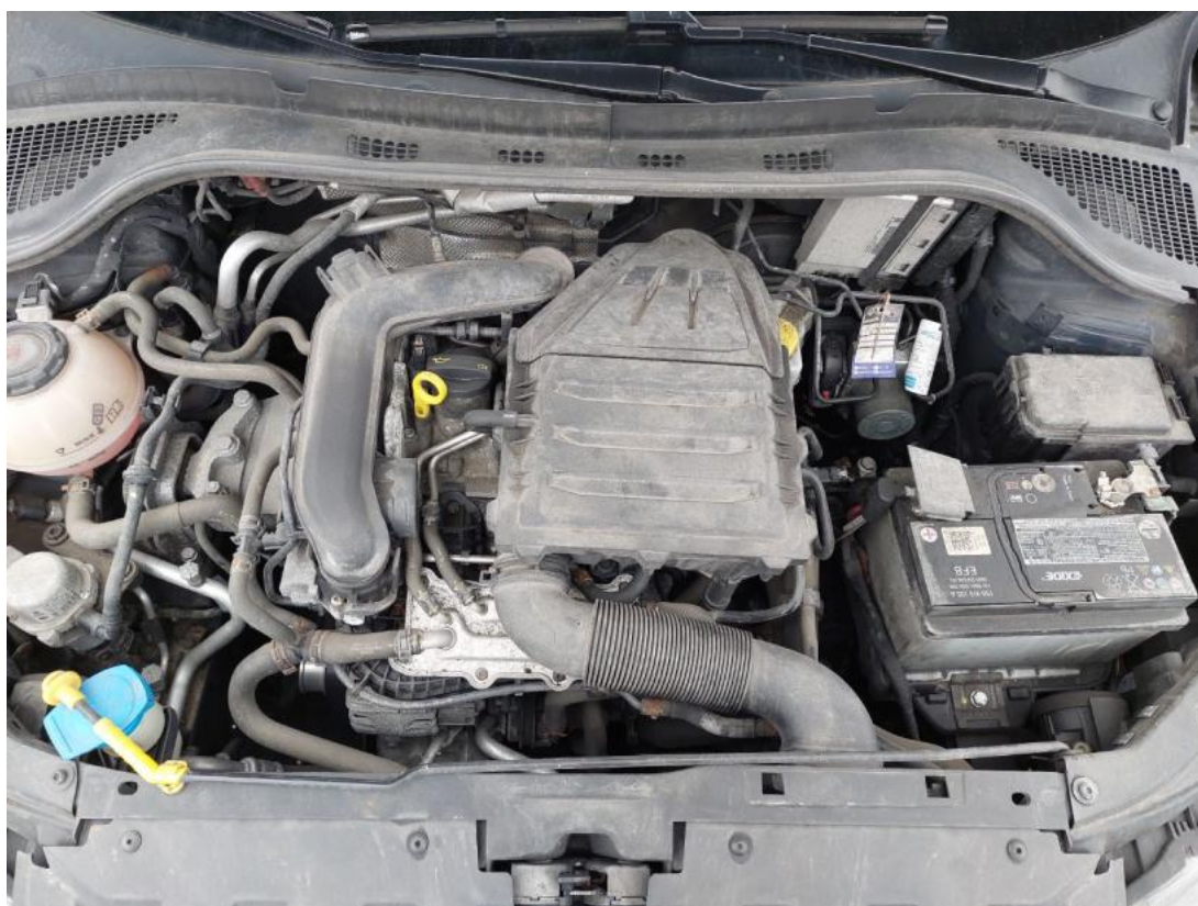
Fot. 24 Komora silnika