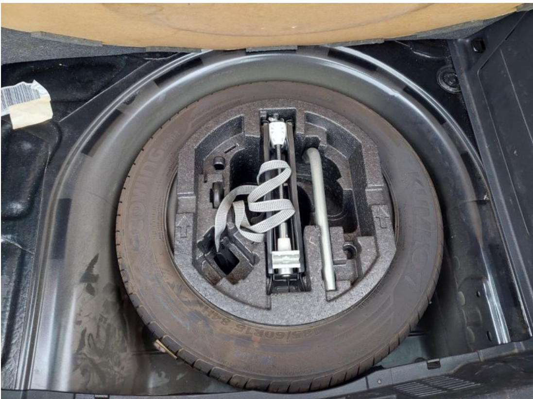
Fot. 26 Koło zapasowe