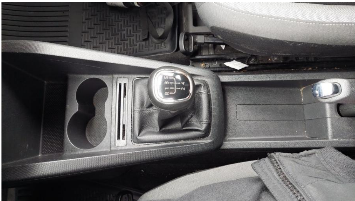
Fot. 21 Tunel środkowy