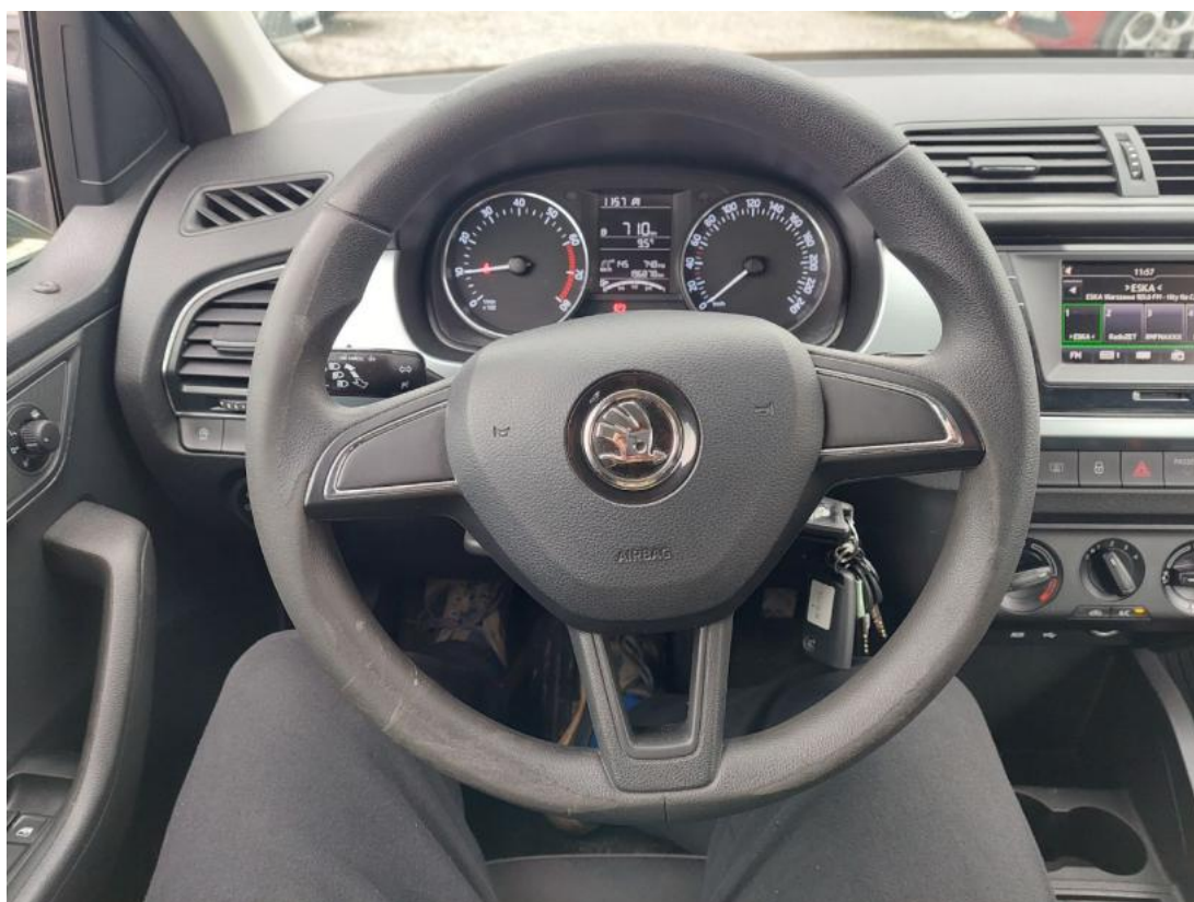
Fot. 22 Kierownica (na wprost)