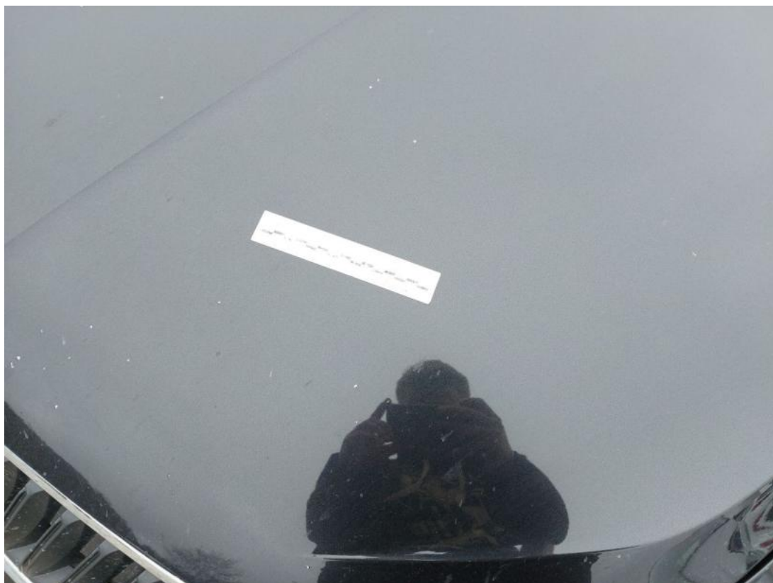
Fot. 35 Pokrywa komory silnika - Rysa/odprysk 2