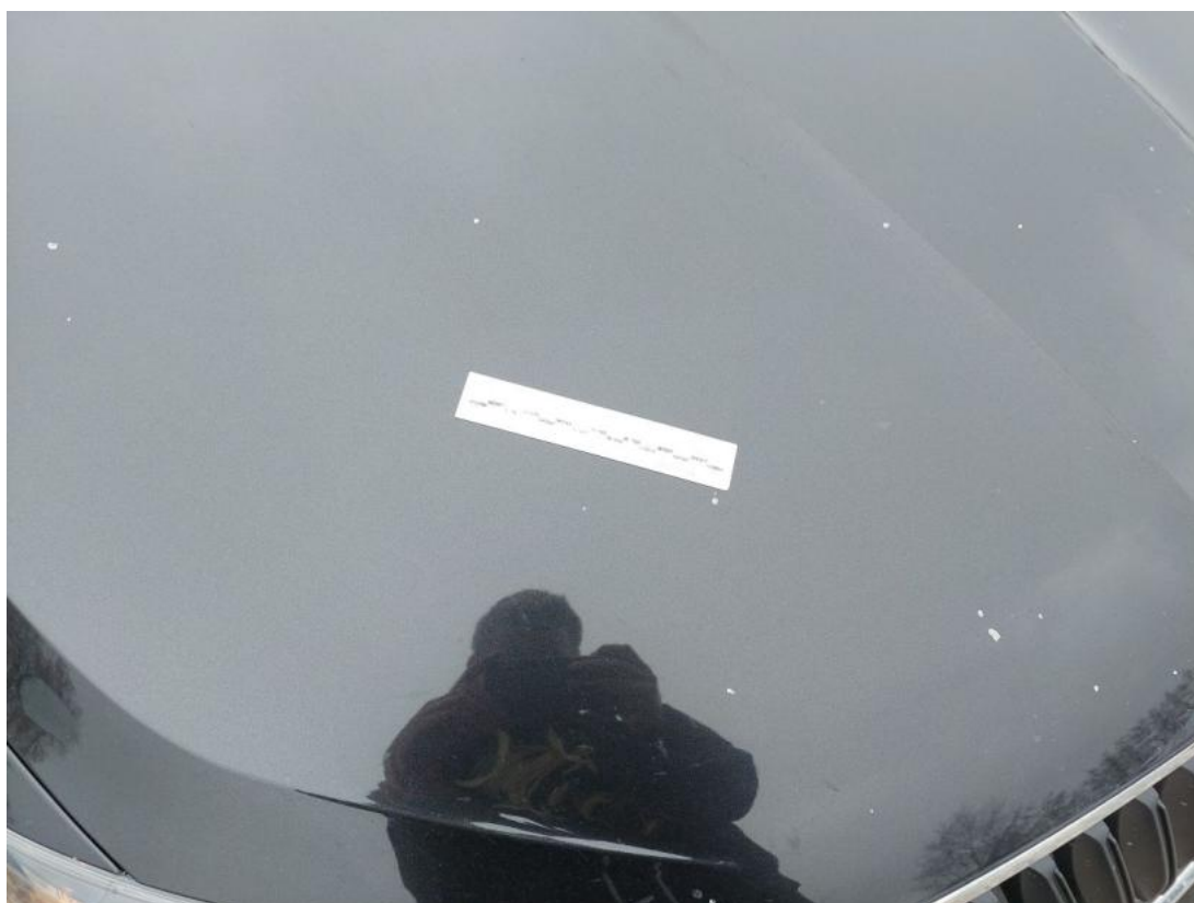
Fot. 36 Pokrywa komory silnika() - Rysa/odprysk 3