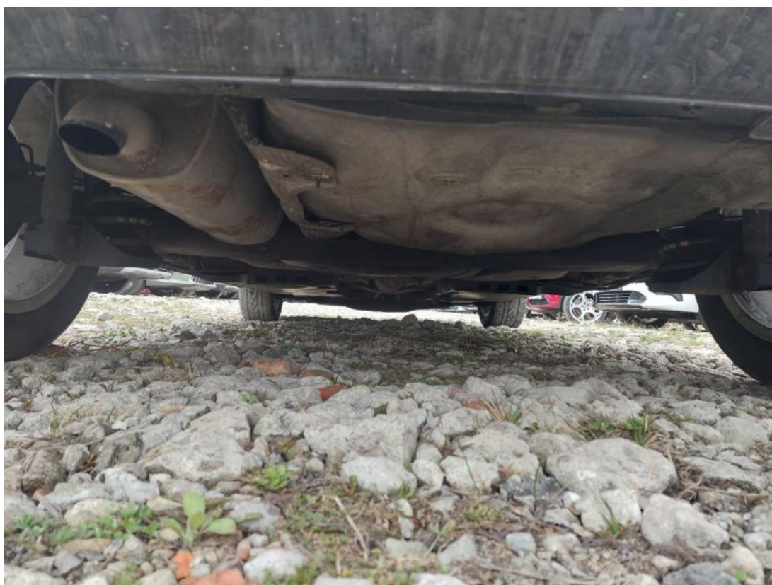
Fot. 28 Spód pojazdu tył