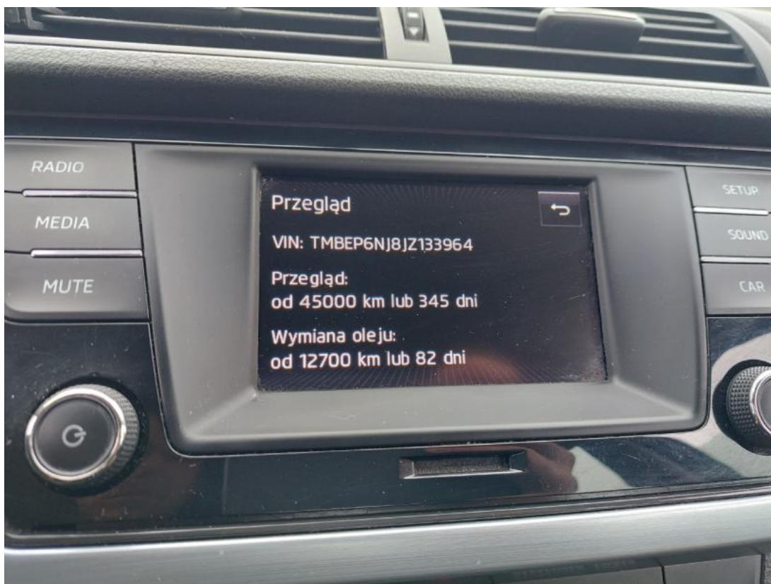
Fot. 16 Zestaw wskaźników - serwis