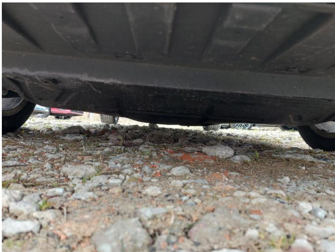
Fot. 27 Spód pojazdu przód