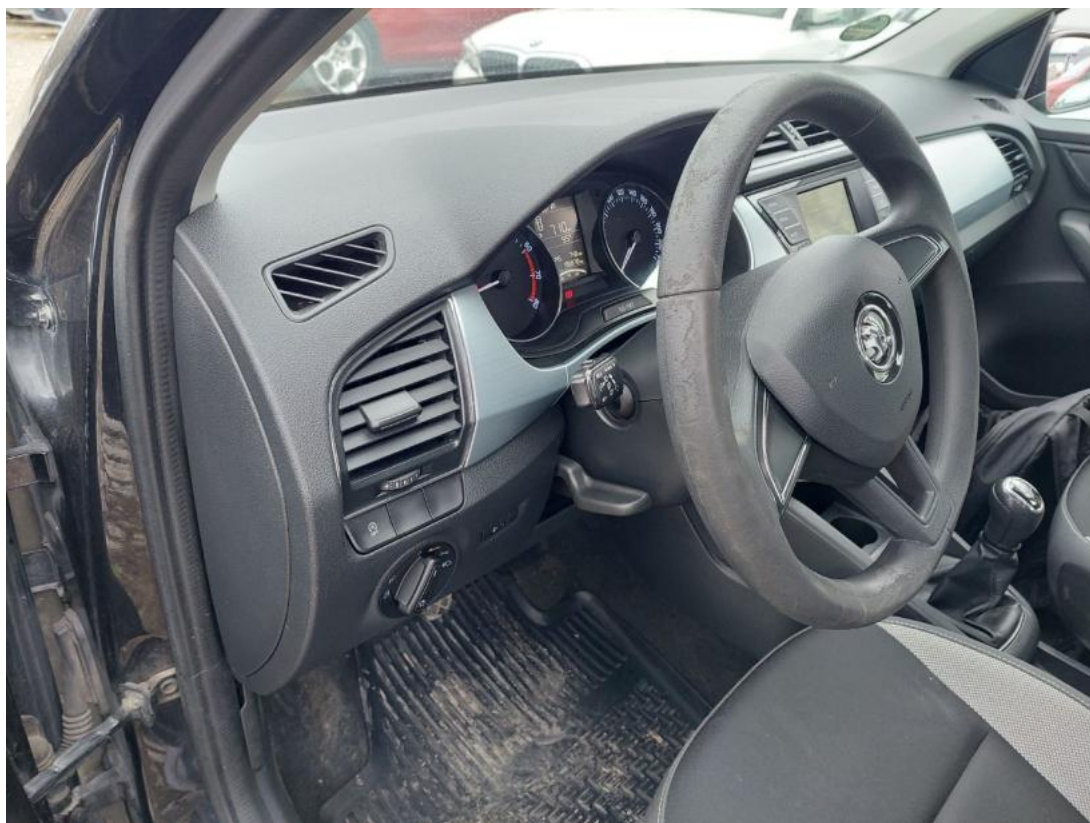
Fot. 23 Kierownica z lewej strony