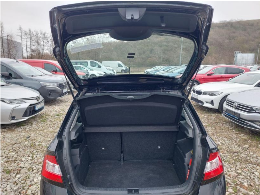
Fot. 25 Bagażnik