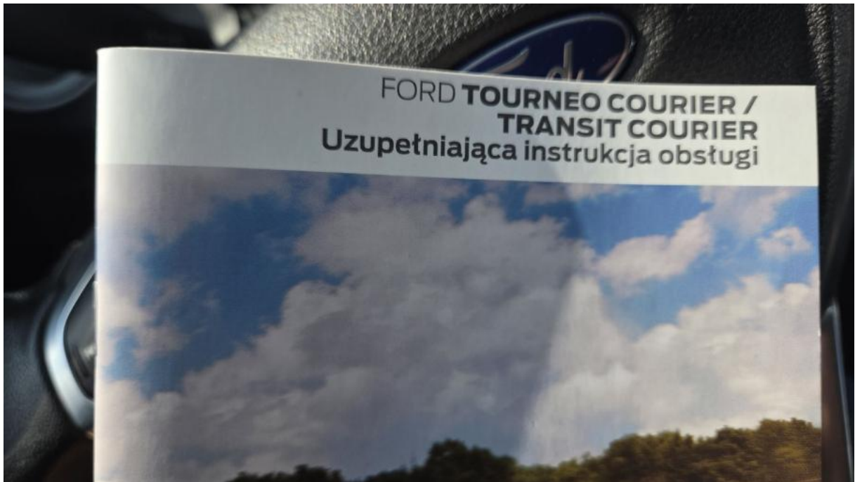
Fot. 31 Instrukcje