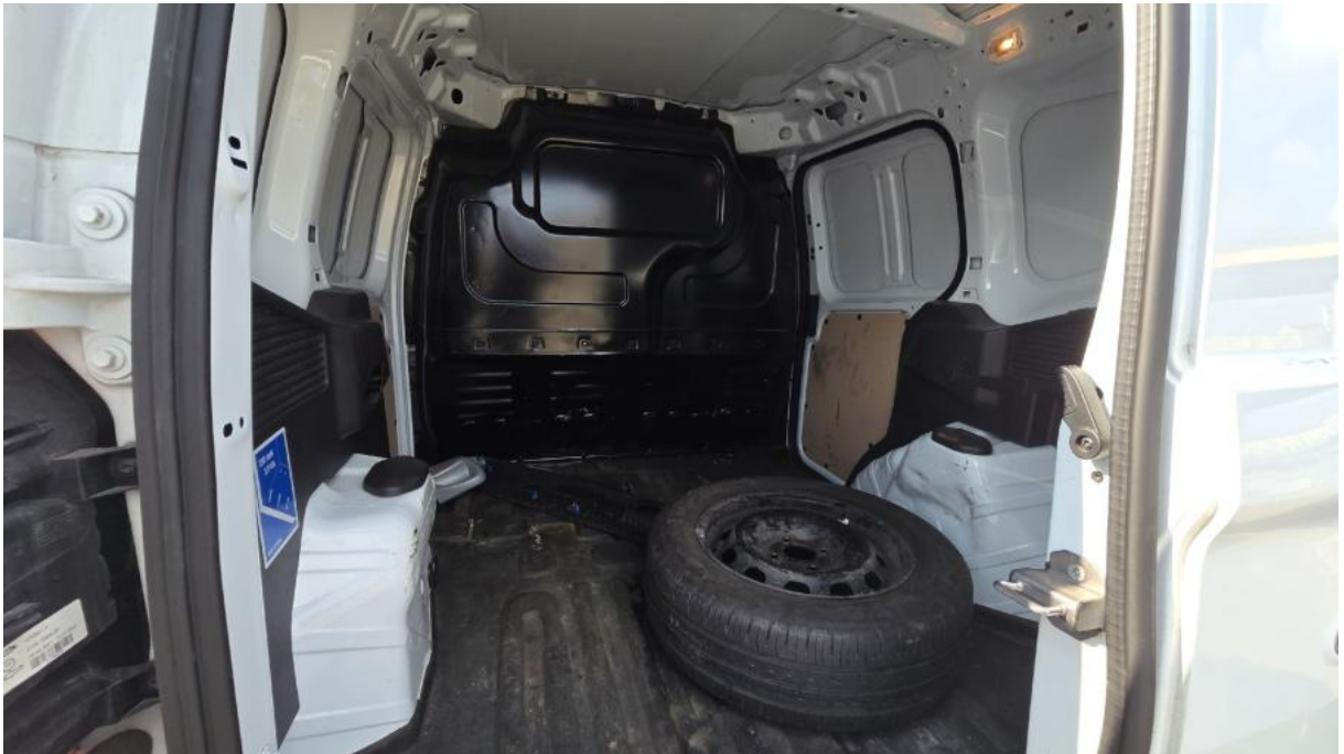
Fot. 23 Bagażnik