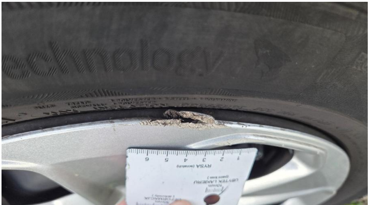
Fot. 32 Kołpak przedni P - Pęknięcie/rozerwanie 1