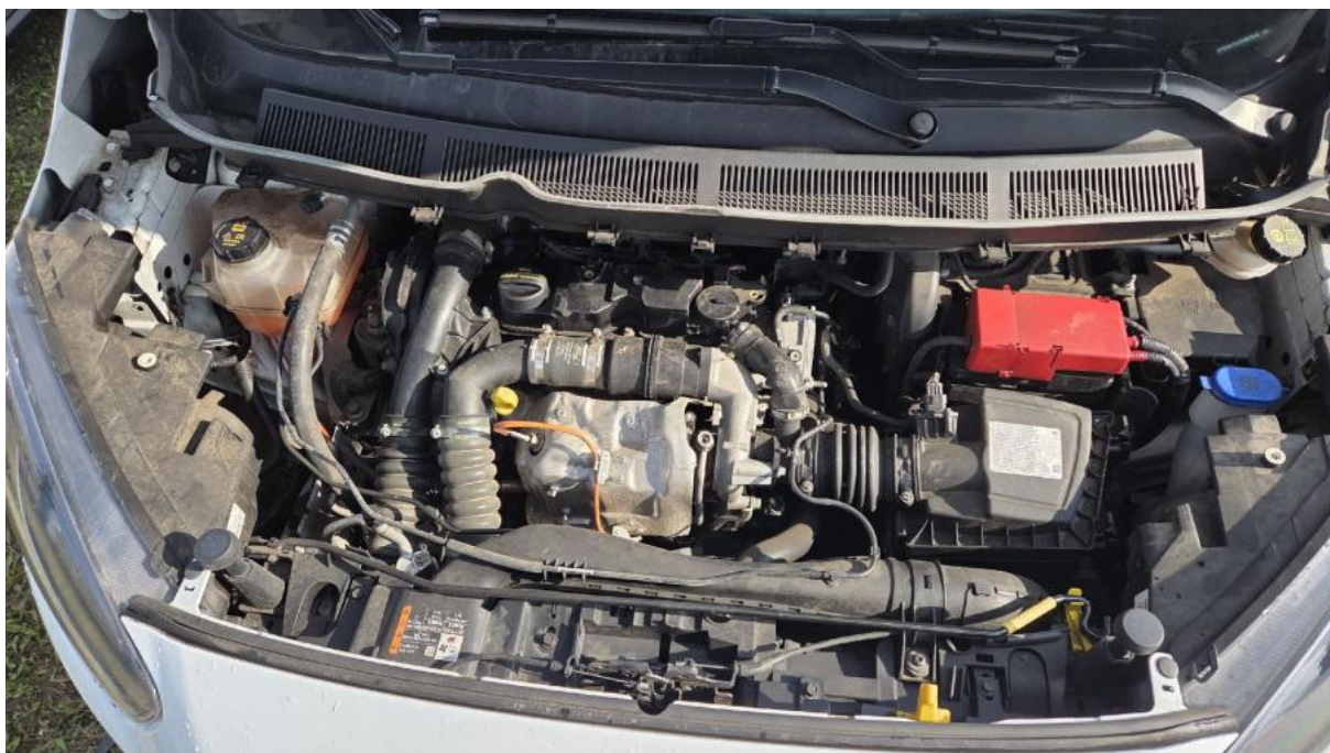
Fot. 22 Komora silnika