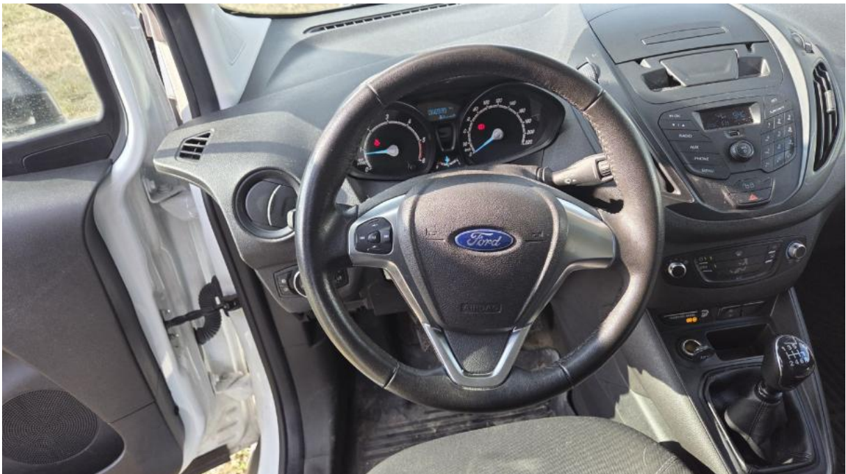
Fot. 20 Kierownica (na wprost)