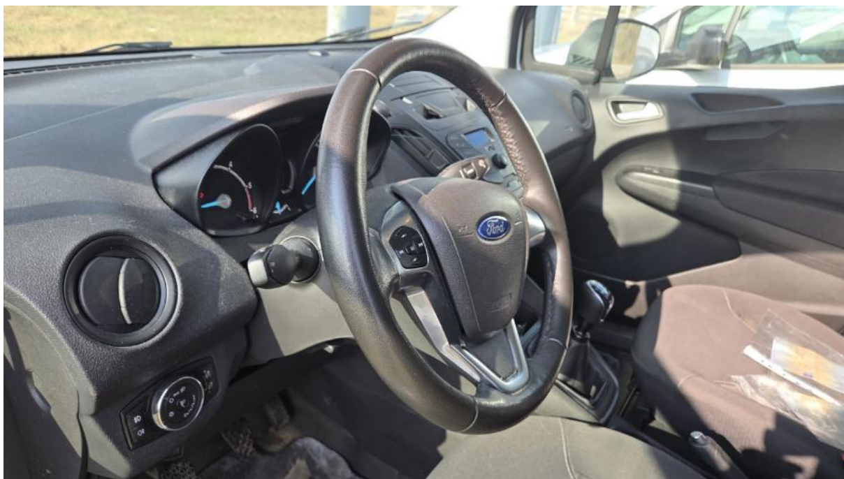
Fot. 21 Kierownica z lewej strony