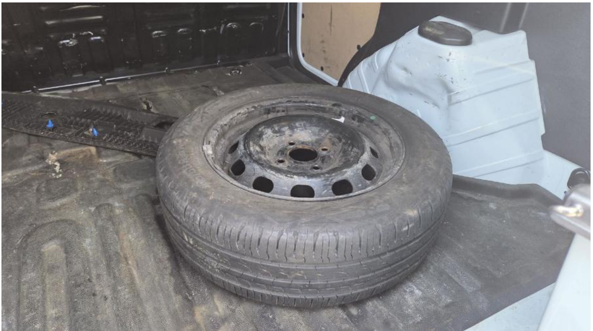
Fot. 24 Koło zapasowe