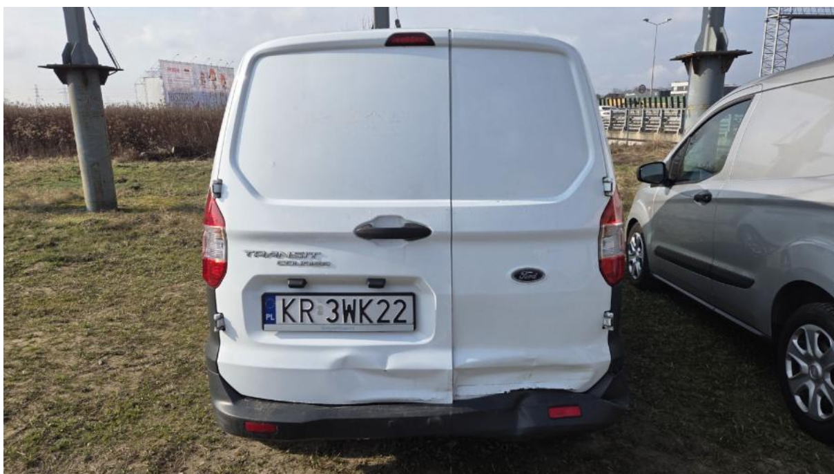
Fot. 8 Tyt