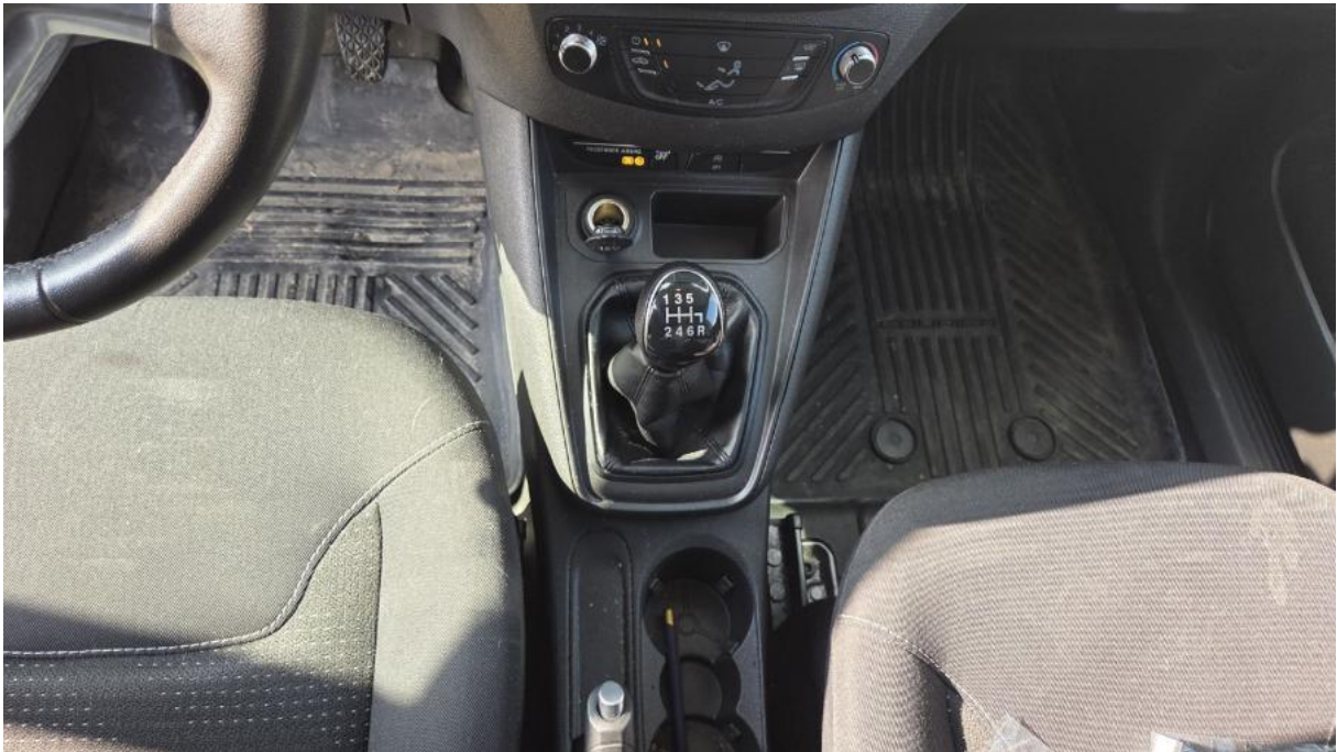
Fot. 19 Tunel środkowy