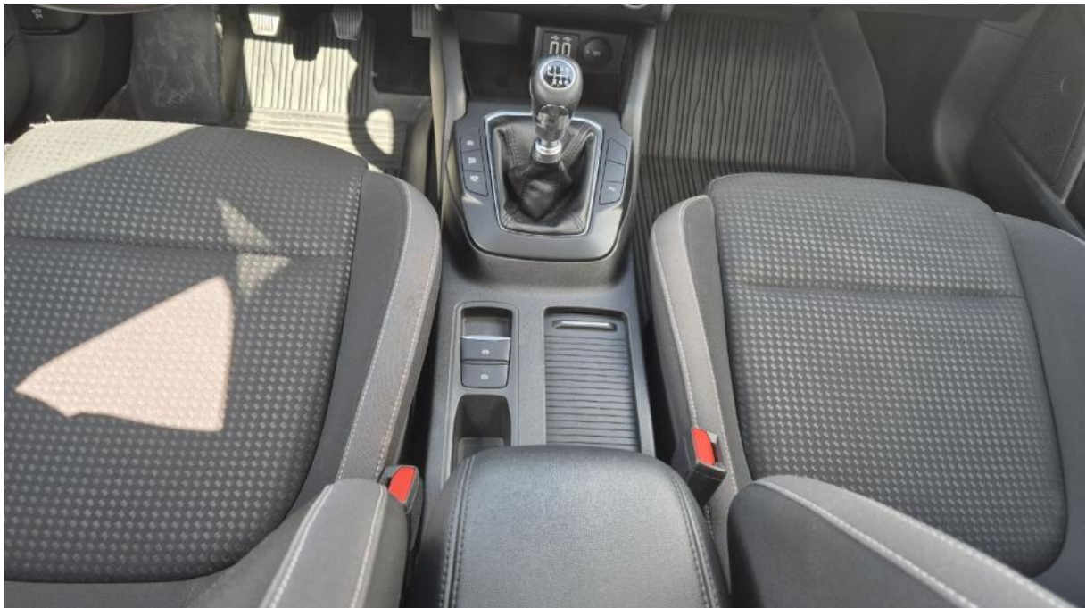
Fot. 20 Tuneł środkowy