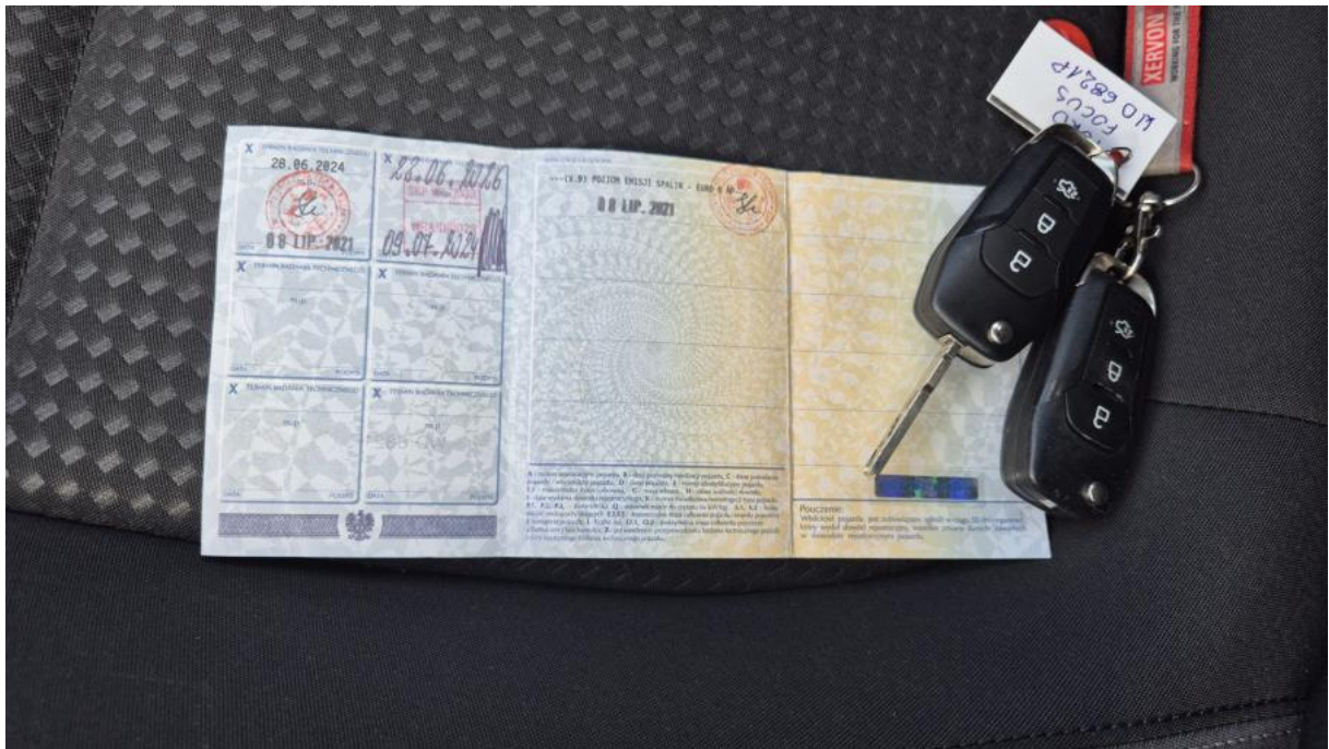
Fot. 33 Dow. Rej. Str.2 i klucze