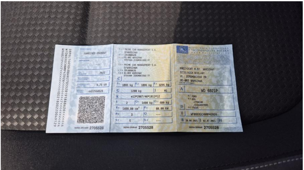
Fot. 32 Dowód rej. Str. 1