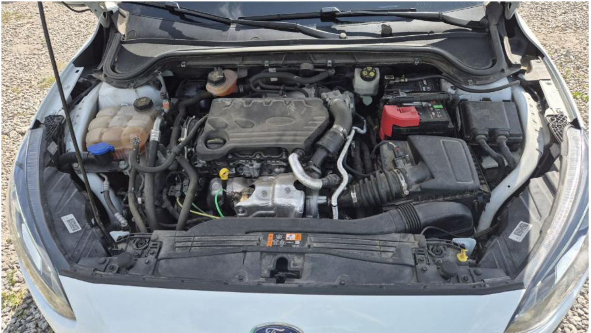
Fot. 23 Komora silnika