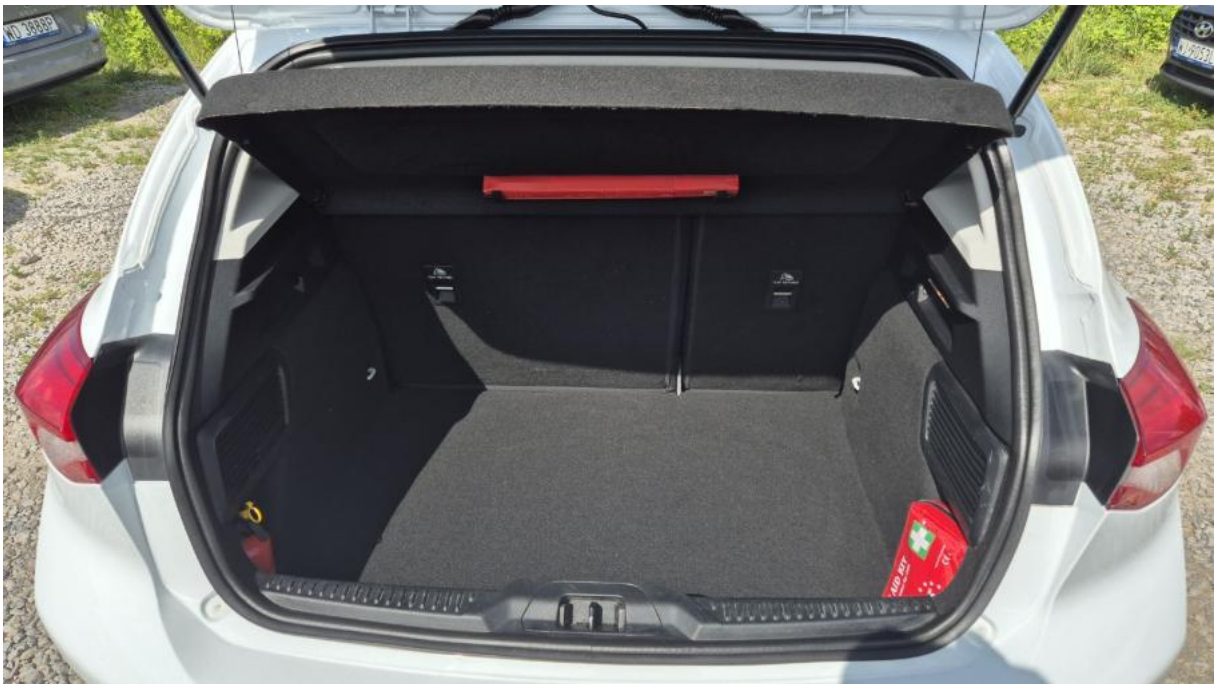
Fot. 24 Bagażnik