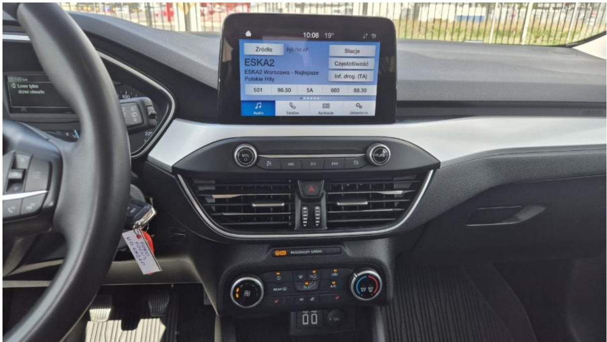
Fot. 19 Konsola środkowa