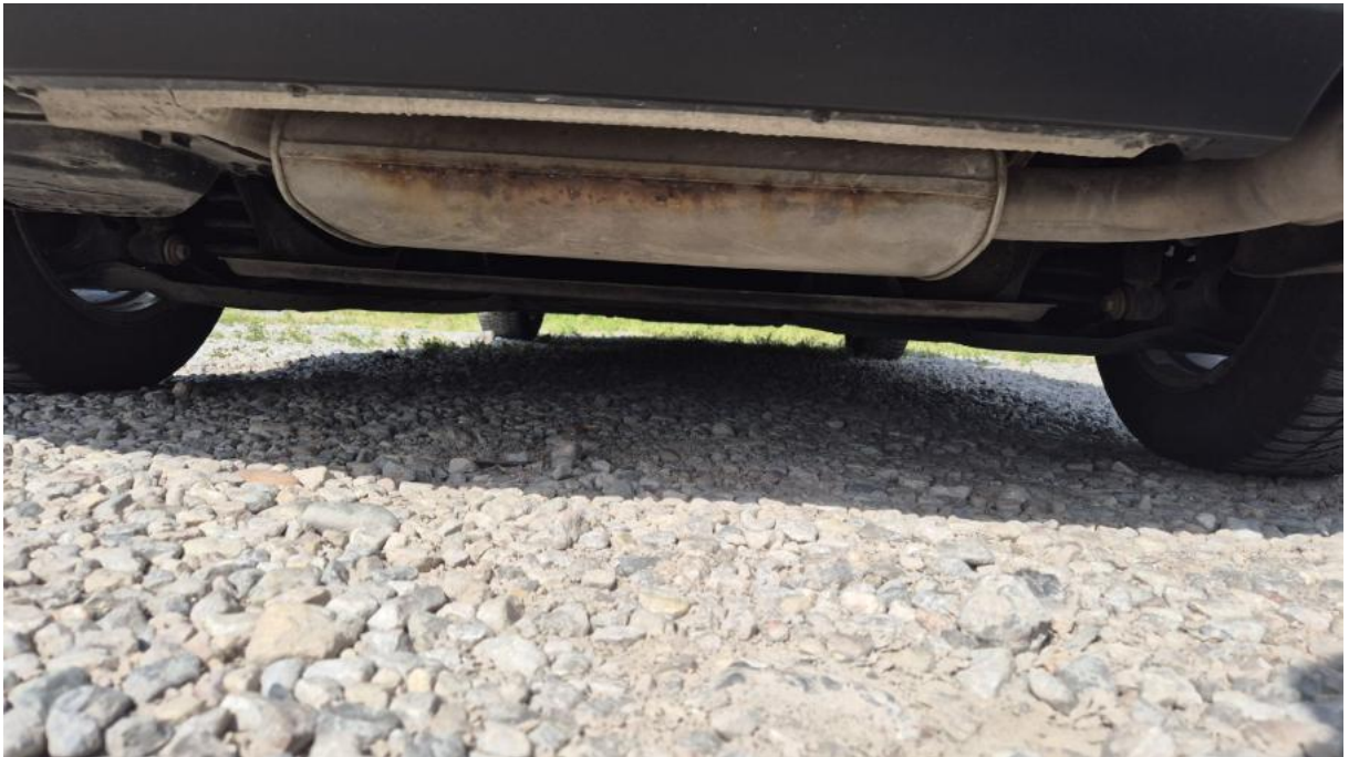
Fot. 27 Spód pojazdu tył