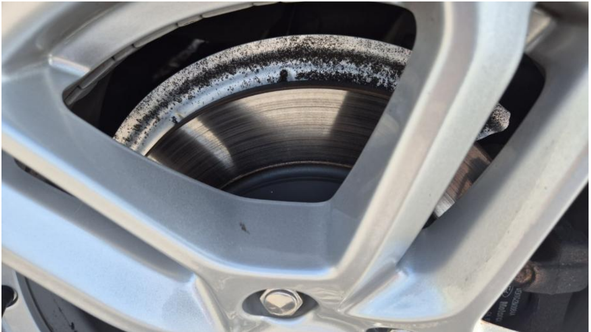
Fot. 31 Tarcza hamulcowa tylna lewa