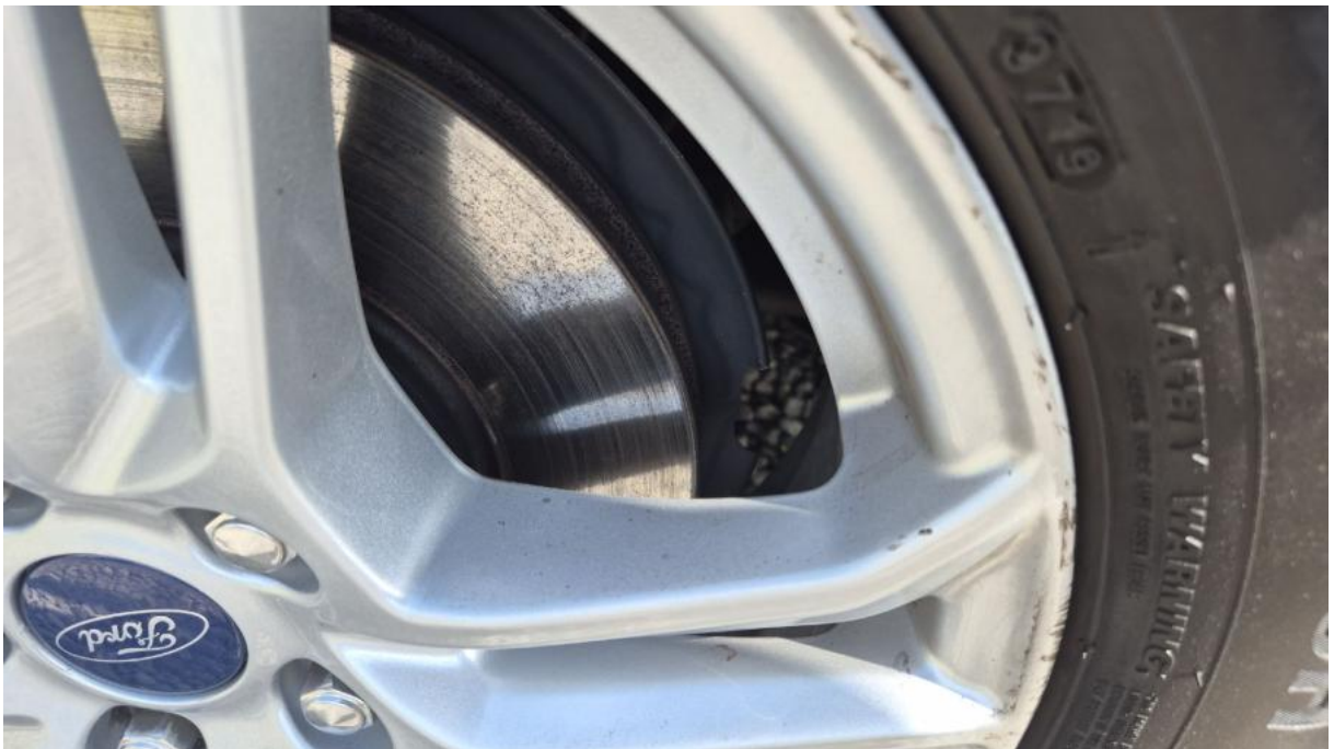
Fot. 28 Tarcza hamulcowa przednia lewa