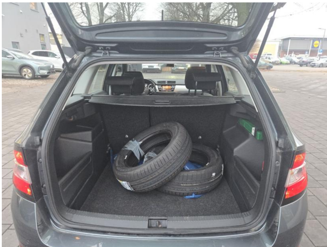
Fot. 25 Bagażnik