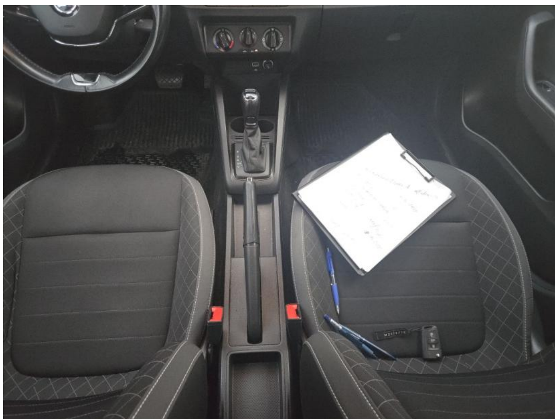
Fot. 21 Tunel środkowy