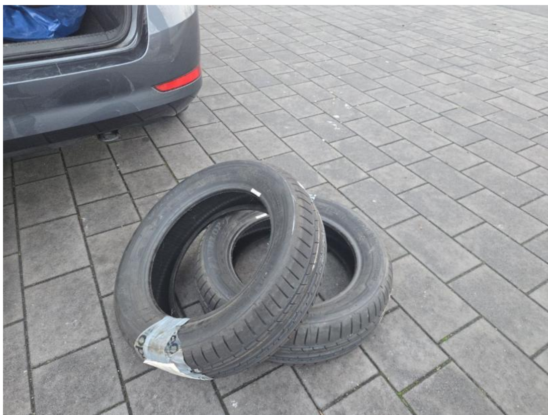
Fot. 36 2 szt opony letnie