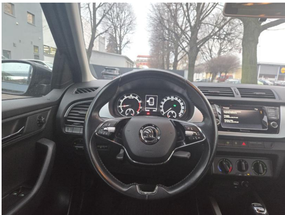
Fot. 22 Kierownica (na wprost)