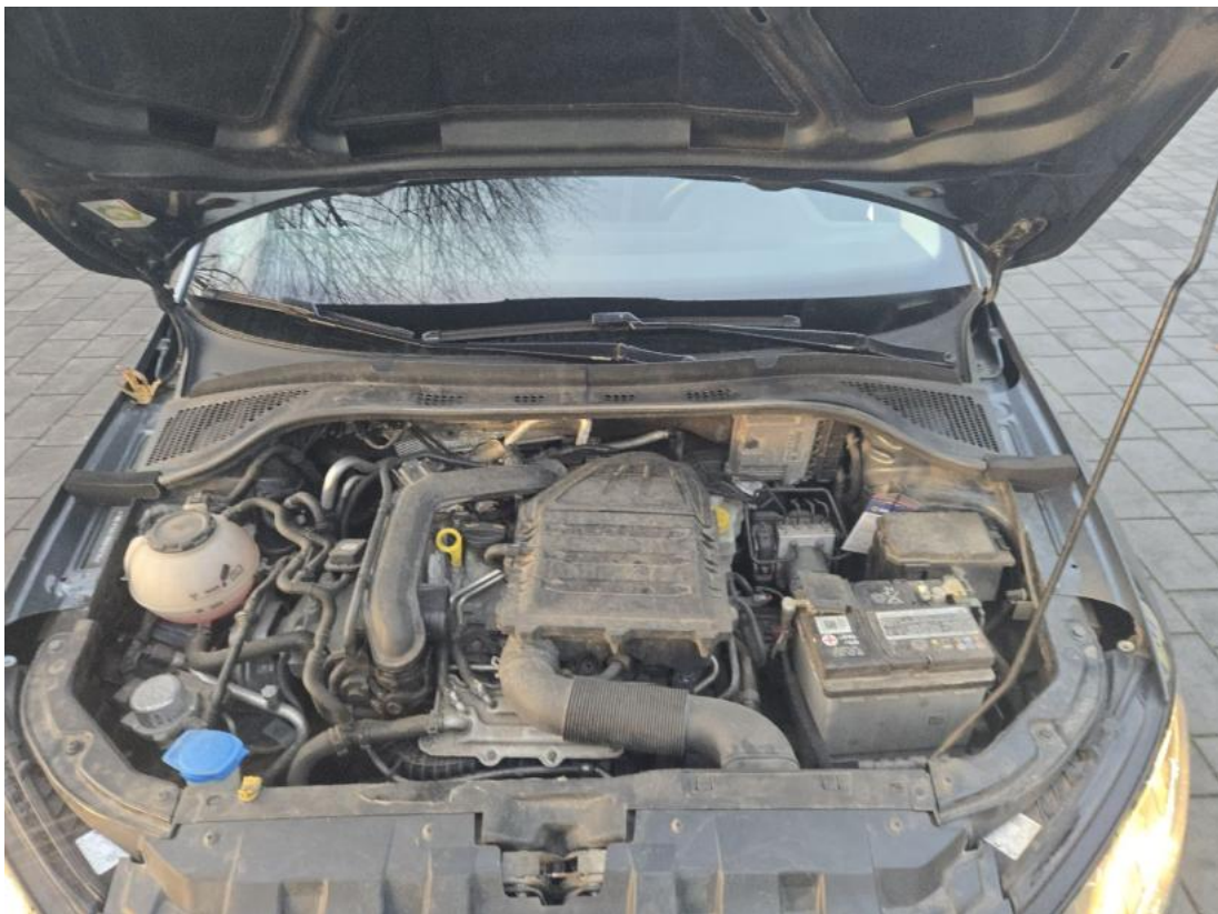
Fot. 24 Komora silnika