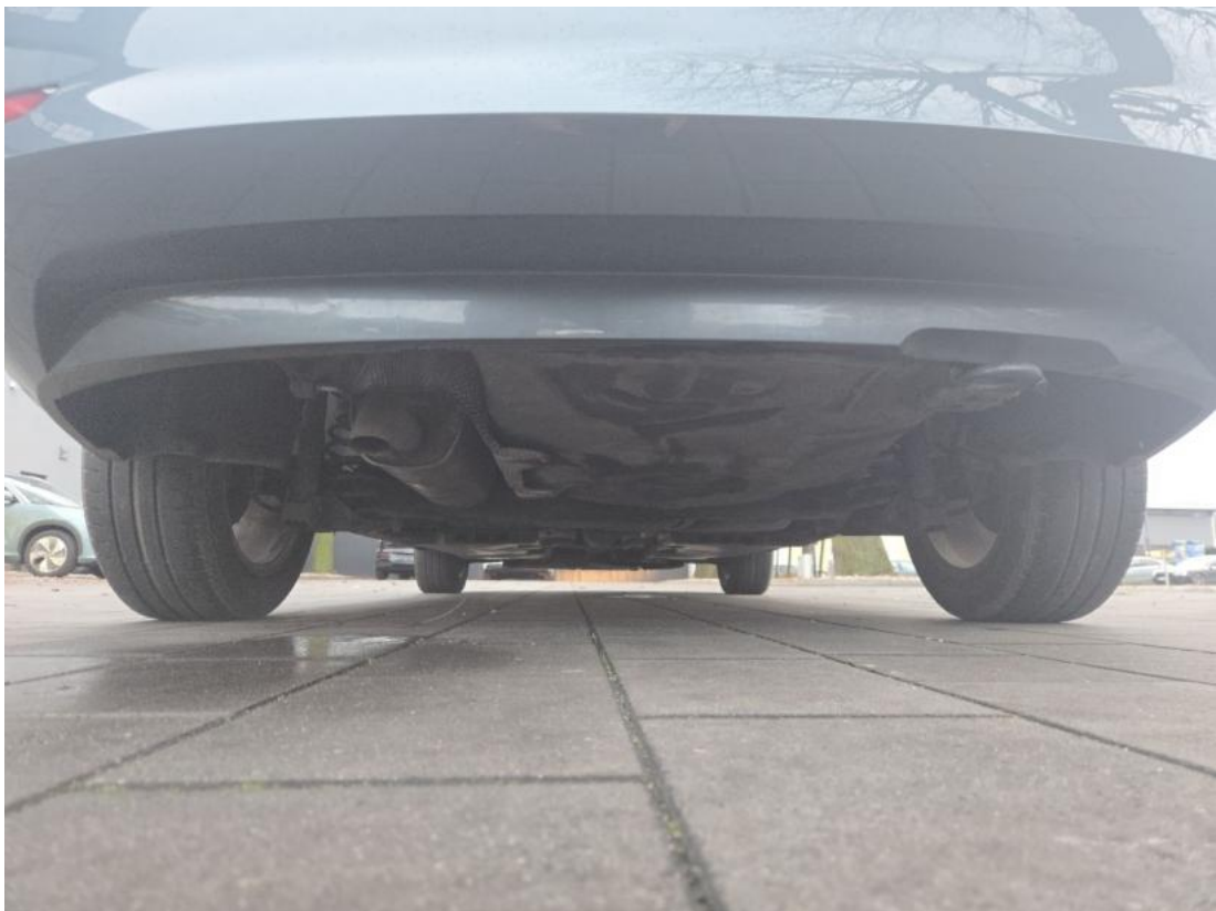
Fot. 28 Spód pojazdu tył