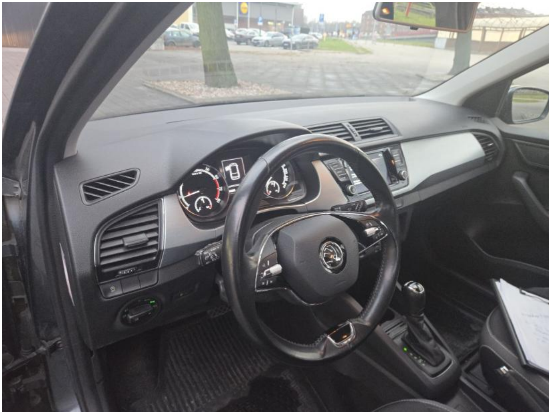
Fot. 23 Kierownica z lewej strony