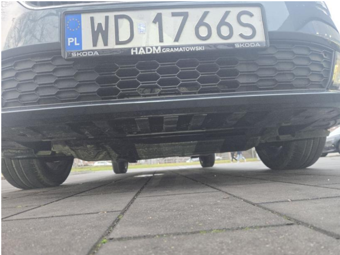
Fot. 27 Spód pojazdu przód