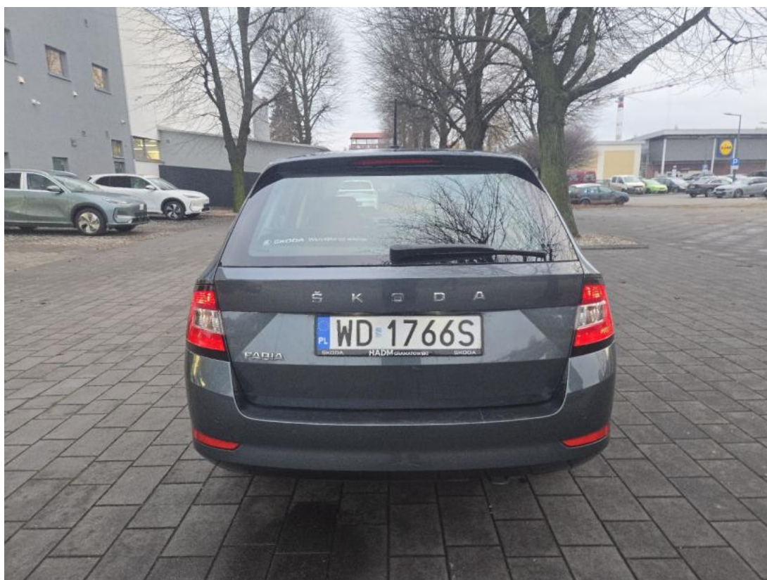
Fot. 8 Tyt