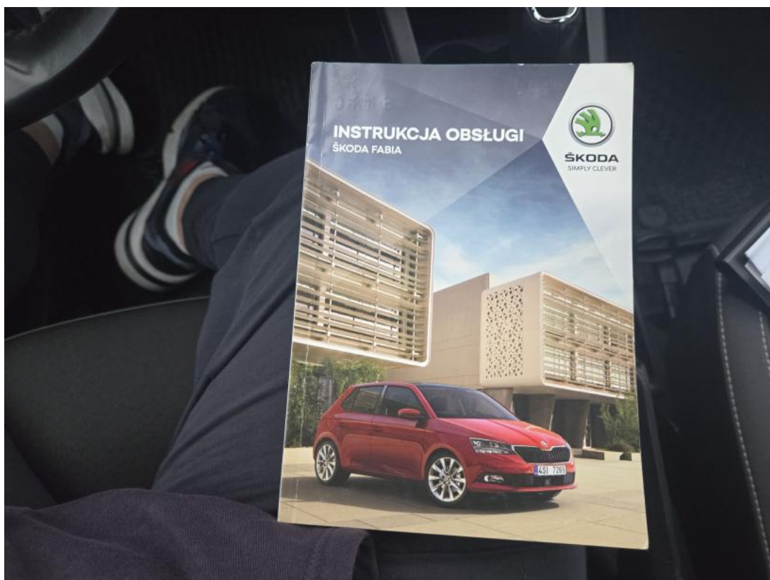
Fot. 35 Instrukcje