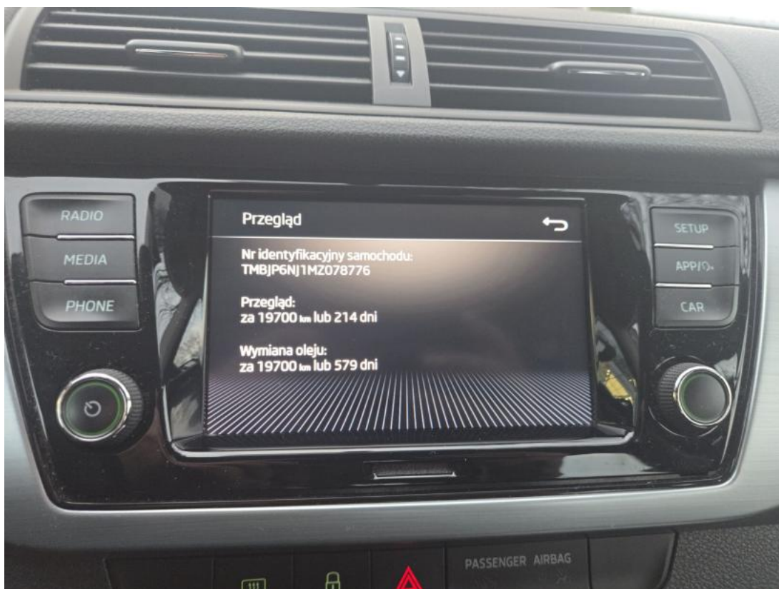
Fot. 34 Książka serwisowa – ostatni przegląd