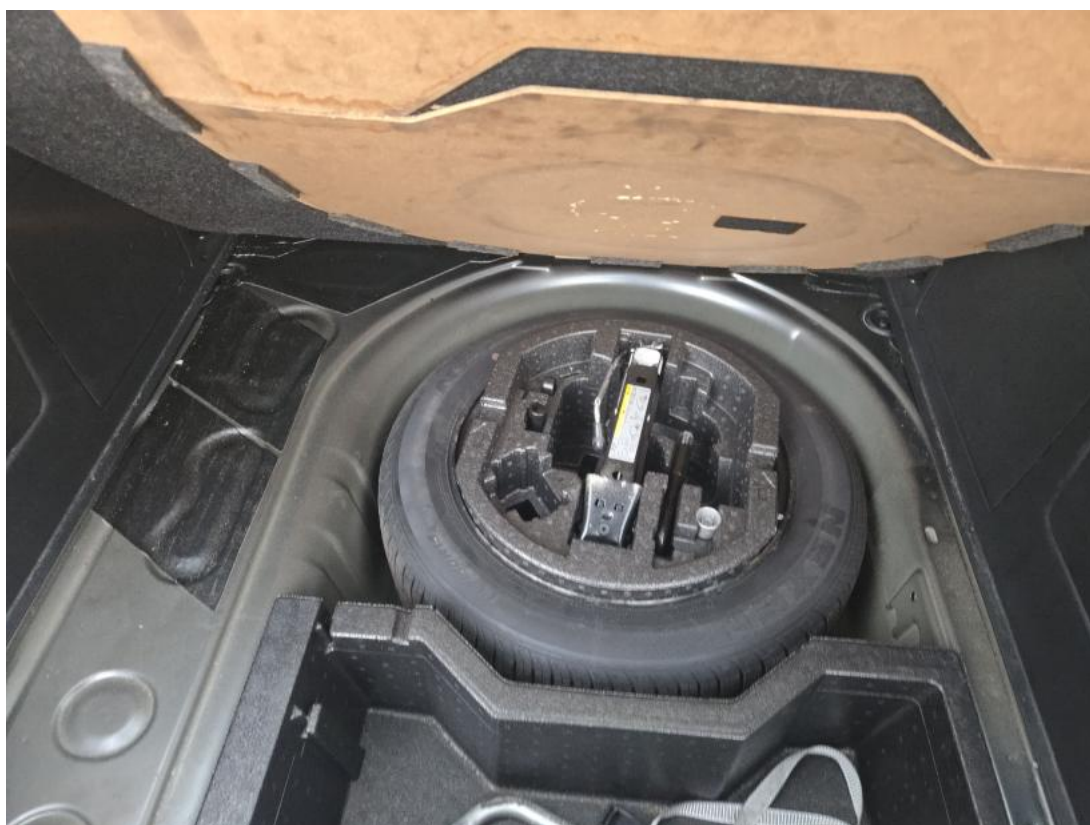
Fot. 26 Koło zapasowe