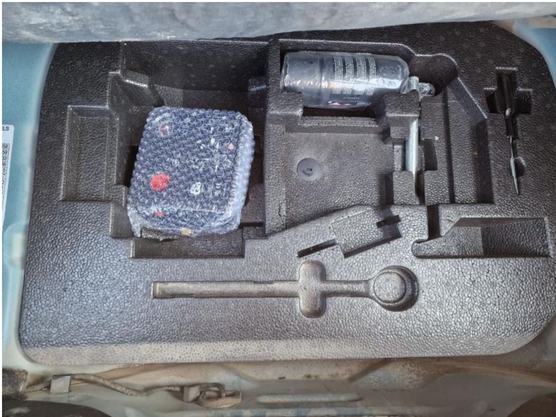
Fot. 35 Zestaw naprawczy koła