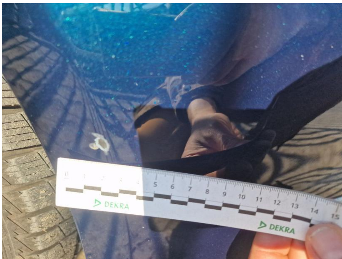
Fot. 39 Zderzak - Rysa/odprysk 1