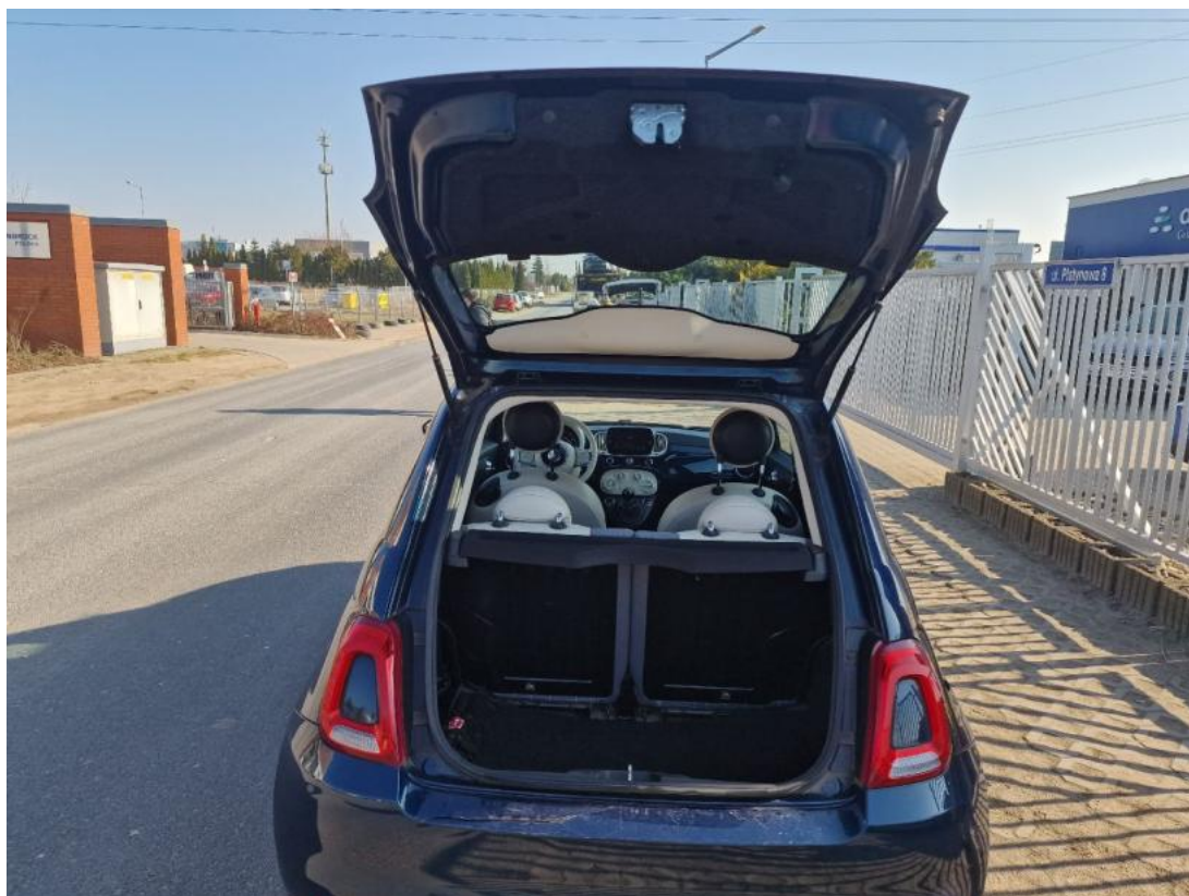
Fot. 25 Bagażnik