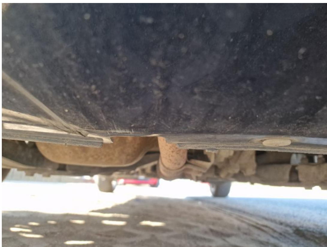
Fot. 26 Spód pojazdu przód