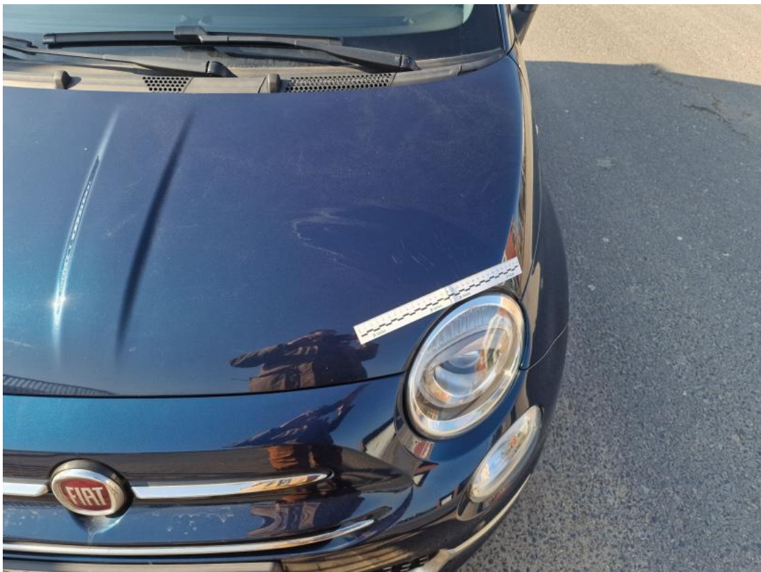
Fot. 36 Pokrywa komory silnika - zdjęcie poglądowe 1