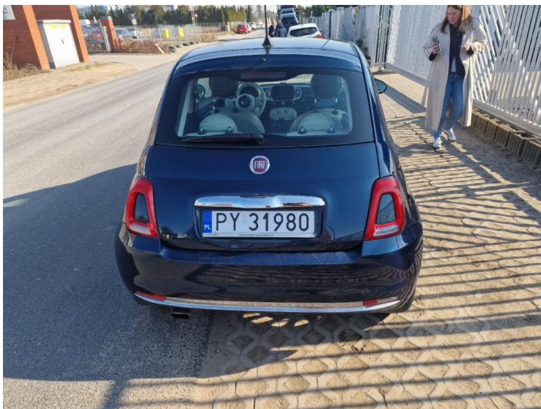
Fot. 8 Tyt