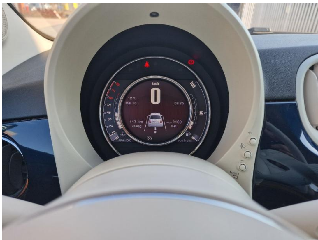
Fot. 16 Zestaw wskaźników - serwis