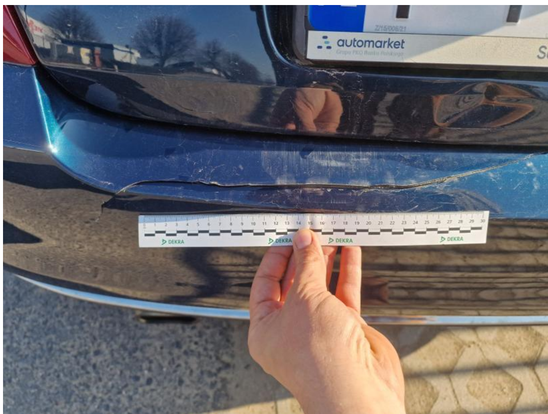
Fot. 54 Zderzak tylny - zdjęcie pogładowe 1