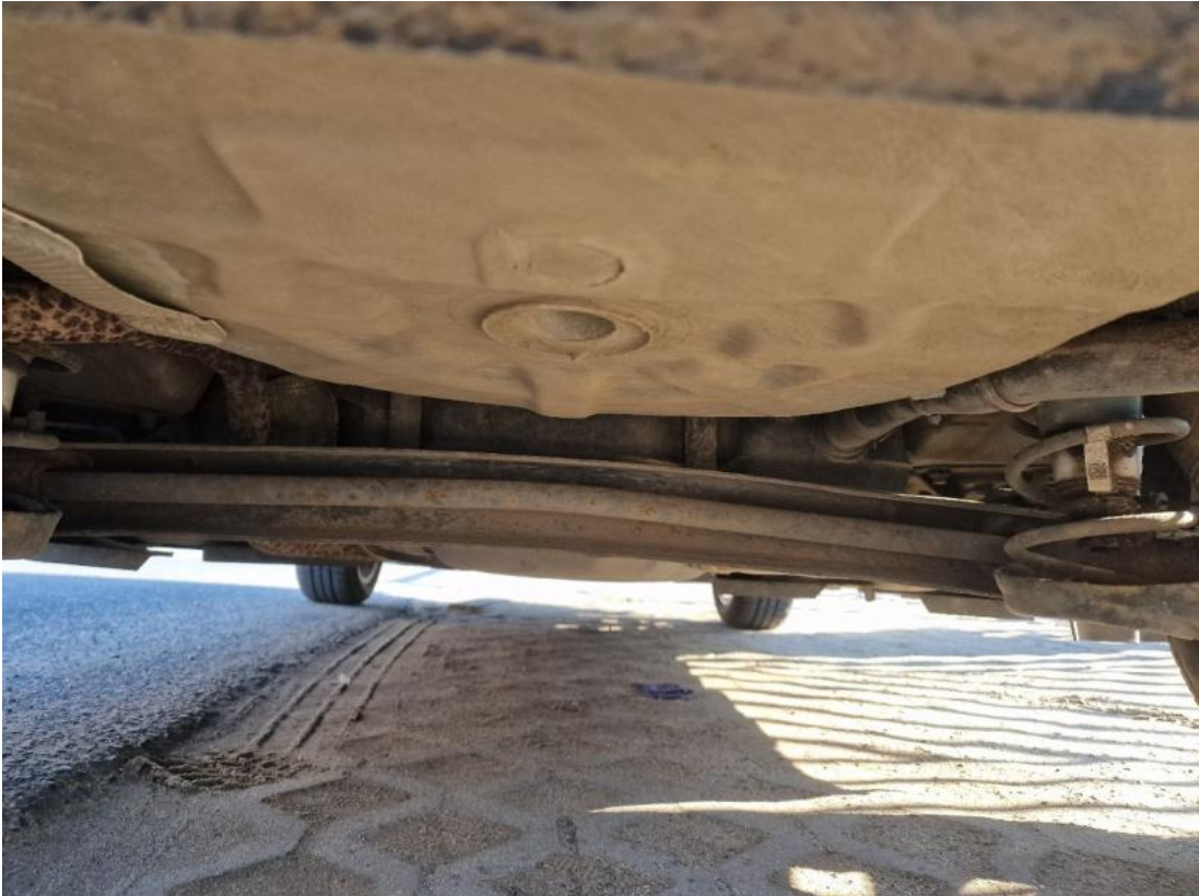
Fot. 27 Spód pojazdu tył