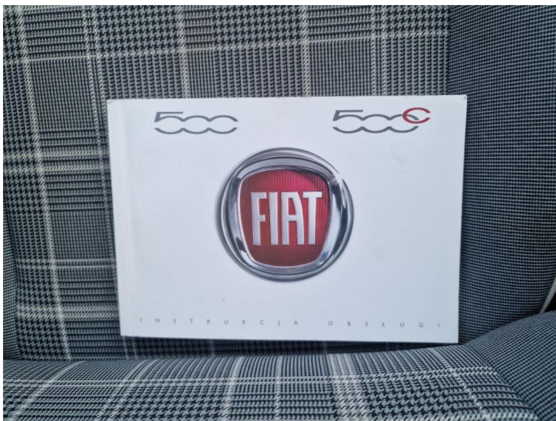
Fot. 34 Instrukcje