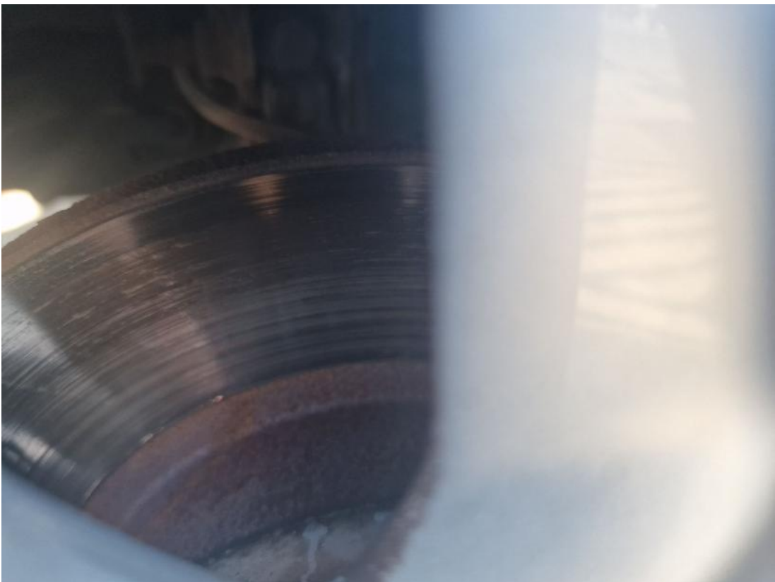
Fot. 28 Tarcza hamulcowa przednia lewa