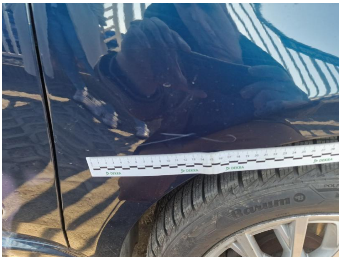
Fot. 40 Błotnik przedni P - zdjęcie pogładowe 1