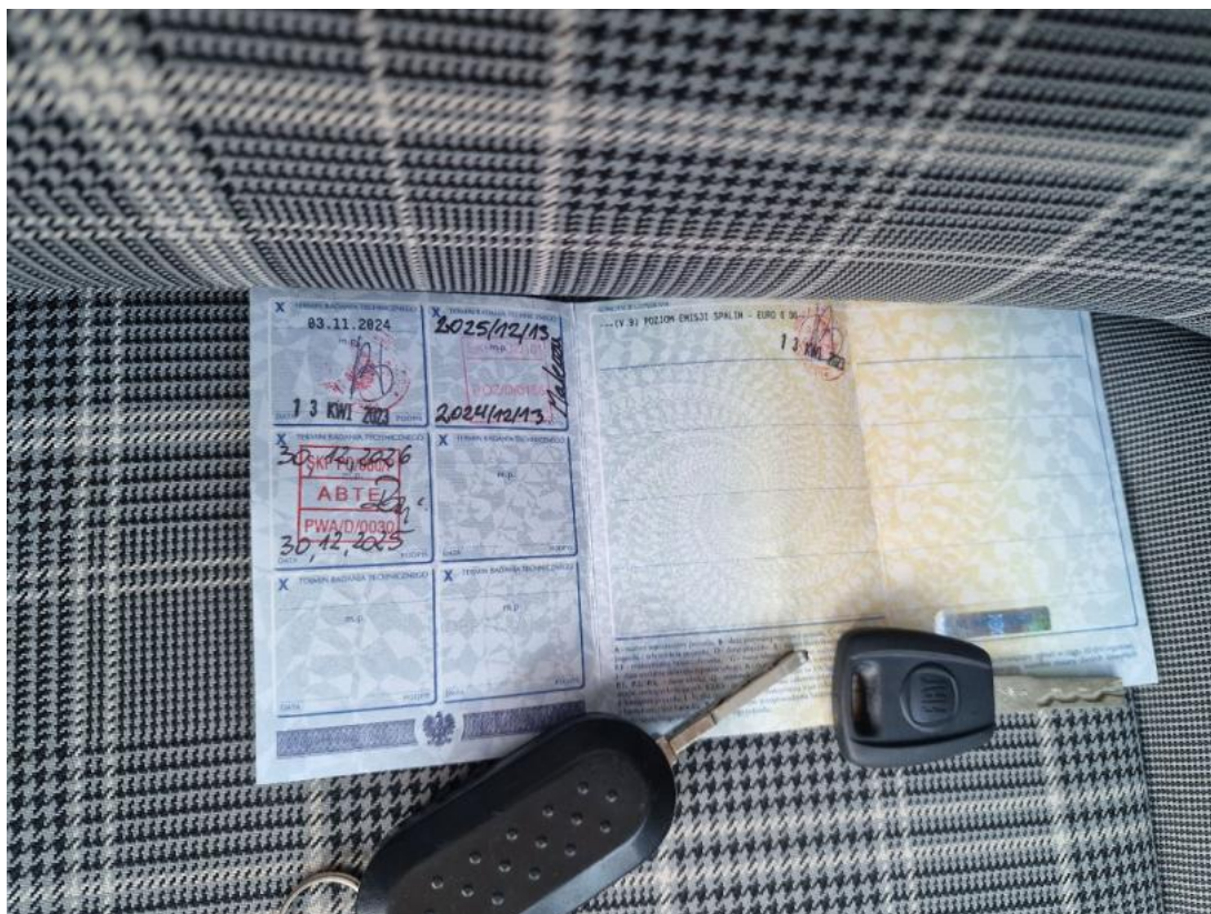
Fot. 33 Dow. Rej. Str.2 i klucze