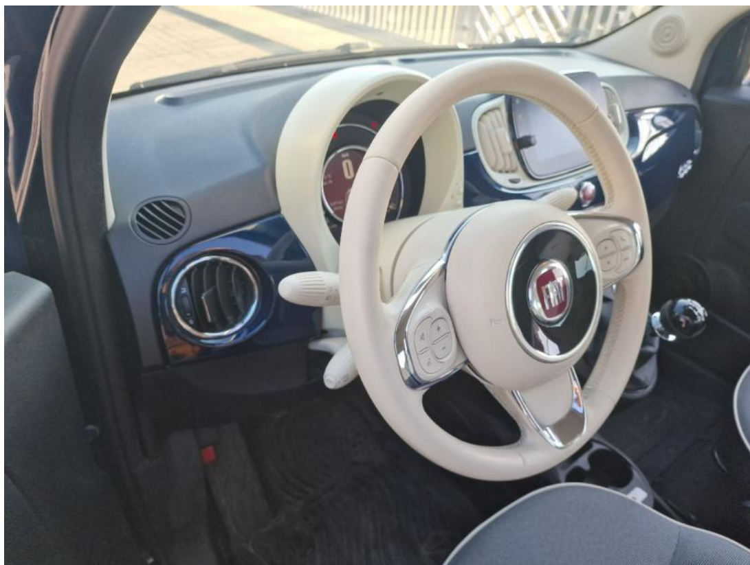
Fot. 23 Kierownica z lewej strony