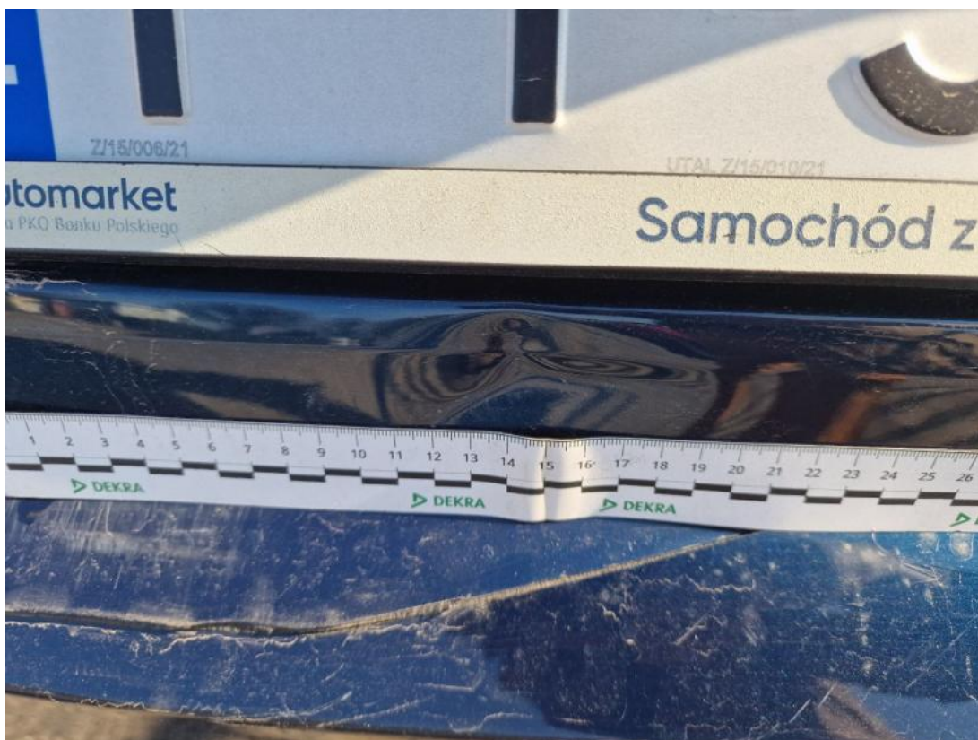
Fot. 53 Pokrywy bagażnika - Wgniecenie/odkształcenie 1