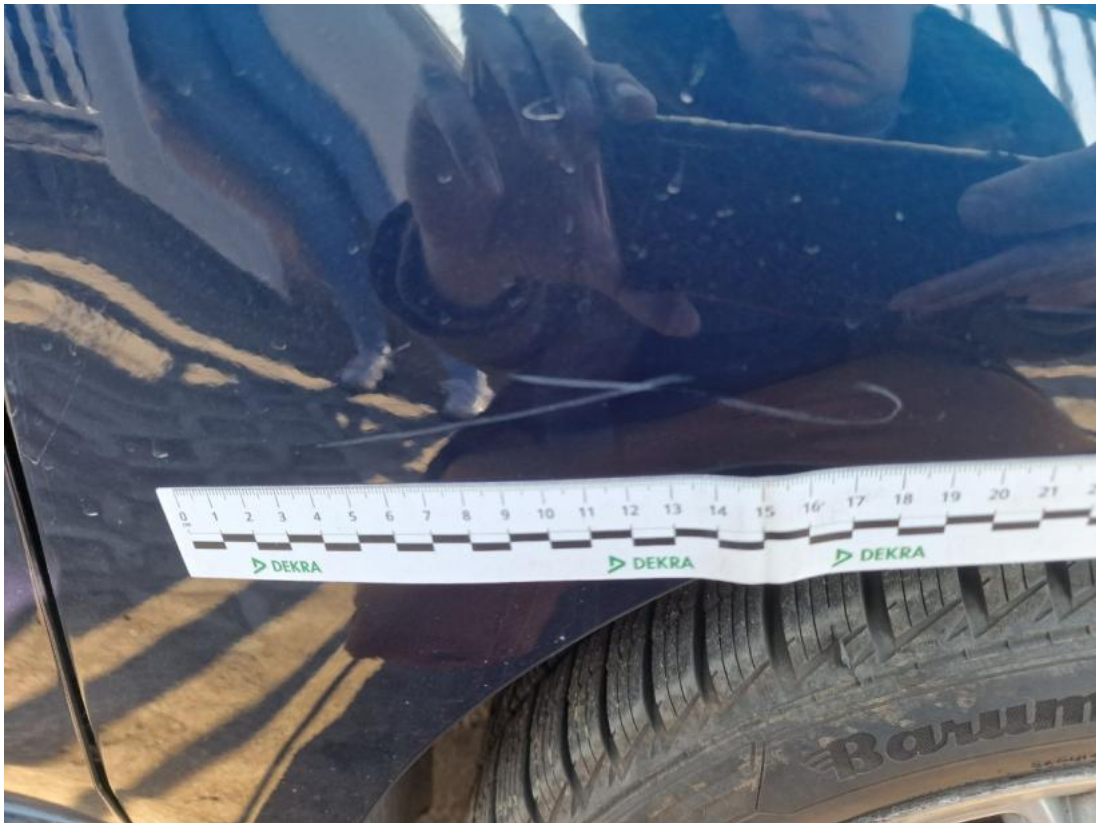
Fot. 41 Błotnik przedni P - Rysa/odprysk 1