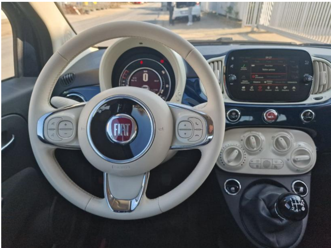
Fot. 22 Kierownica (na wprost)