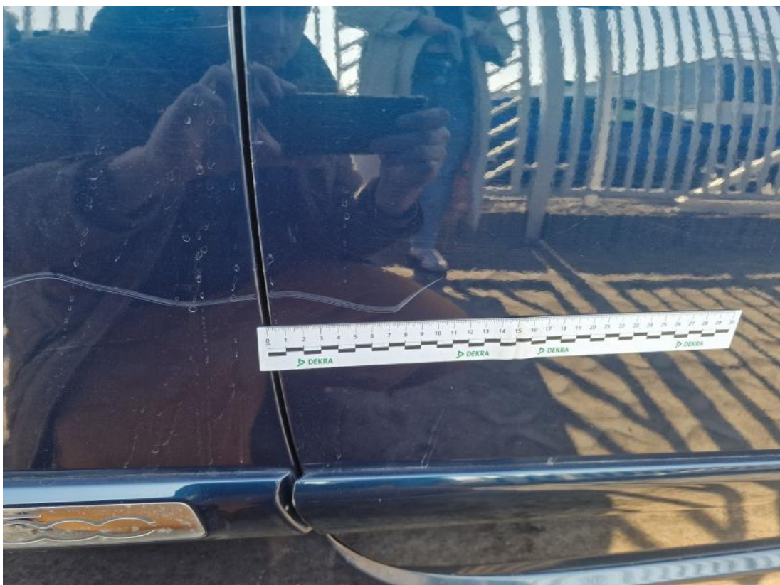
Fot. 42 Drzwi przednie P - zdjęcie pogładowe 1