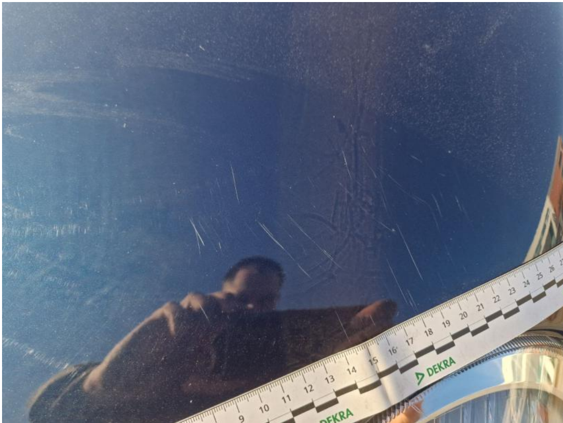
Fot. 37 Pokrywa komory silnika - Rysa/odprysk 1