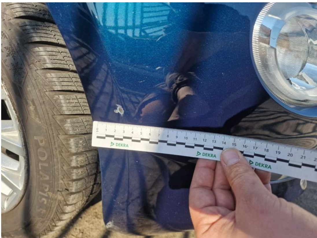
Fot. 38 Zderzak - zdjęcie poglądowe 1