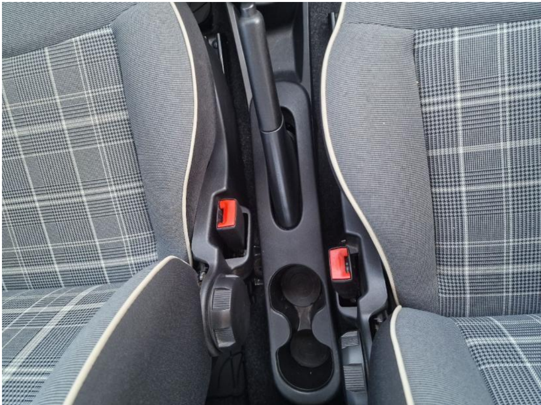
Fot. 21 Tunel środkowy