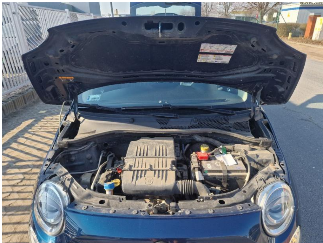
Fot. 24 Komora silnika