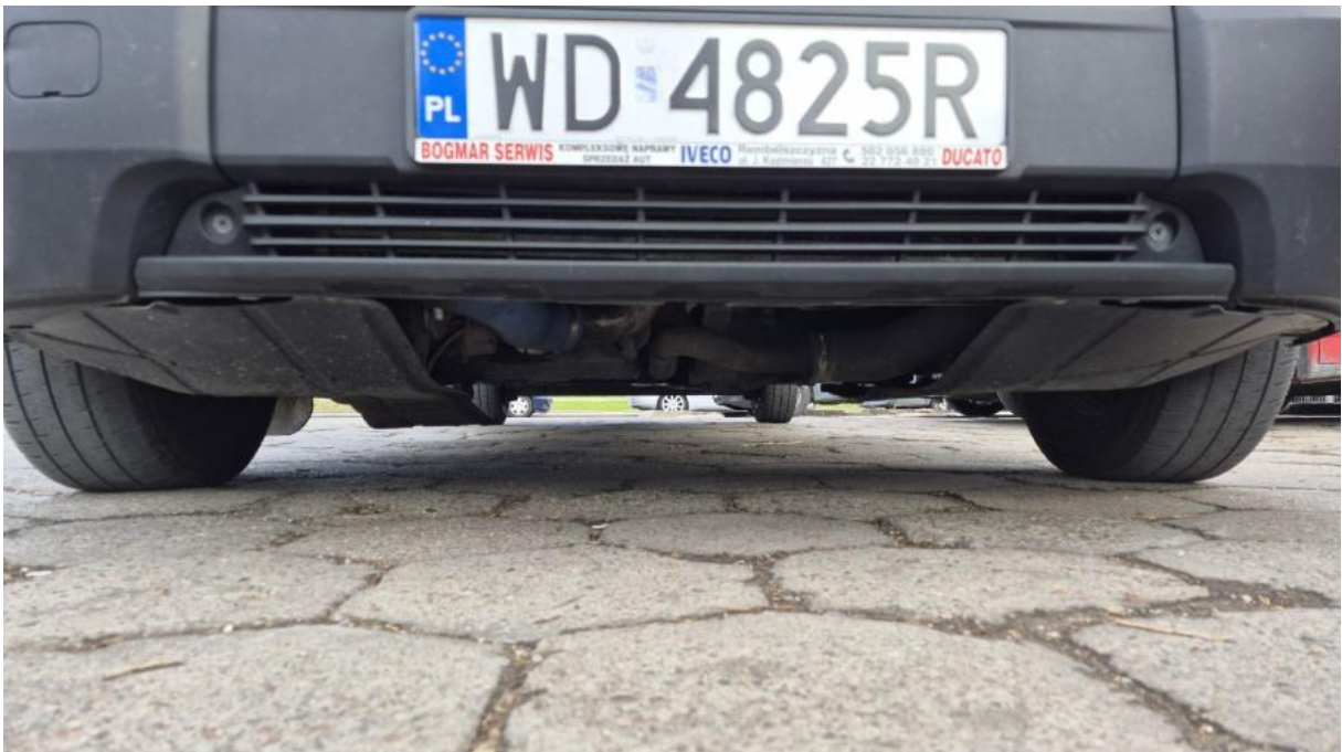
Fot. 24 Spód pojazdu przód