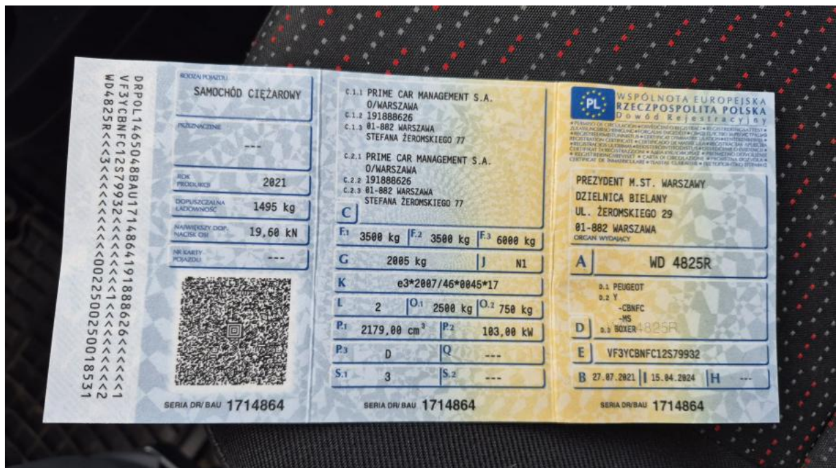
Fot. 26 Dowód rej. Str. 1