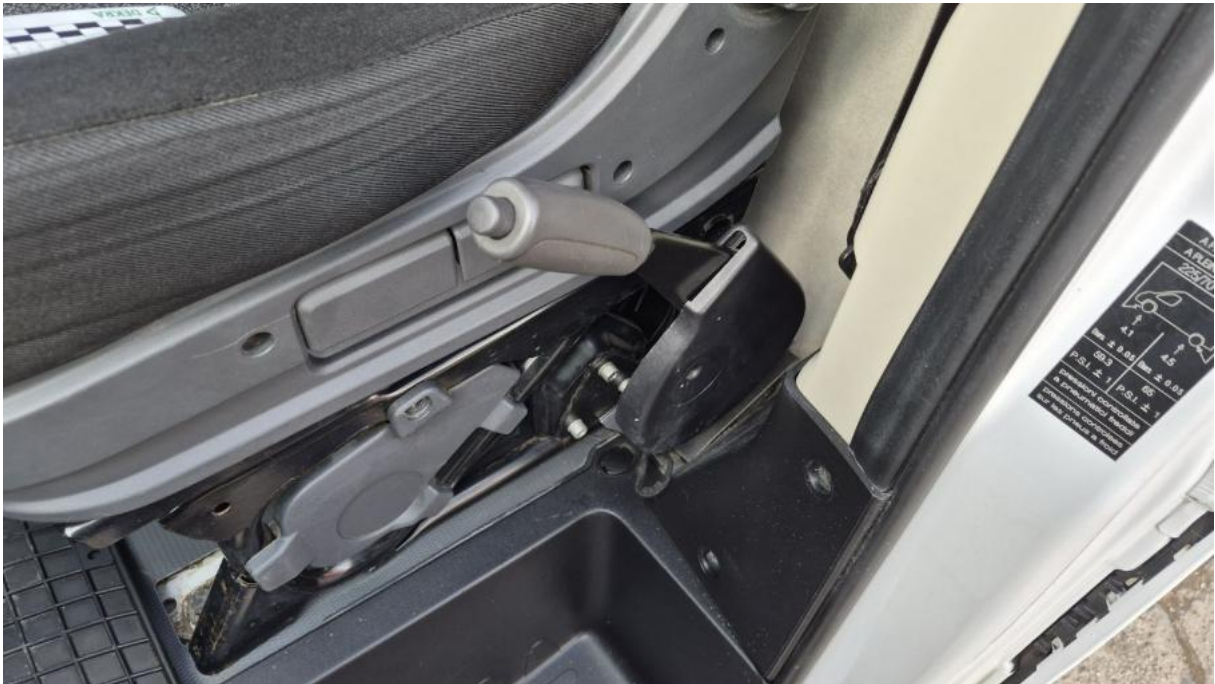
Fot. 33 hamulec ręczny nie działa