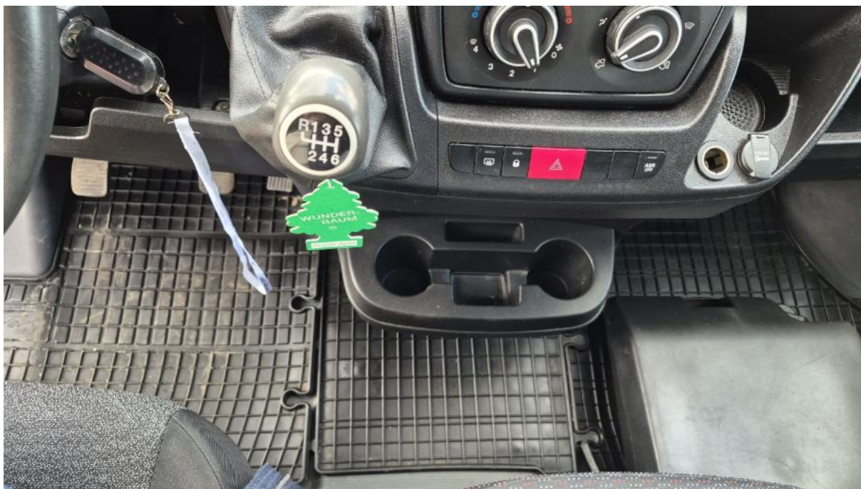
Fot. 19 Tunel środkowy