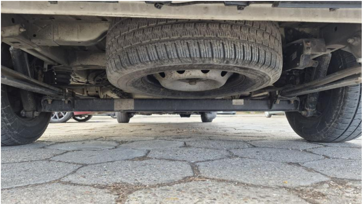
Fot. 25 Spód pojazdu tył