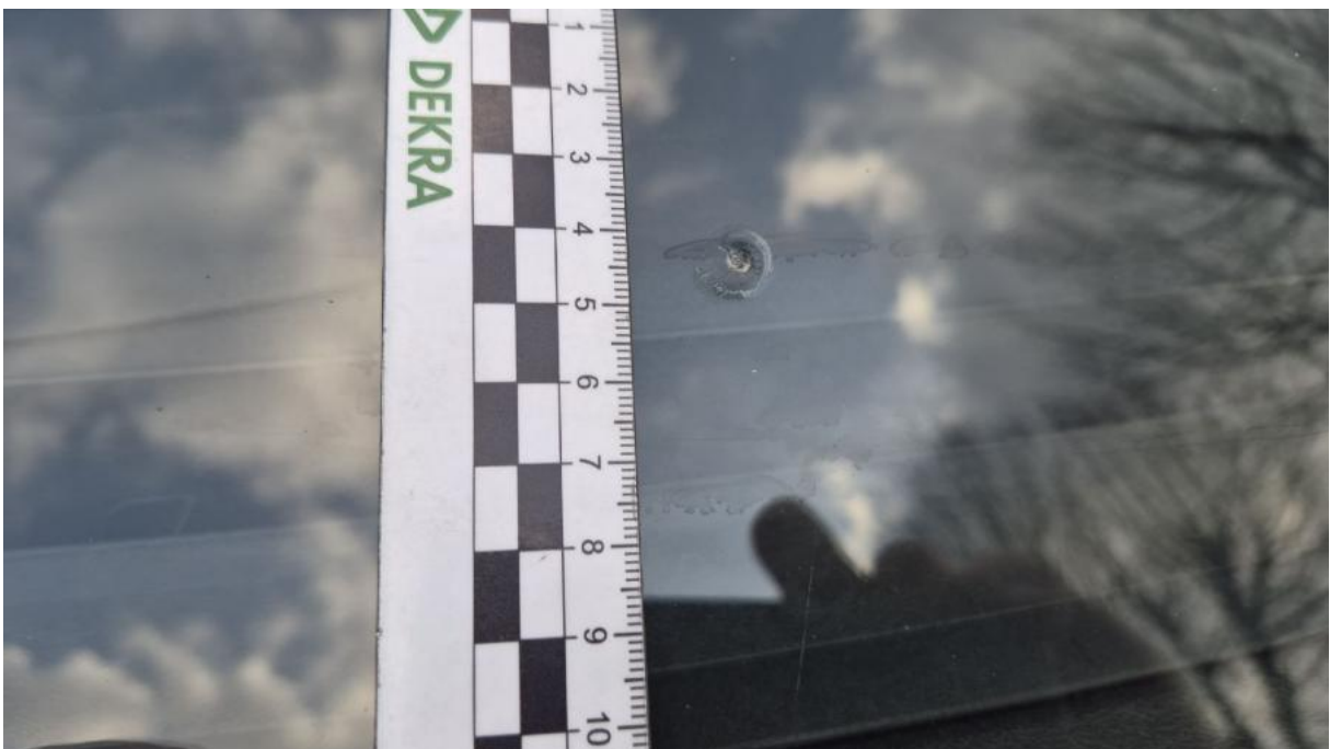
Fot. 34 Szyba czołowa - Pęknięcie/rozerwanie 1