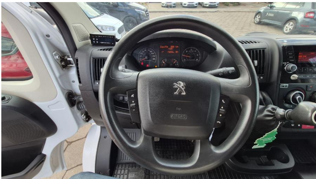
Fot. 20 Kierownica (na wprost)