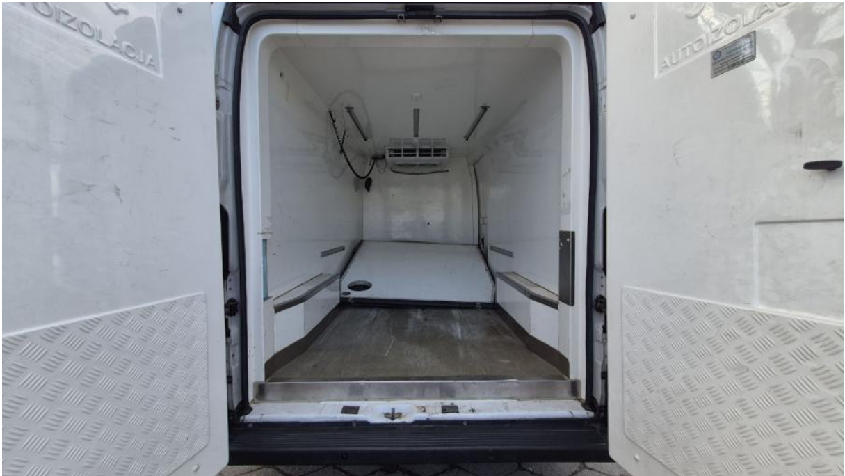
Fot. 23 Bagażnik