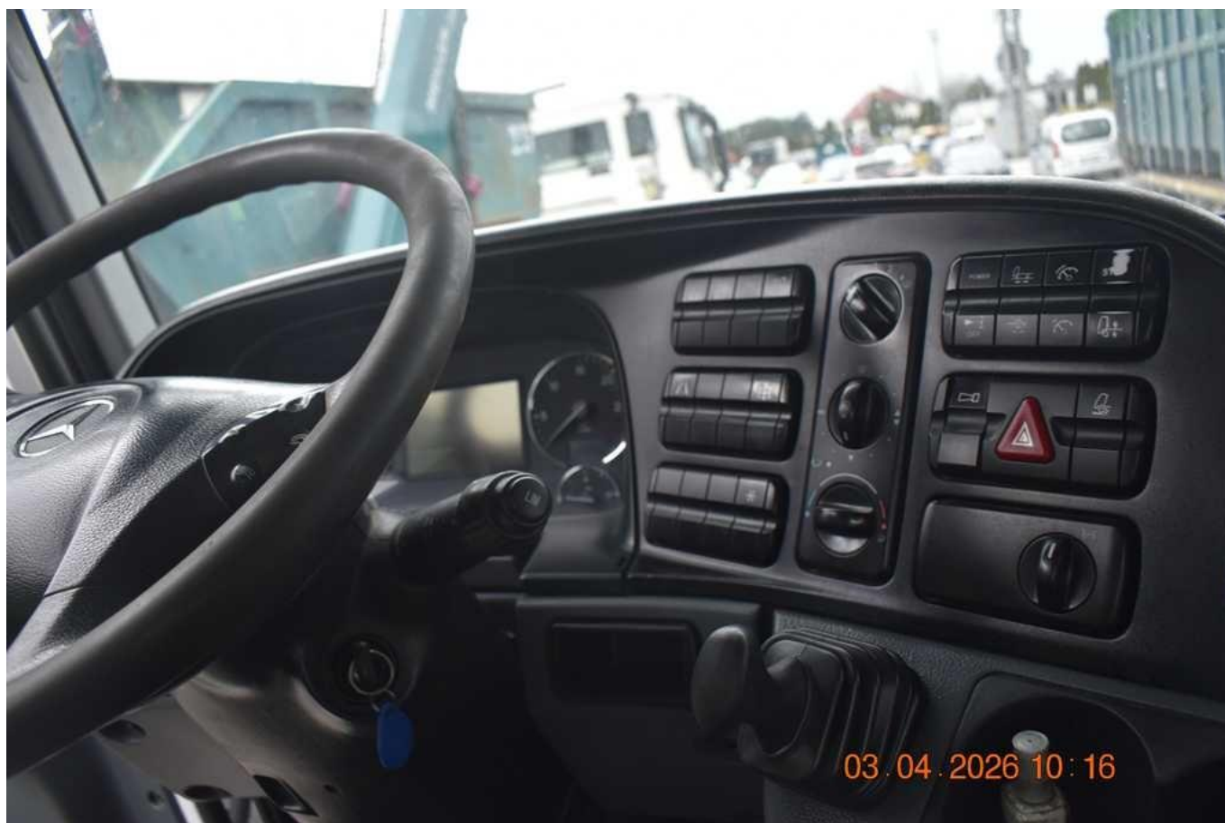
Fot. nr 76