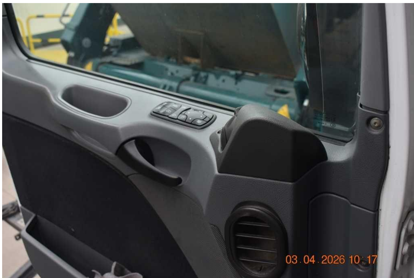
Fot. nr 80