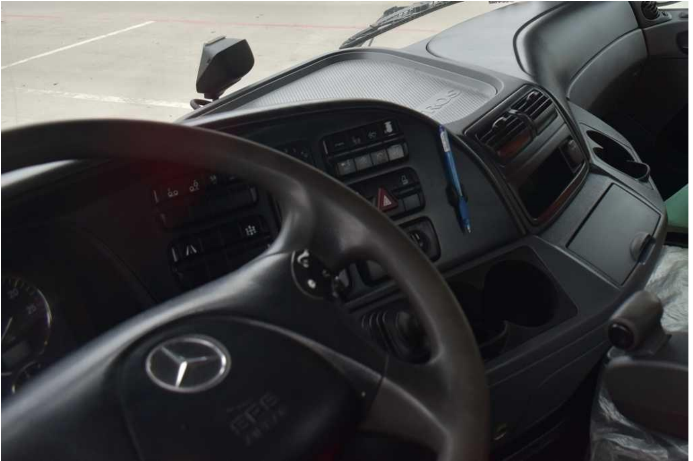
Fot. nr 81