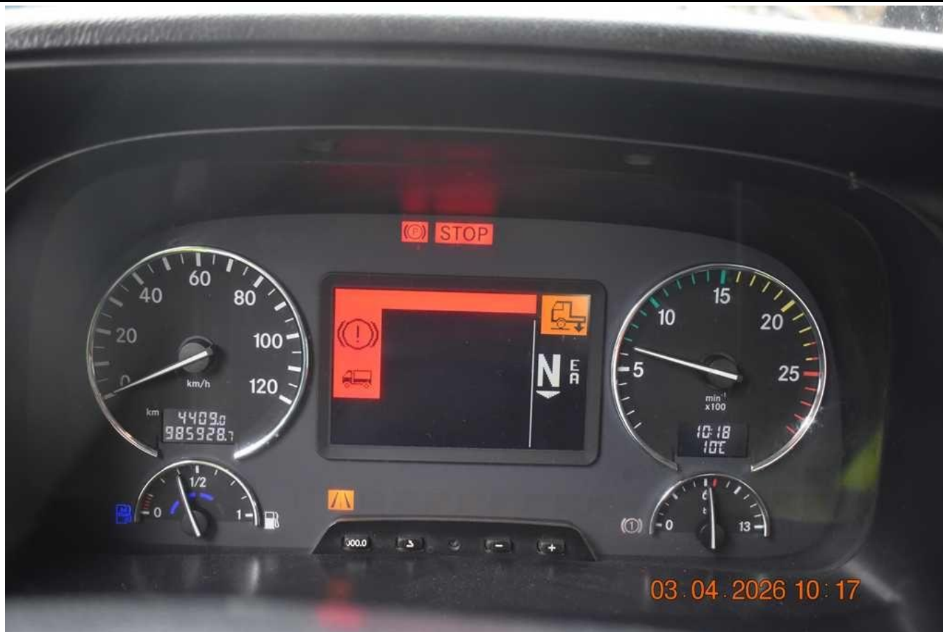
Fot. nr 79