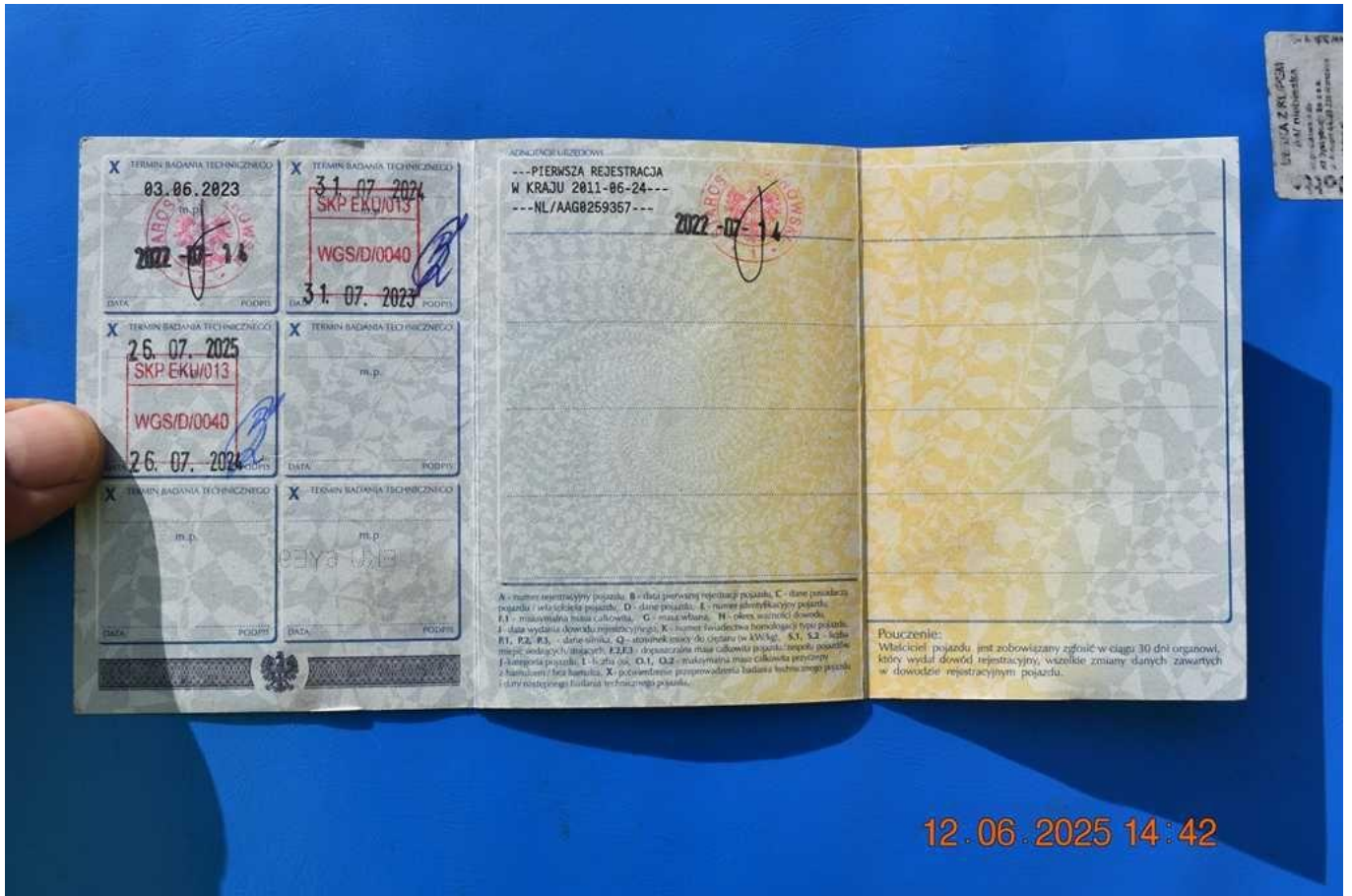
Fot. nr 83

Dokument wystawiony elektronicznie, wa ny bez podpisu