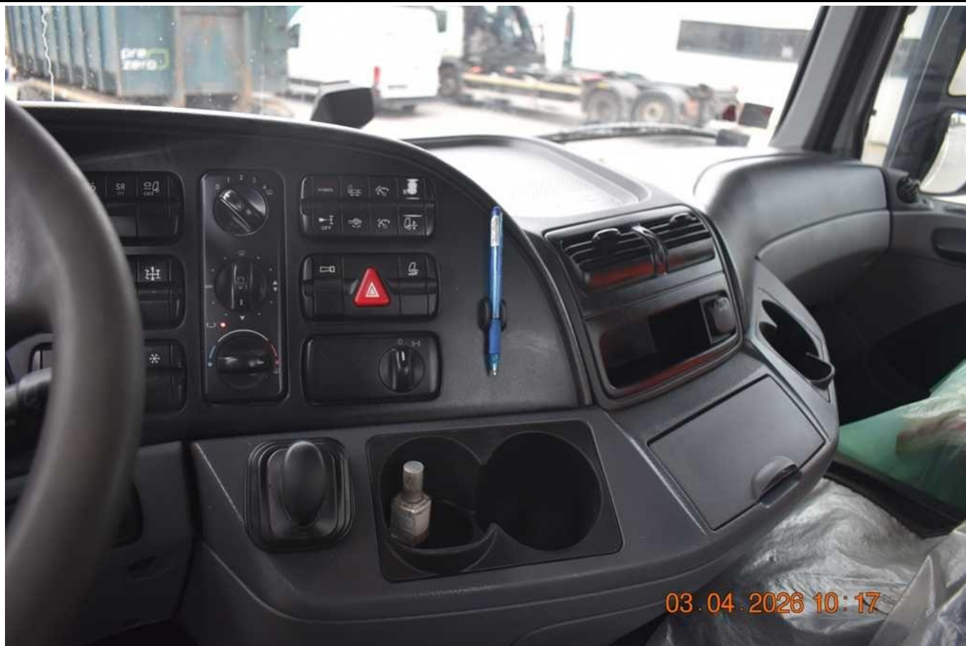
Fot. nr 77