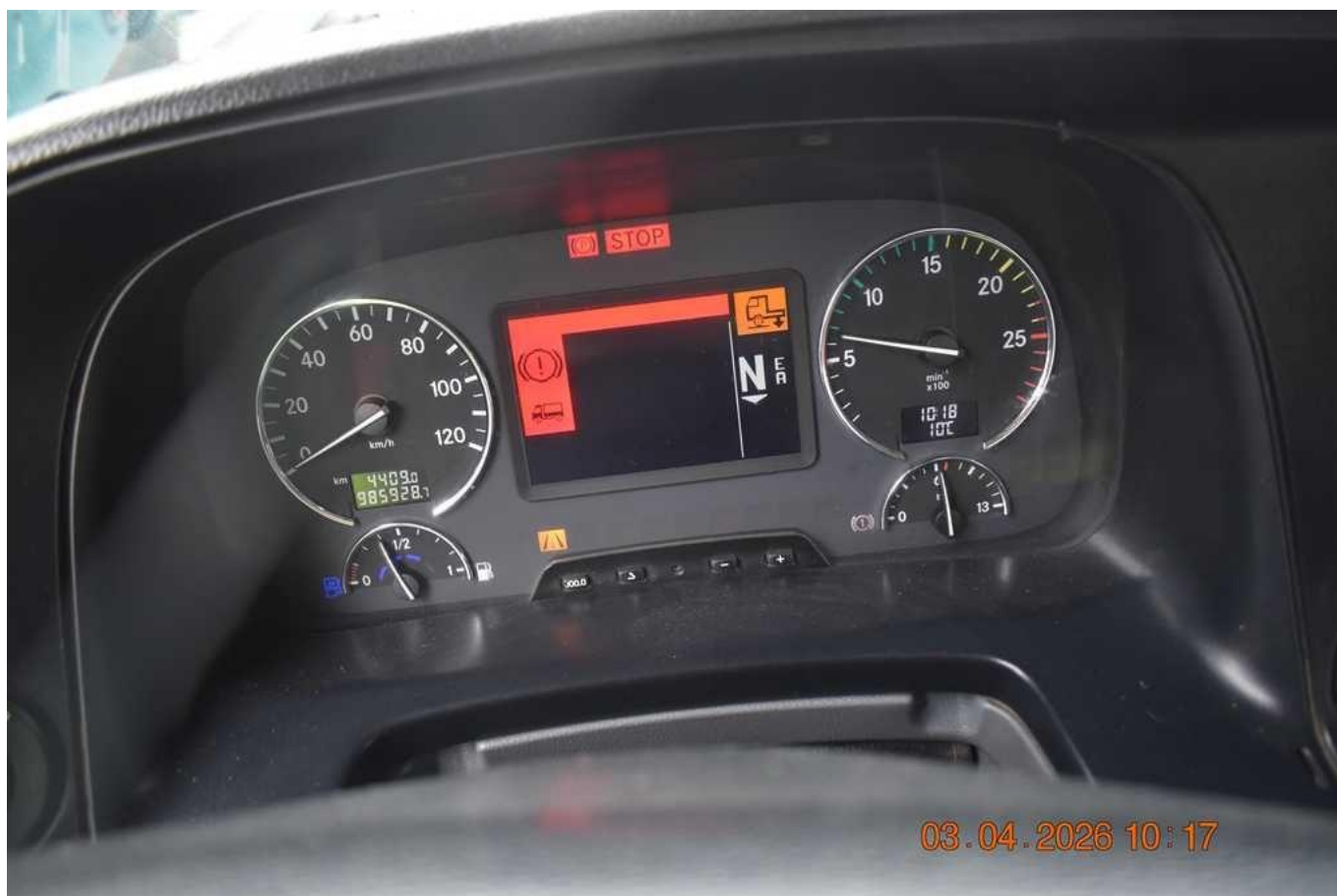
Fot. nr 78