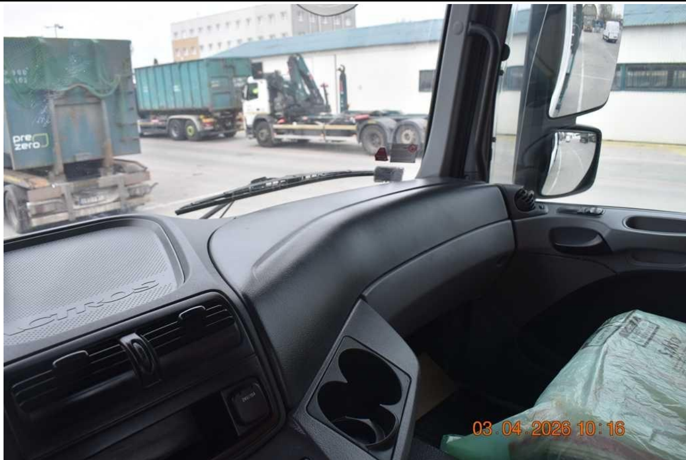
Fot. nr 75