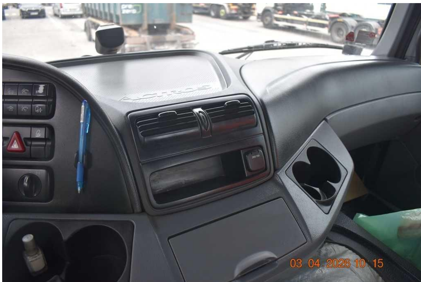
Fot. nr 74