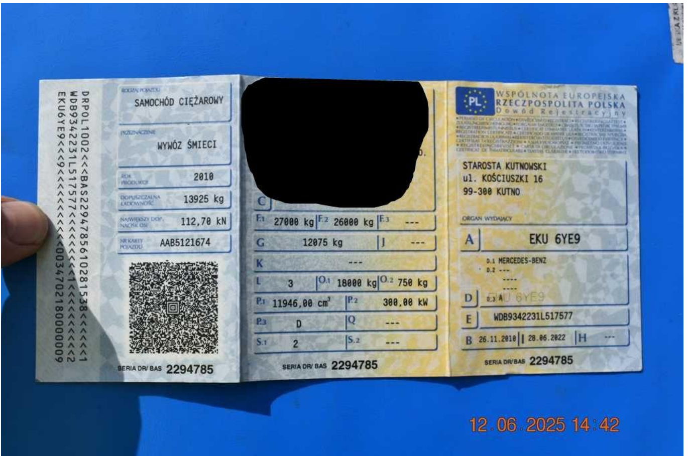
Fot. nr 82