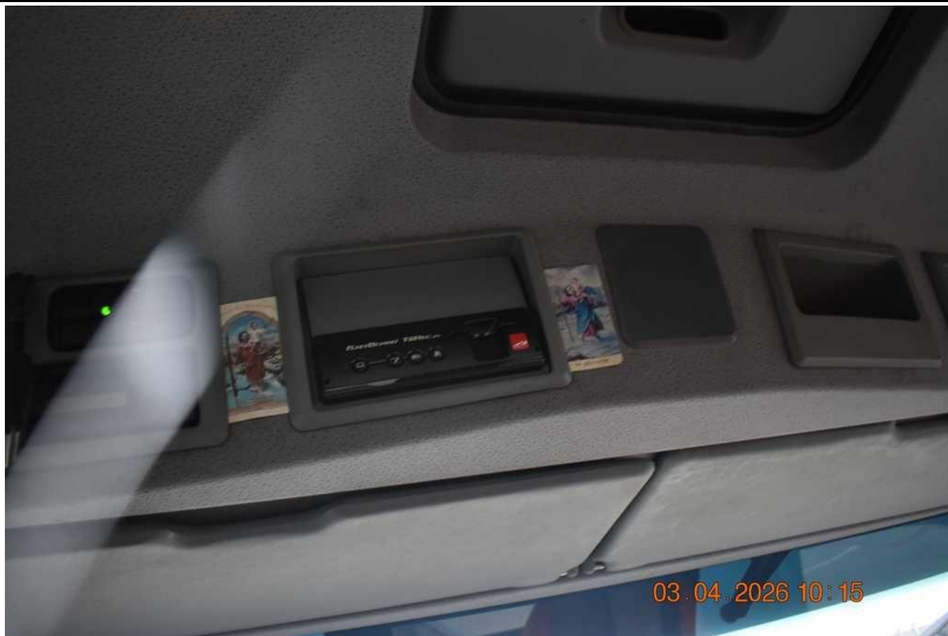
Fot. nr 71