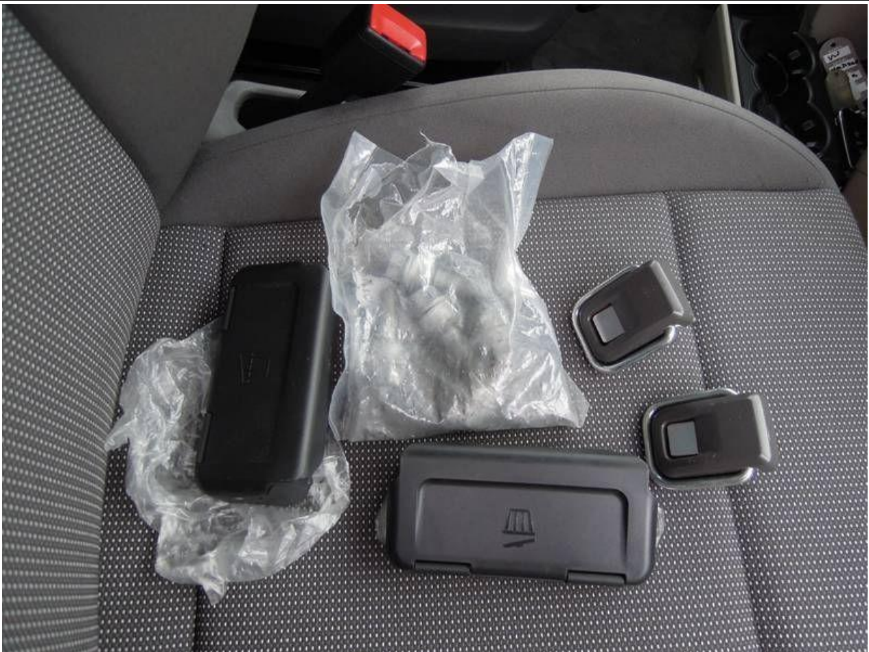
Fot. nr 71