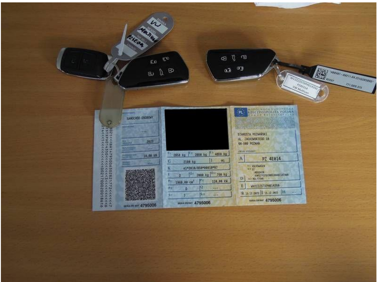
Fot. nr 72