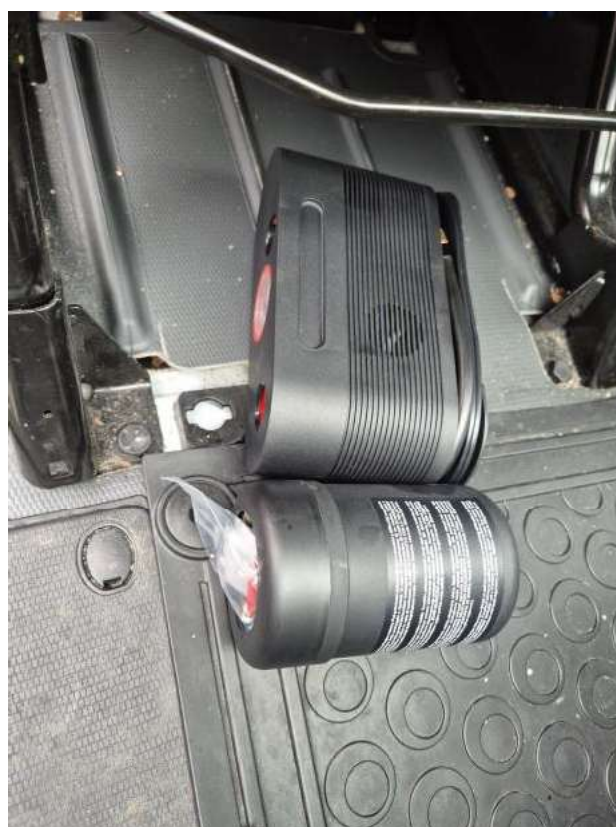
Fot. 36 Zestaw naprawczy koła