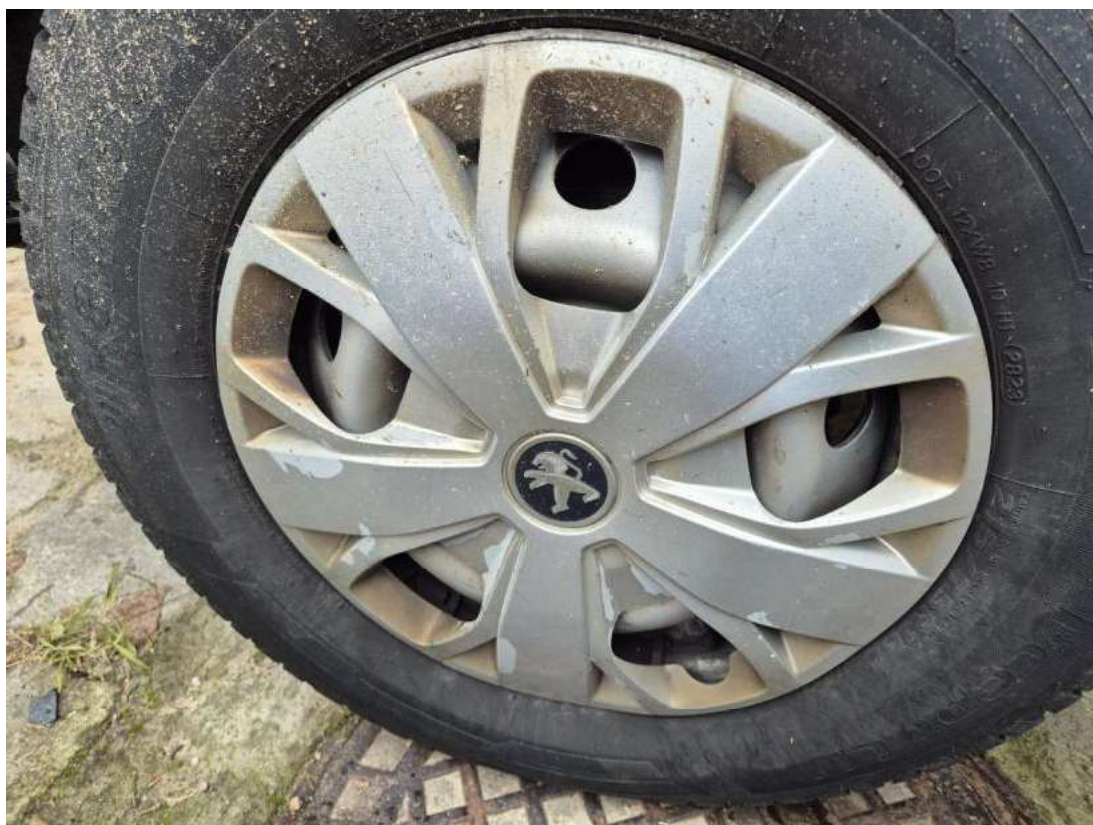
Fot. 38 Kołpak tylny P - zdjęcie poglądowe 1