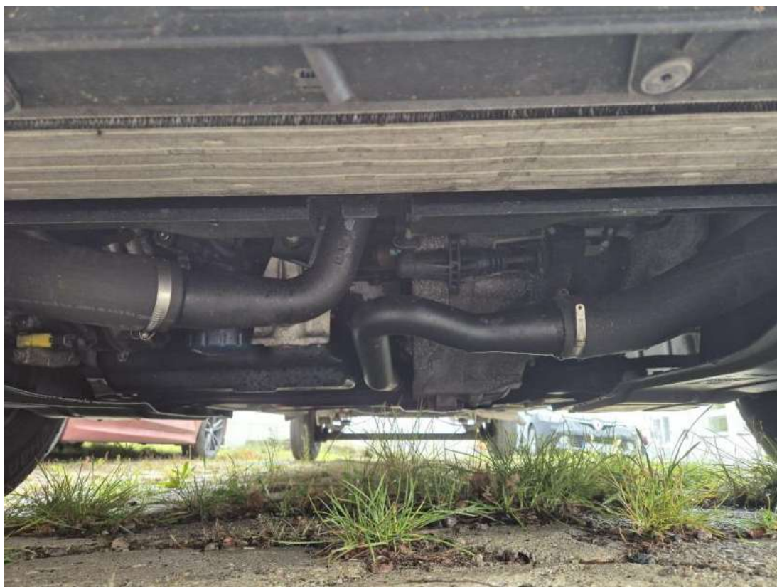
Fot. 25 Spód pojazdu przód