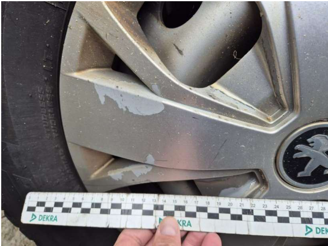
Fot. 39 Kołpak tylny P - Rysa/odprysk 1