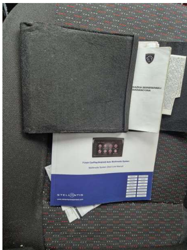
Fot. 35 Instrukcje