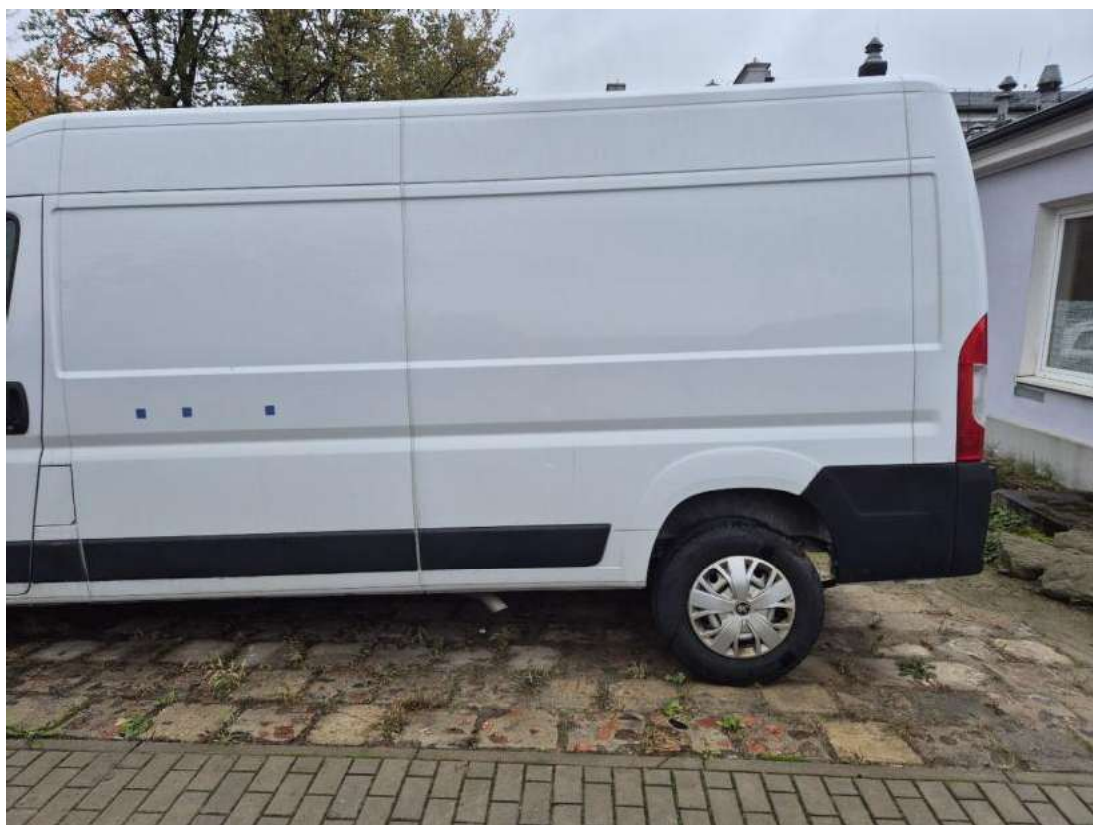
Fot. 10 Bok lewy z tyłu