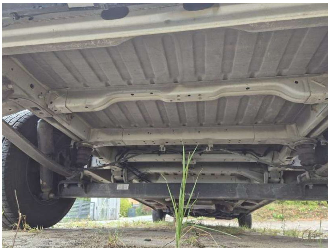
Fot. 26 Spód pojazdu tył