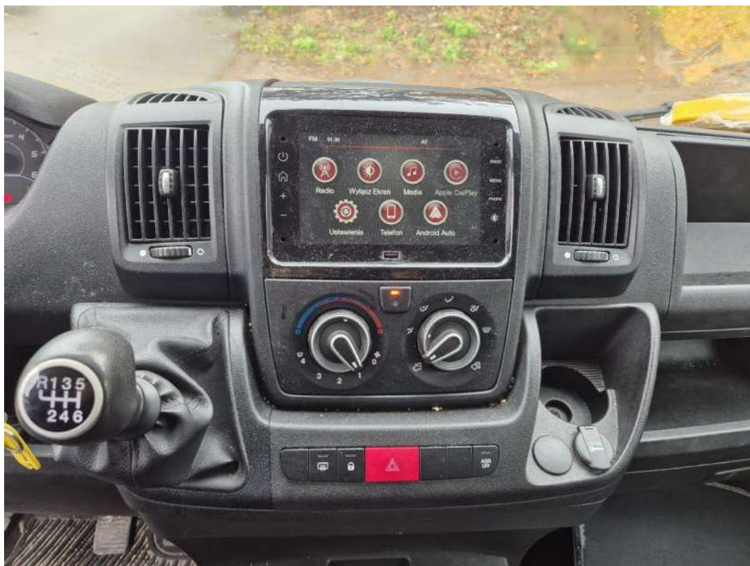
Fot. 19 Konsola środkowa