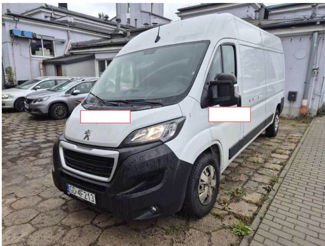
Fot. 1 Przekątna przednia lewa