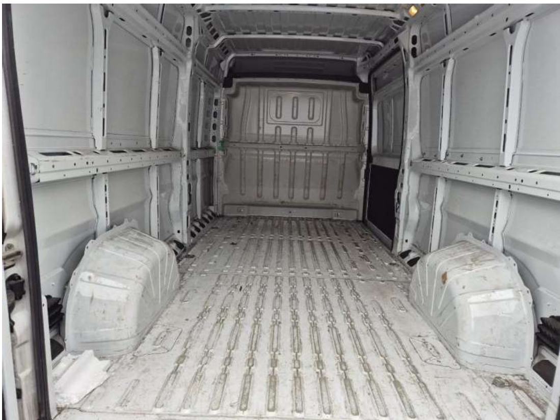
Fot. 24 Bagażnik