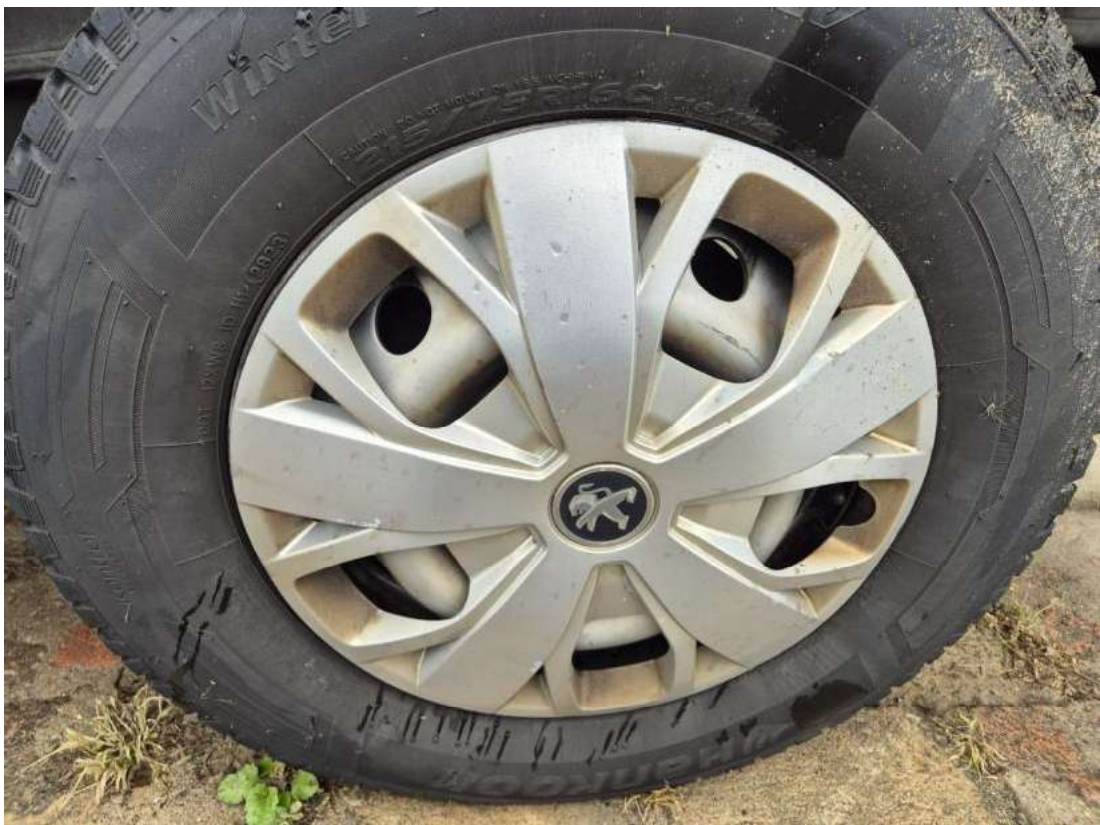
Fot. 40 Kołpak tylny L - zdjęcie poglądowe 1