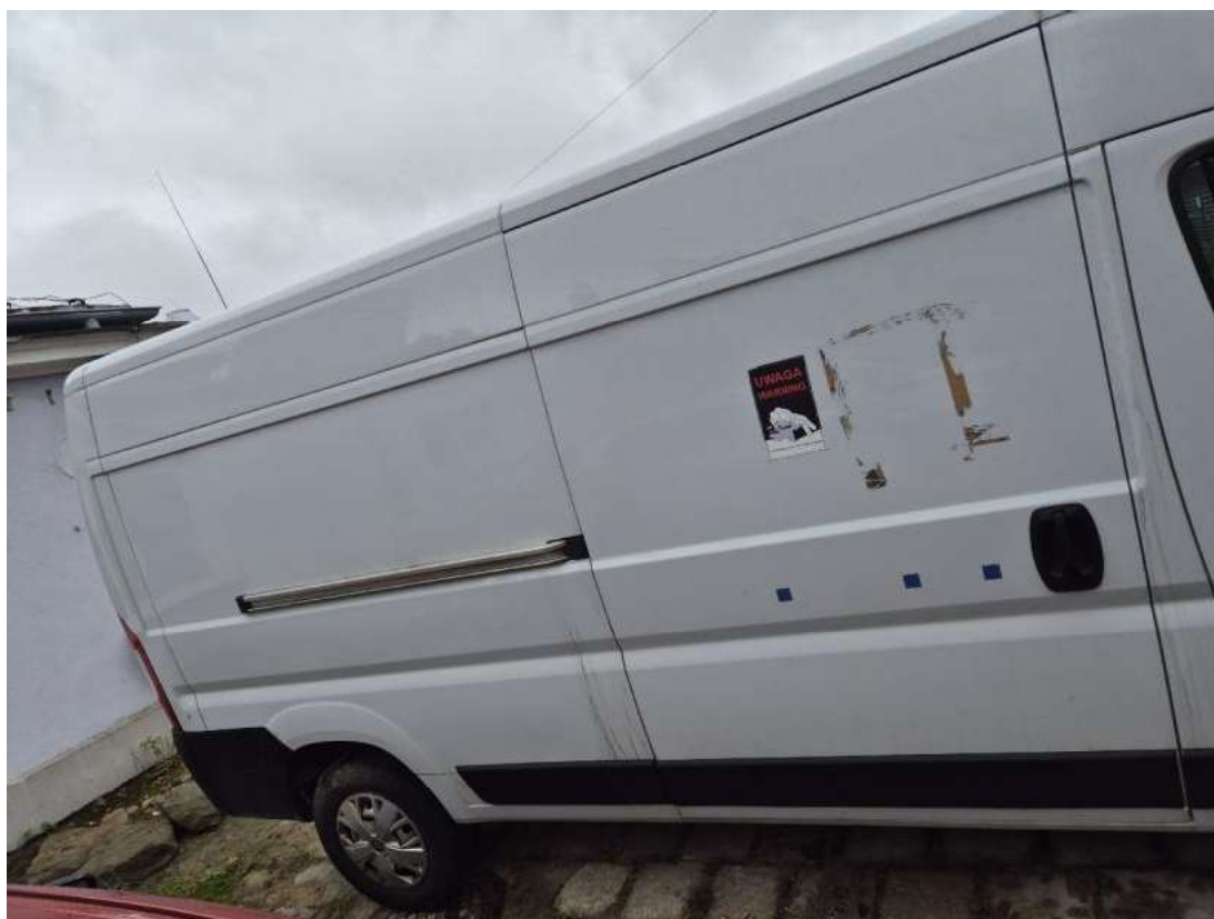
Fot. 6 Bok prawy z tyłu