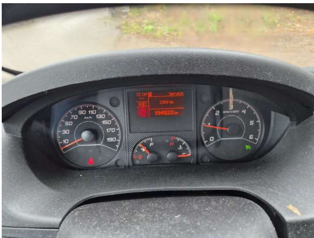
Fot. 16 Zestaw wskaźników - serwis