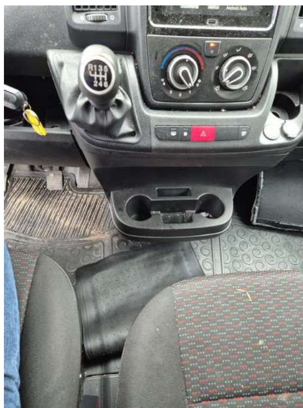
Fot. 20 Tuneł środkowy