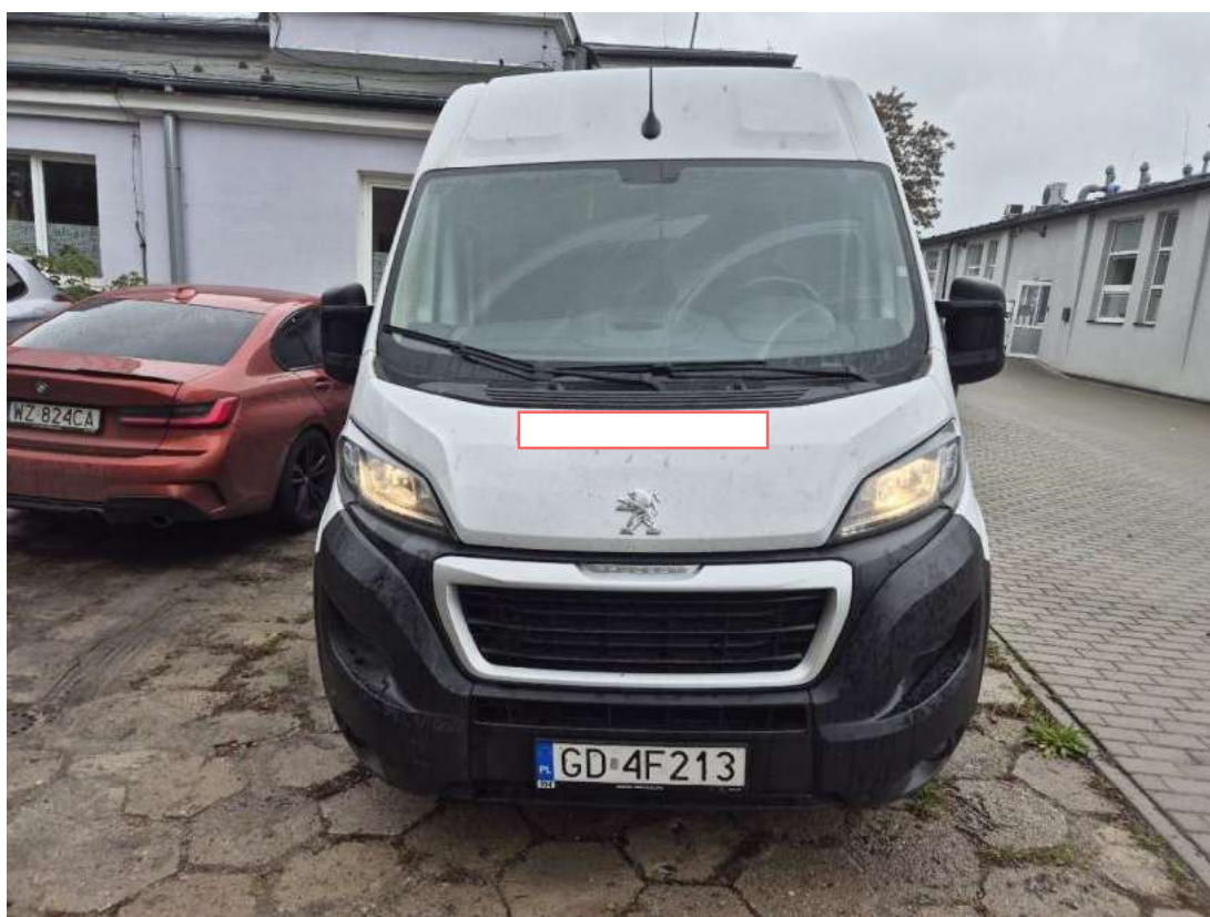
Fot. 2 Przód