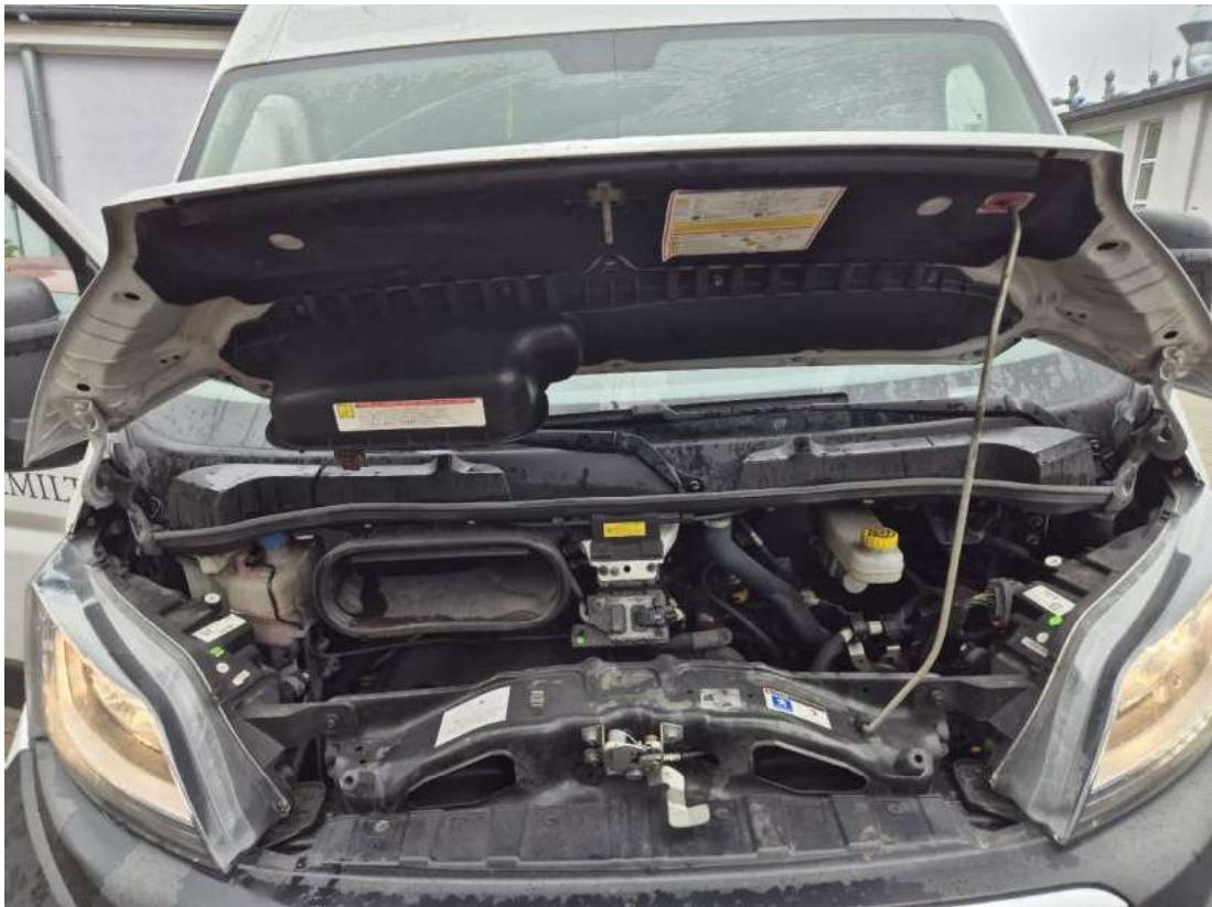
Fot. 23 Komora silnika