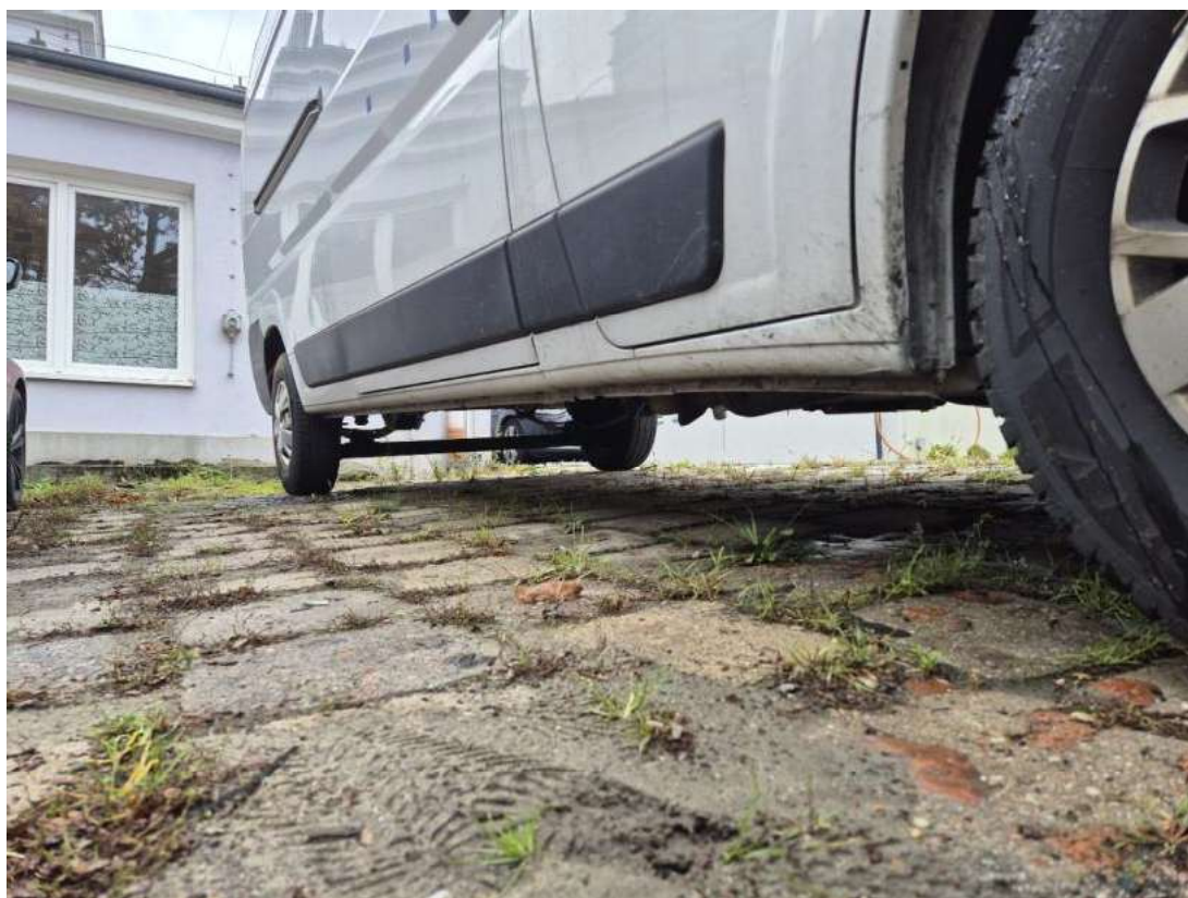
Fot. 4 Próg prawy (widok od przodu)