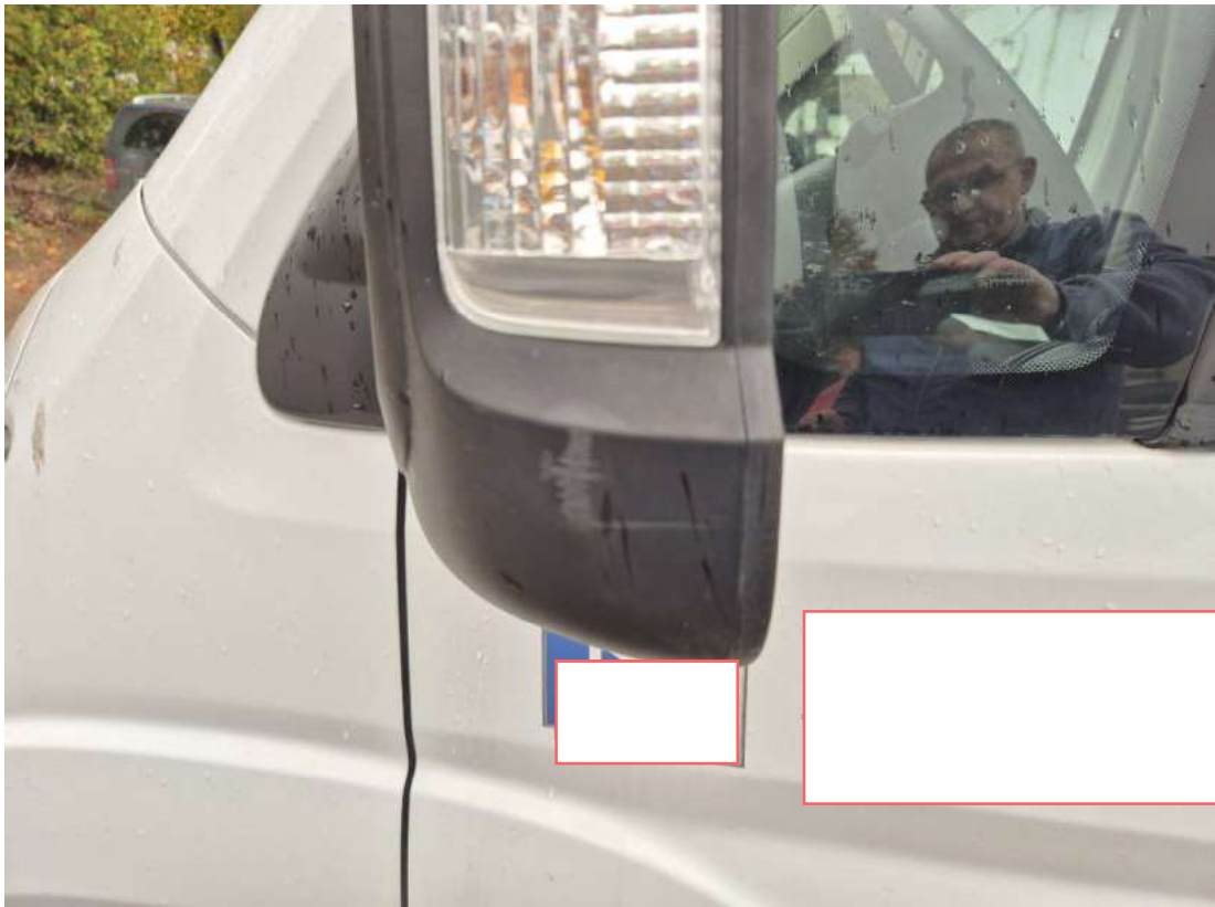
Fot. 43 Obudowa lusterka zew L - zdjęcie poglądowe 1