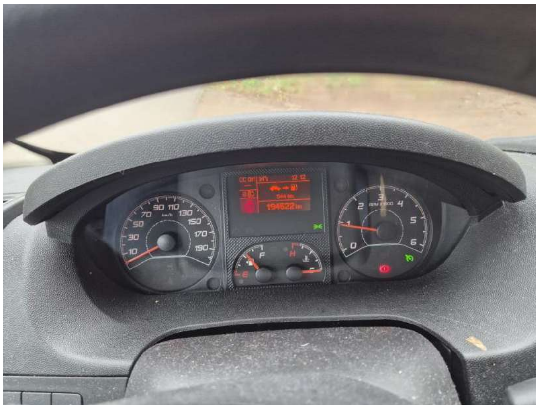
Fot. 15 Zestaw wskaźników - przebieg