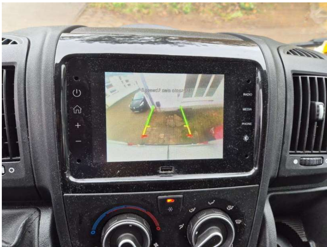
Fot. 37 Zdjęcie do protokołu