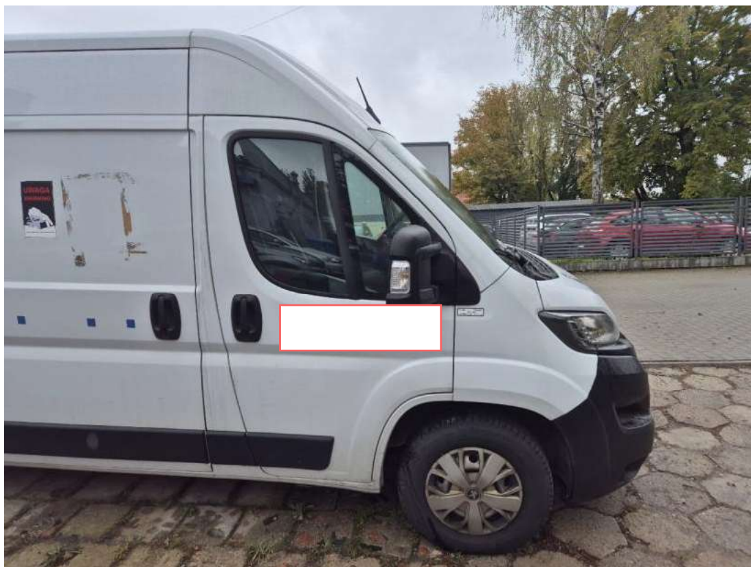
Fot. 5 Bok prawy z przodu