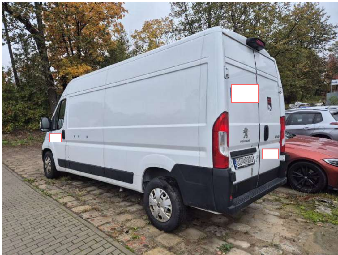
Fot. 9 Przekątna tylna lewa