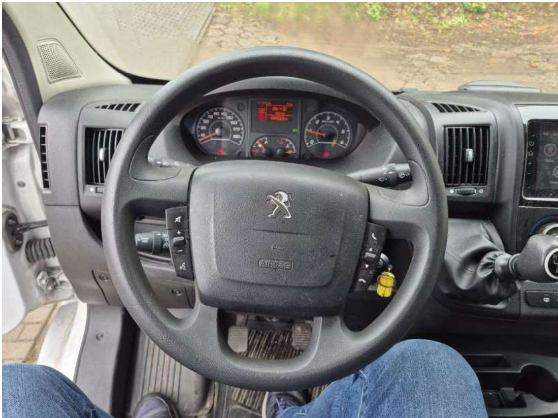
Fot. 21 Kierownica (na wprost)