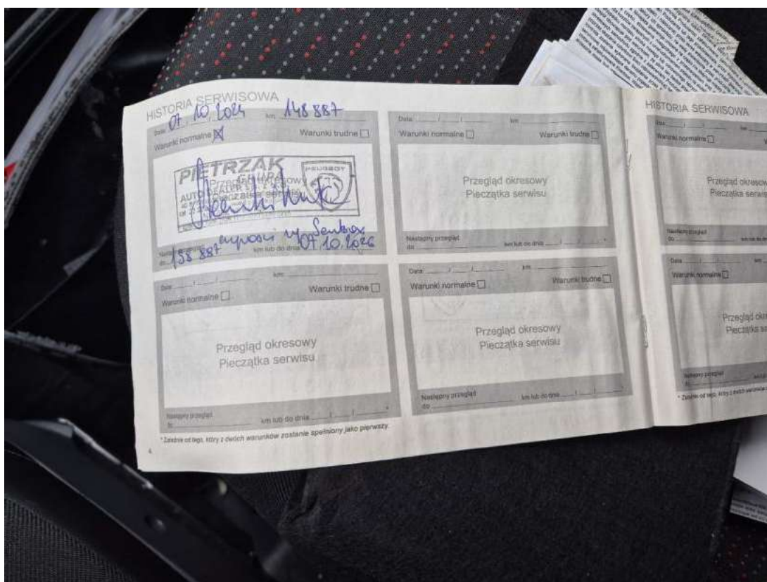
Fot. 32 Książka serwisowa – ostatni przegląd