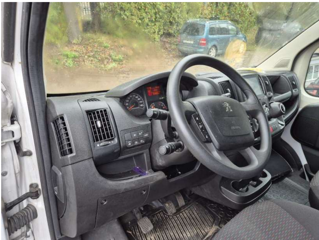
Fot. 22 Kierownica z lewej strony