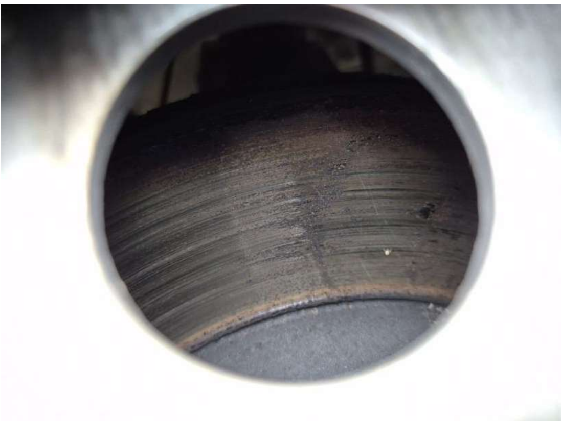
Fot. 28 Tarcza hamulcowa przednia prawa