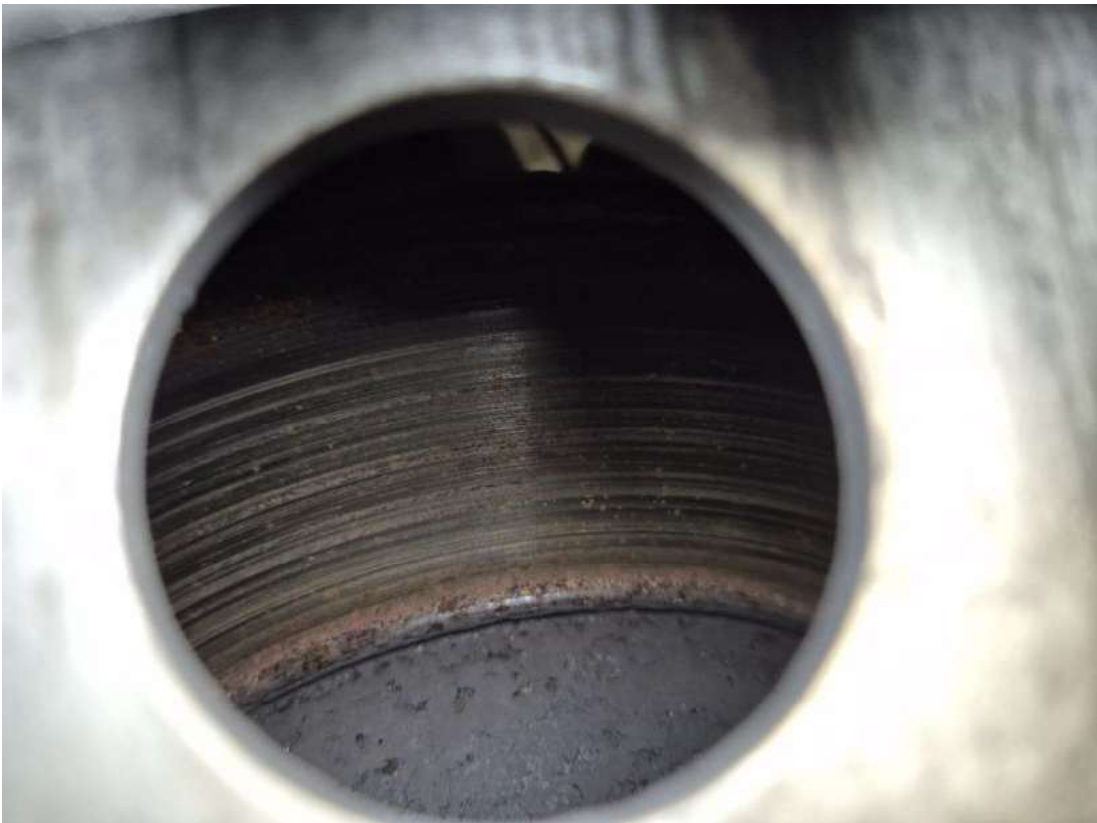
Fot. 27 Tarcza hamulcowa przednia lewa