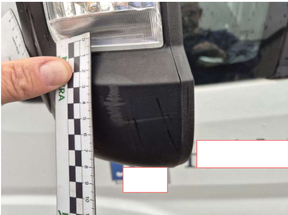
Fot. 44 Obudowa lusterka zew L - Rysa/odprysk 1