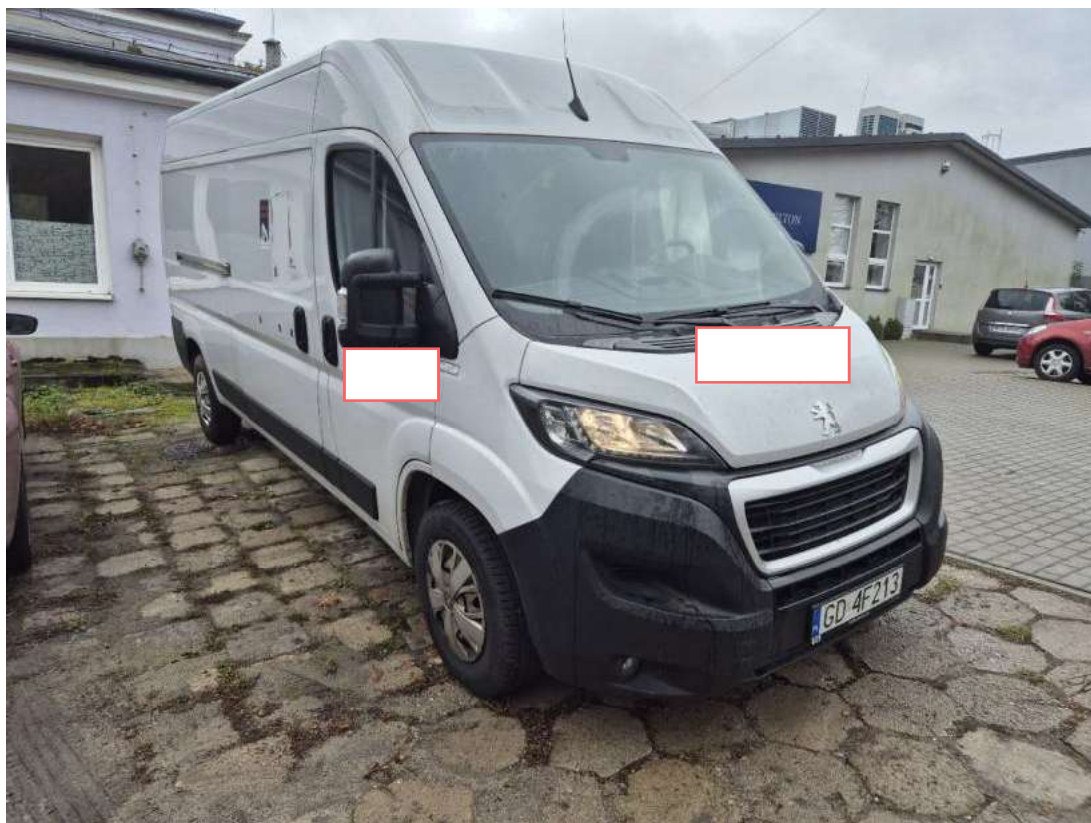
Fot. 3 Przekątna przednia prawa