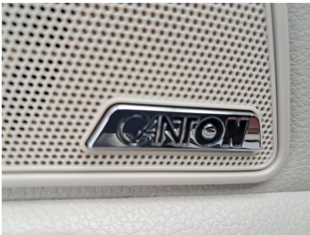
Fot. 39 Zdjęcie do protokołu