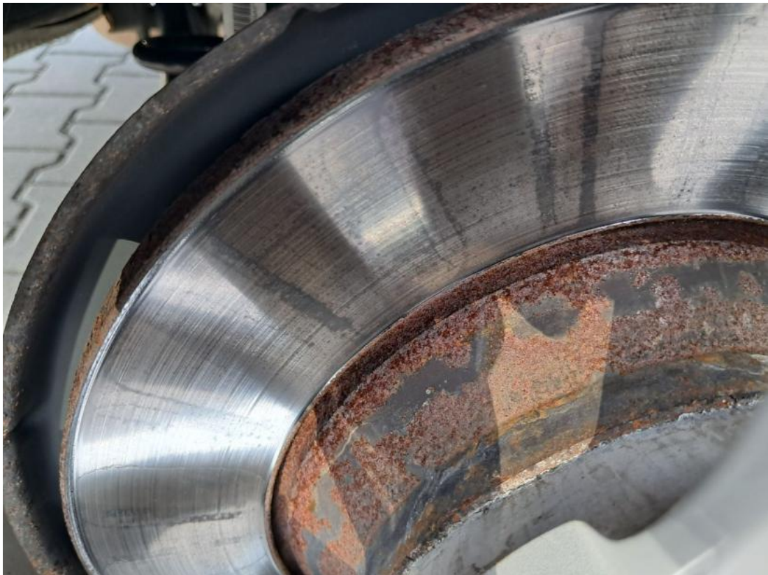
Fot. 31 Tarcza hamulcowa tylna prawa