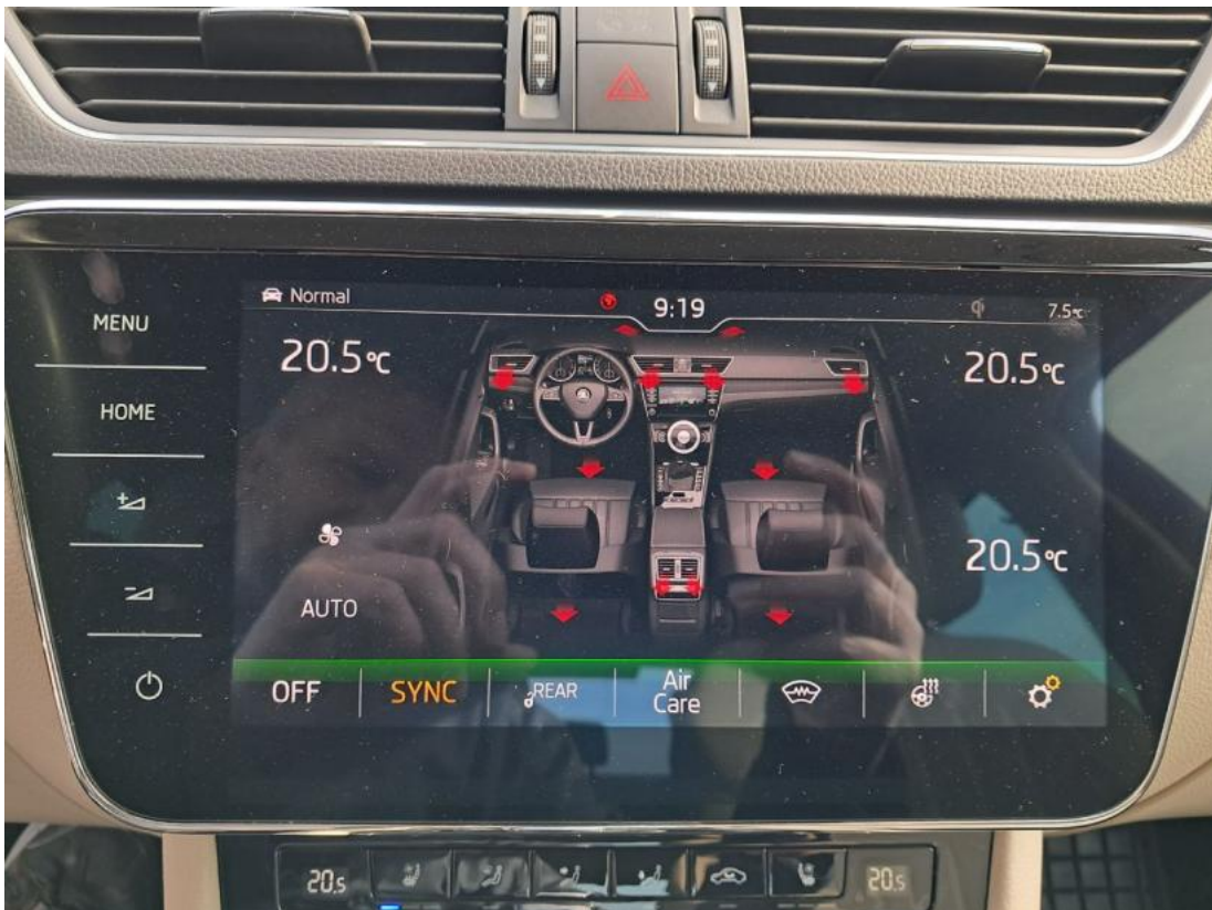
Fot. 41 Zdjęcie do protokołu