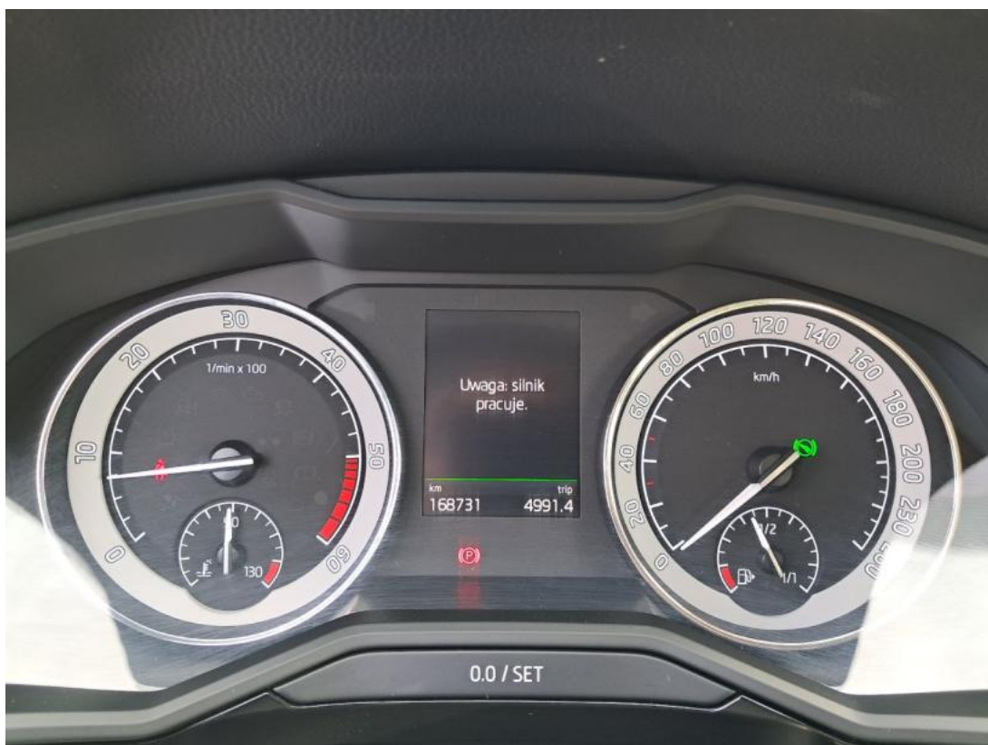
Fot. 15 Zestaw wskaźników - przebieg