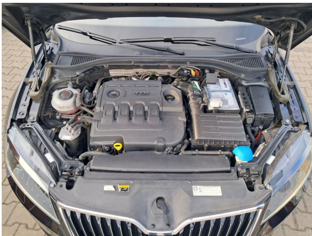
Fot. 24 Komora silnika