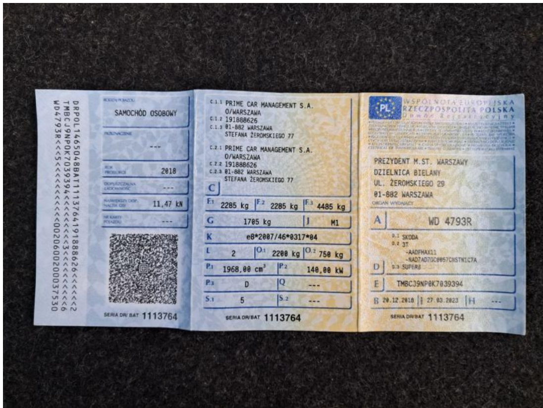
Fot. 33 Dowód rej. Str. 1