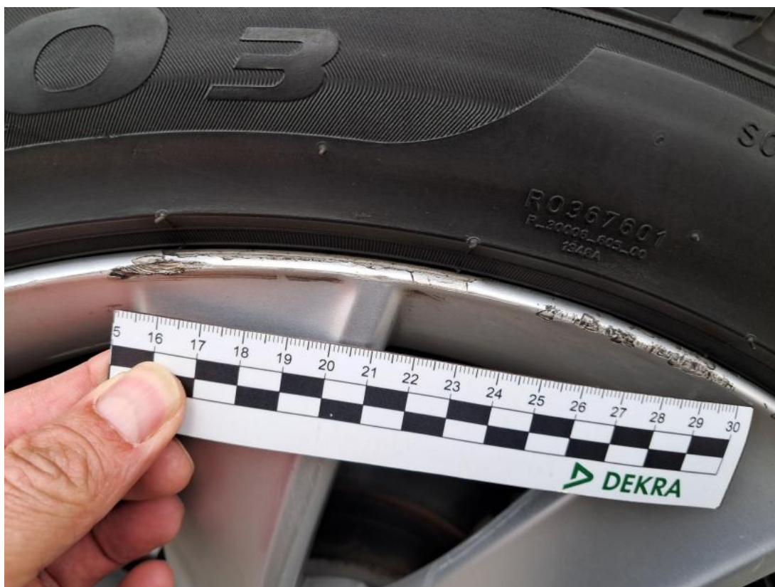
Fot. 43 Felga aluminiowa przednia P - Rysa/odprysk 1