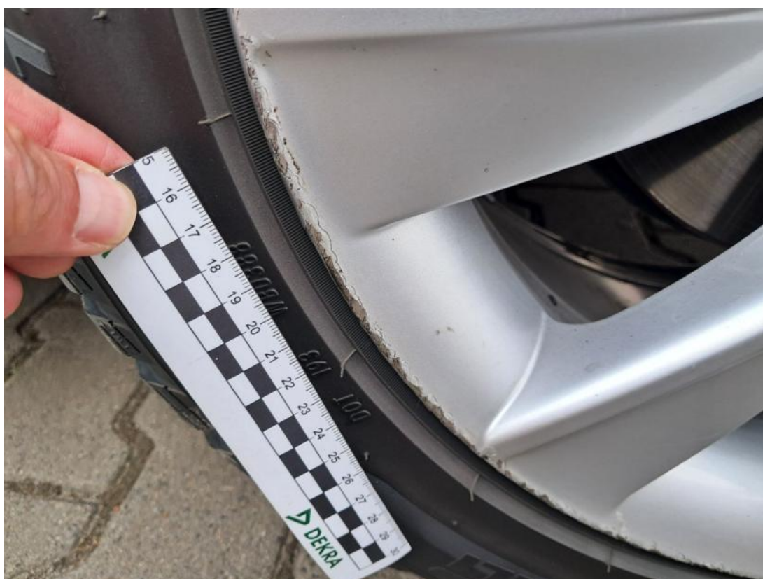
Fot. 44 Felga aluminiowa przednia P - Rysa/odprysk 2