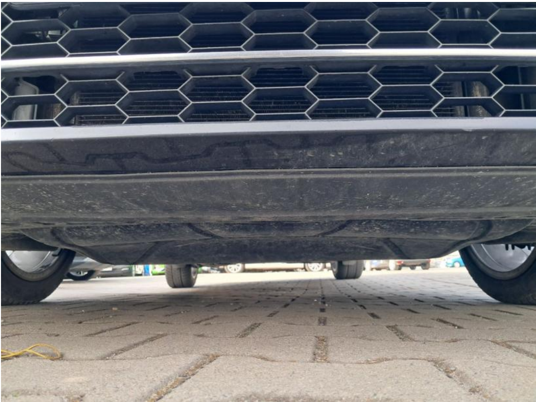
Fot. 27 Spód pojazdu przód