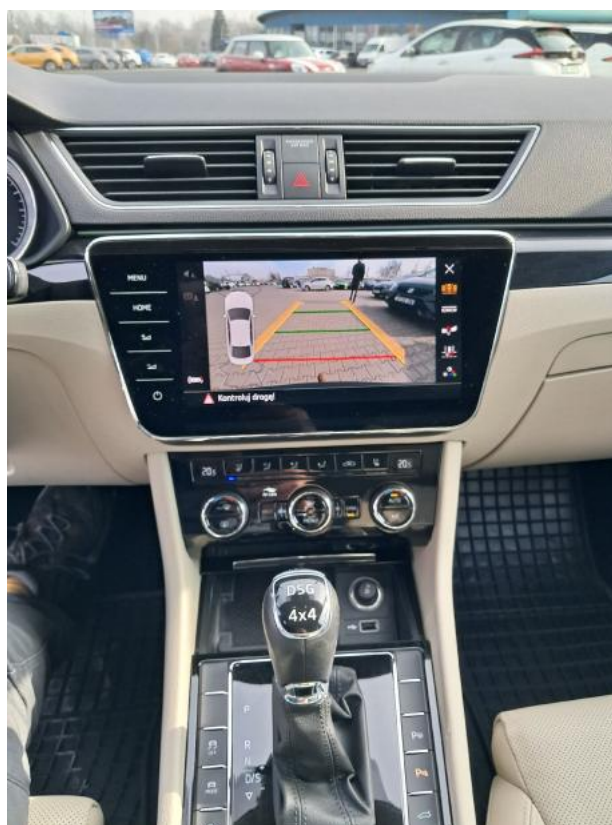
Fot. 20 Konsola środkowa