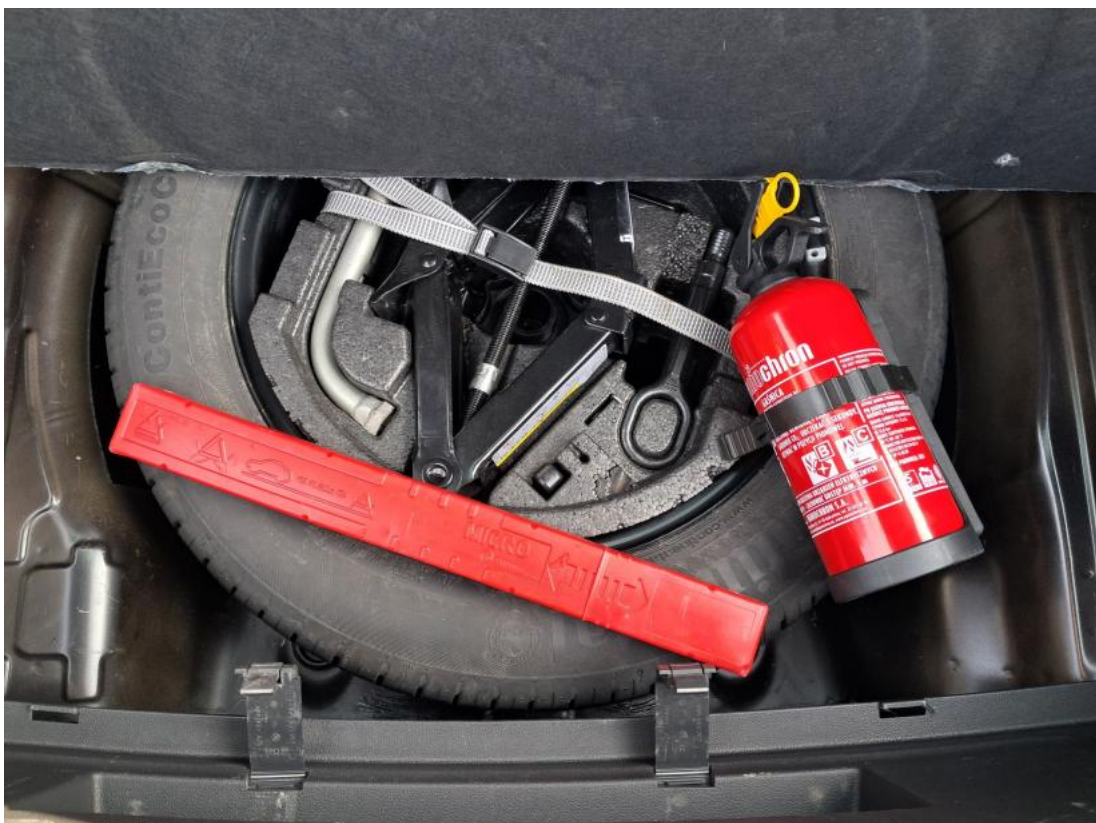
Fot. 26 Koło zapasowe