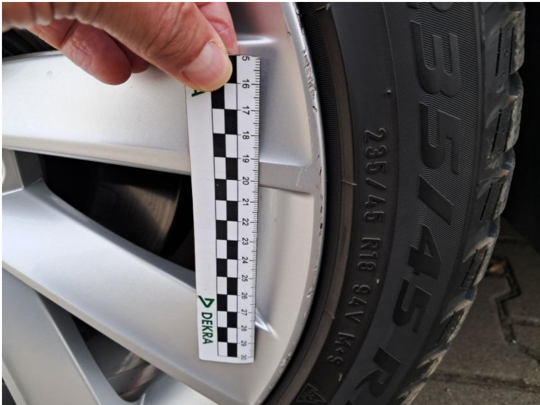
Fot. 55 Felga Aluminiowa przednia L - Rysa/odprysk 1