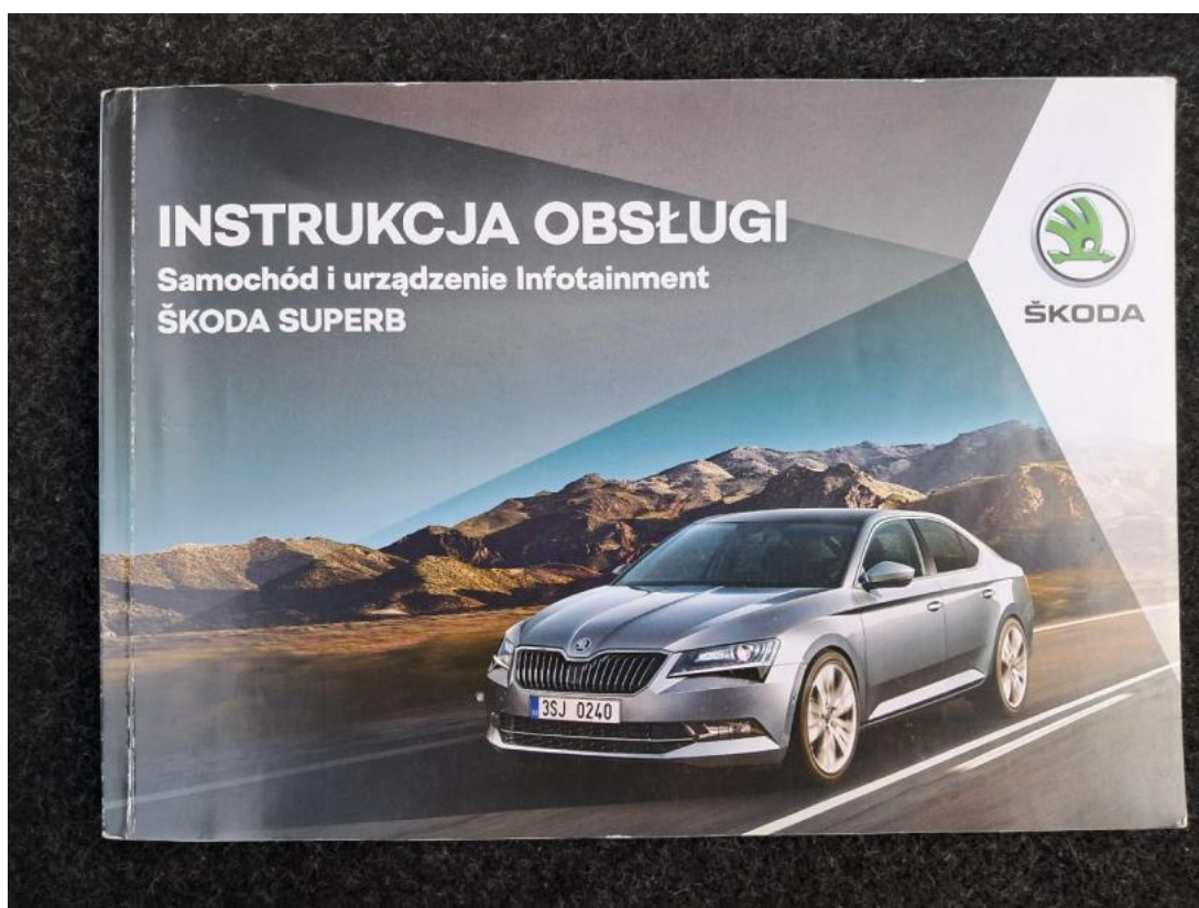
Fot. 36 Instrukcje