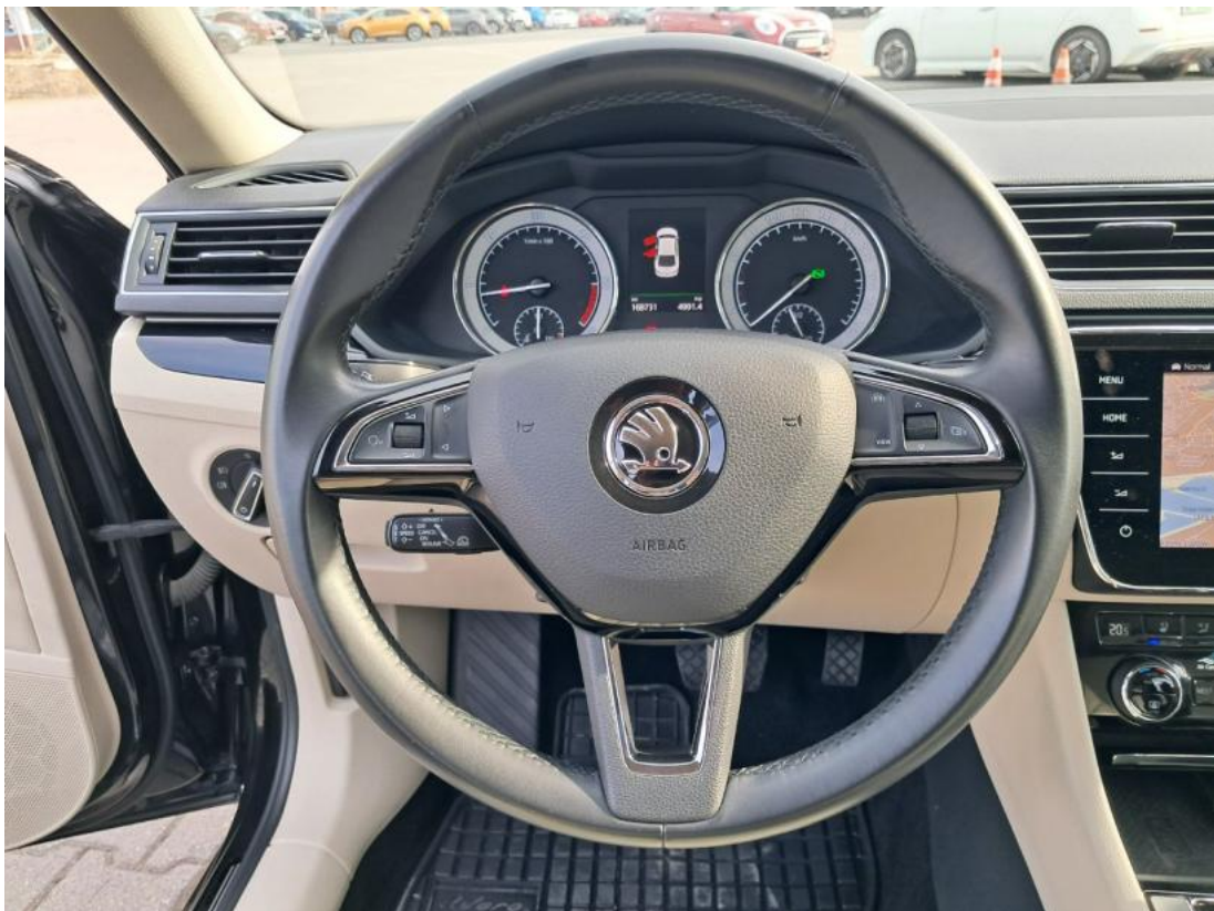
Fot. 22 Kierownica (na wprost)