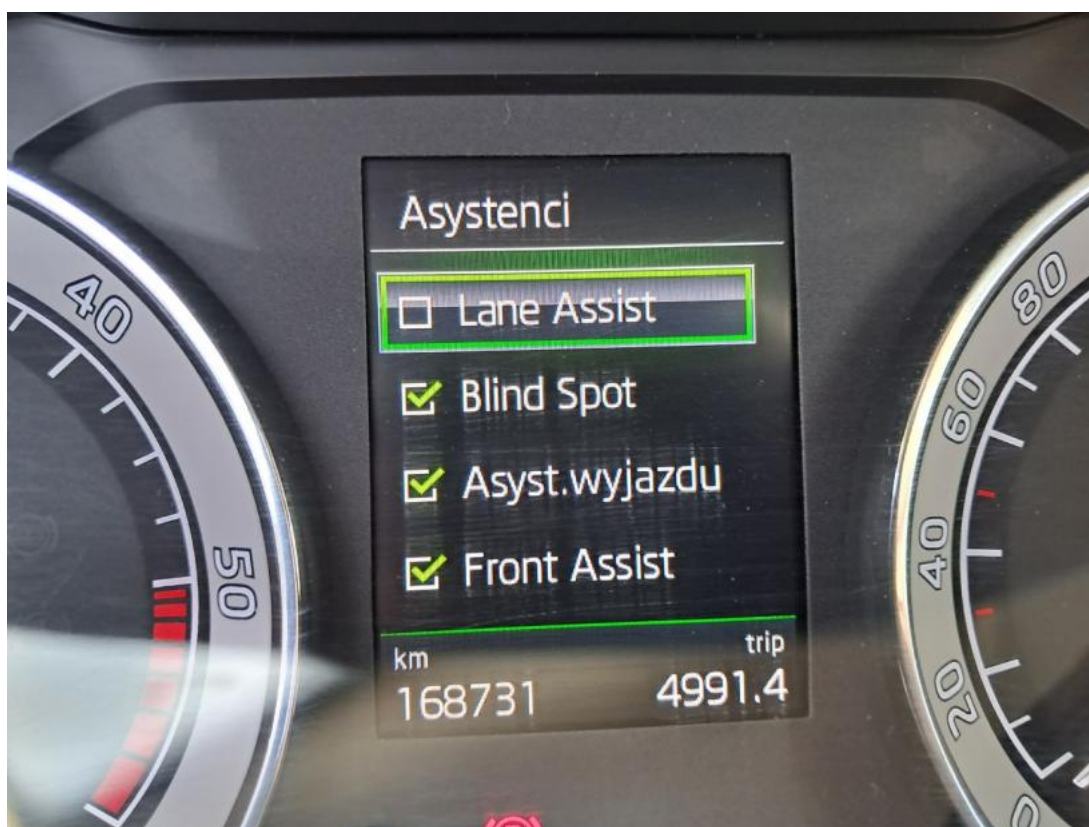
Fot. 40 Zdjęcie do protokołu