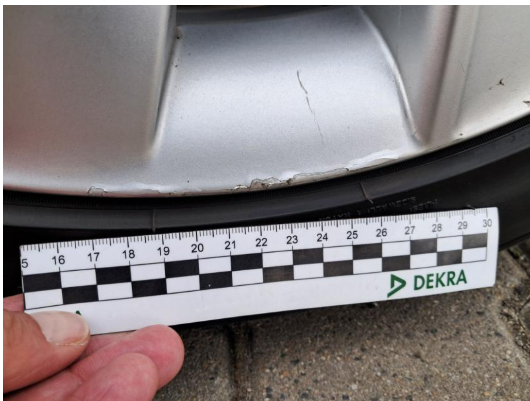
Fot. 50 Felga aluminiowa tylna L - Rysa/odprysk 1