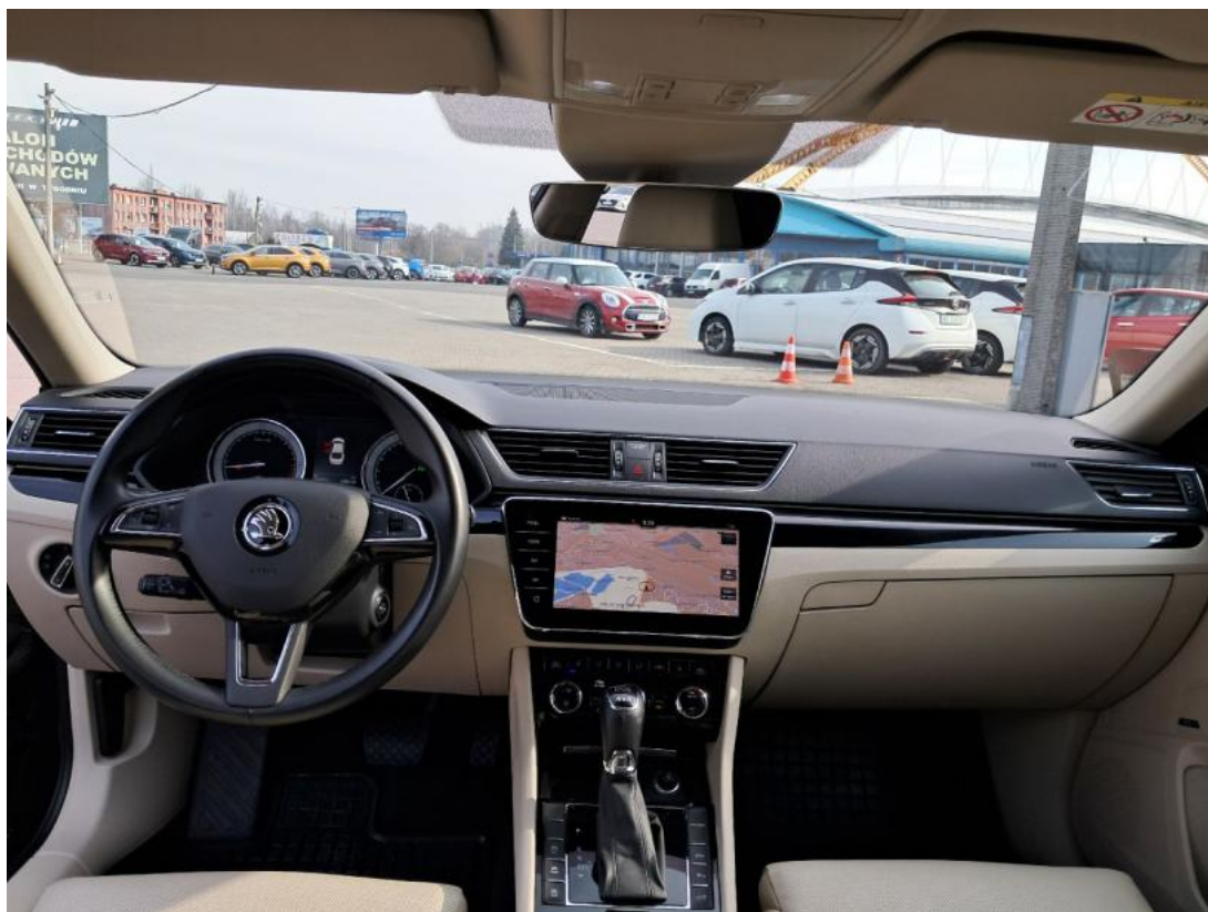
Fot. 19 Widok z tylnej kanapy na deskę rozd.