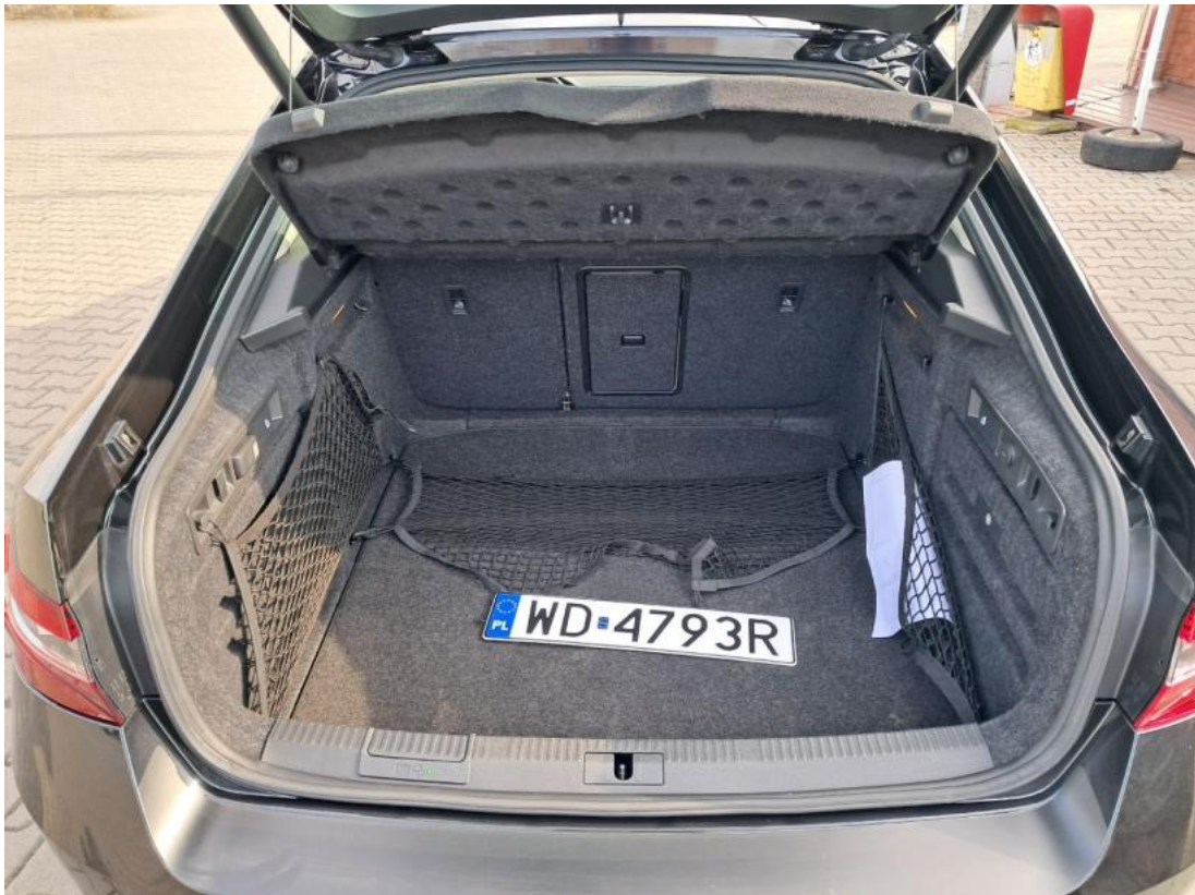
Fot. 25 Bagażnik