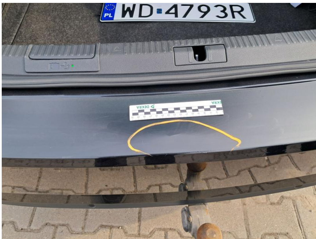
Fot. 49 Zderzak tylny - Wgniecenie/odkształcenie 1