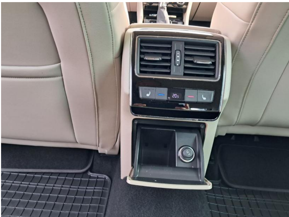
Fot. 42 Zdjęcie do protokołu