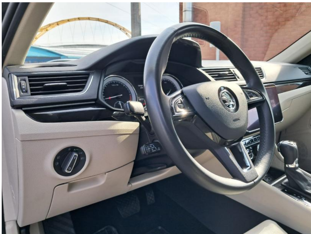
Fot. 23 Kierownica z lewej strony