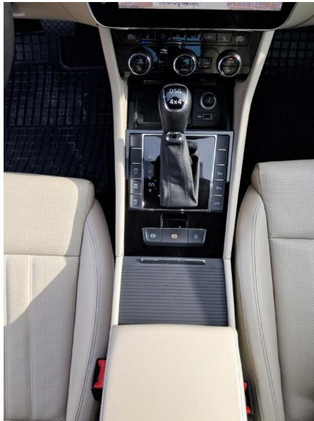
Fot. 21 Tunel środkowy