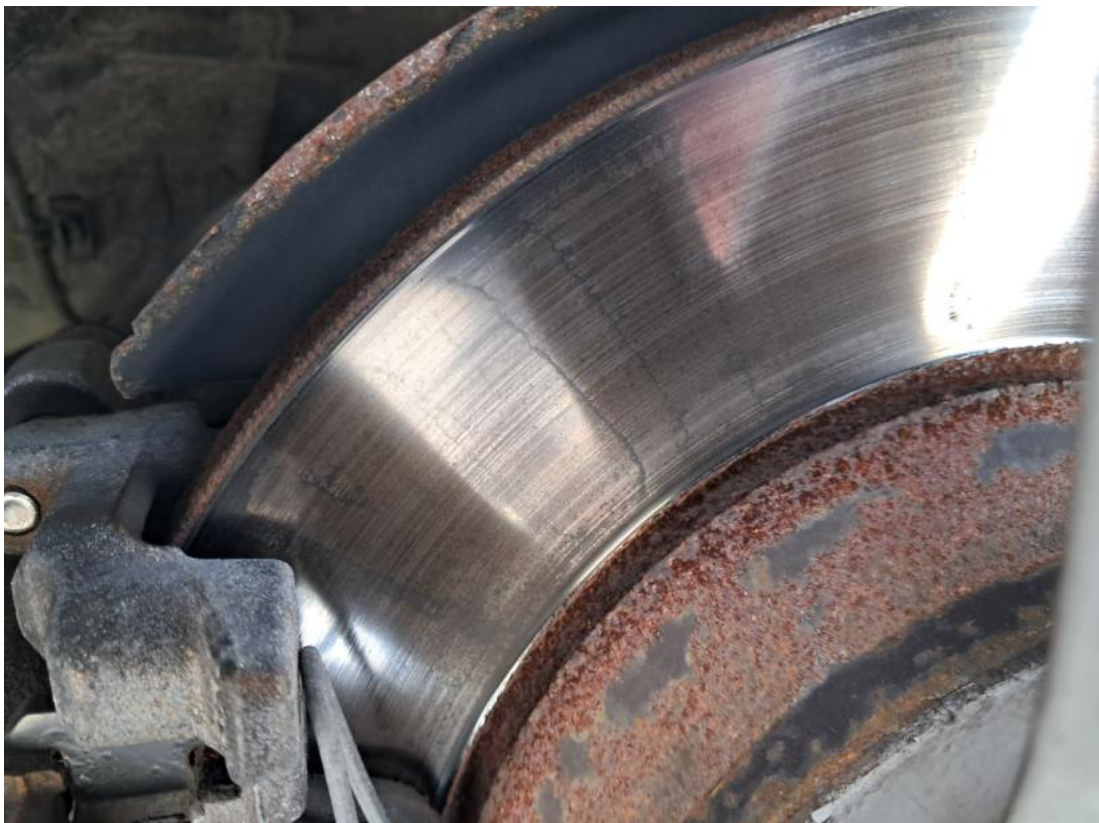
Fot. 32 Tarcza hamulcowa tylna lewa