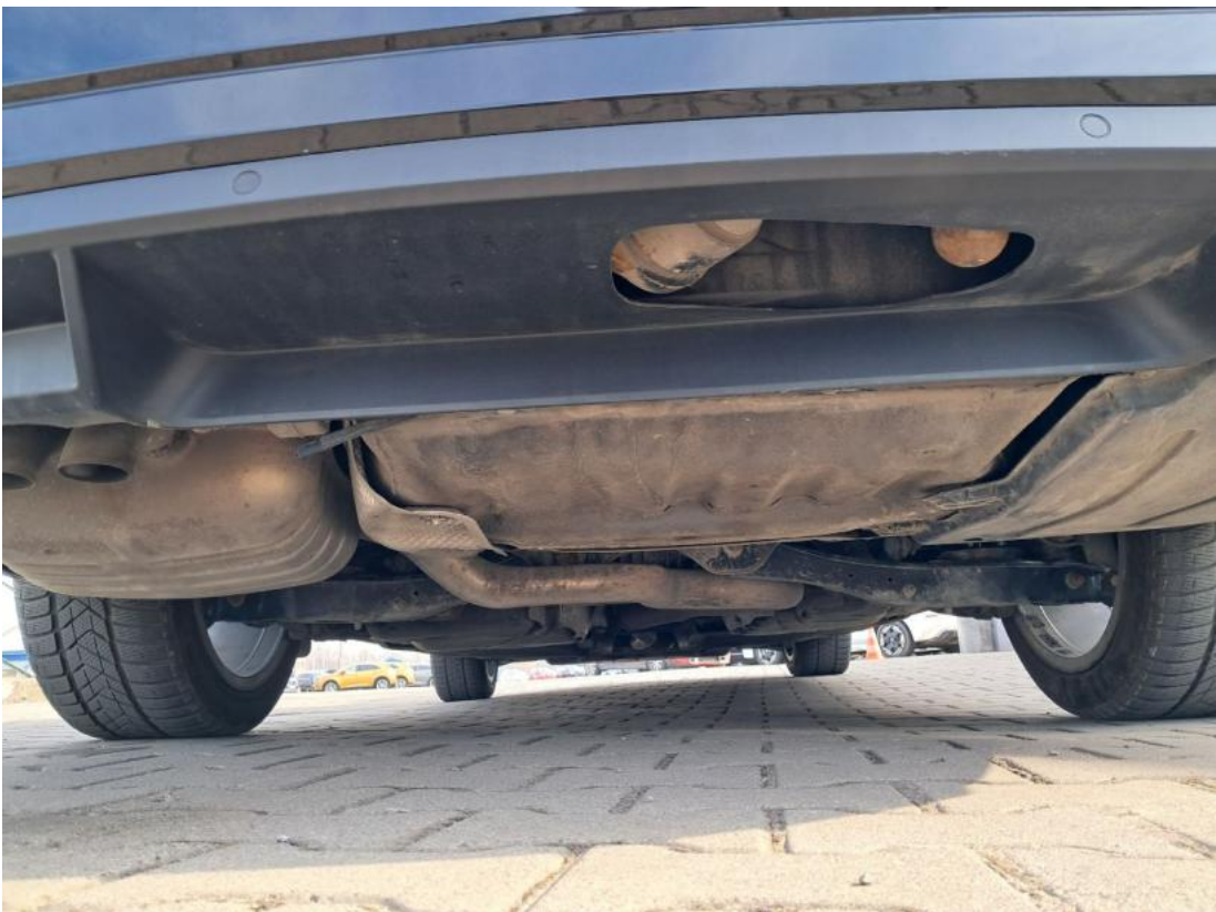
Fot. 28 Spód pojazdu tył