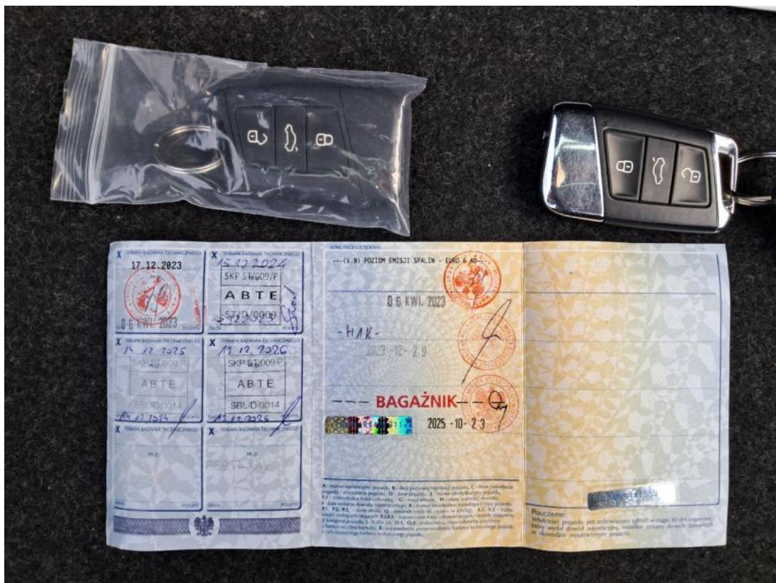
Fot. 34 Dow. Rej. Str.2 i klucze