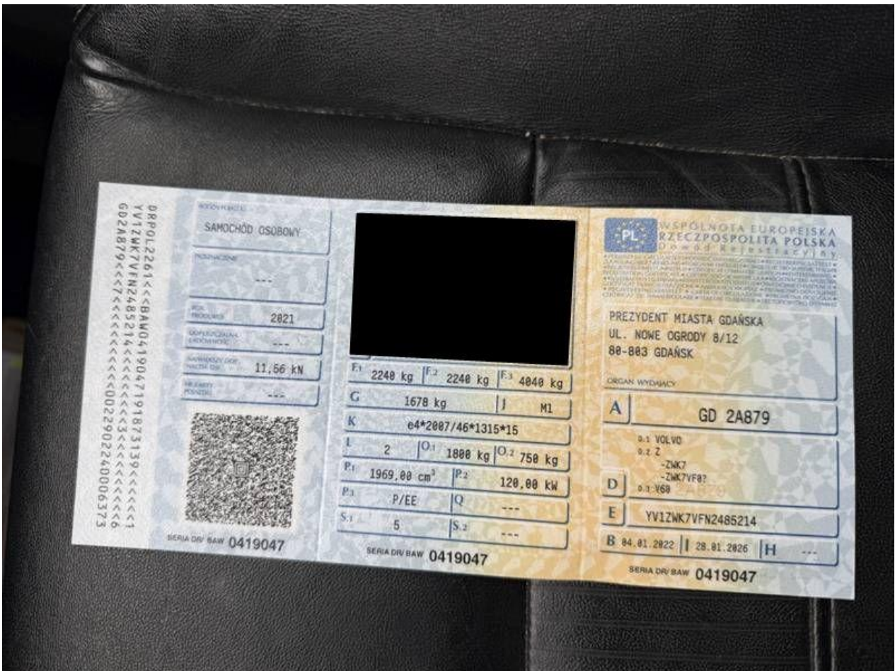
Fot. nr 66