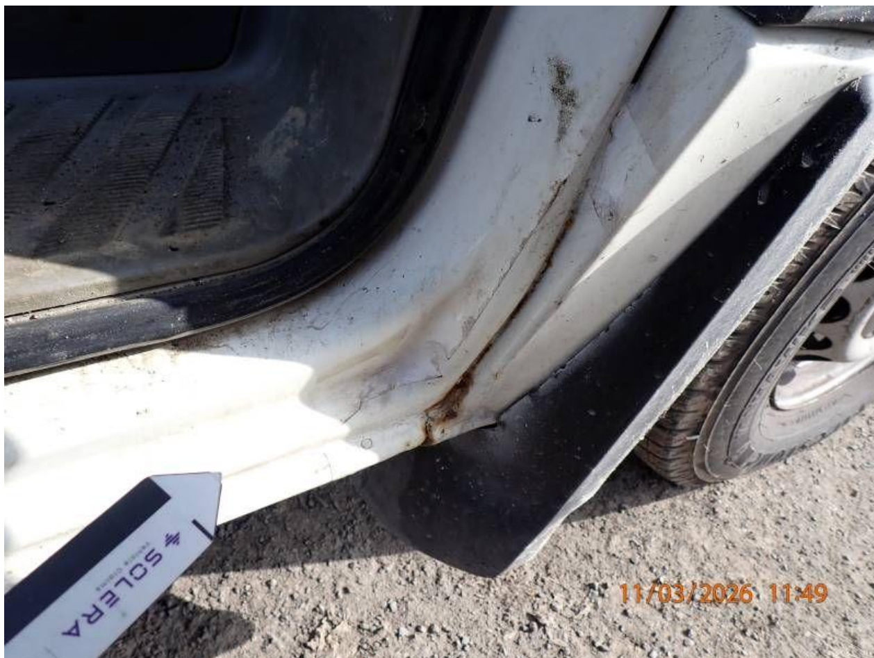
Fot. nr 114