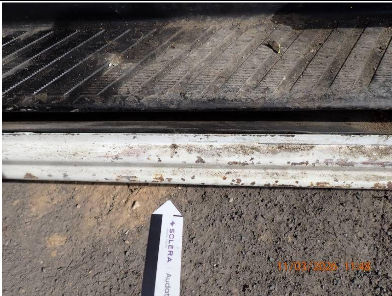
Fot. nr 107