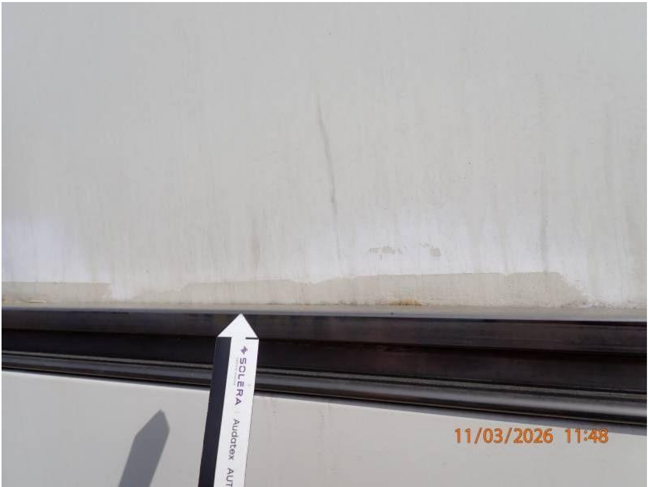
Fot. nr 95