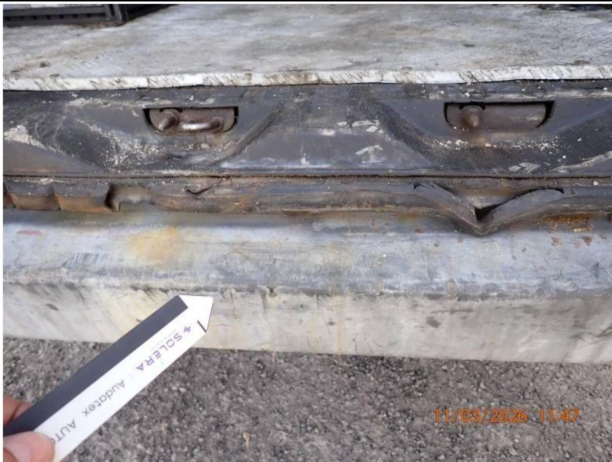
Fot. nr 81