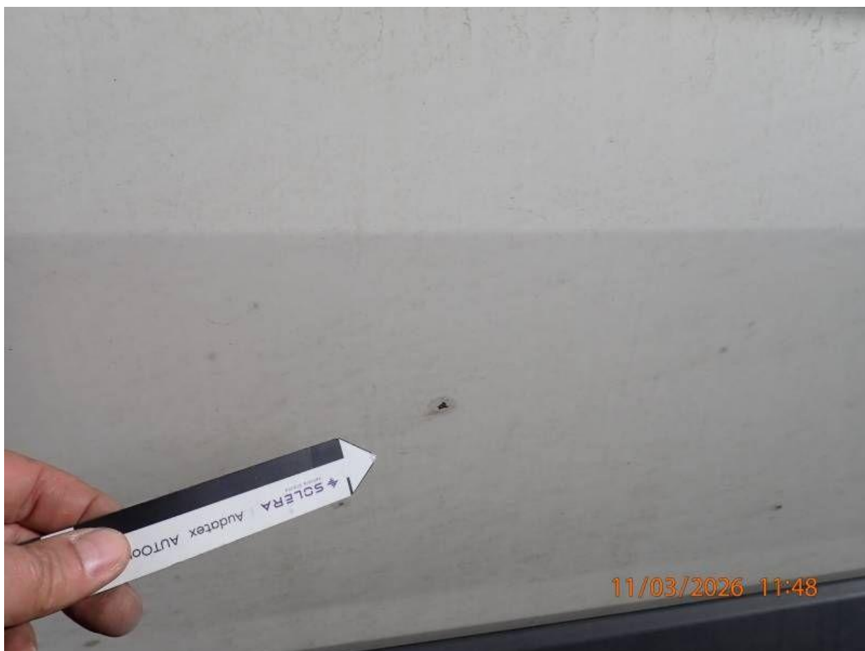
Fot. nr 104