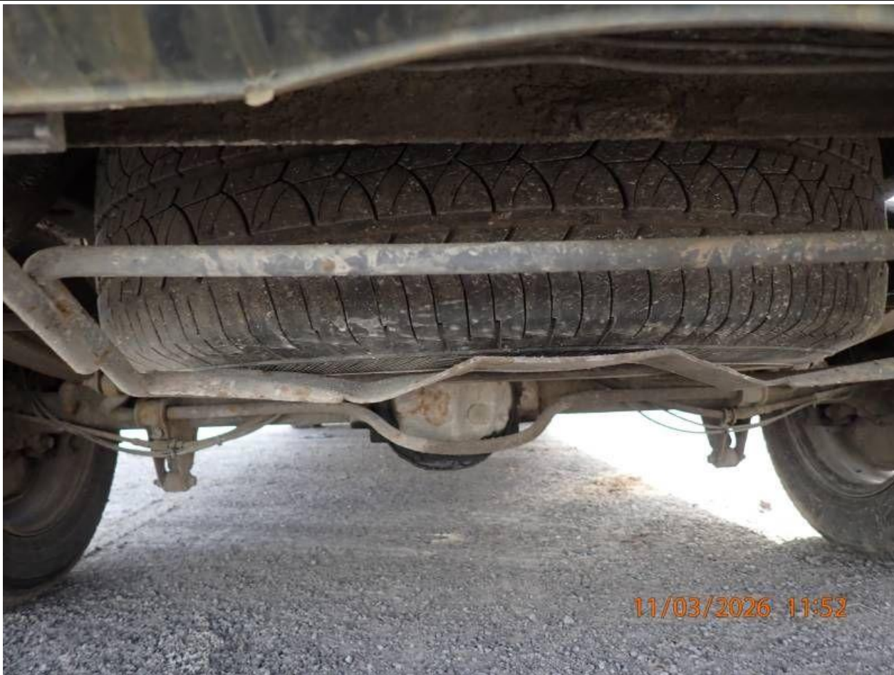
Fot. nr 117