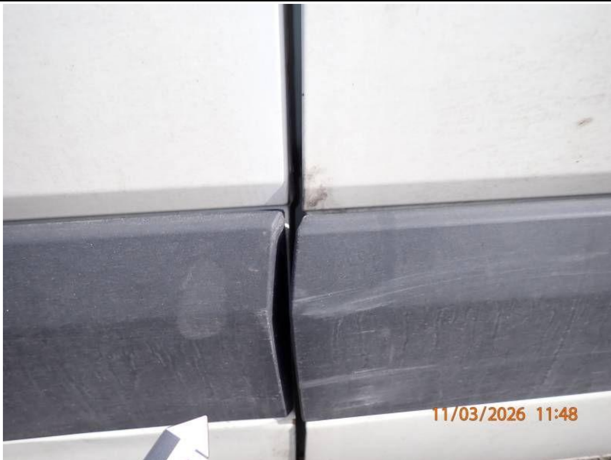
Fot. nr 103