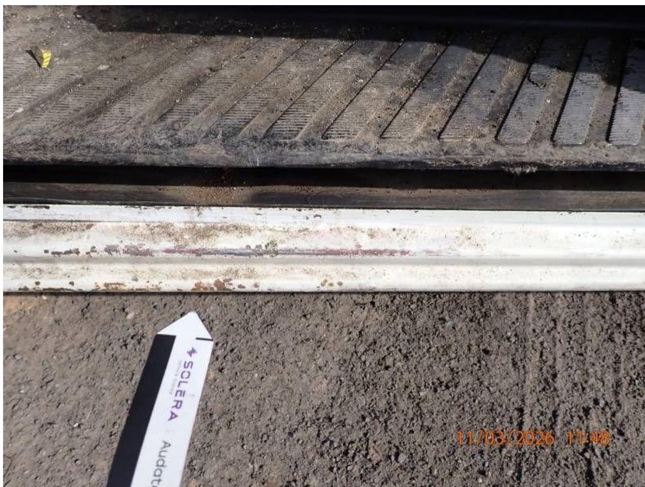
Fot. nr 108