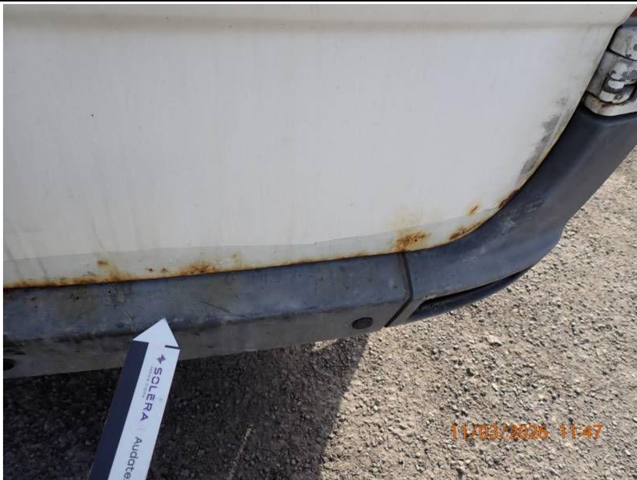
Fot. nr 91