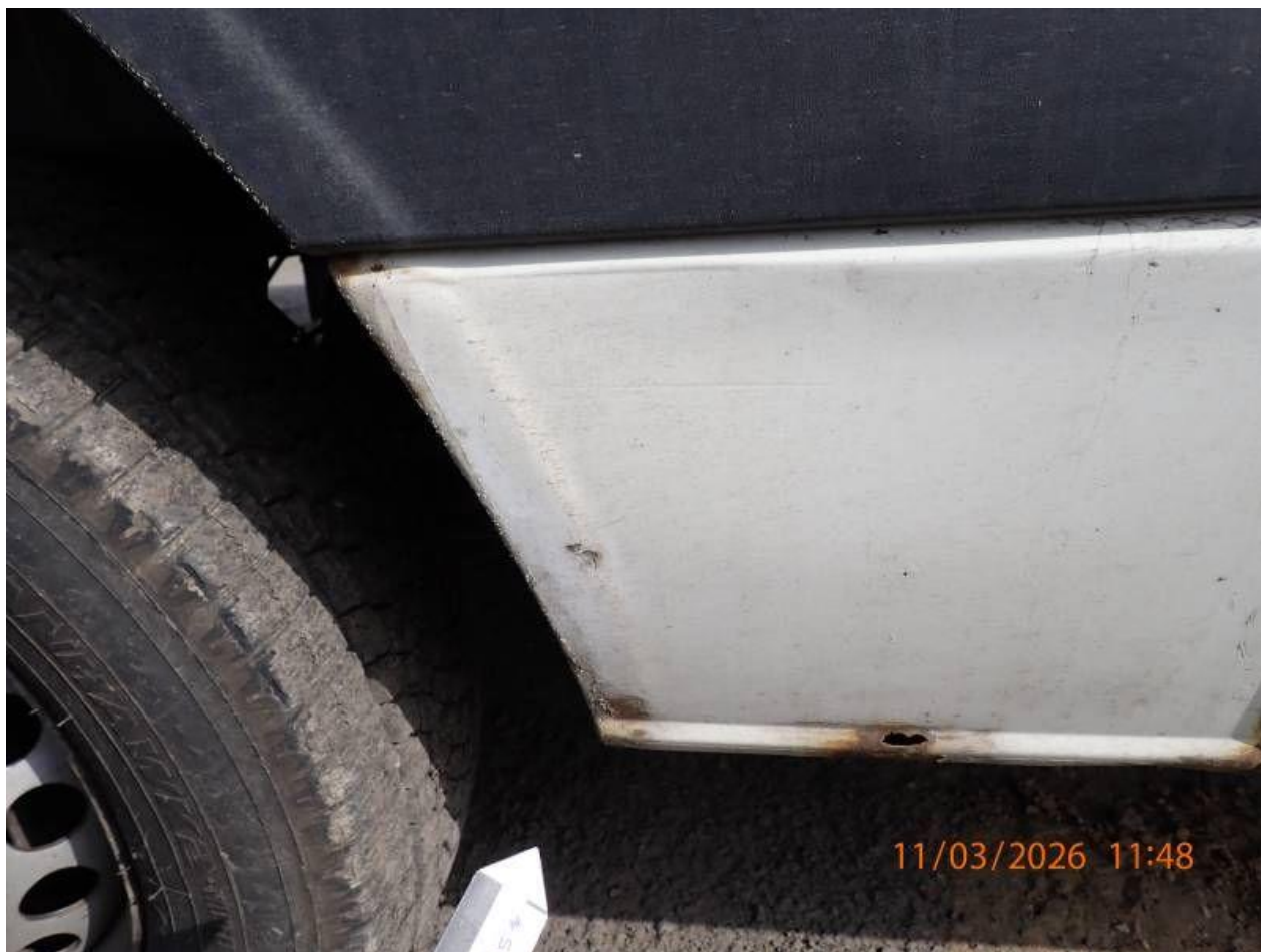
Fot. nr 102