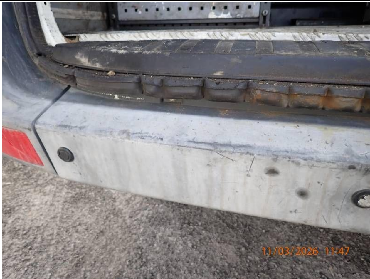
Fot. nr 79