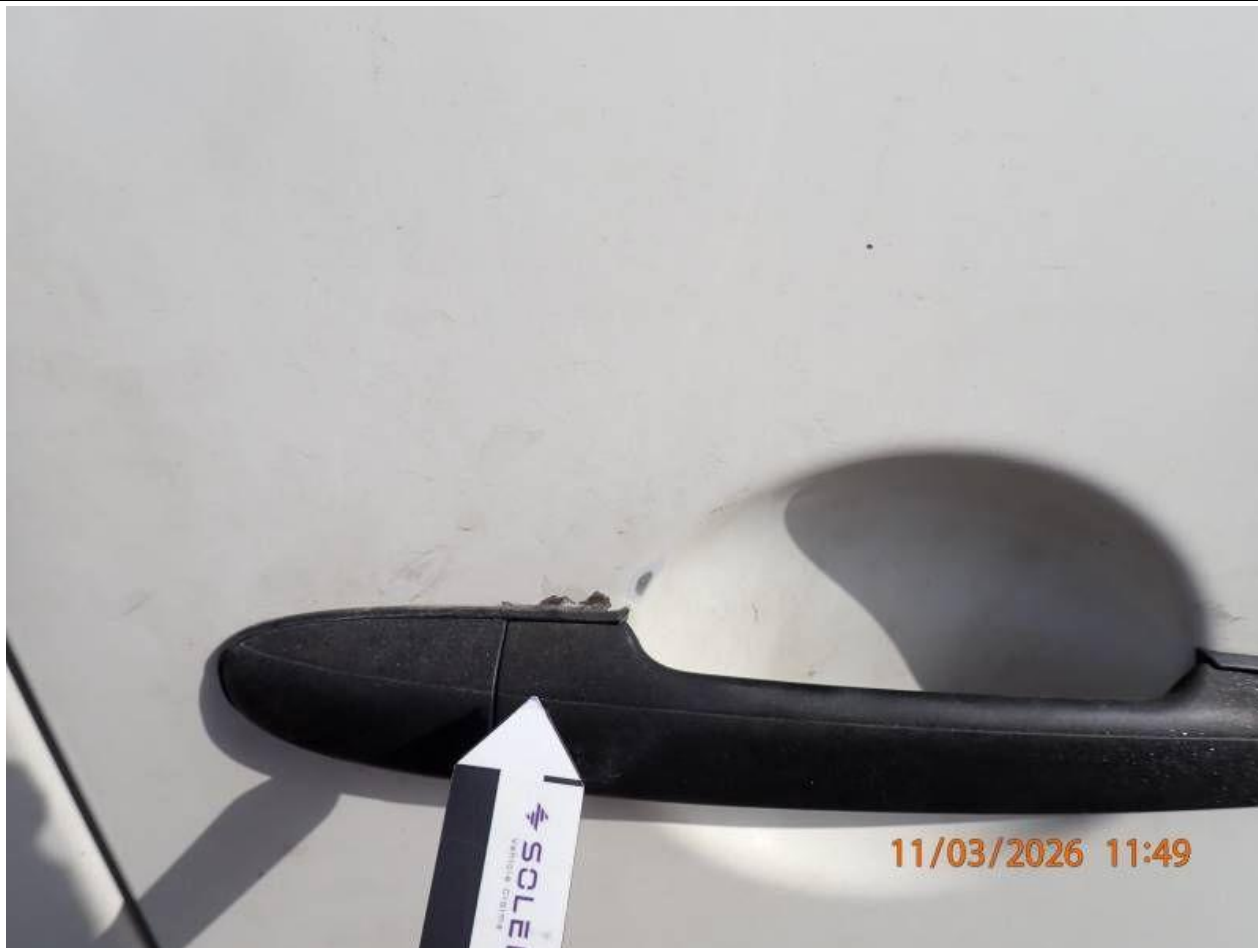
Fot. nr 113