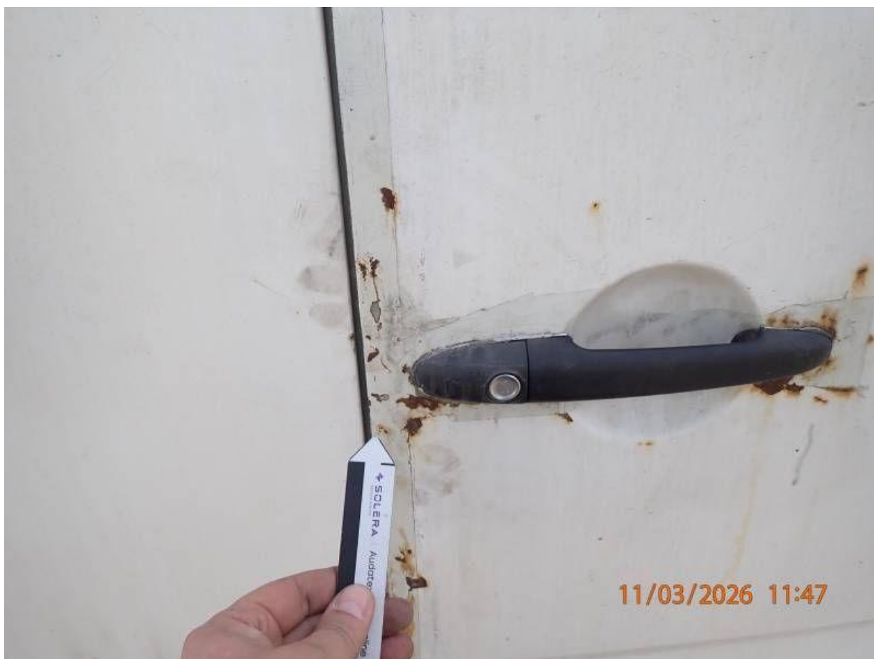
Fot. nr 88