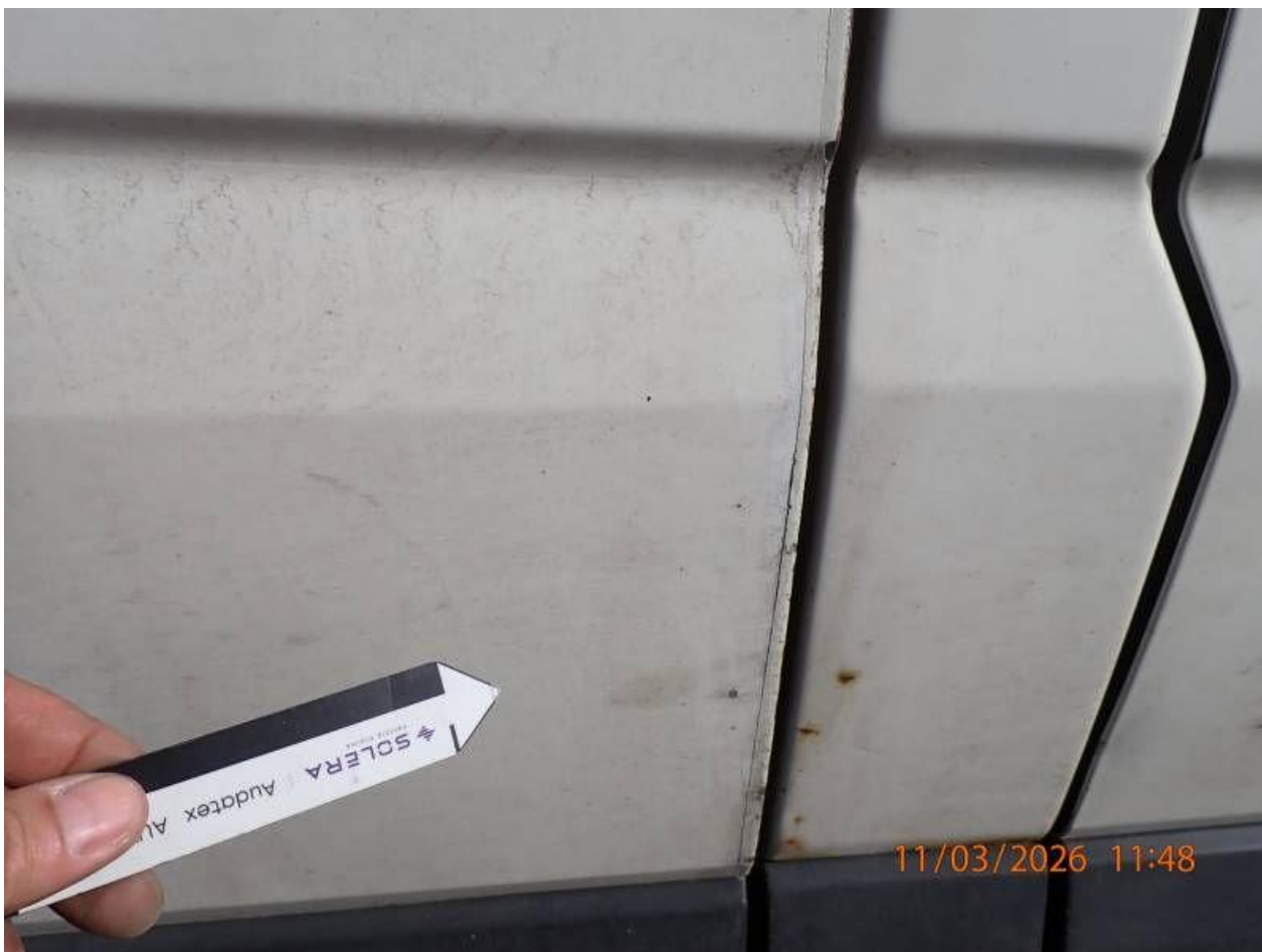
Fot. nr 106