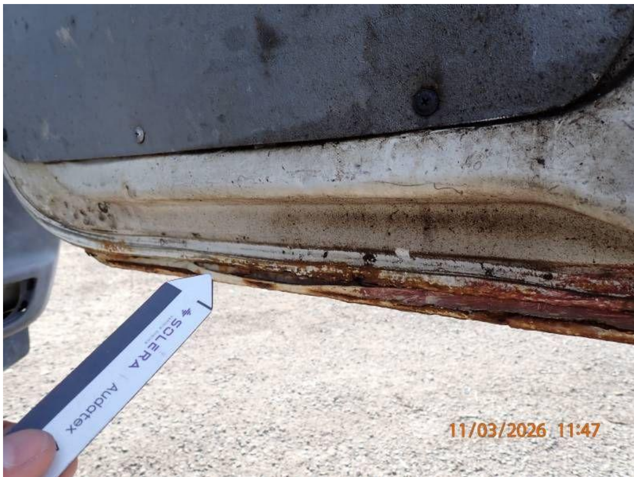
Fot. nr 84