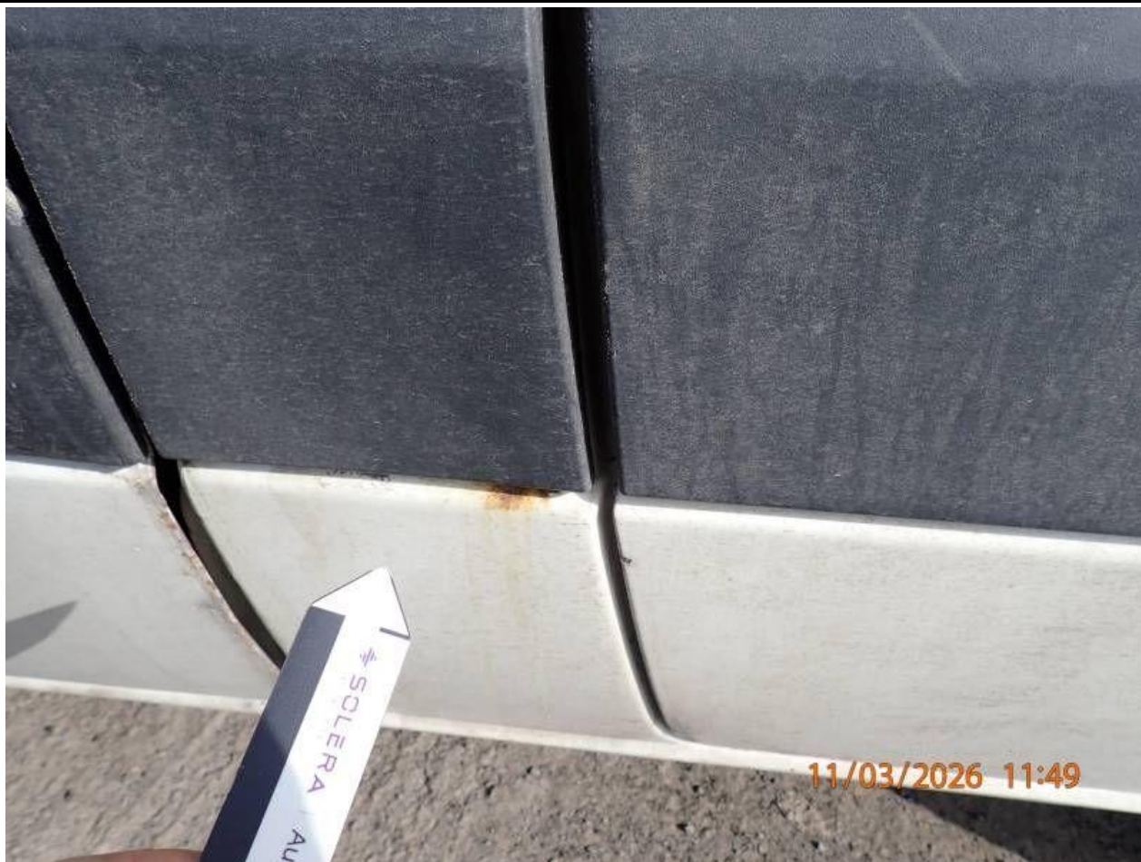
Fot. nr 111