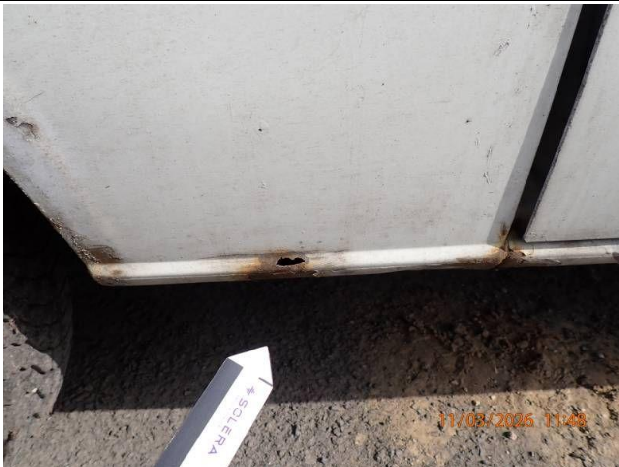
Fot. nr 101