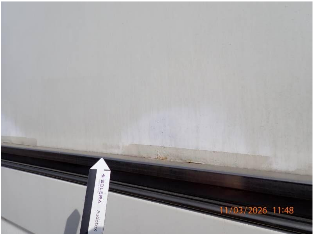
Fot. nr 96