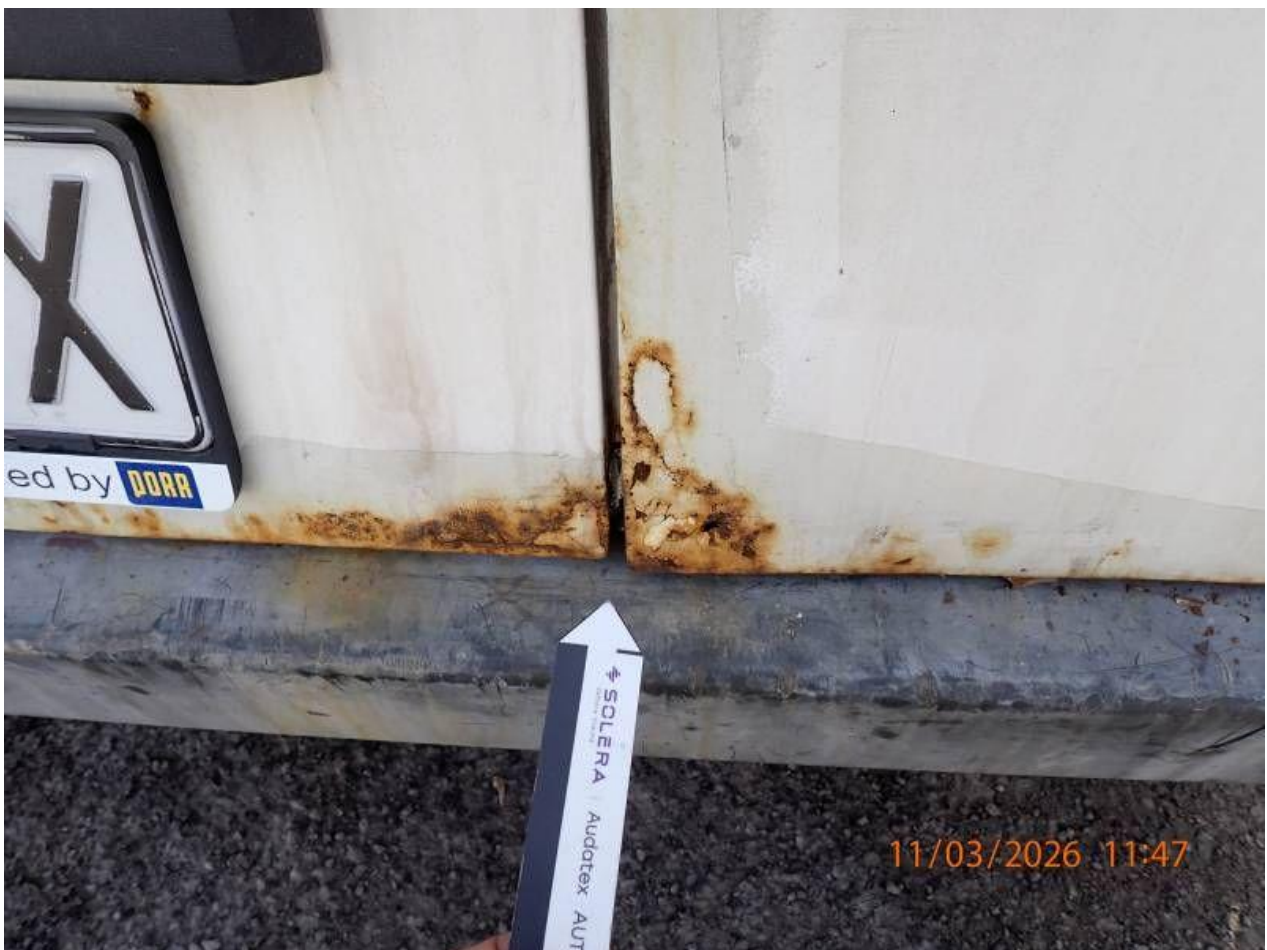
Fot. nr 90