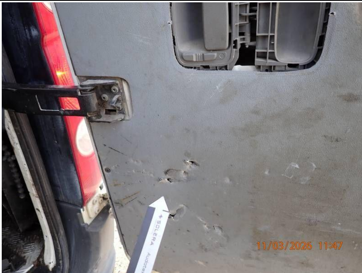
Fot. nr 85