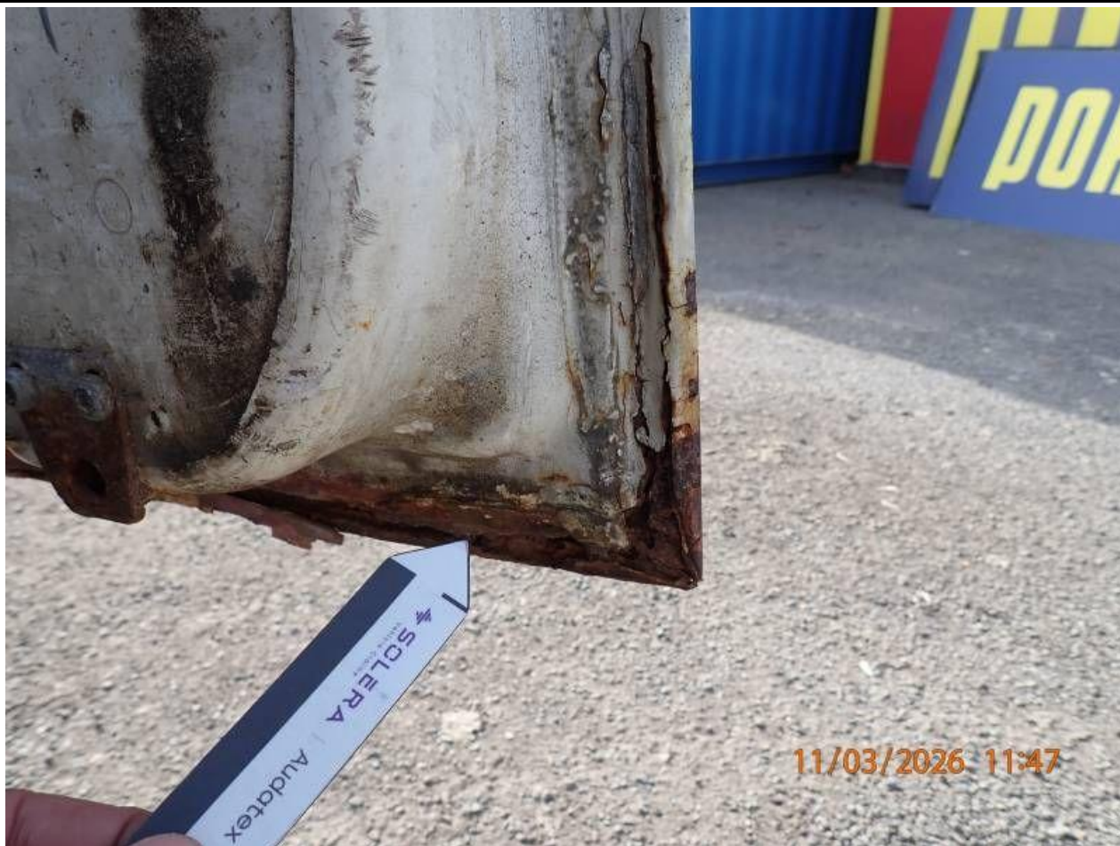
Fot. nr 83