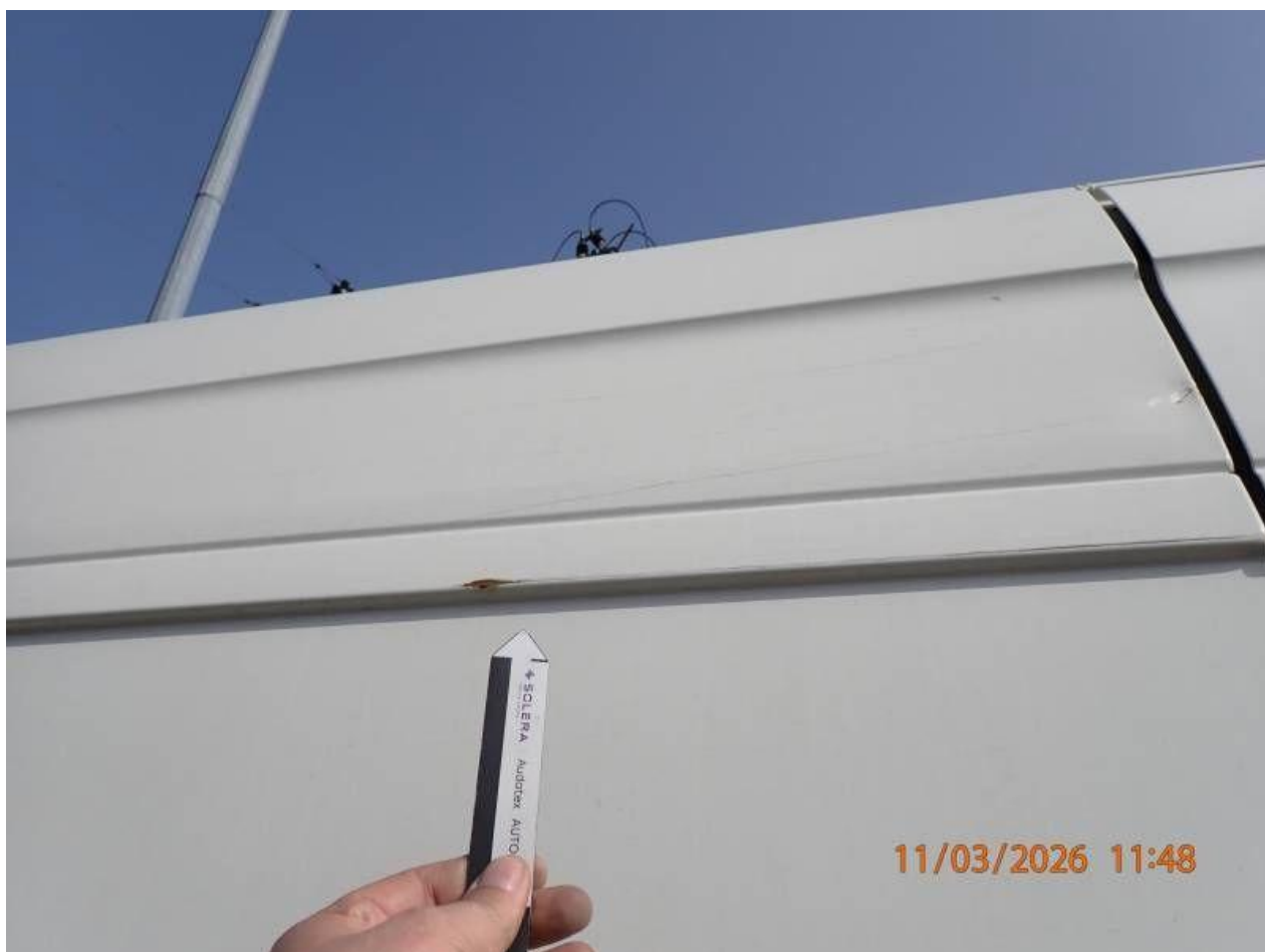
Fot. nr 94