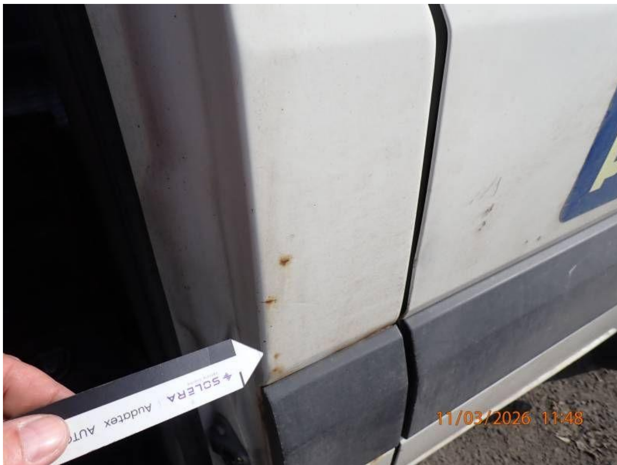
Fot. nr 110