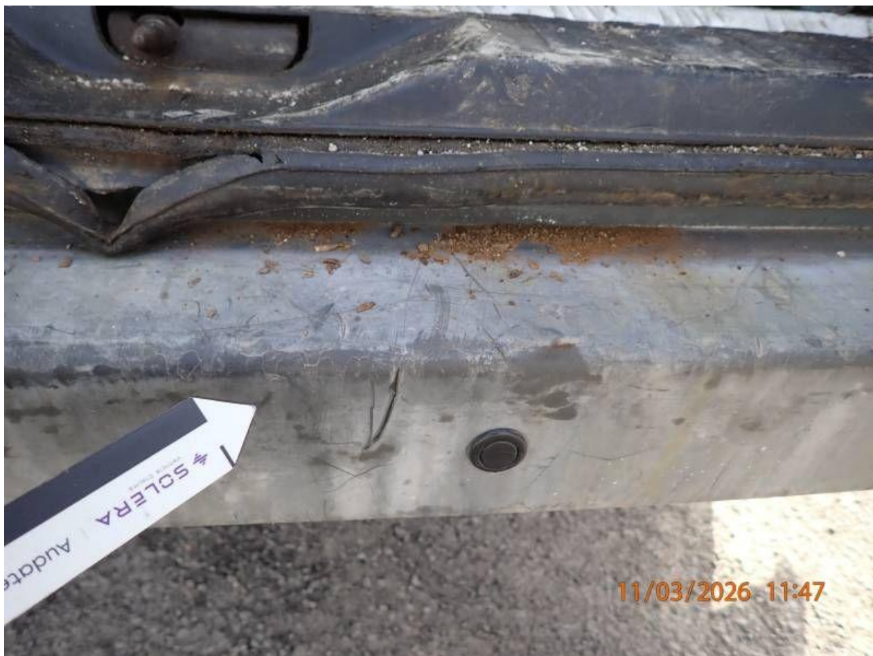
Fot. nr 80