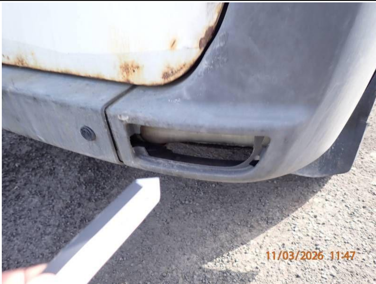
Fot. nr 93