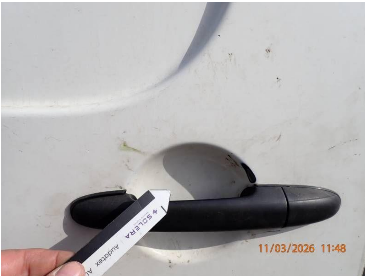
Fot. nr 105