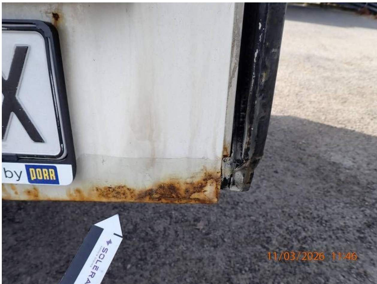
Fot. nr 74