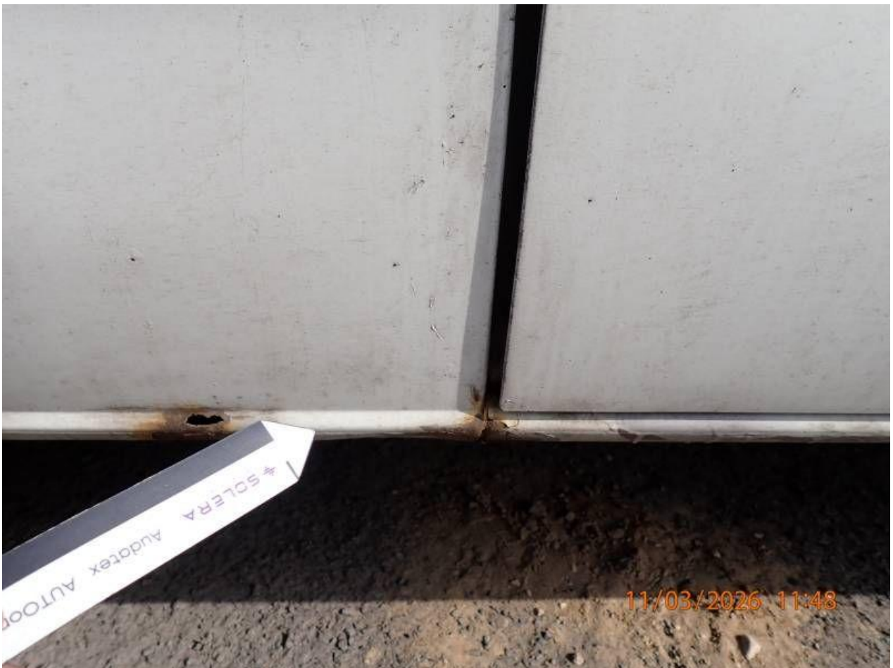
Fot. nr 100