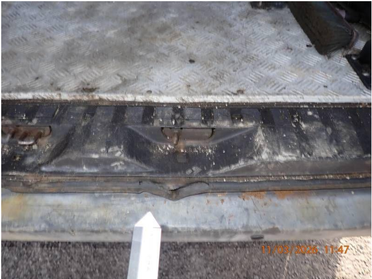
Fot. nr 77