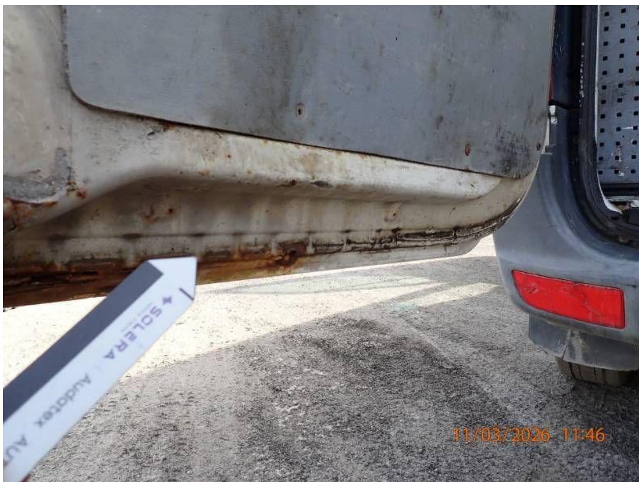
Fot. nr 76