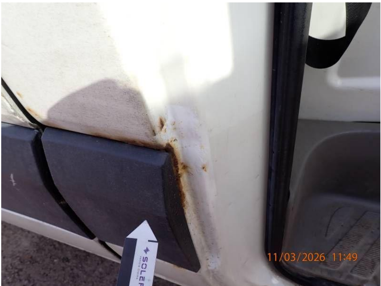
Fot. nr 116