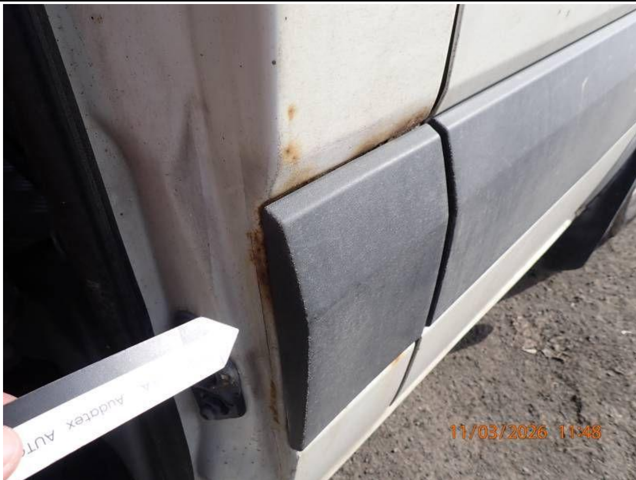
Fot. nr 109