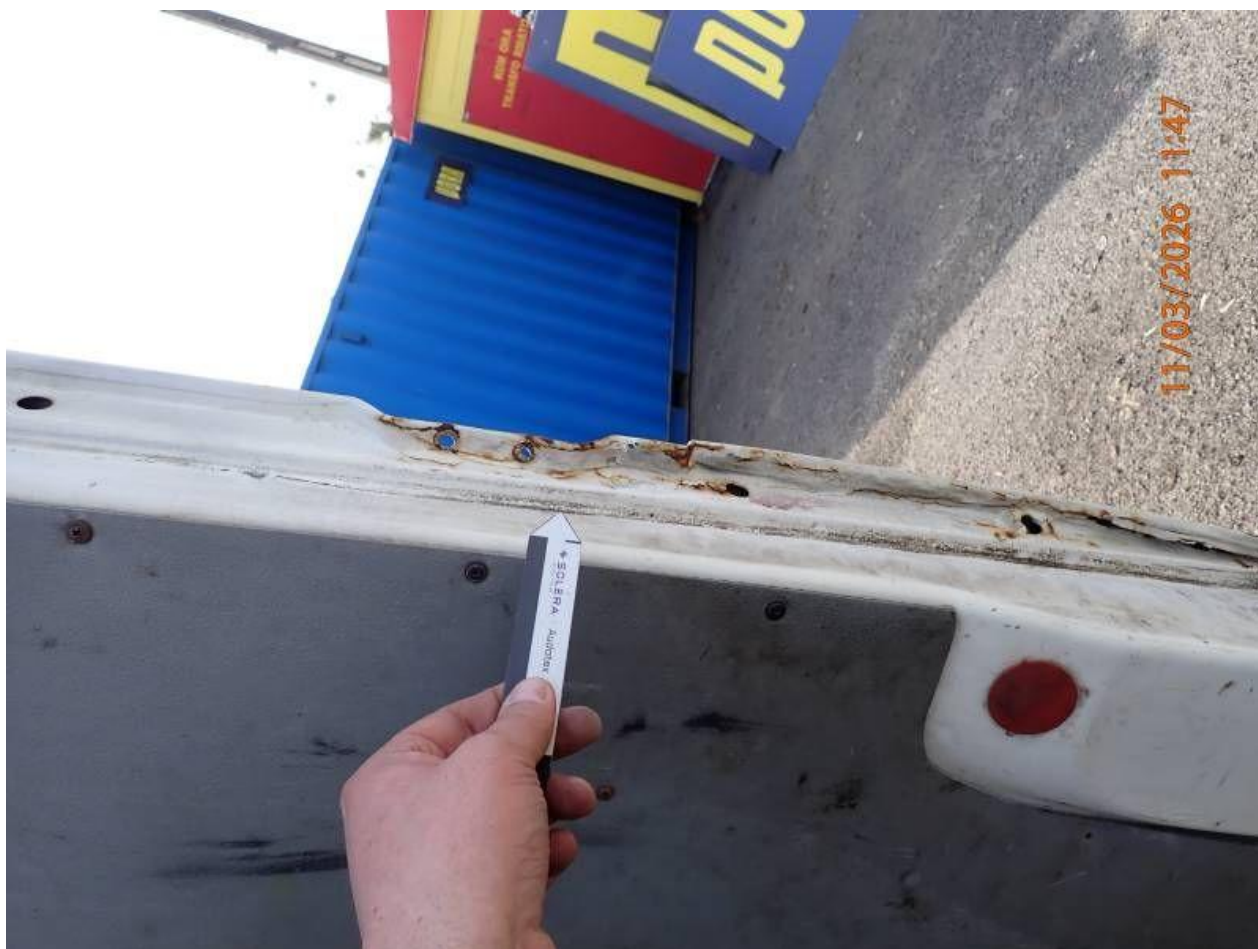
Fot. nr 82