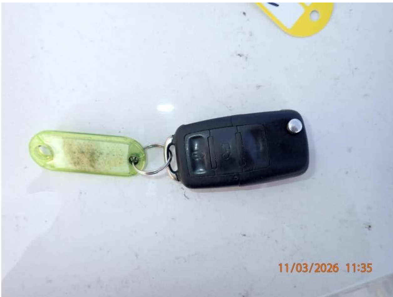
Fot. nr 118