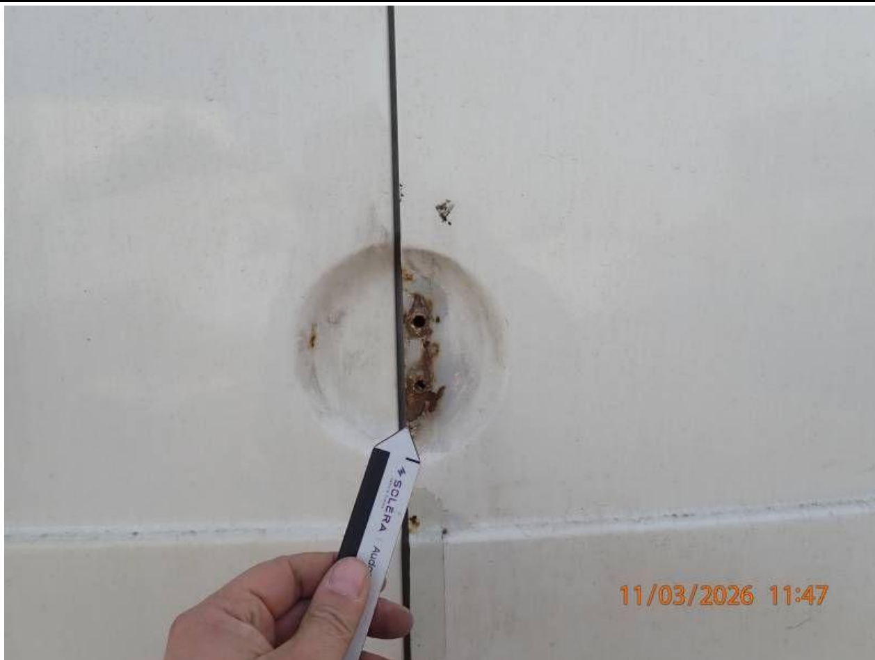
Fot. nr 87