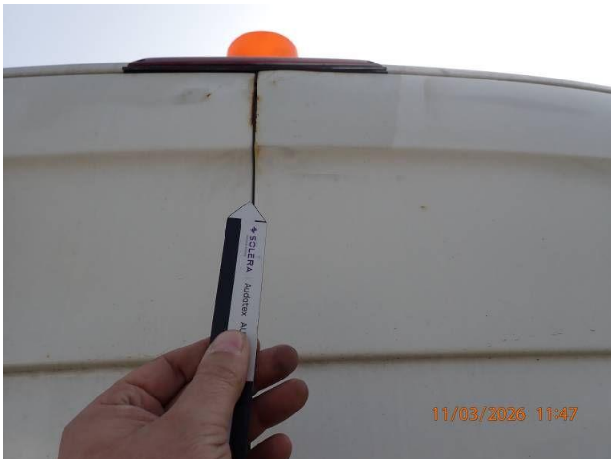
Fot. nr 92