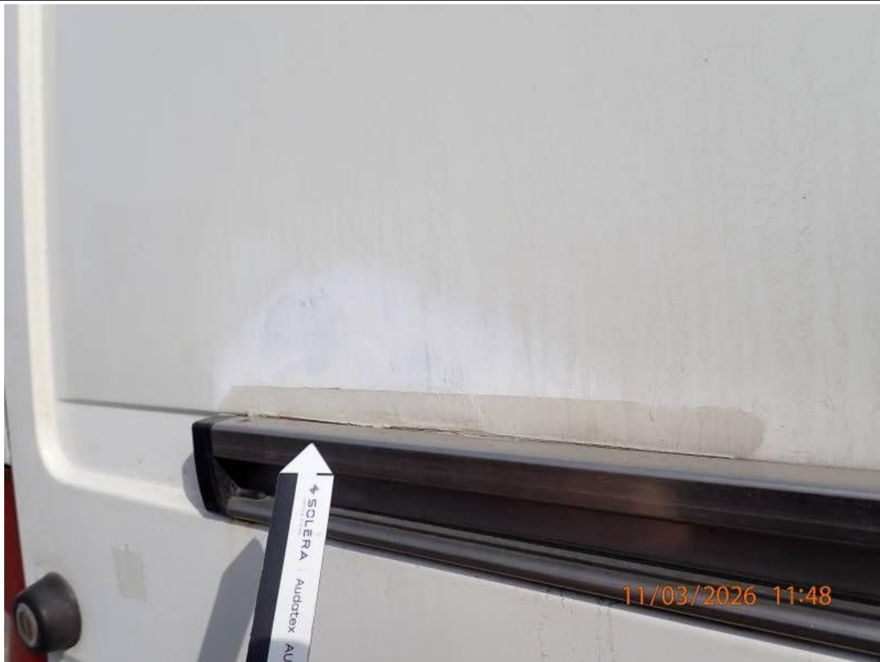
Fot. nr 97