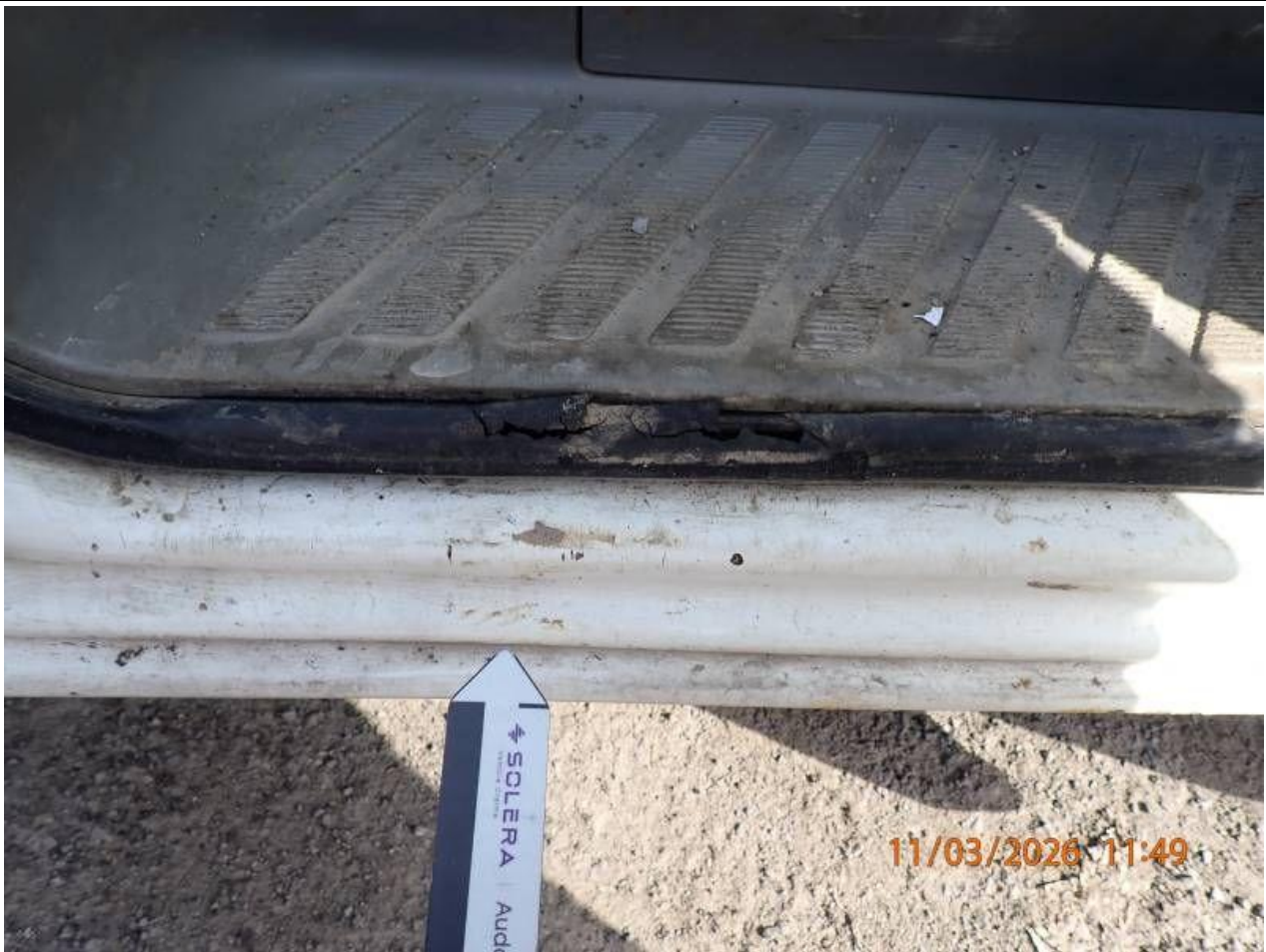
Fot. nr 115