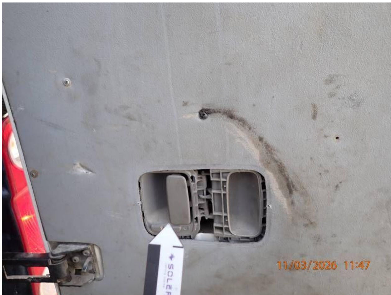
Fot. nr 86