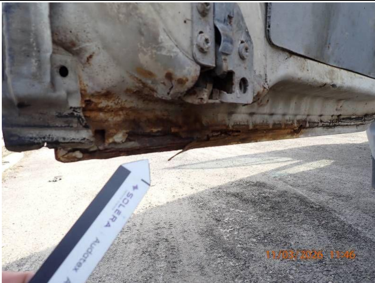
Fot. nr 75