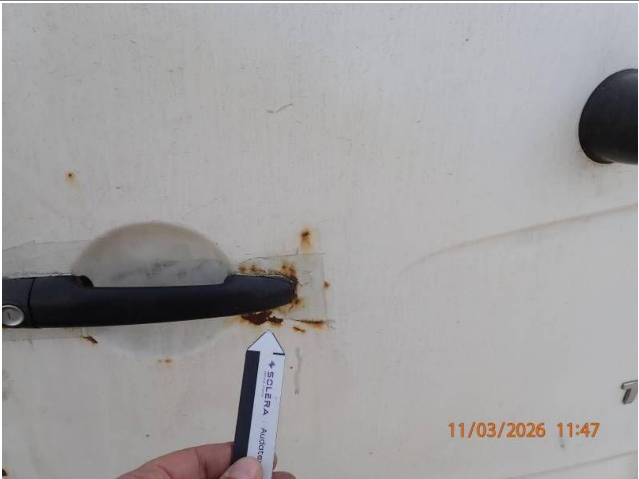
Fot. nr 89