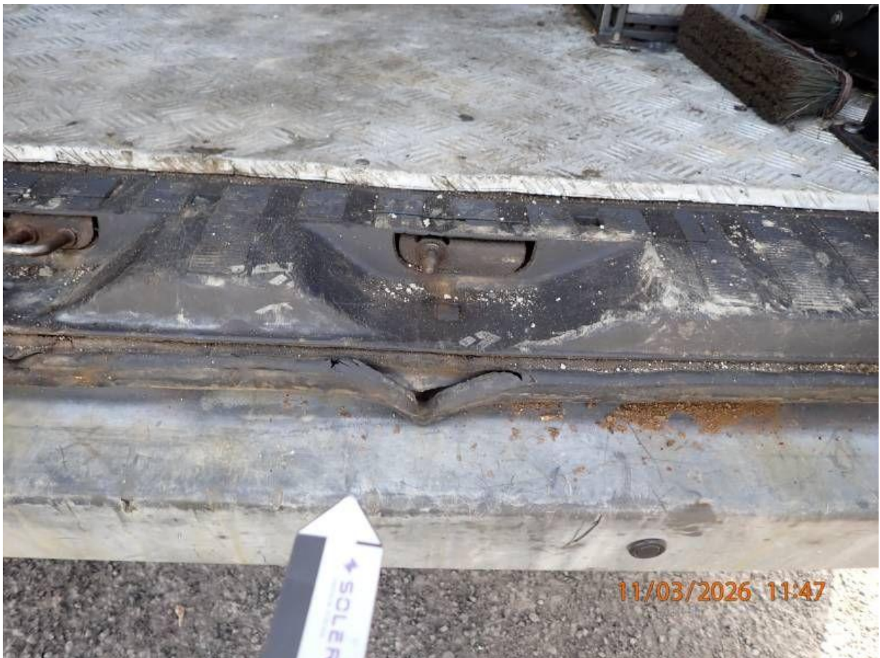
Fot. nr 78