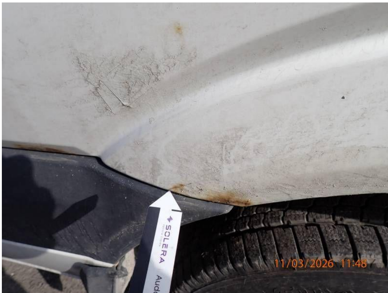
Fot. nr 98