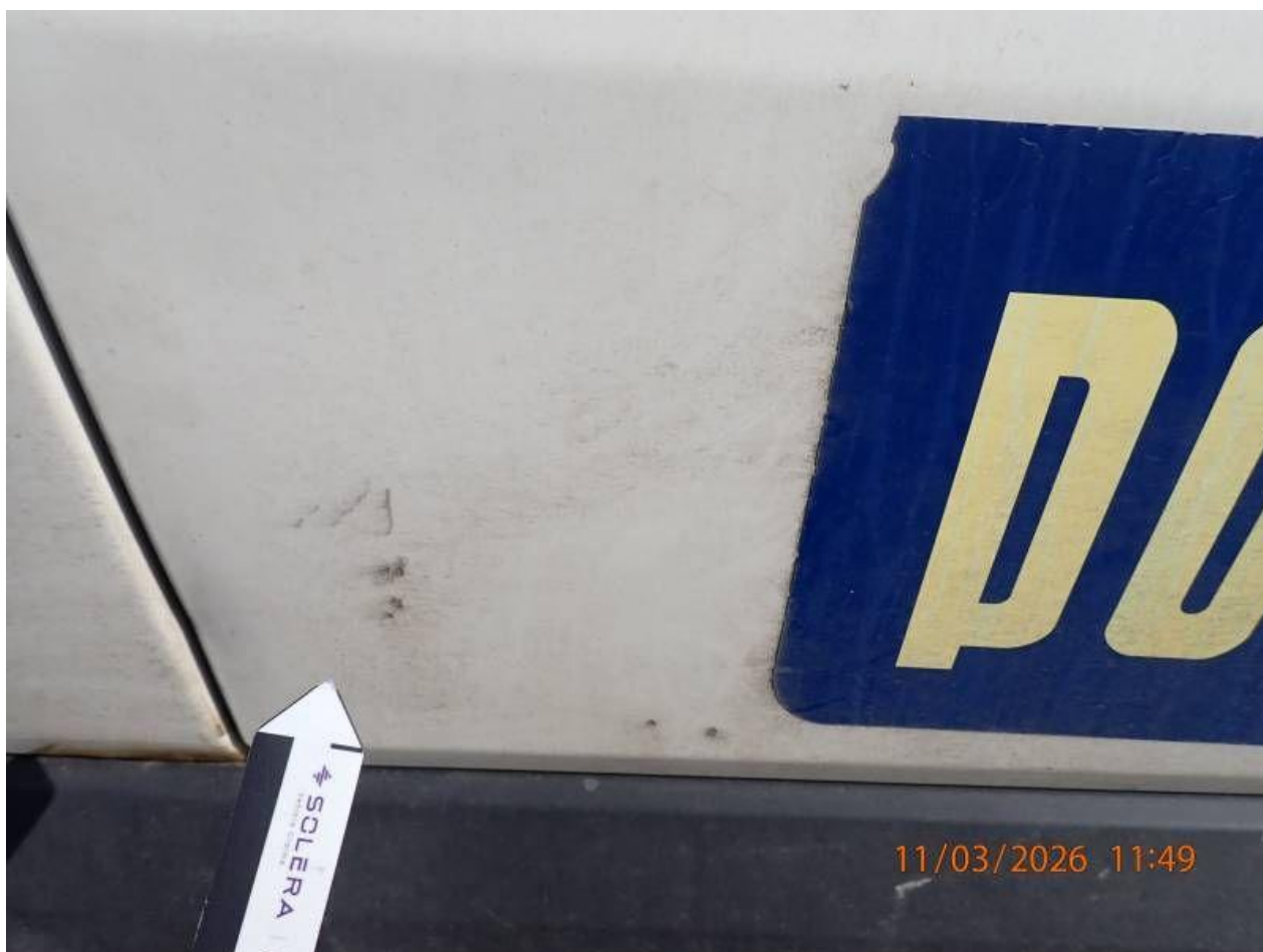
Fot. nr 112