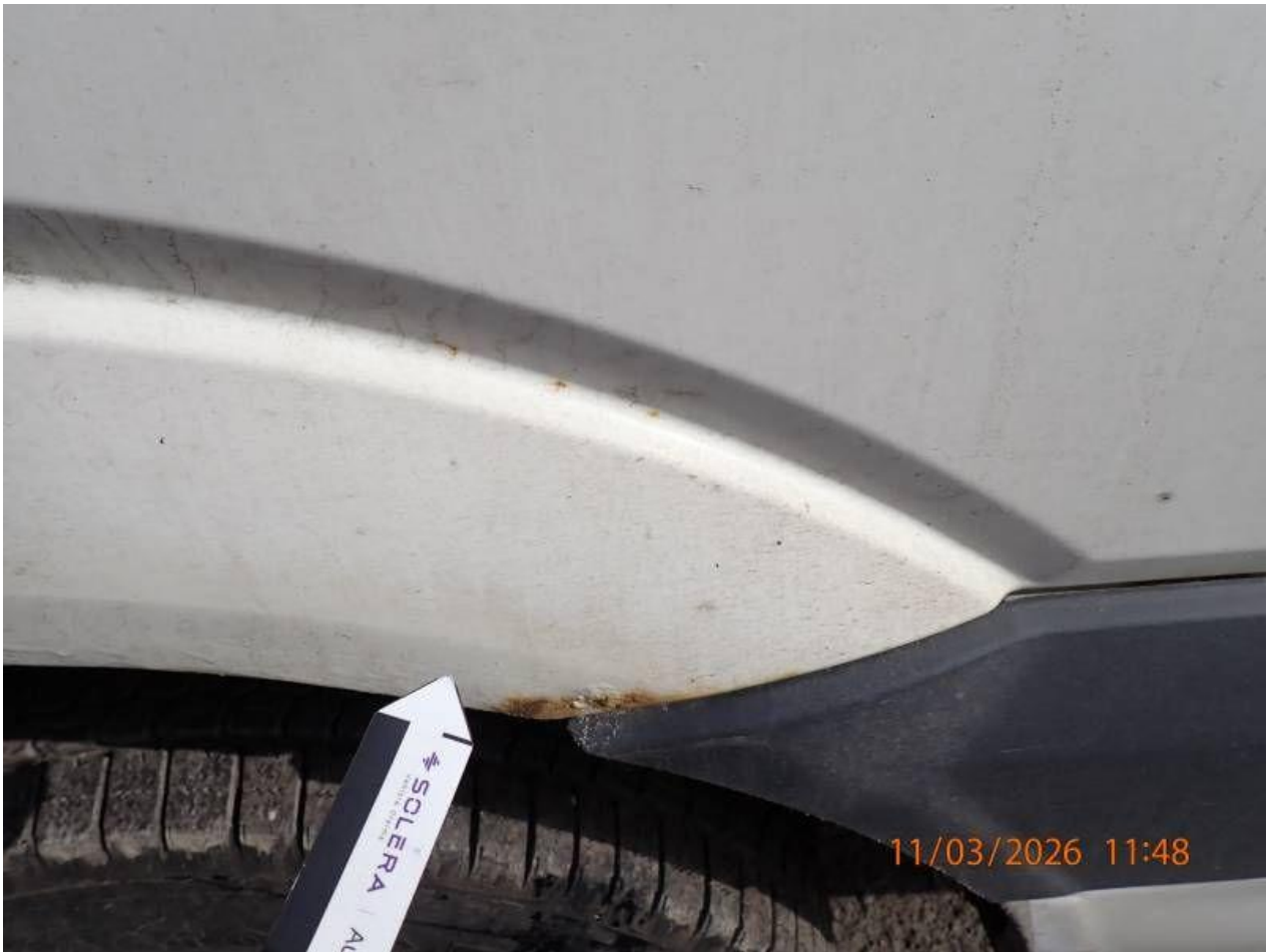
Fot. nr 99