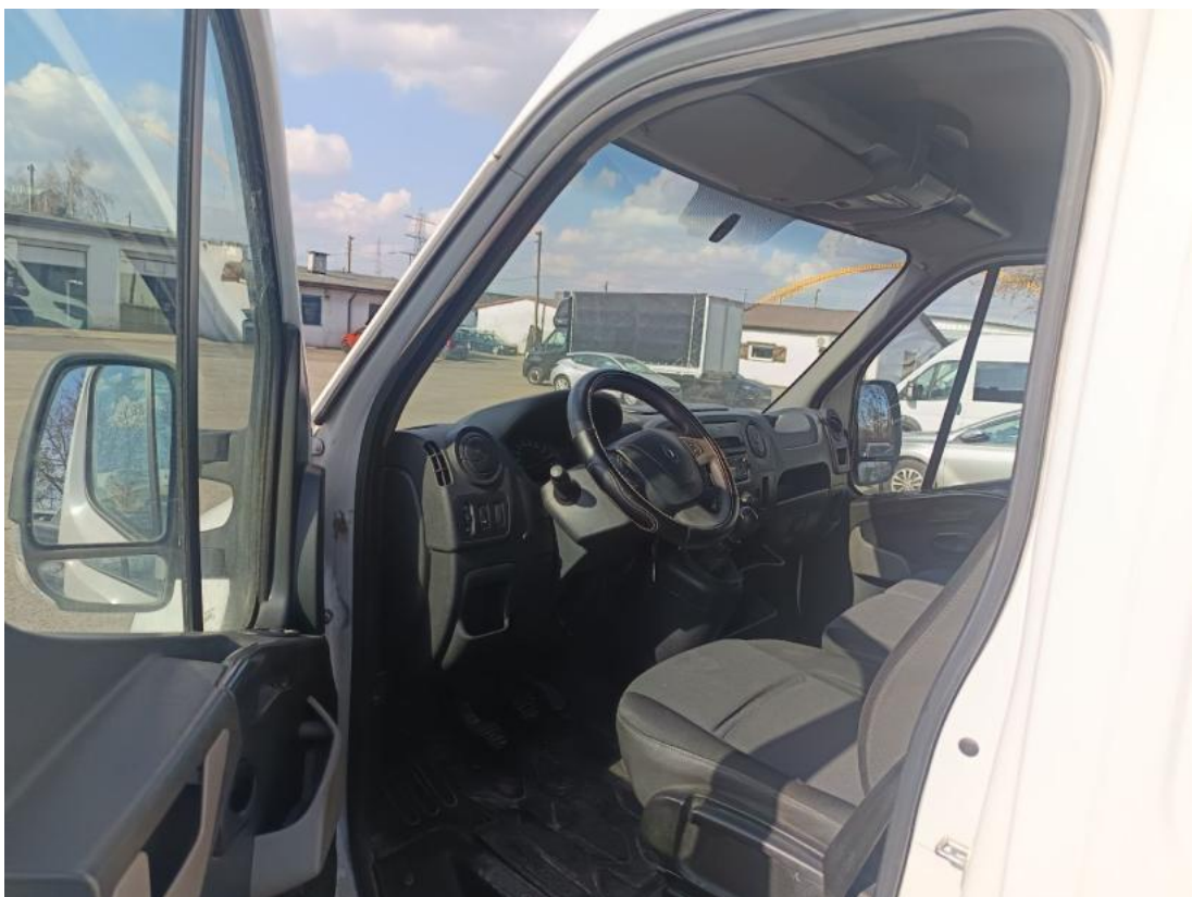
Fot. 16 Widok przez otwarte drzwi przednie lewe