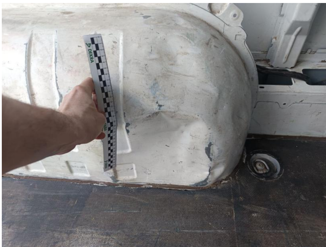
Fot. 36 nadkole tylne lewe