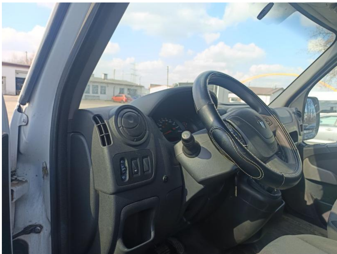
Fot. 21 Kierownica z lewej strony