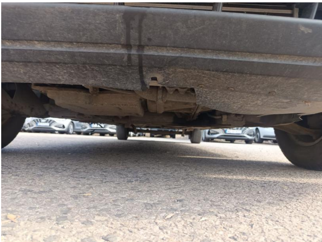
Fot. 25 Spód pojazdu przód