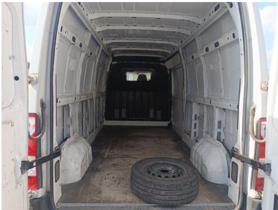
Fot. 23 Bagażnik