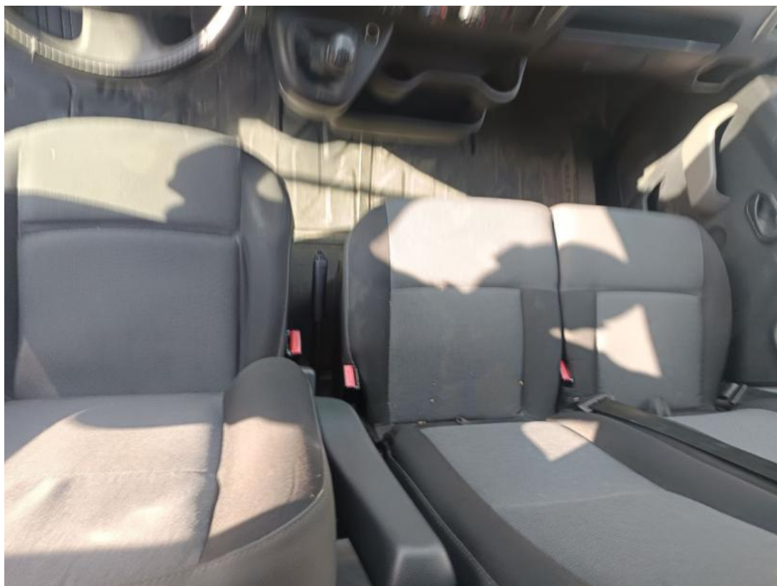
Fot. 19 Tunel środkowy