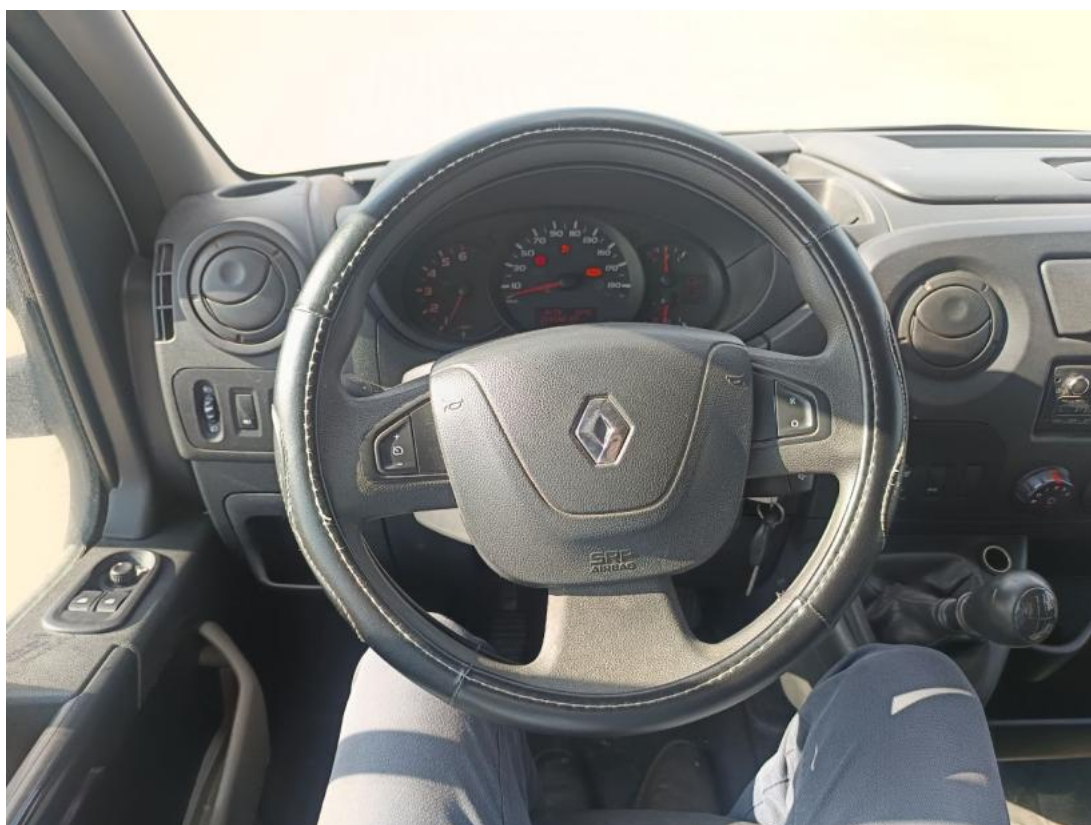
Fot. 20 Kierownica (na wprost)