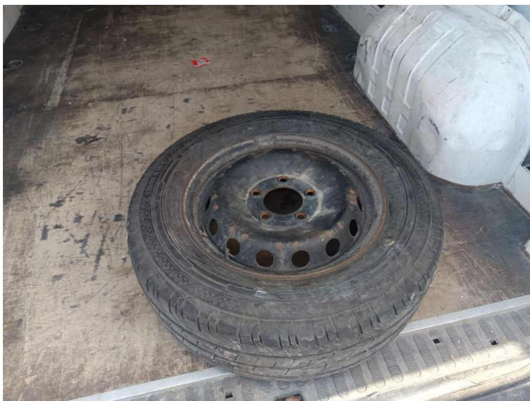
Fot. 24 Koło zapasowe