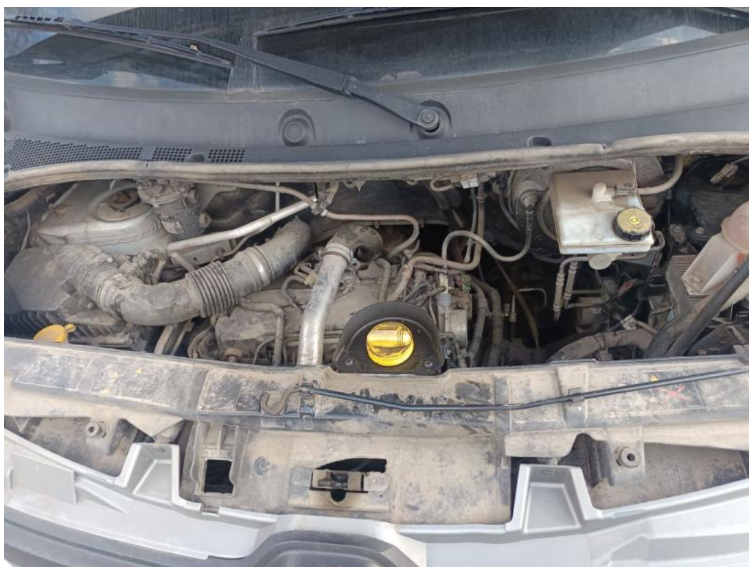
Fot. 22 Komora silnika