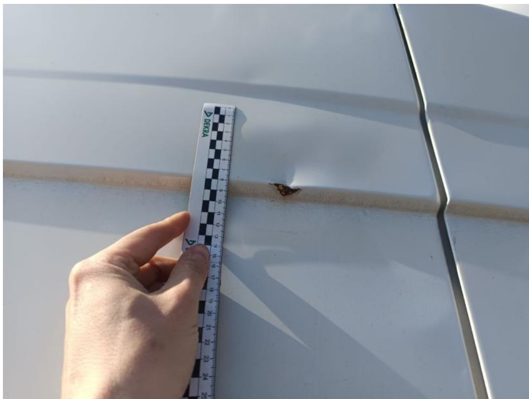
Fot. 37 Drzwi tylne lewe