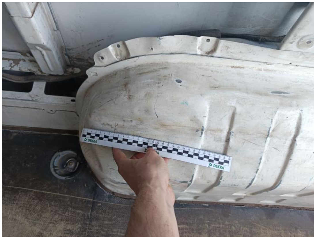
Fot. 35 nadkole tylne prawe