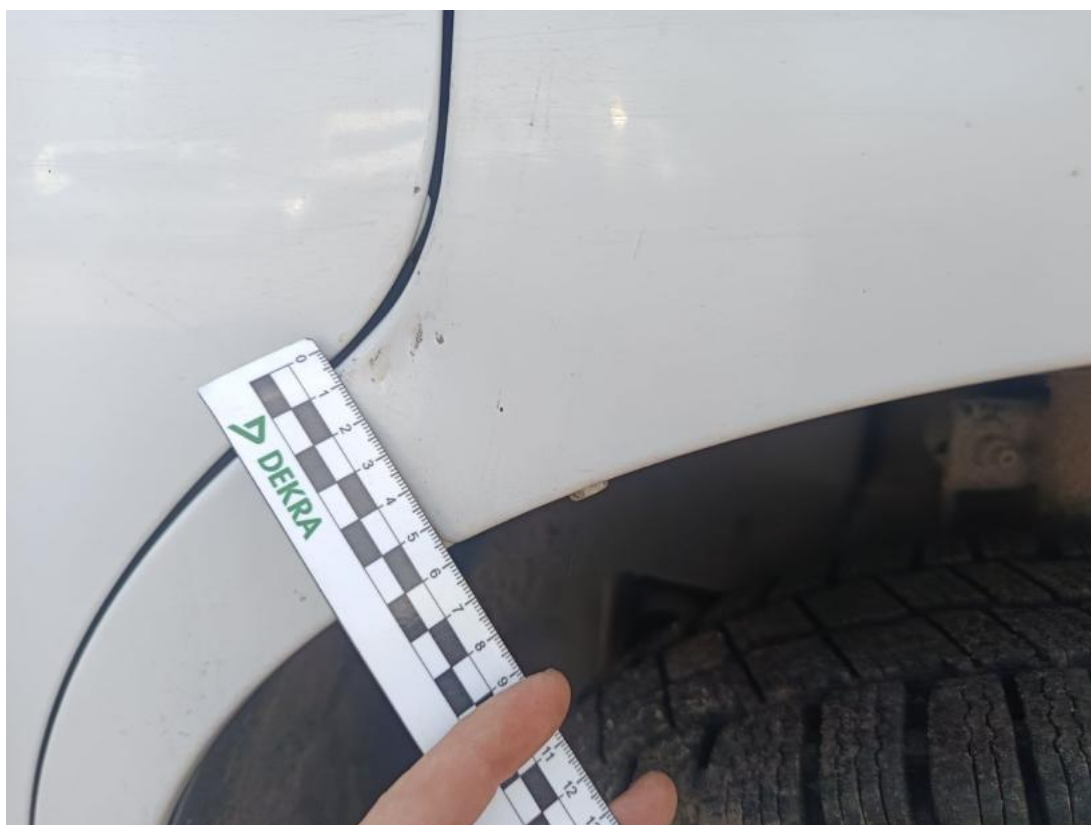
Fot. 38 Błotnik przedni P - zdjęcie poglądowe 1