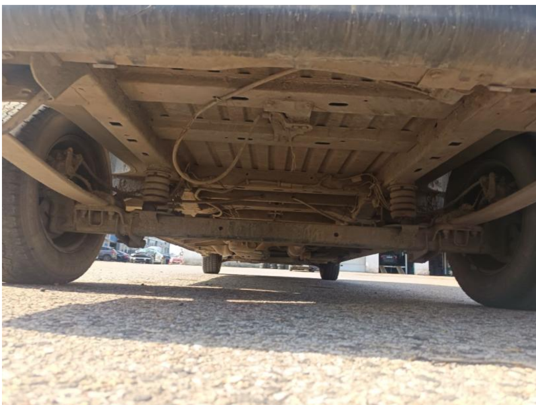
Fot. 26 Spód pojazdu tył