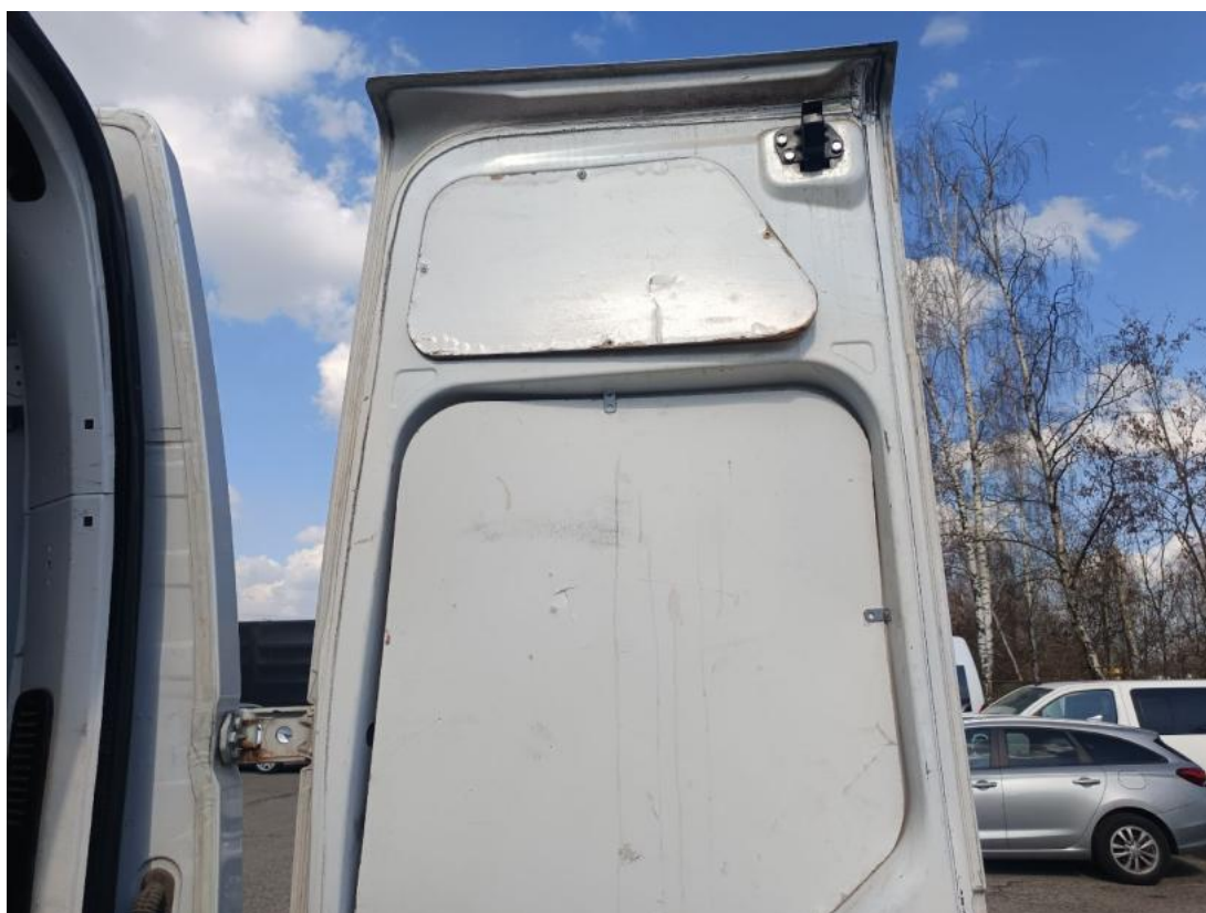
Fot. 74 Wykładzina pokrywy tylnej() - Pęknięcie/rozerwanie 3