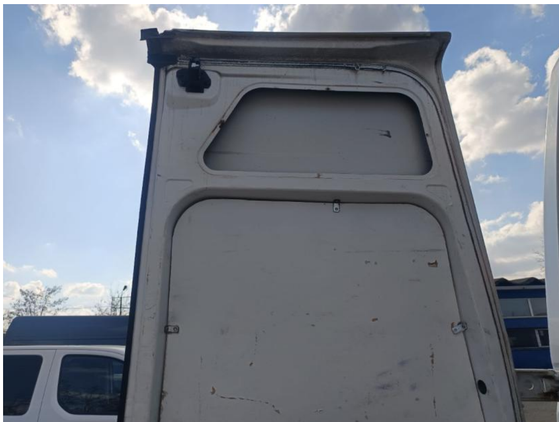
Fot. 73 Wykładzina pokrywy tylnej - Pęknięcie/rozerwanie 2