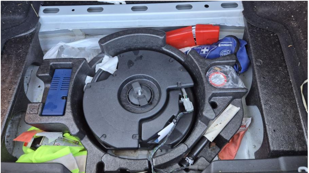
Fot. 33 Zestaw naprawy koła