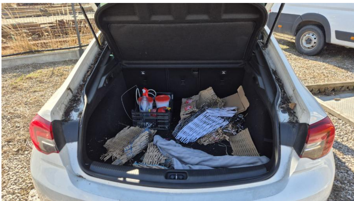
Fot. 24 Bagażnik