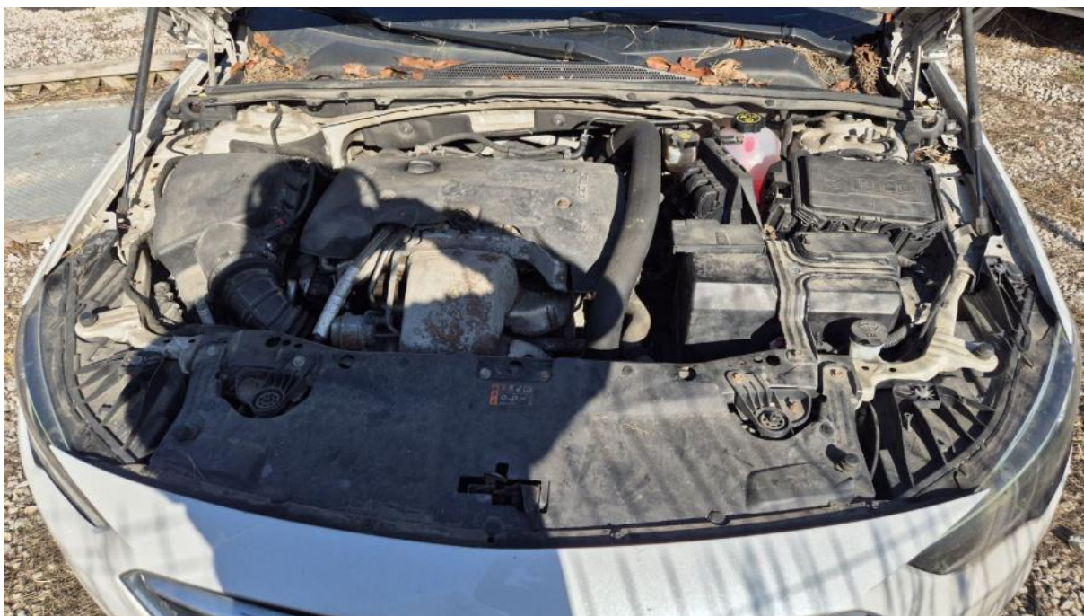
Fot. 23 Komora silnika