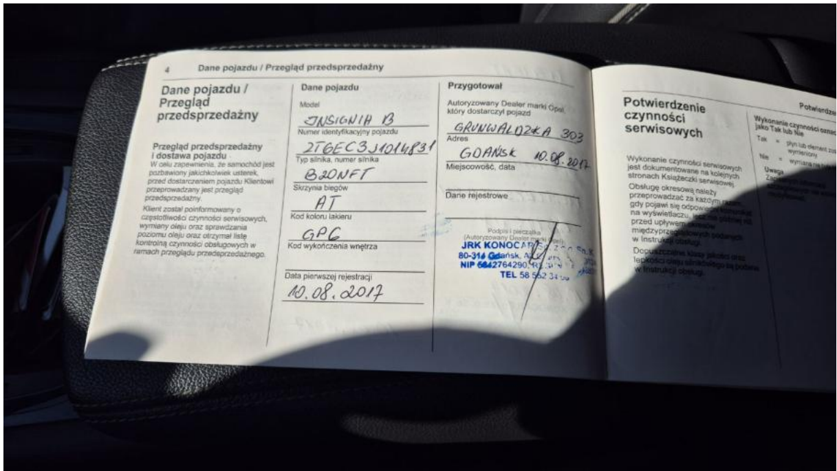
Fot. 11 Książka serwisowa – dane