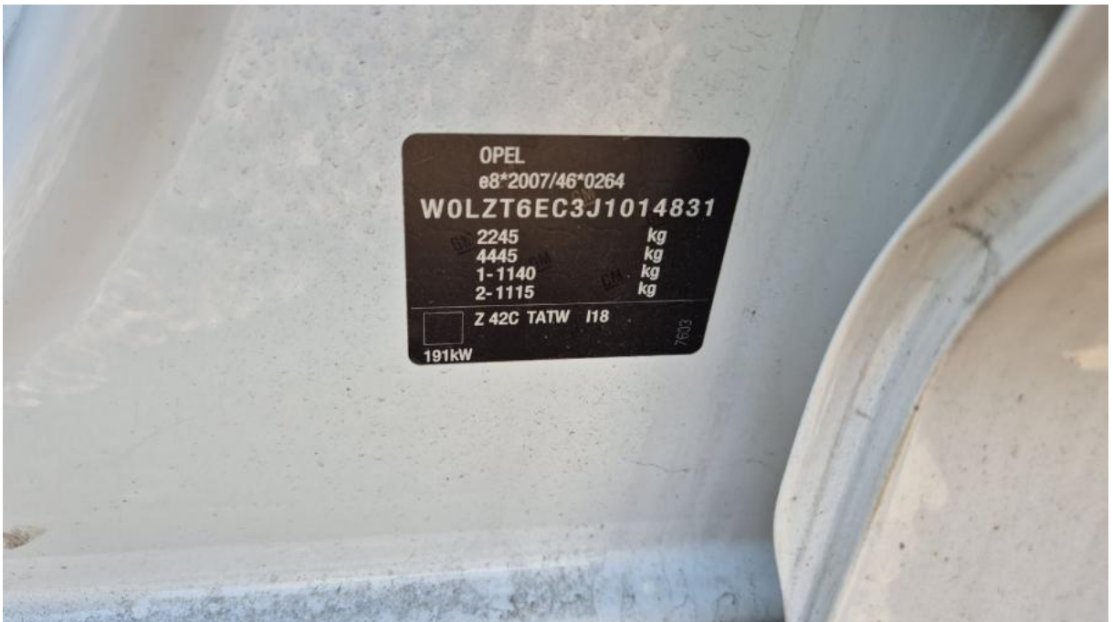
Fot. 14 Tabliczka znamionowa