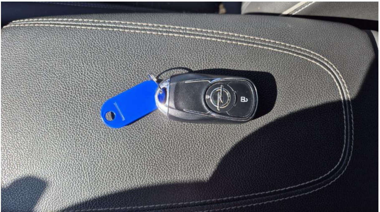
Fot. 34 Zdjęcie do protokołu