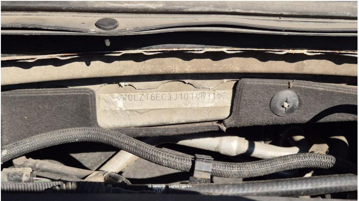
Fot. 13 Numer identyfikacyjny