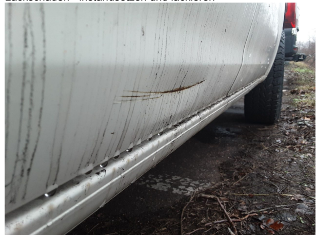
Beschädigung #5: Karosserie: Karosserie - Delle / Lackschaden - instandsetzen und lackieren