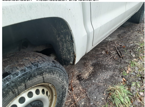
Beschädigung #5: Karosserie: Karosserie - Delle / Lackschaden - instandsetzen und lackieren