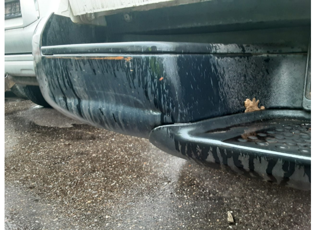
Beschädigung #6: Stossfänger hinten: Stossfänger hinten - beschädigt - erneuern