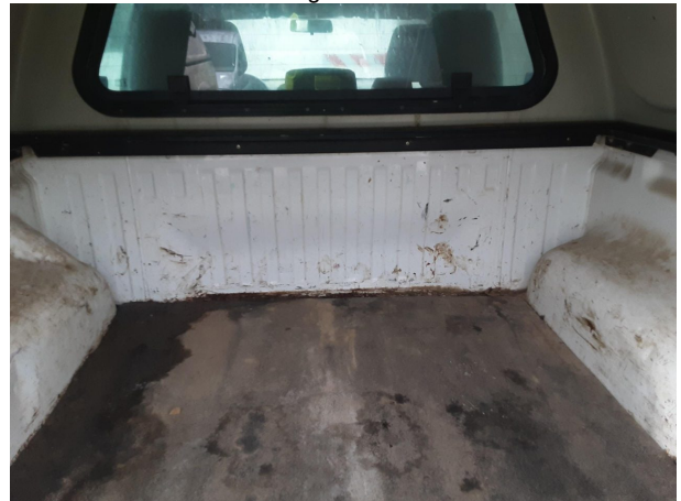
Beschädigung #4: Interieur: Innenraum (Laderaum) - verschlissen - Wertminderung