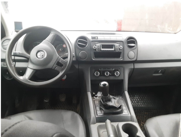
Abbildung 9: Instrumententafel