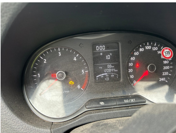
Abbildung 5: Kombiinstrument