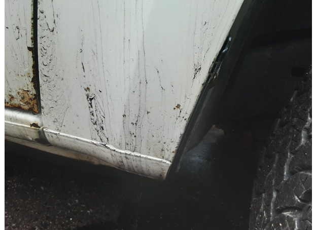
Beschädigung #5: Karosserie: Karosserie - Delle / Lackschaden - instandsetzen und lackieren