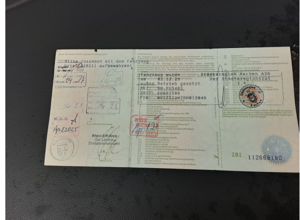
Abbildung 14: Dokumente