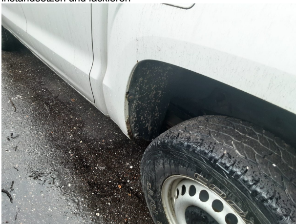
Beschädigung #5: Karosserie: Karosserie - Delle / Lackschaden - instandsetzen und lackieren