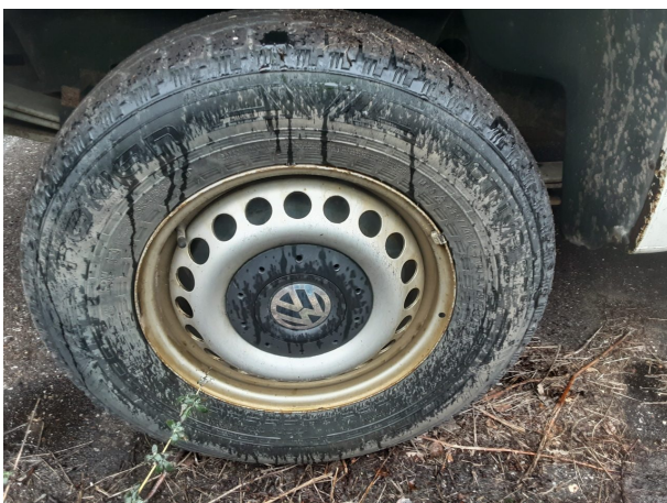
Abbildung 17: Montierte Bereifung