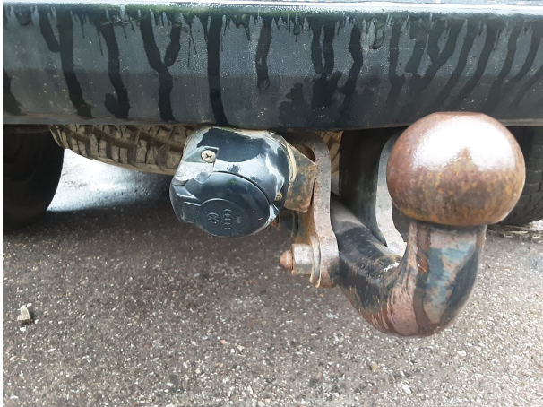
Abbildung 25: Sonstiges