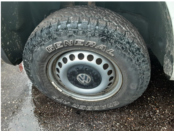
Abbildung 15: Montierte Bereifung