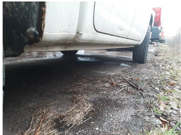
Abbildung 22: Sonstiges