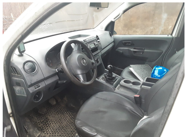
Abbildung 6: Innenraum vorne