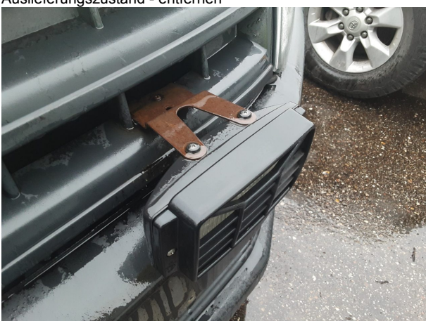
Beschädigung #7: Sonstiges: Fahrzeug - abweichend Auslieferungszustand - entfernen