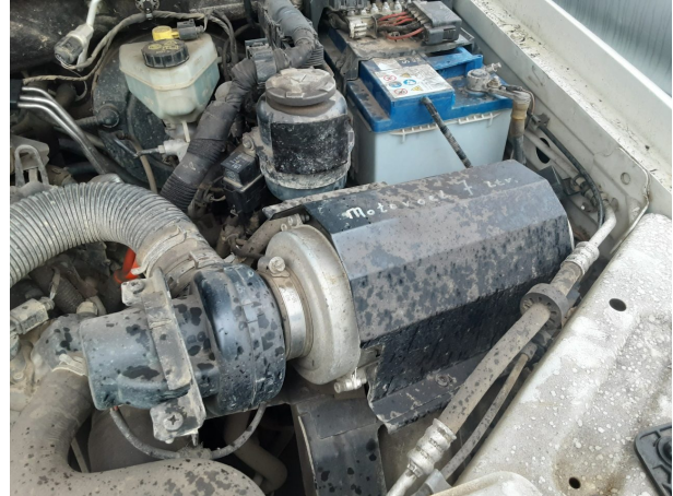
Abbildung 20: Sonstiges