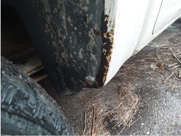
Beschädigung #5: Karosserie: Karosserie - Delle / Lackschaden - instandsetzen und lackieren