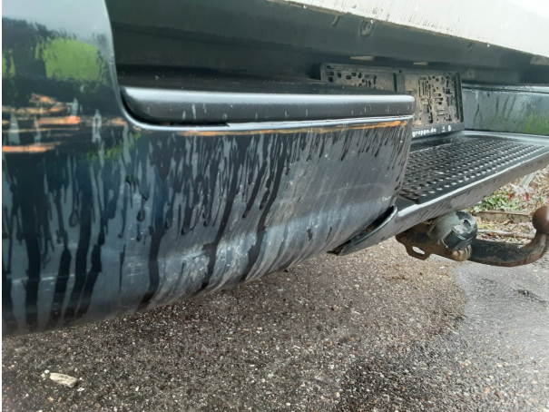
Beschädigung #6: Stossfänger hinten: Stossfänger hinten - beschädigt - erneuern