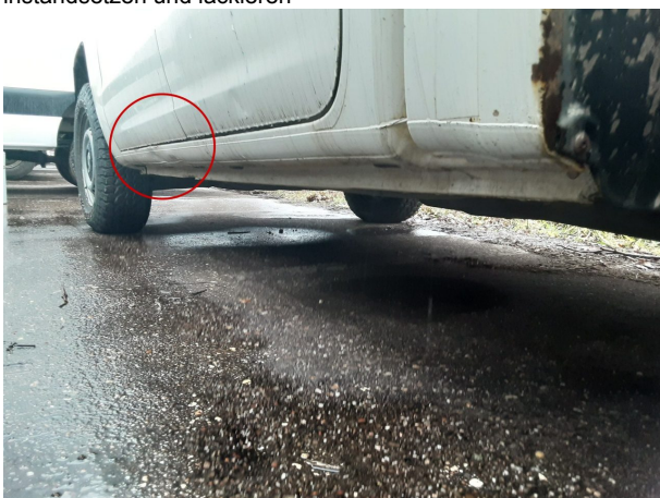
Beschädigung #5: Karosserie: Karosserie - Delle / Lackschaden - instandsetzen und lackieren