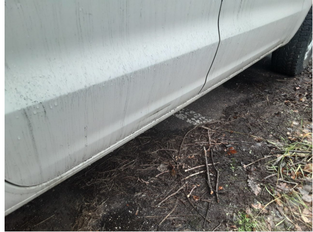
Beschädigung #5: Karosserie: Karosserie - Delle / Lackschaden - instandsetzen und lackieren