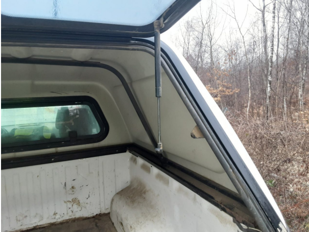
Beschädigung #3: Heckklappe/-tür: Heckklappe (Dämpfer) - beschädigt - erneuern