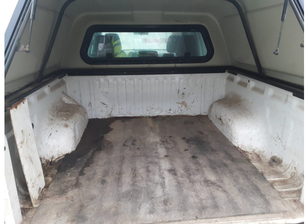
Beschädigung #4: Interieur: Innenraum (Laderaum) - verschlissen - Wertminderung