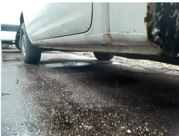
Abbildung 23: Sonstiges