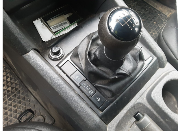
Abbildung 26: Sonstiges