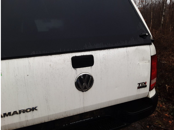
Beschädigung #5: Karosserie: Karosserie - Delle / Lackschaden - instandsetzen und lackieren