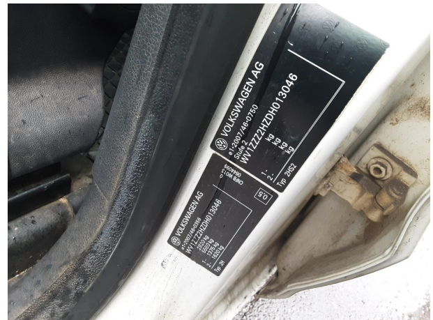
Abbildung 10: FIN