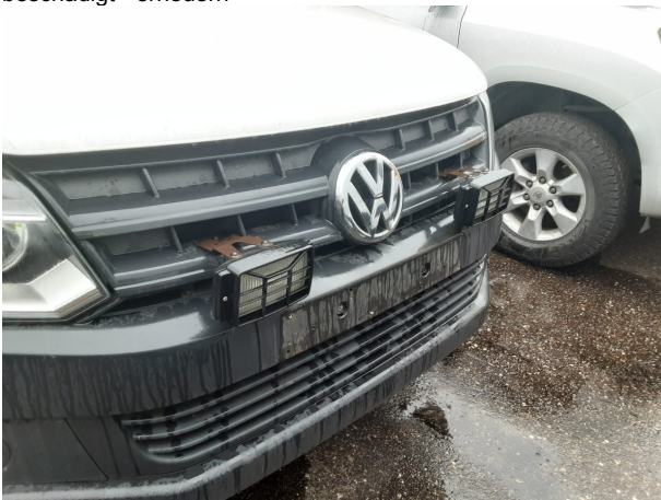
Beschädigung #7: Sonstiges: Fahrzeug - abweichend Auslieferungszustand - entfernen