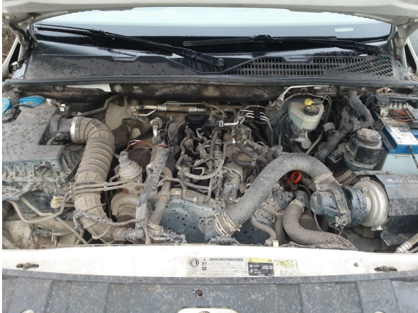
Abbildung 19: Sonstiges