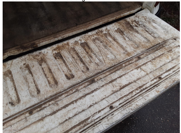
Beschädigung #4: Interieur: Innenraum (Laderaum) - verschlissen - Wertminderung