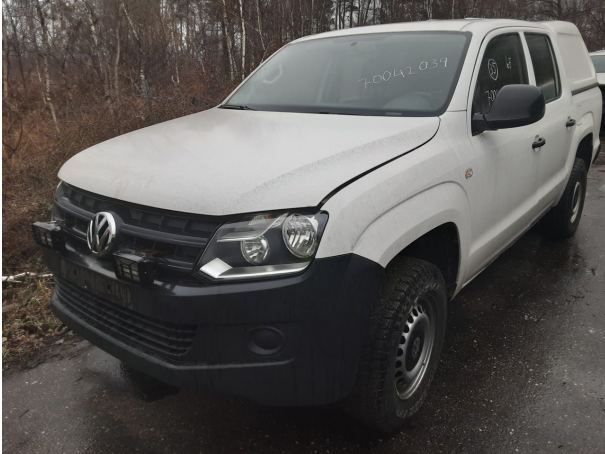
Abbildung 1: Schräg vorne (links)