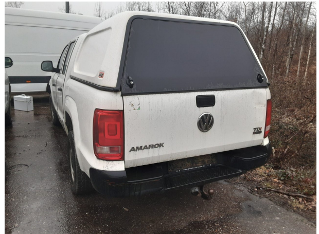
Abbildung 4: Schräg hinten (links)