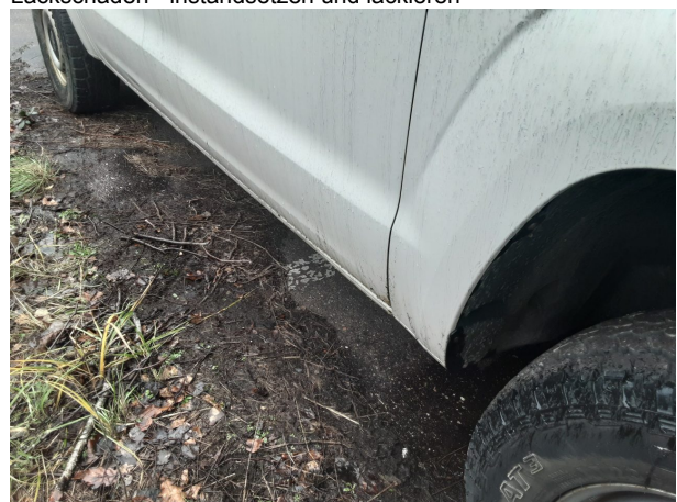
Beschädigung #5: Karosserie: Karosserie - Delle / Lackschaden - instandsetzen und lackieren