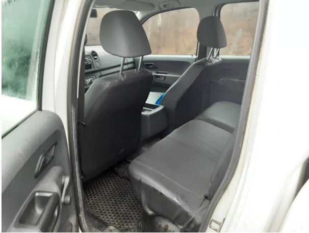
Abbildung 7: Innenraum hinten