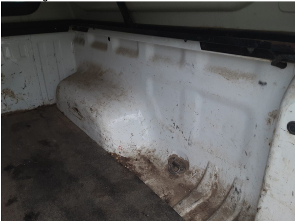
Beschädigung #4: Interieur: Innenraum (Laderaum) - verschlissen - Wertminderung