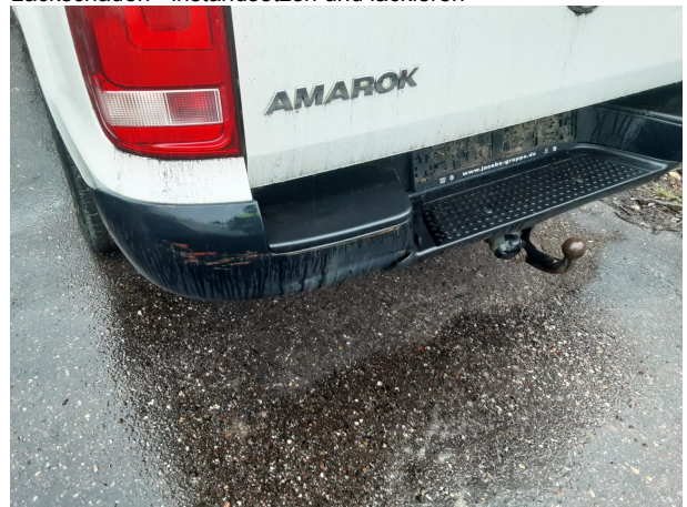
Beschädigung #6: Stossfänger hinten: Stossfänger hinten - beschädigt - erneuern