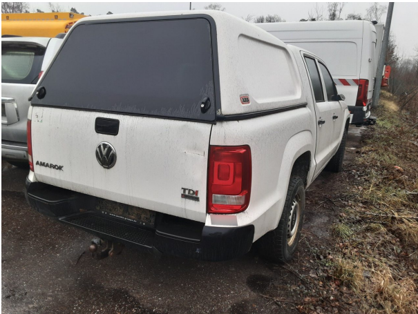
Abbildung 3: Schräg hinten (rechts)