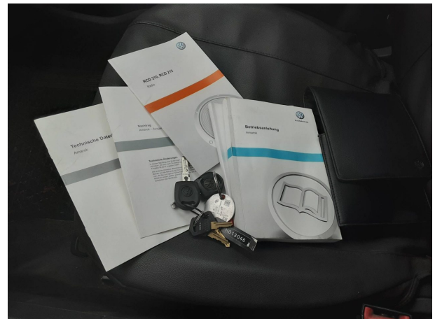
Abbildung 12: Dokumente