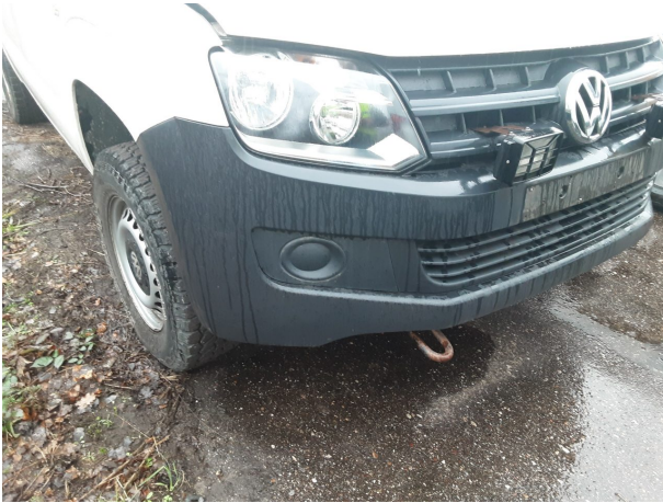
Beschädigung #9: Stossfänger vorn: Stossfänger vorn (unlackiert) - verkratzt / verschürft - erneuern