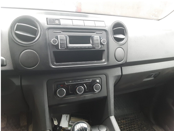
Abbildung 11: Entertainment