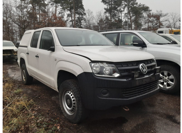
Abbildung 2: Schräg vorne (rechts)