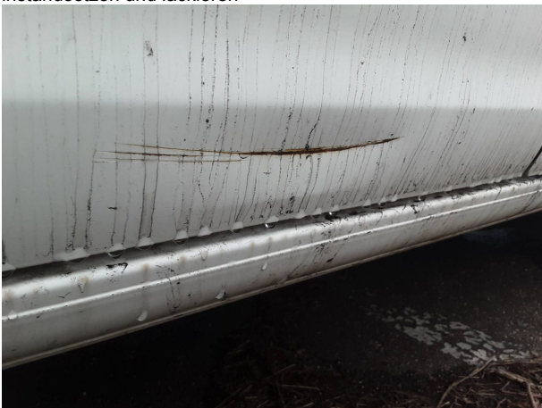
Beschädigung #5: Karosserie: Karosserie - Delle / Lackschaden - instandsetzen und lackieren