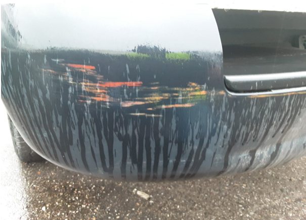
Beschädigung #6: Stossfänger hinten: Stossfänger hinten - beschädigt - erneuern