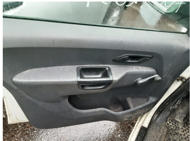
Abbildung 28: Sonstiges