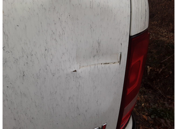
Beschädigung #5: Karosserie: Karosserie - Delle / Lackschaden - instandsetzen und lackieren