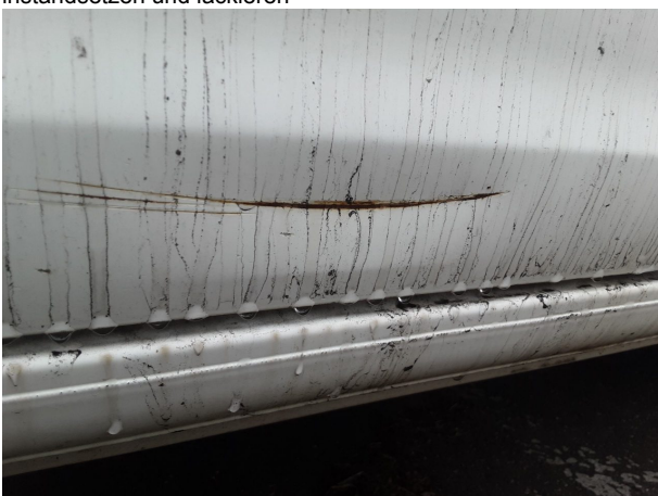
Beschädigung #5: Karosserie: Karosserie - Delle / Lackschaden - instandsetzen und lackieren