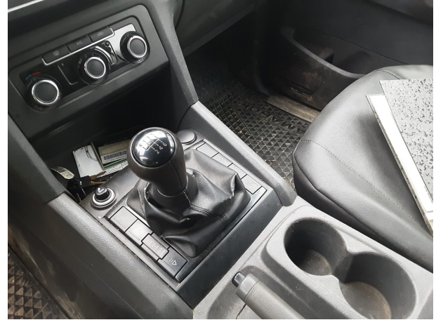
Abbildung 8: Mittelkonsole