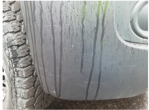
Beschädigung #9: Stossfänger vorn: Stossfänger vorn (unlackiert) - verkratzt / verschürft - erneuern