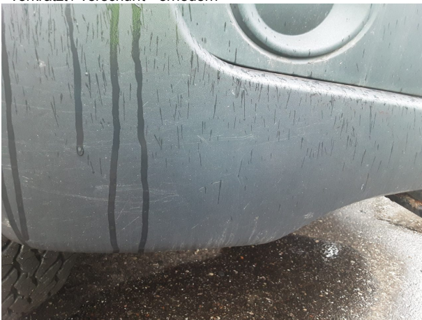
Beschädigung #9: Stossfänger vorn: Stossfänger vorn (unlackiert) - verkratzt / verschürft - erneuern