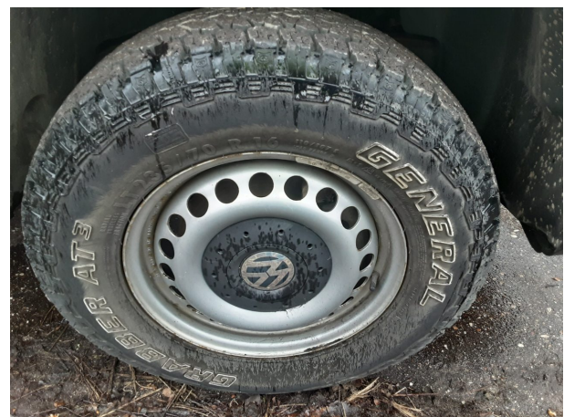
Abbildung 18: Montierte Bereifung