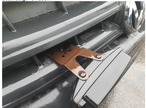
Beschädigung #7: Sonstiges: Fahrzeug - abweichend Auslieferungszustand - entfernen