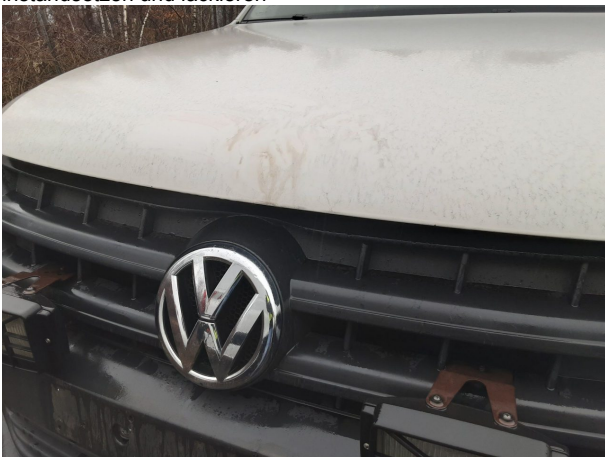
Beschädigung #5: Karosserie: Karosserie - Delle / Lackschaden - instandsetzen und lackieren