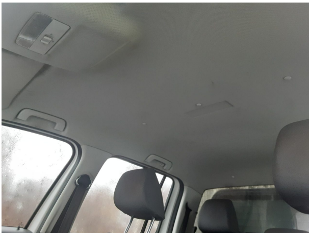
Abbildung 27: Sonstiges