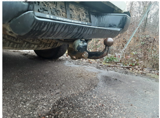
Beschädigung #6: Stossfänger hinten: Stossfänger hinten - beschädigt - erneuern