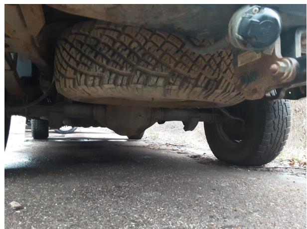
Abbildung 24: Sonstiges