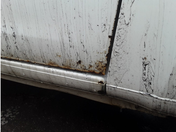
Beschädigung #5: Karosserie: Karosserie - Delle / Lackschaden - instandsetzen und lackieren