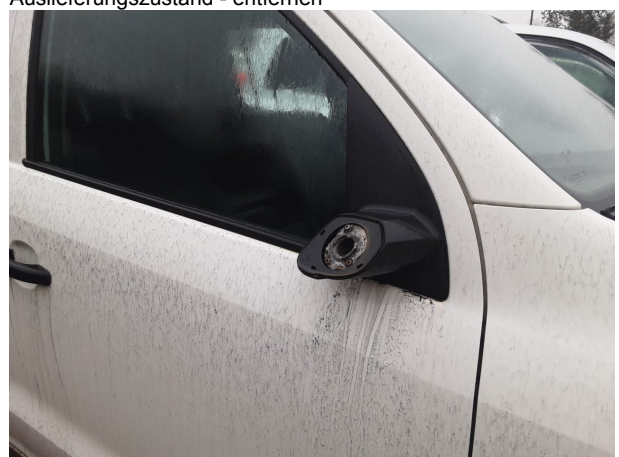
Beschädigung #8: Außenspiegel rechts: Außenspiegel - fehlt - erneuern