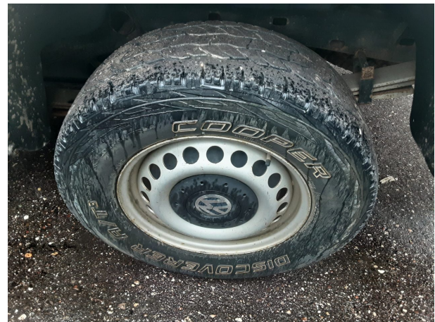
Abbildung 16: Montierte Bereifung