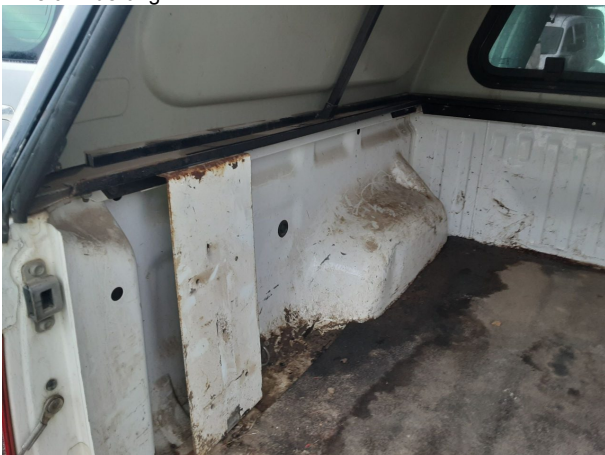
Beschädigung #4: Interieur: Innenraum (Laderaum) - verschlissen - Wertminderung