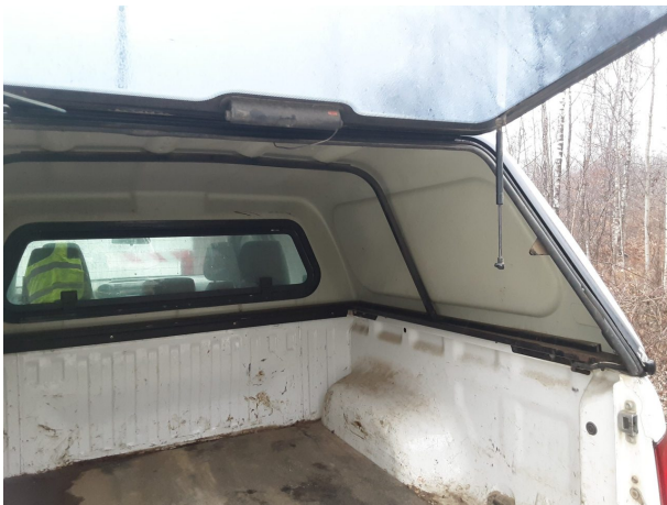
Abbildung 21: Sonstiges