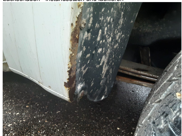
Beschädigung #5: Karosserie: Karosserie - Delle / Lackschaden - instandsetzen und lackieren