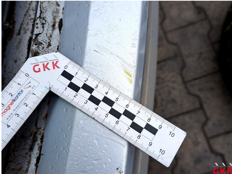
Bild 21 Stoßfänger hinten, Verkleidung -lackiert-, verkratzt, lackieren