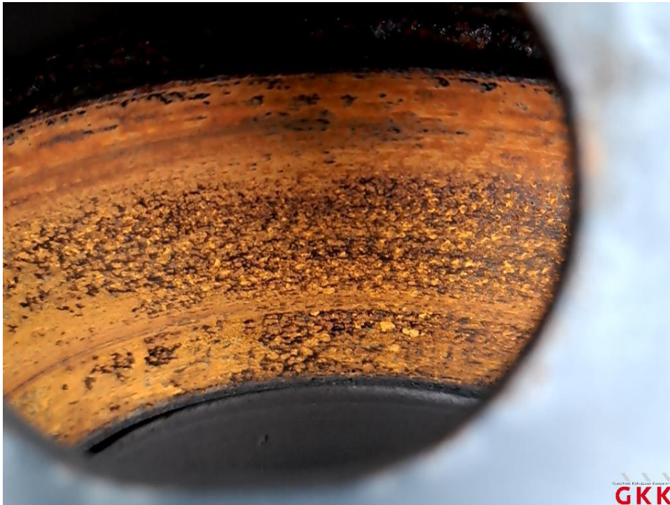
Bild 15 Vorderachse Bremsscheiben, komplett, korrodiert, ersetzen