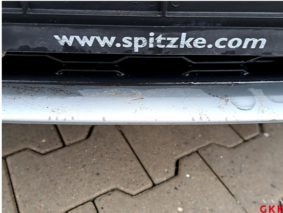
Bild 19 Stoßfänger vorne, Verkleidung -lackiert-, Steinschlag, lackieren