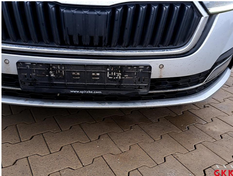
Bild 18 Stoßfänger vorne, Verkleidung -lackiert-, Steinschlag, lackieren