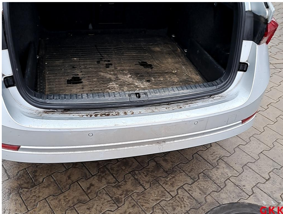
Bild 20 Stoßfänger hinten, Verkleidung -lackiert-, verkratzt, lackieren