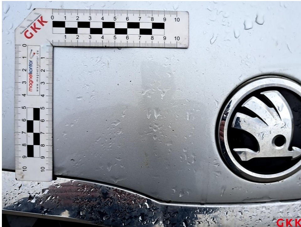
Bild 17 Motorhaube, Steinschlag, lackieren