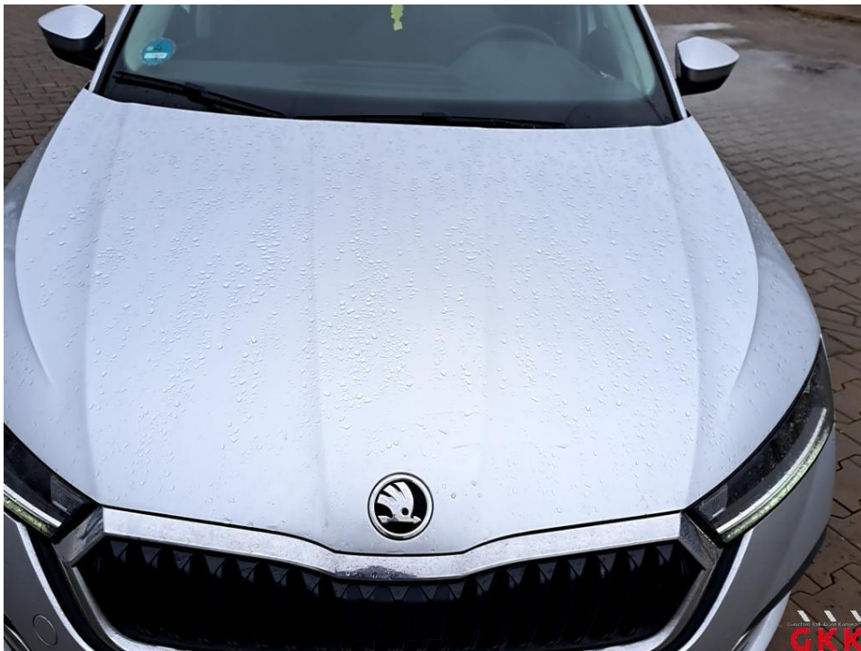
Bild 16 Motorhaube, Steinschlag, lackieren