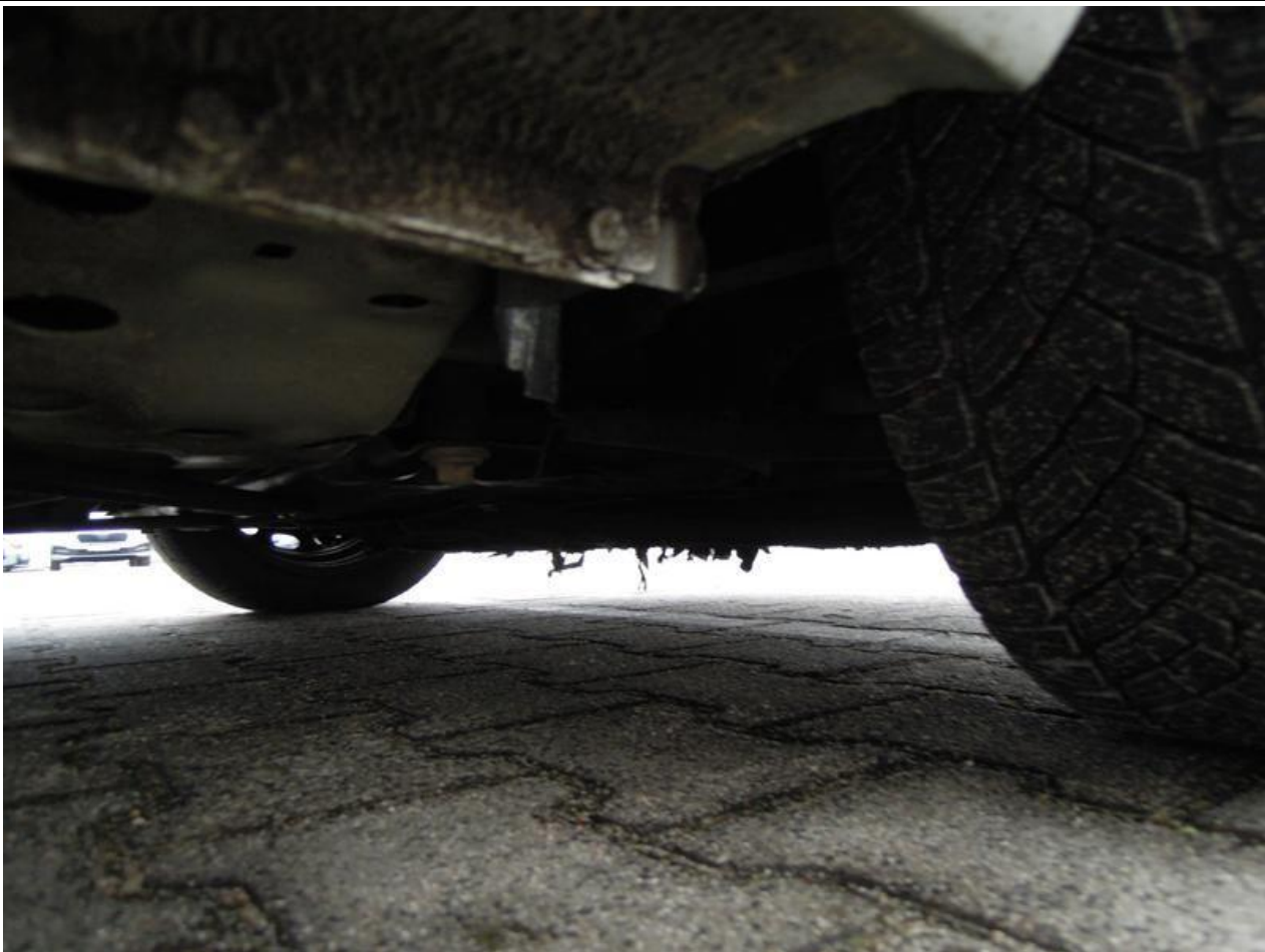
Fot. nr 57