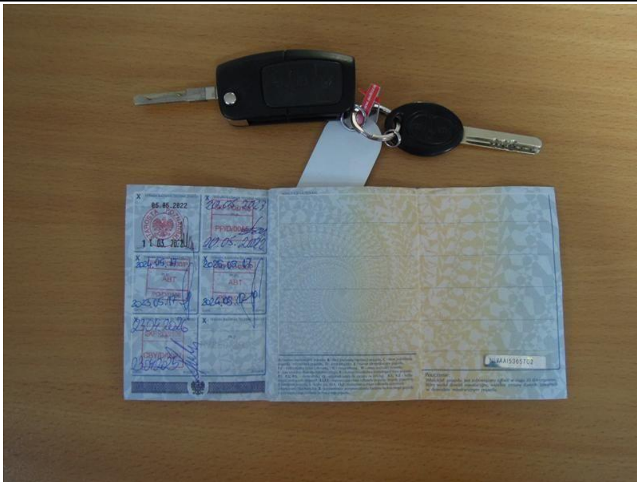
Fot. nr 63

Dokument wystawiony elektronicznie, waży bez podpisu