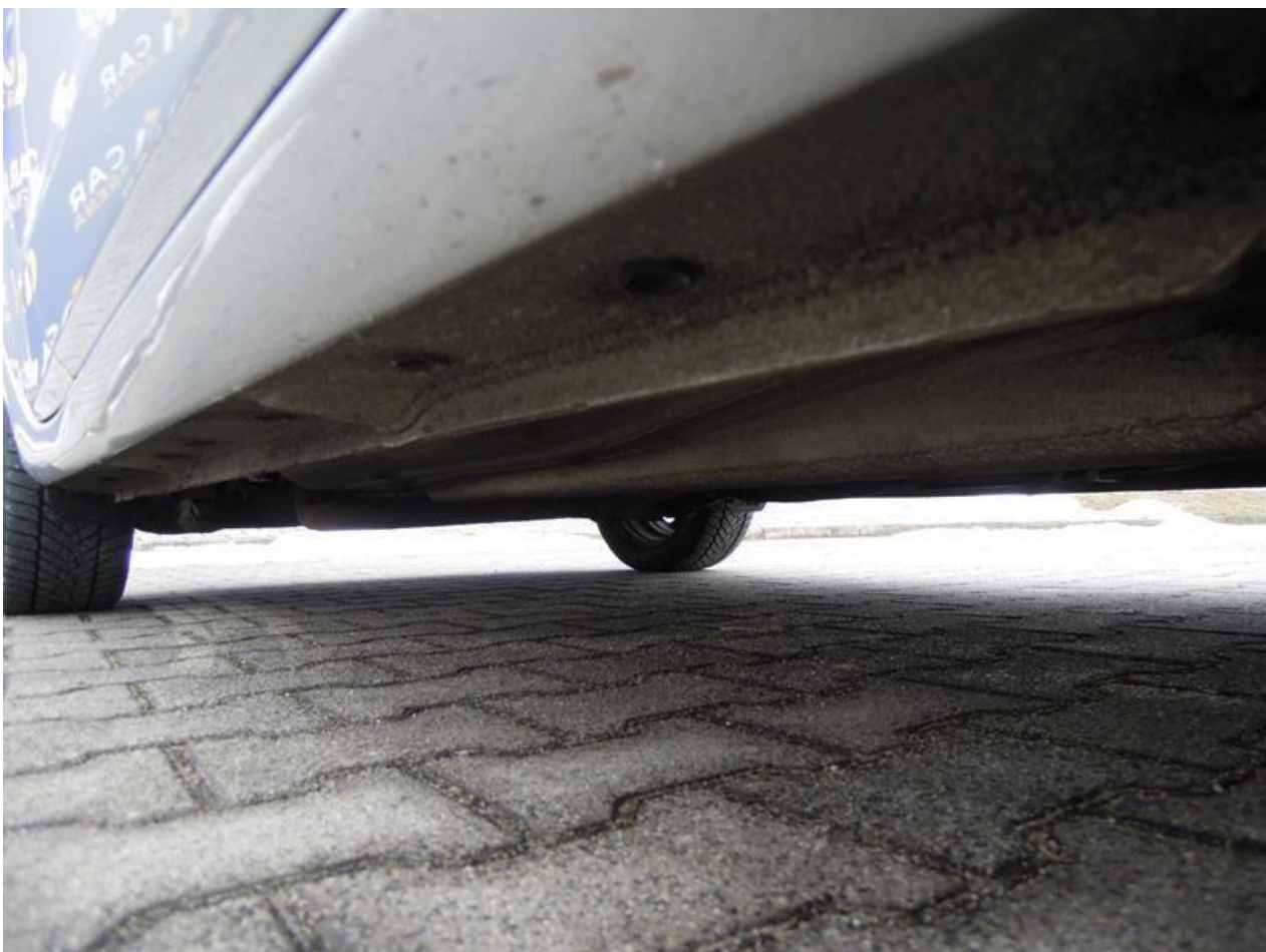
Fot. nr 58