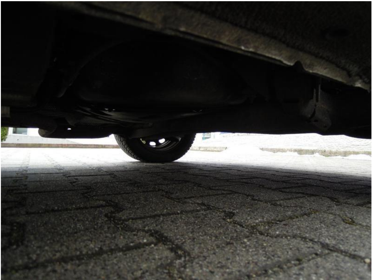
Fot. nr 61