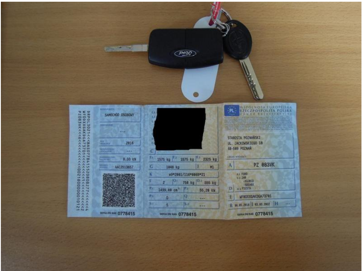
Fot. nr 62