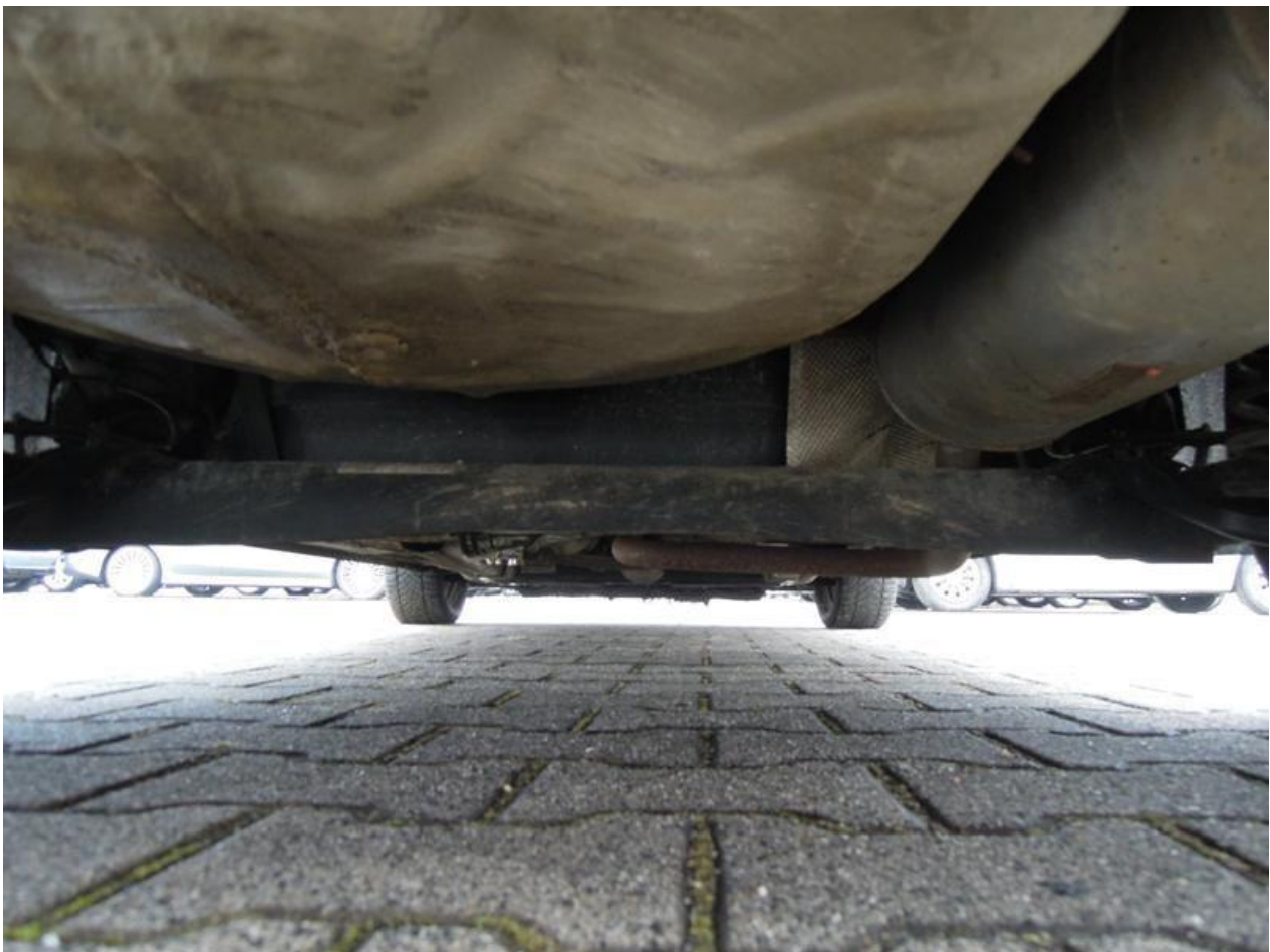
Fot. nr 60