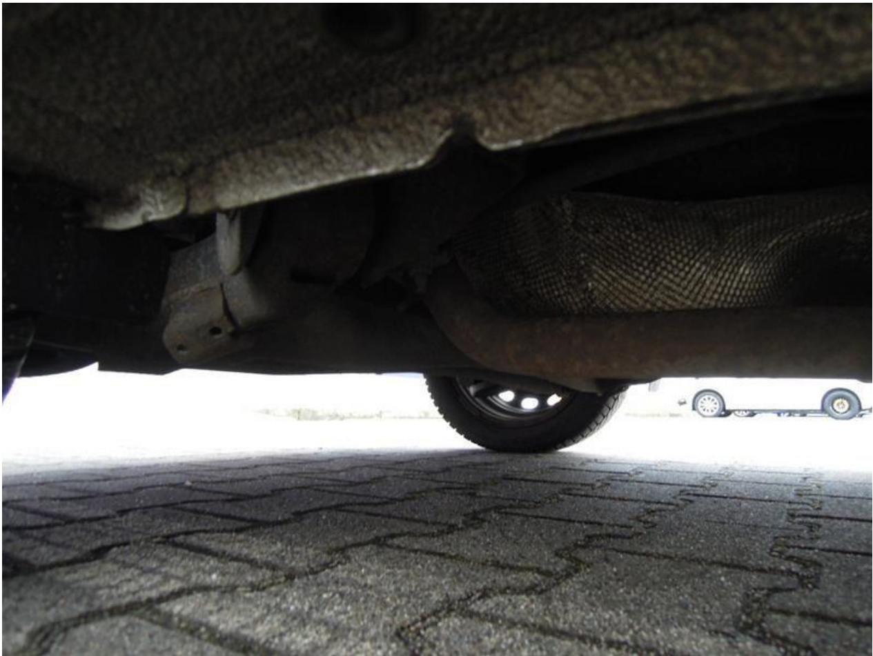
Fot. nr 59