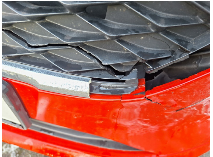
Kühlgrill vorne: gebrochen - erneuern (Foto 6)