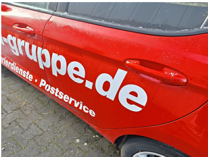
Tür hinten links: Delle mit Lackbeschädigung - instandsetzen (Foto 15)