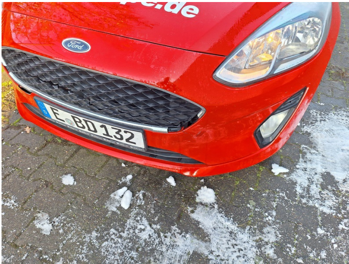
Kühlgrill vorne: gebrochen - erneuern (Foto 5)