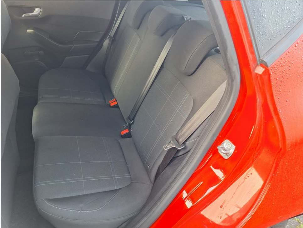
Innenraum hinten / Rückbank