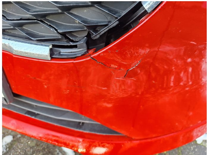
Stoßfänger vorne: gebrochen - erneuern (Foto 4)