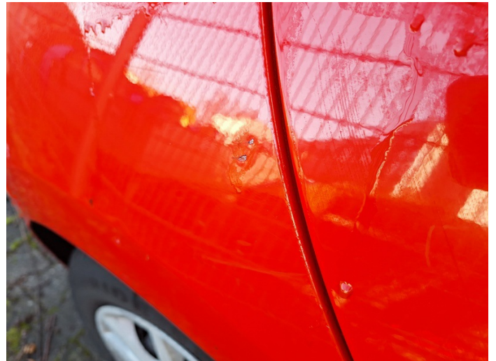
Seitenwand rechts: Dellen mit Lackbeschädigungen - instandsetzen (Foto 10)