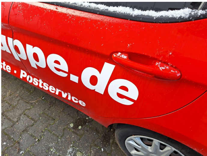
Tür hinten links: Kratzer - lackieren (Foto 23)