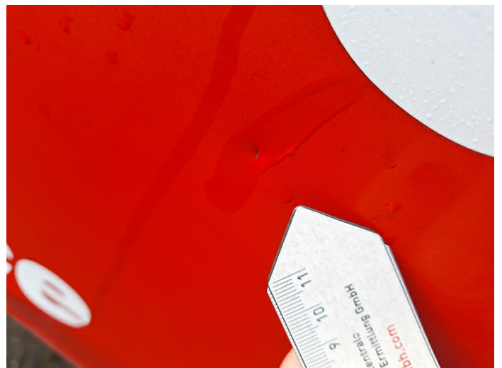
Tür hinten links: Delle mit Lackbeschädigung - instandsetzen (Foto 16)