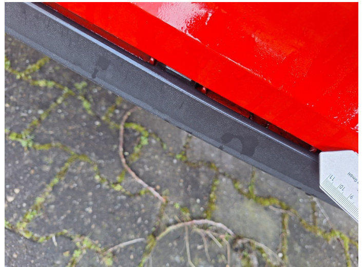
Stoßfänger spoiler hinten: Spaltmaß - Nebenarbeit (Foto 14)