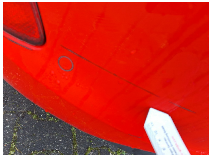
Stoßfänger hinten: verschrammt - lackieren (Foto 12)