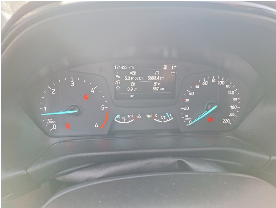
Instrumententafel bei laufendem Motor / km-Stand