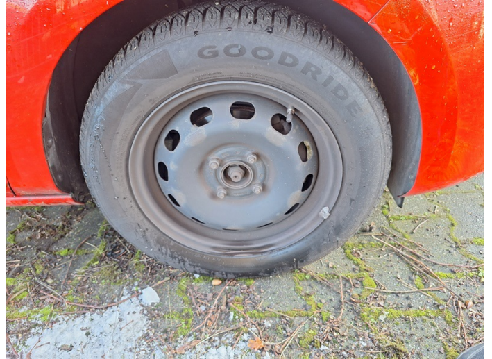
Radkappe x2: fehlt - erneuern (Foto 26)