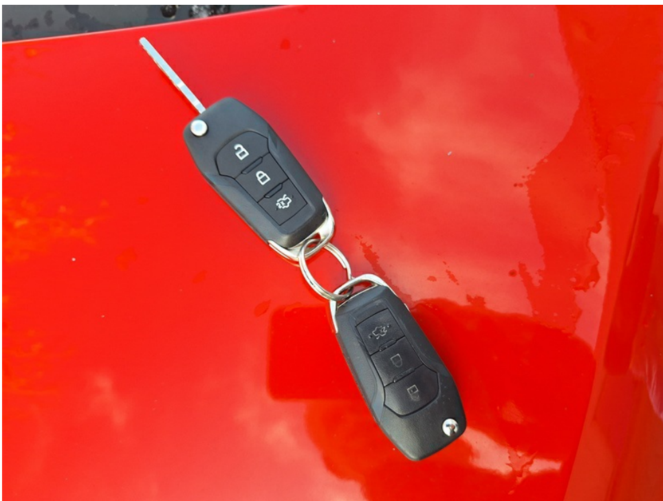
Zubehörteile (Fahrzeugschlüssel, Betriebsanleitung, Serviceheft, Navi CD)