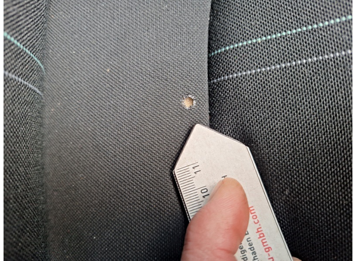
Sitzkissenbezug Beifahrersitz: Brandloch - erneuern (Foto 2)