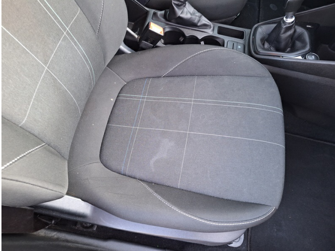
Sitzkissenbezug Beifahrersitz: Brandloch - erneuern (Foto 1)