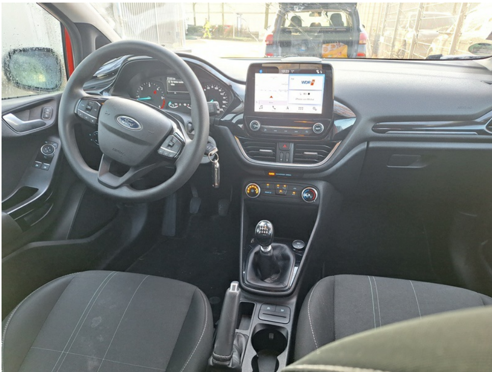
Cockpit gesamt (Perspektive von der Rückbank)