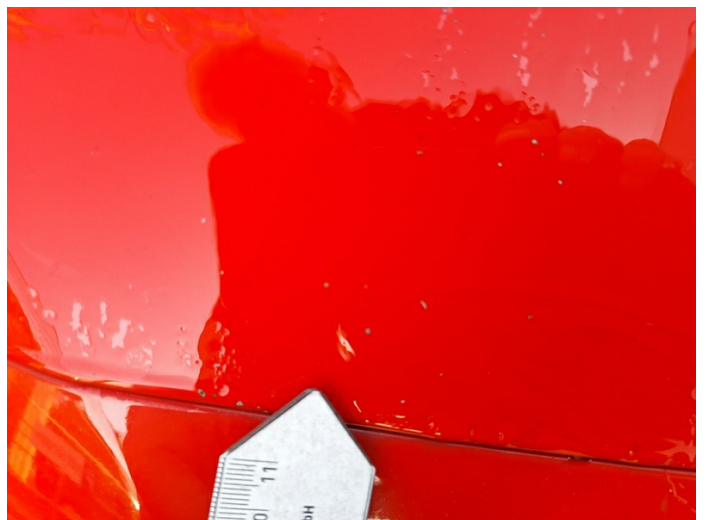
Motorhaube: Steinschlag - lackieren (Foto 8)