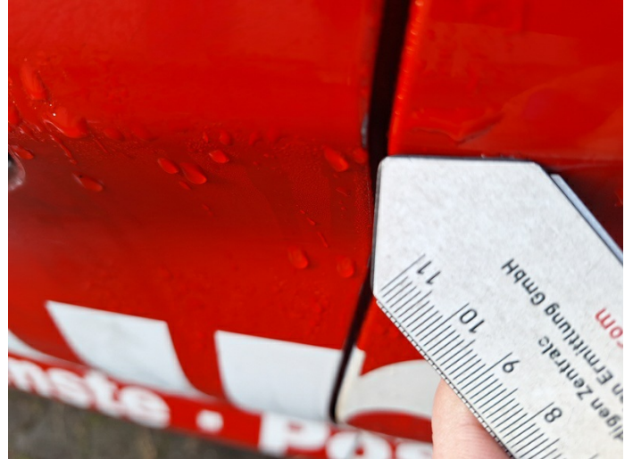
Tür vorne links: verschrammt - Smartrepair (Foto 18)