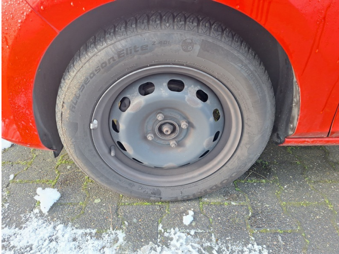
Radkappe x2: fehlt - erneuern (Foto 25)