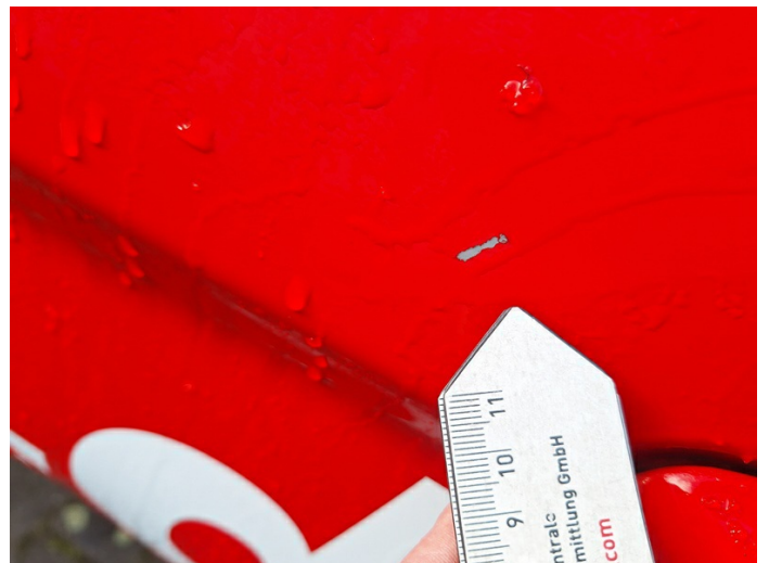
Tür hinten links: Kratzer - lackieren (Foto 24)