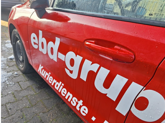
Tür vorne links: verschrammt - Smartrepair (Foto 17)