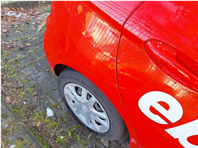
Seitenwand rechts: Dellen mit Lackbeschädigungen - instandsetzen (Foto 9)