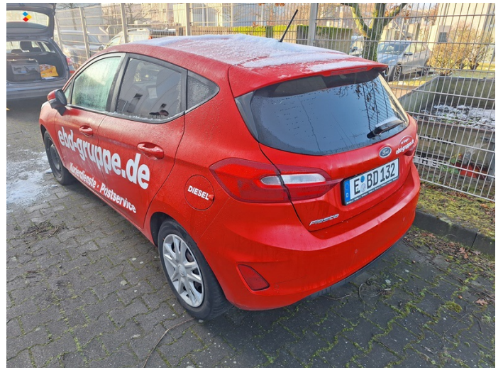
Fahrzeug außen: Beschriftung - entfernen (Foto 28)