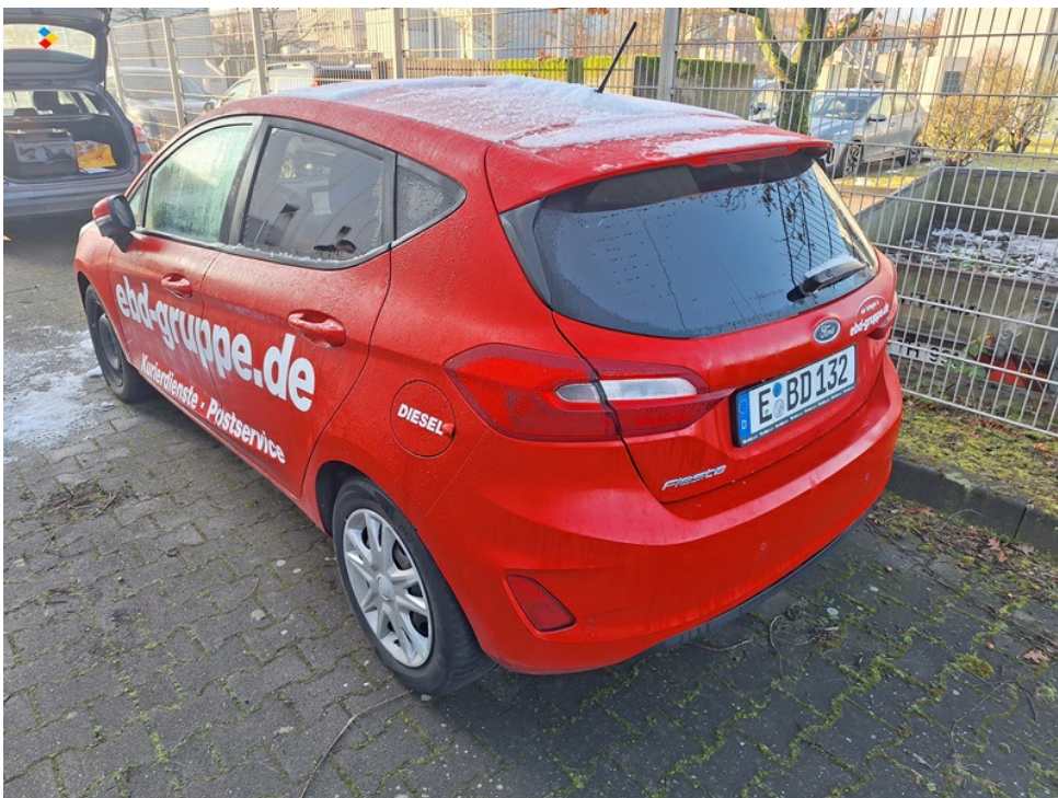
Seitenprofil des Fahrzeugs von hinten links