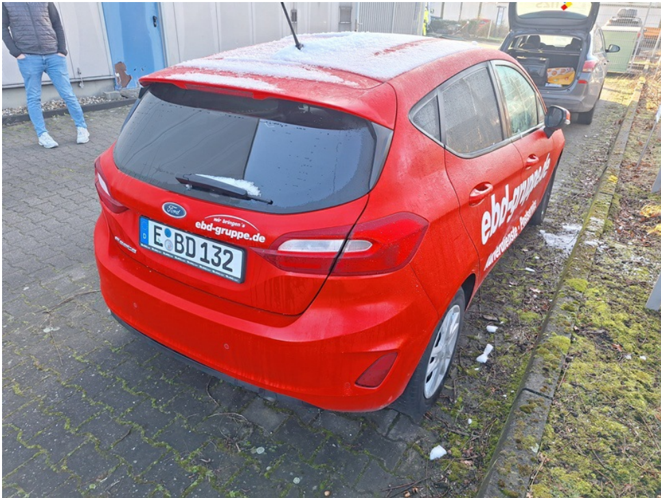
Seitenprofil des Fahrzeugs von hinten rechts