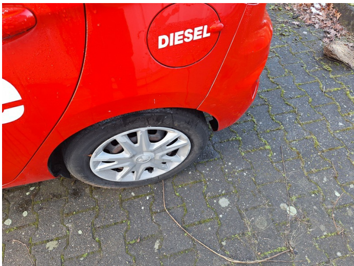
Seitenwand links: Kratzer - lackieren (Foto 19)