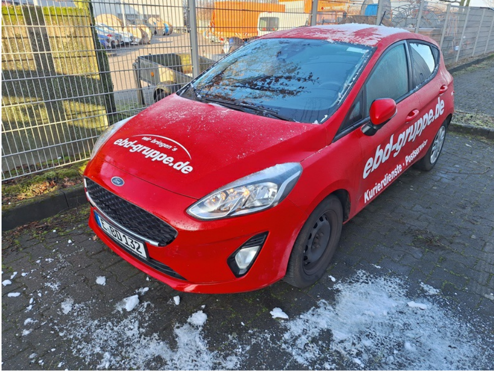
Seitenprofil des Fahrzeugs von vorne links