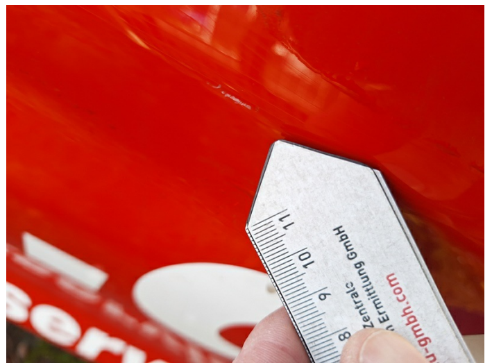
Tür vorne rechts: Kratzer - lackieren (Foto 22)