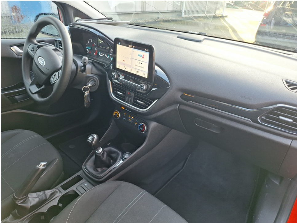
Geöffnete Beifahrertür in Richtung Lenkrad