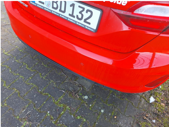
Stoßfänger spoiler hinten: Spaltmaß - Nebenarbeit (Foto 13)