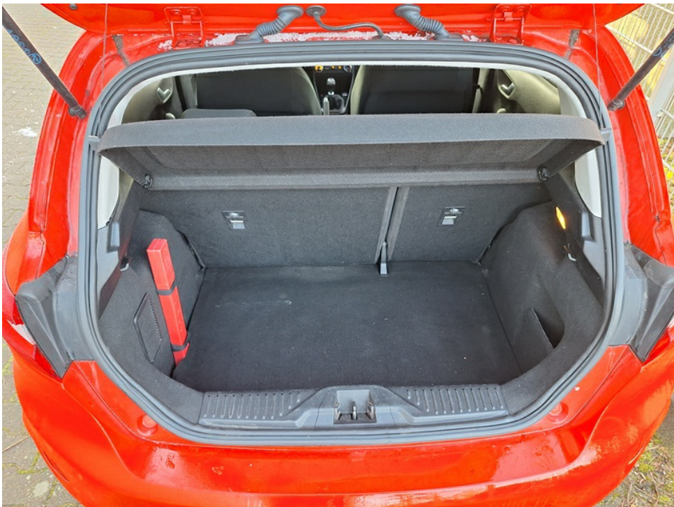
Geöffneter Kofferraum / Laderaum