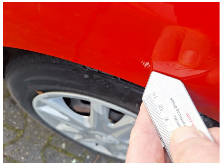
Seitenwand links: Kratzer - lackieren (Foto 20)