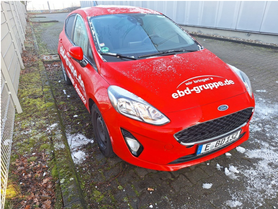
Seitenprofil des Fahrzeugs von vorne rechts