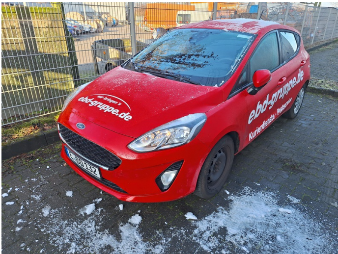
Fahrzeug außen: Beschriftung - entfernen (Foto 27)