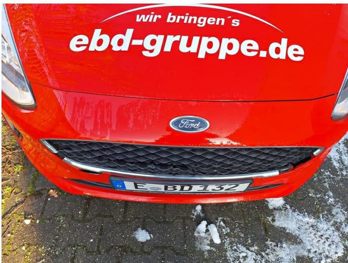
Motorhaube: Steinschlag - lackieren (Foto 7)