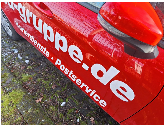
Tür vorne rechts: Kratzer - lackieren (Foto 21)