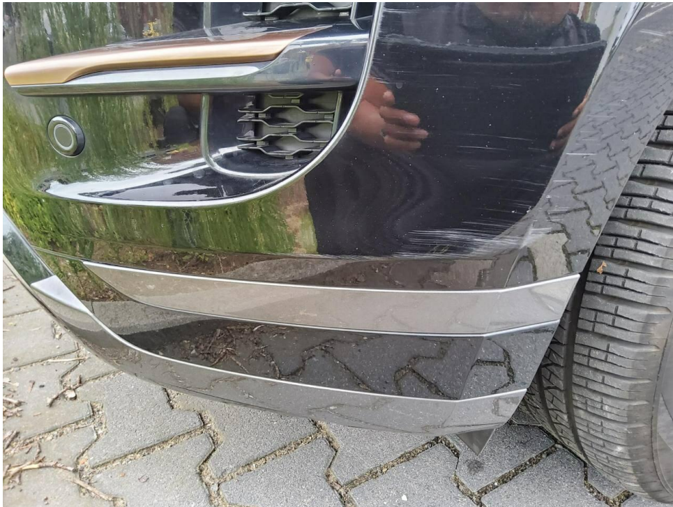
Bild 13 : Stoßfänger vorne Lackierung, zerkratzt, lackieren mit Lackaufbau