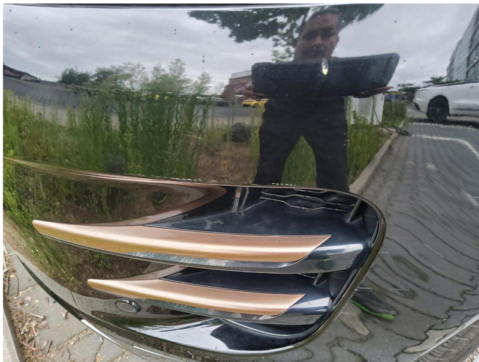
Bild 15 : Stoßfänger vorne Lackierung, zerkratzt, lackieren mit Lackaufbau