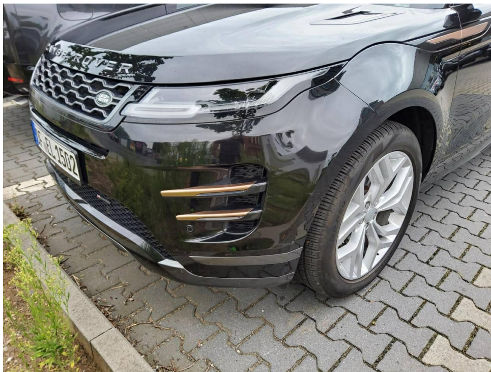
Bild 12 : Stoßfänger vorne Lackierung, zerkratzt, lackieren mit Lackaufbau