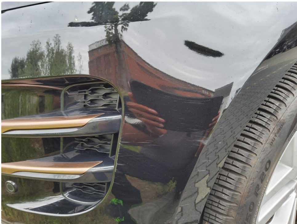
Bild 14 : Stoßfänger vorne Lackierung, zerkratzt, lackieren mit Lackaufbau