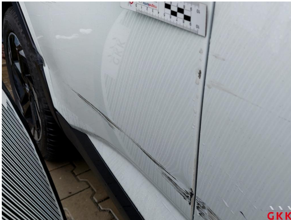
Bild 25 Tür hinten rechts verformt und verkratzt