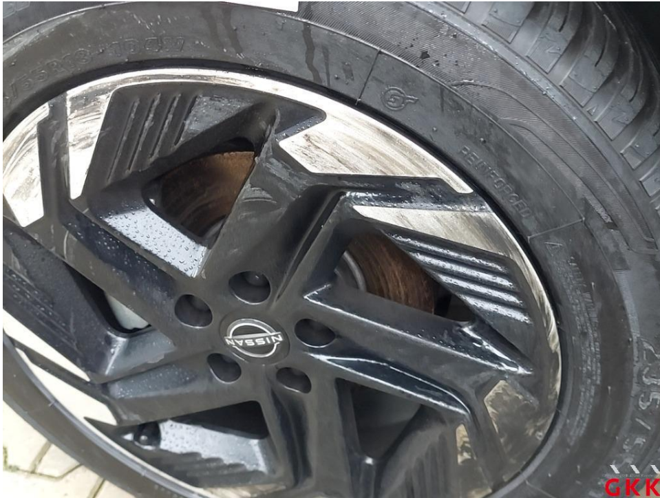
Bild 51 Rad/Reifen vorn links verkratzt/angestoßen