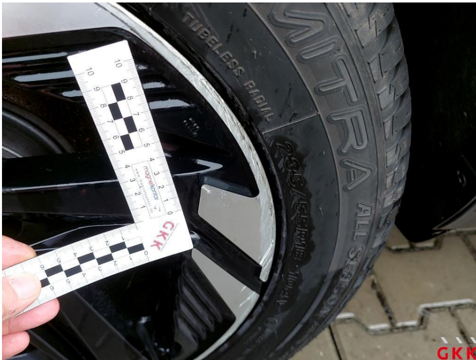
Bild 33 Rad/Reifen hinten rechts verkratzt/angestoßen