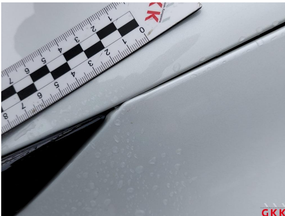
Bild 56 Frontklappe verkratzt