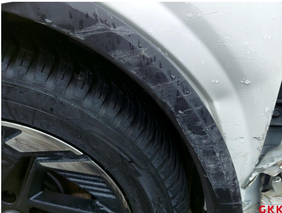
Bild 50 Kotflügel vorn links Radlaufblende verformt