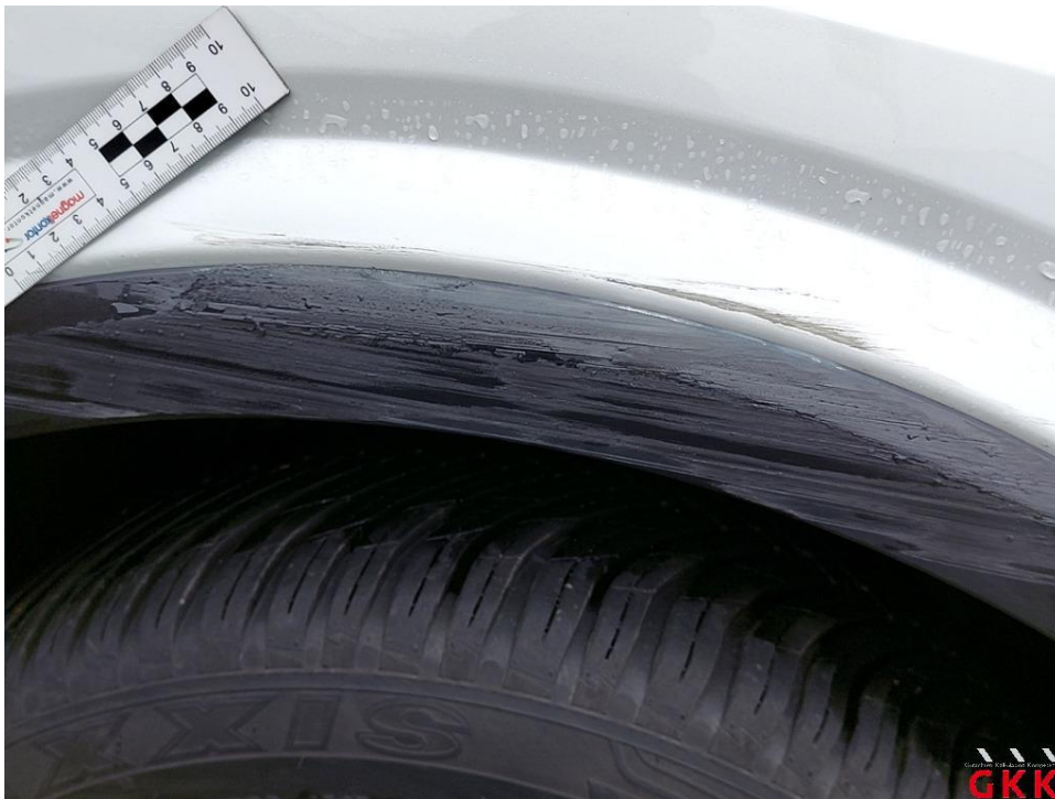
Bild 17 Kotflügel vorn rechts Radlaufblende verformt und verkratzt