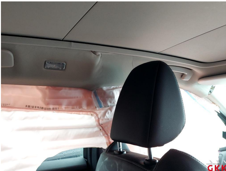
Bild 12 Dachinnenverkleidung verformt