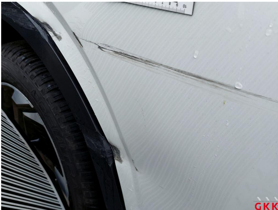
Bild 24 Tür hinten rechts verformt und verkratzt