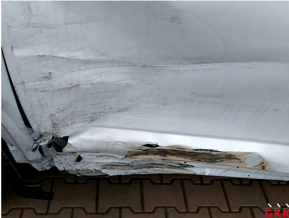
Bild 47 Tür vorn links eingerissen und verkratzt