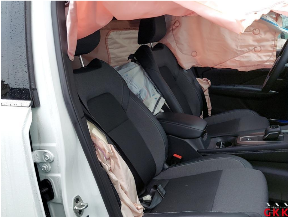
Bild 7 Airbag/Gurtstraffer ausgelöst