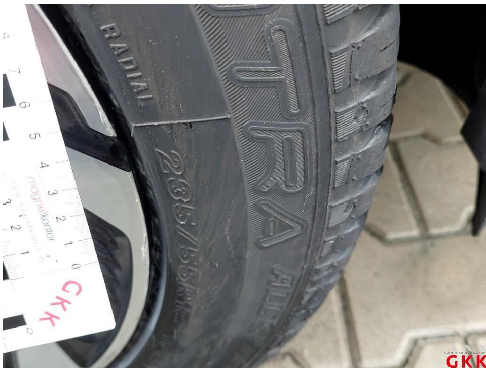
Bild 20 Rad/Reifen vorn rechts verkratzt/angestoßen