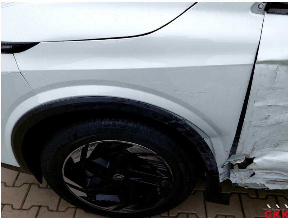
Bild 48 Kotflügel vorn links verformt und verkratzt