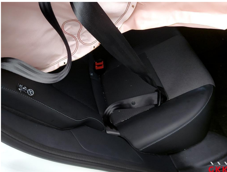
Bild 10 Airbag/Gurtstraffer ausgelöst