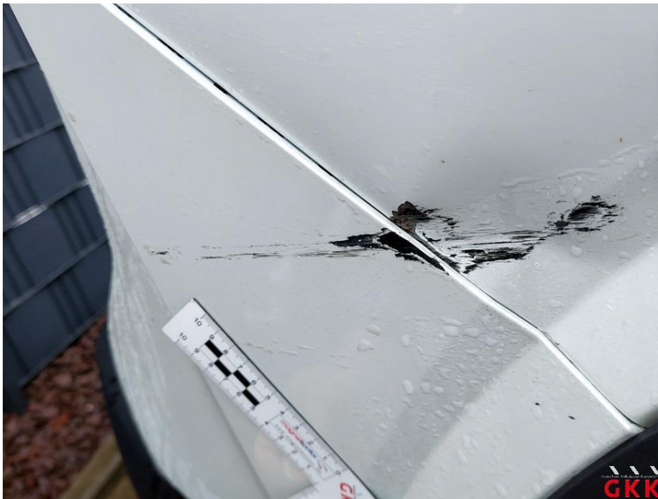
Bild 37 Stoßfänger hinten gestaucht und verkratzt