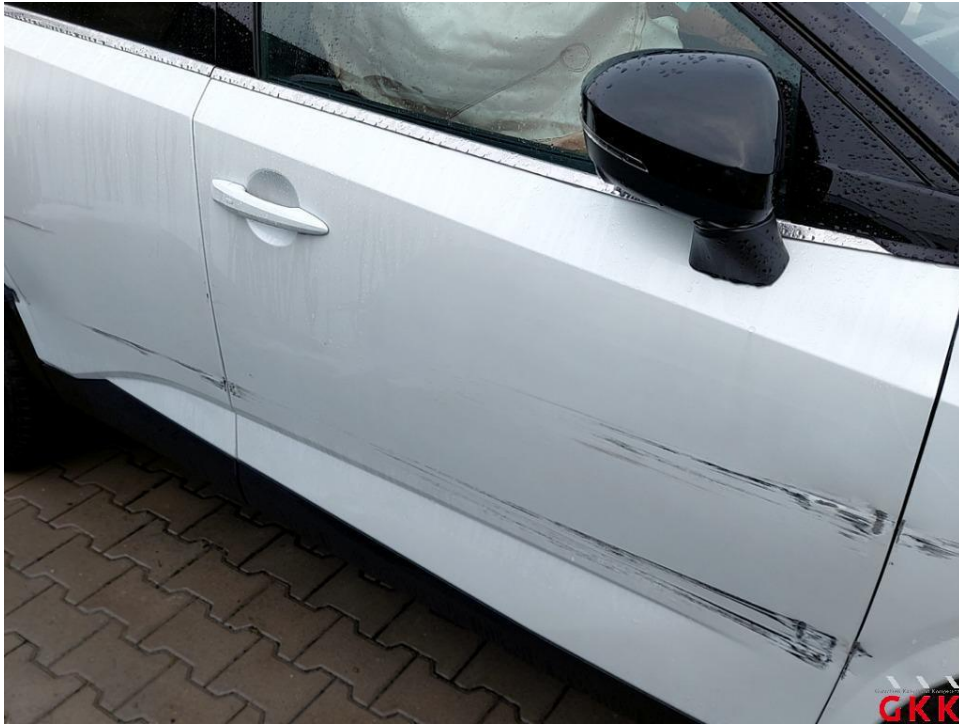
Bild 21 Tür vorn rechts verformt und verkratzt