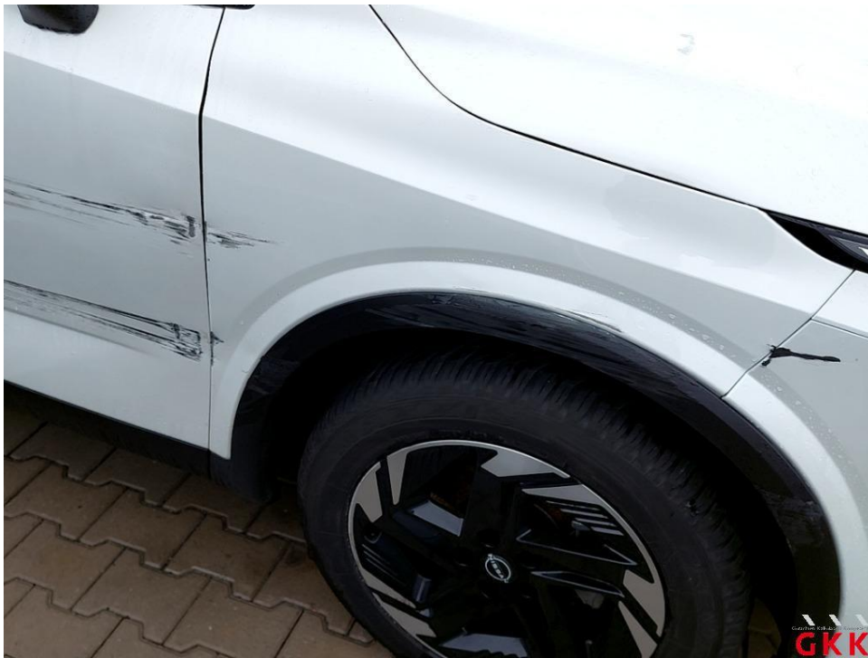
Bild 15 Kotflügel vorn rechts verformt und verkratzt