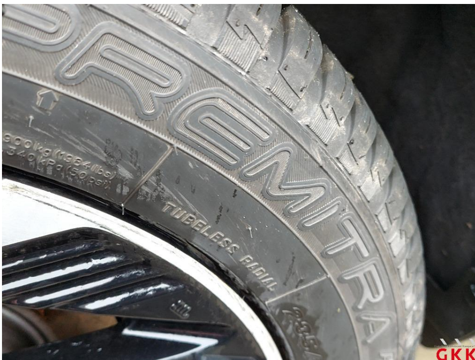
Bild 34 Rad/Reifen hinten rechts verkratzt/angestoßen