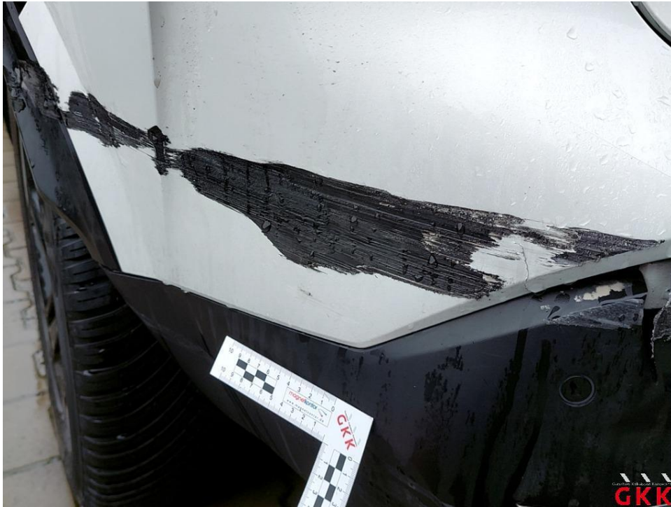
Bild 41 Stoßfänger hinten gestaucht und verkratzt