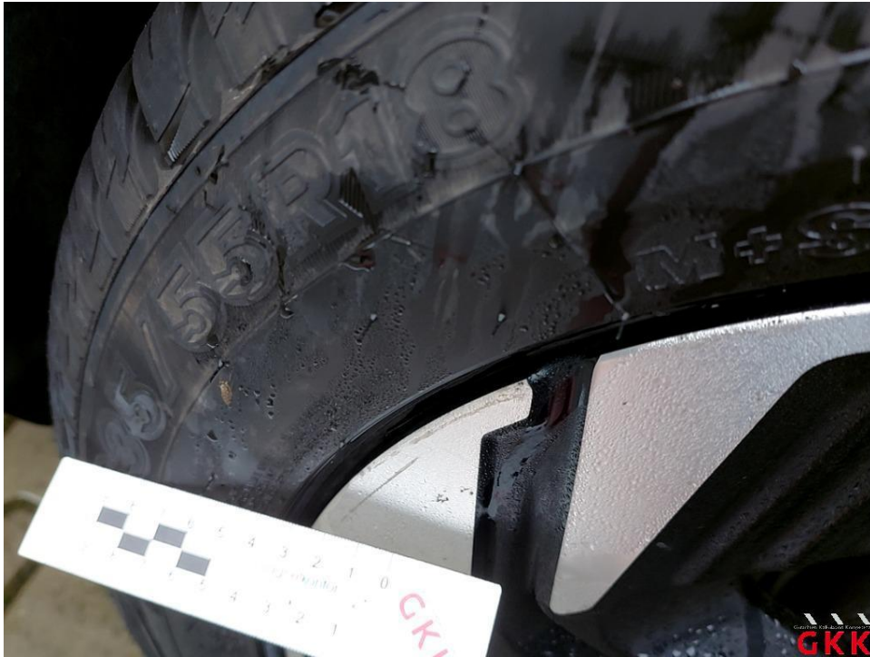
Bild 45 Rad/Reifen hinten links verkratzt/angestoßen