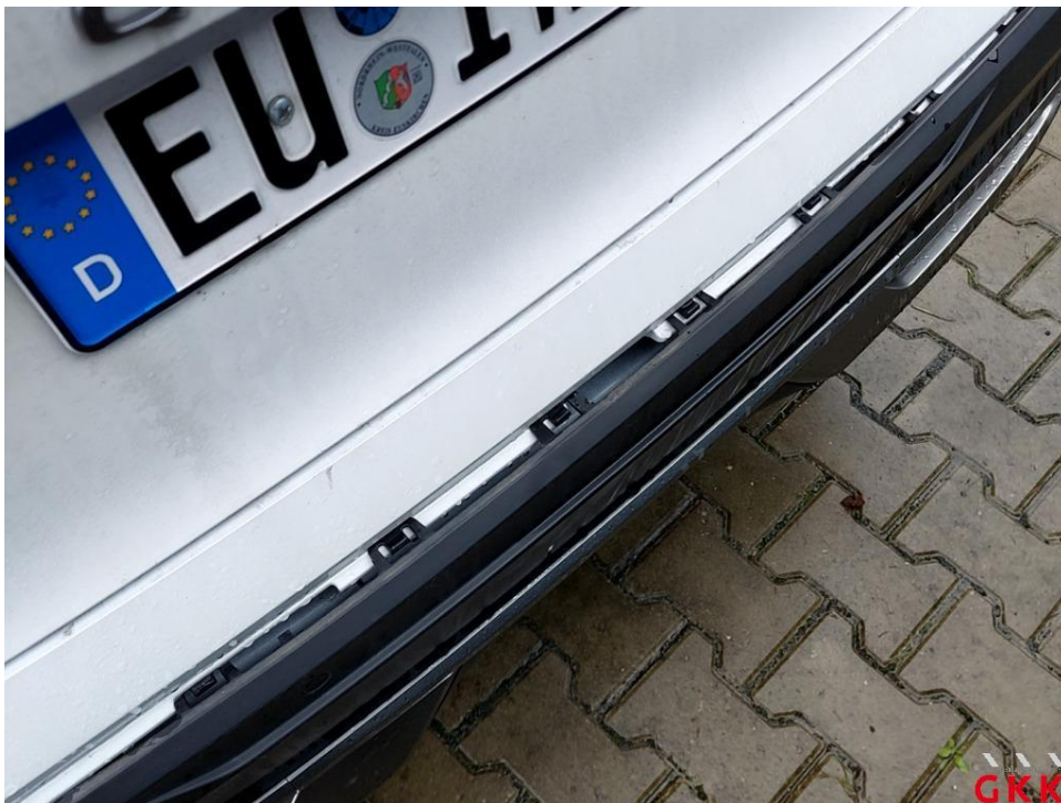
Bild 38 Stoßfänger hinten unterhalb gebrochen