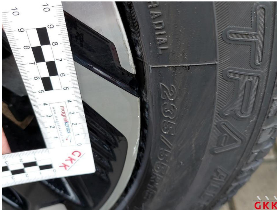
Bild 19 Rad/Reifen vorn rechts verkratzt/angestoßen