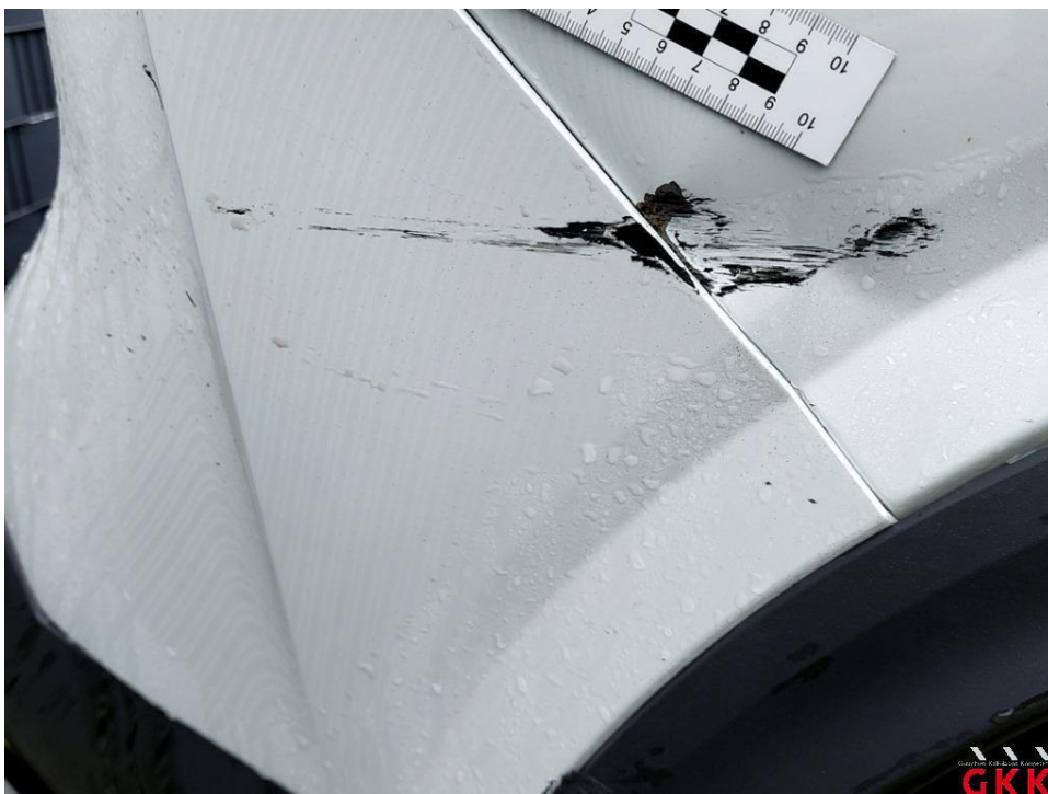
Bild 36 Stoßfänger hinten gestaucht und verkratzt