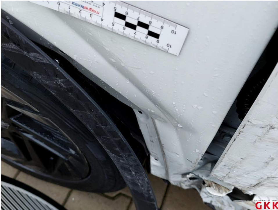
Bild 49 Kotflügel vorn links verformt und verkratzt