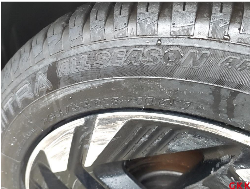
Bild 52 Rad/Reifen vorn links verkratzt/angestoßen