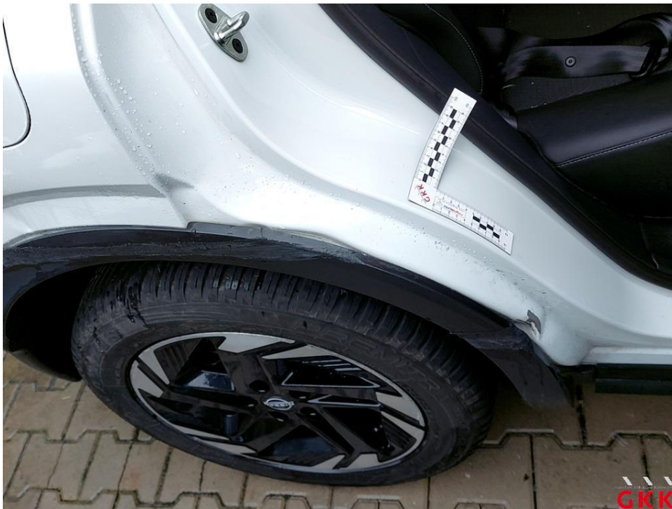
Bild 29 Seitenwand hinten rechts verformt und verkratzt