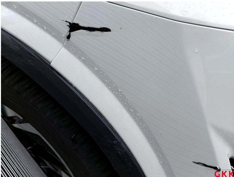
Bild 14 Stoßfänger vorn gestaucht und verkratzt