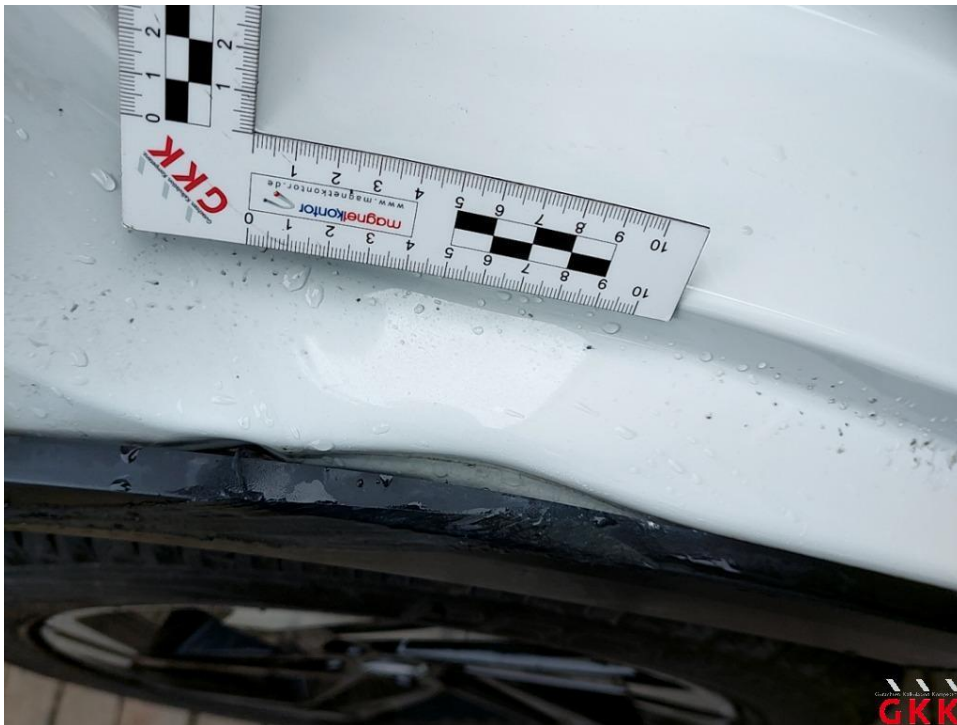
Bild 31 Seitenwand hinten rechts verformt und verkratzt