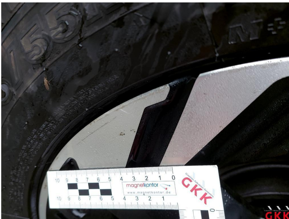
Bild 44 Rad/Reifen hinten links verkratzt/angestoßen