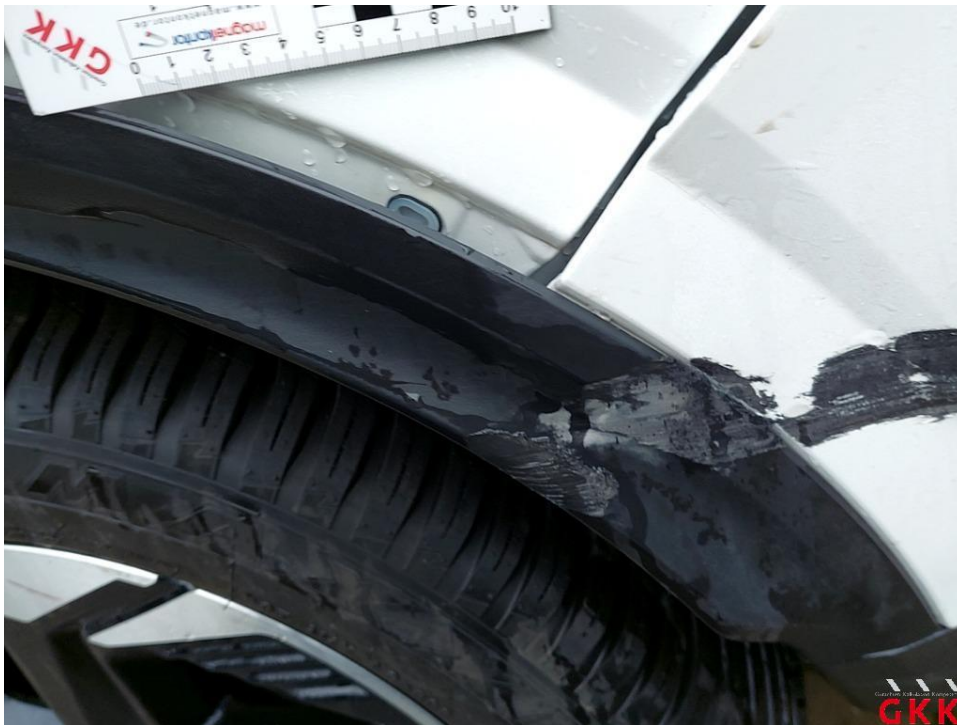
Bild 43 Radlaufverkleidung hinten links verformt und verkratzt