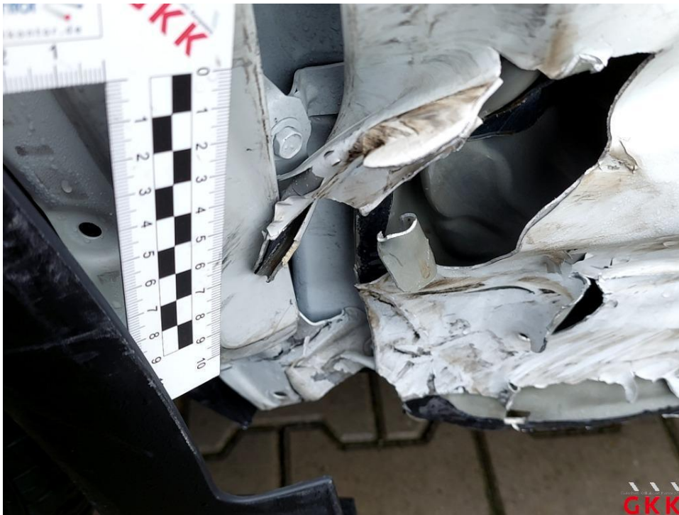
Bild 55 A-Säule links eingedellt