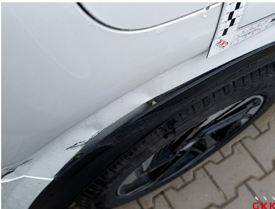
Bild 28 Seitenwand hinten rechts verformt und verkratzt