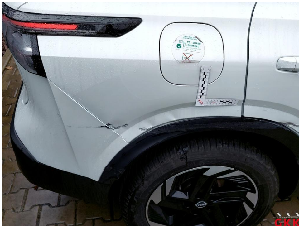
Bild 26 Seitenwand hinten rechts verformt und verkratzt