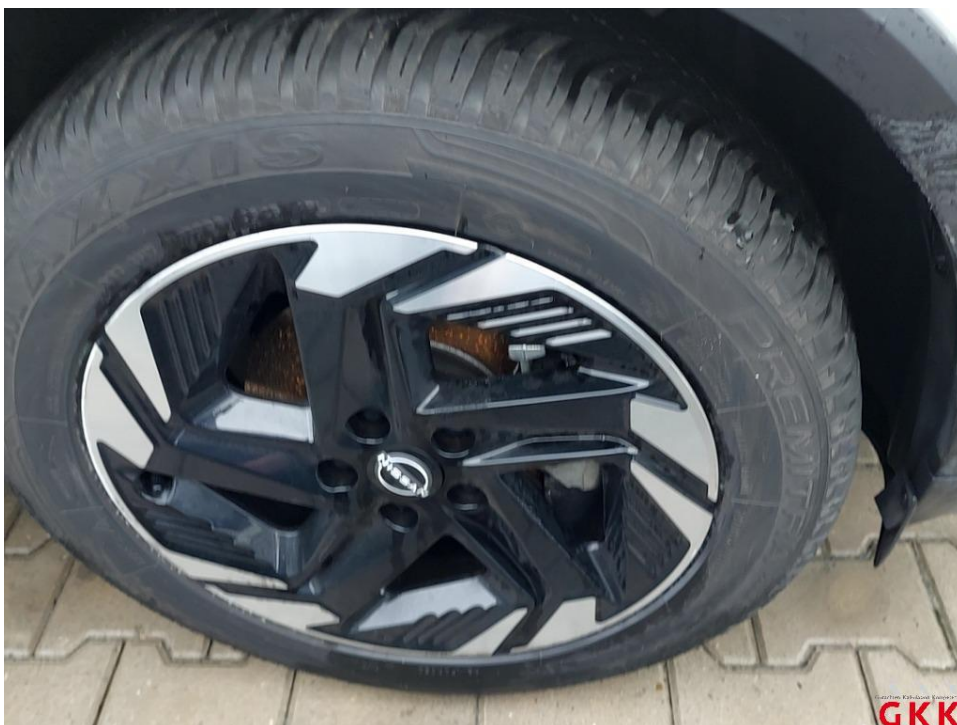
Bild 18 Rad/Reifen vorn rechts verkratzt/angestoßen