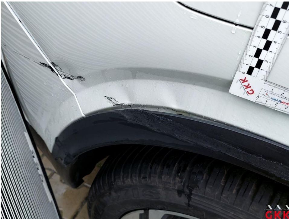
Bild 27 Seitenwand hinten rechts verformt und verkratzt