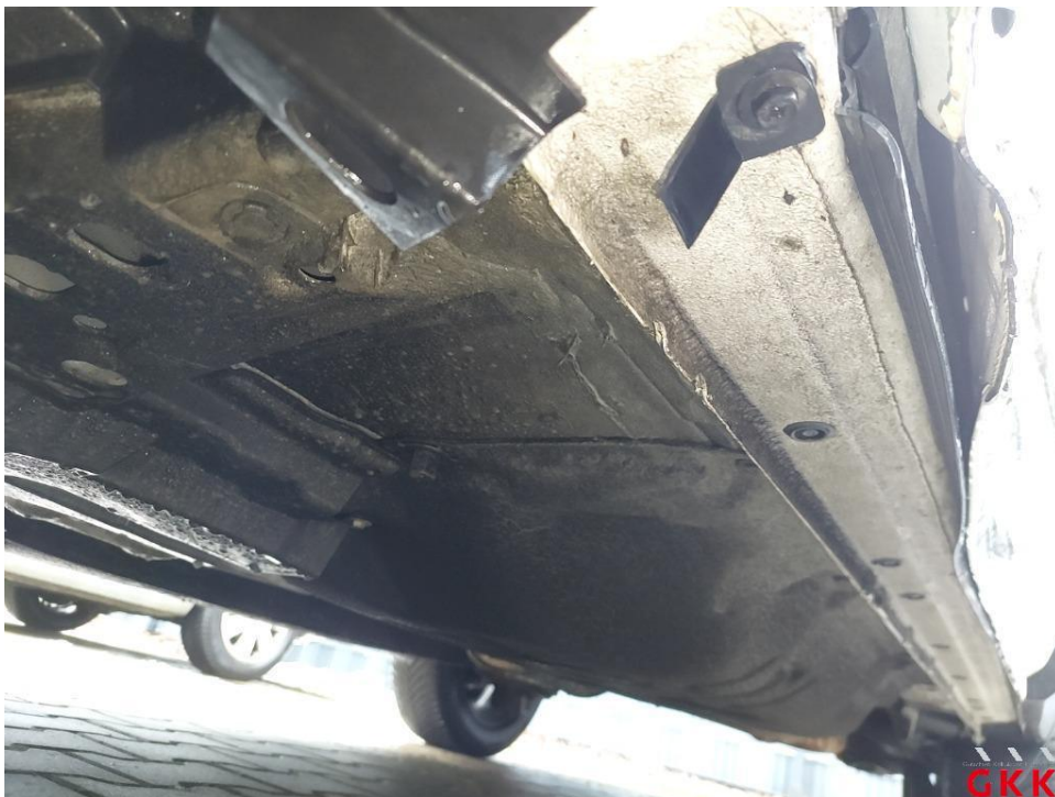
Bild 54 Schweller/Unterholm links eingedellt und verkratzt