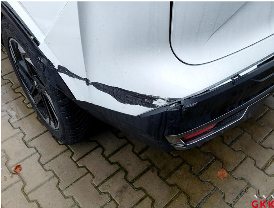
Bild 39 Stoßfänger hinten gestaucht und verkratzt