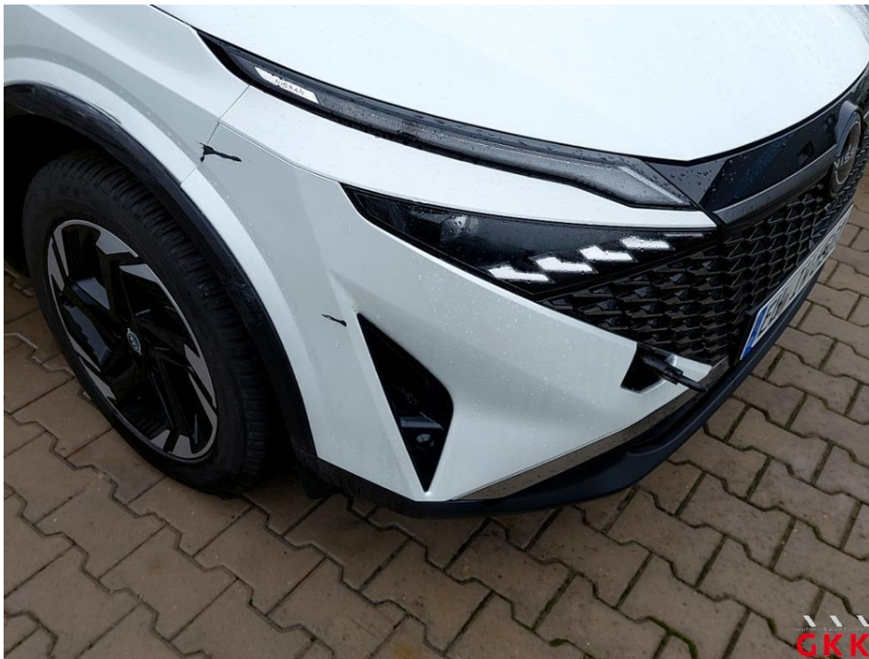
Bild 13 Stoßfänger vorn gestaucht und verkratzt