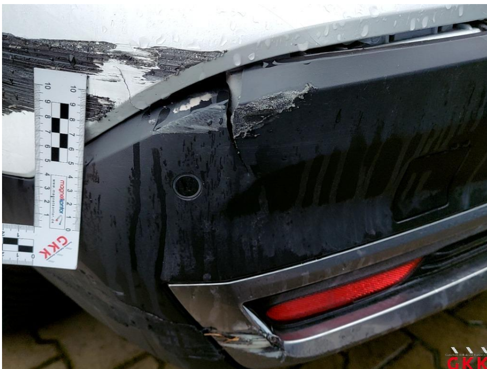
Bild 40 Stoßfänger hinten unterhalb gebrochen