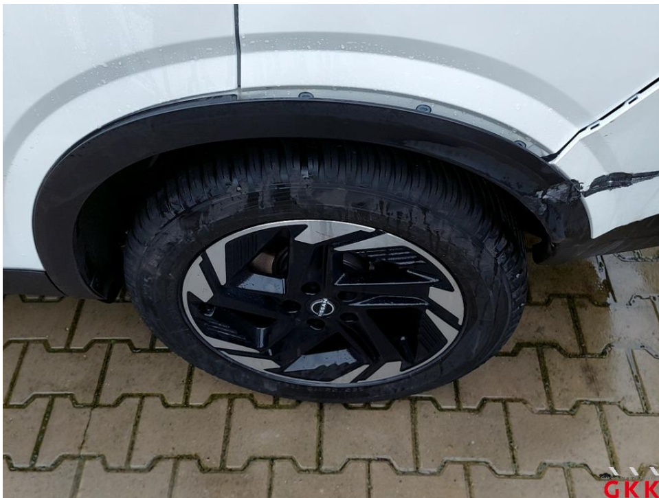
Bild 42 Radlaufverkleidung hinten links verformt und verkratzt