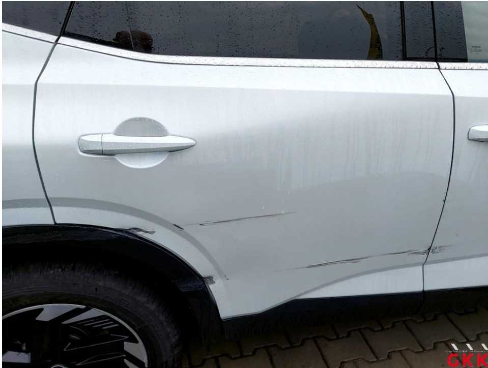
Bild 23 Tür hinten rechts verformt und verkratzt