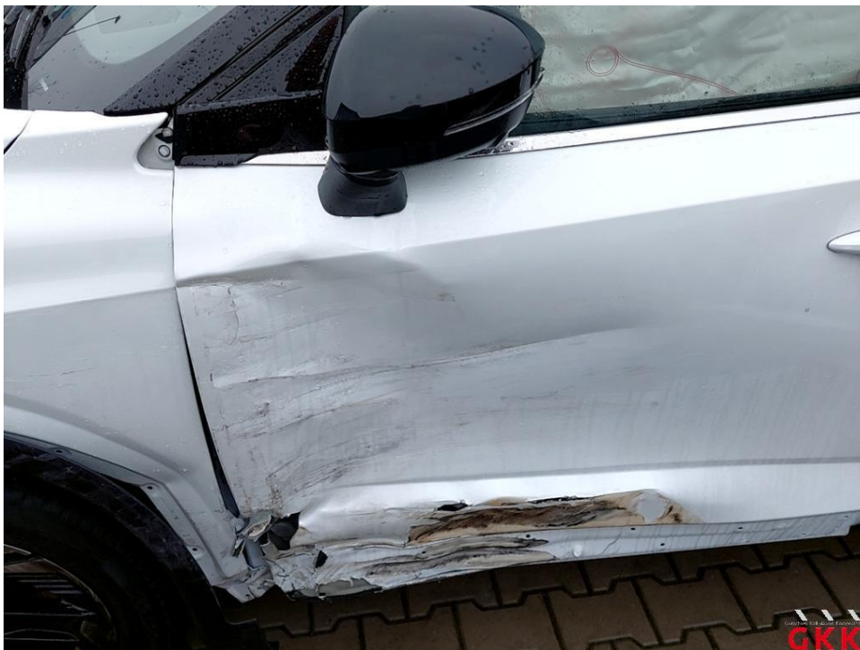
Bild 46 Tür vorn links eingerissen und verkratzt