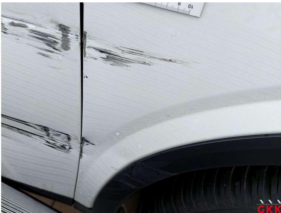
Bild 16 Kotflügel vorn rechts verformt und verkratzt