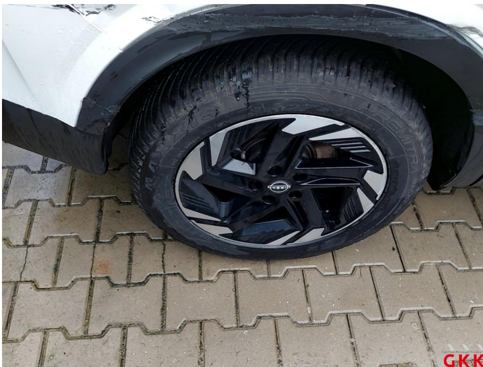
Bild 32 Rad/Reifen hinten rechts verkratzt/angestoßen