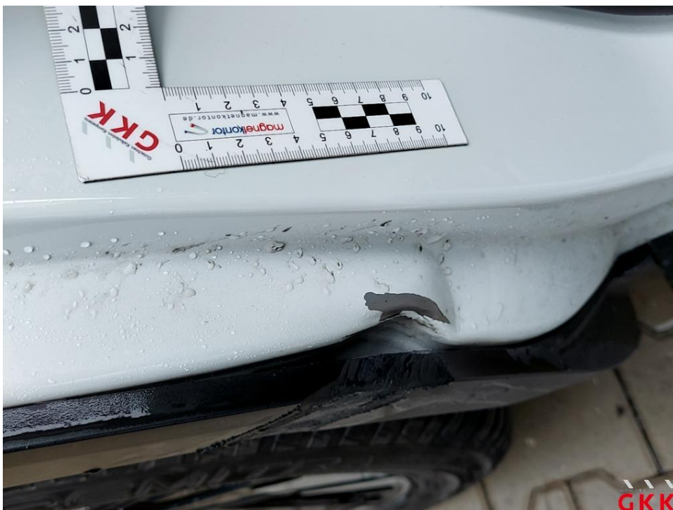
Bild 30 Seitenwand hinten rechts verformt und verkratzt