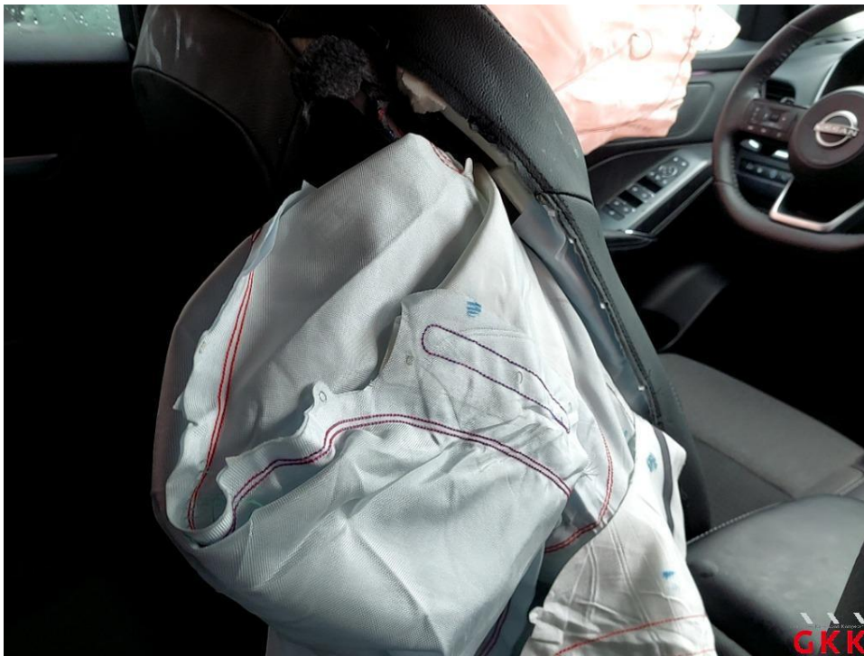
Bild 11 Airbag/Gurtstraffer ausgelöst