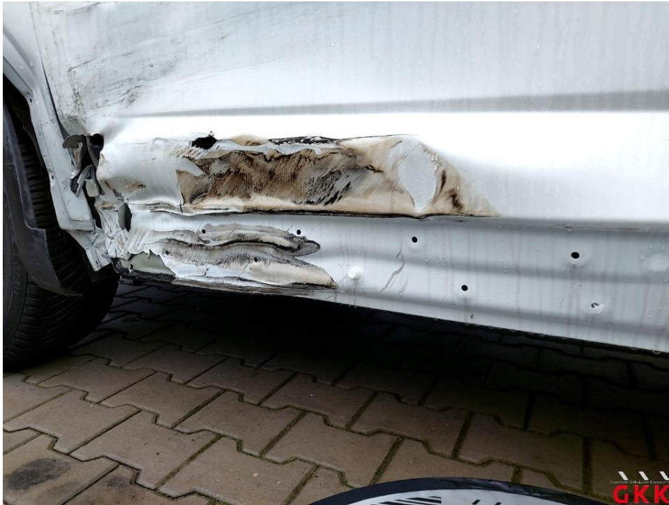
Bild 53 Schweller/Unterholm links eingedellt und verkratzt