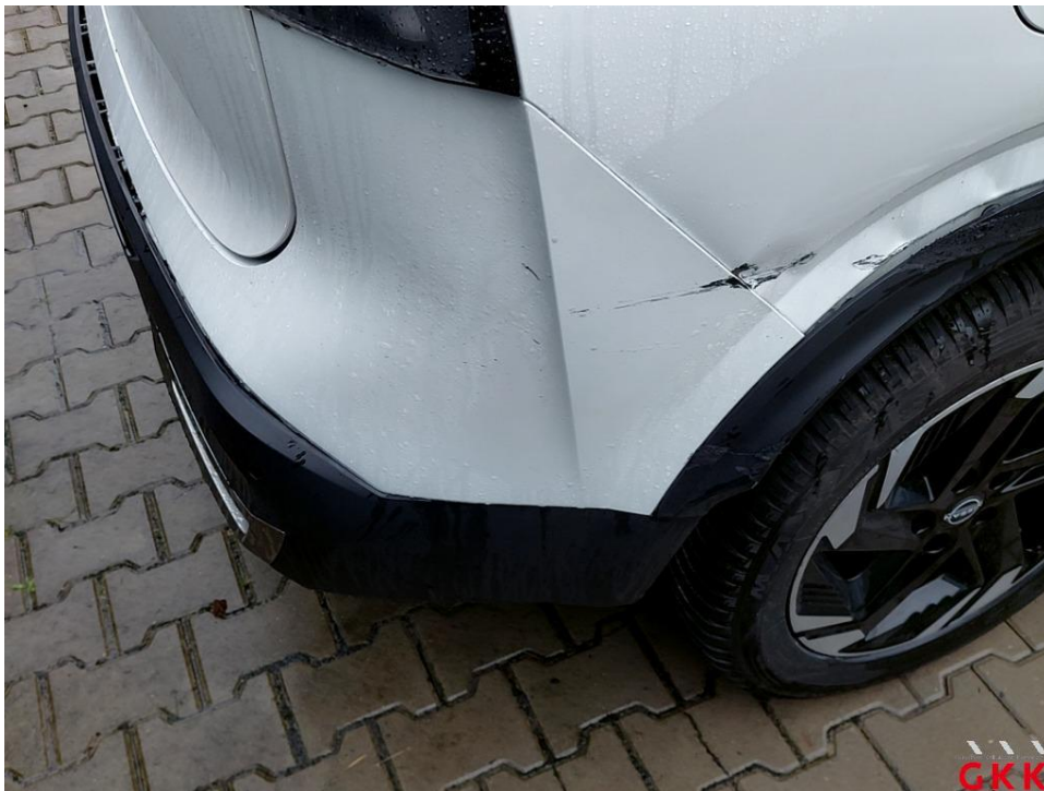
Bild 35 Stoßfänger hinten gestaucht und verkratzt