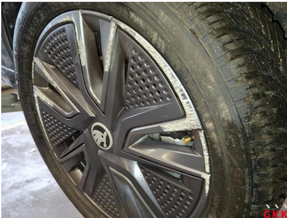
Bild 8 Scheibenrad vorne rechts deformiert