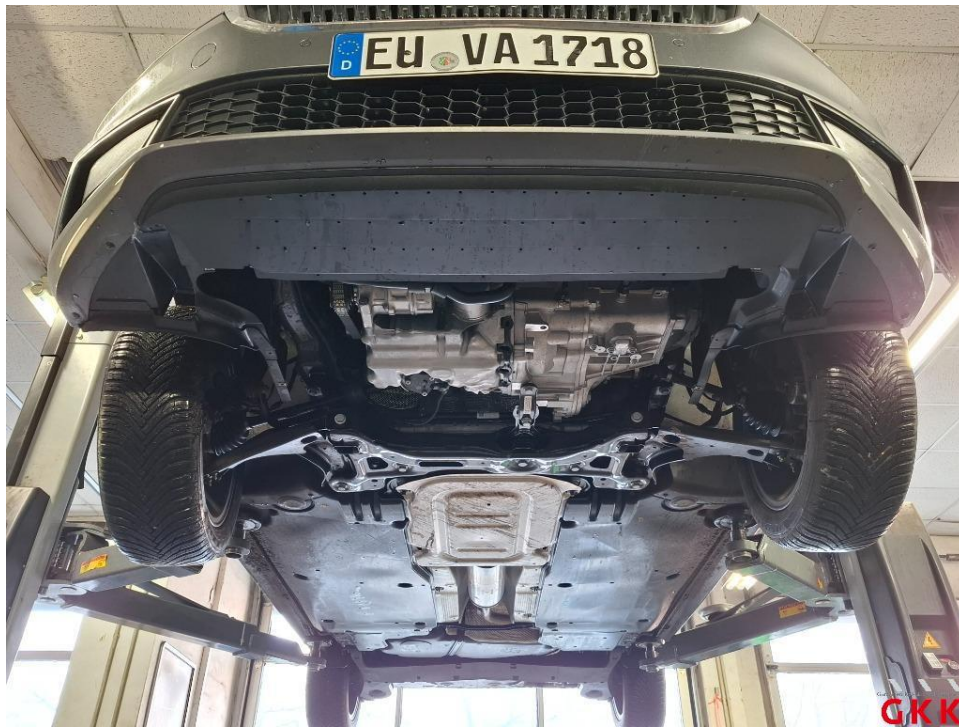
Bild 13 Übersichtsaufnahme Unterboden