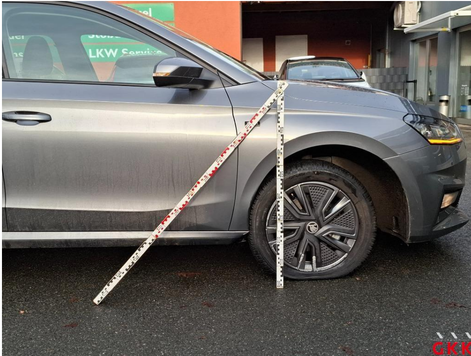
Bild 7 Schadenübersicht