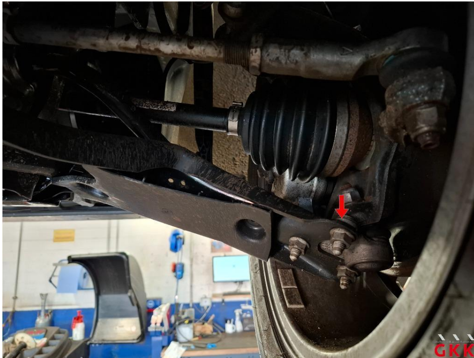
Bild 15 Querlenker vorne rechts deformiert