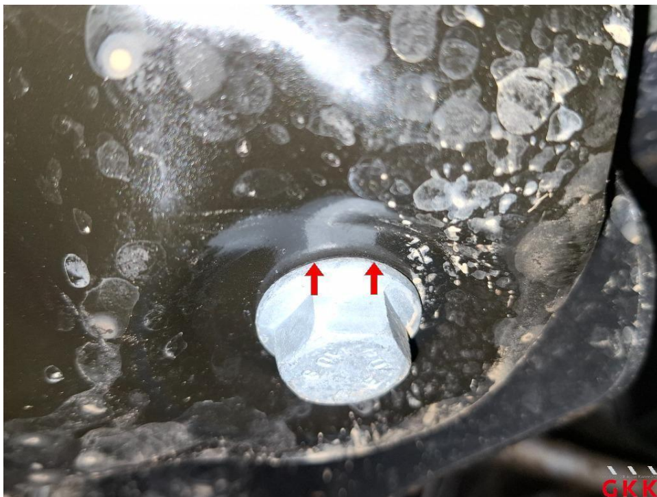
Bild 18 Aggregateträger nach hinten verschoben