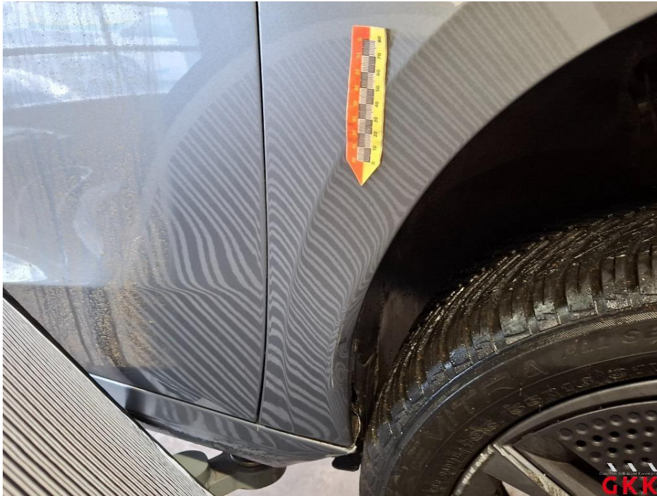
Bild 9 Kotflügel vorne rechts deformiert