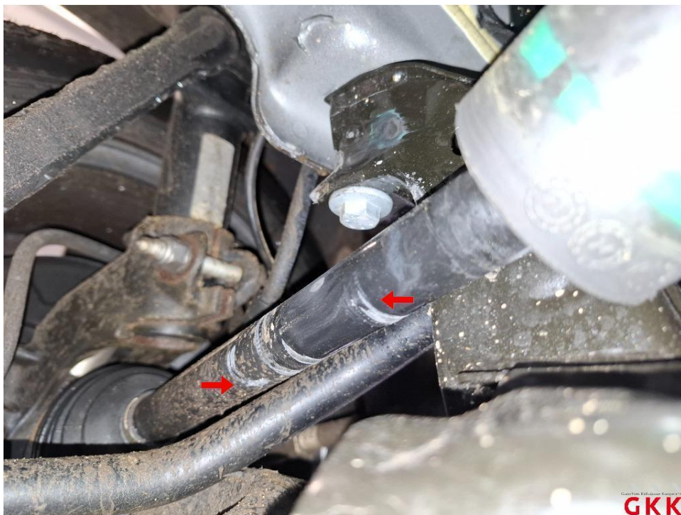
Bild 16 Gelenkwelle vorne rechts deformiert