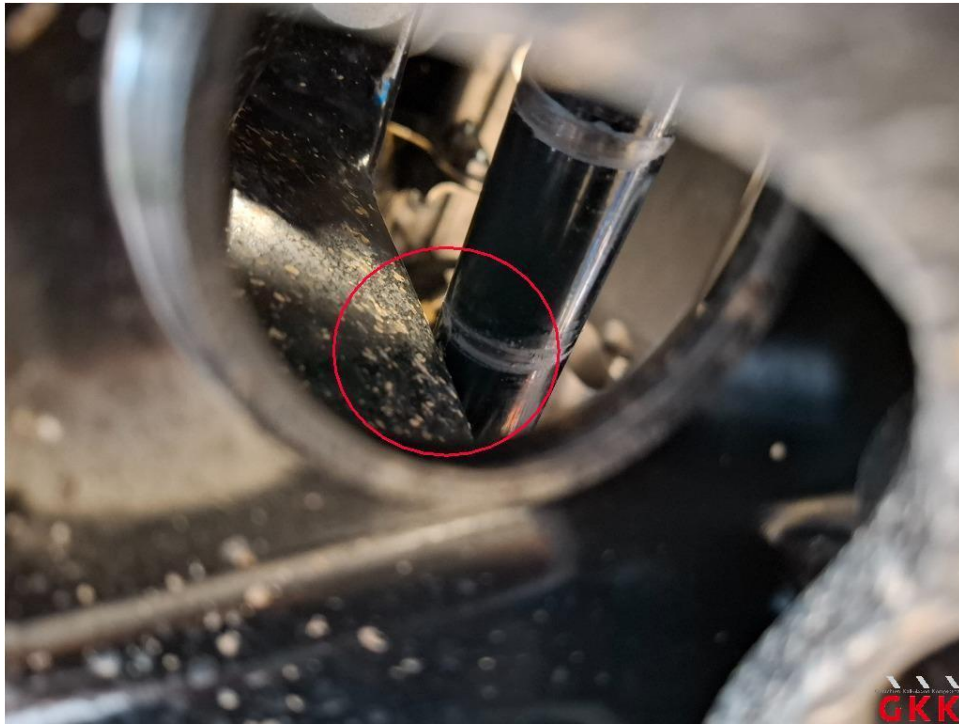
Bild 17 Gelenkwelle an Aggregateträger angeschlagen