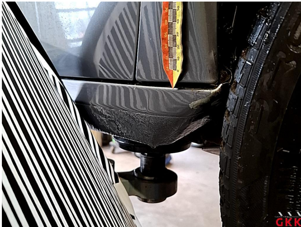
Bild 11 Trailer vorne rechts deformiert