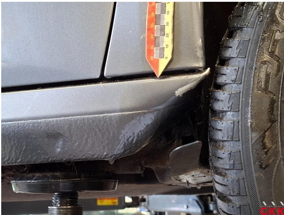
Bild 10 Schweller vorne rechts deformiert