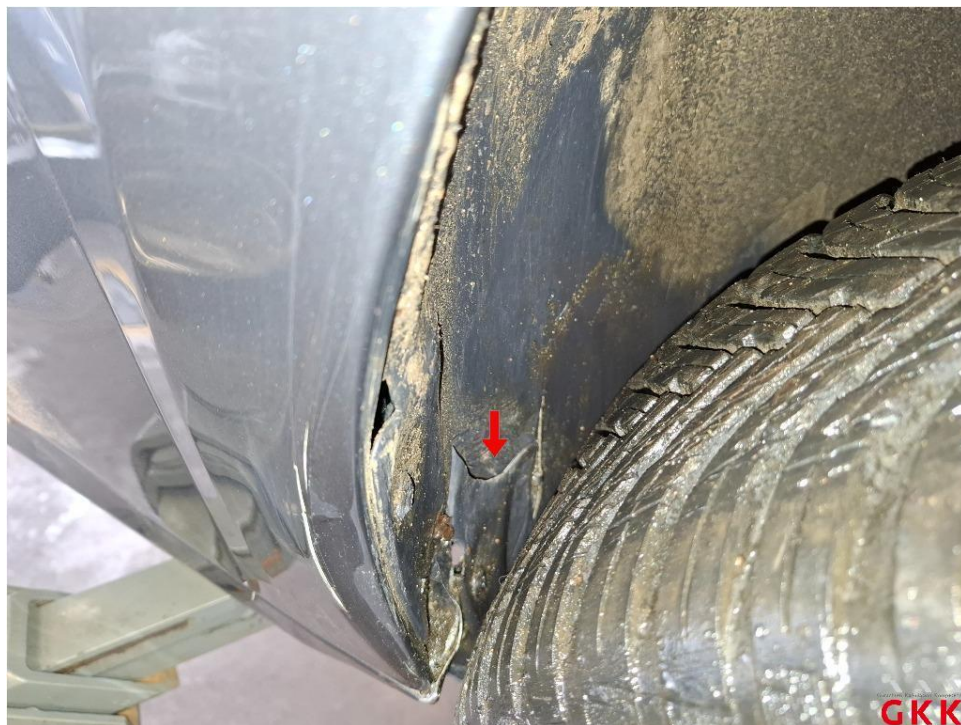
Bild 12 Radhausschale vorne rechts deformiert