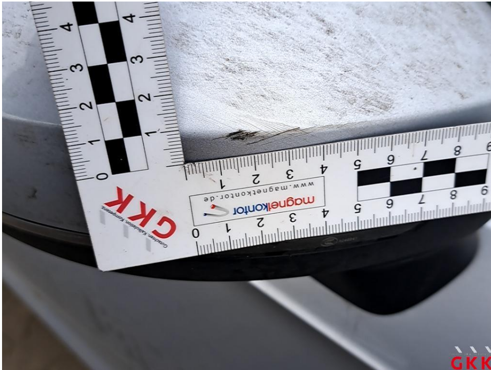
Bild 31 Spiegelgehäuse rechts, Kappe -lackiert-, verkratzt, lackieren