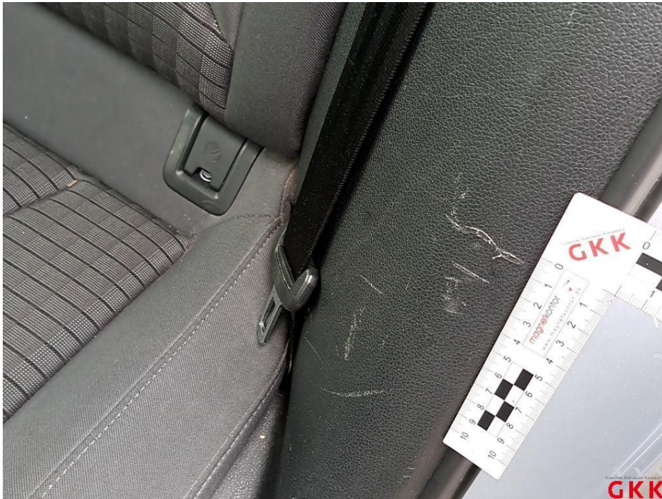
Bild 23 C- Säule links, Innenverkleidung -unterhalb-, verkratzt, ersetzen