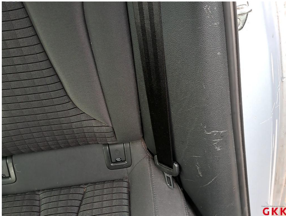
Bild 22 C- Säule links, Innenverkleidung -unterhalb-, verkratzt, ersetzen