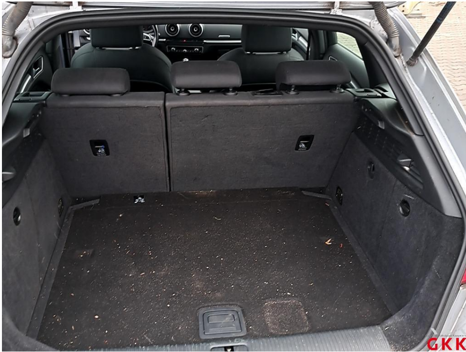
Bild 19 Fahrzeug, innen, verschmutzt, aufbereiten