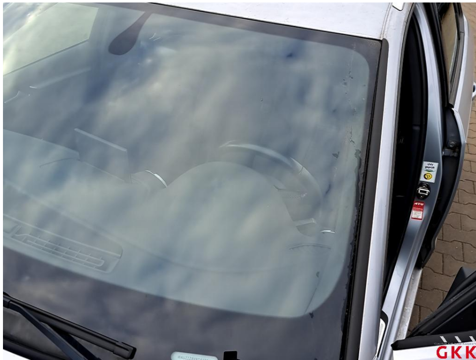
Bild 14 Frontscheibe, Steinschlag, ersetzen