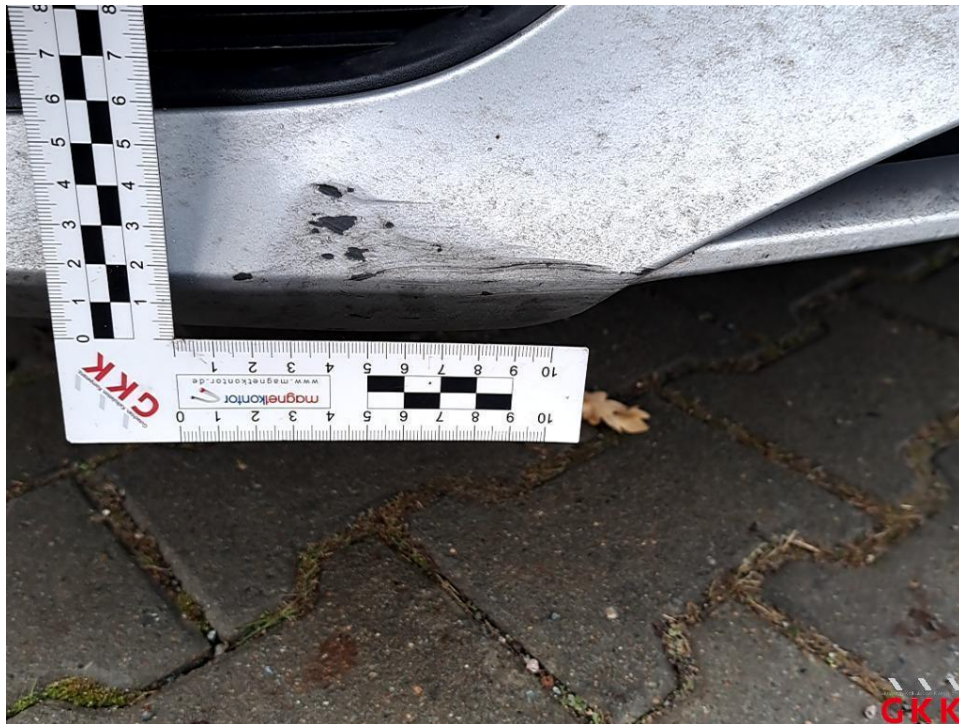
Bild 17 Stoßfänger vorne, Verkleidung -lackiert-, beschädigt, ersetzen