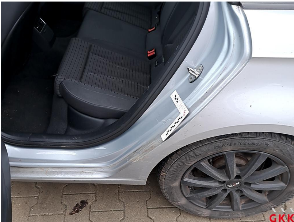
Bild 20 Tür hinten links, Einstieg, verkratzt, Smartrepair