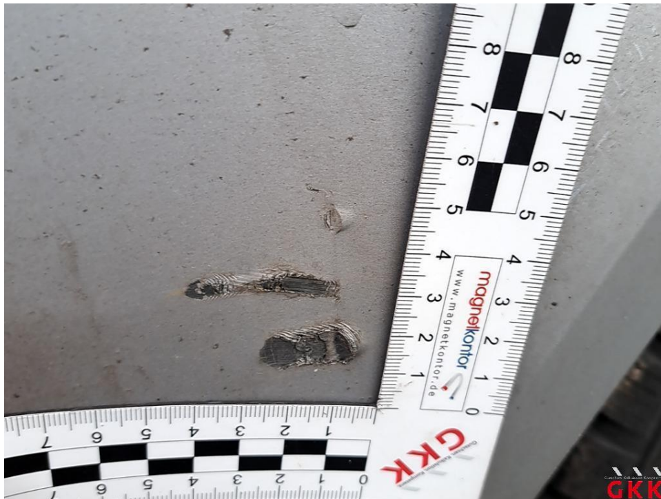
Bild 25 Stoßfänger hinten, Verkleidung -lackiert-, beschädigt, ersetzen