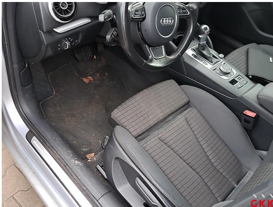
Bild 18 Fahrzeug, innen, verschmutzt, aufbereiten