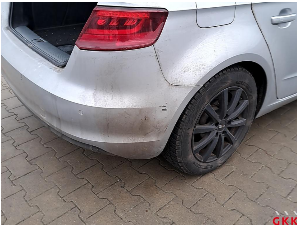
Bild 24 Stoßfänger hinten, Verkleidung -lackiert-, beschädigt, ersetzen