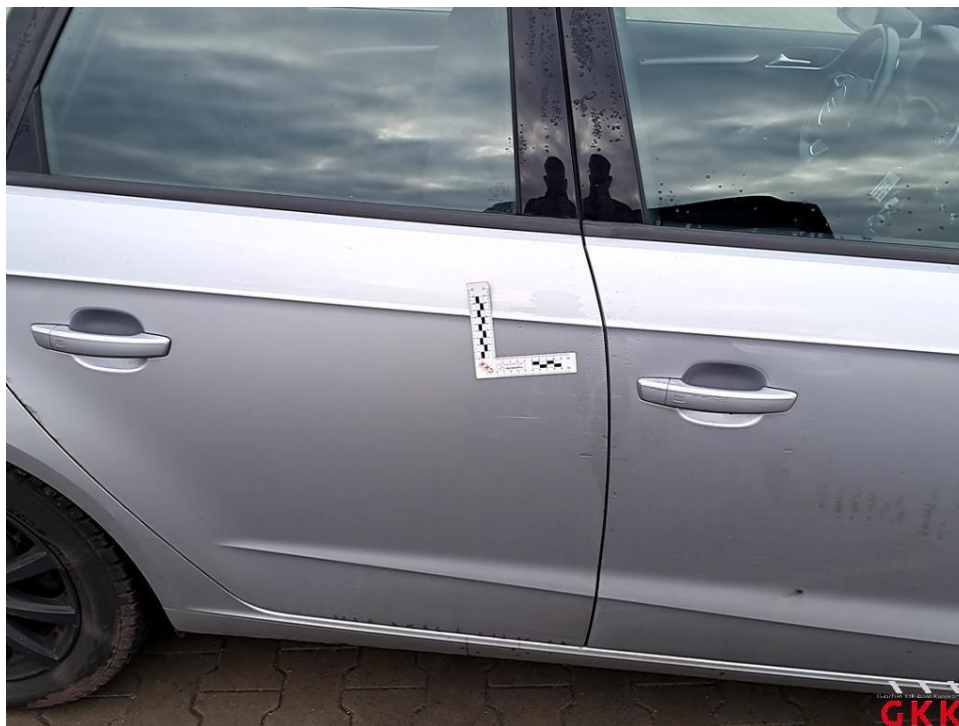
Bild 26 Tür hinten rechts, verkratzt, lackieren