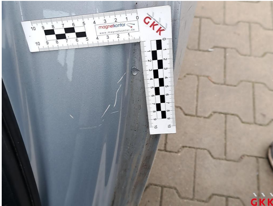
Bild 21 Tür hinten links, Einstieg, verkratzt, Smartrepair