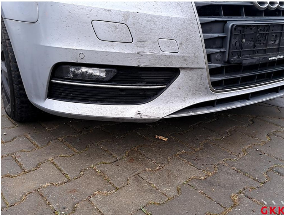
Bild 16 Stoßfänger vorne, Verkleidung -lackiert-, beschädigt, ersetzen