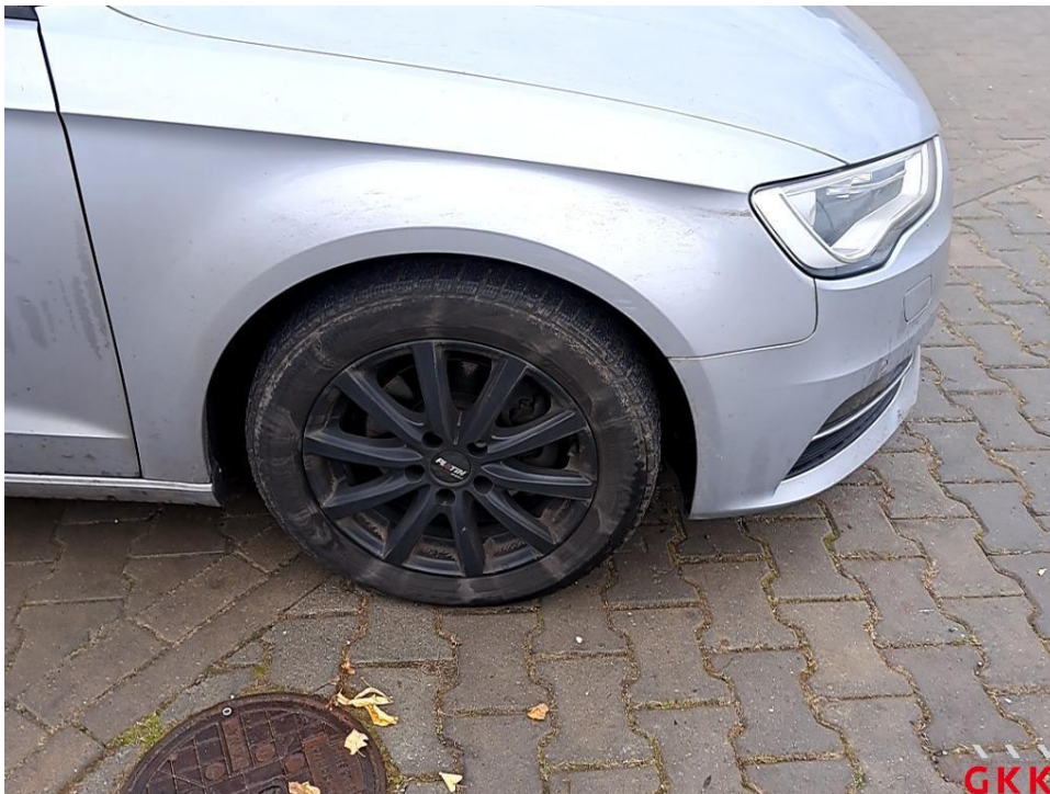
Bild 32 Kotflügel vorne rechts, verkratzt, lackieren