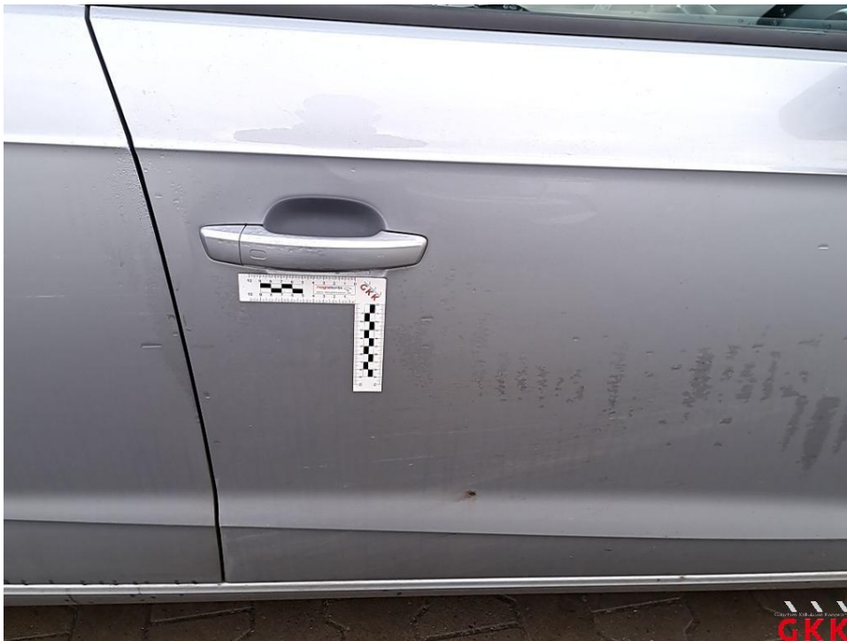
Bild 28 Tür vorne rechts, Griff, verkratzt, lackieren