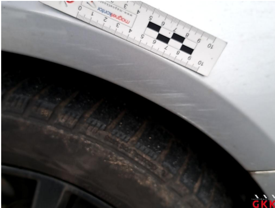
Bild 33 Kotflügel vorne rechts, verkratzt, lackieren