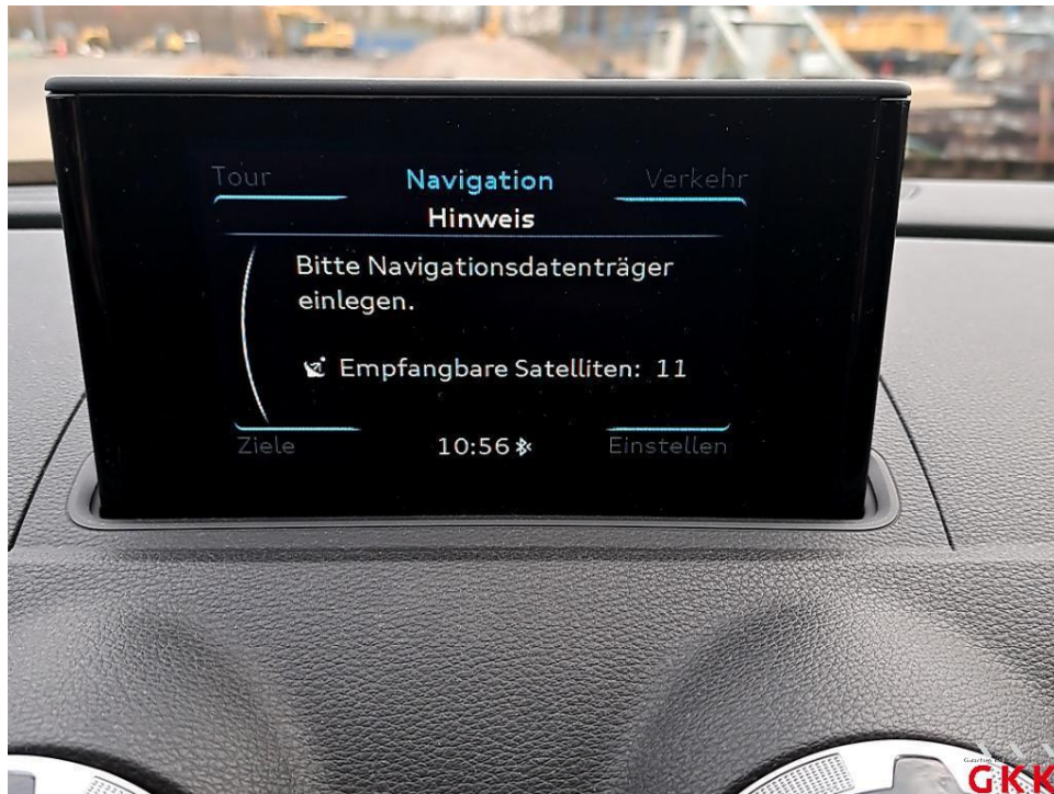
Bild 13 Navigationssystem, Datenträger, fehlt, ersetzen