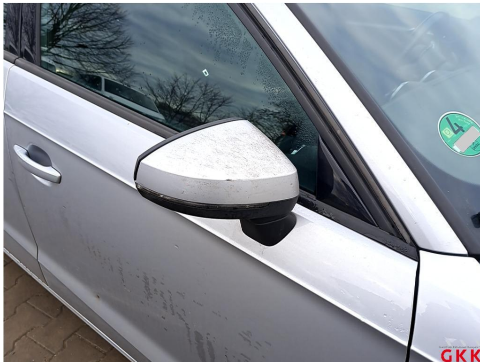
Bild 30 Spiegelgehäuse rechts, Kappe -lackiert-, verkratzt, lackieren