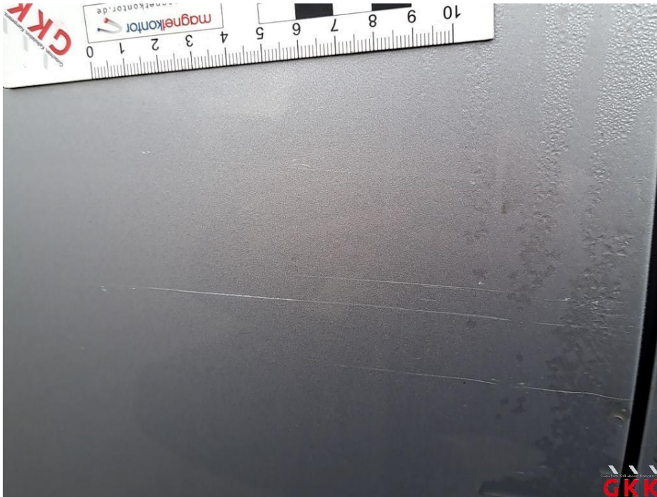
Bild 27 Tür hinten rechts, verkratzt, lackieren