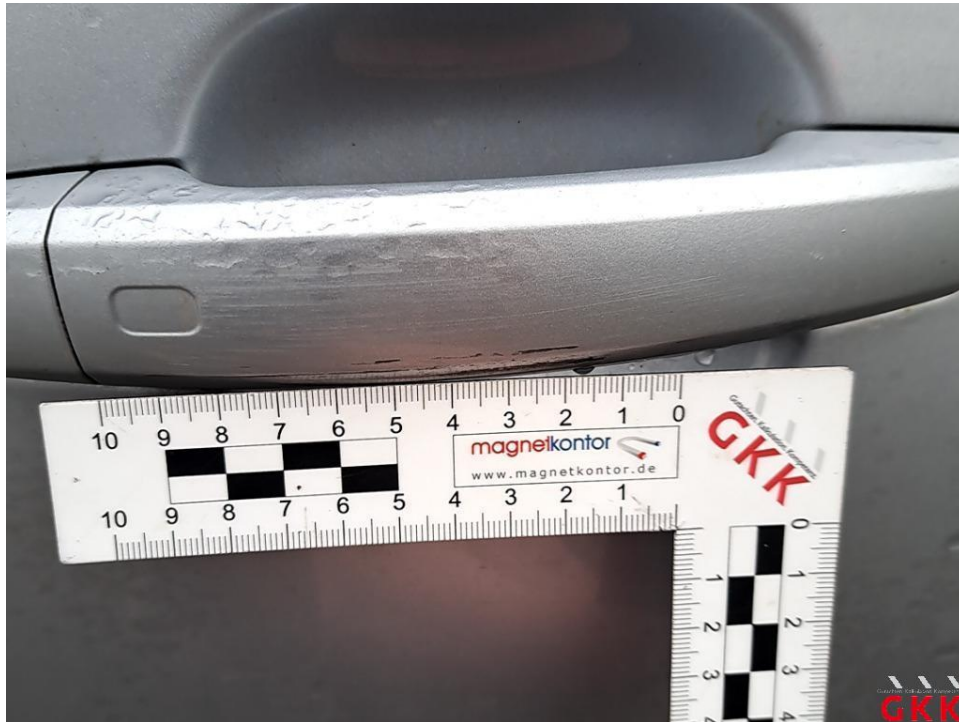
Bild 29 Tür vorne rechts, Griff, verkratzt, lackieren