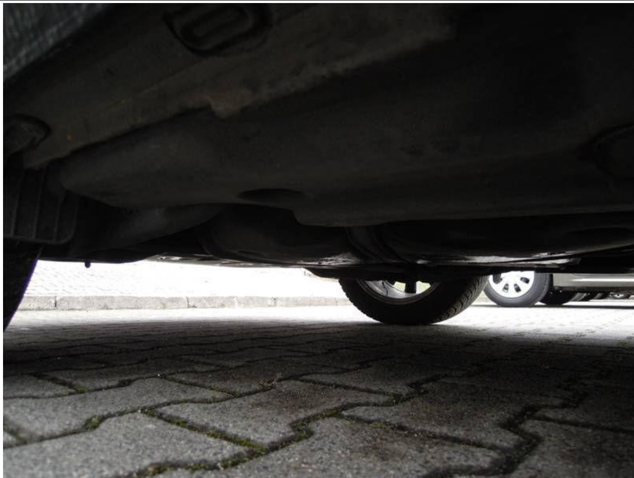
Fot. nr 55