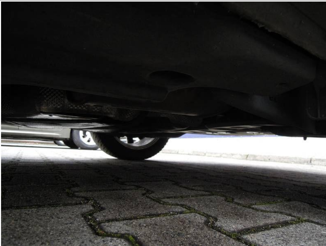
Fot. nr 57