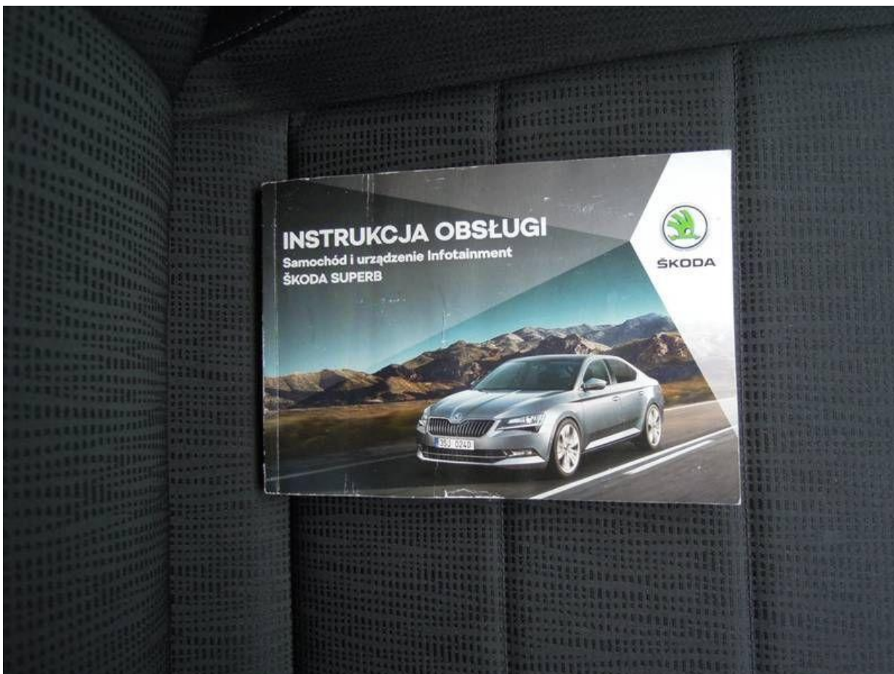
Fot. nr 58