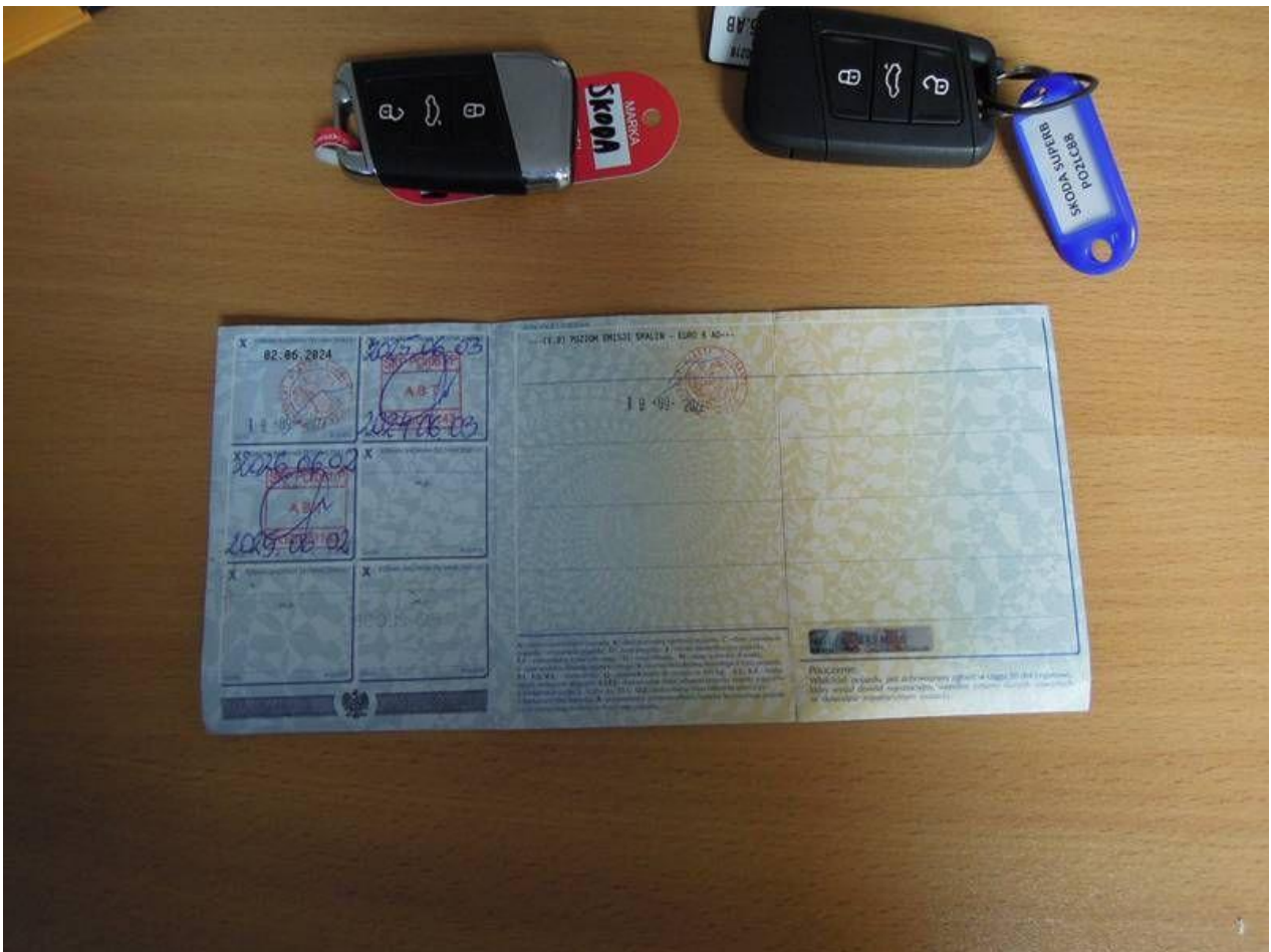
Fot. nr 60

Dokument wystawiony elektronicznie, wa ny bez podpisu