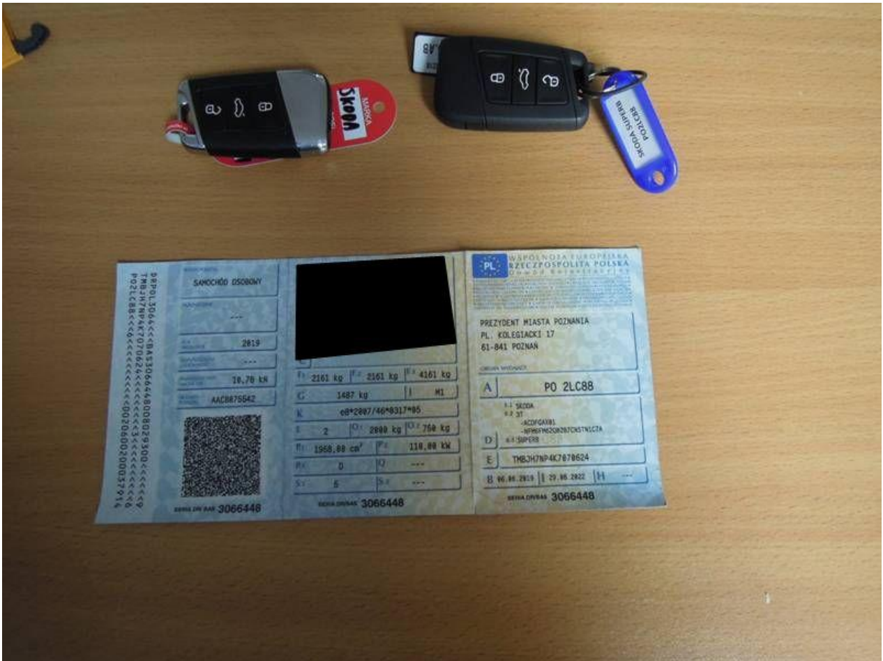
Fot. nr 59