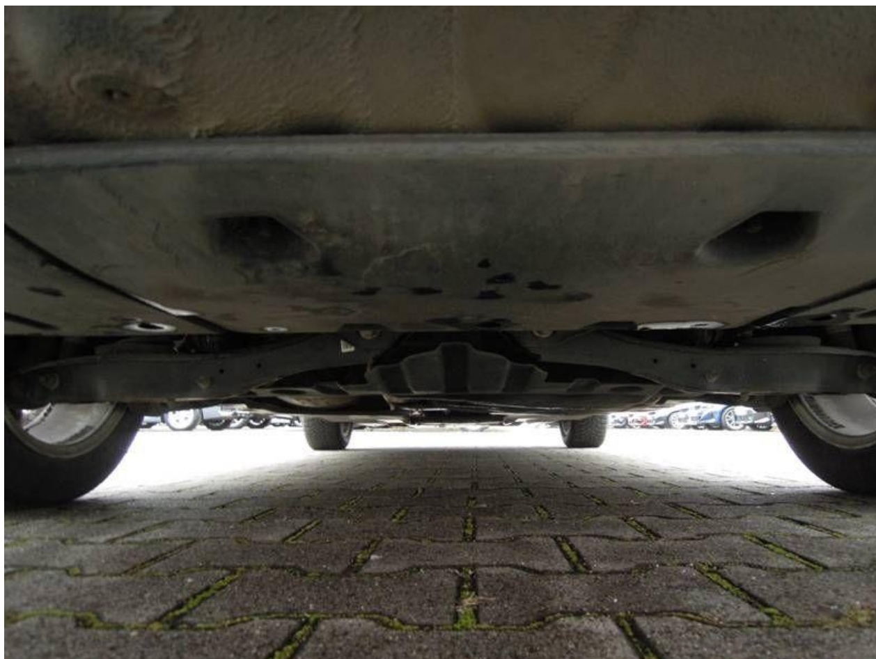
Fot. nr 56