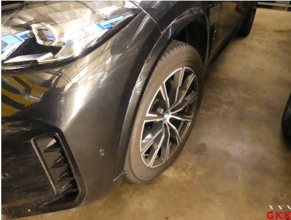
Bild 15 Vergleich Seite links